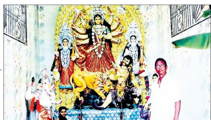
ବାହାନଗା ଗୋପାଳପୁର ବଜାର କମିଟି ପକ୍ଷରୁ ପୂଜା ପାଉଥିବା ମା'ଙ୍କ ମୁଖ୍ୟମା ମୂର୍ତ୍ତି।