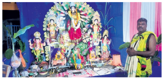
ସୋର ଉତ୍ତରେଶ୍ୱର ବଜାର କମିଟି (ଉପର) ଓ ପୁରୀରୁ ମା'ଙ୍କ ପୂଜା।