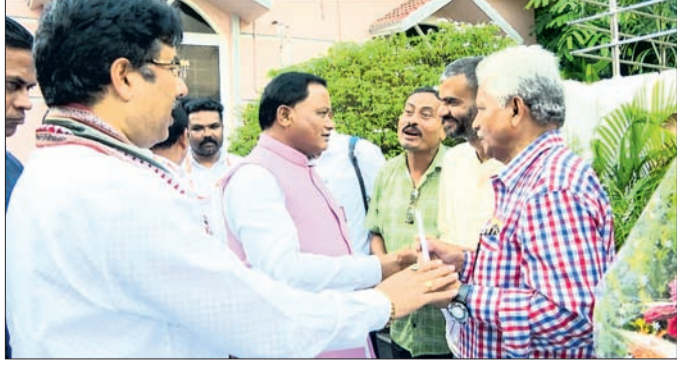
ମୋରଡ଼ା ବ୍ଲକ୍ ସାମ୍ପାଦକ ସଂଘ ପକ୍ଷରୁ ମୁଖ୍ୟମନ୍ତ୍ରୀଙ୍କୁ ଦାବିପତ୍ର ପ୍ରଦାନ କରାଯାଇଛି।

ମୁଖ୍ୟମନ୍ତ୍ରୀ ମୋହନ ଚରଣ ମାଝୀ ବୁଧବାର ବାରିପଦା ଗସ୍ତରେ ଆସିଥିବା ବେଳେ ମୟୂରଭଞ୍ଜ ଜିଲ୍ଲା ମୋରଡ଼ା ବ୍ଲକ୍ ସାମ୍ପାଦକ ସଂଘ ତରଫରୁ ତାଙ୍କୁ ଦାବିପତ୍ର ପ୍ରଦାନ କରାଯାଇଛି। ମୁଖ୍ୟମନ୍ତ୍ରୀ ବାରିପଦା ସର୍ବିଟ ହାଉସରେ ଥିବା ବେଳେ ସଂଘ ପକ୍ଷରୁ ଉତ୍ତର ଦାବିପତ୍ର ପ୍ରଦାନ କରାଯାଇଥିଲା। ସାମ୍ପାଦକମାନଙ୍କ ପାଇଁ ସ୍ୱତନ୍ତ୍ର ଭଣ୍ଡା ବ୍ୟବସ୍ଥା, ମୋରଡ଼ା ନିର୍ବାଚନ ମଣ୍ଡଳୀର ସର୍ବ ବୃହତ ମୋରଡ଼ା ବ୍ଲକ୍ ସଂଘର ଦାବିପତ୍ର ଅନେକ କଞ୍ଚାମାଲରେ ଭରପୂର ଥିବା ମୋରଡ଼ା ନିର୍ବାଚନ ମଣ୍ଡଳୀରେ ଏକ କାଗଜ କଳ ପ୍ରତିଷ୍ଠା, ବାରମାଲକ୍ଷିତ ଘଟଣାରେ ପରିଣତ ହୋଇଣା। ଗତ ୨ ବର୍ଷ ମଧ୍ୟରେ ୮୦ ଲକ୍ଷରୁ ଊର୍ଦ୍ଧ୍ୱ ଟଙ୍କାର ସମ୍ପତ୍ତି ଚୋରି ହୋଇଥିବା ବେଳେ ଛୋଟ ଛୋଟ ଚୋରି ଘଟଣା ପ୍ରାୟତଃ ଘଟୁଛି। ଅପରାଧକୁ ଠାବ କରିବାରେ ପୋଲିସର ଦିନକାଟା ଯୋଗୁ ସାଧାରଣରେ ଅସନ୍ତୋଷ ବୃଦ୍ଧି ପାଇବାରେ ଲାଗିଛି। ଅନେକସେ ରାତ୍ରି ପାଗ୍ରୋଲି ପୂର୍ବପରି ହେଉ ନ ଥିବା ଅଭିଯୋଗ ହେବା ସହ ନିଶାଶକ୍ତ ମାନଙ୍କର ପ୍ରାୟତଃ ବଢିବା ଯୋଗୁ ବାରମ୍ବାର ଚୋରି ଘଟଣା ଘଟୁଥିବା ନଜରକୁ ଆସୁଛି। ପୋଲିସ ପ୍ରଶାସନ ଏଥିପ୍ରତି ଦୃଷ୍ଟି ଦେବାକୁ ଦାବି ହେଉଛି।