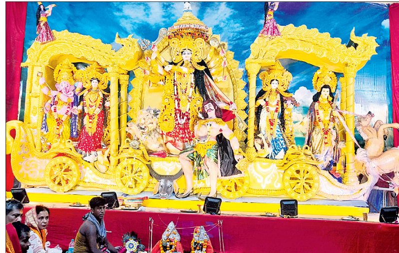
ବାଲେଶ୍ୱର: ବିବେକାନନ୍ଦ ମାର୍ଗରେ ପୂଜା ପାଉଥିବା ମା' ଦୁର୍ଗାଙ୍କ ମୁଖ୍ୟମା ମୂର୍ତ୍ତି।