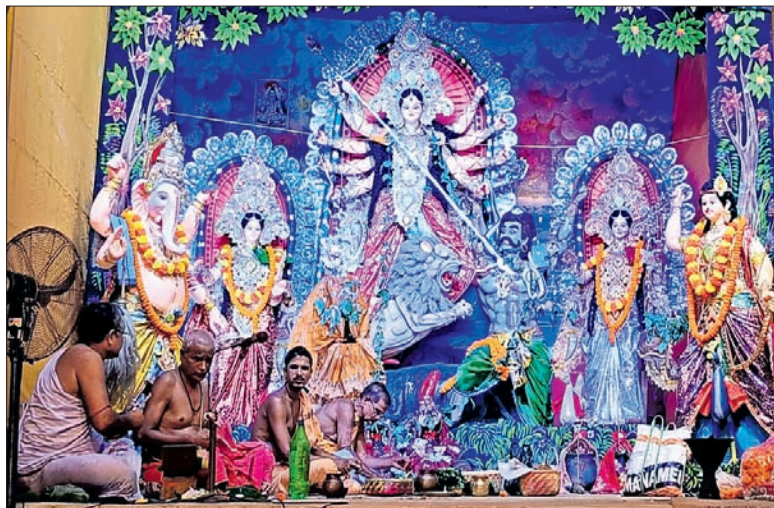
ବାଲିଆପାଳ: ମଣ୍ଡପରେ ପୂଜା ପାଉଥିବା ମା'ଙ୍କ ମୁଖ୍ୟମା ମୂର୍ତ୍ତି।