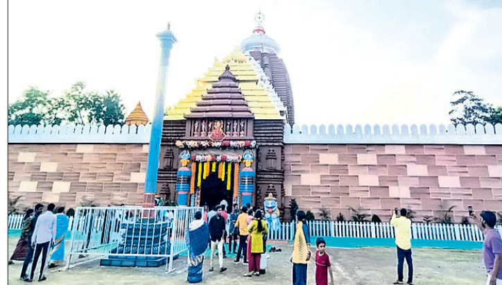
ବୁଲସୀ ଚଉରାଠାରେ ପୂଜା ଶ୍ରୀମନ୍ଦିର ଓ ପାଳକଗଣଠାରେ ତିନି ଖାଲୁ ସଦୃଶ ତୋରଣ।