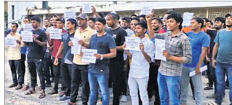
ପରୀକ୍ଷାର୍ଥୀମାନେ ବିକ୍ଷୋଭ ପ୍ରଦର୍ଶନ କରୁଛନ୍ତି।