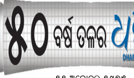
୧୧ ଅକ୍ଟୋବର ୧୯୭୫