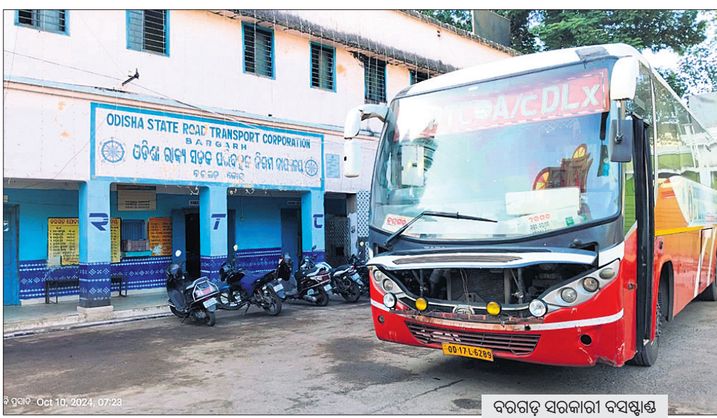
ବରଗଡ଼ ସରକାରୀ ବସ୍ଷ୍ଟାଣ୍ଡ

ବରଗଡ଼ ସରକାରୀ ବସ୍ଷ୍ଟାଣ୍ଡ ସର୍ବ ପୁରାତନ। ଅନ୍ୟ ବସ୍ଷ୍ଟାଣ୍ଡଗୁଡ଼ିକର ନବୀକରଣ, ରୂପାନ୍ତରାକରଣ ହେଉଛି। କିନ୍ତୁ ବରଗଡ଼ ସହରର ପୁଖ୍ୟ ପେଣ୍ଡୁଳାରେ ରହିଥିବା ଏହି ବସ୍ଷ୍ଟାଣ୍ଡରେ ତାହା ହେଉନାହିଁ। ଅପରପକ୍ଷେ ରାଜ୍ୟର ଏହି ପ୍ରମୁଖ ବସ୍ଷ୍ଟାଣ୍ଡ ଦିନକୁ ଦିନ ଚା'ର ଅସ୍ତିତ୍ୱ ହରାଇ ବସିଛି। ବସ୍ଷ୍ଟାଣ୍ଡ ପରିସରରେ ଥିବା ପେଟ୍ରୋଲ ପମ୍ପ କେଉଁକାଳକୁ ଉଠିଯାଇଛି। ଏଠାରେ ରହିଥିବା ଗ୍ୟାରେଜ ମଧ୍ୟ ଆଉ ନାହିଁ। ସେହିପରି ବସ୍ଷ୍ଟାଣ୍ଡ ପରିସରରେ ଥିବା କ୍ୟାଣ୍ଟିନ୍ରେ ଦୀର୍ଘବର୍ଷ ହେଲା ତାଲା ଖୁଲୁଛି। ତ୍ରେନେଜ ବ୍ୟବସ୍ଥା ଠିକ୍ ନ ଥିବା ଯୋଗୁଁ ସାମାନ୍ୟ ବର୍ଷାରେ ବସ୍ଷ୍ଟାଣ୍ଡ ଜଳାଣି ହୋଇପଡ଼ୁଛି। କେବଳ ସେତିକି ନୁହେଁ, ଏଠାରେ ଯାତ୍ରୀମାନଙ୍କୁ ଅନେକ ସମସ୍ୟାରେ ସମ୍ବନ୍ଧିତ ମୌଳିକ ସୁବିଧା ସୁଯୋଗରୁ ମଧ୍ୟ ବଞ୍ଚିତ ହେବାକୁ ପଡ଼ୁଥିବା ଅଭିଯୋଗ ହେଉଛି। ଯାତ୍ରୀବାହୀ ବସ୍ ଯାତାୟାତ ସମ୍ପର୍କିତ ସୂଚନା ଆଉ ତାଳବାଜି ଯନ୍ତ୍ରରେ ଶୁଣିବାକୁ ମିଳୁନାହିଁ। ଏହାସତ୍ତ୍ୱେ ଓଡ଼ିଶା ରାଜ୍ୟ ସଡ଼କ ପରିବହନ ନିଗମ(ଓଏସଆର୍ଟିସି) ଏଥିପ୍ରତି ଆଖି ବୁଜିଦେଇଛି।