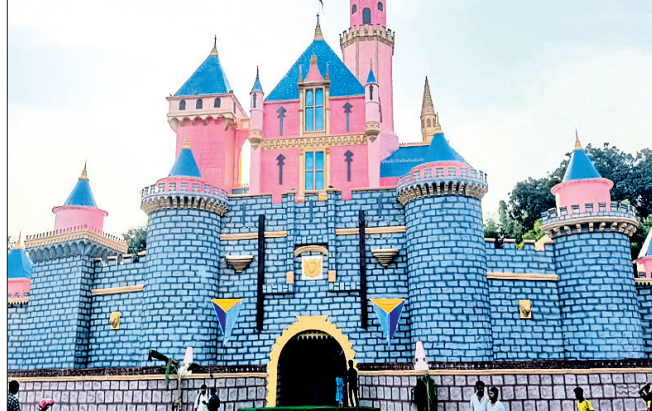
ବୁଲସୀ ଚଉରାଠାରେ ପୂଜା ଶ୍ରୀମନ୍ଦିର ଓ ପାଳକଗଣଠାରେ ତିନି ଖାଲୁ ସଦୃଶ ତୋରଣ।