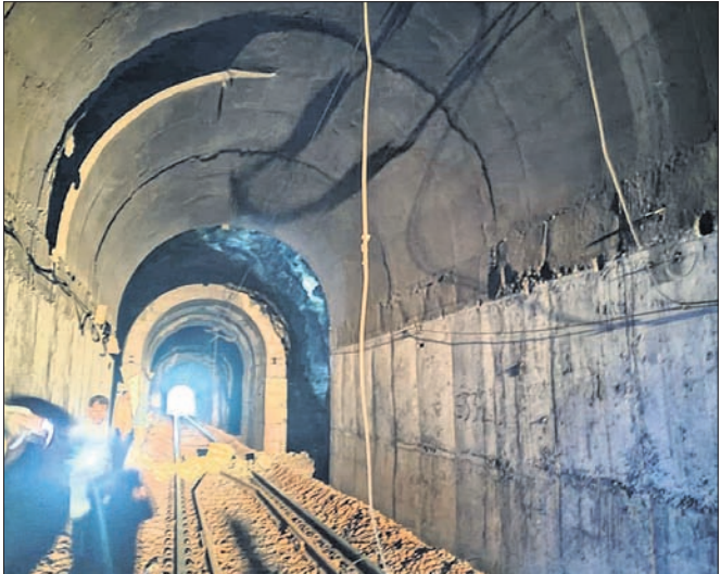
ରେଳଧାରଣାରେ ମରାମତି କାମ ଚାଲିଛି।

କୋରାପୁଟ/ଲକ୍ଷ୍ମୀପୁର, ୧୦/୧୦ (ଅମିତାଭ ବେହେରା/ଅନନ୍ତ ପ୍ରସାଦ ନାୟକ) କୋରାପୁଟଠାରୁ ରାୟଗଡ଼ାକୁ ସଂଯୋଗ କରୁଥିବା କେଆର୍ ଲାଇନର ୩ ନମ୍ବର ଟନେଲ ଭିତରେ ଏକ ପଥର ଖସି ଓଭର ହେଡ୍‌ରେ ଲକ୍ଷ୍ମୀପୁରଠାରେ ଉପରେ ପଡ଼ିବାରୁ ପ୍ରାୟ ୪ ଘଣ୍ଟା ଟନେଲ ବନ୍ଦ ରହିଥିଲା। ରେଳ ବିଭାଗ କର୍ମଚାରୀ ଟନେଲ ଭିତରେ ପଶି ପଥରକୁ ବାହାର କରିବା ସହ ତାର ସଜାଡ଼ିବା ପରେ ଟନେଲ ଚଳାଚଳ ସ୍ୱାଭାବିକ ହୋଇଥିଲା। ସୁନାମୁଖୀୟା, ରାତ୍ର ପ୍ରାୟ ୩ଟା ୩୦ ମିନିଟ୍‌ରେ କେଆର୍ ରେଳପଥର କାରିଗରମାନେ-ଲକ୍ଷ୍ମୀପୁର ଷ୍ଟେସନ ମଧ୍ୟରେ ଥିବା ୩ ନଂ. ଟନେଲରେ ୫୮ କି.ମି. ପଥରେ ହଠାତ୍ ରେଳଧାରଣା ଉପରେ ପଥର ଖସିପଡ଼ିଥିଲା। ଏଥିରେ ଓଭର ହେଡ୍‌ରେ ଲକ୍ଷ୍ମୀପୁରଠାରେ ଛିଣ୍ଡିଯିବାରୁ ବିଦ୍ୟୁତ୍ ସରବରାହ ବିଚ୍ଛିନ୍ନ ହୋଇଯାଇଥିଲା। ଫଳରେ ସକାଳ ୮ଟା ପର୍ଯ୍ୟନ୍ତ ରେଳ ଚଳାଚଳ ଠପ୍ ହୋଇପଡ଼ିଥିଲା। କୋରାପୁଟରୁ ବିଶେଷଜ୍ଞ ସହ ଉଦ୍ଧାରକାରୀ ଦଳ ଘଟଣାସ୍ଥଳରେ ପହଞ୍ଚି ରେଳପଥରୁ ପଥର ହଟାଇବା ସହ ଓଭର ହେଡ୍‌ରେ ଲକ୍ଷ୍ମୀପୁରଠାରେ ମରାମତି କରି ବିଦ୍ୟୁତ୍ ସରବରାହ ବ୍ୟବସ୍ଥାକୁ ସଜାଡ଼ିଥିଲେ। ପରେ ରେଳ ଚଳାଚଳ ସ୍ୱାଭାବିକ ହୋଇଥିଲା। କୋରାପୁଟ ଅଭିଯୁକ୍ତ ଯାଉଥିବା ରାଉରକେଲା ଟ୍ରେନ ଲକ୍ଷ୍ମୀପୁରରେ ଅଟକି ରହିଥିଲା।