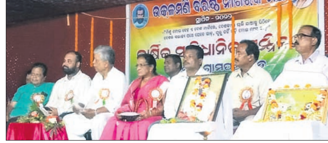
ବାର୍ଷିକୋତ୍ସବରେ ଉପସ୍ଥିତ ଅତିଥିମାନେ।

ନୂତନ ଆଲୋକ ଦେଖାଇଥିଲା ବୋଲି ଅତିଥିମାନେ କହିଥିଲେ। ଏଥିସହ ଜିଲ୍ଲାର ଆଞ୍ଚଳିକ ସଂସଦ କର୍ମକର୍ତ୍ତାମାନଙ୍କ ସମାପ୍ୟ ଉପରେ ବିଧାୟକଙ୍କ ଦୃଷ୍ଟି ଆକର୍ଷଣ କରିଥିଲେ। ବରିଷ୍ଠ ନାଗରିକମଞ୍ଚକୁ ବ୍ଲକ୍ ଓ ତହସିଲରେ ବହୁତ ଅନୁଦାନ ସମ୍ପୂର୍ଣ୍ଣ ହେବାକୁ ପଡ଼ୁଥିବା ବିଷୟରେ ମଧ୍ୟ ବୈଠକରେ ଅବଗତ କରାଗଲା। ଶୁକ୍ଷ୍ମଗ୍ରାମ ଏସବୁ ସମାପ୍ୟ ସମାଧାନ କରାଯିବ ବୋଲି ବିଧାୟକ କହିଥିଲେ।