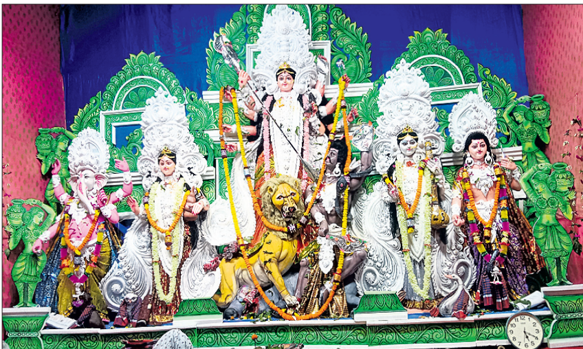
ଜଳେଶ୍ୱର: ମଣ୍ଡପରେ ମା'ଙ୍କ ମହାସପ୍ତମୀ ପୂଜା।