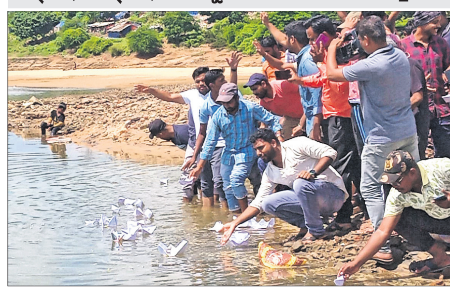
ପରୀକ୍ଷାର୍ଥୀମାନେ ଆତ୍ମିକ କାର୍ତ୍ତବ୍ୟ ତଳା କରି କାଠଯୋଡ଼ି ନଦୀରେ ଭସାଇଛନ୍ତି।