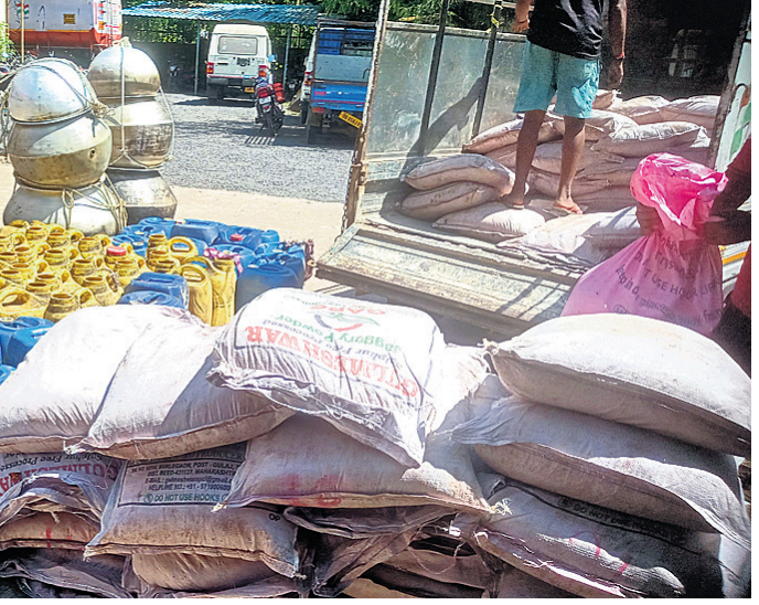
ଜବତ ହୋଇଥିବା ମଦ, ପୋତ ଓ ଅନ୍ୟ ସାମଗ୍ରୀ।