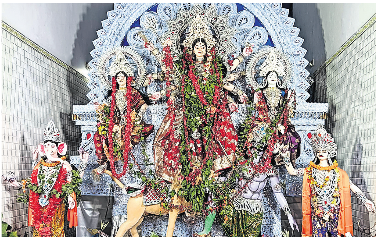
କାଞ୍ଚନ ବଜାର ପୂଜା ମଣ୍ଡପ (ଫଟୋ-ମାନସ)