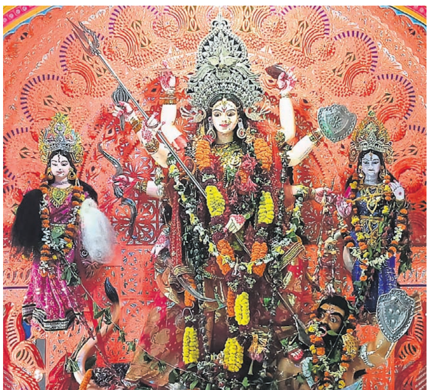
ଦେଈନାଳ ସହର ରିଜର୍ଭ ପୋଲିସ ଲାଇନ ପୂଜାମଣ୍ଡପରେ ମା' ଦୁର୍ଗାଙ୍କୁ ପୂଜା କରାଯାଉଛି ।