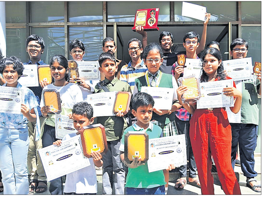
ରାଜ୍ୟ ଓପନ ଚେସ୍‌ର କୃତୀ ପ୍ରତିଯୋଗୀମାନେ ପୁରସ୍କାର ସହ ଅତିଥିଙ୍କ ରହଣରେ।

କୁଆଲାଇମ୍ପୁର (ମାଲେସିଆ), ୧୧।୧୦ (ଏପି): ସୁରକ୍ଷାଜନିତ କାରଣରୁ ଫୁଟ୍‌ବଲ୍ ବିଶ୍ୱକପ୍‌ର ଏକ ଯୋଗ୍ୟତା ପର୍ଯ୍ୟାୟ ମ୍ୟାଚ ଇରାନ (ମାଗାଦ)ରୁ ସଂଯୁକ୍ତ ଆରବ ଏମିରେଟ୍ସ (ଦୁବାଇ)ର ଦୁବାଇକୁ ଘ୍ୱାନାନ୍ତର କରାଯାଇଥିବା ଏସିଆନ ଫୁଟ୍‌ବଲ୍ କମିଶନର ଉପଦେଶରେ (ଏଏଫସି) କହିଛି। ଅକ୍ଟୋବର ୧୫ରେ ଏହି ମ୍ୟାଚ ଇରାନ ଓ କାତାର ମଧ୍ୟରେ ଖେଳାଯାଇଥାନ୍ତା। ନିଷ୍ପତ୍ତି ପୂର୍ବରୁ ଫିଫା ପରାମର୍ଶ ନିଆଯାଇଥିଲା। ଇରାନର ଏକ ରଣମାଧ୍ୟମ ରିପୋର୍ଟ ଅନୁସାରେ ଏସିଆରେ ତୃତୀୟ ରାଉଣ୍ଡ ଯୋଗ୍ୟତା ପର୍ଯ୍ୟାୟର ଚତୁର୍ଥ ମ୍ୟାଚ କାତାରକୁ ଘ୍ୱାନାନ୍ତର କରିବା ଲାଗି ତେହେରାନ କର୍ତ୍ତୃକ୍ଷ ଅନୁରୋଧ କରିଛନ୍ତି। ଏହା ଇରାନରେ କରା ନ ଯାଇ ଦୋହାରେ କରିବା ପାଇଁ ସେମାନେ ପ୍ରସ୍ତାବ ଦେଇଛନ୍ତି। ସୂଚନାଯୋଗ୍ୟ ୩ ଦିନ ତଳେ ଏଏଫସି ଚାମ୍ପିୟନ୍ସ ଲିଗ୍‌ର ଦ୍ୱିତୀୟ ସଂସ୍କରଣରୁ ମୋହନବାବାଦ ମୁସଲିମ୍ ଲାଏଞ୍ଜର୍ସ ବାନ୍ ଦିଆଯାଇଛି। ସୁରକ୍ଷା କାରଣରୁ ଏହି ଭାରତୀୟ କ୍ଲବ୍ ଚାକ୍ରିକ ସହରରେ ଟ୍ରାଫିକ୍ ଏଏଫସି ବିପକ୍ଷ ମ୍ୟାଚ ଖେଳିବା ପାଇଁ ଇରାନ ଗସ୍ତ କରିବାକୁ ମନା କରି ଦେଇଥିଲା।