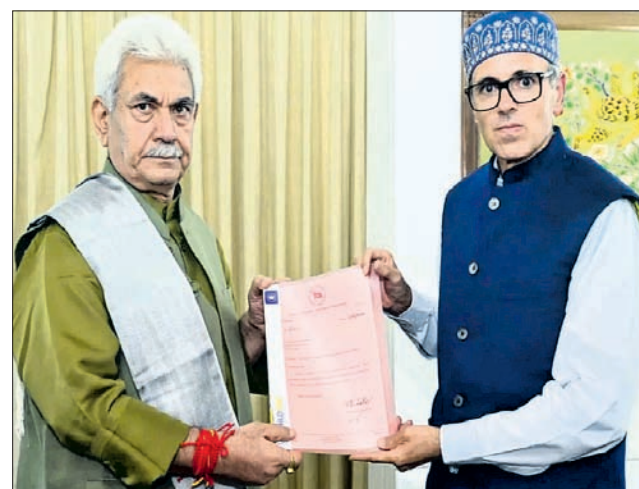
ଏନ୍ସି ବିଧାୟକ ଦଳ ନେତା ଓମାର ଅବଦୁଲ୍ ଶୁକ୍ରବାର କମ୍ପ୍ୟୁ-କମ୍ପ୍ୟୁର ଉପରାଜ୍ୟପାଳ ମନୋଜ ସିଂହାଙ୍କୁ ଭେଟି ବିଧାୟକମାନଙ୍କ ସମର୍ଥନପତ୍ର ପ୍ରଦାନ କରୁଛନ୍ତି।

ଘାଟଗଡ଼, ୧୧/୧୦ (ପି.ଟି.) ସମର୍ଥନ ପତ୍ର ପ୍ରଦାନ କରିଥିଲେ। ୯୦ ଆସନ ବିଶିଷ୍ଟ କମ୍ପ୍ୟୁ-କମ୍ପ୍ୟୁର ବିଧାନସଭାରେ ଏନ୍ସି ୪୨ ଆସନ ଉପରାଜ୍ୟପାଳ ମନୋଜ ସିଂହାଙ୍କୁ ଭେଟି କମ୍ପ୍ୟୁ-କମ୍ପ୍ୟୁର ଜଣ ସାଧାରଣ ବିଧାୟକ ଏବଂ ଆପୁର କେନ୍ଦ୍ରଶାସିତ ଅଞ୍ଚଳରେ ଏନ୍ସି-କମ୍ପ୍ୟୁର ମେଢ଼ ସରକାର ଗଠନ ପାଇଁ ଦାବି ଜଣାଇଛନ୍ତି। ସିଂହାଙ୍କୁ ଭେଟିବା ସମ୍ବନ୍ଧରେ ଓମାର ସହଯୋଗୀ ଦଳର ବିଧାୟକମାନଙ୍କୁ ଭେଟି ବିଧାୟକମାନଙ୍କ ସମର୍ଥନ ପତ୍ର ପ୍ରଦାନ କରିଥିଲେ। ୯୦ ଆସନ ବିଶିଷ୍ଟ କମ୍ପ୍ୟୁ-କମ୍ପ୍ୟୁର ବିଧାନସଭାରେ ଏନ୍ସି ୪୨ ଆସନ ଉପରାଜ୍ୟପାଳ ମନୋଜ ସିଂହାଙ୍କୁ ଭେଟି କମ୍ପ୍ୟୁ-କମ୍ପ୍ୟୁର ଜଣ ସାଧାରଣ ବିଧାୟକ ଏବଂ ଆପୁର କେନ୍ଦ୍ରଶାସିତ ଅଞ୍ଚଳରେ ଏନ୍ସି-କମ୍ପ୍ୟୁର ମେଢ଼ ସରକାର ଗଠନ ପାଇଁ ଦାବି ଜଣାଇଛନ୍ତି। ସିଂହାଙ୍କୁ ଭେଟିବା ସମ୍ବନ୍ଧରେ ଓମାର ସହଯୋଗୀ ଦଳର ବିଧାୟକମାନଙ୍କୁ ଭେଟି ବିଧାୟକମାନଙ୍କ ସମର୍ଥନ ପତ୍ର ପ୍ରଦାନ କରିଥିଲେ।