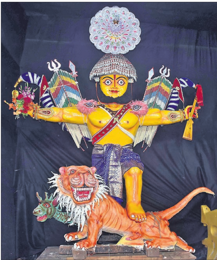
ମାଟିମଣ୍ଡପ ସାହିର ନାଗା।

ଶ୍ରୀକ୍ଷେତ୍ରର ଗୋଷାଣା ପୂଜନ ମଧ୍ୟରେ ନାଗା ଉପାସନା ଏକ ନିଆରା ଉପାସନା, ଯାହା ବାରଦ୍ୱାର ପ୍ରତୀକକୁ ଦର୍ଶାଇଥାଏ। ବାଲିସାହି ଆଖଡ଼ାକୁ ଆରମ୍ଭ ହୋଇଥିବା ନାଗା ଉପାସନା ପୁରୀର ସାତସାହି ୪୨କିମି ଦୂରରେ ଦେଖିବାକୁ ମିଳିଥାଏ। ତେବେ ବାଲିସାହି ନାଗାକୁ ଗାଦିନାଗା ବୋଲି କୁହାଯାଏ। ବର୍ତ୍ତମାନ ବାଲିସାହି ସମେତ ହରଚଣ୍ଡା ସାହି, ପଣ୍ଡିମହାର, ନରେନ୍ଦ୍ରକୋଣ, ମାଳକୋଣ୍ଡର ସାହି ଓ ବଳରାଜସ୍ଥିତ ମାଳଶା ନାଗା ନାଗା ପ୍ରତିଷ୍ଠା କରାଯାଇଛି। ପ୍ରତିବର୍ଷ ପରିଚଳିତବର୍ଷ ମଧ୍ୟ ପରମ୍ପରା ଅନୁଯାୟୀ, ଷଷ୍ଠୀ ଓଷ୍ଟାକୁ ନାଗା ନିର୍ମାଣ କାର୍ଯ୍ୟ ଆରମ୍ଭ ହୋଇଛି। ନାଗାର ଉଚ୍ଚତା ୧୬ ଫୁଟ। ନାଗାମାନଙ୍କୁ ଦୁର୍ଗାପୂଜାର ସମ୍ପର୍କ, ଅଷ୍ଟମୀ ଓ ନବମୀ ତିନିଦିନ ଧରି ପୂଜା କରାଯାଏ। ଦଶମୀରେ ବିସର୍ଜନ କର୍ମ କରାଯାଏ। ଏକାଦଶୀରେ ଶ୍ରୀମନ୍ଦିର ସିଂହଦ୍ୱାରସ୍ଥିତ ସତୀକୁ ନିଆଯାଏ। ପରେ ପୁଷ୍କରିଣୀରେ ବିସର୍ଜନ କରାଯାଏ। ଏତିହାସ ବିଶାରଦ ତ. ପୁରେନ୍ଦ୍ର ମିଶ୍ରଙ୍କ ମତାନୁସାରେ, ଆଦିଶଙ୍କରଙ୍କ ଦ୍ୱାରା ପୃଷ୍ଠି ଦଶନାମୀ ସମ୍ପ୍ରଦାୟର ନାଗା ସମ୍ପ୍ରଦାୟ ଏକ ଅବିଚ୍ଛେଦ୍ୟ ଅଙ୍ଗ। ଏହି ସମ୍ପ୍ରଦାୟ ତତ୍କାଳୀନ ହିନ୍ଦୁ ମଠ, ମନ୍ଦିର ଓ ପୁଷ୍କସୋପକଳ ରକ୍ଷା ପାଇଁ ପୃଷ୍ଠି ହୋଇଥିଲା। ସେମାନେ ସମଗ୍ର ଭାରତରେ ପ୍ରଥମେ ବୌଦ୍ଧ ଧର୍ମାବଲମ୍ବୀ ଏବଂ ପରେ ପୁସ୍କଳମାନ ଓ ମୋଗଲଙ୍କୁ ପ୍ରତିହତ କଲେ। ସେଥିପାଇଁ ପୁଷ୍କ