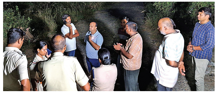
ମହାନଦୀ ସଡ଼କ ଘାଟରେ ପୋଲିସ୍ ଏବଂ ଅଗ୍ନିଶମ ବିଭାଗର କର୍ମଚାରୀମାନେ ନାବାଳକଙ୍କୁ ଖୋଜିବା କାର୍ଯ୍ୟ ତଦାରଖ କରୁଛନ୍ତି।