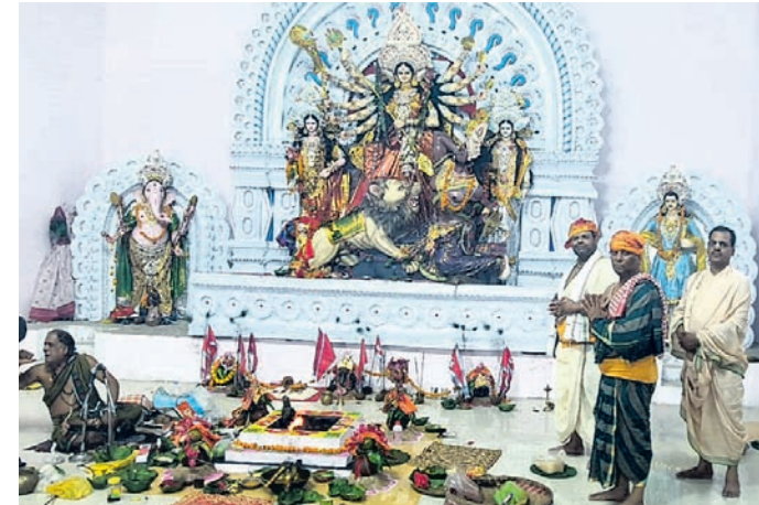
ପରିବର୍ତ୍ତନ ହୋଇଛି। ରୂପବାର ଶସ୍ତ୍ରରେ ଅଧିବାସ କାର୍ଯ୍ୟ ଆରମ୍ଭ ହୋଇ ଗୁରୁବାର ମହାଅଷ୍ଟମୀ ଦିନେ ପୂଜା, ଶୁକ୍ରବାର ମହାଅଷ୍ଟମୀ ପୂଜା