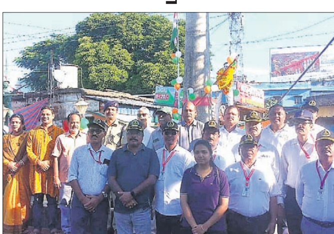
ଶହୀଦ ବାଜିରାଉତଙ୍କ ପ୍ରତିମୂର୍ତ୍ତିରେ ମାଲ୍ୟାପର୍ଣ୍ଣ