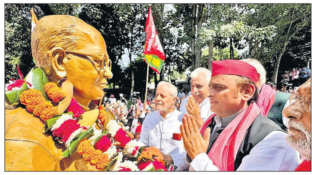
ଲକ୍ଷ୍ମେଶ୍ୱର କରପ୍ରକାଶ ନାରାୟଣଙ୍କ ପ୍ରତିମୂର୍ତ୍ତିରେ ପୁଷ୍ପମାଳ୍ୟ ଅର୍ପଣ କରୁଛନ୍ତି ଏସ୍‌ପି ଅଧ୍ୟକ୍ଷ ଅଖିଳେଶ ଯାଦବ।

ସମାଜବାଦୀ ପାର୍ଟି (ଏସ୍‌ପି) ରାଷ୍ଟ୍ରପତି ଅଧ୍ୟକ୍ଷ ଅଖିଳେଶ ଯାଦବ ଶୁକ୍ରବାର ସମ୍ପୂର୍ଣ୍ଣ କ୍ରାନ୍ତିର ମହାନାୟକ କରପ୍ରକାଶ ନାରାୟଣଙ୍କ ଜୟନ୍ତୀରେ ଶ୍ରଦ୍ଧାଞ୍ଜଳି ଦେବା ପାଇଁ ଲକ୍ଷ୍ମେଶ୍ୱର କରପ୍ରକାଶ ନାରାୟଣଙ୍କ ଇଷ୍ଟରନ୍ୟାମାଳ ସେଣ୍ଟର (କେପିଏନ୍‌ଆଇସି)କୁ ଯାଉଥିବାବେଳେ ଉତ୍ତର ପ୍ରଦେଶ ପୋଲିସ୍ ଡାକ ଗାଡ଼ିକୁ ଅଟକାଇଥିଲା।