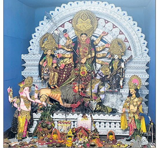
ନ୍ୟାହତା ଶିମିଳିସାହି ପୂଜା କର୍ମିତ୍ର ଦୁର୍ଗା ବଜାର ମେଢ଼।