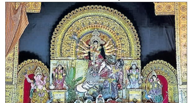
ପୂଜା ମଣ୍ଡପରେ ମା' ଦୁର୍ଗା।