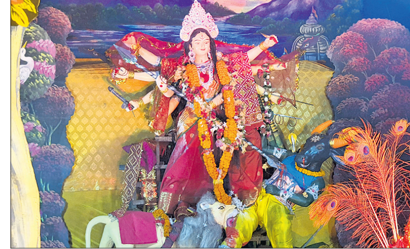
ବଅଁରପାଳ କଲେଜ ଛକ ପୂଜା କର୍ମିତ୍ର ପକ୍ଷରୁ କରାଯାଇଥିବା ମେଢ଼।