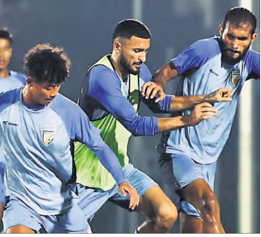
ନାମ୍ ଦିନରେ ଶୁକ୍ରବାର ଭାରତୀୟ ପୁରୁଷ ଦଳର ଅଭ୍ୟାସ।