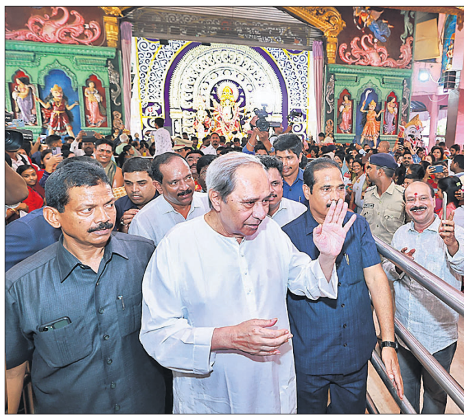
ବିଜେଡି ସଭାପତି ନବୀନ ପଟ୍ଟନାୟକ ଶୁକ୍ରବାର ଭୁବନେଶ୍ୱରରେ ଏକ ପୂଜାମଣ୍ଡପ ବୁଲି ଦେଖୁଛନ୍ତି। ବୁଲିବାରେ କିଛି ଅସୁବିଧା ନାହିଁ। ହେଲେ ଏବେ ମଧ୍ୟ ଜନମାନସର