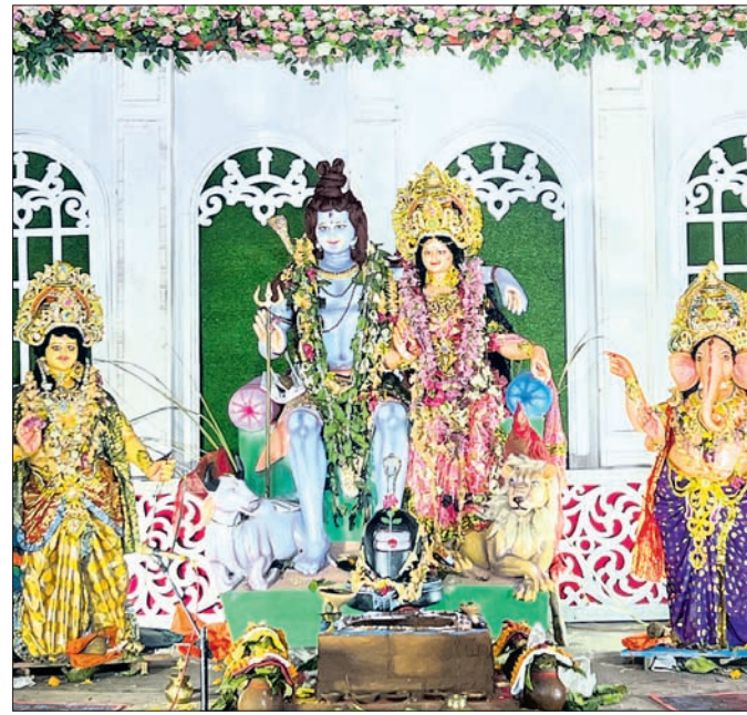
ଅନୁଗୋଳ ସହର ଗାନ୍ଧୀମାର୍ଗ ଛକ ପୂଜା କର୍ମିତ୍ର ପକ୍ଷରୁ ହୋଇଥିବା ମେଢ଼।