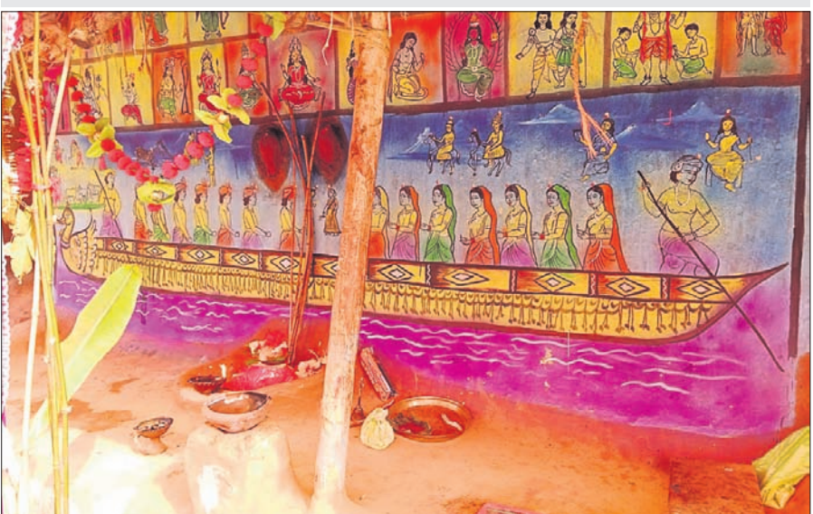
କୋଠିରେ ପୂଜା ପାଇବାକୁ ଥିବା ମା'ମଙ୍ଗଳାଙ୍କ ଦେବଦେବୀଙ୍କ ଫଟୋଟିପ୍ତ।

ଯେଉଁ ଧଳା କଇଁଫୁଲଟି ଦୋହଲିଥାଏ ସେହି ଫୁଲକୁ ବରଣ କରାଯାଇଥାଏ। ଏହାକୁ କୁହାଯାଏ ଫୁଲବରଣ। ଘଣ୍ଟ ଘଣ୍ଟା, ଝୁଲୁଛୁଳି ଆଦି ତାଳରେ ସେବକଙ୍କ ଦେହରେ କାଳିଣୀ ସଦୃଶ ହୁଏ। ପରେ ଅନ୍ୟସେବକମାନେ ଫୁଲବରଣକୁ ଘଟ ଦ୍ୱାରା ପୁଣ୍ଡରେ ପୁଣ୍ଡା ପା'ମଙ୍ଗଳାଙ୍କ ପୀଠ ପରିସରକୁ ଆସିଥାନ୍ତି। ପରେ ସାହି ପରିକ୍ରମା କରାଯାଏ। ଫୁଲବରଣକୁ କୋଠି ଭିତରେ ରଖି ଧୂଳି ଧରି ପୂଜା କରାଯାଇଥାଏ। ପୂଜକ ଦୈନିକ