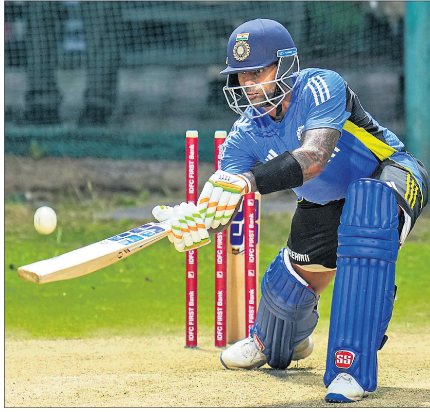
ହାଇଦ୍ରାବାଦରେ ତୃତୀୟ ଟି୨୦ କ୍ରିକେଟ ମ୍ୟାଚ ପୂର୍ବରୁ ଶୁଭକାର ଅଭ୍ୟାସରତ ଦୁଇ ଦଳର ଅଧିନାୟକ ବାଲାଦେଶର ନଜମୁଲ ହୋସେନ ଶାନ୍ତୋ ଓ ଭାରତର ସୂର୍ଯ୍ୟକୁମାର ଯାଦବ।