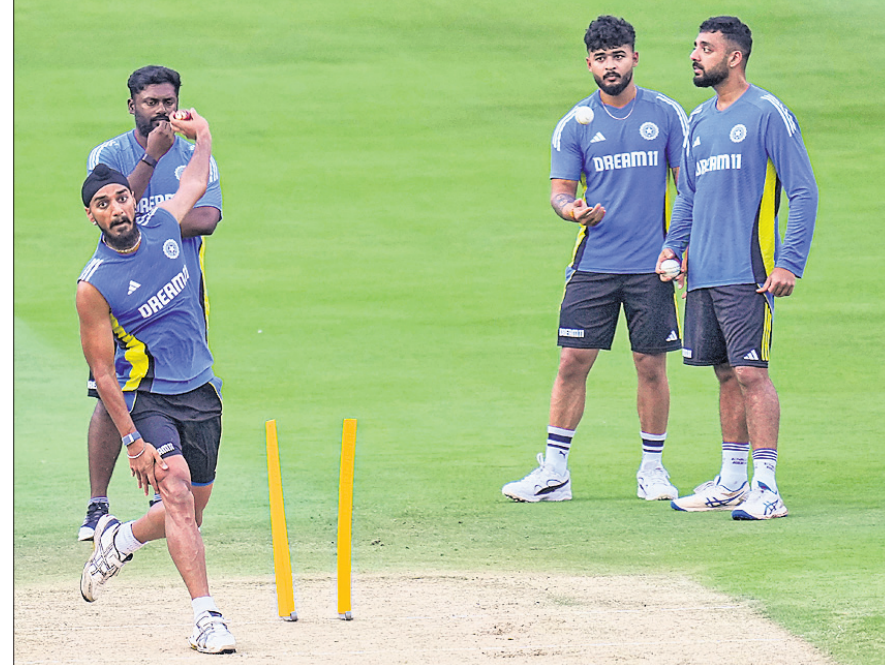
ନେତୃ ସେବନରେ ସାଥୁ ଖେଳାଳିଙ୍କ ଉପସ୍ଥିତିରେ ବୋଲିଂ କରୁଛନ୍ତି ଅର୍ଶଦୀପ ସିଂ।