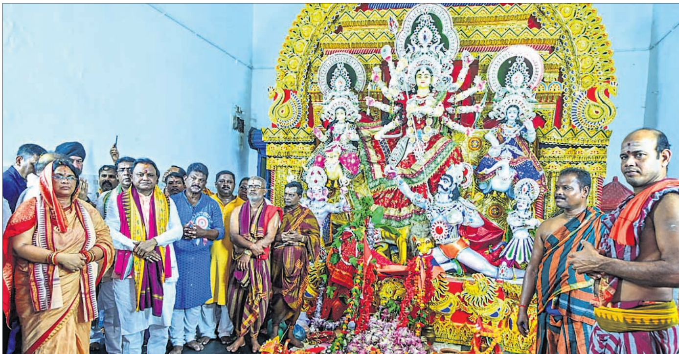
ଭୁବନେଶ୍ୱର ଲକ୍ଷ୍ମୀସାଗର ପୂଜା ମଣ୍ଡପରେ ମା' ଦୁର୍ଗାଙ୍କ ଦର୍ଶନ ଅବସରରେ ମୁଖ୍ୟମନ୍ତ୍ରୀ ମୋହନ ଚରଣ ନାୟକ, ତାଙ୍କ ସ୍ତ୍ରୀ ଡ.ପ୍ରିୟଙ୍କା ନାରାୟଣ ଓ ଅନ୍ୟମାନେ। (ରିପୋର୍ଟ: ପୃଷ୍ଠା-୪)