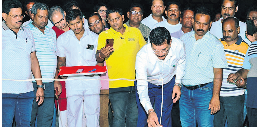
ତାଳଚେର, ୧୫୧୦ (ମନୋଜ ନନ୍ଦ)

ଏନ୍‌ଟିପିସି କଣିହାଁ ପକ୍ଷରୁ ଚାଉଳଖିପ୍ପା ଗ୍ରାଉଣ୍ଡରେ ଦଶହରା ଉତ୍ସବ ଓ ରାବଣପୋଡ଼ି ଆୟୋଜନ କରାଯାଇଥିଲା। ଏଥିରେ ସ୍ଥାନୀୟ ଗ୍ରାମାଞ୍ଚଳରୁ ବହୁ ସଂଖ୍ୟକ ଲୋକ ଅଂଶଗ୍ରହଣ କରିଥିଲେ। ଏହି କାର୍ଯ୍ୟକ୍ରମ ଲୋକମାନଙ୍କୁ ଏକ ସ୍ମରଣୀୟ ଅନୁଭୂତି