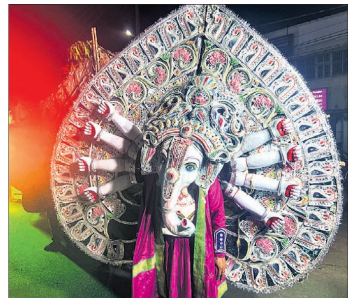
ଅନୁଗୋଳ ସହରରେ ଭବାଣୀ ଶୋଭାଯାତ୍ରା ବେଳେ କଳାକାରମାନଙ୍କ ଦ୍ୱାରା ବିଭିନ୍ନ କଳାକୌଶଳ ପ୍ରଦର୍ଶନ କରାଯାଇଛି।