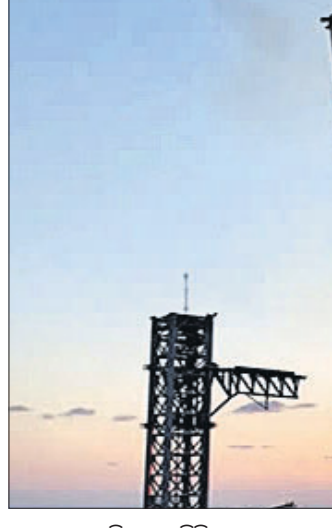
ଝେସ୍ ଏକ୍ସ୍‌ର ଲକ୍ଷ୍ମପ୍ୟାଡ୍‌ରେ ଯାନ୍ତ୍ରିକ ଉତ୍ଥାପନ

ଏକଲ ମସ୍କ୍‌ଙ୍କ ଝେସ୍ ଏକ୍ସ୍‌ ବ୍ଲାର ସୋମବାର ମାଡ୍ର ୭ ମିନିଟ୍ ମଧ୍ୟରେ ୫ମ ଝାରସିପ୍ ରକେଟର ଉତ୍ତ୍ରେକ୍ଷଣ ଓ ଅବତରଣ କରାଯାଇଛି, ଯାହା ଇତିହାସ ସୃଷ୍ଟି କରିଛି। ପୂର୍ବ ୪ଟି ପ୍ରୟାସ ପରି ଚଳିତ ଥର ଝାରସିପ୍ ରକେଟର ବୁଷ୍ଟର ଭାସମାନ ସମୁଦ୍ର ପ୍ଲାଟଫର୍ମରେ ଅବତରଣ କରିନାହିଁ। ଚନ୍ଦ୍ର ଏହା ସମୁଦ୍ରରେ ଅବତରଣ କରିବା ପୂର୍ବରୁ ଲକ୍ଷ୍ମପ୍ୟାଡ୍‌ରେ ମେକାନିକାଲ ଆର୍ମିଏ ବା ଯାନ୍ତ୍ରିକ ବାହୁ ମେକାନିକା ଝାରସିପ୍ ରକେଟର ବୁଷ୍ଟରକୁ ସଫଳତା ସହ ଆକାଶରେ ଧରିବାକୁ ସମର୍ଥ ହୋଇଛି। ଝେସ୍ ଏକ୍ସ୍‌ ଏହାର ଲକ୍ଷ୍ମପ୍ୟାଡ୍‌ରେ ଯାନ୍ତ୍ରିକ ବାହୁକୁ ବ୍ୟବହାର କରି ଲକ୍ଷ୍ମପ୍ୟାଡ୍ ୭ ମିନିଟ୍ ମଧ୍ୟରେ ଝାରସିପ୍ ରକେଟର ବୁଷ୍ଟରକୁ ସିଧାସଳଖ ଲକ୍ଷ୍ମପ୍ୟାଡ୍‌ରେ ଅବତରଣ କରାଇପାରିଛି। ଝେସ୍ ଏକ୍ସ୍‌