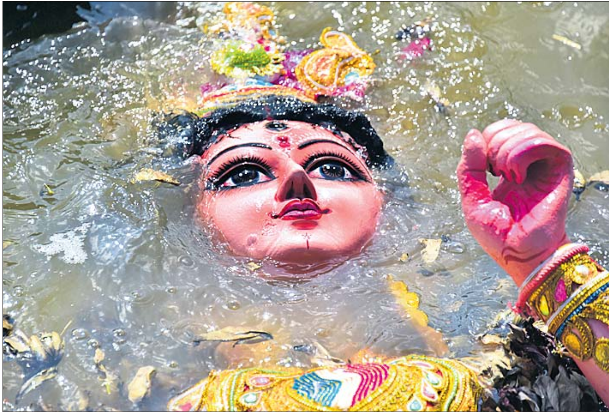
ମା'ଙ୍କୁ ମେଲାଣି: କୁଆଖାଇ ନଦୀରେ ପ୍ରସ୍ତୁତ ଅସ୍ଥାୟୀ ପୋଖରୀରେ ସୋମବାର ଦେବୀ ଦୁର୍ଗାଙ୍କ ପୂର୍ଣ୍ଣିକା ବିଧିବଦ୍ଧ କରାଯାଇଛି।