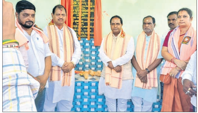
ବିର୍ବାପୁଣ୍ଡା କମ୍ୟୁନିଟି ସେଣ୍ଟର ଗୃହର ଶୁଭ ଉଦ୍‌ଘାଟନ କରିଥିଲେ। କାର୍ଯ୍ୟକ୍ରମ