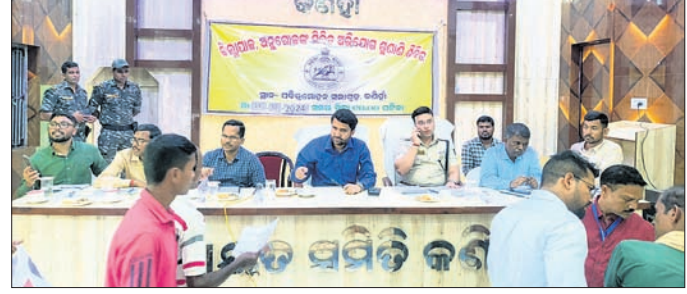
ଜନ ଅଭିଯୋଗ ଶୁଣାଣିରେ ଜିଲ୍ଲାପାଳଙ୍କ ସମେତ ଅନ୍ୟ ଅଧିକାରୀମାନେ।

ପବିତ୍ରନଗର, ୧୫୧୦ (ନିରୋଜ କୁମାର ପ୍ରଧାନ) କଣିହାଁ ବୁକରେ ସୋମବାର ଜିଲ୍ଲାପାଳଙ୍କ ଅଭିଯୋଗ ଶୁଣାଣି କାର୍ଯ୍ୟକ୍ରମ ଅନୁଷ୍ଠିତ ହୋଇଯାଇଛି। କଣିହାଁ ପଞ୍ଚାୟତ ସମିତି ସଭାଗୃହଠାରେ ଆୟୋଜିତ