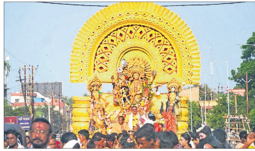
ଅନୁଗୋଳ ସହରରେ ଭବାଣୀ ଶୋଭାଯାତ୍ରାରେ ସାମିଲ ହୋଇଥିବା ବିଭିନ୍ନ ପୂଜା କମିଟିର ମେଡ଼।