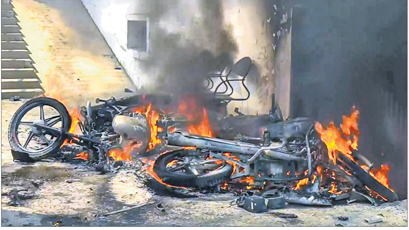
ଦୁର୍ଗାପର୍ବରେ ଏକ ମୋଟରସାଇକେଲ ଶୋ'ରୁମ୍‌ରେ ନିଆଁ ଲଗାଇଦେବାକୁ ବହୁ ବାଲକ କଳ୍ପିତାଲକ୍ଷି।

ମୁମ୍ବାଇରୁ ଦୁଇଦିନ ଯାଉଥିବା ଏୟାର ଇଣ୍ଡିଆର ଏକ ବିମାନକୁ ବୋମାରେ ଉଡ଼ାଇଦେବାକୁ ସୋମବାର ଧମକ ମିଳିବାରୁ ଏହାକୁ ନୂଆଦିଲ୍ଲୀରେ କରୁରୀ ଅବତରଣ କରାଯାଇଛି। ଉକ୍ତ ବିମାନରେ ୨୩୯ ଜଣ ଯାତ୍ରୀ ଓ ୧୯ ଜଣ କ୍ରିଜ୍ ସଦସ୍ୟ ରହିଥିଲେ। ଇନ୍‌ଡିଆରାଣୀ ଅନ୍ତର୍ଜାତୀୟ ବିମାନ ବନ୍ଦରରେ ଏୟାରପୋର୍ଟକୁ ପୁଞ୍ଜୀନୁପୁଞ୍ଜୀ ଯାତ୍ରା କରାଯାଇଥିବାବେଳେ କୌଣସି ସମ୍ବେଦନକର ସାମଗ୍ରୀ ମିଳି ନ ଥିବା ନେଇ ଜଣେ ପୋଲିସ୍ ଅଧିକାରୀ ସୂଚନା ଦେଇଛନ୍ତି। ତେବେ ଉକ୍ତ ବିମାନର ସମୟକୁ ପୁନଃ ନିର୍ଦ୍ଧାରଣ କରାଯାଇଛି ଏବଂ ମଙ୍ଗଳବାର ସକାଳେ ଏହା ନୂଆଦିଲ୍ଲୀରୁ ଦୁଇଦିନ ଯାତ୍ରା କରାଯିବ ବୋଲି ଏୟାର ଇଣ୍ଡିଆ ସୂଚନା ଦେଇଛି। ସେହିପରି ମୁମ୍ବାଇରୁ ମଧ୍ୟାହ୍ନ ଓ କେନ୍ଦ୍ର ଅଭିମୁଖେ ଯିବାକୁ ଥିବା ଇଣ୍ଡିଗୋ ଏୟାରଲାଇନ୍‌ରୁ ୨ଟି ବିମାନକୁ ମଧ୍ୟ ବୋମାରେ ଉଡ଼ାଇଦେବାକୁ ଧମକ ମିଳିଛି। ଫଳରେ ମୁମ୍ବାଇ ବିମାନବନ୍ଦରରେ ଉଭୟ ବିମାନର ତଲାସୀ ନିଆଯାଇଥିଲା। ତେବେ କୌଣସି ସମ୍ବେଦନକର ସାମଗ୍ରୀ ମିଳି ନ ଥିଲା। ତେବେ ଉଭୟ ବିମାନ ଅନେକ ଦିନ ବିଳମ୍ବରେ ଉଡ଼ାଣ ଭରିଥିଲା।