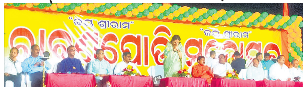
ତାଳଚେର, ୧୫୧୦