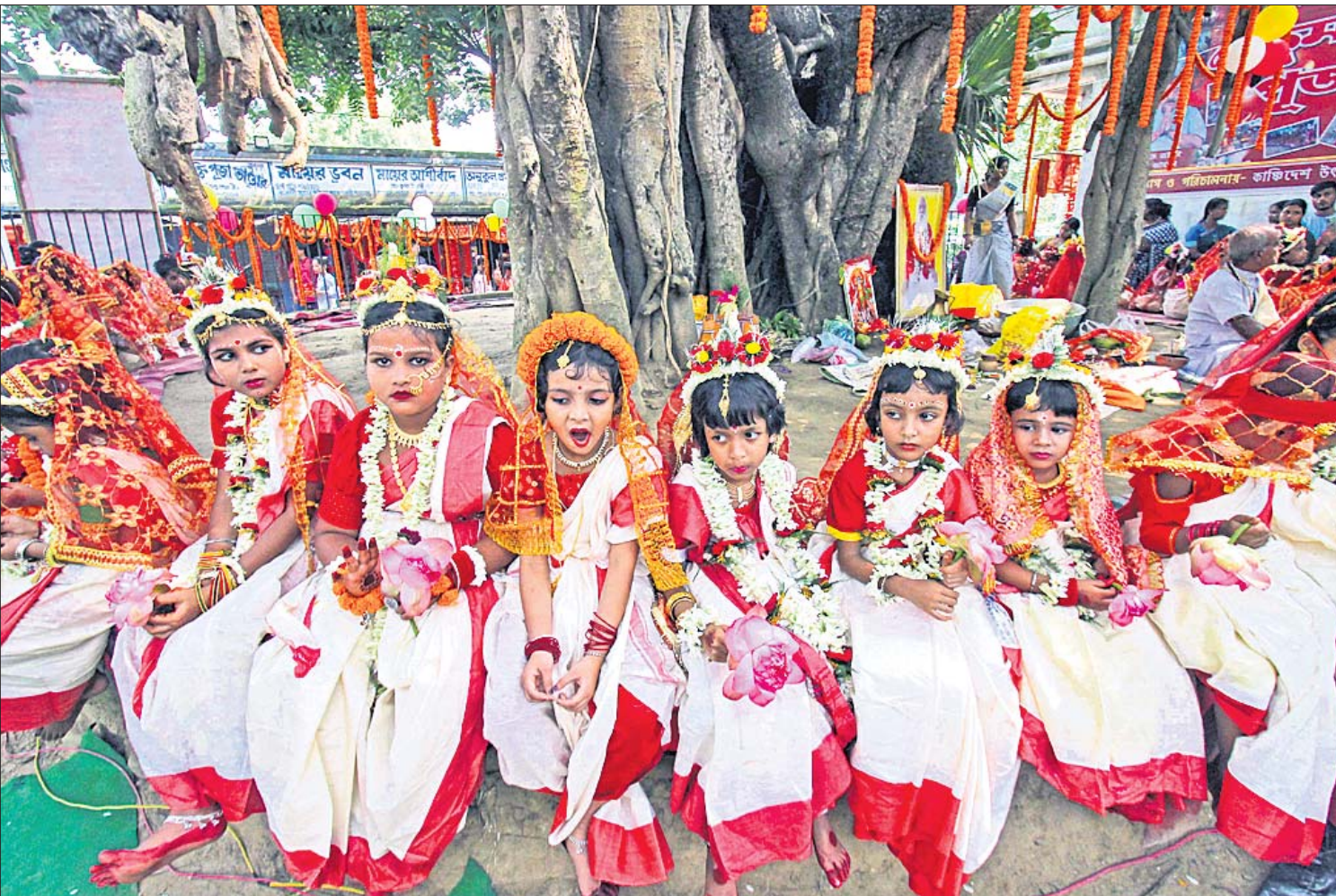
୫୧ ଶକ୍ତିପାଠ ମଧ୍ୟରୁ ଅନ୍ୟତମ ପଣ୍ଡିତବଞ୍ଚନ ବୀରଭୂମି ଜିଲ୍ଲା କନକାଳୀ କାଳୀ ମନ୍ଦିରରେ ମଙ୍ଗଳବାର ୫୧ ଡିଅକୁ ନେଇ କୁମାରୀ ପୂଜା କରାଯାଇଛି।

ଉଦିତା ସବୁଠାରୁ ଦୀନା ଖେଳାଳି ହକି ଲଣ୍ଡିଆ ଲିଗ୍ ମହିଳା ଖେଳାଳି ନିଲାମରେ ସବୁଠାରୁ ଦୀନା ଖେଳାଳି ବିବେଚିତ ହୋଇଛନ୍ତି ଭାରତର ଉଦିତା ଦୁହାନ।