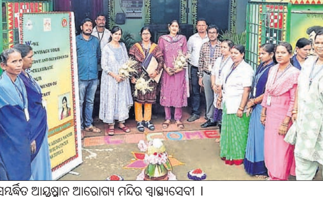
ସମ୍ବଲପୁର ଆରୋଗ୍ୟ ମନ୍ଦିର ସ୍ୱାସ୍ଥ୍ୟସେବା।