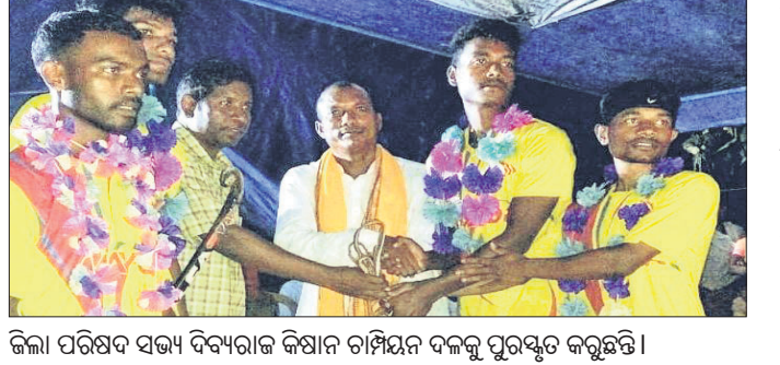
ଜିଲ୍ଲା ପରିଷଦ ସଭ୍ୟ ବିଦ୍ୟାଳୟ କିଷାନ ଚାମ୍ପିୟନ ଦଳକୁ ପୁରସ୍କୃତ କରୁଛନ୍ତି।