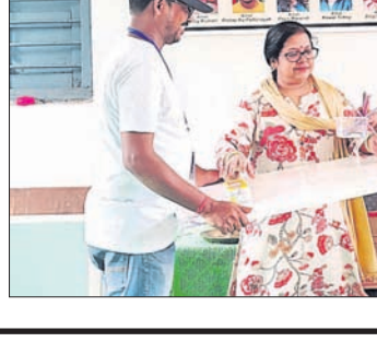
ଶିବିରରେ ଉପସ୍ଥିତ କର୍ମକର୍ତ୍ତାଗଣ।

କରିବା ପାଇଁ ଉପଯୋଗ ଲାଗି ଯୋଜନା କାର୍ଯ୍ୟକାରୀ କରିଛି। ଏରବ୍ ସପ୍ତି-୧ ଏବଂ ସିଆରବ୍ ବିଭାଗକୁ ଜଳ ଯୋଗାଣ କରୁଥିବା ବୋଲି ମିଲ୍ ପକ୍ଷ ହାତୀହ ବନ୍ଦ ଯୋଗୁ ମେକ୍ ଇନ୍ ଜଳ ବ୍ୟବହାର ମଧ୍ୟ ହ୍ରାସ ପାଇଛି। ଏହି ସମସ୍ତ ପଦକ୍ଷେପ ଚଳାଉ ଚଳିଥିବା ସମୟରେ ଆରବ୍ ସପ୍ତିର ପ୍ରମୁଖ ସମ୍ପାଦକ ଭାବେ ମେକ୍ ଅପ୍ ଡିଭିସନ ପକ୍ଷରୁ ହାତୀହ ହ୍ରାସ କରିଛି। କାରଖାନାର ପ୍ରମୁଖ ଉତ୍ପାଦନ ସ୍ଥିତି ଗୁଡ଼ିକରେ ଜଳ ଲୋଡ଼ା ଉପରେ ହ୍ରାସ ପାଇଁ ଜଳ ବିଶୋଧନ ରାସାୟନିକ ପ୍ରକ୍ରିୟା ପ୍ରୟୋଗ ମାଧ୍ୟମରେ ଜଳ ଉପଯୋଗକୁ ହ୍ରାସ କରାଯାଇଛି। ଏହାସହିତ କାରଖାନା ମଧ୍ୟରେ ବିଭିନ୍ନ ଜଳ ସଂରକ୍ଷଣ ବନ୍ଦ ପାଇଁ ବ୍ୟାପକ ମରାମତି କରାଯାଇଛି। ଏହି ମିଳିତ ପଦକ୍ଷେପ ଗୁଡ଼ିକ ଜଳ ଆବଶ୍ୟକତା କ୍ରମାଗତ ସ୍ତରରେ ତ୍ରିତମେଶ୍ ପ୍ଲାଣ୍ଟରୁ ବିଶୋଧିତ ଜଳକୁ ଆରବ୍ ସପ୍ତି ମଧ୍ୟରେ ଥିବା ବିଭିନ୍ନ ବିଭାଗରେ ଜଳସେଚନ ଓ ଗୋସ୍ତା ସଫା