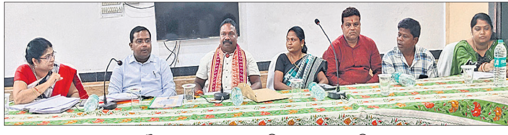
ବୈଠକରେ ମନ୍ତ୍ରୀ ଅଧିକାରୀଙ୍କ ସହିତ ଆଲୋଚନା କରୁଛନ୍ତି।