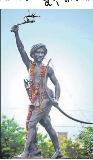
ବିର୍ସା ମୁଖାଳ ପ୍ରତିମୂର୍ତ୍ତି। ନିର୍ମାଣ କରାଯିବା ସହ ତାଙ୍କ ବୀରତା ଚର୍ଚ୍ଚାବଳୀ କେନ୍ଦ୍ର, ଏକ ସମ୍ମିଳନୀ କକ୍ଷ ମଧ୍ୟ ନିର୍ମାଣ ହେବ। ଏଥିପାଇଁ ଜିଲ୍ଲା ବିଧିସଭା ସେଠା ସୁନ୍ଦରଗଡ଼ ଜିଲ୍ଲାପାଳଙ୍କୁ ନିର୍ଦ୍ଦେଶ ଦେଇଛନ୍ତି। ଯୋଜନା ମୁତାବକ ବିର୍ସା ମୁଖାଳ ୧୫୦୯୯୯ ବିଶିଷ୍ଟ ସ୍ମାରକ

ସୁନ୍ଦରଗଡ଼ ଜିଲ୍ଲାରେ ଆଦିବାସୀ ନେତା ଶହାଦ ବିର୍ସା ମୁଖାଳ ୧୫୦୯୯୯ ବିଶିଷ୍ଟ ସ୍ମାରକ ସ୍ଥାପନ ହେବ। ଏହି ଉପଲକ୍ଷେ ଆସନ୍ତା ନଭେମ୍ବର ୧୫ତାରିଖରେ ବିର୍ସା ମୁଖାଳ ଜୟନ୍ତୀରେ ରାଉରକେଲାଠାରେ ଏକ ରାଜ୍ୟସ୍ତରୀୟ ବିଶାଳ ସମାରୋହ ମଧ୍ୟ ଆୟୋଜନ ହେବ। ସମାରୋହରେ ବିର୍ସା ମୁଖାଳ ସ୍ମାରକ ସ୍ଥାପନ ଲାଗି ଆଧାରଣିକ ସ୍ଥାପନ ହେବା କାର୍ଯ୍ୟକ୍ରମ ରହିଛି। ଅନ୍ୟପଟେ ଆସନ୍ତା ବର୍ଷ ବିର୍ସା ମୁଖାଳ ୧୫୦୯୯୯ ଜୟନ୍ତୀରେ ନିର୍ଦ୍ଧାରିତ ବିଶାଳକାରୀ ବିର୍ସା ମୁଖାଳ ସ୍ମାରକ ନିର୍ମାଣ କାମ ସମ୍ପୂର୍ଣ୍ଣ କରିବାକୁ ଲକ୍ଷ୍ୟଧାର୍ଯ୍ୟ କରାଯାଇଛି। ଏହି ପ୍ରସ୍ତାବକୁ ମୁଖ୍ୟମନ୍ତ୍ରୀ ମୋହନ ଚରଣ ମାଝୀ ମଞ୍ଜୁରୀ ପ୍ରଦାନ କରିଛନ୍ତି। ବିର୍ସା ମୁଖାଳ ସ୍ମାରକ ସହ ମଞ୍ଜୁଳକ୍ଷ୍ମରେ ଗୁଡ଼ ଓ ନାରିକେଳ ସମର୍ପଣ କରିଥିଲେ। ଶ୍ରଦ୍ଧାଳୁଙ୍କ ଦ୍ୱାରା ୧୦୦୮ ଗାୟତ୍ରୀ ମହାମନ୍ତ୍ର ଜପ କରାଯାଇଥିଲା। ପରେ ଗାୟତ୍ରୀ ପରିବାର ପକ୍ଷରୁ ବିଶ୍ୱଶାନ୍ତି ଲାଗି ସାମୁଦ୍ରିକ ପ୍ରାର୍ଥନା କରାଯାଇଥିଲା।