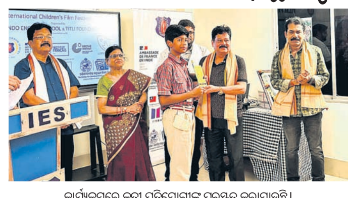
କାର୍ଯ୍ୟକ୍ରମରେ କୃତୀ ପ୍ରତିଯୋଗୀଙ୍କୁ ପୁରସ୍କୃତ କରାଯାଇଛି।