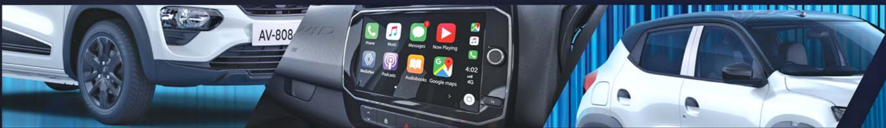
ପିଆନୋ ବ୍ଲାକ୍ ଯେକ୍ସ ହୁଇଲ୍ସ