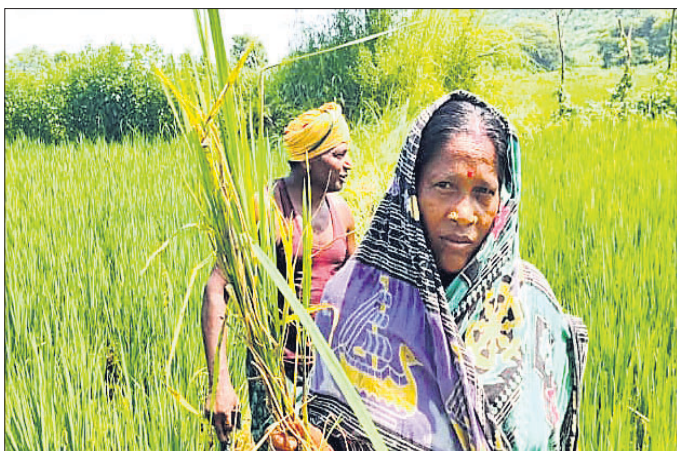
ପୋକ ଲାଗିଥିବା ଧାନଗଛ ଦେଖାଉଛନ୍ତି ଚାଷୀ।

ଖଡ଼ିଆଳ, ୧୫୧୦ (ସୁଜିତ କୁମାର ପ୍ରଧାନ) ନୂଆପଡ଼ା ଜିଲ୍ଲା ଖଡ଼ିଆଳ ବ୍ଲକ୍ରେ ଧାନ ଫସଲରେ ରୋଗପୋକ ଚାଷୀଙ୍କ ଚିନ୍ତା ବଢ଼ାଇଛି। ବିଶେଷକରି ବ୍ଲକ୍ ଅନ୍ତର୍ଗତ ତିଖାଳି, ଚତୁର୍ଥମାଳ, ବଳାପୁର, ବୋହେଲପଡ଼ା ଆଦି ଗ୍ରାମର ଚାଷକର୍ମୀରେ ରୋଗପୋକର ପ୍ରାୟତଃ ଦେଖାଦେଇଛି। କାଣ୍ଡବିନ୍ଧା ରୋଗ ଯୋଗୁ ଧାନଗଛ ଶୁଷ୍କ ମରିଯାଉଛି। ଏହି ରୋଗର ପୋକ ଧାନ ଗଛକୁ ନଷ୍ଟକରି ଦେଉଛନ୍ତି। ଚାଷୀମାନେ ନିଜ ଚେଷ୍ଟାରେ ଔଷଧ ଆଣି ସିଧିନ କରୁଥିଲେ ମଧ୍ୟ ସୁଫଳ ମିଳୁନାହିଁ। ଏ ବର୍ଷ ଭଲ ବର୍ଷ ହେବାରୁ ଭଲ ଅମଳର ଆଶା ରଖୁଥିଲେ ଚାଷୀ। କିନ୍ତୁ ରୋଗପୋକ ଯୋଗୁ ସେମାନଙ୍କ ଆଶା ମଉଳିକାରେ