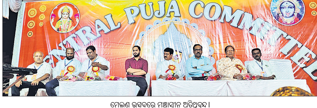
ମେଲଣ ଉପରେ ମଞ୍ଚାସୀନ ଅତିଥିବୃନ୍ଦ।