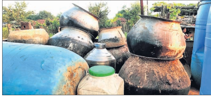
ମହିଳାଙ୍କ ଦ୍ୱାରା ଜବତ ମଦ ତିଆରି ସରମ୍ପାଦିତ ମଦକୁ ପୋତ।

ନୂଆପଡ଼ା, ୧୫୧୦ (ମକାରୁ ବେମାଲ) ନୂଆପଡ଼ା ଜିଲ୍ଲା କୋମନା ବ୍ଲକ୍ ସୁନାବେଡ଼ା ଅଭିଯାନରେ ଦିନକ ପରେ ଚଳାଣିଆ ଛୁଟିଆ ସମ୍ପ୍ରଦାୟର ଲକ୍ଷ୍ମୀଦେବୀ ସୁନାବେଡ଼ାକୁ ଅନୁଷ୍ଠିତ ହେବ। ଏହାକୁ ଦୃଷ୍ଟିରେ ରଖି ମହିଳାମାନେ ମଦମୁକ୍ତି ଅଭିଯାନ ଆରମ୍ଭ କରିଛନ୍ତି। ସ୍ୱୟଂ ସହାୟକ ଗୋଷ୍ଠୀର ଶତାଧିକ ମହିଳା ବିଭିନ୍ନ ସ୍ଥାନ ବୁଲି ବିକ୍ରମ ପରିମାଣରେ ଦେଖା ମଦ, ମଦୁଲ ପୋତ ସହ ମଦ ତିଆରି ସାମଗ୍ରୀ ଜବତ କରିଛନ୍ତି। ସୁନାବେଡ଼ା ସୁନାବେଡ଼ା ଅଭିଯାନରେ ଭିତର ଥିବା ଗାଁଗୁଡ଼ିକରେ ବେଆଇନ ଭାବେ