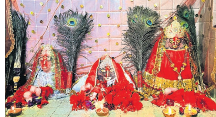
ପୀଠରେ ପୂଜା ପାଉଥିବା ଦେବୀ।