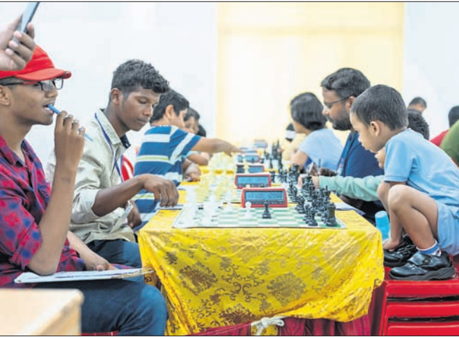
ପଞ୍ଚମ ରାଉଣ୍ଡ ଅବସରରେ ଖେଳାଳିମାନେ ।