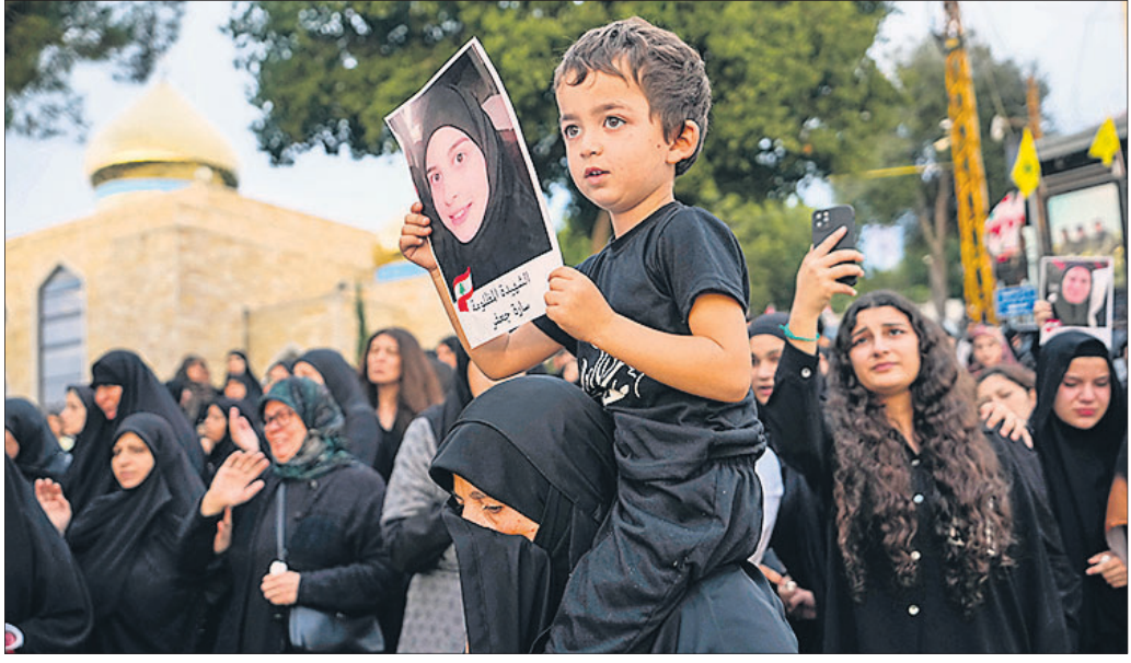
ଲେବାନନ୍‌ର ବାୟବୋଲୁଠାରେ ଏକ ସାମୂହିକ ଅତିମ ସଂସ୍କାର ଶୋଭାଯାତ୍ରାରେ ଜଣେ ବାଳକ ନିଜ ସମ୍ପର୍କୀୟଙ୍କ ଫଟୋକୁ ଧରିଛନ୍ତି।

କଲିଡ଼ ଅଭିନେତା ସଲମାନ ଖାନ୍‌ଙ୍କ ପ୍ରତି ଲରେନ୍ସ ବିଶ୍ଵେଇ ଗ୍ୟାଙ୍ଗ୍‌ରୁ ଆକ୍ରମଣ ଧମକ ମିଳିବା ପରେ ପୋଲିସ ଚାକ ଘର ଉପରେ ୨୪ ଘଣ୍ଟା ନଜର ରଖିଛି। ୬୦ରୁ ଊର୍ଦ୍ଧ୍ୱ ସାବାପୋସାକଧାରୀ ପୋଲିସ ଅଫିସର ୨୪ ଘଣ୍ଟା ଚାକ ଘର ପାଖରେ ପୁରୁଷ ନହିଁ ସେଠାକୁ ଆସୁଥିବା ଭିଜିଟରମାନଙ୍କ ଯାଞ୍ଚ କରିବେ। କୌଣସି ଦେଆଇନ ସମାଗମକୁ ଅନୁମତି ଦିଆଯିବ ନାହିଁ। ଏସିଏସି ନେତା ବାବା ସିଦିକ୍‌ଙ୍କୁ ହତ୍ୟା ପରେ ସଲମାନଙ୍କ ବାହୁଡ଼ିତ ଗାଳାନ୍ତି ଆପାର୍ତମେଶ୍ୱରେ ସୁରକ୍ଷାକୁ ବଢ଼ାଇ ଦିଆଯାଇଛି। ବିଶ୍ଵେଇ ଗ୍ୟାଙ୍ଗ୍ ସଲମାନଙ୍କୁ ଚାର୍ଜେଟରେ ରଖୁଆସିଛି। ପୁସାଇ ପୋଲିସ କଲିଡ଼ ସ୍ଵରାଜ୍ୟ ଘର ନିକଟରେ ଏଥାଇ ସମର୍ଥ ହାଇଡ୍ରୋଲୋଜିଷ୍ଟମାନ ସିପିଟିଭି କ୍ୟାମେରା ଲଗାଇଛି, ଯେଉଁଥିରେ ମୁହଁ ଚିହ୍ନିବା ଚେନ୍ନାଇଲୋଜି ରହିଛି। ଉକ୍ତ ଅଞ୍ଚଳ ଦେଇ ଏକାଧିକ ଥର ଅତିକ୍ରମ କରୁଥିବା ବ୍ୟକ୍ତିଙ୍କୁ ଉକ୍ତ କ୍ୟାମେରା ଚିହ୍ନଟ କରିପାରିବ। ଏକ କମାଣ୍ଡ ସେକ୍ଟର ଉକ୍ତ ଅଞ୍ଚଳ ଉପରେ ୨୪ ଘଣ୍ଟା ନଜର ରଖିଛି।