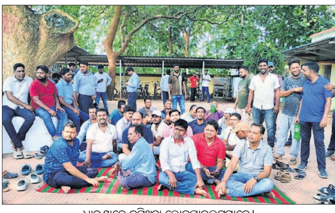
ଧାରଣାରେ ବସିଥିବା ଲୋକପାଇଲଟମାନେ।