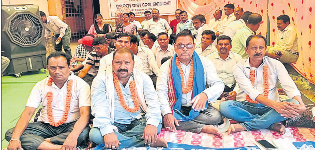
ବୁକ୍ ଶିକ୍ଷା ଅଧିକାରୀଙ୍କ ଅଧିକ ସମ୍ମୁଖରେ ଧାରଣା ଦିଆଯାଇଛି।

ଭବାନୀପାଟଣା, ୧୫୧୦ (ଉତ୍ତମ କୁମାର ବାଗ) କଳାହାଣ୍ଡି ଜିଲ୍ଲା ଭବାନୀପାଟଣା ସଦର ବ୍ଲକ୍ ଏକ କ୍ୟାଡର ପ୍ରାଥମିକ ଶିକ୍ଷକ ସଂଘ ପକ୍ଷରୁ ୨ ଦମ୍ପା ଦାବି ନେଇ ମଙ୍ଗଳବାର ସ୍ଥାନୀୟ ବୁକ୍ ଶିକ୍ଷା ଅଧିକାରୀଙ୍କ ଅଧିକ ସମ୍ମୁଖରେ ଧାରଣା ଦିଆଯାଇଛି। ସଂଘର ବୁକ୍ ସଭାପତି ଦାମୋଦର ଚନ୍ଦନ ଓ