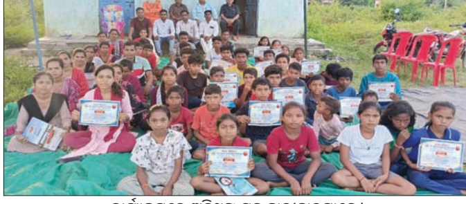
କାର୍ଯ୍ୟକ୍ରମରେ ଅତିଥିଙ୍କ ସହ ଛାତ୍ରାଭ୍ୟାସମାନେ।

ନୂଆପଡ଼ା, ୧୫୧୦ (ମକାରୁ ବେମାଲ) ନୂଆପଡ଼ା ଜିଲ୍ଲା କୋମନା ବ୍ଲକ୍ ସୁନାବେଡ଼ା ଅଭିଯାନରେ ଦିନକ ପରେ ଚଳାଣିଆ ଛୁଟିଆ ସମ୍ପ୍ରଦାୟର ଲକ୍ଷ୍ମୀଦେବୀ ସୁନାବେଡ଼ାକୁ ଅନୁଷ୍ଠିତ ହେବ। ଏହାକୁ ଦୃଷ୍ଟିରେ ରଖି ମହିଳାମାନେ ମଦମୁକ୍ତି ଅଭିଯାନ ଆରମ୍ଭ କରିଛନ୍ତି। ସ୍ୱୟଂ ସହାୟକ ଗୋଷ୍ଠୀର ଶତାଧିକ ମହିଳା ବିଭିନ୍ନ ସ୍ଥାନ ବୁଲି ବିକ୍ରମ ପରିମାଣରେ ଦେଖା ମଦ, ମଦୁଲ ପୋତ ସହ ମଦ ତିଆରି ସାମଗ୍ରୀ ଜବତ କରିଛନ୍ତି। ସୁନାବେଡ଼ା ସୁନାବେଡ଼ା ଅଭିଯାନରେ ଭିତର ଥିବା ଗାଁଗୁଡ଼ିକରେ ବେଆଇନ ଭାବେ