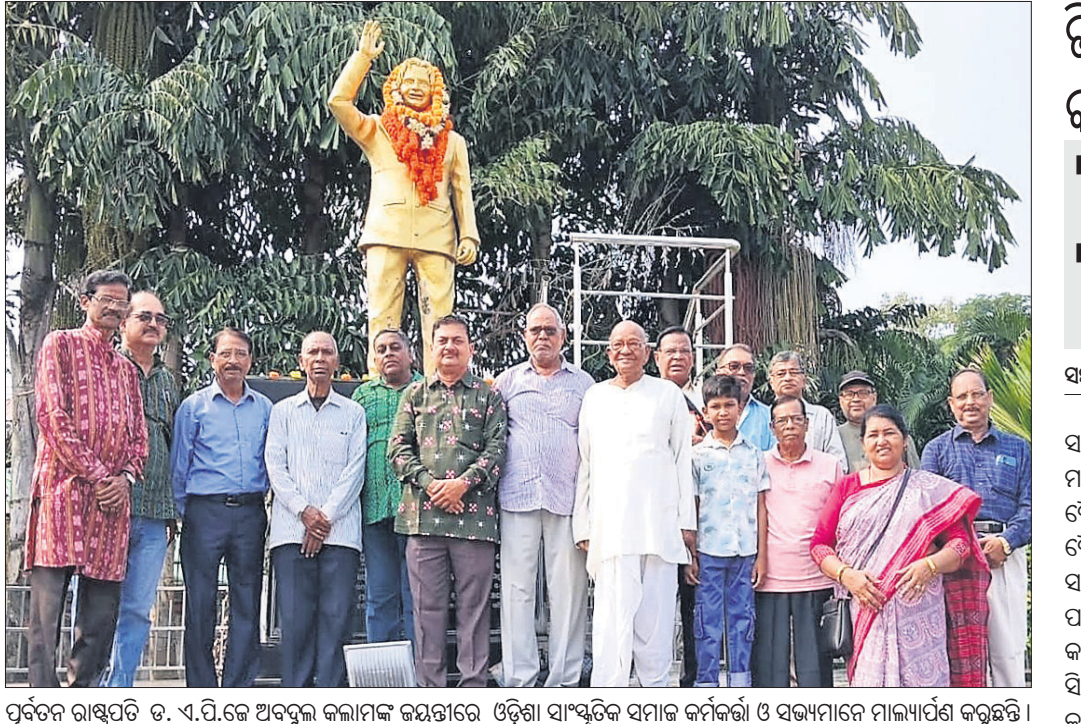
ପୂର୍ବତନ ରାଷ୍ଟ୍ରପତି ଡ. ଏ.ପି.କେ ଅବଦୁଲ କଲୀମଙ୍କ ଜୟନ୍ତୀରେ ଓଡ଼ିଶା ସାଂସ୍କୃତିକ ସମାଜ କର୍ମକର୍ତ୍ତା ଓ ସଭ୍ୟମାନେ ମାଲ୍ୟାପର୍ଗ କରୁଛନ୍ତି।