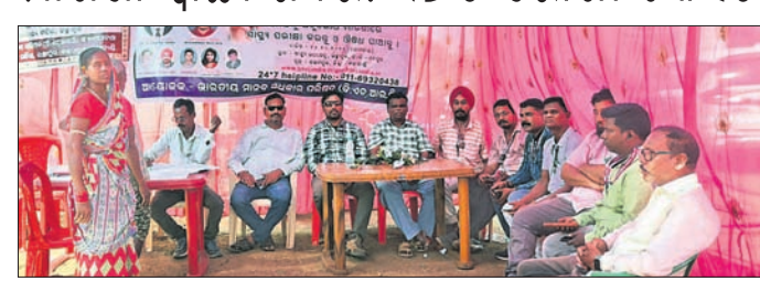
କଳମପୁର, ୧୫୧୦