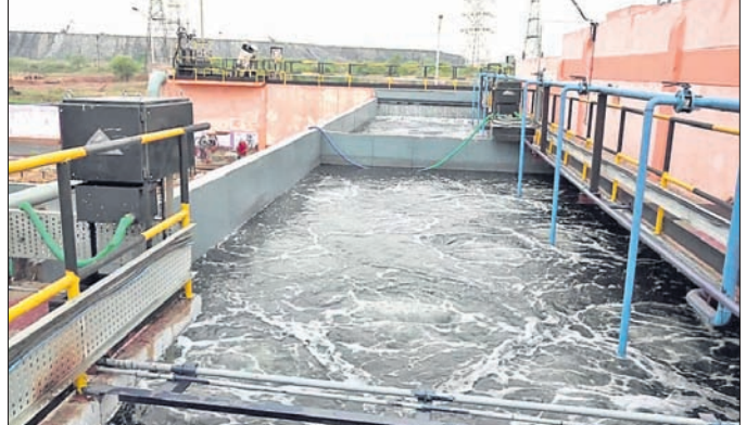
ଆରବ୍ ସପ୍ତି ଦ୍ୱାରା ବର୍ଣ୍ଣ ଜଳ ପରିଚାଳନା।

ଆରବ୍ ସପ୍ତି ଗତ ସେପ୍ଟେମ୍ବର ମାସରେ ଅଣୋଧିତ ଇସ୍ପାତ ଚଳାଉ ଚଳିଥିବା ସର୍ବନିମ୍ନ ମାସିକ ୨.୮୩ ଘନ ମିଟର ଆପେକ୍ଷିକ ଜଳ ଉପଯୋଗରେ ରେକର୍ଡ୍ ସ୍ଥାପନ କରିଛି। ଏଥିପୂର୍ବରୁ ୨୦୨୩ ଜୁଲାଇ ମାସରେ ଅଣୋଧିତ ଇସ୍ପାତ ଚଳାଉ ଚଳିଥିବା ୨.୮୪ ଘନ ମିଟର ଆପେକ୍ଷିକ ଜଳ ଉପଯୋଗ ଆରବ୍ ସପ୍ତିର ଶ୍ରେଷ୍ଠ ପ୍ରଦର୍ଶନ ରହିଥିଲା। ଜଳ ଉପଯୋଗରେ ହ୍ରାସ ହେଉଛି ଆରବ୍ ସପ୍ତିର ଜଳ ପ୍ରଦାନ ବିଭାଗ (ଡିଭିଏମ୍.ଏସି) ଦ୍ୱାରା ଏହାର ବ୍ୟାପକ ଜଳ ସଂରକ୍ଷଣ ଚଳାଉ ଚଳିଥିବା ପ୍ରମାଣ ଦେଖାଯାଇଛି। ଜିରୋ ଲିକ୍ଚିଡ୍ ଡିସିଆର୍ଡ୍ (ଜେଡ୍ ଏଲ୍.ଡି) ବା ଶୂନ୍ୟ ବର୍ଣ୍ଣ ଜଳ ନିଷ୍କାସନ ପ୍ରକଳ୍ପ ଅଧୀନରେ ତ୍ରିତମେଶ୍ ବିଶ୍ୱମ-୧ର ସ୍ଥାପନ ଏହାର ପ୍ରମୁଖ କାରକ ଅଟେ। ଇସ୍ପାତ କାରଖାନା