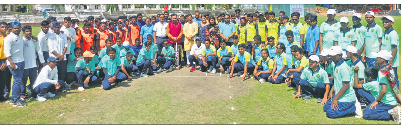
ରାଜ୍ୟସ୍ତରୀୟ ଦୃଷ୍ଟିବାଧୂତ କ୍ରିକେଟ ଚୁନାମେଣ୍ଟର ଉଦ୍‌ଘାଟନୀ ଅବସରରେ ଅତିଥିଙ୍କ ସହ ଅଂଶଗ୍ରହଣକାରୀ ଦଳର ଖେଳାଳିମାନେ ।