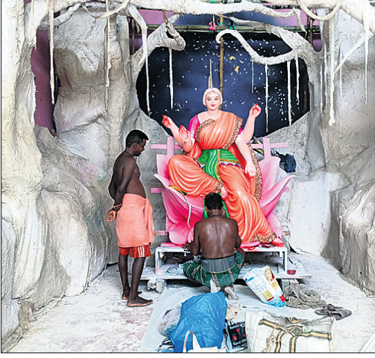
ନେତୃତ୍ୱ ପୂଜା ମଣ୍ଡପରେ ମା'ଙ୍କୁ ଶେଷ ସର୍ଗ ଦେଉଛନ୍ତି ଶିଳ୍ପୀ।

ବଡ଼ ସାରଦେଇପୁର, ନହେନ୍ଦ୍ର ଆନନ୍ଦ ବଜାର, ମନ୍ତ୍ରାପଡ଼ା, ଫକୀରାବାସ, ଓଲଡ଼ି, ଛତା, ଲକ୍ଷ୍ମୀନାରାୟଣପୁର, ବଳଭଦ୍ରପୁର ଓ ସାତବାଟିଆ ଗ୍ରାମ ମା'ଙ୍କ ପାଇଁ ଉତ୍ସବମଣ୍ଡପ ହେବ। ସେହିପରି ଚଷାଖଣ୍ଡ, କାଳପୁର, ଠାକୁରହାଟ, ଠାକୁରପାଟଣା, ଉଦୟନଗର, ବାରିପୁର ଓ ରାୟୋଳ