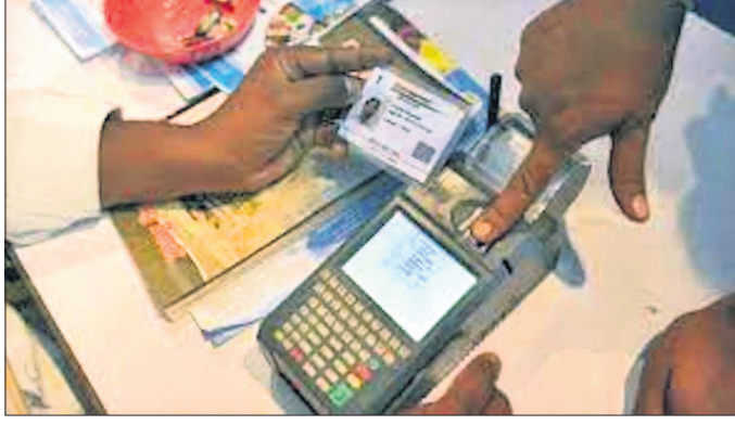
ଇ କେମ୍ପାଇସି କରିବା ବ୍ୟବହାର ହେଉଥିବା ମେଶିନ।

ସରକାରଙ୍କ ଦିନ ଅନୁମତିରେ ଡେରାମାନେ ରାଜ୍ୟ ବାହାରକୁ ମେଶିନ ନେଇ କିଛି ରାଶିନ କାର୍ଡ ଅପଡେଟ୍ କରୁଛନ୍ତି। ଏ କରୁଛନ୍ତି ବୋଲି କିଛିଦିନ ପୂର୍ବରୁ ଯୋଗାଣ ମନୁ କହିଥିଲେ। ମାତ୍ର ଅଧିକାଂଶ ତାହା କାର୍ଯ୍ୟକାରୀ ହୋଇପାରିନାହିଁ। ଏବେ ବି ବହୁ ଡେରା ବାହାର ରାଜ୍ୟରେ ଦଳାଳି କରୁଛନ୍ତି।