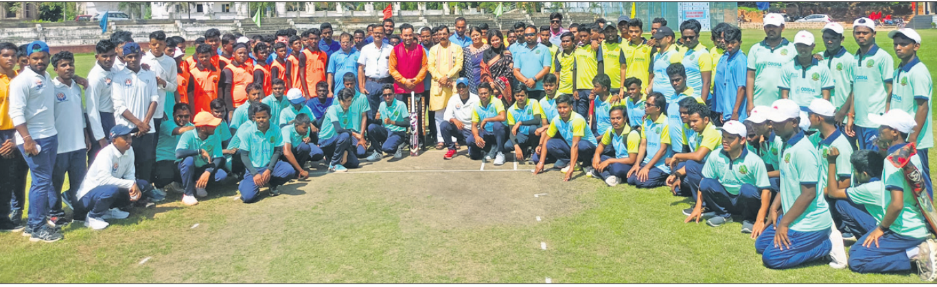
ରାଜ୍ୟସ୍ତରୀୟ ଦୃଷ୍ଟିବାଧୁତ କ୍ରିକେଟ ଟୁର୍ନାମେଣ୍ଟର ଉଦ୍‌ଘାଟନୀ ଅବସରରେ ଅତିଥିଙ୍କ ସହ ଅଂଶଗ୍ରହଣକାରୀ ଦଳର ଖେଳାଳିମାନେ।

ମ୍ୟାଚରେ ଗୋୟନ ହାଇଡ୍ରାବାଦ୍ ଭେଟିଥିଲା। ନିକଟରୁ ୪ ଉଇକେଟରେ ପରାଜୟ ପରେ ୭ମ ମ୍ୟାଚରେ ରୁକ୍ମିଣୀ ଦଳ ଫାଇନାଲରେ ପ୍ରବେଶ କରିଥିଲା। ଦ୍ୱେ-ଅପ୍ ପାଇଁ ଯୋଗ୍ୟତା ଅର୍ଜନ କରିଥିଲା। ପଦ୍ମ ଚେନ୍ନାଇର ଦ୍ୱିତୀୟ ଗ୍ଲାନରେ ଥିବାବେଳେ ସର୍ବନି ସୁପର ଷ୍ଟାର୍ସ ବିପକ୍ଷରେ କାଲିଫୋର୍ନିଆ-୧ରେ ବିଜୟୀ ହୋଇ ଫାଇନାଲରେ ପହଞ୍ଚିଥିଲା। ହାଇଡ୍ରାବାଦକୁ ଭେଟିଥିଲା। ନିକଟରୁ ୪ ଉଇକେଟରେ ପରାଜୟ ପରେ ୭ମ ମ୍ୟାଚରେ ରୁକ୍ମିଣୀ ଦଳ ଫାଇନାଲରେ ପ୍ରବେଶ କରିଥିଲା। ଅନ୍ୟପକ୍ଷରେ ସର୍ବନି ସୁପର ଷ୍ଟାର୍ସ ଲିଗ୍ ପର୍ଯ୍ୟାୟରେ ୭ ମ୍ୟାଚ ଖେଳି ୫ ବିଜୟ ଓ ୨ ପରାଜୟ ସହ ଚେନ୍ନାଇର ଶୀର୍ଷରେ ରହିଥିଲା। କାଲିଫୋର୍ନିଆ-୧ରେ ବିଜୟୀ ହୋଇ ଫାଇନାଲରେ ପହଞ୍ଚିଥିଲା।