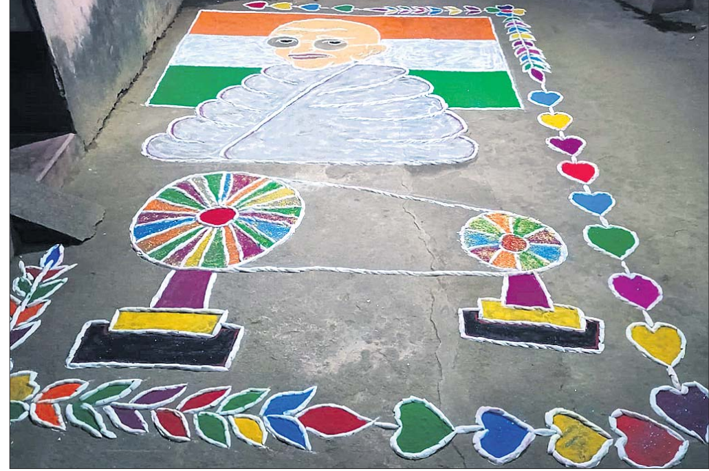
କୁମାର ଉତ୍ସବ ଉପଲକ୍ଷେ ମଙ୍ଗଳବାର ସନ୍ଧ୍ୟାରେ ଯାଜପୁର ଜିଲ୍ଲା ରଘୁନାଥପୁର କୁଳ ସଦାନନ୍ଦପୁର ଗ୍ରାମରେ ଯୁବକଙ୍କ ଦ୍ୱାରା ପ୍ରସ୍ତୁତ କୋଠି ।