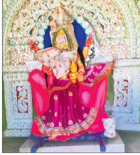
ବଳଭଦ୍ରପୂଜା ପୂଜା ମଣ୍ଡପରେ ମା' ଗଜଲକ୍ଷ୍ମୀଙ୍କ ମୂର୍ତ୍ତି।

ବଡ଼ ସାରଦେଇପୁର, ନହେନ୍ଦ୍ର ଆନନ୍ଦ ବଜାର, ମନ୍ତ୍ରାପଡ଼ା, ଫକୀରାବାସ, ଓଲଡ଼ି, ଛତା, ଲକ୍ଷ୍ମୀନାରାୟଣପୁର, ବଳଭଦ୍ରପୁର ଓ ସାତବାଟିଆ ଗ୍ରାମ ମା'ଙ୍କ ପାଇଁ ଉତ୍ସବମଣ୍ଡପ ହେବ। ସେହିପରି ଚଷାଖଣ୍ଡ, କାଳପୁର, ଠାକୁରହାଟ, ଠାକୁରପାଟଣା, ଉଦୟନଗର, ବାରିପୁର ଓ ରାୟୋଳ