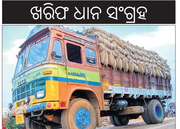
ଏହାକୁଦୃଷ୍ଟିରେ ରଖି ଧାନ କିଣାବେଳେ ରାଜ୍ୟର ସାମାନ୍ୟତା ଜିଲ୍ଲାଗୁଡ଼ିକର ପ୍ରବେଶପଥକୁ ସିଲ୍ କରାଯିବ। ସିସିଟିଭି କ୍ୟାମେରା ମାଧ୍ୟମରେ ସାମାନ୍ୟତା ରାଜ୍ୟ ସହ

କେନ୍ଦ୍ର ସରକାର ୨୦୨୪-୨୫ ଆର୍ଥିକ ବର୍ଷରେ ଖରିଫ ଧାନର କୁଳଖଣ୍ଡା ପିଛା ସର୍ବନିମ୍ନ ସହାୟକ ମୂଲ୍ୟ (ଏମ୍ଏସ୍‌ସି) ୨,୩୦୦ ଟଙ୍କାରେ ଠିକ୍ କରିଛନ୍ତି। ଓଡ଼ିଶା ସରକାର ଏହି ମୂଲ୍ୟଠାରୁ ଅଧିକ ୮୦୦ ଟଙ୍କାରେ ଅର୍ଥାତ୍ ୩,୧୦୦ ଟଙ୍କାରେ ଧାନ କିଣିବା ପଡ଼େଣା ଖାତ୍ତାଖଣ୍ଡ, ପଣ୍ଡିମବଳା ଓ ଛତିଶଗଡ଼ର ଅସାଧୁ ବ୍ୟବସାୟୀ ଏହାର ଫାଇଦା ନେବା ପାଇଁ ଓଡ଼ିଶାରେ ଧାନ ବିକ୍ରି କରିପାରନ୍ତି ବୋଲି ରାଜ୍ୟ ସରକାର ଆଶଙ୍କା କରି ଏହା ଉପରେ ରୋକ୍ ଲଗାଇବାକୁ ଯାଉଛନ୍ତି। ଏହିକ୍ରମେ ମଙ୍ଗଳବାର ମୁଖ୍ୟମନ୍ତ୍ରୀ ମୋହନ ଚରଣ ମାଝୀଙ୍କ ଅଧ୍ୟକ୍ଷତାରେ ଏକ ବୈଠକ ବସିଛି। ଏଥିରେ ବାହାର ରାଜ୍ୟର ଧାନକୁ ରୋକିବା ପାଇଁ ସାମାନ୍ୟତା ଜିଲ୍ଲାଗୁଡ଼ିକର ପ୍ରବେଶପଥକୁ ସିଲ୍ କରିବା ସହ ଏନ୍‌ଫୋର୍ସମେଣ୍ଟ୍ ଏକ୍ସ୍‌ପ୍ରେସ୍ କରାଯିବାକୁ ନିଷ୍ପତ୍ତି ନିଆଯାଇଛି। ଧାନ କିଣା ପ୍ରକ୍ରିୟାରେ ସ୍ୱଚ୍ଛତା ପାଇଁ ମନ୍ତ୍ରୀମାନେ ମଣ୍ଡି ବୁଲି ଚାଷୀଙ୍କ କଥା ବୁଝିବେ।