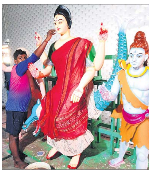
ମା'ଙ୍କ ମୁଖ୍ୟାଳୟ ମୂର୍ତ୍ତିରେ ଶିଳ୍ପୀ ଶେଷ ସର୍ତ୍ତ ଦେଇଛନ୍ତି।

କେନ୍ଦ୍ରାପଡ଼ା ଜିଲାର ଗଣତନ୍ତ୍ର ଚାମା ମା' ଗଜଲକ୍ଷ୍ମୀଙ୍କ ଧରାବତରଣ ରୂପବାର ହେବ। ଏଥିପାଇଁ ସହର ତଥା ଗ୍ରାମାଞ୍ଚଳ ଚଳଚଞ୍ଚଳ ହୋଇଛି। ବିଭିନ୍ନ ପୂଜା କର୍ମଚାରୀ ପ୍ରାୟ ୨୧୧ ଶେଷ ପର୍ଯ୍ୟାୟରେ ପହଞ୍ଚିଛନ୍ତି। ଚଳଚଞ୍ଚଳ ସହର ମଧ୍ୟରେ ୬୮ଟି ମଣ୍ଡପରେ ମା'ଙ୍କ ମୁଖ୍ୟାଳୟ ଓ ଅନ୍ୟ ଦେବଦେବୀଙ୍କ ପୂଜାପାଠ ହେବ। ସେହିପରି ଜିଲାର ୨୧୧ଟି ଗ୍ରାମରେ ମା'ଙ୍କ ପୂଜା ପାଇଁ ଅନୁମତି ମିଳିଛି। ଅଧିକାଂଶ ପଠାପଠରେ ସୁସଜ୍ଜିତ ତୋରଣ ହୋଇଥିବା ବେଳେ ପୂଜାପାଠ ଆଖପାଖ ରାସ୍ତାର ଛକଗୁଡ଼ିକରେ ଆଲୋକମାଳା ଝଲୁଥିଲା। ଜନସମାଗମକୁ ଲକ୍ଷ୍ୟ ରଖି ସହରର ବିଭିନ୍ନ ଗ୍ରାମରେ ଫେସନ ବଜାର, ସ୍ତୁଳ ଆଦି ଲାଗିଲାଣି। ବ୍ୟବସାୟ ଚାଲିଯିବା ସତ୍ତ୍ୱେ ମଧ୍ୟ ପୂଜା ପାଠ ଆରମ୍ଭ ହୋଇଛି। ଚଳଚଞ୍ଚଳ ତୋରଣ ସହିତ ମେଢ଼ି ଯାକସଜ୍ଜାକୁ