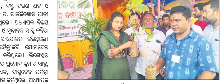
ପଥଚାରୀଙ୍କୁ ଚାରା ବଣ୍ଟନ କରାଯାଇଛି ।

ପ୍ରାଚିପୁର, ୧୫୧୦(ସୁଶାନ୍ତ ବେହେରା): ମଙ୍ଗଳପୁର ବଜାର ମଧ୍ୟରେ ବୁର୍ଲାପୂଜା ଅବସରରେ ମେଡିକାଲ ଛକଠାରେ ହରପାର୍ବତୀ ପୂଜା ଅନୁଷ୍ଠିତ ହେଉଛି । ଚଳିତ ବର୍ଷ ଖୁବ୍ ଜାକଜମକରେ ପାଞ୍ଚ ଦିନ ଧରି ପୂଜା ଅନୁଷ୍ଠିତ ହୋଇଛି । ପରେ କର୍ମିତ ପକ୍ଷରୁ ବୃକ୍ଷ ହିଁ ଜୀବନ ଶୀର୍ଷକ କାର୍ଯ୍ୟକ୍ରମ କରାଯିବ । ସହ ପଥଚାରୀଙ୍କୁ ଚାରାବଣ୍ଟନ କରାଯାଇଛି । ଆୟୋଜିତ ସଭାରେ ମୁଖ୍ୟ ଅତିଥିଭାବେ