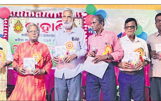
ଅତିଥି ‘ଚାହାଣି’ର ପୂଜା ସଂଖ୍ୟା ଉନ୍ନୋତନ କରୁଛନ୍ତି ।