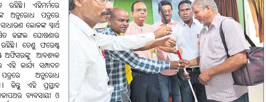
ଦୃଷ୍ଟିବାଧିତଙ୍କୁ ଧଳାବାଡ଼ି ପ୍ରଦାନ କରାଯାଇଛି ।

ଆଇନ ୧୯୮୦ର ବିରୋଧାତରଣ କରି ପଥର ଖାଦାନ କରିବାକୁ କେତେକ ପଥର ବ୍ୟବସାୟୀଙ୍କୁ ଦେଆଇନ ଭାବେ ଲିଙ୍ଗ ପୁତ୍ରରେ ଦେଇଥିଲେ । ପଥର ବେପାରୀମାନେ ଦେଆଇନ ତିନାମାଲଟ ଦ୍ୱାରା ପାହାଡ଼ ଫଟାଇ କ୍ରମେ ଗୁଡ଼ିକୁ ପଥର ଯୋଗାଇଥିଲେ । ଏହାଦ୍ୱାରା ପାହାଡ଼ ଉପରେ ଥିବା ଐତିହାସିକ ବନବାନପୁରଗଡ଼ ଗ୍ରାମ ଓ ପାହାଡ଼ ତଳେ ଥିବା ବହୁ ଗ୍ରାମର ଜଳସ୍ତର ଓ ପରିବେଶ ସଙ୍କଟରେ ଗତି କରୁଥିଲା । ତିନାମାଲଟ ବିଷୟରେ ହେତୁ ୨୦୧୨ରେ ଯାଜପୁର ଜିଲ୍ଲାପାଳ, ପୋଲିସ୍ ଅଧୀକାରୀ, ଆଠଗଡ଼ ଡିଭିଓ ଓ ଧର୍ମଶାଳା ତହସିଲଦାରଙ୍କୁ ନିର୍ଦ୍ଦେଶ ଦେଇଥିଲେ । ଅକ୍ଟୋବର ୧୬ ତାରିଖରେ ଅନୁଯାୟୀ, ଘନାୟ ରାଜ୍ୟ ବିଭାଗ ଦ୍ୱାରା ହୋଇଥିବା ନିର୍ଦ୍ଦେଶ ମଧ୍ୟ ଏଠାରେ