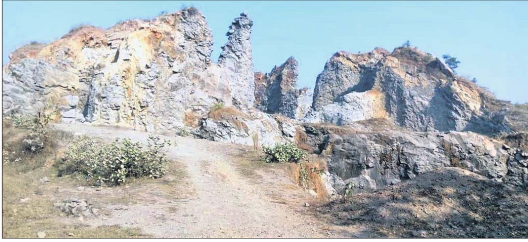
ଜଙ୍ଗଲ ଜମିରେ ଥିବା ପାହାଡ଼କୁ କଳାପଥର ଭାବେ ନିରୀକ୍ଷଣ କରାଯାଇଛି ।

■ ନାଲି ଫିଟା ତଳେ ଜଙ୍ଗଲ ବିଭାଗର ପତ୍ର ■ ମାଉସୁ ମ୍ୟାନେଜର ନିୟୁତ୍ତି ନିର୍ଦ୍ଦେଶ ପ୍ରଦାନ