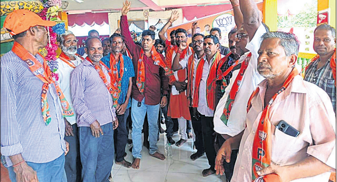
ନେତାଙ୍କ ଗହଣରେ ଭାଇପାରେ ସାମିଲ ହୋଇଥିବା ବିଜେତ, କଂଗ୍ରେସ କର୍ମୀମାନେ।