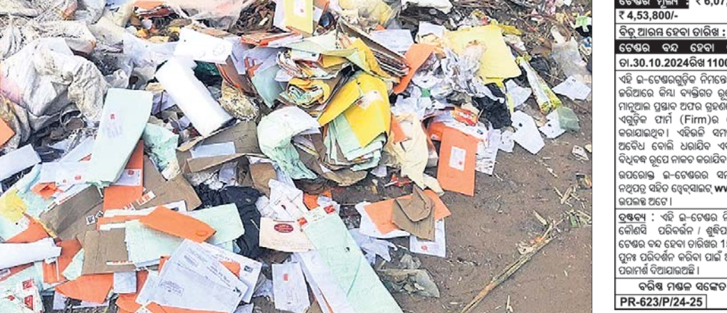
କେନ୍ଦ୍ରାପଡ଼ା, ୧୫୧୦ (କରଳାଥ ଧଳ)

କେନ୍ଦ୍ରାପଡ଼ା ସହରର ଜିଲାପାଳଙ୍କ କାର୍ଯ୍ୟାଳୟ ସମ୍ମୁଖରେ ମୁଖ୍ୟ ଡାକଘର ଅଛି। ଏହି ଡାକଘର ରାସ୍ତା ପାର୍ଶ୍ୱରେ ଶତାଧିକ ଚିଠି ବିପର୍ଯ୍ୟୟ ଭାବେ ପଡ଼ି ରହିଥିବା ମଙ୍ଗଳବାର ଦେଖିବାକୁ ମିଳିଛି। ଏହି ଚିଠିଗୁଡ଼ିକ ସମସ୍ତ ଡାକରେ ଆସିଥିବା ସୁଦ୍ଧା ମିଳୁଛି। ଅଧିକାଂଶ ଚିଠି କେନ୍ଦ୍ରାପଡ଼ା ଡାକ ଅଧିକାରୀଙ୍କ ନାମରେ ଆସିଥିବା ଠିକଣାରେ ଲେଖାଯାଇଛି। କିଏ କାହିଁକି ଏଭଳି ଭାବରେ ଚିଠିଗୁଡ଼ିକ ରାସ୍ତାକଡ଼ରେ ପକାଇ ଦେଇଛି ବୋଲି ଗ୍ଳାନୀୟ ଅଞ୍ଚଳରେ ଚର୍ଚ୍ଚା ଆରମ୍ଭ ହେଇଛି। ଏସମ୍ପର୍କରେ ଡାକ ଅଧିକାରୀଙ୍କ ସହ ଯୋଗାଯୋଗ କରାଯାଇଥିଲେ ମଧ୍ୟ ସମ୍ପର୍କ ହୋଇପାରିନାହିଁ।