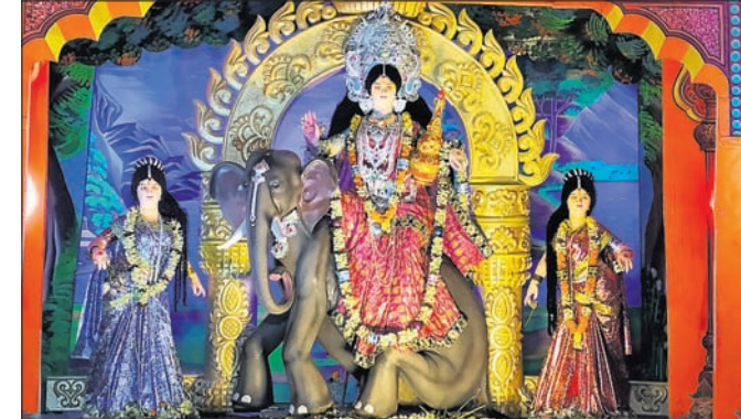
ଭୋଗରାଜ, ୧୭।୧୦(ପ୍ରଦୀପ ଦାସ)

ବାଲେଶ୍ୱର ଜିଲ୍ଲା ଭୋଗରାଜ ବ୍ଲକ୍ରେ ପୂଜା ହେଉଥିବାବେଳେ ବିଭିନ୍ନ ପୂଜାପଣ୍ଡାପୁଣ୍ଡାରେ ଶ୍ରଦ୍ଧାଳୁଙ୍କ ଭିଡ୍ ଜମିଛି । ପୂଜାପଣ୍ଡାପୁଣ୍ଡାରେ ପୂଜ୍ୟ ଆକର୍ଷଣୀୟ ଚୋରଣ ସାଙ୍ଗକୁ ମା'ଙ୍କ ପୂର୍ଣ୍ଣ ଓ ରଙ୍ଗୀନ ଉତ୍ସାହ ମଧ୍ୟରେ ଅନୁଷ୍ଠିତ ହେଉଛି । ଭୋଗରାଜର ୫୦ରୁ ଊର୍ଦ୍ଧ୍ୱ ସ୍ଥାନରେ ପୂଜାପଣ୍ଡାପୁଣ୍ଡାରେ ପୂଜ୍ୟ ଆକର୍ଷଣୀୟ ଚୋରଣ ସାଙ୍ଗକୁ ମା'ଙ୍କ ପୂର୍ଣ୍ଣ ଓ ରଙ୍ଗୀନ ଉତ୍ସାହ ମଧ୍ୟରେ ଅନୁଷ୍ଠିତ ହେଉଛି । ଭୋଗରାଜର ୫୦ରୁ ଊର୍ଦ୍ଧ୍ୱ ସ୍ଥାନରେ ପୂଜାପଣ୍ଡାପୁଣ୍ଡାରେ ପୂଜ୍ୟ ଆକର୍ଷଣୀୟ ଚୋରଣ ସାଙ୍ଗକୁ ମା'ଙ୍କ ପୂର୍ଣ୍ଣ ଓ ରଙ୍ଗୀନ ଉତ୍ସାହ ମଧ୍ୟରେ ଅନୁଷ୍ଠିତ ହେଉଛି । ଭୋଗରାଜର ୫୦ରୁ ଊର୍ଦ୍ଧ୍ୱ ସ୍ଥାନରେ ପୂଜାପଣ୍ଡାପୁଣ୍ଡାରେ ପୂଜ୍ୟ ଆକର୍ଷଣୀୟ ଚୋରଣ ସାଙ୍ଗକୁ ମା'ଙ୍କ ପୂର୍ଣ୍ଣ ଓ ରଙ୍ଗୀନ ଉତ୍ସାହ ମଧ୍ୟରେ ଅନୁଷ୍ଠିତ ହେଉଛି ।