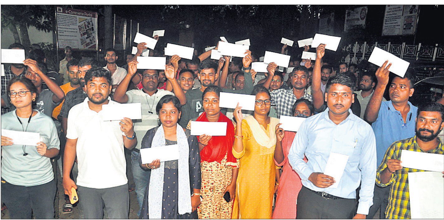
ଆରଥାଇ, ଅମିନ ପରୀକ୍ଷା ବାଟିଲା କରିବାକୁ ରାଷ୍ଟ୍ରପତିଙ୍କ ପାଖକୁ ଚିଠି ପଠାଇବାକୁ ଭୁବନେଶ୍ୱର ପିଏମଜିକୁ ଆସିଥିବା ଛାତ୍ରଛାତ୍ରୀ ଓ ଚାକିରି ଆଶାୟୀମାନେ ।

ଭୁବନେଶ୍ୱର, ୧୭।୧୦ (ଶର୍ମିଷ୍ଠା ପାଣିଗ୍ରାହୀ) ରାଜ୍ୟରେ ଓପିଏସ୍ ସର୍ବସ୍ୱୟ ପକ୍ଷରୁ ନିକଟରେ ଶେଷ ହୋଇଥିବା ଆରଥାଇ, ଏଆରଥାଇ, ଅମିନ ପରୀକ୍ଷାରେ ବ୍ୟାପକ ଅନିୟମିତତା ସହ ନିୟୁକ୍ତି ଦୁର୍ନୀତିକୁ ବିରୋଧକରି ଛାତ୍ରଛାତ୍ରୀ ଓ ଚାକିରି ଆଶାୟୀମାନେ ଆନ୍ଦୋଳନ ଚଳାଇଛନ୍ତି । ପରୀକ୍ଷା ବାଟିଲା ସହ ସମ୍ପୃକ୍ତ ଅଧିକାରୀ ଓ ବ୍ୟକ୍ତିଗଣଙ୍କ ଉପରେ ଦୃଢ଼ କାର୍ଯ୍ୟାନୁଷ୍ଠାନ ଦାବିକରି ଆସୁଥିଲେ ମଧ୍ୟ ସରକାର ଏଯାବତ୍ କୌଣସି ପଦକ୍ଷେପ ଗ୍ରହଣ କରୁ ନ ଥିବାରୁ ଶୁଭେଷ୍ଟ ଏଗ୍ରନେଷ୍ଟ