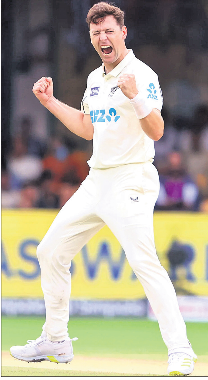
ଉଲ୍ଲେଖନୀୟ ପରେ ଉଲ୍ଲେଖନୀୟ ମ୍ୟାଚ୍ ହେଉଛି।

ବେଙ୍ଗାଳୁରୁ, ୧୭।୧୦(ପି.ଟି.) ଅଲୋଡା ରେକର୍ଡ ନିଜ ନାମରେ କରିଛନ୍ତି। ଦୀର୍ଘ ୨୫ ବର୍ଷ ପରେ ପ୍ରଥମ ଯେ ୫ ଜଣ ବ୍ୟାଟର ଖାତା ଖୋଲିବାରେ ସମର୍ଥ ହୋଇଛନ୍ତି। ଶେଷ ଥର ପାଇଁ ୧୯୯୯ ମୋହାଲି ଟେଷ୍ଟରେ ୫ ଜଣ ଖେଳାଳି ଠରେ ଆଉଟ ହୋଇଥିଲେ। ଉଲ୍ଲେଖଯୋଗ୍ୟ ଯେ ଭାରତ ଏହାର ସର୍ବନିମ୍ନ ଟେଷ୍ଟ ଷ୍ଟୋର ୩୬ ରନ୍ ସର୍ବନିମ୍ନ ଟେଷ୍ଟ ଷ୍ଟୋର ରେକର୍ଡ କରିଛି। ଯେଉଁଠି ମାଟିରେ ଭାରତ ୨୯୩ ଟେଷ୍ଟ ଖେଳି ସାରିଥିବା ବେଳେ ଦଳ ପ୍ରଥମ ଟେଷ୍ଟ ହୋଇଥିବା ବେଳେ ହାତରେ