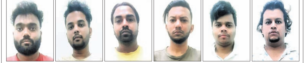
ଗିରଫ ୬ ବଙ୍ଗାୟ ଅଭିଯୁକ୍ତ ।