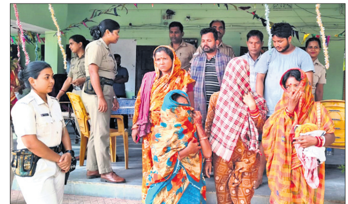
ବାଗପୁର ଥାନାରେ ଗିରଫ ମହିଳା ଓ ପୁରୁଷ ।

ଖୋର୍ଦ୍ଧା ଜିଲ୍ଲା ବାଗପୁର ଥାନା ଅଧୀନ ବାଗପୁର ଗ୍ରାମରେ ବୁଧବାର ଅଭାବନୀୟ ଘଟଣା ଘଟିଛି । ବେଆଇନଭାବେ ମଦ ବିକ୍ରି କରୁଥିବା ବେପାରୀଙ୍କୁ ଧରିବାକୁ ଯାଇଥିବା ପୋଲିସ ଆକ୍ରମଣର ଶିକାର ହୋଇଛି । ଏଥିରେ ଜଣେ ପୋଲିସ କର୍ମଚାରୀ ଗୁରୁତର ଆହତ ହୋଇଛନ୍ତି । ଏହି ଘଟଣାରେ ପୋଲିସ ୬ଜଣଙ୍କୁ ଗିରଫ କରି ଗୁରୁବାର କୋର୍ଟଚାଲାଣ କରିଛି । ଅନ୍ୟପକ୍ଷେ ଏହି ଘଟଣାରେ ଫୋରାର ଥିବା ମଦ ବେପାରୀଙ୍କ ସମେତ ଅନ୍ୟମାନଙ୍କୁ ଖୁବଶୀଘ୍ର ଗିରଫ କରାଯିବ ବୋଲି ଥାନା ଅଧିକାରୀ ରମେଶ କୁମାର ଦେବତା କହିଛନ୍ତି । ସୂଚନା ମୁତାବକ, ବାଗପୁର ଗ୍ରାମରେ ବେଆଇନଭାବେ ମଦ ବିକ୍ରି ହେଉଥିବା ନେଇ ଅଭିଯୋଗ