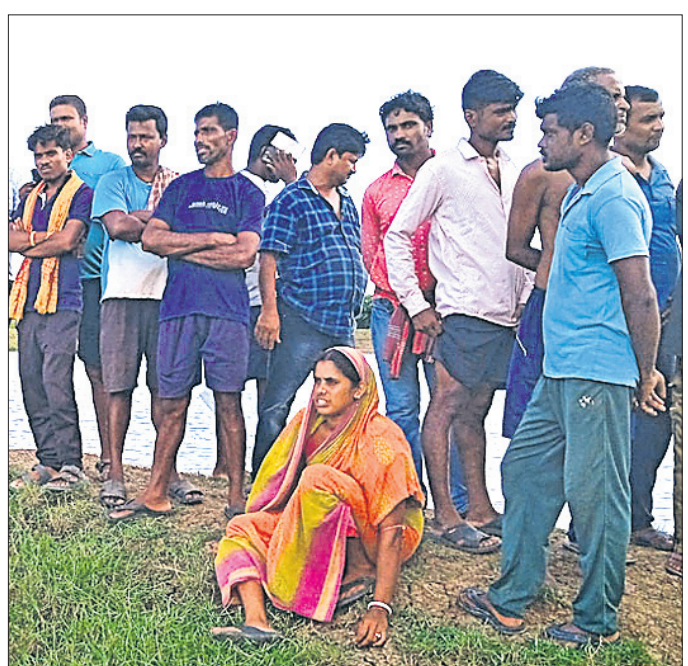
କ୍ରାଇମ୍ ସିନ୍ ଡିକ୍ରିଏସନ ସ୍ଥାନରେ ଉପସ୍ଥିତ ସ୍ଥାନୀୟ ଲୋକେ ।