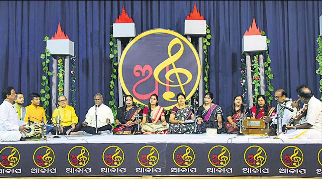
ଭୁବନେଶ୍ୱର, ୧୭।୧୦(ଶର୍ମିଷ୍ଠା ପାଣିଗ୍ରାହୀ)

ଆଲଗଣିଆ, ବରପୁର, ଜଗନ୍ନାଥ ବିହାର, ରେଷ୍ଟାଳ କଲୋନୀ, ସିଆରପିଏସ୍ ଅଞ୍ଚଳ, ଏକମ୍ ଲିଲା, ବରପୁରୀ ବସଷ୍ଟାଣ୍ଡ ଅଞ୍ଚଳ, ତପୋବନ, ଏସ୍‌ନଗର, ଏସ୍ ହସିନୋଡା, ପୋଖରୀପୁର ଅଞ୍ଚଳର ଯତ୍ନପୁର, ହୁମୁରୁମା ଗାଁ, ହୁମୁରୁମା ହାଉସି ବୋର୍ଡ କଲୋନୀ, ଜାଗମରା, ଜଗମୋହନ ନଗର, ଧର୍ମ ବିହାର, ଗଣପୁରୀ, ଭକ୍ତ ମଧୁ ନଗର, ଅନନ୍ତ ବିହାର, ଲିଜାପାଳ ବିହାର, କାରଗିଲ ବସ୍ତି, କପିଳ ପ୍ରସାଦ ଗାଁ, କପିଳ ପ୍ରସାଦ ବିତ୍ତ-କଲୋନୀ, ସୁନ୍ଦରପଦା, ବରପୁରୀ ଗାଁ, କ୍ରୀଷ୍ଣା ଗାଡ଼େନ, ମଲିକ କଟକ୍ସ, ସିକି ବିହାର, ସୌଭାଗ୍ୟ ନଗର ଓ ଶତାଧିକ ନଗର। ସେହିପରି ହାଇଲେଭଲ ଟ୍ୟାକ୍ ଅନ୍ତର୍ଗତ ଏରୋଡ୍ରମ ଏରିଆ, ଭିମପୁର, ପଲାସପଲ୍ଲୀ, ଫରେଷ୍ଟପାର୍କ, ଶିରିପୁର, ଗଜନଗର, ସୁନି-୧ରୁ ସୁନି-୮(ଆଂଶିକ), ନୟାପଲ୍ଲୀ ଅଞ୍ଚଳର ଆଇଆରସି ଭିଲେଜ ଏନ୍-୧ରୁ ଏନ୍-୬, ନୟାପଲ୍ଲୀ ଗାଁ, କାବେରୀ ବସ୍ତି, ଗଡ଼ସାହି ବସ୍ତି, ନାକଗଣ ନଗର, ବାଲିପଦା ସାହି, ଆନନ୍ଦ ବିହାର, ସାତାପୁର ବସ୍ତି, ଶାସ୍ତ୍ରୀ ନଗର ଏବଂ ଚନ୍ଦ୍ରଶେଖରପୁର ଅଞ୍ଚଳର ନାକାପ୍ରତିବିହାର, ସାଲିଆ ସାହି ଓ ମୈତ୍ରୀ ବିହାର ଅଞ୍ଚଳରେ ୨୪ଘଣ୍ଟା ପାଇଁ ଯମ୍ୟତ ପାନୀୟ ଜଳ ଯୋଗାଣ ବନ୍ଦ ରହିବ ବୋଲି ଓଡ଼ିଶା ମହାପ୍ରବନ୍ଧକ-୧ ସୂଚନା ଦେଇଛନ୍ତି।