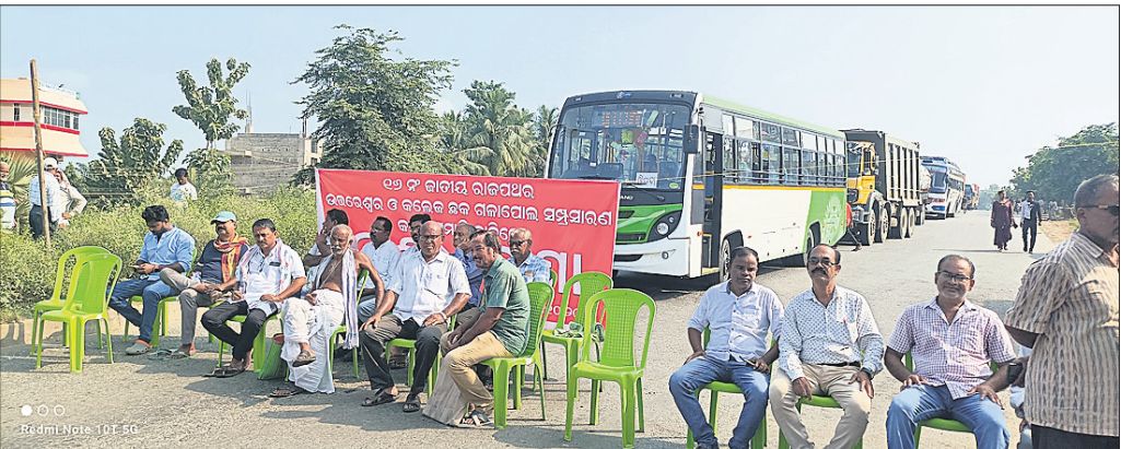
ସୋର ନାଗରିକ ମଞ୍ଚ ପକ୍ଷରୁ ଜାତୀୟ ରାଜପଥ ଅବରୋଧ କରାଯାଇଛି ।

ସୋର, ୧୭।୧୦(କେନ୍ଦ୍ରକନ୍ଦ ମିଶ୍ର) ବାଲେଶ୍ୱର ଜିଲ୍ଲା ସୋର ବ୍ଲକ୍ ଉତ୍ତରଶ୍ୱର ଓ ସୋର କଲେଜ ଛକଠାରେ ଥିବା ସଂକୀର୍ଣ୍ଣ ଗଲାପୋଲ ସମ୍ପ୍ରଦାୟର ପାଇଁ ଦାବିରେ ପୂର୍ବ ନିଷ୍ପତ୍ତି ଅନୁସାରେ ଚୁରଦାର ସୋର ନାଗରିକ ମଞ୍ଚ ପକ୍ଷରୁ ୧୬ ନମ୍ବର ଜାତୀୟ ରାଜପଥ ଉତ୍ତରଶ୍ୱରଠାରେ ଜାତୀୟ ରାଜପଥ ଅବରୋଧ କରାଯାଇଛି । ଦାବିଦିନ ଧରି ସୋରବାସୀଙ୍କ ପକ୍ଷରୁ ଏହି ଦାବି ହୋଇଆସୁଥିଲେ ମଧ୍ୟ ଠିକା କମ୍ପାନୀ ଓ ପ୍ରଶାସନିକ ଅଧିକାରୀଙ୍କ ଉଦାସୀନତା କିମ୍ବା ସହିତ ଆସବା ୧ମାସ ମଧ୍ୟରେ