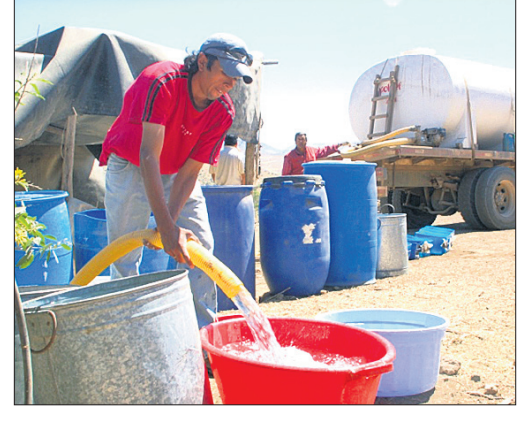
କୃଷିକରମାନେ ଜଳ ବଜାରରେ ପ୍ରାଧାନ୍ୟ ବିସ୍ତାର କରୁଛନ୍ତି ।

କରିପାରିଛି । କାଲିଫର୍ଣିଆର ସେଣ୍ଟ୍ରାଲ ଭ୍ୟାଲି ମଧ୍ୟ କୃଷିଭିତ୍ତିକ ଜଳ ବ୍ୟବସାୟକୁ ଅନୁମତି ଦିଏ । ଏହାଦ୍ୱାରା କୃଷକମାନେ ଜଳ ସମ୍ବଳ ସମୃଦ୍ଧ ଅଞ୍ଚଳକୁ ଜଳ କ୍ରୟ କରି ମରୁଡ଼ି ପରିସ୍ଥିତିର ମୁକାବିଲା କରୁଛନ୍ତି । କିନ୍ତୁ ତିଳିରେ ଜଳ ବଜାରର ଦୁର୍ଲଭତା ସାମାନ୍ୟ ଆସିଛି । ତିଳିରେ ଏହା ଅଧିକ ଅସମାନତା ସୃଷ୍ଟିକରିଛି । ବୃହତ୍ କୃଷି ବ୍ୟବସାୟୀମାନେ ଜଳକୁ ବ୍ୟବହାର କରିବାର ଅଧିକ ଅଧିକାର ପାଇଥିବାବେଳେ କ୍ଷୁଦ୍ରଚାଷୀ ଏବଂ ବୃଦ୍ଧିତ ସମୁଦାୟକୁ କମ୍ ସୁବିଧା ଦିଆଯାଇଛି । ଧନୀ ବ୍ୟବସାୟୀମାନେ ଜଳ ବଜାରରେ ପ୍ରାଧାନ୍ୟ ବିସ୍ତାର