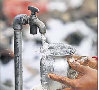
ଭୁବନେଶ୍ୱର, ୧୭।୧୦(ବନ୍ଦନା ସେଠା)

ଆଲଗଣିଆ, ବରପୁର, ଜଗନ୍ନାଥ ବିହାର, ରେଷ୍ଟାଳ କଲୋନୀ, ସିଆରପିଏସ୍ ଅଞ୍ଚଳ, ଏକମ୍ ଲିଲା, ବରପୁରୀ ବସଷ୍ଟାଣ୍ଡ ଅଞ୍ଚଳ, ତପୋବନ, ଏସ୍‌ନଗର, ଏସ୍ ହସିନୋଡା, ପୋଖରୀପୁର ଅଞ୍ଚଳର ଯତ୍ନପୁର, ହୁମୁରୁମା ଗାଁ, ହୁମୁରୁମା ହାଉସି ବୋର୍ଡ କଲୋନୀ, ଜାଗମରା, ଜଗମୋହନ ନଗର, ଧର୍ମ ବିହାର, ଗଣପୁରୀ, ଭକ୍ତ ମଧୁ ନଗର, ଅନନ୍ତ ବିହାର, ଲିଜାପାଳ ବିହାର, କାରଗିଲ ବସ୍ତି, କପିଳ ପ୍ରସାଦ ଗାଁ, କପିଳ ପ୍ରସାଦ ବିତ୍ତ-କଲୋନୀ, ସୁନ୍ଦରପଦା, ବରପୁରୀ ଗାଁ, କ୍ରୀଷ୍ଣା ଗାଡ଼େନ, ମଲିକ କଟକ୍ସ, ସିକି ବିହାର, ସୌଭାଗ୍ୟ ନଗର ଓ ଶତାଧିକ ନଗର। ସେହିପରି ହାଇଲେଭଲ ଟ୍ୟାକ୍ ଅନ୍ତର୍ଗତ ଏରୋଡ୍ରମ ଏରିଆ, ଭିମପୁର, ପଲାସପଲ୍ଲୀ, ଫରେଷ୍ଟପାର୍କ, ଶିରିପୁର, ଗଜନଗର, ସୁନି-୧ରୁ ସୁନି-୮(ଆଂଶିକ), ନୟାପଲ୍ଲୀ ଅଞ୍ଚଳର ଆଇଆରସି ଭିଲେଜ ଏନ୍-୧ରୁ ଏନ୍-୬, ନୟାପଲ୍ଲୀ ଗାଁ, କାବେରୀ ବସ୍ତି, ଗଡ଼ସାହି ବସ୍ତି, ନାକଗଣ ନଗର, ବାଲିପଦା ସାହି, ଆନନ୍ଦ ବିହାର, ସାତାପୁର ବସ୍ତି, ଶାସ୍ତ୍ରୀ ନଗର ଏବଂ ଚନ୍ଦ୍ରଶେଖରପୁର ଅଞ୍ଚଳର ନାକାପ୍ରତିବିହାର, ସାଲିଆ ସାହି ଓ ମୈତ୍ରୀ ବିହାର ଅଞ୍ଚଳରେ ୨୪ଘଣ୍ଟା ପାଇଁ ଯମ୍ୟତ ପାନୀୟ ଜଳ ଯୋଗାଣ ବନ୍ଦ ରହିବ ବୋଲି ଓଡ଼ିଶା ମହାପ୍ରବନ୍ଧକ-୧ ସୂଚନା ଦେଇଛନ୍ତି।