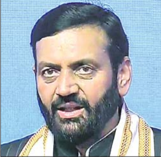
ନାଏବ ସିଂ ସାଇନି

ହରିୟାଣା ବିଧାନସଭା ନିର୍ବାଚନରେ ଭାଜପା ସଂଖ୍ୟାଗରିଷ୍ଠତା ହାସଲ କରିବା ପରେ ନାଏବ ସିଂ ସାଇନି ରୁରୁବାର ପୁଷ୍ୟମନ୍ତ୍ରୀ ଭାବେ ଶପଥ ଗ୍ରହଣ କରିଛନ୍ତି। ଏଥିପାଇଁ ପଞ୍ଚଜ୍ଞାନରେ ଆୟୋଜିତ ଭବ୍ୟ ଉତ୍ସବରେ ପ୍ରଧାନମନ୍ତ୍ରୀ ନରେନ୍ଦ୍ର ମୋଦି, କେନ୍ଦ୍ରମନ୍ତ୍ରୀ ଅମିତ୍ ଶାହା, ରାଜନାଥ ସିଂ, ନୀତିନ୍ ଗଡ଼କରୀ, ଭାଜପା ରାଷ୍ଟ୍ରୀୟ ଅଧ୍ୟକ୍ଷ ଜେ.ପି. ନନ୍ଦାଙ୍କ ସମେତ ବହୁସଂଖ୍ୟାରେ ଏନ୍‌ଡିଏ ନେତା ଏବଂ ଭାଜପାଶାସିତ ରାଜ୍ୟର ପୁଷ୍ୟମନ୍ତ୍ରୀମାନେ ଯୋଗ ଦେଇଥିଲେ। ସମାଜବାଦୀ, ବୁଦ୍ଧାସନ ଏବଂ ଗରିବଙ୍କ କଲ୍ୟାଣ ତାଙ୍କ ସରକାରଙ୍କ କାର୍ଯ୍ୟସୂଚୀ ଶୀର୍ଷରେ ରହିବ ବୋଲି ଶପଥ ନେବା ପରେ ସାଇନି କହିଛନ୍ତି। ଭାଜପାକୁ ବହୁମତ ଦେଇଥିବାରୁ ସେ ଜନସାଧାରଣଙ୍କୁ ଅଭିନନ୍ଦନ ଜଣାଇଛନ୍ତି। ଏଥିପ୍ରତି ପ୍ରଧାନମନ୍ତ୍ରୀ ମୋଦିଙ୍କୁ ତାଙ୍କର ପ୍ରେରଣାଦାୟୀ ନେତୃତ୍ୱ ପାଇଁ ସାଇନି ଧନ୍ୟବାଦ ଜଣାଇଛନ୍ତି। କ୍ରମାଗତ ତୃତୀୟ ଥର ପାଇଁ ଭାଜପା ପୂର୍ଣ୍ଣ ସଂଖ୍ୟାଗରିଷ୍ଠତା ହାସଲ କରିଥିବାରୁ ପୁଣ୍ୟ ସଂଖ୍ୟାଗରିଷ୍ଠତା କଲ୍ୟାଣ ଲାଗି ତାଙ୍କ ସରକାର ପୂରା ଦମ୍ଭରେ ଆସ୍ତ୍ର ଛତିଶଗଡ଼, ପୃଷ୍ଠା-୨