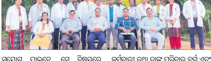
ସୁଯୋଗ ପାଇବେ, ସେ ବିଷୟରେ କର୍ମଚାରୀ ତଥା ତାଙ୍କ ପରିବାର ବର୍ଗ ଏବଂ ଆଲୋଚନା କରିଥିଲେ। ଏହାପ୍ରାୟ ଅବସରପ୍ରାପ୍ତ କର୍ମଚାରୀ ମଧ୍ୟ ଆୟୁର୍ବେଦ ଚିକିତ୍ସାର ପୁରୁଣା ସୁଯୋଗ ପାଇପାରିବେ।

କେନ୍ଦ୍ର ସରକାରଙ୍କ ସ୍ୱାସ୍ଥ୍ୟ ମନ୍ତ୍ରାଳୟର ଏକ ପ୍ରତିନିଧି ଦଳ ଗୁରୁବାର ଶ୍ରୀଶ୍ରୀ ଆୟୁର୍ବେଦ ଚିକିତ୍ସାଳୟ ପରିଦର୍ଶନ କରିଛନ୍ତି।