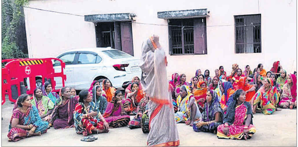
ଗଙ୍ଗା ଥାନା ସମ୍ମୁଖରେ ଗୁରୁବାର ମହିଳାମାନେ ଧାରଣାରେ ବସିଛନ୍ତି।