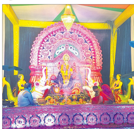
ଲକ୍ଷ୍ମୀ ମାର୍କେଟ ବ୍ୟବସାୟୀ ସଂଘ।