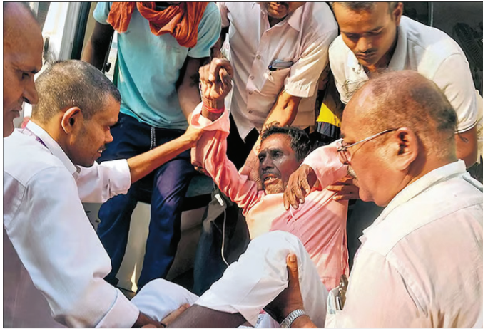
ମଦ ପିଇ ଗୁରୁତର ଜଣେ ବ୍ୟକ୍ତିଙ୍କୁ ହସ୍ପିଟାଲ ନିଆଯାଇଛି।

୧୨ ଗିରଫ ପାଟନା, ୧୭୧୦(ପି.ଟି.) ୨୦୧୬ରୁ ମଦକୁ ସମ୍ପୂର୍ଣ୍ଣ ନିଷେଧ କରାଯାଇଥିବା ବିହାରରେ ମଦପୁରୁଣା ରାଜ୍ୟର ସିଂହାସ ଏବଂ ସରନ୍ ଜିଲ୍ଲାରେ ବିଷାକ୍ତ ମଦ ପିଇ ୩ ଦିନରେ ଅନୁମାନ ୨୬ ଜଣ ପ୍ରାଣ ହରାଇଲେଣି। ସିଂହାସରେ ବିଷାକ୍ତ ମଦ ୨୦ ଜାତୀୟ ନେଇଥିବାବେଳେ ସରନ୍ରେ ୬ ଜଣଙ୍କ ମୃତ୍ୟୁ ଘଟିଥିବା ପୋଲିସ ଡିଏ ଆଲୋକ କହି କହିଛନ୍ତି। ହସ୍ପିଟାଲରେ ୨୦ରୁ ଉର୍ଦ୍ଧ୍ୱ ମୃତ୍ୟୁ ସହ ସଂଘର୍ଷ କରୁଥିବା ବେଳେ ବିଷାକ୍ତ ମଦ ପାର୍ଶ୍ୱ ପ୍ରତିକ୍ରିୟା ଯୋଗୁଁ କେତେକ ଦୃଷ୍ଟିଶକ୍ତି ହରାଇପାରନ୍ତି ବୋଲି କୁହାଯାଇଛି। ଦୃଷ୍ଟି ମଦ ବିକ୍ରି କରିବା ଅଭିଯୋଗରେ ୧୨ ଜଣଙ୍କୁ ଗିରଫ କରାଯାଇଛି। କଠୋର ଆଇନ ଅନୁଯାୟୀ ସେମାନଙ୍କ ବିଚାର ହେବା ସହ ଦଣ୍ଡିତ କରାଯିବ। ମଦପୁରୁଣା ଘଟଣାର ତଦନ୍ତ ପାଇଁ ଦୁଇଟି ସ୍ୱତନ୍ତ୍ର ତଦନ୍ତକାରୀ ଟିମ୍ ଗଠନ କରାଯାଇଛି। ଗୋଟିଏ ଘ୍ନାନାୟ, ପୋଲିସକୁ ନେଇ