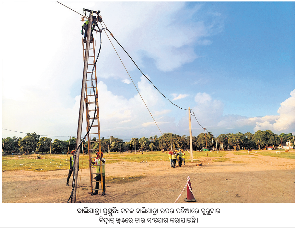
ବାଲିଯାତ୍ରା ପ୍ରସ୍ତୁତି: କଟକ ବାଲିଯାତ୍ରା ଉପରେ ପଡ଼ିଆରେ ଗୁରୁବାର ବିଦ୍ୟୁତ୍ ଖୁଣ୍ଟରେ ତାର ସଂଯୋଗ କରାଯାଇଛି।