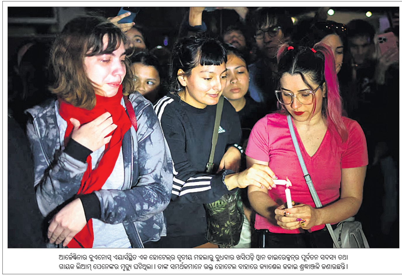
ଆର୍ଶେନିନାର ବୁଧନୋୟ ସ୍ତମ୍ଭାସ୍ଥିତ ଏକ ହୋଟେଲରୁ ତୃତୀୟ ମହଲାକୁ ରୁଧିବାର ଖସିପଡ଼ି ଥିବା ଡାକ୍ତରଙ୍କୁ ପୂର୍ବତନ ସଦସ୍ୟ ତଥା ଗାୟକ ଲିଆମ୍ ପେନେକର ମୃତ୍ୟୁ ଘଟିଥିଲା। ତାଙ୍କ ସମର୍ଥକମାନେ ଉଚ୍ଚ ହୋଟେଲ ବାହାରେ କ୍ୟାଣ୍ଡେଲ ଜଳାଇ ଶ୍ରଦ୍ଧାଞ୍ଜଳି ଜଣାଉଛନ୍ତି।