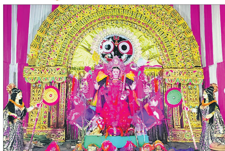
ଖୋର୍ଦ୍ଧାର ପୁନିସିପାଳିଟି କଣ୍ଠେଶ୍ୱରୀ ନୂଆ ବସଷ୍ଟାଣ୍ଡ ବ୍ୟବସାୟୀ ସଂଘ।