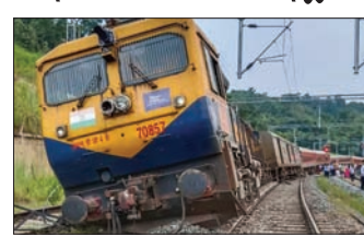
ମଧ୍ୟ କେହି ମୃତ୍ୟୁ ହୋଇ ନ ଥିବା ଉତ୍ତରପୂର୍ବ ପ୍ରଶ୍ନରେ ରେଳଠେଁ କୋନ୍‌ ସିପିଆର୍‌ଓ କହିଛନ୍ତି। ଘଟଣାସ୍ଥଳକୁ ଦୂର୍ଗତଗଣା ରିଲିଫ୍ ଟ୍ରେନ୍ ପଠାଯାଇଛି।

ନୂଆଦିଲ୍ଲୀ, ୧୭୧୦ ଅଗରତାଲାରୁ ମୁମ୍ବାଇ ଯାଉଥିବା ଲୋକମାନଙ୍କୁ ଡିଲକ ଏକ୍ସପ୍ରେସ୍ ଟ୍ରେନ୍‌ର ଟ୍ରାକ୍ ଲାଇନ୍‌ରୁ ହଟାଇ ଦିଆଯାଇଛି। ଗୁରୁବାର ଅପରାହ୍ନ ୩ଟା ୫୫ ମିନିଟ୍ ସମୟରେ ଆସାମର ଡିବାଲୋଇ ଷ୍ଟେସନରେ ଏହି ଟ୍ରେନ୍‌ଟି ଘଟଣା ଘଟିଛି। ରେଳ ଇଞ୍ଜିନ୍ ଓ ପାଞ୍ଚୋଟି କାର୍ ସମେତ ଟ୍ରାକ୍ ଲାଇନ୍‌ରୁ ହଟାଇ ଦିଆଯାଇଛି।