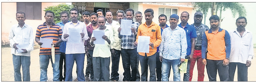
ଭୂସାଗର ଜମିକୁ ନେଇ ତହସିଲଦାରଙ୍କୁ ଦଳିତ ପରିବାରର ଦାବିପତ୍ର

ଭୂସାଗର ଜମିକୁ ନେଇ ତହସିଲଦାରଙ୍କୁ ଦଳିତ ପରିବାରର ଦାବିପତ୍ର ଦେଖାଇବା ପାଇଁ ଦଳିତ ପରିବାରର ଜମିକୁ ଦଖଲ କରାଯାଇଛି। ତହସିଲଦାରଙ୍କୁ ଦାବିପତ୍ର ଦେବାକୁ ଯୋଜନା କରାଯାଉଥିବା ଅଭିଯୋଗରେ ଦଳିତ ପରିବାର ପକ୍ଷରୁ ଗୁରୁବାର ଭୁବନେଶ୍ୱର ତହସିଲଦାରଙ୍କୁ ଦାବିପତ୍ର ପ୍ରଦାନ କରାଯାଇଛି।