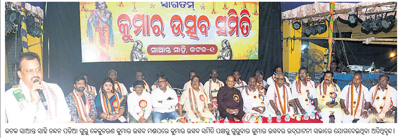
କଟକ ସାଥାନ୍ତ ସାହି ଚନ୍ଦନ ପଡ଼ିଆ ଗୁରୁ କେଳୁଚରଣ କୁମାର ଉତ୍ସବ ମଞ୍ଚପରେ କୁମାର ଉତ୍ସବ ସମିତି ପକ୍ଷରୁ ଗୁରୁବାର କୁମାର ଉତ୍ସବ ଉଦ୍‌ଘାଟନା ସଭାରେ ଯୋଗଦେଇଥିବା ଅତିଥିବୃନ୍ଦ।