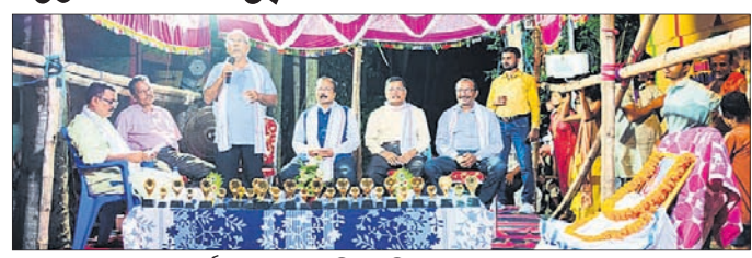
କାର୍ଯ୍ୟକ୍ରମରେ ଉପସ୍ଥିତ ଅତିଥି ଏବଂ ଅନ୍ୟମାନେ।