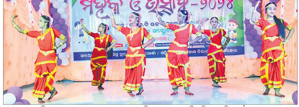
ଶିଶୁ ମହୋତ୍ସବ ମହକ ଉଦ୍‌ଘାଟନା ଅବସରରେ ପିଲାମାନଙ୍କ ଦ୍ୱାରା ପରିବେଷିତ ସାଂସ୍କୃତିକ କାର୍ଯ୍ୟକ୍ରମ।