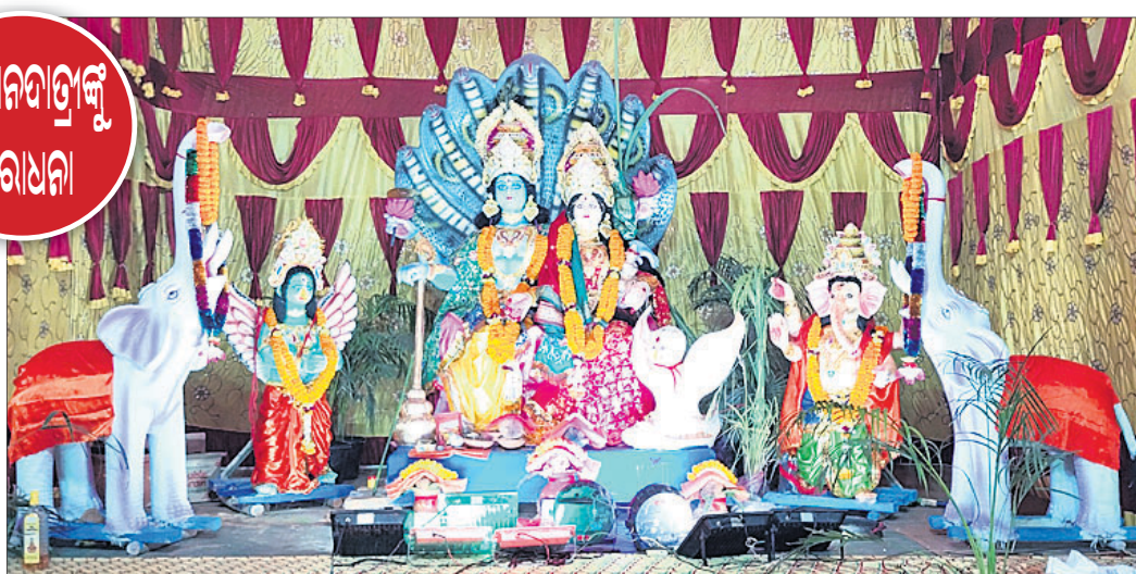
ପଦ୍ମାଳୟା ବ୍ୟବସାୟୀ ସଂଘ, କୋଟି ଛକ।