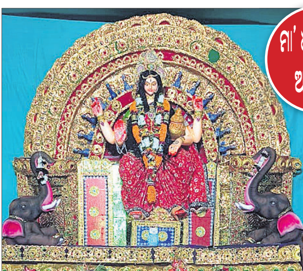
ଗାଙ୍ଗା ଗ୍ରାମ ଗୋବିନ୍ଦପୁର ସାହି।