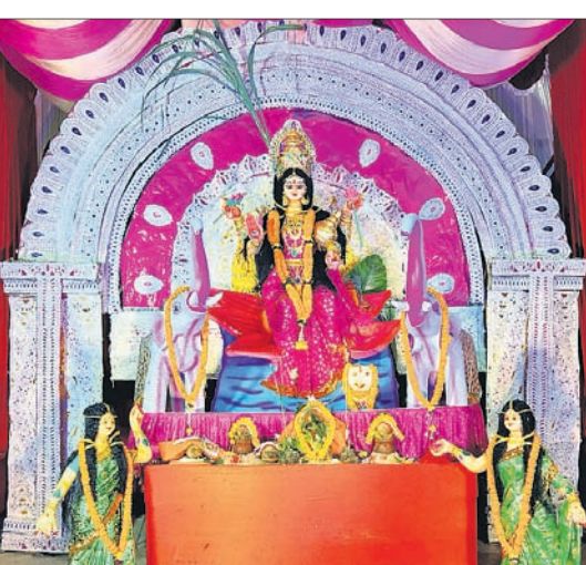
ଗାଙ୍ଗା ମାର୍କେଟ ଗଜଲକ୍ଷ୍ମୀ ପୂଜା କମିଟି, ଷ୍ଟେଟ୍ ବ୍ୟାଙ୍କ ଛକ।