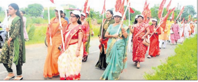
ଝଣା ଶୋଭାଯାତ୍ରାରେ ସାମିଲ ହୋଇଥିବା ମହିଳା ।

ଆଠଗଡ଼, ୧୭୧୦ (ସତ୍ୟ ପ୍ରସାଦ ରଥ) କୁମାର ପୂର୍ଣ୍ଣିମା ଉପଲକ୍ଷେ ସାଲୀୟର ବାବା ସେବା ସମିତି ପକ୍ଷରୁ ଗୁରୁବାର ଏକ ଭବ୍ୟ ଝଣା ଶୋଭାଯାତ୍ରା ଅନୁଷ୍ଠିତ ହୋଇଯାଇଛି । ଏହି ଅବସରରେ ଆଠଗଡ଼ରେ ସାଲୀୟ ବାଲୀଜୀ ଦରବାରରେ ଭକ୍ତମାନେ ନିଶାନ ପଦଯାତ୍ରାରେ ବିଭିନ୍ନ ବାଦ୍ୟଯନ୍ତ୍ର ସହ ସ୍ଥାନୀୟ ଝଣା ମନ୍ଦିରକୁ ଏହି ଶୋଭାଯାତ୍ରା ବାହାର କରିଥିଲେ ।