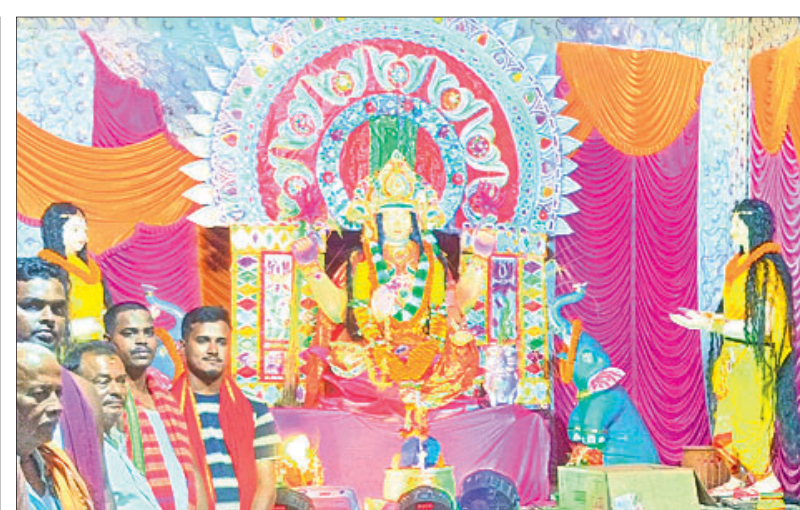
ଏକତାଳିଆ ଗଜଲକ୍ଷ୍ମୀ ପୂଜା କମିଟି।