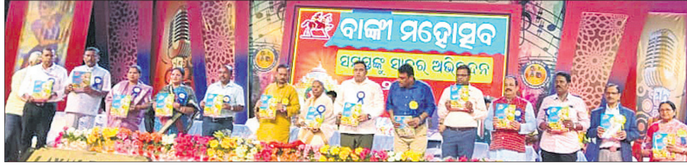
ବାଙ୍କୀ ମହୋତ୍ସବରେ ଅତିଥିମାନେ ସ୍ମରଣକା ପୁସ୍ତକ ଉଦ୍‌ଘାଟନ କରୁଛନ୍ତି ।

ବାଙ୍କୀର ଐତିହ୍ୟ ଓ ଇତିହାସ ଅନନ୍ୟ । ସ୍ୱାଧୀନତା ପ୍ରାପ୍ତି ପରେ ଆନ୍ଦୋଳନଯାଏଁ ବାଙ୍କୀର ଅବଦାନ ଓଡ଼ିଶାରେ ଉଦ୍‌ଘାଟନା ସୃଷ୍ଟି କରିଛି ।