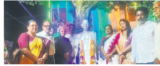
ପ୍ରତିମୂର୍ତ୍ତି ନିକଟରେ ଉପସ୍ଥିତ ଅତିଥିବୃନ୍ଦ।