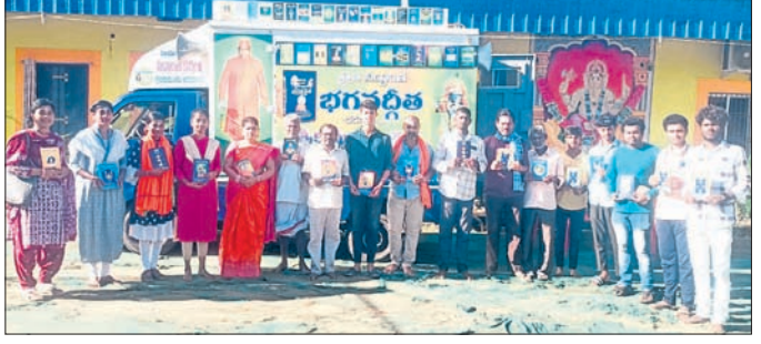
ଭଗବତ୍ ଗୀତା ପ୍ରଚାର କରାଯାଉଛି ।

ରାୟଗଡ଼ା ଜିଲ୍ଲାର ୨ ଶହରୁ ଉର୍ଦ୍ଧ ଡ୍ରେସିଂଗାଜ୍ ପ୍ରଦାନ ସେବା ସମିତି, ଇନ୍ଦ୍ରଜ୍ୟାନ ବେଦିକ କମିଟି, ତଳାସାପୁରୀ, ଖୁରଦା, ସତ୍ୟବାମ, ବୋବାମ, ଆନନ୍ଦଶ୍ରମ ସଦସ୍ୟମାନେ ସାମିଲ ହୋଇଥିଲେ । ଏହି ଅବସରରେ ଭଗବାନ ଶ୍ରୀକୃଷ୍ଣଙ୍କ ଦୀନ ଧରି ଡ୍ରେସିଂଗାଜ୍ ଭଗବତ୍ ଗୀତା ପ୍ରଚାର କରାଯାଇଥିଲା । ଏଥିରେ କଳାହାଣ୍ଡି ଜିଲ୍ଲାର ବିଭିନ୍ନ ସ୍ଥାନରେ ଗତ ଡି ନ ଧରି ଡ୍ରେସିଂଗାଜ୍ ଭଗବତ୍ ଗୀତା ପ୍ରଚାର କରାଯାଇଥିଲା । ଏଥିରେ କଳାହାଣ୍ଡି ଜିଲ୍ଲାର ବିଭିନ୍ନ ସ୍ଥାନରେ ଗତ ଡି ନ ଧରି ଡ୍ରେସିଂଗାଜ୍ ଭଗବତ୍ ଗୀତା ପ୍ରଚାର କରାଯାଇଥିଲା । ଏଥିରେ କଳାହାଣ୍ଡି ଜିଲ୍ଲାର ବିଭିନ୍ନ ସ୍ଥାନରେ ଗତ ଡି ନ ଧରି ଡ୍ରେସିଂଗାଜ୍ ଭଗବତ୍ ଗୀତା ପ୍ରଚାର କରାଯାଇଥିଲା ।