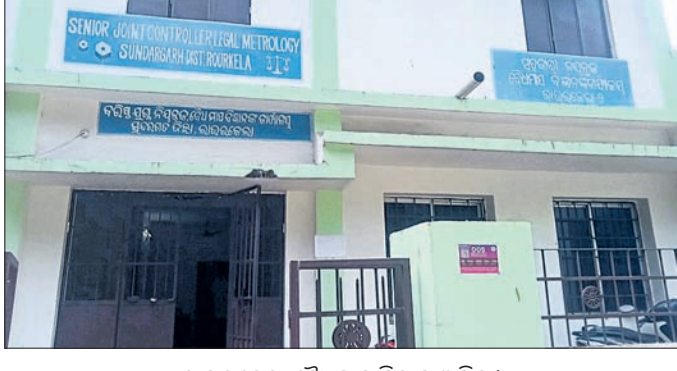
ରାଉରକେଲା ବୈଧମାପ ବିଭାଗ ଅଫିସ୍

ରାଉରକେଲା ବୈଧମାପ ବିଜ୍ଞାନ ପୁଖ୍ୟ କାର୍ଯ୍ୟାଳୟରେ କର୍ମଚାରୀଙ୍କ ଅଭାବ ଦେଖାଦେଇଛି। ବର୍ଷ ବର୍ଷ ଧରି ଖାଲି ପଦବୀ ପୂରଣ କରାଯାଉନାହିଁ। ଫଳରେ ବିଭାଗୀୟ କାର୍ଯ୍ୟ ସମ୍ପାଦନରେ ନାନା ସମସ୍ୟା ସୃଷ୍ଟି ହେଉଛି। ରାଉରକେଲା ବୈଧମାପ ବିଜ୍ଞାନ ବିଭାଗ ପୁଖ୍ୟ କାର୍ଯ୍ୟାଳୟରେ ବୈଧମାପ କାର୍ଯ୍ୟ ସମ୍ପାଦନ ପାଇଁ କ୍ଲବ୍-୧, କ୍ଲବ୍-୨ ପଦାଧିକାରୀଙ୍କ ସମେତ ଚତୁର୍ଥ ଶ୍ରେଣୀ କର୍ମଚାରୀଙ୍କୁ ମିଶାଇ ୨୨ଜଣ ଷ୍ଟାଫ୍ ରହିବା କଥା। ହେଲେ ଏକଜଣ ଷ୍ଟାଫ୍ କେବଳ ଭରସାରେ ଜିଲ୍ଲାବ୍ୟାପୀ ବୈଧମାପ ଜନିତ କାର୍ଯ୍ୟ ଚାଲିଛି। ଫଳରେ ବର୍ଷ ବର୍ଷ ଧରି ହଜାର ଦୋକାନୀ, ଉଦ୍ୟୋଗୀ ଏବଂ ବ୍ୟବସାୟୀ ବିଭାଗ ନଜରକୁ ଆସିପାରୁନାହାନ୍ତି। ସ୍ୱଳ୍ପ ସଂଖ୍ୟକ କର୍ମଚାରୀରେ ବିଭାଗ ଜିଲ୍ଲାବ୍ୟାପୀ ବୈଧମାପ ଜନିତ କାର୍ଯ୍ୟ ସମ୍ପାଦନ କରିବା କାଠିକର ପାଠ ହେଉଛି। ଏକଜଣ ଷ୍ଟାଫ୍ ଓ ଦିନା କିରାଣୀରେ ରାଉରକେଲା-୧ ଯୁନିଟ ଅଧୀନ ବିଶ୍ୱା ଛକଠାରୁ ପାନପୋଷ, ରାଉରକେଲା-୨ ଯୁନିଟ ଅଧୀନ ଆର୍କିଭିଂ ଶିଳ୍ପାଞ୍ଚଳ, ପାନପୋଷ