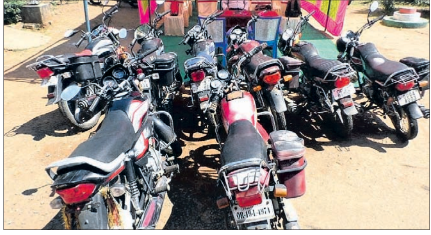
ଖବରଦାତା ସମ୍ମିଳନୀରେ ଦେବଗଡ଼ ଏସ୍ପିପିଓ ସୁଚନା ଦେଉଛନ୍ତି ଓ ଜବତ ବାଇକ୍।