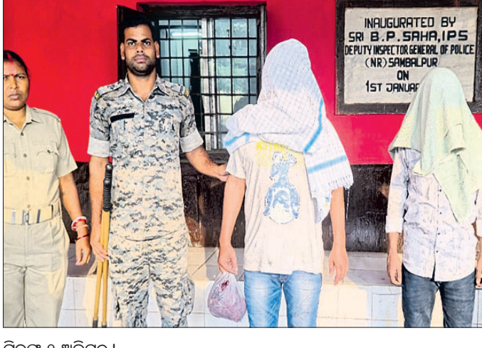
ଗିରଫ ୨ ଅଭିଯୁକ୍ତ।