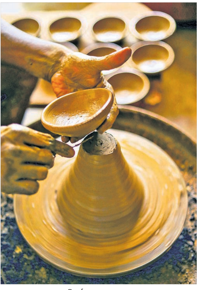
ବାପାଙ୍କ ପୂର୍ବରୁ ଶୁକ୍ରବାର ହାତୀବାଦରେ ବାପ ତିଆରି କରୁଥିବା କଣ୍ଠା କୁଣ୍ଡଳା।