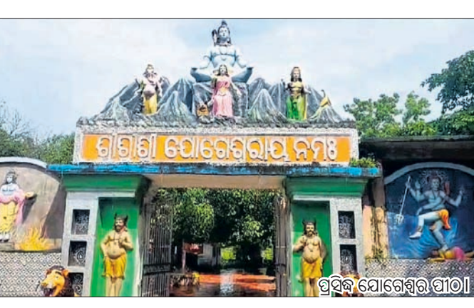
ପ୍ରସିଦ୍ଧ ଯୋଗେଶ୍ୱରୀ ପୀଠ ।