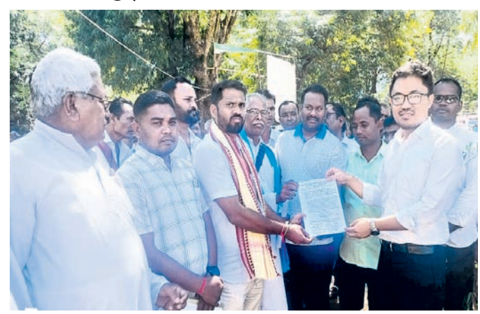
ଉପଜିଲ୍ଲାପାଳଙ୍କୁ ଦାବିପତ୍ର ପ୍ରଦାନ କରାଯାଉଛି ।