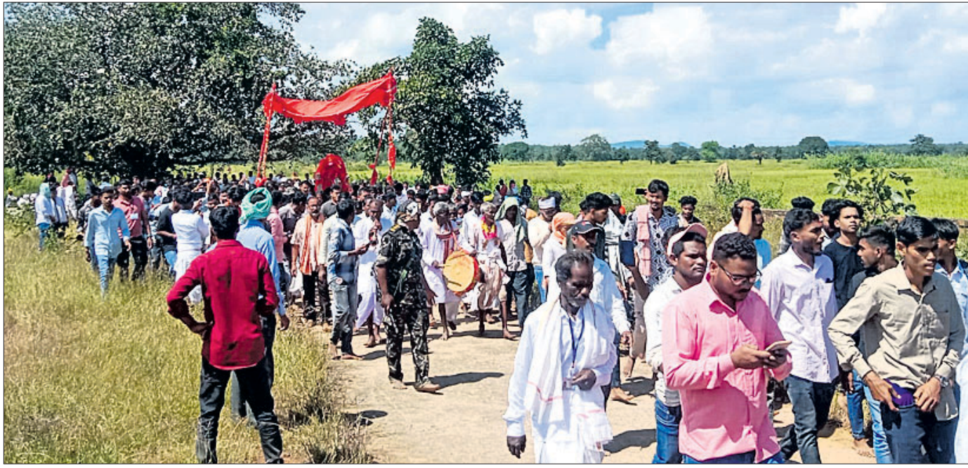
ମା' ସୁନାଦେଇଙ୍କ ଛତରଯାତ୍ରା ପରିକ୍ରମା କରାଯାଉଛି ।

କଳାହାଣ୍ଡି ଜିଲ୍ଲା ଭବାନୀପାଟଣା ପୌରପାଳିକାରେ ସଫେଇ ଚେଣ୍ଡର କେଳେଙ୍କାଗୀ ନେଇ ସାଧାରଣରେ ଉଦ୍‌ବେଗ ପ୍ରକାଶ ପାଇଛି । ଏ ନେଇ ଅଭିଯୋଗ ପରେ ଜିଲ୍ଲାପାଳ ତଦନ୍ତ ନିର୍ଦ୍ଦେଶ ଦେଇଥିଲେ । ମାତ୍ର ତଦନ୍ତ ବିଳମ୍ବ ହେଉଥିବାରୁ ସାଧାରଣରେ ଅସନ୍ତୋଷ ପ୍ରକାଶ ପାଇଛି । ପ୍ରକାଶ ଯେ, ଭବାନୀପାଟଣା ପୌରପାଳିକାରେ ଗତ ଜୁନ ୨୬ରେ ସଫେଇ କାର୍ଯ୍ୟକୁ ପାଇଁ ଚେଣ୍ଡର ଆହ୍ୱାନ କରାଯାଇଥିଲା । ତତ୍ପରେ କର୍ମଚାରୀ ଅନୁମୋଦନ କ୍ରମେ ଗ୍ରୀନ ସର୍କଲ ଏନ୍‌ଭାଇରନ୍‌ମେଣ୍ଟ ପ୍ରାଇଭେଟ ଲିମିଟେଡକୁ ଏଲ-୧ ବିବେଚନା କରାଯାଇଥିଲା । ପୌରପାଳିକା ପକ୍ଷରୁ କାର୍ଯ୍ୟାଦେଶ ପ୍ରଦାନ କରାଯାଇ ଅଗଷ୍ଟ ୧୭ କାର୍ଯ୍ୟ ଆରମ୍ଭ କରିବା ପାଇଁ ନିର୍ଦ୍ଦେଶ ଦିଆଯାଇଥିଲା । ପରବର୍ତ୍ତୀ ସମୟରେ ଚେଣ୍ଡର ନିୟମାବଳୀକୁ ଉଲ୍ଲଙ୍ଘନ କରାଯାଇ ଏଲ-୧ ବିବେଚିତ ସଂସ୍ଥାକୁ ଏକବର୍ଷ ନିମନ୍ତେ ଏଗ୍ରିମେଣ୍ଟ ପରିବର୍ତ୍ତେ ୧୨ମାସ ପାଇଁ ଏଗ୍ରିମେଣ୍ଟ କରାଯାଇଥିଲା । ପୌରପାଳିକା ସଂସ୍ଥାର କାର୍ଯ୍ୟ ଉପରେ ଅସନ୍ତୋଷ ପ୍ରକାଶ କରି ଗତ ଅଗଷ୍ଟ ୯ରେ କାରଣବର୍ତ୍ତୀ ଅନେକ ଗାରି କରାଯାଇ ଏହାପରେ ଅଗଷ୍ଟ ୨୯ରେ କରାଯିବ ବୋଲି ପ୍ରକାଶ କରିଥିଲେ ।