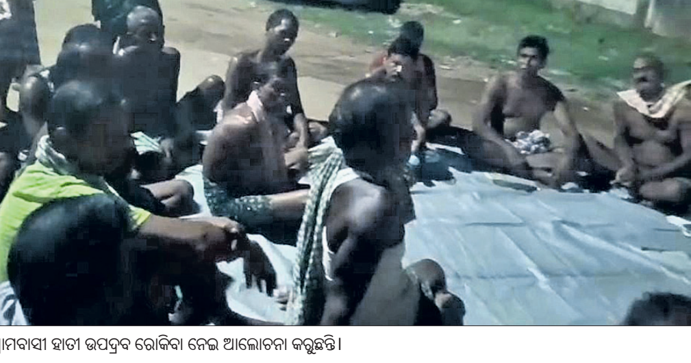
ଗ୍ରାମବାସୀ ହାତୀ ଉପଦ୍ରବ ରୋକିବା ନେଇ ଆଲୋଚନା କରୁଛନ୍ତି।

ଅସହ୍ୟ ହେଲାଣି ହାତୀ ଉପଦ୍ରବ। ନିୟମିତ ହାତୀ ଉପଦ୍ରବ ଯୋଗୁ ଲକ୍ଷ ଲକ୍ଷ ଚଳାକାର କ୍ଷତି ସୃଷ୍ଟି ହେବାରୁ ଦେବଗଡ଼ ଜିଲ୍ଲା ରିଆମାଳ ବ୍ଲକ୍ କୁଷ୍ଠେଇଗୋଳା ଗ୍ରାମ ପଞ୍ଚାୟତ ଅନ୍ତର୍ଗତ କୁରତପୋଣି ଗ୍ରାମର ନିରାହ ଗଣ୍ଡା। ଫଳରେ ଗାଈମାନଙ୍କ ମଧ୍ୟରେ ଚାପ ଅସହ୍ୟ ପ୍ରକାଶ ପାଇବା ସହ ଏକ ଆନ୍ଦୋଳନ ଦାମା ବାନ୍ଧୁଥିବା ଦେଖିବାକୁ ମିଳିଛି। ଏହି କ୍ରମରେ ଗୁରୁବାର ରାତିରେ ଗ୍ରାମବାସୀ ଏକତ୍ରିତ ହୋଇ ଏକ ସଭା କରିଥିବା ବେଳେ ଆନ୍ଦୋଳନ ପାଇଁ ନିଷ୍ପତ୍ତି ନେଇଥିବା ଜଣାପଡିଛି। ମିଳିଥିବା ସୂଚନା ଅନୁଯାୟୀ କୁରତପୋଣି ଗ୍ରାମ ସମେତ ଆଖପାଖ ଅଞ୍ଚଳରେ ଗତ କିଛି ଦିନ ହେଲା ଲଗାତର ଭାବେ ହାତୀ ଉପଦ୍ରବ ଜାରି ରହିଛି। ଫଳରେ ଅନଳ ପୂର୍ବରୁ ଧାନ ଗଣ୍ଡା ନଷ୍ଟ ହେଉଥିବା ବେଳେ ଗାଈ ବ୍ୟାପକ କ୍ଷୟକ୍ଷତିର ସମ୍ମୁଖୀନ ହେବାକୁ ପଡୁଛି। ଅନ୍ୟପକ୍ଷରେ ଦେବିଭାଗ ହାତୀ ଉପଦ୍ରବକୁ ଚେଷ୍ଟା କରୁଥିଲେ ମଧ୍ୟ ହାତୀପଲ ଉକ୍ତ ଅଞ୍ଚଳ