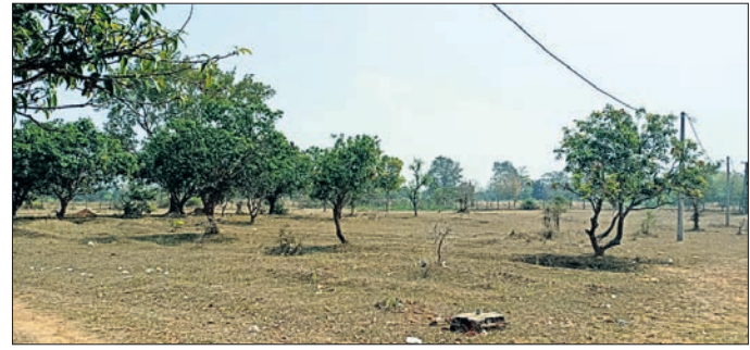
ଉଦ୍ୟାନ ବରିଚାରେ ଗଛ ସଂଖ୍ୟା ହ୍ରାସ ପାଇବାରେ ଲାଗିଛି ।

କଳାହାଣ୍ଡି, ୧୮୧୦ (ପ୍ରତାପ କୁମାର ସାହୁ) ବିଭାଗୀୟ ଅଧିକାରୀଙ୍କ କାର୍ଯ୍ୟକ୍ରମ ନିର୍ମାଣ ହୋଇଥିଲେ ମଧ୍ୟ ବିଭାଗ ପକ୍ଷରୁ କେହି ନ ରହିବାରୁ ଗୁରୁତ୍ୱ ଉପାଦାନ ପଡ଼ି ରହିଥିବା ଦେଖିବାକୁ ମିଳିଛି । ଏହାବ୍ୟତୀତ ରକ୍ଷଣାବେକ୍ଷଣ ଅଭାବରୁ ବରିଚାରେ ଥିବା ଅନେକ ଆୟତ୍ତ ମରିଗଲାଣି । ଏ ନେଇ ଉଦ୍ୟାନ ବିଭାଗ ଏବଂ ଚିକିତ୍ସା ପ୍ରଧାନଙ୍କୁ ପଚାରିବାରୁ ଉଦ୍ୟାନ ବରିଚାରେ ପୁନରୁଦ୍ଧନ କରାଯିବ । ବର୍ତ୍ତମାନ ବରିଚାରେ ପାଚେରି ନିର୍ମାଣ ପାଇଁ ଅନୁମତି ଆବେଦନ କରାଯାଇଛି । କାର୍ଯ୍ୟ ଆରମ୍ଭ ହେବ ବୋଲି କହିଛନ୍ତି ।