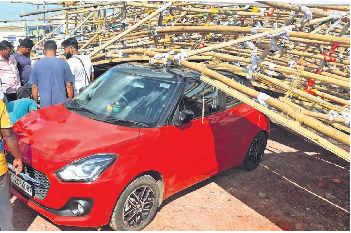
କଟକ ଖାନୁନଗରସ୍ଥିତ ନେତାଜୀ ବସ୍ ଟର୍ମିନାଲ ନିକଟ ରାସ୍ତାରେ ଶୁକ୍ରବାର ଅପରାହ୍ଣରେ ବୁର୍ଗାପୁଜା ତୋରଣ ଭୁକ୍ତି କାର ଉପରେ ପଡ଼ିଛି।