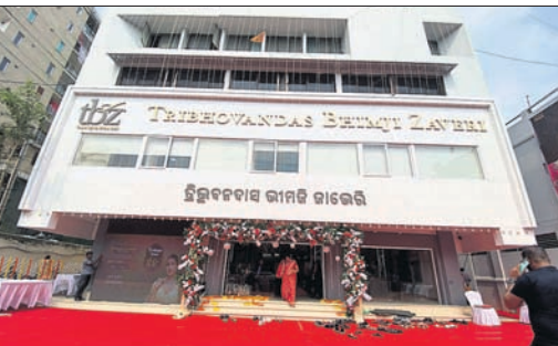
ତ୍ରିଭୁବନଦାସ ଭୀମଜି ଜାଭେରି ଶୋ' ରୁମ୍।