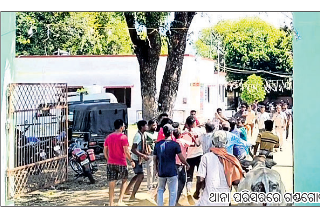
ଥାନା ପରିସରରେ ଗଣଗୋଳ ।

୧୮ ତାରିଖରେ ମନ୍ଦିର ପରିଚାଳନା କମିଟି ଉପଜିଲ୍ଲାପାଳଙ୍କ ଦ୍ୱାରା ଗଠିତ ହୋଇଥିଲା । ପ୍ରଶାସନ ପକ୍ଷରୁ ୨ ଦିନରେ କୌଣସି ପଦକ୍ଷେପ ନିଆ ନ ଯିବାରୁ ସେବାୟତ ଓ ଗ୍ରାମବାସୀଙ୍କ ମଧ୍ୟରେ ବିବାଦ ବଢିବାରେ ଲାଗିଥିଲା । ଏହି କାରଣ ନେଇ ଗତ ଅଗଷ୍ଟ ୨୭ରେ ଯୋଗାସର୍ତ୍ତା ପଞ୍ଚାୟତ ପରିସରରେ ଅନୁଷ୍ଠିତ ପଞ୍ଚାୟତସ୍ତରୀୟ ଅଭିଯୋଗ ଶୁଣାଣି ଓ ସଚେତନତା ଶିବିରରେ ଯୋଗଦେଇଥିବା ଲୋଇସିଂହା ବିଡ଼ିଓ, ତହସିଲଦାର ଏବଂ ଅନ୍ୟ ଅଧିକାରୀଙ୍କୁ ଉଭେକିତ ଗ୍ରାମବାସୀ ତାଳା ପକାଇ ଦୀର୍ଘ ୫ ଘଣ୍ଟାକୁ ଥିବା ସମୟ ଧରି ଅଟକ ରଖିଥିଲେ । ଏହି ଘଟଣା ପରେ ଜିଲ୍ଲାପାଳଙ୍କ କାର୍ଯ୍ୟାଳୟରେ ଉପଜିଲ୍ଲାପାଳ ଏବଂ ଗ୍ରାମବାସୀ ଆଲୋଚନା କରିଥିଲେ । ଦେବୋତ୍ତର ଜମି ବିବାଦ ମାମଲା ନେଇ ଜିଲ୍ଲା ପ୍ରଶାସନ ପକ୍ଷରୁ ସମ୍ବଲପୁର ଦେବୋତ୍ତର କମିଶନରଙ୍କୁ ଦୃଷ୍ଟି ଆକର୍ଷଣ କରାଯାଇଥିଲା । ଏହି କ୍ରମରେ ଶୁକ୍ରବାର ସମ୍ବଲପୁର ଦେବୋତ୍ତର କମିଶନର କାର୍ଯ୍ୟାଳୟରେ ୨ ଜଣ ଅଧିକାରୀ ରଖାଯାଇଛି । ଉଲ୍ଲେଖଯୋଗ୍ୟ, ଏହାପୂର୍ବରୁ ମଧ୍ୟ ସେବାୟତ ଏବଂ ଗ୍ରାମବାସୀ ମୁହାଁମୁହିଁ ହୋଇ ଥାନାର ଦ୍ୱାରକୁ ହୋଇଥିଲେ ।