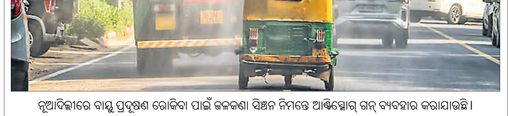
ନୂଆଦିଲ୍ଲୀରେ ବାୟୁ ପ୍ରଦୂଷଣ ରୋକିବା ପାଇଁ ଜଳକଣା ସିଞ୍ଚନ ନିମନ୍ତେ ଆଣ୍ଟିପୋଲ୍ ଗର୍ଦ୍ଧ ବ୍ୟବହାର କରାଯାଇଛି।