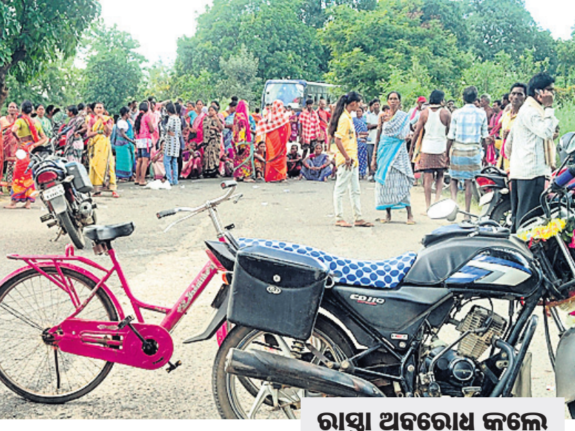
ରାସ୍ତା ଅବରୋଧ କଲେ ଉତ୍ତମକୁ ଲୋକେ, ଜଣେ ଅଟକ

ତେବେ କେତେକ ପାଣିପାଗ ମତେଲ ବାତ୍ୟା ନେଇ ସୂଚନା ଦେଲେଣି । ତଦନୁଯାୟୀ ଗଭୀର ଅବପାତ ଆସନ୍ତା ୨୪ ତାରିଖରେ ସାମୁଦ୍ରିକ ଝଡ଼ରେ ପରିଣତ ହୋଇପାରେ । ଏହି ଝଡ଼ ଓଡ଼ିଶା ପୂର୍ଣ୍ଣ ହେବ । ଆସନ୍ତା ୨୪ ତାରିଖ ସକାଳେ କିମ୍ବା ସନ୍ଧ୍ୟାରେ ଏହା ପୁରୀ ଏବଂ ଜଗତସିଂହପୁର ଦେଇ ଗୁଲୁଗୁଲୁ ଅତିକ୍ରମ କରିବ ବୋଲି ପୂର୍ବାନୁମାନ କରାଯାଇଛି । ସମୁଦ୍ରରେ ବାତ୍ୟା ବେଗ ଘଣ୍ଟା ପ୍ରତି ୧୫୦ରୁ ୧୬୦ କି.ମି. ରହିବ । ଗୁଲୁଗୁଲୁ ଅତିକ୍ରମ କରିବା ବେଳେ ପବନର ବେଗ ୯୦ କି.ମି.ରୁ ଖସି ଆସିପାରେ ବୋଲି ପାଣିପାଗ ମତେଲ ଅନୁମାନ କରୁଛି । ହେଲେ ଲଘୁପା ପ୍ରଭାବରେ ଉତ୍ତର ଏବଂ ଉପକୂଳ ଓଡ଼ିଶାରେ ପ୍ରବଳରୁ ଅତି ପ୍ରବଳ ବର୍ଷା ହେବାର ସମ୍ଭାବନା ରହିଛି । ଏଥିଯୋଗୁ ରାଜ୍ୟରେ ୨୨ରୁ ୨୬ ଯାଏ ବର୍ଷା ଲାଗି ରହିବ । ୨୩ରୁ ୨୫ ଉପକୂଳବର୍ତ୍ତୀ ଜିଲ୍ଲାଗୁଡ଼ିକରେ ପ୍ରବଳ ବର୍ଷା ହେବା ନେଇ ପୂର୍ବାନୁମାନ କରାଯାଇଛି । ବିଶେଷକରି ପୁରୀ, ଜଗତସିଂହପୁର, କେନ୍ଦ୍ରାପଡ଼ା, ମୟୂରଭଞ୍ଜ, ଭଦ୍ରକ, ବାଲେଶ୍ୱର, ଢେଙ୍କାନାଳ, ଅନୁଗୋଳ, ଦେବଗଡ଼ ଆଦି ଜିଲ୍ଲାରେ ପ୍ରବଳରୁ ଅତି ପ୍ରବଳ ବର୍ଷା ହେବ । ଏଥିସହିତ ଦକ୍ଷିଣ ଏବଂ ଆଭ୍ୟନ୍ତରୀଣ ଓଡ଼ିଶାରେ ମଧ୍ୟ ସମ୍ପୃକ୍ତ ମଧ୍ୟମ ଧରଣର ବର୍ଷା ହୋଇପାରେ ।