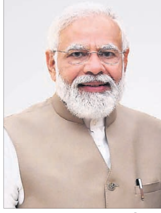
ପ୍ରଧାନମନ୍ତ୍ରୀ ନରେନ୍ଦ୍ର ମୋଦି ଦ୍ୱିପାର୍ଶିକ ଆଲୋଚନା ପାଇଁ ପୁଟିନ୍ ଗତ ମାସରେ ପ୍ରଧାନମନ୍ତ୍ରୀ ମୋଦିଙ୍କୁ ଆମନ୍ତ୍ରଣ କରିଥିଲେ। ଚଳିତ ବର୍ଷ ଏହା ମୋଦିଙ୍କର ଦ୍ୱିତୀୟ ରୁଷିଆ ଗସ୍ତ ପ୍ରମୁଖ ବୈଶ୍ୱିକ ପ୍ରସଙ୍ଗ ଉପରେ ଆଲୋଚନା କରିବେ। ବ୍ରିକ୍ସ ସମ୍ମିଳନୀରେ ଅବସରରେ ଅକ୍ଟୋବର ୨୨ରେ

ରୁଷିଆ ରାଷ୍ଟ୍ରପତି ଭାଣ୍ଡୁ ନାଥୁରାମ ପୁଟିନ୍ଙ୍କ ଆମନ୍ତ୍ରଣ କ୍ରମେ ପ୍ରଧାନମନ୍ତ୍ରୀ ନରେନ୍ଦ୍ର ମୋଦି ୧୬ତମ ବ୍ରିକ୍ସ ସମ୍ମିଳନୀରେ ଯୋଗଦେବା ପାଇଁ ଆସନ୍ତା ୨୨ ତାରିଖରେ ମସ୍କୋ ଗସ୍ତରେ ଯିବେ। ରୁଷିଆ ଅଧ୍ୟକ୍ଷତାରେ କାତାନରେ ବ୍ରିକ୍ସ ସମିତି ଅନୁଷ୍ଠିତ ହେବାକୁ ଯାଉଛି। ଏହି ଗସ୍ତ ଅବସରରେ ମୋଦି ବ୍ରିକ୍ସ ସଦସ୍ୟ ରାଷ୍ଟ୍ରଗୁଡ଼ିକର ପ୍ରତିପକ୍ଷ ସହ ଦ୍ୱିପାର୍ଶିକ ଆଲୋଚନା କରିବା ଆଶା କରାଯାଉଛି। ଏଥର ସମିତିର ଶୀର୍ଷକ ରହିଛି 'ବିଶ୍ୱିକ ବିକାଶ ଏବଂ ସୁରକ୍ଷା ପାଇଁ ବହୁପାର୍ଶିକତାର ସୁଦୃଢ଼ୀକରଣ'। ଏହି ଅବସରରେ ସଦସ୍ୟ ରାଷ୍ଟ୍ର ଅନ୍ୟମାନଙ୍କୁ ତାଙ୍କିଆଣିଥିଲେ। ସେମାନେ ଛୁରିରେ ଆକ୍ରମଣ କରିବାକୁ ଆରବ୍ ସମ୍ବନ୍ଧ କର୍ମୀ ଆହତ ହୋଇଥିବା ପୋଲିସ କହିଛି। ୬ ଜଣ ହସ୍ତିଖଳରେ ଚିକିତ୍ସିତ ହେଉଥିବାବେଳେ ପୋଲିସ ଅଭିଯୁକ୍ତ ନିର୍ଦ୍ଦେଶ ଦେଇ ତାଙ୍କୁ ଗୁଆକୁ ଗିରଫ କରି ତଦନ୍ତ ଚଳାଇଛି।