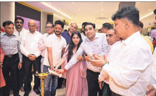
ପ୍ରଦୀପ ପ୍ରସ୍ତୁତ କରି ଷ୍ଟୋରକୁ ଉଦଘାଟନ କରାଯାଉଛି।

ତ୍ରିଭୁବନ ଦାସ ଭୀମଜି ଜାଭେରି (ଟିବିଜେଡ୍-ଦି ଓରିଜିନାଲ) ପକ୍ଷରୁ ଏହାର ପ୍ରଥମ ଶୋ' ରୁମ୍‌ର ଶୁଭ ଉଦଘାଟନ ଶୁକ୍ରବାର ରାଉରକେଲା ଉଦ୍‌ତନଗର ସ୍ଥିତ ଶ୍ରୀ କମ୍ପ୍ଲେକ୍ସର ତଳ ମହଲାରେ ଅନୁଷ୍ଠିତ ହୋଇଯାଇଛି। ଭାରତର ପ୍ରତିଷ୍ଠିତ ଲୁକ୍‌ଲେରି ବ୍ରାଣ୍ଡ ଟିବିଜେଡ୍-ଦି ଓରିଜିନାଲ ଓଡ଼ିଶା ପ୍ରଥମେ ଭୁବନେଶ୍ୱର ପରେ ବିତାଣ ଶୋ' ରୁମ୍ ଭାବେ ରାଉରକେଲା