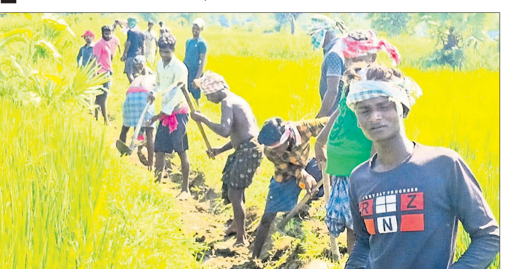
ଭୁଲେଶ୍ୱର ଗ୍ରାମର ଚାଷୀମାନେ କେନାଲ କାମ କରୁଛନ୍ତି।