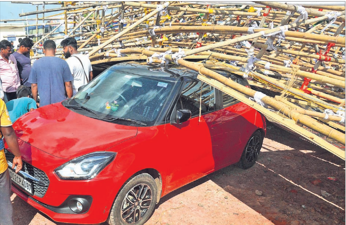
କଟକ ଖାନୁନଗରସ୍ଥିତ ନେତାଜୀ ବସ୍ ଟର୍ମିନାଲ ନିକଟ ରାସ୍ତାରେ ଶୁକ୍ରବାର ଅପରାହ୍ନରେ ବୁର୍ଲାପୁଞ୍ଜା ଚୋରଣ ଭୁକ୍ତି କାର ଉପରେ ପଡ଼ିଛି।

ନ୍ୟୁଜିଲାଣ୍ଡ ବିପକ୍ଷ ଟେଷ୍ଟ ମ୍ୟାଚରେ ୯ ହଜାର ଟେଷ୍ଟ ରନ ପୂରଣ କରିଛନ୍ତି ଭାରତର ଶ୍ଯାମ ବ୍ୟାଟର ବିରାଟ କୋହଲି।