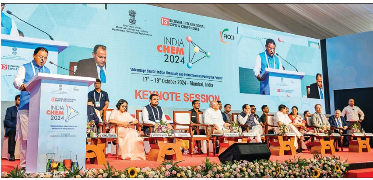
ଭୁବନେଶ୍ୱର, ୧୮.୧୦ (ଅନିଲ ଦାସ)