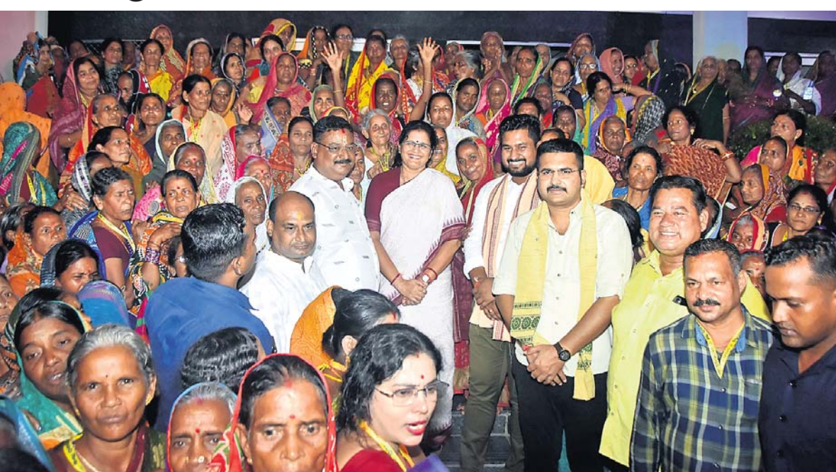
ଭୁବନେଶ୍ୱର ନିବାସରେ ହରିଷି ବ୍ରତର ଶୁଭାରମ୍ଭ ଅବସରରେ ଉପମୁଖ୍ୟମନ୍ତ୍ରୀ ପ୍ରଭାତା ପରିଡ଼ା, ମନ୍ତ୍ରୀ ସୂର୍ଯ୍ୟବଂଶୀ ସୁରଜ, ପିପିଲି ବିଧାନସଭା ଆଶ୍ରିତ ପଞ୍ଚମାୟକ ଏବଂ ପୁରୀ ବିଧାନସଭା ସୁନୀଲ କୁମାର ମହାନ୍ତି ପ୍ରମୁଖଙ୍କ ସହ ହରିଷିଆଳିମାନେ।