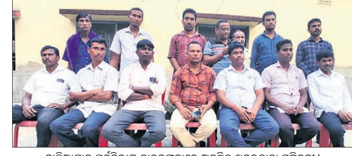
ବାଲିଆପାଳ ପୂର୍ବବିଭାଗ ଡାକ୍ତରଖାନାରେ ଅନୁଷ୍ଠିତ ଖବରଦାତା ସମ୍ମିଳନୀ ।

ବାଲେଶ୍ୱର ଜିଲ୍ଲା ବାଲିଆପାଳ ଜିଲ୍ଲା ଅଧୀନ ଡଗରା ଜନଶୁଣାଣିରେ ବାହାର ଲୋକଙ୍କୁ ବିରୋଧ କରାଯିବ । ଏହାଛଡ଼ା ଉପାସନା ସାଧନା ହେଉଛି ।