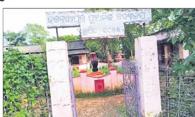
କରନାଥପୁର ପ୍ରାଥମିକ ବିଦ୍ୟାଳୟ ।

ପାଟଳରେ ଶିକ୍ଷୟିତ୍ରୀଙ୍କୁ ବିରୋଧ କରି ତାଲା ପକାଇବା ହେଉଛି । ଏହାଛଡ଼ା ଉପାସନା ସାଧନା ହେଉଛି ।