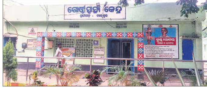
ହାତୀଗଡ଼ ଗୋଷ୍ଠୀ ସ୍ୱାସ୍ଥ୍ୟକେନ୍ଦ୍ର

ବାଲେଶ୍ୱର ଜିଲ୍ଲା କଳେଙ୍କର ଜିଲ୍ଲା ଅଧୀନ ହାତୀଗଡ଼ ଗୋଷ୍ଠୀ ସ୍ୱାସ୍ଥ୍ୟକେନ୍ଦ୍ର ଏବଂ ଏହା ଅଧୀନରେ ଥିବା ଚିକିତ୍ସା ପ୍ରାଥମିକ ସ୍ତରୀୟ ସ୍ୱାସ୍ଥ୍ୟକେନ୍ଦ୍ରରେ ସ୍ୱାସ୍ଥ୍ୟସେବା ବିକାଶ ପାଇଁ ଗୋଷ୍ଠୀ ଗଠନ କରାଯାଇଛି ।