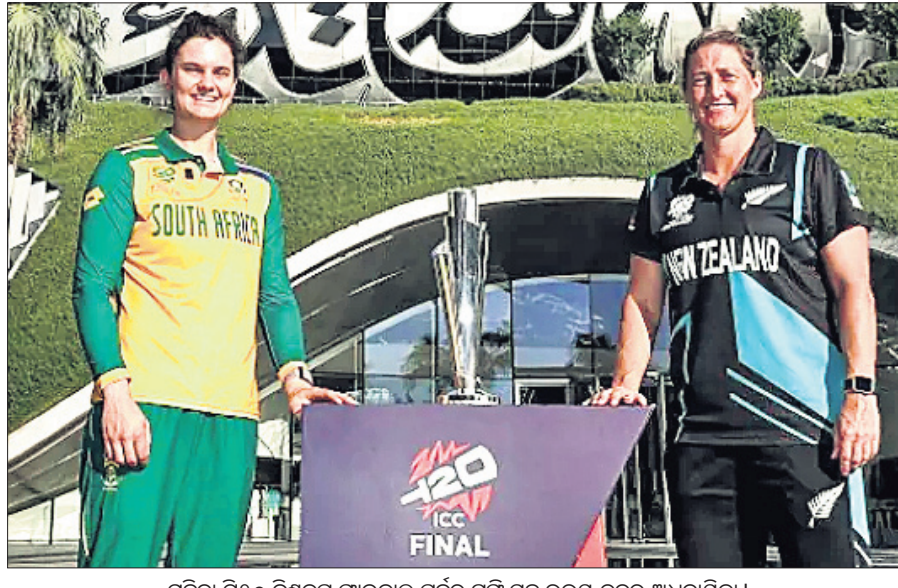
ମହିଳା ଟି୨୦ ବିଶ୍ୱକପ୍ ଫାଇନାଲ୍ ପୂର୍ବରୁ ଟ୍ରଫି ସହ ଉଭୟ ଦଳର ଅଧିନାୟିକା।

ଭାରତୀୟ ବ୍ୟାଟର ପ୍ୟାଲିୟନ୍ ଫେରିଥିଲେ। ଲୋକେଶ ରାହୁଲ ୧୨, ରବୀନ୍ଦ୍ର ଜାଡେଜା ୫, ରବିନ୍ଦ୍ରନ ଅଶ୍ୱିନ ୧୫, କୁଲଦୀପ ଯାଦବ ୬ ରନ୍ କରିଥିବା ବେଳେ ଯଶପ୍ରୀତ ଚୁପ୍ରା ଓ ମହମ୍ମଦ ସିରଜ ଖାତା ଖୋଲିପାରି ନ ଥିଲେ। ଅନ୍ୟପକ୍ଷରେ ଚତୁର୍ଥ ଦିନରେ ଭାରତୀୟ ଇନିଂସର ପତନ ଘଟିଥିବା ସମୟ ୬ ଉଇକେଟ ପେସ୍ ବୋଲରଙ୍କ ଖାତାକୁ ଯାଇଥିଲା। ଫ୍ଲିୟମ ଓରୁକେ ଓ ମ୍ୟାଟ୍ ହେନରୀ ୩ଟି ଲେଖାଏ ଏବଂ ଚିନ୍ତା ସାଉଦି ୧ ଉଇକେଟ ନେଇଥିଲେ। ପୂର୍ବରୁ ତୃତୀୟ ଦିନରେ ଏକାକ ପରେ ୨ ଓ ଲେନ୍ସ ଫିଲିପ୍ସ ୧ ଉଇକେଟ ନେଇଥିଲେ। ନ୍ୟୁଜିଲ୍ୟାଣ୍ଡ ଏହି ଦ୍ୱିତୀୟ ଇନିଂସ ଖେଳ ଆରମ୍ଭ କରିଥିବା ବେଳେ ମାତ୍ର ୪ ବଲ୍ ଖେଳ ସମୟ ହୋଇଥିଲା। ୪ ବଲ୍ ପରେ ଖରାପ ଆଲୋକ କାରଣରୁ ମ୍ୟାଚକୁ ରୋକା ଯାଇଥିଲା। ସ୍ପିନ୍ ଅପସାରଣ ବେଳକୁ ନ୍ୟୁଜିଲ୍ୟାଣ୍ଡ କୌଣସି ରନ୍ ସ୍କୋର କରି ନାହିଁ। ଅନ୍ୟପକ୍ଷରେ ଅନ୍ତିମ ଦିନ ବର୍ଷାର ସମ୍ଭାବନା ରହିଥିବା ବେଳେ ମ୍ୟାଟ୍ ବର୍ତ୍ତମାନ ରୋଚକ ସ୍ଥିତିରେ ରହିଛି। ସଂକ୍ଷିପ୍ତ ସ୍କୋର ଭାରତ ପ୍ରଥମ ଇନିଂସ-୪୬/୧୦। ନ୍ୟୁଜିଲ୍ୟାଣ୍ଡ ପ୍ରଥମ ଇନିଂସ-୪୦୨/୧୦। ଭାରତ-ତୃତୀୟ ଇନିଂସ-୯୯/୩ ଓ ଭାରତ-୪୬୨/୧୦ (ସର୍ପରାଜ ଖାଁ-୧୫୦, ରିଷଭ ପଟ୍ଟ-୯୯, ବିରାଟ କୋହଲି-୭୦, ଫ୍ଲିୟମ ଓରୁକେ-୩/୯୨, ମ୍ୟାଟ୍ ହେନରୀ-୩/୧୦୨, ଏକାକ ପରେ-୨/୧୦୦)।