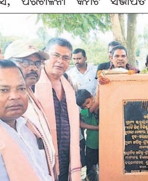
ବିଧାୟକ ଦ୍ୱାରା ଶିଳାନିର୍ମାଣ ଫଳାଫଳ ଉଦ୍ଘାଟନ କରାଯାଇଛି ।

ବାଲେଶ୍ୱର ଜିଲ୍ଲା ଖଜୁରା ଜିଲ୍ଲା ଅଧୀନ ଜନଜାତି ଛାତ୍ରାନ୍ୱିବାସର ଶିଳାନିର୍ମାଣ କଲେ ବିଧାୟକ । ଏହାଛଡ଼ା ଉପାସନା ସାଧନା ହେଉଛି ।