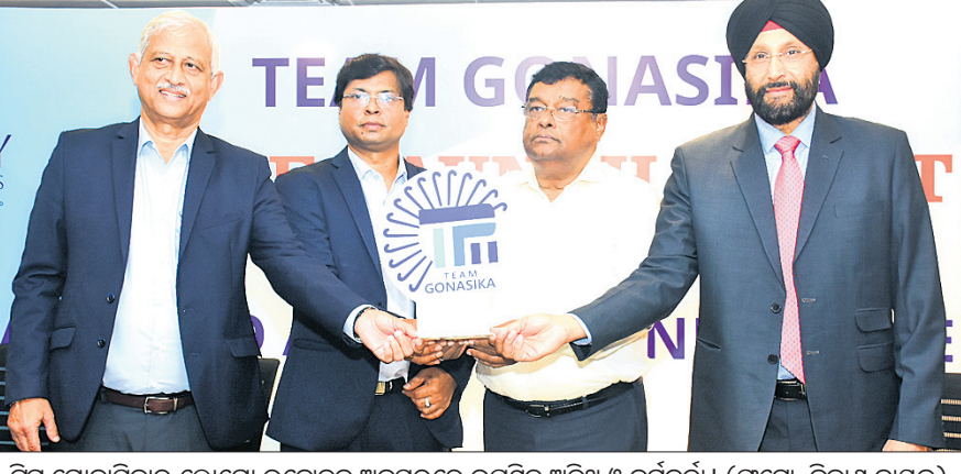
ଟିମ୍ ଗୋନାସିକାର ଲୋଗୋ ଉନ୍ମୋଚନ ଅବସରରେ ଉପସ୍ଥିତ ଅତିଥି ଓ କର୍ମଚାରୀ।