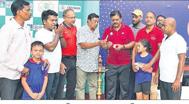
ପୁଣ୍ୟ ଅତିଥି ପ୍ରଦୀପ ପ୍ରଜ୍ୱଳନ କରୁଛନ୍ତି।

ଭୁବନେଶ୍ୱର, ୧୯୧୦ (ସରୋଜ କେନା) ଭୁବନେଶ୍ୱରର ପୋଖରୀପୁରରେ ଥିବା ବହୁମୁଖୀ ଲନଡୋର ଷ୍ଟାଡ଼ିୟମରେ ଅଲ ଓଡ଼ିଶା ଯୋନେକ୍ସ ସର୍ବଭାରତୀୟ ମିଳି (୧୧ ବର୍ଷରୁ କମ) ବାଳିକା ଓ ବାଳକ ବ୍ୟାଡ଼ମିଣ୍ଟନ ଚାମ୍ପିୟନଶିପ ଉଦଘାଟିତ ହୋଇଯାଇଛି।