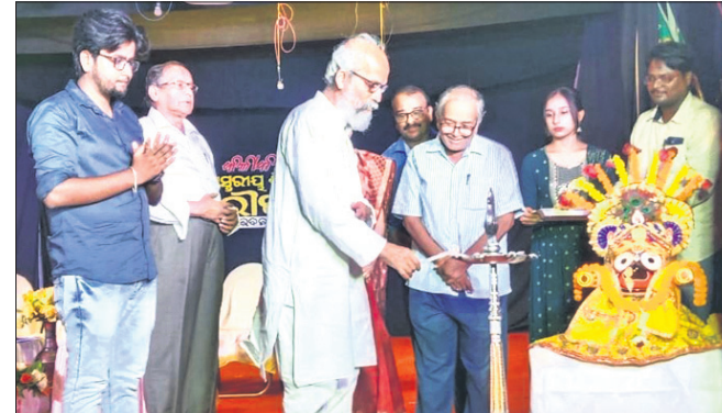
ବାଲେଶ୍ୱର, ୧୯୧୦(ବାସ୍ତବ ଚିତ୍ର)

ନାଟକ ଜୀବନର କଥା କହେ । ସମାଜର ବାସ୍ତବ ଚିତ୍ର ବହନ କରେ । ପୁଣ୍ୟସ୍ଥଳୀରେ ଉପାସନା ସାଧନା ହେଉଛି ।