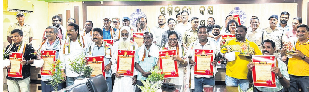
ପୁରସ୍କୃତ କମିଟି ଓ ସ୍ୱେଚ୍ଛାସେବୀଙ୍କ ସହ ପ୍ରଶାସନିକ ଅଧିକାରୀ ।