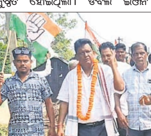
କଂଗ୍ରେସ ପକ୍ଷର ନେତାମାନଙ୍କ ଦ୍ୱାରା ଗାଁକୁ ଚାଲି ଆସିଲା ଉପଲକ୍ଷ୍ୟରେ ପ୍ରତିବାଦ ପଢ଼ାଯାଇଛି ।

ବାଲେଶ୍ୱର ଜିଲ୍ଲା କେନ୍ଦୁଝା କଂଗ୍ରେସ ଉପଲକ୍ଷ୍ୟରେ ଗାଁକୁ ଚାଲି ଆସିଲା । ଏହାଛଡ଼ା ଉପାସନା ସାଧନା ହେଉଛି ।