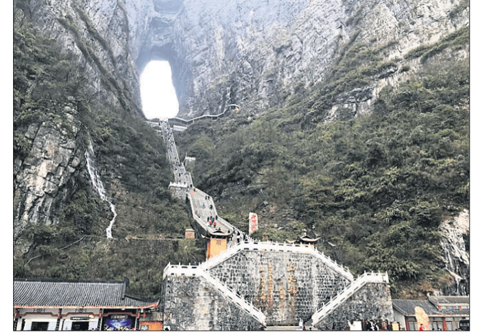
ସର୍ବୋଚ୍ଚ ଗୁମ୍ଫା ଭାବରେ ବିବେଚନା କରାଯାଏ। ସେହିପରି ଏହି ଗୁମ୍ଫାକୁ ସ୍ୱର୍ଗର ଦ୍ୱାର ବୋଲି ମଧ୍ୟ କୁହାଯାଏ।

ବିଶ୍ୱରେ ଏପରି ଅନେକ ପର୍ଯ୍ୟଟନସ୍ଥଳୀ ରହିଛି, ଯାହାର କିଛି ନା କିଛି ରହସ୍ୟ ରହିଛି। ଏହି ପର୍ଯ୍ୟଟନ ସ୍ଥଳୀଗୁଡ଼ିକୁ ଅନେକ ସଂଖ୍ୟାରେ ପର୍ଯ୍ୟଟକ ଭ୍ରମଣ କରିବାକୁ ଆସିଥାନ୍ତି। ଗାଜନାରେ ମଧ୍ୟ ଏପରି ଏକ ସ୍ଥାନ ରହିଛି, ଯାହା ଦୀର୍ଘ ବର୍ଷ ଧରି ପର୍ଯ୍ୟଟକଙ୍କ ଆକର୍ଷଣର କେନ୍ଦ୍ରବିନ୍ଦୁ ପାଲଟିଛି। ଗାଜନାର ପ୍ରମୁଖ ପର୍ଯ୍ୟଟନ ସ୍ଥଳୀଗୁଡ଼ିକ ମଧ୍ୟରୁ ତିଆନମେନ୍ ମାଉଣ୍ଟେନ ଅନ୍ୟତମ। ଏହି ପର୍ବତମାଳାର ଉପର ମୁଣ୍ଡରେ ଏକ ଗୁମ୍ଫା ଅଛି, ଯାହା ଭୂମିଠାରୁ ୧୫୧୮ ମିଟର (ପ୍ରାୟ ୫ ହଜାର ଫୁଟ) ଉଚ୍ଚରେ ଅବସ୍ଥିତ। କୌଣସି ପର୍ବତ ଉପରେ ଅବସ୍ଥିତ ଏହି ଗୁମ୍ଫାକୁ ବିଶ୍ୱର