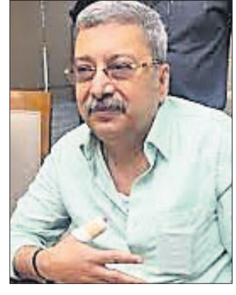
ଭାଜପା ବରିଷ୍ଠ ଏମ୍ପି ଜଗଦମ୍ପିକା ନିନ୍ଦା କରିଛନ୍ତି। ଏହା ଅଭୂତପୂର୍ବ ଏବଂ ସବୁ ସାମା ଚ୍ୟପିୟାଲଥିବା ଜଗଦମ୍ପିକା କହିଛନ୍ତି। ଏମ୍ପିମାନେ ସାଧୁକାର