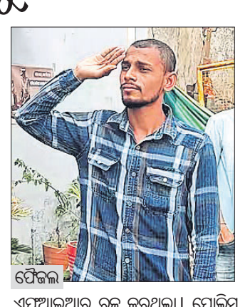
ଏଫଆଇଆର୍ ରୁକ୍ମ କରୁଥିଲା। ପୋଲିସ ଫିକ୍ସେଜ୍ ରିଟ କରିବା ସହ ତାଙ୍କ ବିରୋଧରେ ଚାର୍ଜିଟ୍ରିପ୍ ଗ୍ରାଏଲ କୋର୍ଟରେ ଉପସ୍ଥାପନ କରିଥିଲା। ଗ୍ରାଏଲ କୋର୍ଟରେ ଫିକ୍ସେଜ୍ ଜାମିନ ଆବେଦନ ନାମସ୍ତରେ

ହେବା ପରେ ସେ ହାଇକୋର୍ଟଙ୍କ ଦ୍ୱାରା ହୋଇଥିଲେ। ଶୁଣାଣି ସମୟରେ ସରକାରୀ ଓକିଲ ସି.କେ. ମିଶ୍ରା ଏକ ଭିଡିଓ କ୍ଲିପ୍ ଉପସ୍ଥାପନ କରିଥିଲେ। ଅଭିଯୁକ୍ତ ମୁକ୍ତ ବିବାହୀୟ ସ୍ନୋଗାନ ଦେଖିଥିବା ନେଇ ଭିଡିଓରୁ ସ୍ପଷ୍ଟ ହୋଇଥିଲା। ଶୁଣାଣି ସମୟରେ ସରକାରୀ ଓକିଲ ମିଶ୍ରା କହିଥିଲେ, ଅଭିଯୁକ୍ତ ଜଣକ ଯେଉଁ ଦେଶରେ ଜନ୍ମ ହୋଇଛନ୍ତି, ଯେଉଁଠାରେ ବଡ଼ ହୋଇଛନ୍ତି, ତାହା ବିରୋଧରେ ସ୍ନୋଗାନ ଦେଖିଛନ୍ତି। ଯଦି ଫିକ୍ସେଜ୍ ଭାରତରେ ସମ୍ପୂର୍ଣ୍ଣ ନାହାନ୍ତି, ତେବେ ଭଲ ହେବ ଯେଉଁଦେଶ ସମ୍ପର୍କରେ ସେ ସ୍ନୋଗାନ ଦେଇଛନ୍ତି, ସେହି ଦେଶକୁ ଚାଲିଯାଆନ୍ତୁ। ଉପସ୍ଥାପନ କରିଥିଲା। ଗ୍ରାଏଲ କୋର୍ଟରେ ଫିକ୍ସେଜ୍ ଜାମିନ ଆବେଦନ ନାମସ୍ତରେ