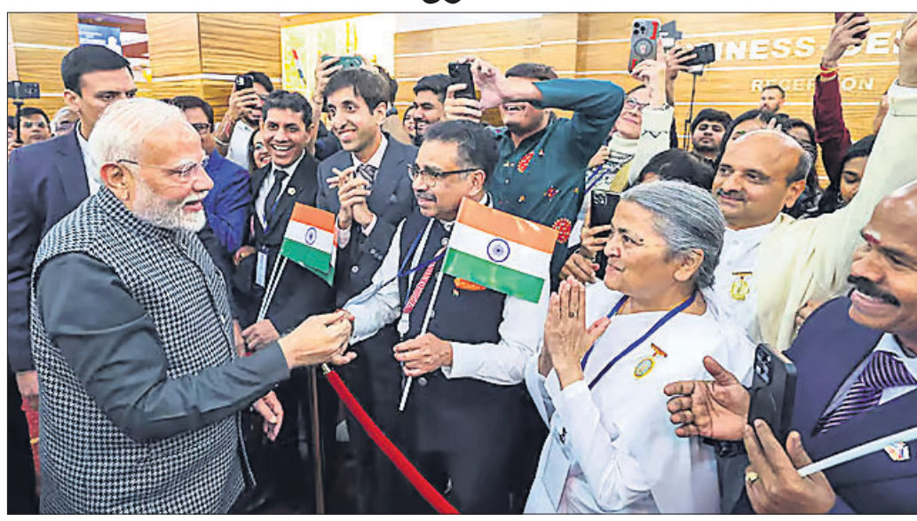
ବିକ୍ରମ ସମ୍ବିଳନୀଙ୍କୁ ଯୋଗଦେବା ପାଇଁ ରୁଷିଆର କାମନା ସହରରେ ପହଞ୍ଚିଥିବା ପ୍ରଧାନମନ୍ତ୍ରୀ ନରେନ୍ଦ୍ର ମୋଦିଙ୍କୁ ପ୍ରଦାନା ଭାରତୀୟମାନେ ସାଗର କରୁଛନ୍ତି।

ବେରୁଟ୍ରେ ମୁଖ୍ୟ ହସ୍ତଶିଳା ସମେତ ଏହା ଆଖପାଖ ଅଞ୍ଚଳରେ ଇସ୍ରାଏଲୀ ସେନା ସୋମବାର ରାତିରେ ଜୋର୍‌ବାର ବୋମାମାଡ଼ କରିବାରୁ ୧୩ ଜଣଙ୍କ ମୃତ୍ୟୁ ଘଟିବା ସହ ୫୬ ଜଣ ଆହତ ହୋଇଛନ୍ତି। ରାତିରେ ହରିରି ମୁନିକର୍ପିଟ ହସ୍ତଶିଳା ନିକଟରେ ଥିବା ଅନେକ ବିଲ୍ଡିଂ ବୋମାମାଡ଼ରେ ଏହା ହୋଇଯାଇଛି।