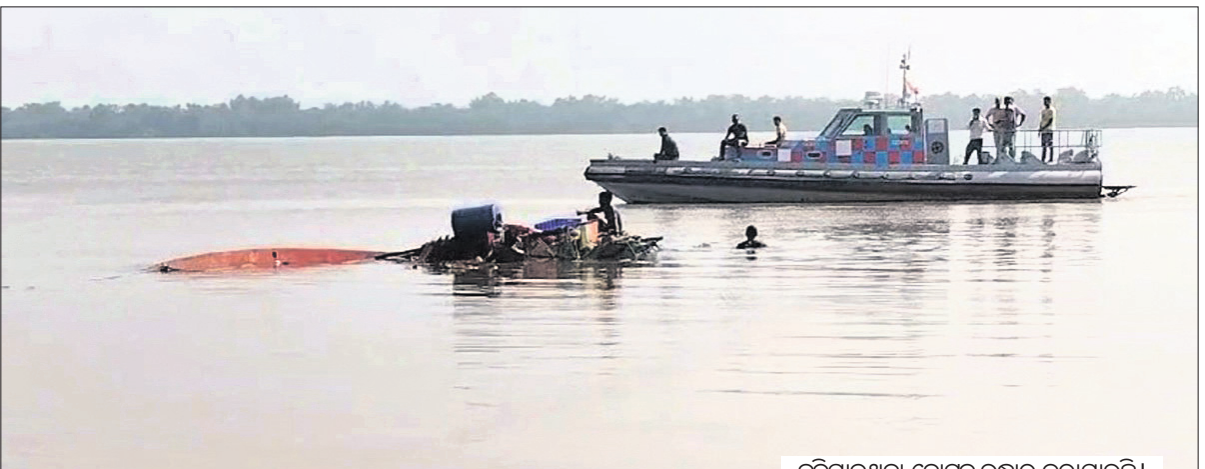
ବୁଡ଼ିଯାଇଥିବା ବୋଟ୍‌ରୁ ଉଦ୍ଧାର କରାଯାଇଛି।

ଗନ୍ଧବଳି, ୨୨.୧୦ (ଅଶୋକ ପଣ୍ଡା/କିଷାନ ପାତ୍ର) ଭଦ୍ରକ ଜିଲା ଗନ୍ଧବଳି ବ୍ଲକ୍‌ର ଧାମରାଠାରେ ବୈତରଣୀ ନଦୀ ମୁହାଣରେ ମଙ୍ଗଳବାର ଏକ ମାଛଧରା ବୋଟ୍ ବୁଡ଼ିଯାଇଛି। ସେଥିରେ ଥିବା ୧୦ ମହାଜୀବାଙ୍କୁ ଧାମରାମେରାଇନପୋଲିସ୍ ସୁରକ୍ଷିତ ଉଦ୍ଧାର କରିଛି। ସୂଚନା ଅନୁଯାୟୀ, ପଶ୍ଚିମବଙ୍ଗ ଦାନ୍ତାର ଏକ ମାଛଧରା ବୋଟ୍‌ରେ ୧୨ଜଣ ମହାଜୀବା ମାଛ ଧରିବା ପାଇଁ ସମୁଦ୍ରକୁ ଯାଇଥିଲେ। ବଙ୍ଗୋପସାଗରରେ ବୁଝି ହୋଇଥିବା ବାତ୍ୟା ଯୋଗୁଁ ପାଣିପାଗ ବିଭାଗ ପକ୍ଷରୁ ମହାଜୀବାମାନଙ୍କୁ ସମୁଦ୍ରରୁ ଫେରି ଆସିବାକୁ ସୂଚନା ଦିଆଯାଇଥିଲା। ବାତ୍ୟା ସୂଚନା ପାଇବା ପରେ ସେମାନେ କୁଳକୁ ଫେରିଆସି ବୋଟ୍‌କୁ ଧାମରା ମୁହାଣରେ ଲଙ୍ଗର ପକାଇ ରଖିଥିଲେ। ୨ତାଳକ ଧାମରା ବଙ୍ଗରୁ ଯାଇଥିବା ବେଳେ ସେଥିରେ ଥିବା ଅନ୍ୟ ମହାଜୀବା ବୋଟ୍‌କୁ ଶ୍ଯାଟ୍ କରି ଦେଇଥିଲେ। ହେଲେ ସେମାନେ ବାଳନା ଜାଣି ନ ଥିବାରୁ ବୋଟ୍ ଯାଇ ଗୋଟିଏ ସ୍ଥାନରେ ମାଡ଼ ହୋଇଥିଲା। ସେଥିରୁ କାଠ ପଟା ବାହାରି ଯାଇ ସେହି ବାଟ ଦେଇ ଭିତରକୁ ପାଣି ପଶିବାରୁ ବୋଟ୍ ଧୀରେ ଧୀରେ ପାଣିରେ ବୁଡ଼ି ଯାଇଥିଲା। ଖବର ପାଇ ମେରାଇନ ପୋଲିସ୍ ପହଞ୍ଚି ପରମ୍ପରା ମହାଜୀବାଙ୍କୁ ଉଦ୍ଧାର କରିଥିଲା। ପରେ ମହାଜୀବାଙ୍କ ସହାୟତାରେ ବୋଟ୍‌କୁ ଉଦ୍ଧାର କରାଯାଇଛି।