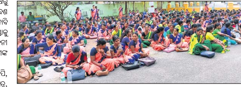
ଜିପିଏଲ୍‌ଏଫ୍ ସଂଘରେ ସିଆରପି, ଏମ୍‌ବିକେ, ବ୍ୟାଙ୍କମିଡ଼ି, ପ୍ରାଣୀମିଡ଼ି, କୃଷିମିଡ଼ି, ଉଦ୍ୟୋଗମିଡ଼ି ଆଦି କର୍ମଚାରୀ ଅଛନ୍ତି।

କର୍ମଚାରୀ ଜିପିଏଲ୍‌ଏଫ୍ କର୍ମୀ ସଂଘ ପକ୍ଷରୁ ମଙ୍ଗଳବାର ଫୁଲବାଣୀରେ ବିଶାଳ ସମାବେଶ ଅନୁଷ୍ଠିତ ହୋଇଯାଇଛି।