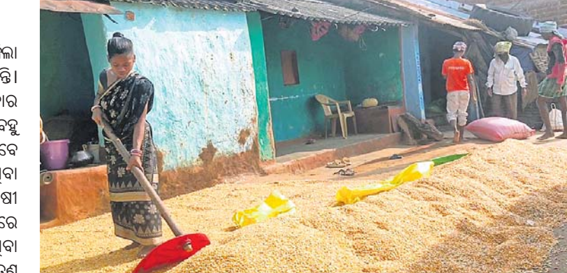
ହୋଇଥିବା ମକାକୁ ପାଳ ଘୋଡ଼ାଇ ସୁରକ୍ଷିତ ଭାବେ ଚାଷୀ ରଖୁଛନ୍ତି। ସରକାର ଚାଷୀମାନଙ୍କ ପାଇଁ ଖଳର ବ୍ୟବସ୍ଥା କରିବା ପାଇଁ କୃଷକ ସାଥୀ ଭାବେ ଚାଷୀ ରଖୁଛନ୍ତି।

ସମ୍ଭାଷ୍ୟ ବାତ୍ୟାକୁ ନେଇ ଗଜପତି ଜିଲ୍ଲା ମୋହନା ବ୍ଲକର ଚାଷୀଙ୍କୁ ଚିନ୍ତାରେ ଅଛନ୍ତି। ବ୍ଲକର ଅଧିକାଂଶ ଲୋକ ଚାଷ କରି ପରିବାର ଚଳାଇ ଆସୁଛନ୍ତି।