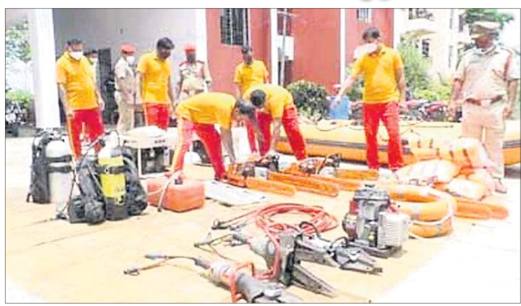
ସମାଜ ସାମ୍ବନ୍ଧିକ ଝଡ଼ ଦାନା ଅଭିଯାନ କର୍ମଚାରୀମାନେ ସମସ୍ତଙ୍କୁ ସୂଚନା ଦେଇଛନ୍ତି ।