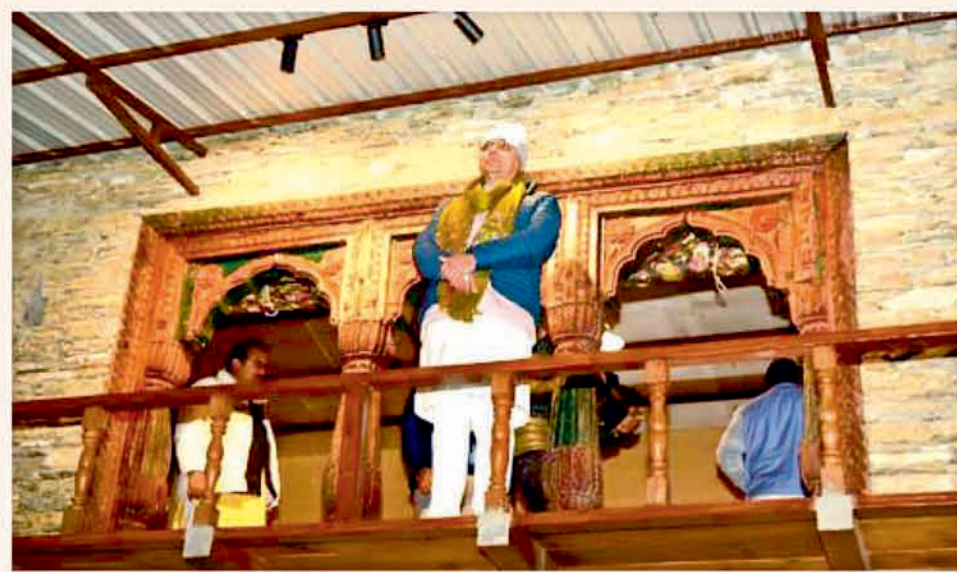
In 2024, the Ministry of Tourism, Government of India, awarded the title of Best Tourism Village to four villages in Uttarakhand: Jakhoul village and Harsil village in Uttarkashi district, Gunji village in the border area of Pithoragarh district, and Supi village in Bageshwar district.

Due to the efforts of the government, the local population has got employment through tourism schemes in Uttarakhand. Besides, this initiative has also strengthened the economy of the state.