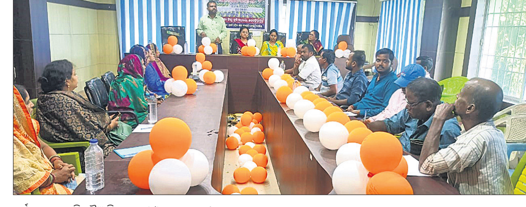
କର୍ମଶାଳାରେ କୃଷି ବିଜ୍ଞାନିକ, ଚାଷୀ ଓ ଅନ୍ୟମାନେ।

ପୃଥିବୀର ଗାୟତ୍ରୀ ବୃଦ୍ଧି ତଥା ଜଳବାୟୁ ପରିବର୍ତ୍ତନରେ ମିଥେନ୍ ଗ୍ୟାସ୍ ପ୍ରମୁଖ ଭୂମିକା ନିଭାଉଛି। କାରଣ ଅଜ୍ଞାନକାରୀ (କାର୍ବନ ଡାଇଅକ୍ସାଇଡ୍) ଗ୍ୟାସ୍‌ରୁ ମିଥେନ୍ ୨୫ରୁ ୨୮ ପ୍ରତିଶତ ଅଧିକ କ୍ଷତିକାରକ। ଅର୍ଥାତ୍ ମିଥେନ୍ ଗ୍ୟାସ୍ ଅଜ୍ଞାନକାରୀ ଗ୍ୟାସ୍‌ରୁ ଅଧିକ ପାଖାପାଖି ୨୮% ଗାୟତ୍ରୀ ଧରି ରଖିଥାଏ। ଏହି ମିଥେନ୍ ଗ୍ୟାସ୍ ଧାନ ବିଲରୁ ମଧ୍ୟ ନିର୍ଗତ ହୋଇଥାଏ। ବିଶେଷକରି ଧାନ ଚାଷ ସମୟରେ ଅର୍ଥାତ୍ ବିଲରେ ପାଣି ଜମି କାରୁଥିବା ଅବସ୍ଥାରେ ଏହି କ୍ଷତିକାରକ ଗ୍ୟାସ୍ ବହୁ ପରିମାଣରେ ନିର୍ଗତ ହେଉଛି। ଏହାକୁ ରୋକିବା ସାଧ୍ୟତା ଗଣନାରେ ଖର୍ଚ୍ଚ କମାଇବା ଲାଗି ଯାନ୍ତ୍ରିକ ପଦ୍ଧତିରେ ଧାନ ଚାଷ ଉପରେ ଗୁରୁତ୍ୱରୋପ କରାଯାଇଛି। ଏହାଦ୍ୱାରା କମ୍ ଜଳ ବ୍ୟବହାର ହେବାର ସୁବିଧା ସଂରକ୍ଷଣ ହୋଇପାରିବ ବୋଲି ମଙ୍ଗଳବାର କରବିହାରପୁର ଜିଲ୍ଲା ଏରସମା ଓ କୁଳଜ ବୁକ କୃଷି ଅଧିକାରୀଙ୍କ କାର୍ଯ୍ୟାଳୟ ପରିସରରେ ଯାନ୍ତ୍ରିକ ପଦ୍ଧତିରେ ଧାନ ଚାଷ ଉପରେ ଅନୁଷ୍ଠିତ ତାଲିମ କାର୍ଯ୍ୟକ୍ରମରେ କୁହାଯାଇଛି। ଏହି କାର୍ଯ୍ୟକ୍ରମରେ କରବିହାରପୁର କୃଷି ବିଜ୍ଞାନ କେନ୍ଦ୍ରର କୃଷି