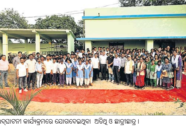
ଉଦ୍‌ଘାଟନା କାର୍ଯ୍ୟକ୍ରମରେ ଯୋଗଦେଇଥିବା ଅତିଥି ଓ ଛାତ୍ରଛାତ୍ରୀ ।

ବାଟା ଦାନା ଭୟଙ୍କର ରୂପ ନେଇ ସ୍ଥଳ ଭାଗକୁ ମାଡ଼ି ଆସୁଛି । ଭିତରକନିକାକୁ ଧାମରା ମଧ୍ୟରେ ବାଟା ଉପକୂଳ ଛୁଇଁବ । ଧାମରା ପ୍ରକାଶ ରାଜନଗର ବ୍ଲକର ଚାଳକଙ୍କୁ ଆକ୍ରମଣ କରିବାକୁ ଏହି ବ୍ଲକ ଅଧିକାରୀଙ୍କୁ ପ୍ରଭାବିତ ହେବ ବୋଲି ଆଶଙ୍କା କରାଯାଇଛି । ବିଶେଷକରି ବାସନାପା, ଚାଳକଙ୍କୁ, କେରୁଆପାଳ, ରଜଶା, କୁସୁନଗର, ଖମାରସାହି, ତାଳମାଳ, ଲକ୍ଷ୍ମନପୁର, ଘଡ଼ିଆମାଳ, ଗୁପ୍ତି, ସାତଭାୟା, ବ୍ରାହ୍ମଣସାହି ପ୍ରଭୃତି ପଞ୍ଚାୟତ ଅଧିକ ପ୍ରଭାବିତ ହେବାର ଆଶଙ୍କା ରହିଛି । ମଙ୍ଗଳବାର ପାଗ ଖରାପିଆ ଥିଲେ ମଧ୍ୟ ସମ୍ପାଦକ ବାଉଁଶଗଡ଼ ନଦୀ ସେପଟରେ ଥିବା ମଗରକନ୍ଦାର ଗାଁର ୪୦ ପରିବାରକୁ ଘାଟ ପାର କରି ଓକିଲପାଳ