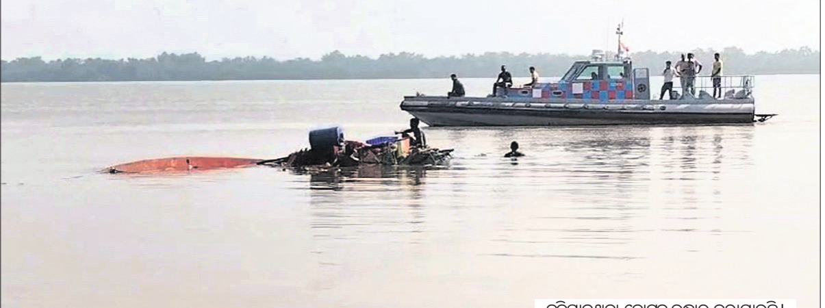
ବୁଡ଼ିଯାଇଥିବା ବୋଟ୍କୁ ଉଦ୍ଧାର କରାଯାଇଛି।

ଗନ୍ଧବଳି, ୨୨୧୦ (ଅଶୋକ ପଣ୍ଡା/କିଶୋର ପାଣି) : ଭଦ୍ରକ ଜିଲ୍ଲା ଗନ୍ଧବଳି ବ୍ଲକ୍ରେ ଧାମରାଠାରେ ବୈତରଣୀ ନଦୀ ମୁହାଣରେ ମଙ୍ଗଳବାର ଏକ ମାଛଧରା ବୋଟ୍ ବୁଡ଼ିଯାଇଛି। ସେଥିରେ ଥିବା ୧୦ ମହାଜୀବାଙ୍କୁ ଧାମରା ମେଡିକାଲ ପୋଲିସ୍ ପୁରୁଷିତ ଉଦ୍ଧାର କରିଛି। ସୂଚନା ଅନୁଯାୟୀ, ପଶ୍ଚିମବଙ୍ଗ ଦାମରା ଏକ ମାଛଧରା ବୋଟ୍ରେ ୧୨ଜଣ ମହାଜୀବା ମାଛ ଧରିବା ପାଇଁ ସମୁଦ୍ରକୁ ଯାଇଥିଲେ। ବଙ୍ଗୋପସାଗରରେ ବୁଡ଼ିଯାଇଥିବା ବାତ୍ୟା ଯୋଗୁଁ ପାଣିପାଗ ବିଭାଗ ପକ୍ଷରୁ ମହାଜୀବାମାନଙ୍କୁ ସମୁଦ୍ରରୁ ଫେରି ଆସିବାକୁ ସୂଚନା ଦିଆଯାଇଥିଲା। ବାତ୍ୟା ସୂଚନା ପାଇବା ପରେ ସେମାନେ କୁଳକୁ ଫେରିଆସି ବୋଟ୍କୁ ଧାମରା ମୁହାଣରେ ଲଙ୍ଗର ପକାଇ ରଖିଥିଲେ। ୨୦ମିନିଟ୍ ଧାମରା ବନ୍ଦରକୁ ଯାଇଥିବା ବେଳେ ସେଥିରେ ଥିବା ଅନ୍ୟ ମହାଜୀବା ବୋଟ୍କୁ ଖୁଣ୍ଟି କରି ଦେଇଥିଲେ। ହେଲେ ସେମାନେ ବାଳନା ଜାଣି ନ ଥିବାରୁ ବୋଟ୍ଟି ଯାଇ ଗୋଟିଏ ସ୍ଥାନରେ ମାଡ଼ ହୋଇଥିଲା। ସେଥିରୁ କାଠ ପଟା ବାହାରି ଯାଇ ସେହି ବାଟ ଦେଇ ଭିତରକୁ ପାଣି ପଶିବାରୁ ବୋଟ୍ଟି ଧାମରା ବନ୍ଦର ବୁଡ଼ି ଯାଇଥିଲା। ଖବର ପାଇ ମେଡିକାଲ ପୋଲିସ୍ ପହଞ୍ଚି ସମସ୍ତ ମହାଜୀବାଙ୍କୁ ଉଦ୍ଧାର କରିଥିଲା। ପରେ ମହାଜୀବାଙ୍କ ସହାୟତାରେ ବୋଟ୍ଟିକୁ ଉଦ୍ଧାର କରାଯାଇଛି।