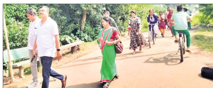
ଉତ୍ତରପ୍ରାଚ୍ୟ ପଞ୍ଚାୟତ ଅଞ୍ଚଳରେ ସ୍ୱାସ୍ଥ୍ୟ ବିଭାଗର ଚିମ୍ପ ।