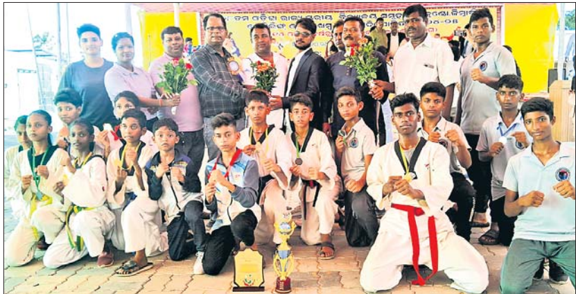
ଗାଏକୋଣ୍ଡାରେ ଭାଗନେଇଥିବା ପ୍ରତିଯୋଗୀ ଓ ଅନ୍ୟମାନେ ।

ଯାଜପୁର, ୨୨.୧୦.୨୦୨୪ (ହର୍ଷବର୍ଦ୍ଧନ ବେହେରା):