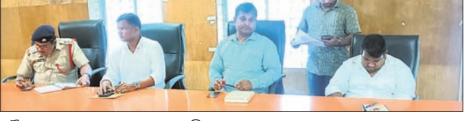
ବୈଠକରେ ଯୋଗଦେଇଥିବା ପ୍ରଶାସନିକ ଅଧିକାରୀମାନେ।

କୂଳକ କୁଳର ଖାଲୁଆ ଅଞ୍ଚଳ ରୂପେ ବିକାଶ ପାଇବାପରେ ପଞ୍ଚାୟତର ଚଳକଣ ଚୌକା ଓ ନୂଆଗଡ଼ ପଞ୍ଚାୟତର ବିକ୍ଷୟକାରୀଙ୍କୁ, କାମାନାସୀ ଏବଂ ମୁଣ୍ଡାଡ଼ିଆ ଚୌକା ଅଧିବାସୀଙ୍କୁ ସମ୍ପର୍କରେ ବିତ୍ତି ଦାପକ ପ୍ରସାଦ ସ୍ୱାକ୍ଷରରେ ରୁଦ୍ଧି କରାଯାଇଛି। କୁଳକରୁ ୧୦ ବାତ୍ୟା ଆଶ୍ରୟସ୍ଥଳ ଓ ୪ ବନ୍ୟା ଆଶ୍ରୟସ୍ଥଳକୁ ପାନୀୟ ଜଳ ଯୋଗାଣ ବ୍ୟବସ୍ଥା ହୋଇଥିବାବେଳେ ପାଇଁ ଗଣାପଡ଼ିଛି। ରୁପସା ଛାଡ଼ି ଦେଖି