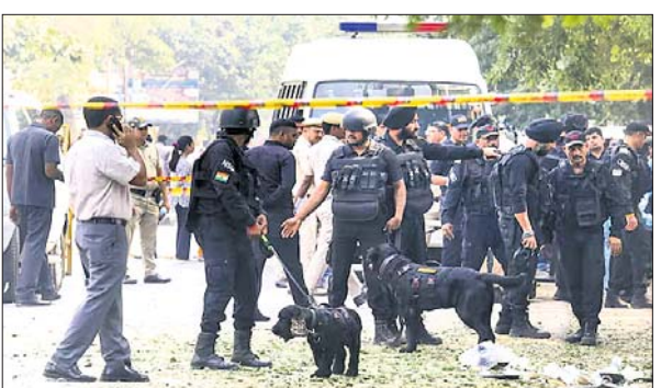
ବୋମା ଧମକ ପରେ ଦିଲ୍ଲୀର ଏକ ସ୍ଥଳରେ ମଙ୍ଗଳବାର ଆର୍ଡି-ସାବୋଟେଜ୍ ଚିମ୍ପି ଯାଞ୍ଚ କରୁଛି।

ସପ୍ତାହେତୁ ଉର୍ଦ୍ଧ୍ୱ ସମୟ ଧରି ଭାରତୀୟ ବିମାନ ଚଳାଚଳ କମ୍ପାନୀର ଫ୍ଲାଇଓଭରକୁ ବୋମାରେ ଉଡ଼ାଇଦେବାକୁ ଧମକ ଆହୁରିବାକୁ ଦେଖାଯାଇଛି। ଏଥିପାଇଁ ଏୟାରଲାଇନିଆରୁ ଚିନ୍ତା କରାଯାଇଛି।