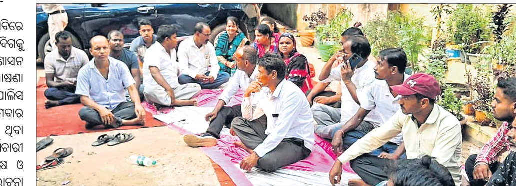
ଅଭିଭାବକମାନେ ଘରୋଇ କଲେଜ ସମ୍ବନ୍ଧରେ ଧାରଣା ଦେଇଛନ୍ତି ।