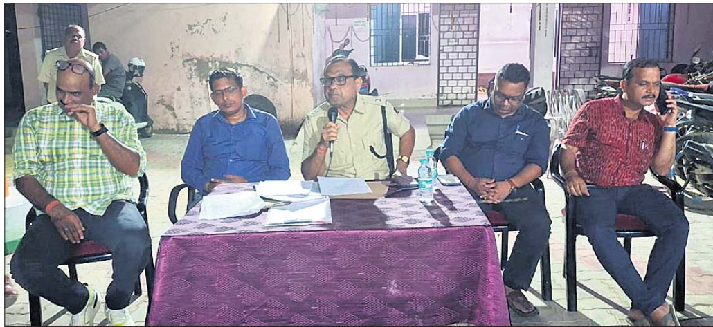
ପ୍ରସ୍ତୁତି ବୈଠକରେ ଯୋଗଦେଇଥିବା ପୂଜା କମିଟି କର୍ମକର୍ତ୍ତା ଓ ପୋଲିସ ଅଧିକାରୀ ।

ଯାଜପୁର ଗଜନ, ୨୨.୧୦ (ପ୍ରମୋଦ ପ୍ରିୟଦର୍ଶିନୀ ମହାନ୍ତି):