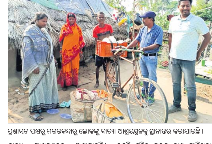
ପ୍ରଶାସନ ପକ୍ଷରୁ ମଗରକନ୍ଦାରୁ ଲୋକଙ୍କୁ ବାଟା ଆଶ୍ରୟସ୍ଥଳକୁ ସ୍ଥାନାନ୍ତରଣ କରାଯାଇଛି ।

ବାଟା ଦାନା ଭୟଙ୍କର ରୂପ ନେଇ ସ୍ଥଳ ଭାଗକୁ ମାଡ଼ି ଆସୁଛି । ଭିତରକନିକାକୁ ଧାମରା ମଧ୍ୟରେ ବାଟା ଉପକୂଳ ଛୁଇଁବ । ଧାମରା ପ୍ରକାଶ ରାଜନଗର ବ୍ଲକର ଚାଳକଙ୍କୁ ଆକ୍ରମଣ କରିବାକୁ ଏହି ବ୍ଲକ ଅଧିକାରୀଙ୍କୁ ପ୍ରଭାବିତ ହେବ ବୋଲି ଆଶଙ୍କା କରାଯାଇଛି । ବିଶେଷକରି ବାସନାପା, ଚାଳକଙ୍କୁ, କେରୁଆପାଳ, ରଜଶା, କୁସୁନଗର, ଖମାରସାହି, ତାଳମାଳ, ଲକ୍ଷ୍ମନପୁର, ଘଡ଼ିଆମାଳ, ଗୁପ୍ତି, ସାତଭାୟା, ବ୍ରାହ୍ମଣସାହି ପ୍ରଭୃତି ପଞ୍ଚାୟତ ଅଧିକ ପ୍ରଭାବିତ ହେବାର ଆଶଙ୍କା ରହିଛି । ମଙ୍ଗଳବାର ପାଗ ଖରାପିଆ ଥିଲେ ମଧ୍ୟ ସମ୍ପାଦକ ବାଉଁଶଗଡ଼ ନଦୀ ସେପଟରେ ଥିବା ମଗରକନ୍ଦାର ଗାଁର ୪୦ ପରିବାରକୁ ଘାଟ ପାର କରି ଓକିଲପାଳ