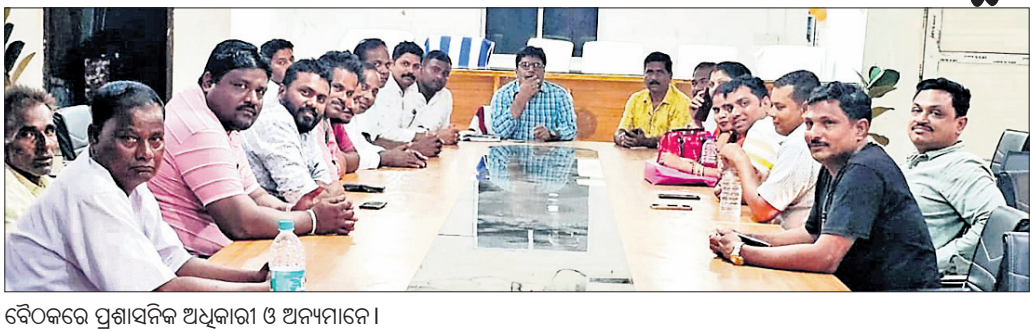
ବୈଠକରେ ପ୍ରଶାସନିକ ଅଧିକାରୀ ଓ ଅନ୍ୟମାନେ।

ପଞ୍ଚାୟତ, ୨୨।୧୦(କଳ୍ପଚରୁ ନାୟକ) ରାଜ୍ୟ ସରକାରଙ୍କ ନିର୍ଦ୍ଦେଶରେ ସମ୍ଭାବ୍ୟ ବାତ୍ୟା 'ଦାନା'କୁ ସଫଳତାର ସହ ପୂର୍ଣ୍ଣାଙ୍ଗ କରିବା ପ୍ରଶାସନିକ ପ୍ରସ୍ତୁତି ଯୋରଦାର କରାଯାଇଛି। ଅନୁରକ୍ଷିତ ଅବସ୍ଥାରେ ଥିବା ଲୋକଙ୍କୁ ସୁରକ୍ଷା ଓ ଅନୁଯାୟୀ ବାତ୍ୟା ଆଶ୍ରୟଗୃହରେ ରଖିବାକୁ ବ୍ୟବସ୍ଥା କରାଯାଇଛି। ପଞ୍ଚାୟତରୁ ବୁକରେ ବେଠାପଡ଼ା, ବାଡ଼କୁଡ଼ିଆ, ବିଲକଣା, କଳକବନ୍ଧ, କୋରିଆପଲ୍ଲୀ, ଶଙ୍କପୁର, ପାଳପାଟଣା, ବଳଭଦ୍ରପୁର ବାଲିପାଟଣା, ବିହାରୀ, ଦାଣ୍ଡିଆ, ଦୋଷିଆ ଆଦି ୧୦ ଗ୍ରାମୀଣ ବାତ୍ୟା ଆଶ୍ରୟଗୃହ ଓ ୨୫ ଟି ବିଭିନ୍ନ ଶୁଳ୍କରେ ଅନୁଯାୟୀ ବାତ୍ୟା ଆଶ୍ରୟଗୃହରେ ଲୋକଙ୍କୁ ଆବଶ୍ୟକ ଖାଦ୍ୟ, ପାନୀୟ ସୁରକ୍ଷିତ ଭାବେ ଅବସ୍ଥାନ ପାଇଁ ପଦକ୍ଷେପ