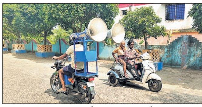
ବୁକ ପ୍ରଶାସନ ପକ୍ଷରୁ ବାତ୍ୟା ଆଶଙ୍କାରେ ମାଲିକ ମାଧ୍ୟମରେ ପ୍ରଚାର କରାଯାଇଛି।

କଳୋପସାଗରରେ ଲକ୍ଷ୍ମୀପୁର ପୁଣି ହୋଇ ବାତ୍ୟା 'ଦାନା'ର ରୂପ ନେଇଥିବା ଭାରତୀୟ ପାଣିପାଗ ବିଭାଗ ପୂର୍ବଦ୍ୱାରା ସୂଚନା ଜାରି କରିଛି। ବିଶେଷକରି କଳୋପସାଗର ଉପକୂଳବର୍ତ୍ତୀ ଜିଲ୍ଲା କେନ୍ଦ୍ରାପଡ଼ାକୁ ରେଡ୍ ସିଗ୍ନାଲ ଡିସ୍ଟର କରାଯାଇଛି। ସମ୍ଭାବ୍ୟ ବାତ୍ୟାର ରୂପରେଖ ଏପର୍ଯ୍ୟନ୍ତ ସ୍ପଷ୍ଟ ହୋଇନାହିଁ। କେଉଁ ଦିଗକୁ ଗତି କରିବ ବୋଲି ଆଶଙ୍କା ପ୍ରକାଶ ପାଇଛି। ହେଲେ ଜିଲ୍ଲା ଓ ବୁକ ପ୍ରଶାସନ ପକ୍ଷରୁ ବ୍ୟାପକ ପ୍ରସ୍ତୁତି ଶେଷ ପର୍ଯ୍ୟାୟରେ ପହଞ୍ଚିଛି। ଉପକୂଳ ଅଞ୍ଚଳରେ ବାତ୍ୟା ଓ ସୁନାମୀ ସଚେତନତା ପାଇଁ ଡାକବାଜି ଯନ୍ତ୍ର ମାଧ୍ୟମରେ ପ୍ରଚାର କରାଯାଇଛି। ତଳିଆ ଅଞ୍ଚଳରେ ଲୋକମାନେ ବାତ୍ୟା ଓ ସୁନାମିକୁ ନିଜରରେ ରଖି ଉଚ୍ଚ ସ୍ଥାନକୁ ସ୍ଥାନାନ୍ତର ପାଇଁ ଟାଣିଟାଣି ବହୁପ୍ରକାର ବାତ୍ୟା ଆଶ୍ରୟଗୃହ, ବିଭିନ୍ନ ବିଧ୍ୟାୟକରେ ପଥପଥ ପାଇଁ କୁହାଯାଇଛି। ବିଶେଷକରି