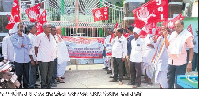
କୂଳକ କାର୍ଯ୍ୟାଳୟ ଆଗରେ ଅଲ୍ ଇଣ୍ଡିଆ କୂଳକ ସଭା ପକ୍ଷରୁ ବିକ୍ଷୋଭ କରାଯାଇଛି।

କୂଳକ କୁଳର ଖାଲୁଆ ଅଞ୍ଚଳ ରୂପେ ବିକାଶ ପାଇବାପରେ ପଞ୍ଚାୟତର ଚଳକଣ ଚୌକା ଓ ନୂଆଗଡ଼ ପଞ୍ଚାୟତର ବିକ୍ଷୟକାରୀଙ୍କୁ, କାମାନାସୀ ଏବଂ ମୁଣ୍ଡାଡ଼ିଆ ଚୌକା ଅଧିବାସୀଙ୍କୁ ସମ୍ପର୍କରେ ବିତ୍ତି ଦାପକ ପ୍ରସାଦ ସ୍ୱାକ୍ଷରରେ ରୁଦ୍ଧି କରାଯାଇଛି। କୁଳକରୁ ୧୦ ବାତ୍ୟା ଆଶ୍ରୟସ୍ଥଳ ଓ ୪ ବନ୍ୟା ଆଶ୍ରୟସ୍ଥଳକୁ ପାନୀୟ ଜଳ ଯୋଗାଣ ବ୍ୟବସ୍ଥା ହୋଇଥିବାବେଳେ ପାଇଁ ଗଣାପଡ଼ିଛି। ରୁପସା ଛାଡ଼ି ଦେଖି