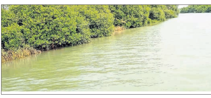
ରାଜନଗର, ୨୨।୧୦(ଭାଷ୍ୟ ରାଜତରାୟ)

ବିଭାଗ ପକ୍ଷରୁ କଣ୍ଠୋଳ କରାଯାଇଛି। ବୁକ ପ୍ରଶାସନ ପକ୍ଷରୁ ପ୍ରତି ବାତ୍ୟା ଆଶ୍ରୟଗୃହରେ ଶୁଖିଲା ଖାଦ୍ୟ, ପାନୀୟ ଜଳ ମହତ୍ତ୍ୱପୂର୍ଣ୍ଣ ଭାବରେ ବ୍ୟବସ୍ଥା ଗ୍ରହଣ କରାଯାଇଛି ବୋଲି ସୂଚନା ଦିଆଯାଇଛି। ଅପରପକ୍ଷରେ ରାଜନ ସାମଗ୍ରୀ ବ୍ୟବସ୍ଥା, ଭରା ବ୍ୟବସ୍ଥା ପୂର୍ଣ୍ଣକାଳୀନ ଭିତ୍ତିରେ ପ୍ରଦାନ କରାଯାଇଛି। ବୁକର ହାଟ ବଜାରରେ ଆଳୁ କିଲୋ ୫୦, ପନିପତା, ତେଲ ଦରଦାମ ଅହେତୁକ ବୁଦ୍ଧି ପାଇଛି ବୋଲି ଖାଉଟିମାନେ କହିଛନ୍ତି। ଜମ୍ବୁ, ରାମନଗର, ବାବର ହାଟ, ଜଗରି କୋର ହାଟ, ଓରଡ଼ ହାଟ, ମଙ୍ଗଳପୁର, ଓସ୍ତର ହାଟ ଆଦି ଅଞ୍ଚଳରେ ଖାଉଟି ଖୁବ୍ଦରା ଦର ବୁଦ୍ଧି ପାଇଛି ବୋଲି ସ୍ଥାନୀୟ ଲୋକେ କହିଛନ୍ତି। ଯୋଗାଣ ବିଭାଗ ଅଧିକାରୀ କଳାବଜାର ରୋକିବାକୁ ପ୍ରଶାସନ ନିକଟରେ ସ୍ଥାନୀୟ ବୁଦ୍ଧିଜୀବୀ ଦାବି କରିଛନ୍ତି। ଆପତ୍ତିକାଳରେ ବାତ୍ୟା ଝଡ଼ ପରିସରରେ ବିପଦ ପରିସାରରେ ଖର୍ଚ୍ଚ ଧାରଣା ପ୍ରଭାବିତ ହେବାର ଆଶଙ୍କା ରହିଛି।