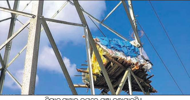
ବିଦ୍ୟୁତ୍ ଟାୱାର ଉପରେ ମଞ୍ଚା ବନ୍ଧାଯାଇଛି ।

ଭଞ୍ଜନଗର ଜିଲ୍ଲା ଭଞ୍ଜନଗର ଗୁପ୍ତସର ଉତ୍ତର ବନଖଣ୍ଡରେ ଲୋକେ ଅବାଧରେ ଜଙ୍ଗଲ ଭିତରକୁ ପ୍ରବେଶ କରୁଛନ୍ତି । କେତେକ ରେଞ୍ଜରେ ଶିକାର ବହୁଥିବା ବେଳେ କେତେକ ସ୍ଥାନରେ ଆବଶ୍ୟକ ଖାଦ୍ୟ ନ ପାଇ ବନମୁଖାମାନେ ଜଙ୍ଗଲରୁ ବାହାରକୁ ଚାଲି ଆସୁଛନ୍ତି । ଏଥିପାଇଁ ବିଭିନ୍ନ ସମୟରେ ମଣିଷ ଓ ବନମୁଖା ମୁହାଁମୁହିଁ ହେଉଛନ୍ତି । ଅନେକ ଧନଜୀବନ କ୍ଷତି ହେଉଛି । ବନମୁଖା ବାଉରୁ ଫସଲକୁ ସୁରକ୍ଷା ଦେବାକୁ ଲୋକେ ଜୀବନକୁ ବାଜି ଲାଗାଇ ଗଛ କିମ୍ବା ବିଦ୍ୟୁତ୍ ଟାୱାରରେ ମଞ୍ଚା କରି ରଖୁଥିବା ଦେଖାଯାଉଛି । ଏପରିକି ୪୪୦ ଭୋଲୁ ଲାଜନ ଯାଇଥିବା ଟାୱାରରେ ମଧ୍ୟ ମଞ୍ଚା ବନ୍ଧାଯାଇଛି । ଅନ୍ୟପଟେ କିଛିଦିନ ହେବ ହାତୀ, ବାଘ ପାଇଁ ବିଭାଗୀୟ କର୍ମଚାରୀଙ୍କ ନିଦ ହଜିଛି । ଗୁପ୍ତସର ଉତ୍ତର