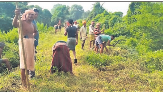
ଗ୍ରାମବାସୀ ମାଳବନ୍ଧ ରାସ୍ତା ସଫା କରୁଛନ୍ତି ।