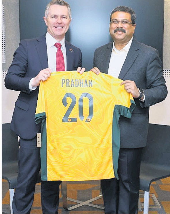
ଅଷ୍ଟ୍ରେଲିଆ ଶିକ୍ଷାମନ୍ତ୍ରୀ ଜେସନ କ୍ଲେୟାରଙ୍କ ସହ କେନ୍ଦ୍ର ଶିକ୍ଷାମନ୍ତ୍ରୀ ଧର୍ମେନ୍ଦ୍ର ପ୍ରଧାନ।

ଭାରତ ଓ ଅଷ୍ଟ୍ରେଲିଆର ମିଳିତ ସହଯୋଗ ୨ ଦେଶର ଜ୍ଞାନ ବ୍ୟବସ୍ଥାକୁ ଆଗକୁ ନେବା ବିଶ୍ୱ ଆହ୍ୱାନର ସମାଧାନ ପାଇଁ