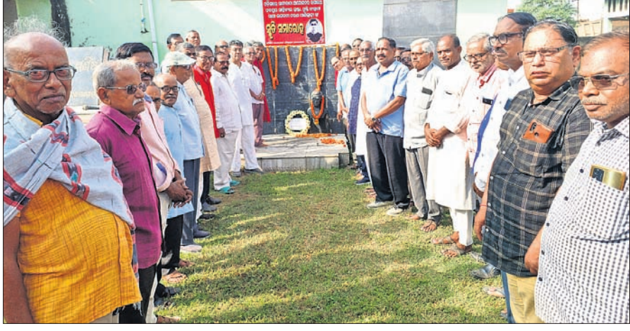
ସାଧନତା ସଂଗ୍ରାମୀ ଭଗବତୀ ଚରଣ ପାଣିଗ୍ରାହୀଙ୍କ ୮୧ତମ ରାଜ୍ୟସ୍ତରୀୟ ସ୍ମୃତି ସମାରୋହ ଅବସରରେ ରୁପସାହର କଳାକାରମାନଙ୍କ ଦ୍ୱାରା ସମାଧିଷ୍ଠିତ ହେଉଥିବା ପାଣିଗ୍ରାହୀଙ୍କ ସ୍ମୃତି ସମାରୋହରେ

ପାଣିଗ୍ରାହୀ ଭଗବତୀ ଚରଣ ପାଣିଗ୍ରାହୀଙ୍କ ୮୧ତମ ରାଜ୍ୟସ୍ତରୀୟ ସ୍ମୃତି ସମାରୋହ ଅବସରରେ ରୁପସାହର କଳାକାରମାନଙ୍କ ଦ୍ୱାରା ସମାଧିଷ୍ଠିତ ହେଉଥିବା ପାଣିଗ୍ରାହୀଙ୍କ ସ୍ମୃତି ସମାରୋହରେ ସମାଧିଷ୍ଠିତ ହେଉଥିବା ପାଣିଗ୍ରାହୀଙ୍କ ସ୍ମୃତି ସମାରୋହରେ