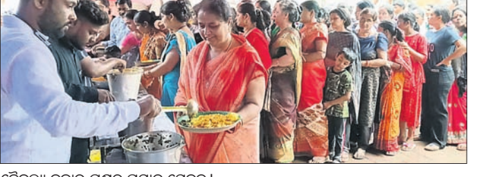
କୈବଲ୍ୟ ବଜାର ପକ୍ଷରୁ ପ୍ରସାଦ ସେବନ ।

ଦେଢ଼ାନାଳ, ୨୫।୧୦(ରତନ ନାୟକ) ଦେଢ଼ାନାଳର ପ୍ରସିଦ୍ଧ ଲକ୍ଷ୍ମୀପୂଜା ଉତ୍ସବରେ ଗୁରୁବାର ଶଙ୍ଖୁଡ଼ି ଭୋଗ ପ୍ରସାଦ ସେବନ ଏକ ନିଆରା ପରମ୍ପରା ଦେଖିବାକୁ ମିଳିଥିଲା । ବିଭିନ୍ନ ପୂଜା ପ୍ରତିଷ୍ଠାନ ପକ୍ଷରୁ ଆୟୋଜିତ ଏହି ପ୍ରସାଦ ସେବନ କାର୍ଯ୍ୟକ୍ରମରେ ଗୁରୁବାର ଶ୍ରଦ୍ଧାଳୁମାନଙ୍କ ନାହିଁ ନ ଥିବା ଭିଡ଼ ଲାଗିଥିଲା । କୈବଲ୍ୟ ବଜାର ପୂଜା ପ୍ରତିଷ୍ଠାନ ପକ୍ଷରୁ ପ୍ରସାଦ ସେବନ ପ୍ରାୟ ୩ହଜାର ଶ୍ରଦ୍ଧାଳୁ ସାମିଲ ହୋଇଥିଲେ । ଶ୍ରଦ୍ଧାଳୁମାନଙ୍କ ମଧ୍ୟରେ ମହିଳାଙ୍କ ସଂଖ୍ୟା ଅଧିକ ଦେଖାଯାଇଥିଲା । ଚଳିତବର୍ଷ କୈବଲ୍ୟ ବଜାର ପୂଜା ପ୍ରତିଷ୍ଠାନ ପକ୍ଷରୁ ଶଙ୍ଖୁଡ଼ି ଭୋଗ ପ୍ରସାଦ ସେବନରେ ଖେଚୁଡ଼ି, ଡାଲମା, ଖଟା, ଶାମ ଓ ଖିରିର ମତା ନେଇଥିଲେ ଶ୍ରଦ୍ଧାଳୁ ।