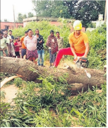
ରାସ୍ତାରେ ପଡ଼ିଥିବା ଗଛକୁ କଟାଯାଇଛି ।