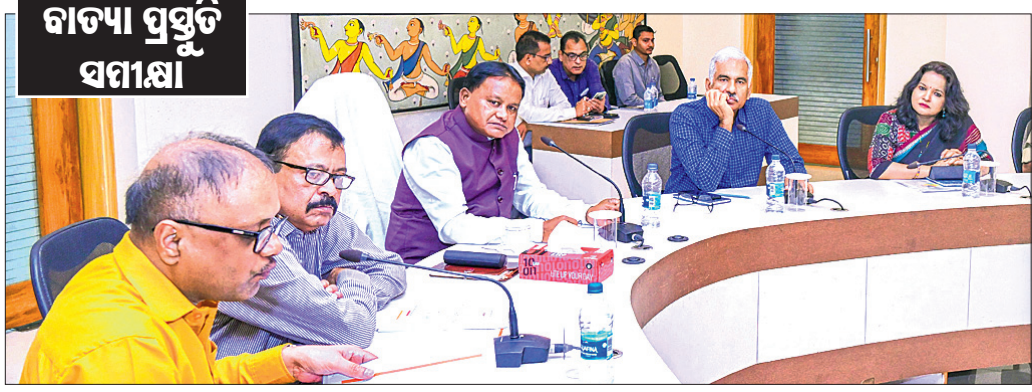
ବାଦ୍ୟ ପ୍ରସ୍ତୁତି ସମୀକ୍ଷା