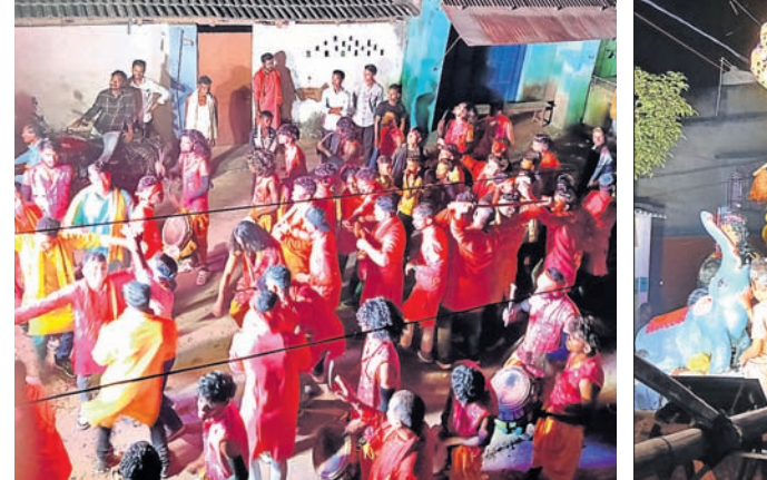
ମା'ଙ୍କୁ ବିସର୍ଜନ ପାଇଁ ଶୋଭାଯାତ୍ରାରେ ନିଆଯାଇଛି।