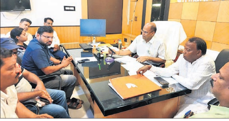
ଦୈଠକରେ ବିଧାୟକ, ଉପଜିଲ୍ଲାପାଳଙ୍କ ସମେତ ଅନ୍ୟମାନେ ।

କାମାକ୍ଷାନଗର, ୨୫।୧୦(ସୁଧାଂଶୁ ପରିଡ଼ା) ଏହି ଦୈଠକରେ ବିଧାୟକ ବାତ୍ୟା ଓ ଏହାର ପରବର୍ତ୍ତୀ ସମୟର ସୁପରିଚାଳନା ପାଇଁ ସମସ୍ତଙ୍କ ସହଯୋଗ କାମନା କରିଥିଲେ । ଗୁରୁବାର ଅପରାହ୍ନ ସୁଦ୍ଧା କାମାକ୍ଷାନଗର ବ୍ଲକରେ ୧୫ଟି ଅଗାଧା ବାତ୍ୟା ଆଘାତଗ୍ରସ୍ତରେ ୩୬୮ ଜଣ ଓ ଏନ୍‌ଏସିର ୩ ଗୋଟି ସ୍ଥାନକୁ ୧୦୪