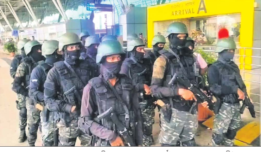
ବୋମା ଧମକ ପରେ ଭୁବନେଶ୍ୱର ବିମାନ ବନ୍ଦରେ ସୁରକ୍ଷା କର୍ମୀଙ୍କ ଦ୍ୱାରା ଯାଞ୍ଚ କରାଯାଇଛି।

ଭୁବନେଶ୍ୱର, ୨୪।୧୦ (ସତ୍ୟକାନ୍ତ ରାଉତ) ସୋସିଆଲ ମିଡ଼ିଆରେ କିଛିଦିନ ମଧ୍ୟରେ ଘରୋଇ ଓ ଅନ୍ତର୍ଜାତୀୟ ସଂସ୍ଥାର ଶତାଧିକ ବିମାନକୁ ବୋମା ଧମକ ଆଘୂଳି। ଏଥିଯୋଗୁ ବିମାନ ସେବା ମଧ୍ୟ ପ୍ରଭାବିତ ହେଉଛି। ଏହା ଏକ ବିଚାଳନକ ସ୍ଥିତି ସୃଷ୍ଟି କରିଥିବାବେଳେ ଗୁରୁବାର ପୁଣି ବୋମା ଧମକ ବିମାନଯାତ୍ରାକୁ ଆଡକିଟ କରିଛି। ବେଙ୍ଗାଳୁରୁରୁ ଭୁବନେଶ୍ୱର ଆସୁଥିବା ଆକାଶୀ ଏୟାର ଫ୍ଲାଇଟକୁ ବୋମା ଧମକ ମିଳିଥିବା ବେଳେ ବେଙ୍ଗାଳୁରୁରୁ ଝାରସୁଗୁଡ଼ା ଆସୁଥିବା ଏକ ଇଣ୍ଡିଗୋ ଫ୍ଲାଇଟକୁ ସମାନ ଧମକ ମିଳିଛି। ବୁକିଟି ଫ୍ଲାଇଟ ନିର୍ଦ୍ଧାରିତ ସମୟରେ ଭୁବନେଶ୍ୱର ବିଜୁ ପଟ୍ଟନାୟକ ଅନ୍ତର୍ଜାତୀୟ ବିମାନ ବନ୍ଦର ଓ ଝାରସୁଗୁଡ଼ା ଏୟାରପୋର୍ଟରେ ପହଞ୍ଚିବା ପରେ ସୁରକ୍ଷା କର୍ମୀଙ୍କ ଦ୍ୱାରା ଯାଞ୍ଚ କରାଯାଇଥିଲା। ପରେ ଏହା ଏକ ଗୁଲ୍ଡ ବୋଲି ଜଣାପଡ଼ିଛି। ତେବେ ଗୋଟିଏ ଦିନରେ ବିଭିନ୍ନ ସ୍ଥାନକୁ ଯାଉଥିବା