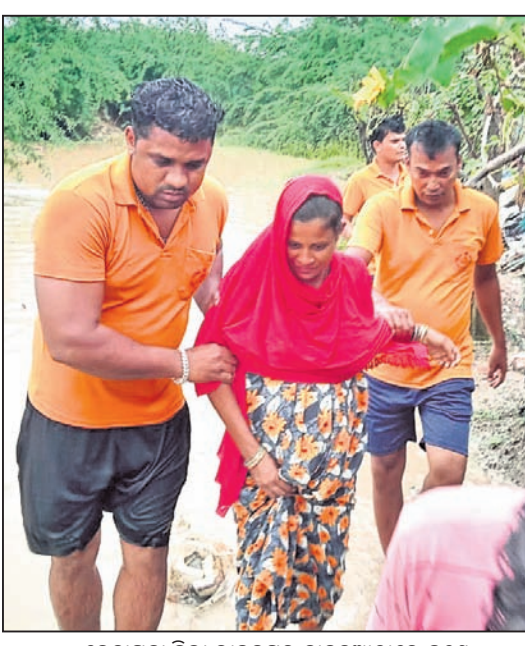
କେନ୍ଦ୍ରାପଡ଼ା ଜିଲା ରାଜନଗର ଚାକରୁଆଠାରେ ଜଣେ ଗର୍ଭବତୀଙ୍କୁ ବାଟ୍ୟା ଆଶ୍ରୟସ୍ଥଳକୁ ନିଆଯାଇଛି ।