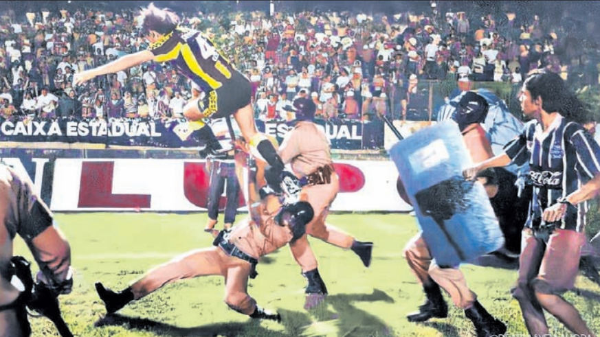
ପୋଲିସକୁ ଆକ୍ରମଣ କରୁଛନ୍ତି ଜଣେ ଦର୍ଶକ।

ରିଓ ଡି ଜେନେରିଓ, ୨୫୧୦(ପି.ଟି.) କୋପା ଲିବାର୍ଡୋର୍ସ ଚୁନାମଣ୍ଡର ସେମି ଫାଇନାଲ ମ୍ୟାଚ୍‌ରେ ପୋଲିସ୍ ଉପରକୁ ଆକ୍ରମଣ ଘଟଣାରେ ୨୫୦ରୁ ଅଧିକ ଉରୁଗୁଏ ଫ୍ୟାନ୍‌ଙ୍କୁ ବ୍ରାଜିଲରେ ଅଟକ ରଖାଯାଇଛି। ଉରୁଗୁଏ କ୍ଲବ ପେନାରୋଲ ଓ ବ୍ରାଜିଲିଆନ୍ କ୍ଲବ ବୋଗାଫୋରୋ ମଧ୍ୟରେ ମ୍ୟାଚ୍ ଖେଳା ଯାଉଥିଲା। ବୋଗାଫୋରୋ