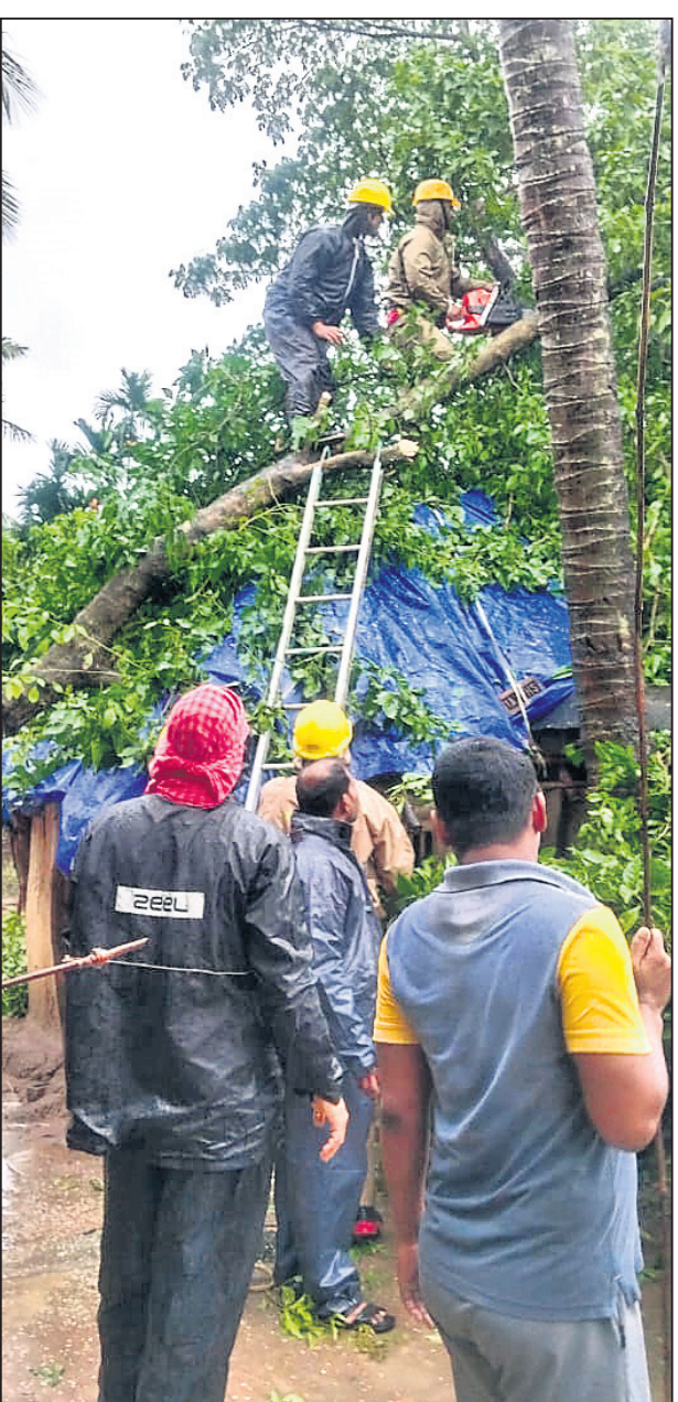
କଗର୍ସିଂହପୁର ଜିଲା କୁଳଙ୍ଗ ବ୍ଲକ ଅନ୍ତର୍ଗତ ନୂଆଗଡ଼ ଗ୍ରାମରେ ଘର ଉପରେ ପଡ଼ିଯାଇଥିବା ଏକ ଗଛକୁ ଓଡ୍ରାଫ୍ ଟିମ୍ ପକ୍ଷରୁ କଟାଯାଇଛି ।