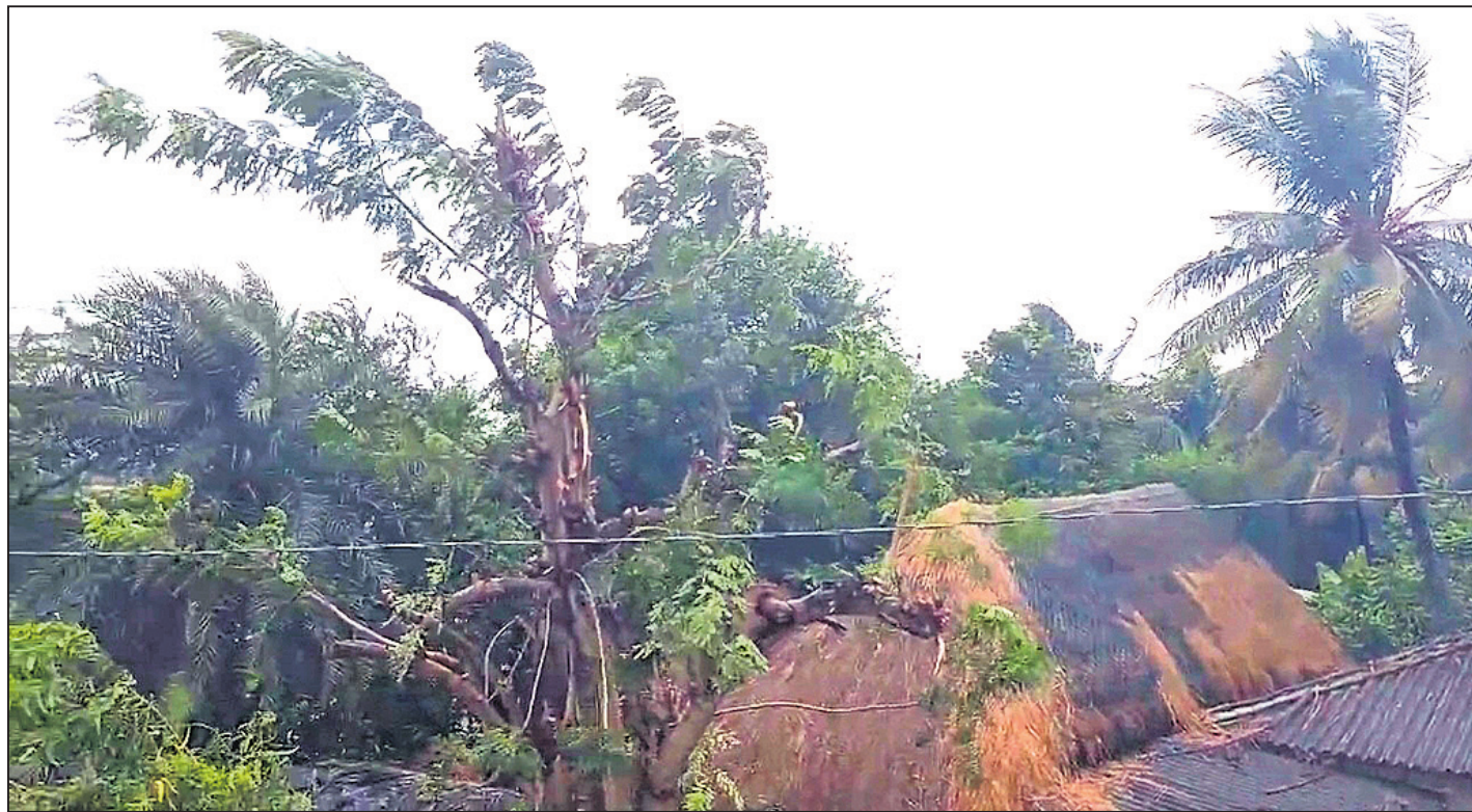
ଚାନ୍ଦବାଲିରେ ପବନରେ ଗଛର ଡାଳ ଭାଙ୍ଗି ଯାଇଛି ।