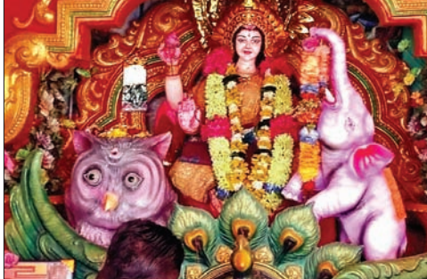
ଇନ୍ଦିପୁର ରାଜପୁଷ୍ପିକ ମେଡ଼ ।

ଦେଢ଼ାନାଳ, ୨୫।୧୦(ରତନ ନାୟକ) ଦେଢ଼ାନାଳ ଜିଲ୍ଲା ଓଡ଼ାପଡ଼ା ବ୍ଲକ ଇନ୍ଦିପୁର ଗ୍ରାମରେ ଚଳିତବର୍ଷ ୨୪ଟି ମଣ୍ଡପରେ ମା' ଲକ୍ଷ୍ମୀଙ୍କ ପୂଜାର୍ଚ୍ଚନା ଅନୁଷ୍ଠିତ ହେଉଛି । ରଜିନ ଆଲୋକମାଳାର ସାକ୍ଷ୍ୟ ଗ୍ରାମରେ ଇନ୍ଦ୍ରପୁରୀ ଭଳି ଭ୍ରମ ସୃଷ୍ଟି କରୁଛି । ପୂଜାକୁ ନେଇ ଗ୍ରାମର ସୁବଗୋଷ୍ଠୀ ଉତ୍ସାହିତ ହୋଇପଡ଼ିଛନ୍ତି । ୧୯୬୭ ମସିହାରେ ଗ୍ରାମରେ ରାଜ ପୂଷ୍ପିକ