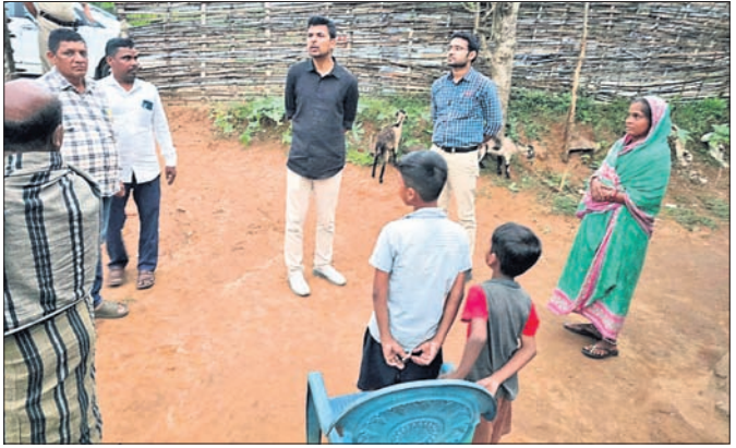
କଟାଯାଇଥିବା ହିନ୍ଦୋଳ ବ୍ଲକର ଏକ ପରିବାରଙ୍କ ସହ ଜିଲ୍ଲାପାଳ କଥା ହେଉଛନ୍ତି ।