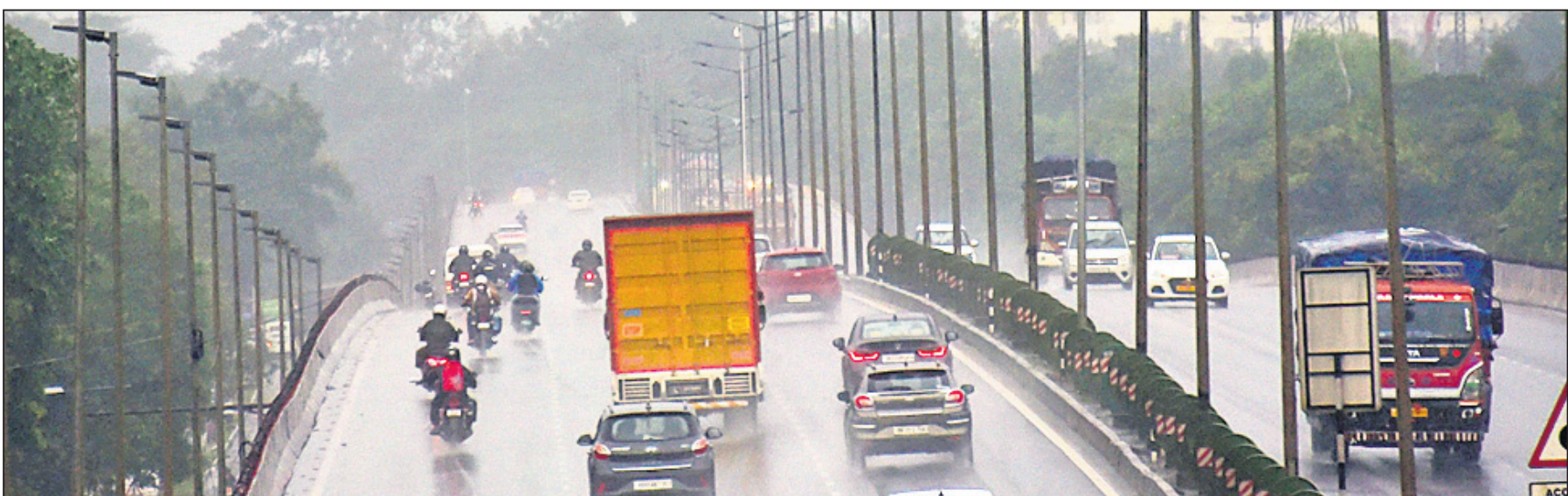
ଗୁରୁବାର ଅପରାହ୍ନରେ ଭୁବନେଶ୍ୱରର ମୁଖ୍ୟ ରାସ୍ତାରେ ବର୍ଷାର ବୃଷ୍ଟ୍ୟ ।