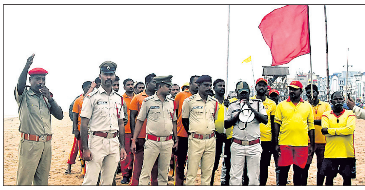
ପୁରୀ ସମୁଦ୍ର ଅଣାନ୍ଦ ଥିବାକୁ ଗୁରୁବାର ପର୍ଯ୍ୟନ୍ତକେବଳ ସମୁଦ୍ରକୁ ନ ଯିବା ପାଇଁ ଅଗ୍ନିଶମ କର୍ମଚାରୀ ଓ ଲାଇଫଗାର୍ଡମାନେ ସଚେତନ କରାଇଛନ୍ତି ।