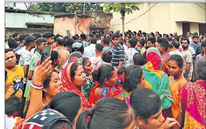
ଘଟଣାସ୍ଥଳରେ ଲୋକଙ୍କ ଭିଡ଼।