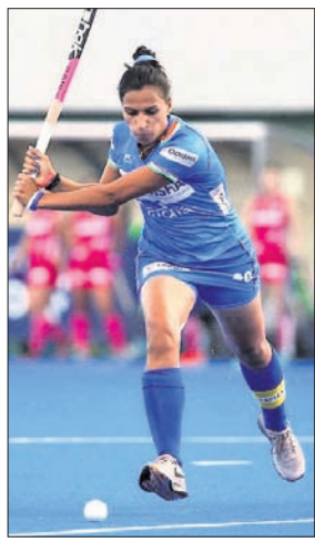
ଖେଳିବା ଏକ ସ୍ମରଣୀୟ ଯାତ୍ରା। ଭାରତୀୟ ମଧ୍ୟରେ ବଡ଼ ହୋଇଥିବା ବେଳେ ଦେଶର ପ୍ରତିନିଧିତ୍ୱ କରିବା ସର୍ବଦା ଲକ୍ଷ୍ୟ ରହିଥିଲା। ଦେଶର ପ୍ରତିନିଧିତ୍ୱ କରିବାର ସୁଯୋଗ ମିଳିଥିବା ବେଳେ ପୂର୍ଣ୍ଣ ସର୍ବଦା ଗର୍ବିତ।

ଭାରତୀୟ ମହିଳା ହକି ଦଳର ପୂର୍ବତନ ଅଧିନାୟିକା ରାଣୀ ରାମ୍ପାଲ ଚୁରୁବାର ଅନ୍ତର୍ଜାତୀୟ ହକିରୁ ଅବସର ଘୋଷଣା କରିଛନ୍ତି। ହରିୟାଣାର ଏକ ଛୋଟ ସହରରୁ ଆସି ହକି ଖେଳିବା ସହ ଭାରତୀୟ ଦଳର ନେତୃତ୍ୱ ନେଇଥିଲେ। ଦୀର୍ଘ ୧୬ ବର୍ଷ ଧରି ଭାରତ ପାଇଁ ଖେଳିବା ପରେ ରାଣୀ ଅବସର ଘୋଷଣା କରିଛନ୍ତି। ଭାରତୀୟ ହକିର ଶ୍ରେଷ୍ଠ ଅଧିନାୟିକା ଭାବରେ ୨୯ ବର୍ଷୀୟା ରାଣୀଙ୍କ ନେତୃତ୍ୱରେ ଅଲିମ୍ପିକ୍‌ସରେ ଭାରତ ଏହାର ସର୍ବଶ୍ରେଷ୍ଠ ପ୍ରଦର୍ଶନ କରିଥିଲା। ୨୦୨୧ ଚୋଲିଓ ଅଲିମ୍ପିକ୍‌ସରେ ଭାରତ ଚତୁର୍ଥ ସ୍ଥାନରେ ଅଭିଯାନ ଶେଷ କରିଥିଲା। ଏକ ଖବରଦାତା ସମ୍ମିଳନୀ କରି ସେ ନିଜର ଅବସର ଘୋଷଣା କରିଛନ୍ତି। ଭାରତ ପକ୍ଷରୁ