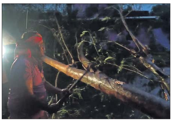
ରାଜନଗର ବୁକ ଚାଳକଗୁଡ଼ିଆ-ଡାଙ୍ଗମାଳ ରାସ୍ତାରେ ଭାଙ୍ଗିପଡ଼ିଥିବା ଗଛକୁ କଟାଯାଇଛି।

ବାତ୍ୟା ଦାନା ଭିତରକନିକା-ଧାମରା ମଧ୍ୟରେ ଥିବା ରାଜନଗର ବୁକର ଚାଳକଗୁଡ଼ିଆରେ ମାଡ଼ ହେବ ବୋଲି ପାଣିପାଗ ବିଭାଗ ପୂର୍ବାନୁମାନ କରିଛି। ଗୁରୁବାର ସକାଳୁ ଚାଳକଗୁଡ଼ିଆରେ ବର୍ଷା ସହ ପବନ ଲାଗିରହିଛି। ବୈତରଣୀ ନଦୀ ଓ ଧାମରା ପୁଣ୍ୟସା ପାର୍ବତ୍ରିକ ଉଚ୍ଚ ଜୁଆର ଉଠୁଛି। ଉଚ୍ଚ ଜୁଆର ଭିତରକନିକାର ଜୁଣା ଜଙ୍ଗଲ ଉପରେ ମାଡ଼ ହେଉଛି। ଉଚ୍ଚ ଜୁଆର ଯୋଗୁ ନଦୀ କୂଳରେ ବନ୍ଧା ହୋଇଥିବା ଟ୍ରାକର ଓ ଭୁବନେଶ୍ୱର ମଧ୍ୟରେ ପାଣି ପଶିଯାଇଛି। ଚାଳକଗୁଡ଼ିଆ ଘାଟ ରାସ୍ତା ଉପରେ ଜୁଆର ପାଣି ଚାଲି ଆସୁଛି। ଅପରାହ୍ନ ସୁଦ୍ଧା ତୁହାକୁ