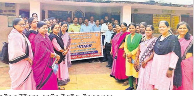
ପ୍ରଶିକ୍ଷଣ ଶିବିରରେ ଉପସ୍ଥିତ ଶିକ୍ଷୟିତ୍ରୀ ଶିକ୍ଷକମାନେ ।

ଦେଢ଼ାନାଳ, ୨୫।୧୦(ରତନ ନାୟକ) ଦେଢ଼ାନାଳ ସଦର ବ୍ଲକ ବାଲ୍ୟାୟା ଉ.ପ୍ରା. ବିଦ୍ୟାଳୟରେ ଶିକ୍ଷକ ପ୍ରଶିକ୍ଷଣ ଶିବିର ୨୧ରୁ ୨୩ ତାରିଖ ପର୍ଯ୍ୟନ୍ତ ଅନୁଷ୍ଠିତ ହୋଇଯାଇଛି । ଶିବିରରେ ଶିକ୍ଷକ ନେତୃତ୍ୱ, ଶିକ୍ଷକମାନଙ୍କ ବିକାଶମୂଳକ ମନୋବୃତ୍ତି, ସାମାଜିକ, ଆବେଦିକ ଓ ନୈତିକ ଶିକ୍ଷା, ହାତ୍ସାୟ ସୃଷ୍ଟି, ଅଭିବ୍ୟକ୍ତି ଶିକ୍ଷା, ବସ୍ତାନି ବିହୀନ ପାଠପଢ଼ା ବିସୟ, ସାମାଜିକ ଲିଙ୍ଗଭିତ୍ତିକ ସମତା ପାଇଁ ପ୍ରୟାସ, ଜାତୀୟ ଉପଲବ୍ଧି ସର୍ବେକ୍ଷଣ, ମାସିକ ପାଠ୍ୟ ଖସଡ଼ା ଯୋଜନା, ଚାକ୍ଷୁଷ ବିକାଶ ସହାୟକ, ସାକ୍ଷର ପୁରସ୍କା