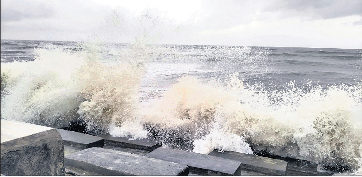
ଦୀପା ବେଳାଭୂମିରେ ଥିବା ସୁରକ୍ଷା ବନ୍ଧରେ ଭୁଆରମାଡ଼ ।