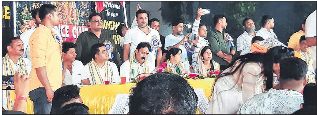
ଆଜ୍ଞାଳତ୍ୱ ନିର୍ଲାମ କାର୍ଯ୍ୟକ୍ରମରେ ମଞ୍ଚାସୀନ ଅତିଥିମାନେ।