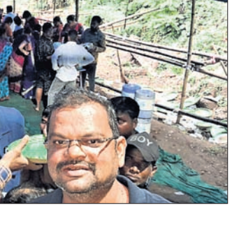
ମହାବୀର ବଜାର ପକ୍ଷରୁ ପ୍ରସାଦ ସେବନ ।

ମହାବୀର ବଜାରରେ ଖେଚୁଡ଼ି, ଡାଲମା, ଖଟା ଓ ଶାମର ମତା ନେଇଥିଲେ ଶ୍ରଦ୍ଧାଳୁ । ବନମାଳୀ ପ୍ରସାଦ, ପଦ୍ମବଜାର ଓ ସ୍ୱପ୍ନେଶ୍ୱର ବଜାର ପୂଜା ପ୍ରତିଷ୍ଠାନ ପକ୍ଷରୁ ମଧ୍ୟ ପ୍ରସାଦ ସେବନ କାର୍ଯ୍ୟକ୍ରମ ଅନୁଷ୍ଠିତ ହୋଇଥିଲା । ବାତ୍ୟାକୁ ଦେଖି ପ୍ରଶାସନ ପକ୍ଷରୁ ପୂଜା ପ୍ରତିଷ୍ଠାନ ରୁଚିକରେ ସମସ୍ତ ସାକ୍ଷ୍ୟରୁ ଓ ଶ୍ରଦ୍ଧାଳୁ ସାମିଲ ହୋଇଥିଲେ । ଚଳିତବର୍ଷ ଗୁରୁବାର ଶଙ୍ଖୁଡ଼ି ପ୍ରସାଦ ସେବନରେ ବ୍ୟବସ୍ଥା କରାଯାଇଥିଲା । ସେହିପରି ଶ୍ରଦ୍ଧାଳୁ ନାହିଁ ନ ଥିବା ଭିଡ଼ ହୋଇଥିଲା ।