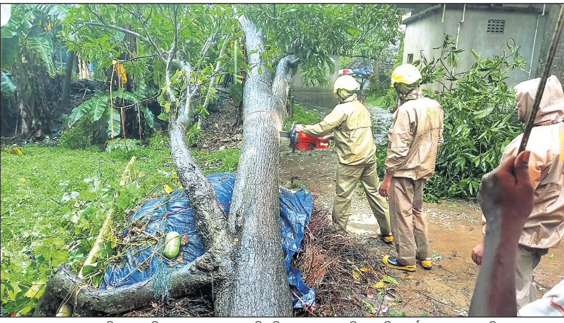
କେନ୍ଦ୍ରାପଡ଼ା ଜିଲା ରାଜକନିକାରେ ରାସ୍ତା ଉପରେ ଉତ୍ତୁଡ଼ି ପଡ଼ିଥିବା ଏକ ଗଛକୁ ଅଗ୍ନିଶମ ବାହିନୀ କର୍ମଚାରୀମାନେ କାଟୁଛନ୍ତି ।