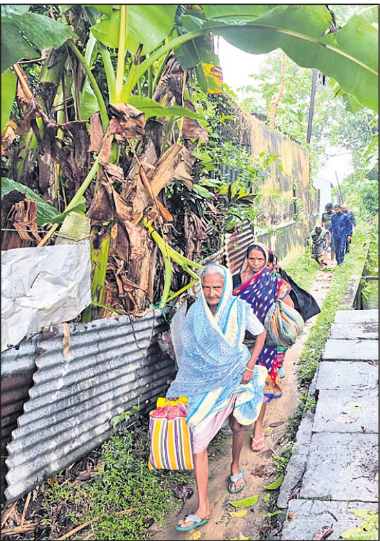
ଭଦ୍ରକ ଜିଲା ଧାମରାରେ ଲୋକେ ଜିନିଷ ଧରି ବାଟ୍ୟା ଆଶ୍ରୟସ୍ଥଳକୁ ଯାଉଛନ୍ତି ।