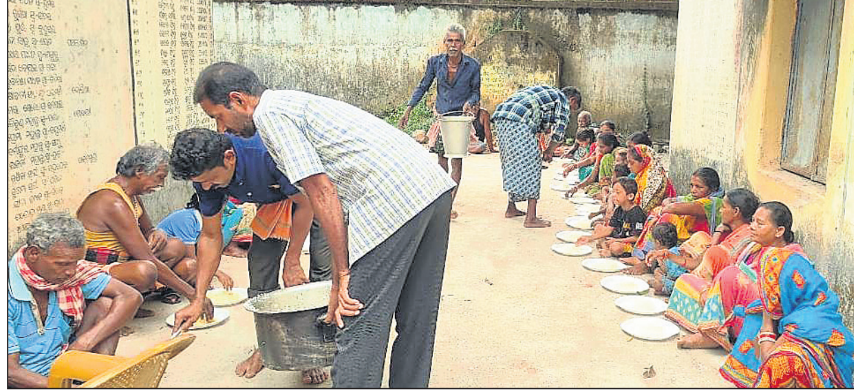
ଡେକାନାଲ ଜିଲାର ଏକ ବାଟ୍ୟା ଆଶ୍ରୟ ସ୍ଥଳରେ ଲୋକଙ୍କୁ ରନ୍ଧାଖାଦ୍ୟ ଦିଆଯାଇଛି ।