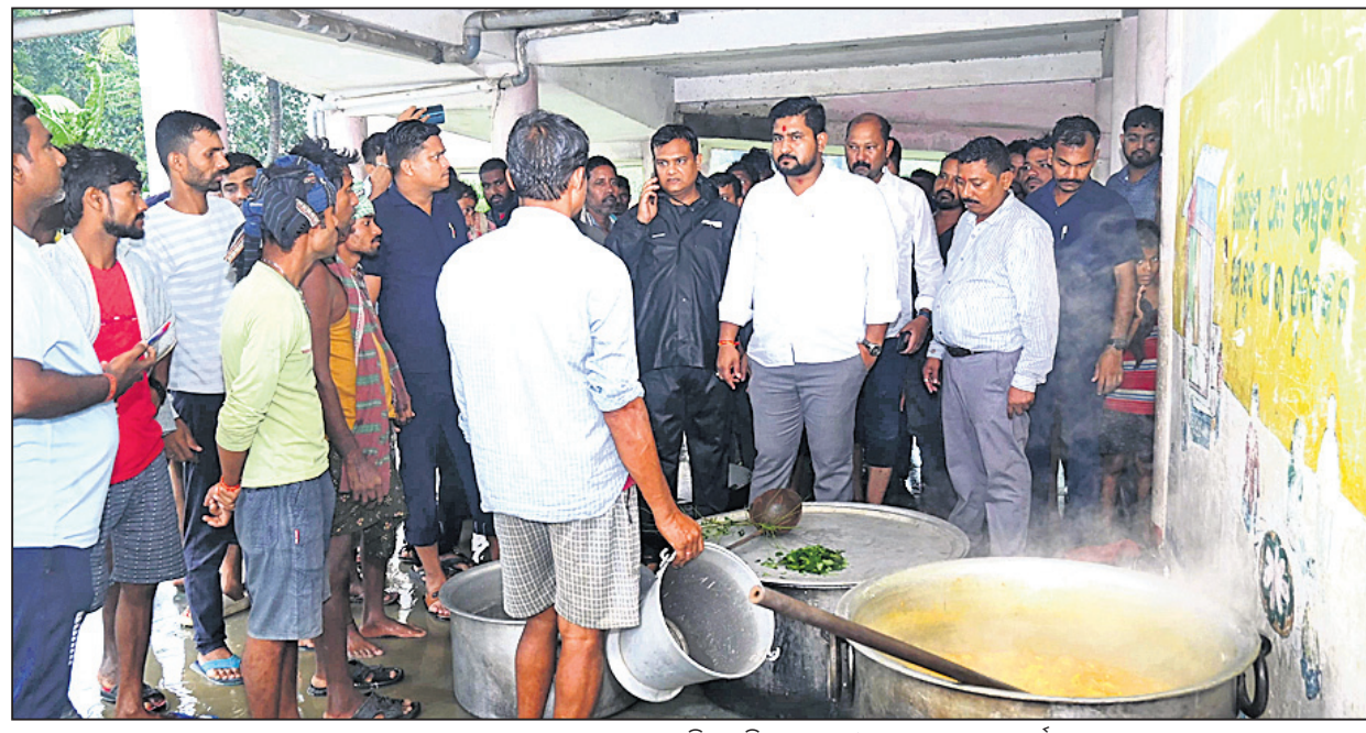
ଧାମରାର ଏକ ଆଶ୍ରୟସ୍ଥଳରେ ରନ୍ଧାଖାଦ୍ୟ ବ୍ୟବସ୍ଥା ଅନୁଧ୍ୟାନ କରୁଛନ୍ତି ଉଚ୍ଚଶିକ୍ଷା, କ୍ରୀଡ଼ା ଓ ଯୁବସେବା ମନ୍ତ୍ରୀ ସୂର୍ଯ୍ୟବଂଶୀ ସୁରକ ।