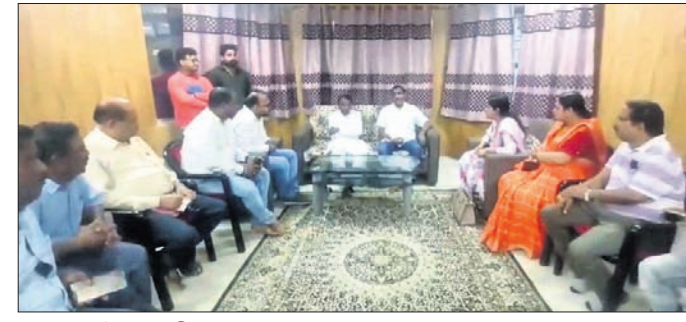
ସମାଜା ଦୈଠକରେ ବିଧାୟକଙ୍କ ସହ ଅଧିକାରୀମାନେ ।