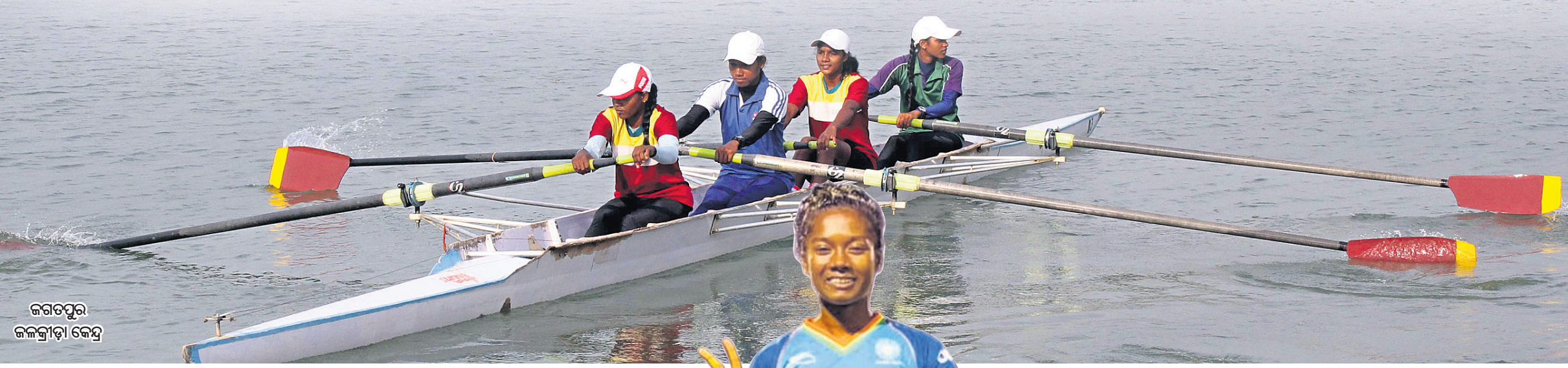
ଜଗତପୁର ଜଳକ୍ରୀଡ଼ା କେନ୍ଦ୍ର