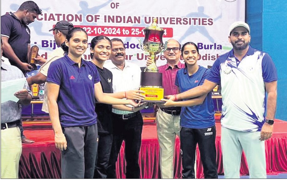
ଅତିଥିକ ରଘୁଶର ଚାମ୍ପିୟନ କିଟ୍ ଦଳ।

ସମ୍ପର୍କରେ ଅନୁଷ୍ଠିତ କଳ୍ପ ଜୋର୍ ଆନ୍ତର୍ ବିଶ୍ୱବିଦ୍ୟାଳୟ ମହିଳା ବ୍ୟାଡମିଣ୍ଟନ ଚାମ୍ପିୟନ ଆଖ୍ୟା ଅର୍ଜନ କରିଛି କିଟ୍ ବିଶ୍ୱବିଦ୍ୟାଳୟ।