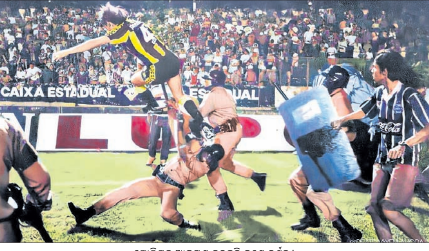
ପୋଲିସକୁ ଆକ୍ରମଣ କରୁଛନ୍ତି ଜଣେ ଦର୍ଶକ।

ରିଓ ଡି ଜେନେରିଓ, ୨୫୧୦(ପି.ଟି.) କୋପା ଲିବାର୍ଡୋର୍ସ ଚୁନିମେଣ୍ଟର ସେମି ଫାଇନାଲ ମ୍ୟାଚ୍ରେ ପୋଲିସ୍ ଉପରକୁ ଆକ୍ରମଣ ଘଟଣାରେ ୨୫୦ରୁ ଅଧିକ ଉତ୍ତୁରୁଏ ଫ୍ୟାନଙ୍କୁ ବ୍ରାଜିଲରେ ଅଟକ ରଖାଯାଇଛି। ଉତ୍ତୁରୁଏ କ୍ଲବ ପେନାରୋଲ ଓ ବ୍ରାଜିଲିଆନ୍ କ୍ଲବ ବୋଗାଫୋରୋ ମଧ୍ୟରେ ମ୍ୟାଚ୍ ଖେଳା ଯାଉଥିଲା। ବୋଗାଫୋରୋ