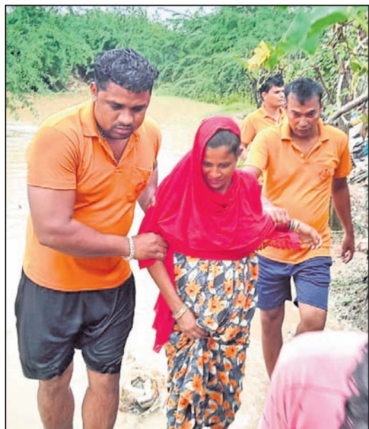
କେନ୍ଦ୍ରାପଡ଼ା ଜିଲା ରାଜନଗର ଚାକରୁଆଠାରେ ଜଣେ ଗର୍ଭବତୀଙ୍କୁ ବାଟ୍ୟା ଆଶ୍ରୟସ୍ଥଳକୁ ନିଆଯାଇଛି ।