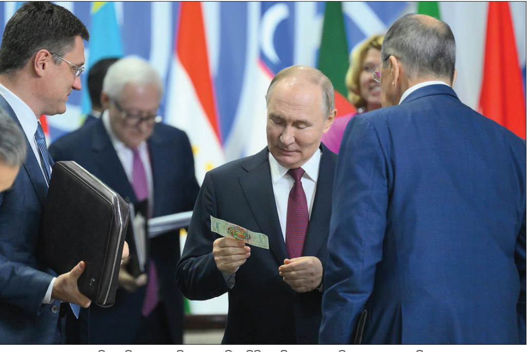
ବ୍ରହ୍ମ ବ୍ୟାଙ୍କନୋଟ୍ ରୁଷିଆ ରାଷ୍ଟ୍ରପତି ଭାଣ୍ଡୁରୀଙ୍କୁ ପୂର୍ବରୁ ଏକ କରେନ୍ସି ନୋଟ୍ ଦେଖାଉଛନ୍ତି।