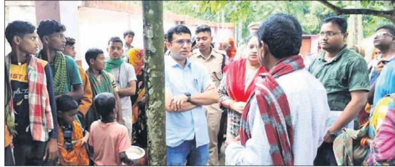
ବାତ୍ୟା ଆଶ୍ରୟସ୍ଥଳରେ ଜିଲ୍ଲାପାଳ ଓ ସର୍ବି।

ବାତ୍ୟା 'ଦାନା' ପ୍ରଭାବରେ ବାଲେଶ୍ୱରରେ ଆରମ୍ଭ ହୋଇଛି ବର୍ଷା ଓ ପବନ। ଜିଲ୍ଲା ପ୍ରଶାସନ ପକ୍ଷରୁ ଜରୁରୀକାଳୀନ ସହାୟତା ନିମନ୍ତେ ବ୍ୟବସ୍ଥା କରାଯାଇଛି। ଜିଲ୍ଲା ଅଧୀନ ସମସ୍ତ ବ୍ଲକ୍ ଓ ପୌରାଞ୍ଚଳର ତଳିଆ ଅଞ୍ଚଳକୁ ୧ଲକ୍ଷ ୩୪ହଜାର ୯୯ଜଣ ଲୋକଙ୍କୁ ଗୁରୁବାର ୧୪୪ଟି ବାତ୍ୟା ଆଶ୍ରୟସ୍ଥଳ ଓ ୭୨୮ଟି ବିକଳ ସୁରକ୍ଷିତ ଆଶ୍ରୟସ୍ଥଳକୁ ସ୍ଥାନାନ୍ତର କରାଯାଇଛି। ଜିଲ୍ଲାରେ