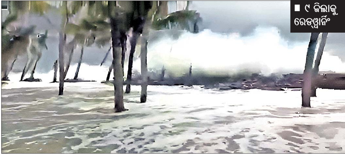
ବାତ୍ୟା ପ୍ରଭାବରେ କେନ୍ଦ୍ରାପଡ଼ା ଜିଲ୍ଲା ରାଜନଗର ବୁକ ପେଣ୍ଠାରେ ଗୁରୁବାର ଅପରାହ୍ନରେ ସାମୁଦ୍ରିକ ଜୁଆର ମାଡ଼।

ଭୁବନେଶ୍ୱର, ୨୪।୧୦ (ଅନିଲ ଦାସ) ପୂର୍ବ-କେନ୍ଦ୍ରୀୟ ବଙ୍ଗୋପ ସାଗରରେ ସୃଷ୍ଟି ହୋଇଥିବା ବାତ୍ୟା (ଦାନା) ପ୍ରଭାବରେ ଗୁରୁବାର ଉପକୂଳବର୍ତ୍ତୀ ଜିଲ୍ଲାଗୁଡ଼ିକରେ ବର୍ଷା, ପବନ ଲାଗି ରହିଛି। ଆଞ୍ଚଳିକ ପାଣିପାଗ କାର୍ଯ୍ୟାଳୟ ସୂଚନା ଅନୁଯାୟୀ ଗୁରୁବାର ପାରାଦୀପରେ ୨୨.୯ ମିଲିମିଟର ବର୍ଷା ରେକର୍ଡ କରାଯାଇଥିବା ବେଳେ ଗାନ୍ଧିବାଲିରେ ୪୬.୨, ରାଜକନିକା ୨୭, ରାଜନଗର ୨୪, ନୀଳଗିରି ୨୩, ପଟ୍ଟାମୁଣ୍ଡା ୨୨.୫, ଯୋଗୋ ୧୯, ବେତନଗା ୧୯, ଓଡ଼ପଦା ୧୮, ଧାମନଗର ୧୬, ସାରସକଣାରେ ୧୬ ମିଲିମିଟର ବର୍ଷା ରେକର୍ଡ କରାଯାଇଛି। ଶୁକ୍ରବାର କେନ୍ଦୁଝର, ଅନୁଗୋଳ, କେନ୍ଦ୍ରାପଡ଼ା, ଜଗତସିଂହପୁର, କଟକ, ଖୋର୍ଦ୍ଧା, ଡେଙ୍କାନାଳ, ଯାଜପୁର ଓ ପୁରୀ ଜିଲ୍ଲା କେତେକ ସ୍ଥାନରେ ୨୦ ସେଣ୍ଟିମିଟରରୁ ଅଧିକ ବର୍ଷା ହେବାର ସମ୍ଭାବନା ରହିଛି। ଏହି ସବୁ ଜିଲ୍ଲା ପାଇଁ ରେଡ୍ ଓ ଅଙ୍ଗୁଳ ଚିହ୍ନ ଦିଆଯାଇଛି।