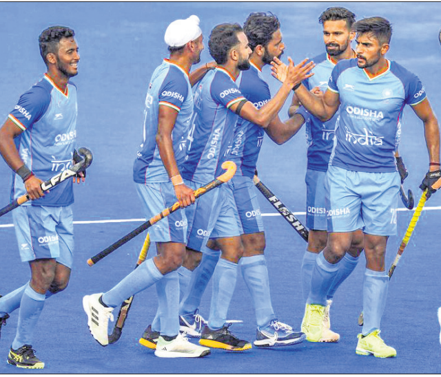
ଗୋଲ୍ ଫିଲ୍ଡରେ ଭାରତୀୟ ଦଳର ସଭ୍ୟମାନେ।