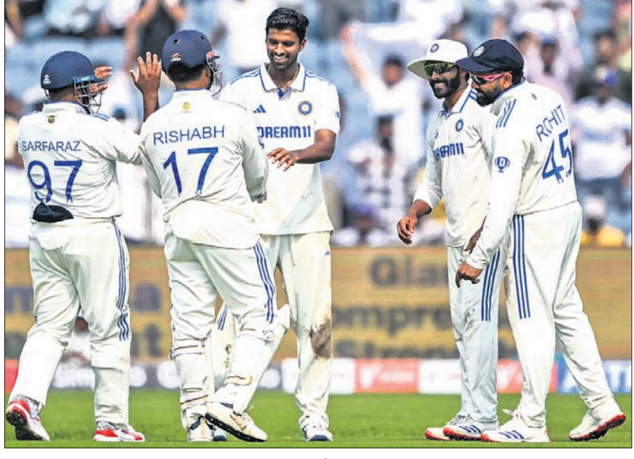
ଉଇକେଟ ନେବା ପରେ ଖୁବ୍ ଶୀଘ୍ର ଫୁଲ ଟପ୍ସ ବସେଇ।

ଭାରତ ବିପକ୍ଷ ଦ୍ୱିତୀୟ ଟେଷ୍ଟ ମ୍ୟାଚରେ ଦୁଧିଲୀଘ କ୍ରିକେଟ ଦଳ ୨୫୯ ରନରେ ଅଲଆଉଟ ହୋଇଛି। ଜବାବରେ ପ୍ରଥମ ଦିନର ଷ୍ଟ୍ରୀକ୍ସ ଅପସାରଣ ବେଳକୁ ଭାରତ ୧୭ ରନ ଷ୍ଟୋର କରିଛି। ଭାରତ ପକ୍ଷରୁ ଖୁବ୍ ଶୀଘ୍ର ଫୁଲ ଟପ୍ସ ବୋଲି କରି ୬ ଉଇକେଟ ନେଇଛନ୍ତି। ଭାରତ ଏହି ମ୍ୟାଚରେ ଲୋକେଶ ରାହୁଲ, କୁଲଦୀପ ଯାଦବ ଓ ମହମ୍ମଦ ସିରାଜଙ୍କ ଗୁମରେ ଉତ୍ତମାନ୍ ଟିଲ୍, ଖୁବ୍ ଶୀଘ୍ର ଫୁଲ ଟପ୍ସ ଓ ଆକାଶ ଦାସଙ୍କୁ ଖେଳାଇଥିଲା।