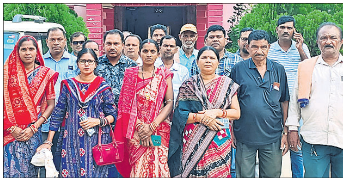
ପ୍ରତିବାଦରତ ଆଗଲପୁର ବ୍ଲକ୍ ସରପଞ୍ଚ ସଂଘ ସଦସ୍ୟ।

ରକ୍ଷଣାବେକ୍ଷଣ କାମ ପାଇଁ ପଞ୍ଚାୟତ ପକ୍ଷରୁ ସମଗ୍ର ଶିକ୍ଷା ଅଭିଯାନ ନାମରେ ଗୋଟିଏ ଲେଖାଏ ପାଠ୍ୟପୁସ୍ତକ ଖୋଲି ଦିଆଯାଇଛି। ଏବେ ବ୍ଲକ୍ ପ୍ରଶାସନ ପକ୍ଷରୁ ସରପଞ୍ଚମାନଙ୍କୁ ଅଣବେଶାକରି ପଞ୍ଚାୟତ ବାହାରର ଠିକାଦାର ଲଗାଇ କାମ ସମ୍ପାଦନ କରାଯାଉଛି। ମରାମତି କାମ ନିମ୍ନମାନର ହେଉଥିବାରୁ ସରପଞ୍ଚମାନେ ଅସନ୍ତୋଷ ବ୍ୟକ୍ତ କରିଛନ୍ତି। ସରକାର ପଞ୍ଚାୟତକୁ କ୍ଷମତା କେନ୍ଦ୍ରୀଭୂତ କରୁଥିବା କହୁଥିବାବେଳେ ବ୍ଲକ୍ ପ୍ରଶାସନର ଏପରି ନିମ୍ନମୁଖ୍ୟ କାର୍ଯ୍ୟ ପ୍ରତିବାଦରେ ରୁଧିରୀ ସଂଘ ସଦସ୍ୟ ଏକାଠି ହୋଇଥିବା ସେମାନେ କହିଛନ୍ତି। ଏସମ୍ଭବରେ ବିଭିନ୍ନ କୁଳଦାପ ମହାନ୍ତିଙ୍କୁ ଯୋଗାଇ ଦିଆଯାଇଛି। ଏହିକ୍ରମରେ ଆଗଲପୁର ବ୍ଲକ୍ ୩୨ ଲକ୍ଷ ୪୦ହଜାର ଅନୁଦାନ ମିଳିଛି। ସରପଞ୍ଚ ସଂଘର କହିବା ଅନୁଯାୟୀ, ସରକାରଙ୍କ ପତ୍ର ପୂର୍ତ୍ତାବକ ଉପରୋକ୍ତ ମରାମତି ଓ