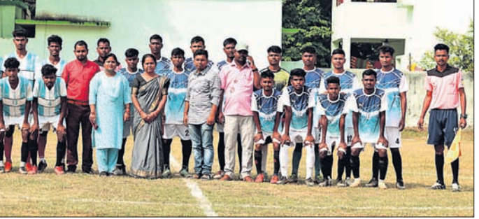
ଅତିଥିଙ୍କ ସହ ପ୍ରତିଯୋଗିତାରେ ଭାଗନେଇଥିବା ଖେଳାଳି।

ହେବ ବୋଲି ସୂଚନା ଦିଆଯାଇଥିଲା। ନଭେମ୍ବର ୧ ସକାଳ ୮ଟାରୁ ସଂସ୍କୃତିକ ଶୋଭାଯାତ୍ରା ଆରମ୍ଭ ହୋଇ ସହର ପରିକ୍ରମା କରିବ। ପରେ ରତ୍ନଦାନ ଶିବିର ଅନୁଷ୍ଠିତ ହେବ। ବଲାଙ୍ଗୀର କୋଶଳ କଳାମଣ୍ଡଳ ପଡ଼ିଆକୁ ସଂସ୍କୃତିକ ଶୋଭାଯାତ୍ରା ବାହାରି ସମଲୋକ