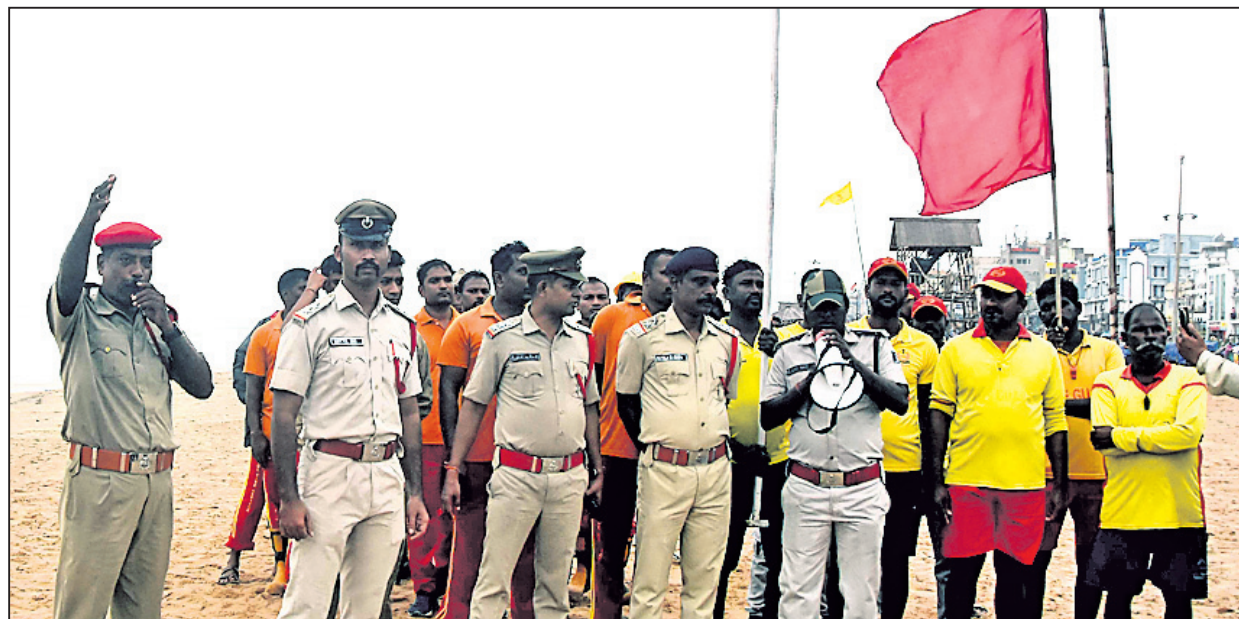
ପୁରୀ ସମୁଦ୍ର ଅଣାନ୍ଦ ଥିବାକୁ ଗୁରୁବାର ପର୍ଯ୍ୟନ୍ତକେବଳ ସମୁଦ୍ରକୁ ନ ଯିବା ପାଇଁ ଅଗ୍ନିଶମ କର୍ମଚାରୀ ଓ ଲାଇଫ୍‌ଗାର୍ଡମାନେ ସଚେତନ କରାଇଛନ୍ତି ।