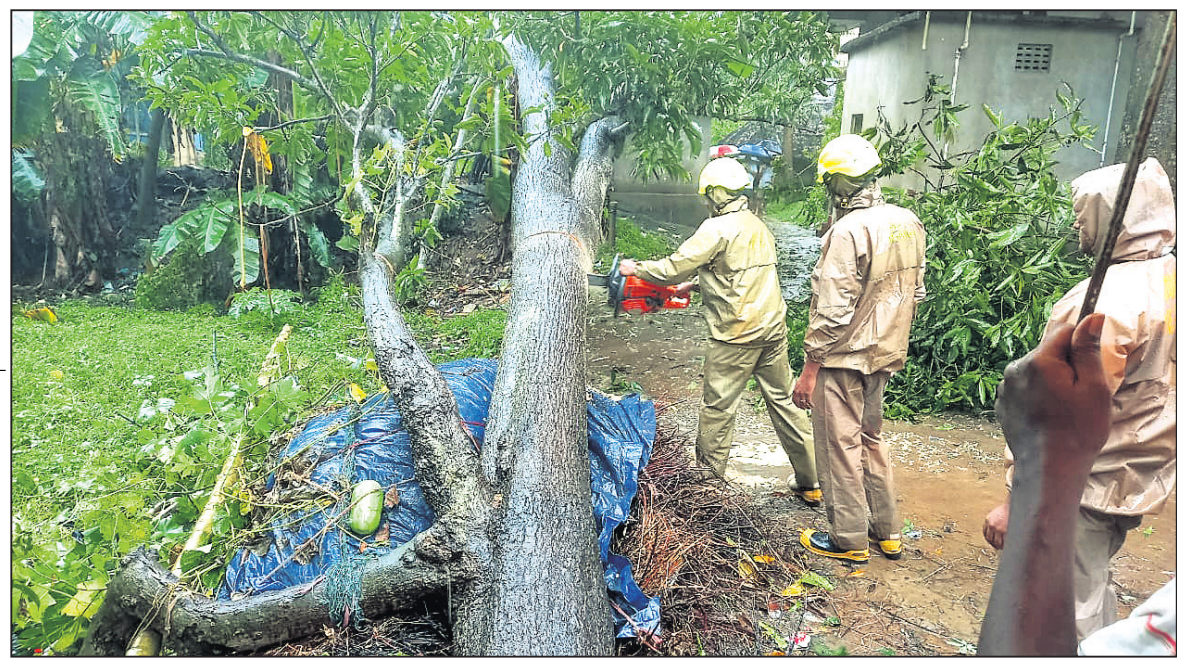
କେନ୍ଦ୍ରାପଡ଼ା ଜିଲା ରାଜକନିକାରେ ରାସ୍ତା ଉପରେ ଉପୁଡ଼ି ପଡ଼ିଥିବା ଏକ ଗଛକୁ ଅଗ୍ନିଶମ ବାହିନୀ କର୍ମଚାରୀମାନେ କାଟୁଛନ୍ତି ।