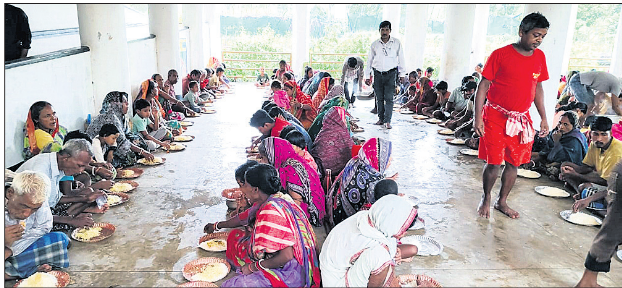
ବାଲେଶ୍ୱର ଜିଲା ଭୋଗରାଇ ବ୍ଲକ୍ ଉଦୟପୁର ସ୍କୁଲରେ ଆଶ୍ରୟ ନେଇଥିବା ଲୋକଙ୍କୁ ରନ୍ଧାଖାଦ୍ୟ ଦିଆଯାଇଛି ।