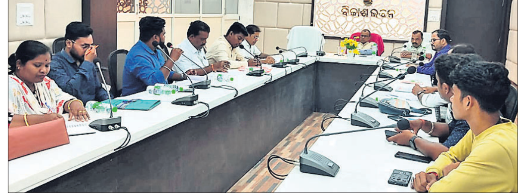
ବୈଠକରେ ଆଲୋଚନା କରାଯାଇଛି।

ଦତ୍ତେନ୍ଦ୍ର ୧୦ ତାରିଖରେ ବିଶ୍ୱ ମାଣ୍ଡିଆ ଦିବସ ସମୟରେ ପାଳନ କରାଯିବ। ସହ ବିଭିନ୍ନ ପ୍ରଦର୍ଶନୀ ମଣ୍ଡପ, ଛାତ୍ରଛାତ୍ରୀ ମାନଙ୍କ ମଧ୍ୟରେ କୁଳକ ପ୍ରତିଯୋଗିତା, ମାଣ୍ଡିଆ ଉପରେ ଖାଦ୍ୟ ରନ୍ଧନ ପ୍ରତିଯୋଗିତା ଗାଉଁସଲଠାରେ କରାଯିବ। ପାଇଁ ଗଠନ କରାଯାଇଛି। ବୈଠକରେ ମୁଖ୍ୟ ଉପଲକ୍ଷେ ପ୍ରସ୍ତୁତି ବୈଠକ ଅନୁଷ୍ଠିତ ହୋଇଯାଇଛି। ଜିଲାପାଳ ସାହୁ ଆଗାମୀ