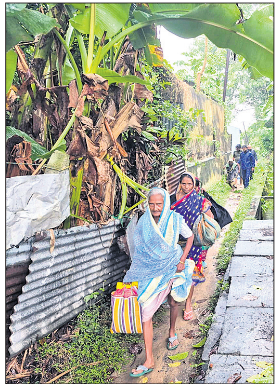
ଅଦୃକ ଜିଲା ଧାମରାରେ ଲୋକେ ଜିନିଷ ଧରି ବାଟ୍ୟା ଆଶ୍ରୟସ୍ଥଳକୁ ଯାଉଛନ୍ତି ।