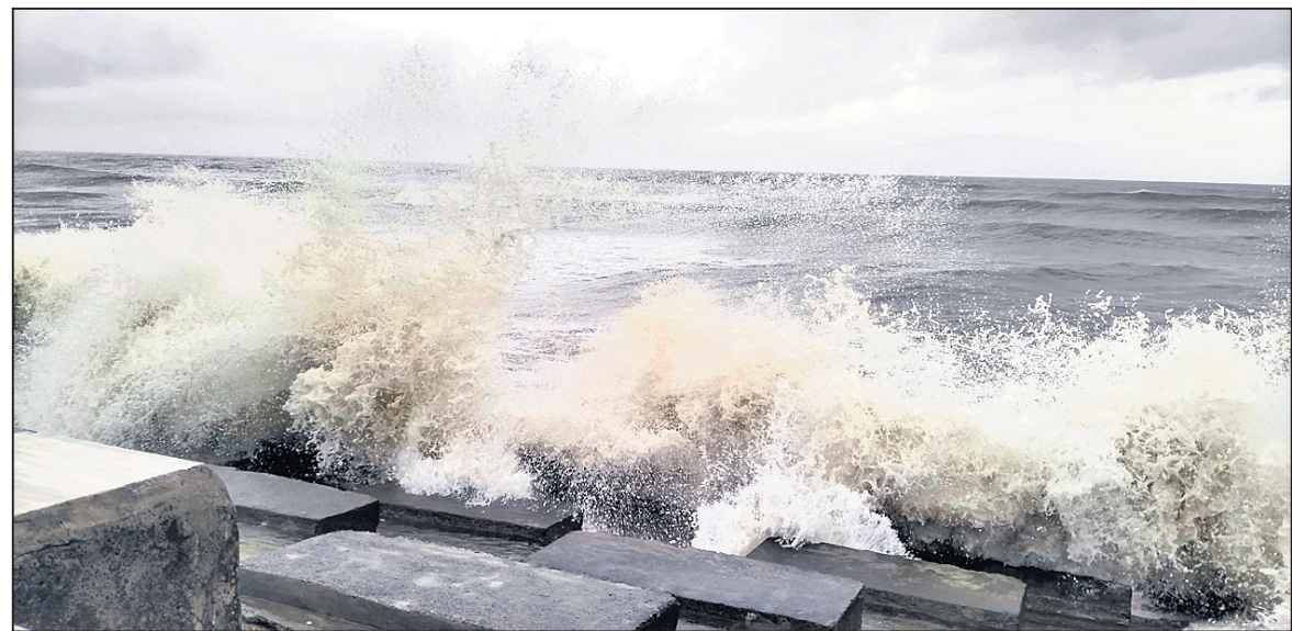
ଦୀପା ବେଳାଭୂମିରେ ଥିବା ସୁରକ୍ଷା ବନ୍ଧରେ ଭୁଆରମାଡ଼ ।