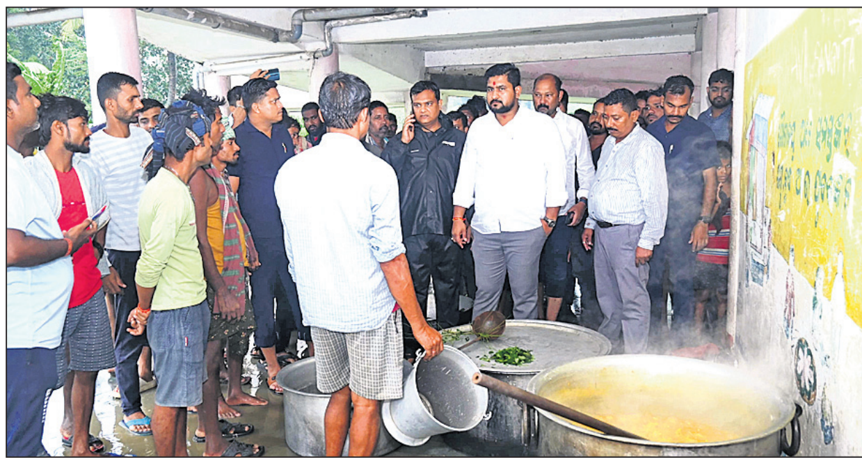
ଧାମରାର ଏକ ଆଶ୍ରୟସ୍ଥଳରେ ରନ୍ଧାଖାଦ୍ୟ ବ୍ୟବସ୍ଥା ଅନୁଧ୍ୟାନ କରୁଛନ୍ତି ଉଚ୍ଚଶିକ୍ଷା, କ୍ରୀଡ଼ା ଓ ଯୁବସେବା ମନ୍ତ୍ରୀ ସୂର୍ଯ୍ୟବଂଶୀ ସୁରକ ।