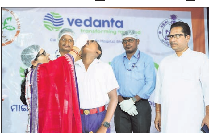
ଜଣେ ଛାତ୍ରକୁ ଚିକା ଦିଆଯାଇଛି ।

ଭବାନୀପାଟଣା/ଲାଞ୍ଜିଗଡ଼, ୨୪।୧୦ (ଉତ୍ତମ କୁମାର ଦାଶ/ରମେଶ ନାୟକ)