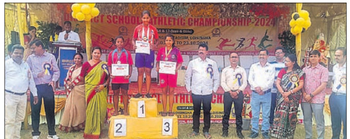
ଜଣେ କୃତୀ ପ୍ରତିଯୋଗୀଙ୍କୁ ମୁଖ୍ୟ ଅତିଥି ପୁରସ୍କୃତ କରୁଛନ୍ତି।