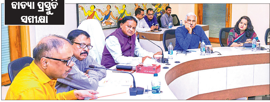
ବାଦ୍ୟ ପ୍ରସ୍ତୁତି ସମୀକ୍ଷା