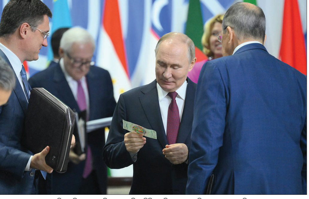
ଦ୍ୱିକ୍ର ସମ୍ମିଳନୀରେ ରୁଷିଆ ରାଷ୍ଟ୍ରପତି ଭ୍ଲାଡିମିର ପୁଟିନ୍ ଏକ କରେନ୍ସି ନୋଟ୍ ଦେଖାଉଛନ୍ତି।