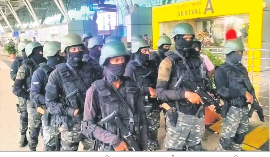
ବୋମା ଧନକ ପରେ ଭୁବନେଶ୍ୱର ବିମାନ ବନ୍ଦରେ ସୁରକ୍ଷା କର୍ମୀଙ୍କ ଦ୍ୱାରା ଯାଞ୍ଚ କରାଯାଇଛି।

ଭୁବନେଶ୍ୱର, ୨୪।୧୦ (ସଂପାଦକ ରାଉତ) ସୋପିଆଲ ମିଡ଼ିଆରେ କିଛିଦିନ ମଧ୍ୟରେ ଘରୋଇ ଓ ଅନ୍ତର୍ଜାତୀୟ ସଂସ୍ଥାର ଶତାଧିକ ବିମାନକୁ ବୋମା ଧନକ ଆଘାତ। ଏଥିଯୋଗୁ ବିମାନ ସେବା ମଧ୍ୟ ପ୍ରଭାବିତ ହେଉଛି। ଏହା ଏକ ବିଚଳନକ ସ୍ଥିତି ସୃଷ୍ଟି