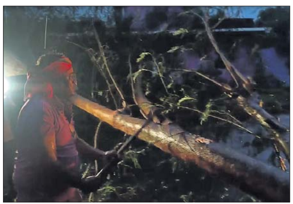
ରାଜନଗର ବୁକ ଚାଳକଙ୍କୁ-ଚାଳକଙ୍କୁ ରାସ୍ତାରେ ଭାଙ୍ଗିପଡ଼ିଥିବା ଗଛକୁ କଟାଯାଇଛି। ତୁହା ବର୍ଷା ସାଙ୍ଗକୁ ୭୦ରୁ ୮୦ କିମି ବେଗରେ ପବନ ମାଡ଼ ହେଉଛି। ରାଜନଗର-ରୁପ୍ତି, ନଳିତାପାଟିଆ-ଅଗ୍ନିଶମ ବାହିନୀ ଓ ପୋଲିସ୍ ପକ୍ଷରୁ ଚାଳକଙ୍କୁ ଉଦ୍ଧାର କରାଯାଇଛି।

ରାଜନଗର, ୨୪।୧୦ (ଭାସ୍କର ରାଉତରାୟ) ବାତ୍ୟା 'ଦାନା' ଉତ୍ତରକନିକା-ଧାମରା ମଧ୍ୟରେ ଥିବା ରାଜନଗର ବୁକର ଚାଳକଙ୍କୁ ଆଘାତ ହେବା ବୋଲି ପାଣିପାଗ ବିଭାଗ ପୂର୍ବାନୁମାନ କରିଛି। ଗୁରୁବାର ସକାଳୁ ଚାଳକଙ୍କୁ ଆଘାତ ହେବା ସହ ପବନ ଲାଗି ରହିଛି। ବୈତରଣୀ ନଦୀ ଓ ଧାମରା ପୁରୀର ସାମୁଦ୍ରିକ ଉଚ୍ଚ ଜୁଆର ଉଚ୍ଚ। ଉଚ୍ଚ ଜୁଆର ଉତ୍ତରକନିକାର ଜୁଣା ଜଙ୍ଗଲ ଉପରେ ମାଡ଼ ହେଉଛି। ଉଚ୍ଚ ଜୁଆର ଯୋଗୁ ନଦୀ କୂଳରେ ବନ୍ଧା ହୋଇଥିବା ଗ୍ରାମର ଓ ଗୁରୁତ୍ୱପୂର୍ଣ୍ଣ ମଧ୍ୟରେ ପାଣି ପଶିଯାଇଛି। ଚାଳକଙ୍କୁ ଘାଟ ରାସ୍ତା ଉପରେ ଜୁଆର ପାଣି ଚାଲି ଆସୁଛି। ଅପରାହ୍ନ ପୂର୍ବ ତୁହାକୁ