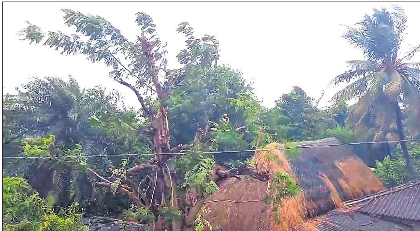
ବାନ୍ଦବାଲିରେ ପବନରେ ଗଛର ଡାଳ ଭାଙ୍ଗି ଯାଇଛି ।