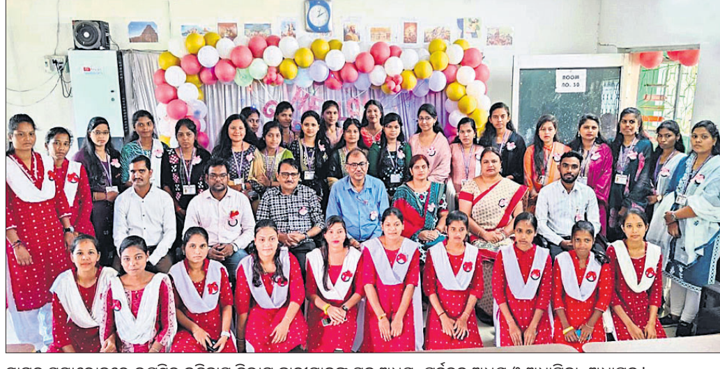
ସ୍ୱାଗତ ସମାରୋହରେ ଉପସ୍ଥିତ ଇତିହାସ ବିଭାଗ ଛାତ୍ରାମାନଙ୍କ ସହ ଅଧ୍ୟକ୍ଷ, ପୂର୍ବତନ ଅଧ୍ୟକ୍ଷ ଓ ଅଧ୍ୟାପିକା, ଅଧ୍ୟାପକ।