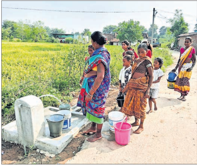
ଖୁଣ୍ଟପୋଖରୀ ପାନୀୟ ଜଳ ସଂଗ୍ରହ କରୁଛନ୍ତି ପଢ଼ାବାସୀ ।

କଳାହାଣ୍ଡି ଜିଲ୍ଲା କୋକସରା ବ୍ଲକ୍ ତଳେ ପଞ୍ଚାୟତ ସିଲିଗୁଡ଼ା ଗ୍ରାମର ଗୋଟିଏ ପଢ଼ାରେ ଦୀର୍ଘ ବର୍ଷ ପରେ ପାନୀୟଜଳର ସମସ୍ୟା ସମାଧାନ ହୋଇଛି । ପାନୀୟ ଜଳ ପାଇଁ ଅନେକ ଥର ପଞ୍ଚାୟତ ଓ ପ୍ରଶାସନ ପକ୍ଷରୁ ନିକଟତର ଖନନ କରାଯାଇ ଚେଷ୍ଟା କରାଯାଇଥିଲା । କିନ୍ତୁ କୌଣସି ଫଳପ୍ରାପ୍ତ ହୋଇନଥିଲା । ଫଳରେ ପଢ଼ାବାସୀ ନିକଟସ୍ଥ ନଦୀ, ପୋଖରୀ ପାଣିକୁ ପାନୀୟ ଜଳ ରୂପେ ବ୍ୟବହାର କରୁଥିଲେ । ଖରାଦିନରେ ପଞ୍ଚାୟତ ପକ୍ଷରୁ ବ୍ୟବହାରରେ ପଡ଼ାକୁ ପାନୀୟ ଜଳ ଯୋଗାଣ ହେଉଥିଲା । ଏନେଇ ଗ୍ରାମବାସୀ ବ୍ଲକ୍ ପ୍ରଶାସନ ତଥା ବ୍ଲକ୍