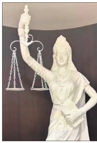
ରହିଛି। ପାରମ୍ପରିକ ପୋଷାକରେ ଥିବା ନ୍ୟାୟଦେବାଙ୍କ ଆଖିରେ

ବାର ଆସୋସିଏସନ ସହ ପରାମର୍ଶ କରା ନ ଯାଇ ନ୍ୟାୟଦେବାଙ୍କ ମୂର୍ତ୍ତି ଏବଂ ସର୍ବୋଚ୍ଚ ଅବାଲତକ ପ୍ରତୀକର ବ୍ରାହ୍ମିକାରୀ ପରିବର୍ତ୍ତନ କରାଯାଇଥିବାରୁ ସୁପ୍ରିମକୋର୍ଟର ବାର ଆସୋସିଏସନ (ଏସ୍‌ସିଏ) ଏହା ଉପରେ ଆପତ୍ତି ଉଠାଇ ଏକ ସର୍ବସମ୍ମତ ପ୍ରସ୍ତାବ ଆଣିଛି। ସୁପ୍ରିମକୋର୍ଟର ବିଚାରପତିମାନଙ୍କ ଲାଇବ୍ରେରିରେ ୬ ଫୁଟ ଉଚ୍ଚତା ବିଶିଷ୍ଟ ନୂତନ ନ୍ୟାୟଦେବା ମୂର୍ତ୍ତି ଘାପନ କରାଯାଇଛି। ଉକ୍ତ ମୂର୍ତ୍ତିକ ଗୋଟିଏ ହାତରେ ସ୍କେଲ ରହିଥିବାବେଳେ ଅନ୍ୟ ହାତରେ ଖଣ୍ଡ ବଦଳରେ ସସିଧାନ