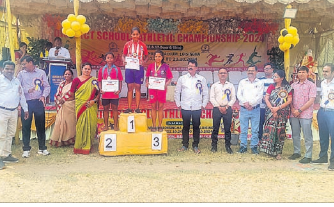
ଅତିଥିକ୍ଷେତ୍ରରେ କୃତୀ ପ୍ରତିଯୋଗୀ।