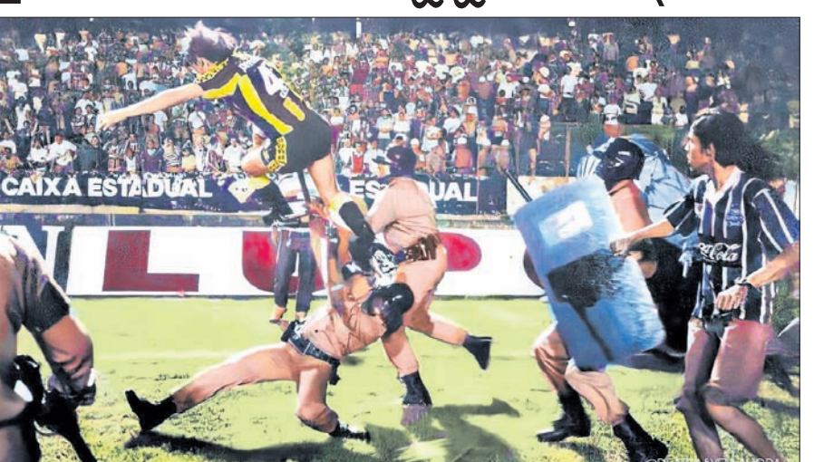
ପୋଲିସକୁ ଆକ୍ରମଣ କରୁଛନ୍ତି ଜଣେ ଦର୍ଶକ।