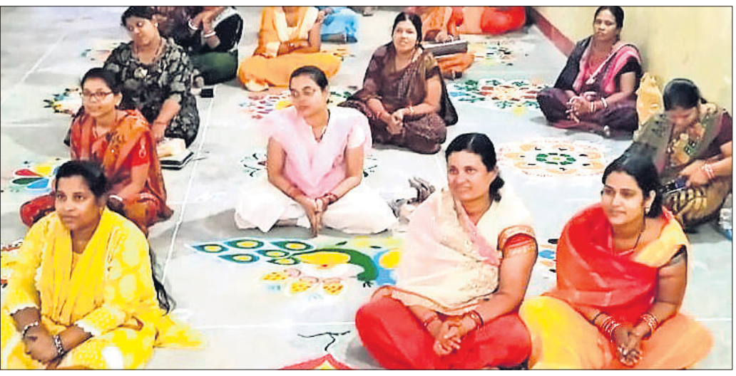
ଆୟୋଜିତ ରଞ୍ଜୋଲି ପ୍ରତିଯୋଗିତାରେ ପ୍ରତିଯୋଗୀମାନେ।

ମନରେ ତାଙ୍କର ସନ୍ଦେହ ହୋଇଥିଲା। ସେ ଯାଇ ତାଙ୍କ ଆଲମାରାଟି ଖୋଲାଥିଲା ଓ ଏଥିରୁ ତୁରନ୍ତ ସୁନାହାର, ପାଞ୍ଚହଳ ସୁନା କାନପୁଲ, ଦୁଇଟି ସୁନା ନାକପୁଲ, ଦୁଇଟି ସୁନା ମୁଦି, ଛଅଟି ସୁନା ଲକେଟ୍, କିଛି ରୂପା ଗହଣା, କିଛି ନଗଦ ଟଙ୍କା ଚୋରି ହୋଇଯାଇଥିବା ଦେଖିବାକୁ ପାଇଥିଲେ। ଏହା ସହ ବାହାରେ ଥିବା ତାଙ୍କର ଏକ ମୋବାଇଲ ଫୋନ୍ ମଧ୍ୟ ଚୋରି ହୋଇଥିବା ନେଇ ସେ ତାଙ୍କ ଏତଲାରେ ଦର୍ଶାଇଥିଲେ। ତାଙ୍କ ଏତଲାକୁ ଆଧାର କରି ଅଇଁଠାପାଲି ଥାନାରେ ଏକ ମାମଲା (ନଂ. ୩୪୭/୨୦୨୪) ରୁକ୍ତ କରି ତଦନ୍ତ ଆରମ୍ଭ କରିଥିଲା। ପରବର୍ତ୍ତୀକାଳରେ ଗ୍ରାମବାସୀଙ୍କୁ ପଚରା ଉଚରା କରିବା ସହ ଅନ୍ୟାନ୍ୟ ପାରିପାଶ୍ୱିକ ଛୁଟି ଆଧାରରେ ଅନୁସନ୍ଧାନ କରି ପୋଲିସ ଅଭିଯୁକ୍ତ ନିକଟରେ ପହଞ୍ଚିବାରେ ସକ୍ଷମ ହୋଇଥିଲା। ଅଭିଯୁକ୍ତଙ୍କୁ ପ୍ରଥମେ ଆନାକୁ ଆଣି ପୋଲିସ ଜେରା କରିଥିଲା। କେରାବେଳେ ଉକ୍ତ ଚୋରି ଘଟଣାରେ ତାଙ୍କର ସମ୍ପୃକ୍ତ ଥିବା ଅଭିଯୁକ୍ତ ସ୍ୱୀକାର କରିବା ପରେ ତାଙ୍କୁ ପୋଲିସ ଗିରଫ କରିଥିଲା। ଏହାବାଦ ଅଭିଯୁକ୍ତଙ୍କୁ ସୁନା ଆଧାରରେ ପୋଲିସ ଚୋରି ସୁନା ଗହଣାକୁ କିଛି ଉଦ୍ଧାର କରିଥିଲା।