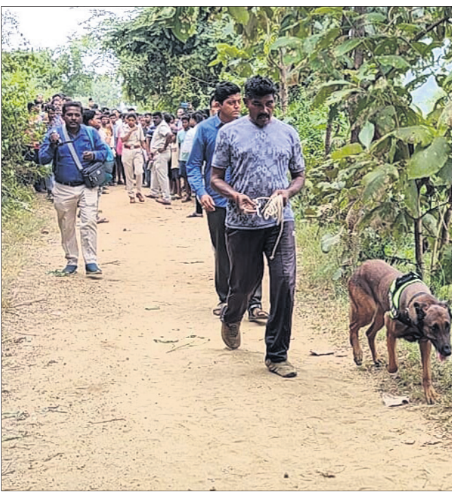
ରାସ୍ତାର ଠାକୁରାଣୀ ମନ୍ଦିର ନିକଟରେ ଥିବା ତତ୍ତ୍ୱାବଧାନ ଗାଁକୁ ଯାଇଥିବା ଏକ ଅଣ୍ଡାଧାରିଣୀ ସ୍ତ୍ରୀଙ୍କୁ ଯୁବକଙ୍କ ମୃତଦେହ ପଡ଼ିଥିବାରୁ ପୂର୍ବରୁ ଏହି ସ୍ଥାନ ଦେଖି ସେମାନଙ୍କୁ ପୁଲିଫିଙ୍ଗ୍ ଟିମ୍ ଆସିଥିଲା। ସନ୍ଦେହ କରାଯାଉଛି। ପୋଲିସ୍ ମୃତଦେହକୁ ଉପରଝର ମନ୍ଦିର ନିକଟରେ ରଖିଛି।

ବଲାଙ୍ଗୀର ଜିଲା ପୁଲିଫିଙ୍ଗ୍ ଟିମ୍ ଆରମ୍ଭିତ ତତ୍ତ୍ୱାବଧାନ ଗାଁ ନିକଟ ରାସ୍ତାକଡ଼ ପତ୍ର ଜଙ୍ଗଲରେ ଗୁରୁବାର ସକାଳେ ଜଣେ ଯୁବତୀ ଓ ଯୁବକଙ୍କ ଗଳାକଟା ମୃତଦେହ ପୋଲିସ୍ ଜବତ କରିଛି। ସେମାନଙ୍କ ପରିଚୟ ମିଳିପାରି ନ ଥିବା ବେଳେ ବୟସ ୨୦ରୁ ୨୫ ବର୍ଷ ହେବ ବୋଲି ଅନୁମାନ କରାଯାଉଛି। ଉଭୟ ଯୁବତୀ ଓ ଯୁବକଙ୍କ ଗଳାରେ ଧାଉଁଆ ଅସ୍ତ୍ରରେ କଟା ଚିହ୍ନ ରହିଛି। ଯୁବତୀଙ୍କ ହାତରେ ମଧ୍ୟ କଟା ଚିହ୍ନ ଥିବା ଜଣାପଡ଼ିଛି। ଯୁବତୀଙ୍କ ମୃତଦେହ ପଡ଼ିଥିବା ସ୍ଥାନରୁ ୨ ଫୁଟ ତଳକୁ ଯୁବକଙ୍କ ମୃତଦେହ ପଡ଼ିଥିଲା। ସେମାନଙ୍କୁ ହତ୍ୟା କରି ସେଠାରେ କେହି ଫିଙ୍ଗି ଦେଇଥିବା ପାରିପାର୍ଶ୍ୱିକ ସ୍ଥିତିରୁ ଜଣାପଡ଼ିଛି। ମୃତଦେହ ଆଟଗାଁ-ଉପରଝର ଘାଟି