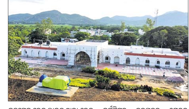
ପୁନର୍ବିକାଶ କରାଯାଇଥିବା ପାରଳାଖେମୁଣ୍ଡି ରେଳ ଷ୍ଟେଶନର ଦୃଶ୍ୟ।

ରେଳ ମନ୍ତ୍ରାଳୟ ଦ୍ୱାରା ଯୋଜିତ ୫୦ଟି ଅନୁ ଷ୍ଟେଶନ ମଧ୍ୟରେ ଅନ୍ତର୍ଭୁକ୍ତ ପାରଳାଖେମୁଣ୍ଡି ରେଳ ଷ୍ଟେଶନର ପୁନର୍ବିକାଶ କରାଯାଇଛି।