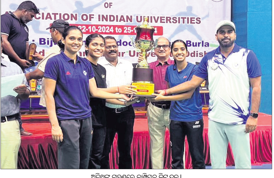
ଅତିଥିକ ରଘୁଶର ଚାମ୍ପିୟନ କିର୍ ଦଳ।

ସମ୍ବଲପୁରରେ ଅନୁଷ୍ଠିତ ଇଷ୍ଟ ଜୋର୍ ଆନ୍ତର୍ ବିଶ୍ୱବିଦ୍ୟାଳୟ ମହିଳା ବ୍ୟାଡମିଣ୍ଟନ ଚାମ୍ପିୟନ ଆଖ୍ୟା ଅର୍ଜନ କରିଛି କିର୍ ବିଶ୍ୱବିଦ୍ୟାଳୟ।