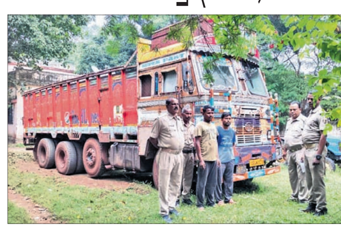
ଚମ୍ପୁଆ, ୨୫ ଅକ୍ଟୋବର (ମହେଶ୍ୱର ଦାସ)

କେନ୍ଦୁଝର ଜିଲା ଚମ୍ପୁଆ ପୋଲିସ୍ ଓ ସ୍ୱତନ୍ତ୍ର ଅଞ୍ଚଳକୁ ମାଙ୍ଗାନିକ ବୋହେଇ ଏକ ଟ୍ରକ୍ ଜବତ କରିଛି। ଜବତ ମାଙ୍ଗାନିକର ମୂଲ୍ୟ ପ୍ରାୟ ୩ ଲକ୍ଷ ଟଙ୍କାରୁ ଊର୍ଦ୍ଧ୍ୱ ହେବ ବୋଲି ଜଣାପଡ଼ିଛି। ଏହା ସହିତ ଟ୍ରକ୍‌ର ଡ୍ରାଇଭର ଓ ମାଙ୍ଗାନିକ ଠିକାଦାରକୁ ଗିରଫ ପରେ କୋର୍ଟଚାଲାଣ କରାଯାଇଥିବା ଆଇଆଇସି ଦେବକା ନାଏକ ସୂଚନା ଦେଇଛନ୍ତି। ସୂଚନା ଅନୁଯାୟୀ, ଗତ ୨୨ ତାରିଖ ରାତିରେ ସ୍ମୃତ ଓ ପୋଲିସ୍ ପାଟୁଗାଳି କରୁଥିବା ବେଳେ ଟ୍ରକ୍ (ନଂ. ସିଜି ୦୪ ୫୨୭୦)କୁ ଅଟକାଇଥିଲେ। ଏନି ୫୨୭୦)କୁ ଅଟକାଇଥିଲେ। ସାନ ଝିଙ୍କପାଣି (ଖାଡ଼ଖଣ୍ଡ) ଅଞ୍ଚଳର