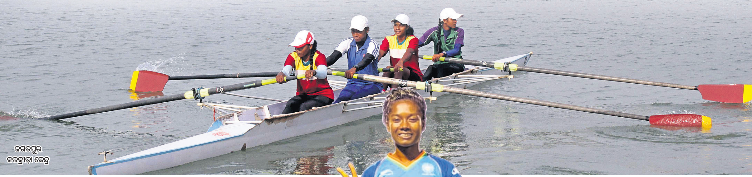
ଜଗତପୁର ଜଳକ୍ରୀଡ଼ା କେନ୍ଦ୍ର