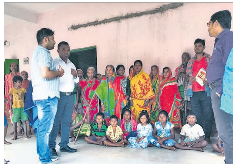
ନୟାଗଡ଼ ଜିଲ୍ଲା ଖଣ୍ଡପଡ଼ା ବ୍ଲକ ସିଧାମୁଳା, ନୟାଗଡ଼ ବ୍ଲକ ନାଗୁଆଁ ଓ ବାଣପୁର ଅଞ୍ଚଳ ଆଶ୍ରୟସ୍ଥଳୀରେ ରହିଥିବା ବାଟ୍ୟା ବିପନ୍ନମାନେ।