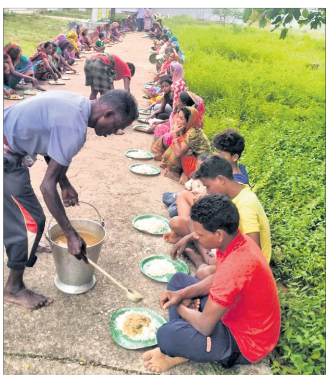
ରଣପୁର ବ୍ଲକ ତମାଗଡ଼ ବାଟ୍ୟା ଆଶ୍ରୟସ୍ଥଳୀରେ ଥିବା ଲୋକଙ୍କୁ ରନ୍ଧାଖାଦ୍ୟ ଦିଆଯାଇଛି।