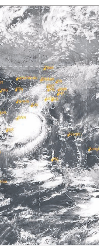
ଗୁରୁବାର ଅପରାହ୍ଣ ୫ଟାରେ ମହାକାଶରୁ ଉଲ୍ଲେଖିତ ପାଣିପାଗ ଚିତ୍ର।

ଓଡ଼ିଆ ଭଗବତମାଳି ଓ ରୁଚି ପ୍ରୟୋଗ - ଏ.କେ. ମିଶ୍ର ପଢ଼ିଶର୍ଯ୍ୟ ପ୍ରା:ଲି:ଖ: