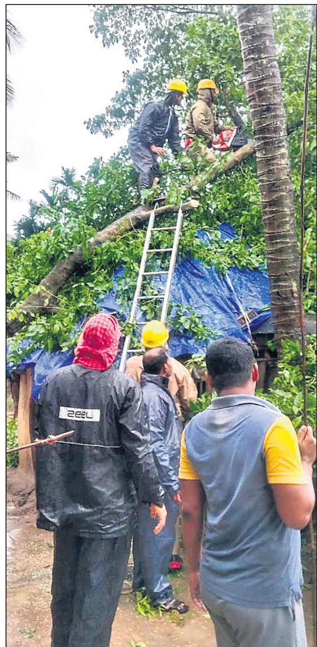
ଜଗତସିଂହପୁର ଜିଲା କୁଳଙ୍ଗ ବ୍ଲକ୍ ଅନ୍ତର୍ଗତ ନୂଆଗଡ଼ ଗ୍ରାମରେ ଘର ଉପରେ ପଡ଼ିଯାଇଥିବା ଏକ ଗଛକୁ ଓଡ୍ରାଏ ଟିମ୍ ପକ୍ଷରୁ କଟାଯାଇଛି ।