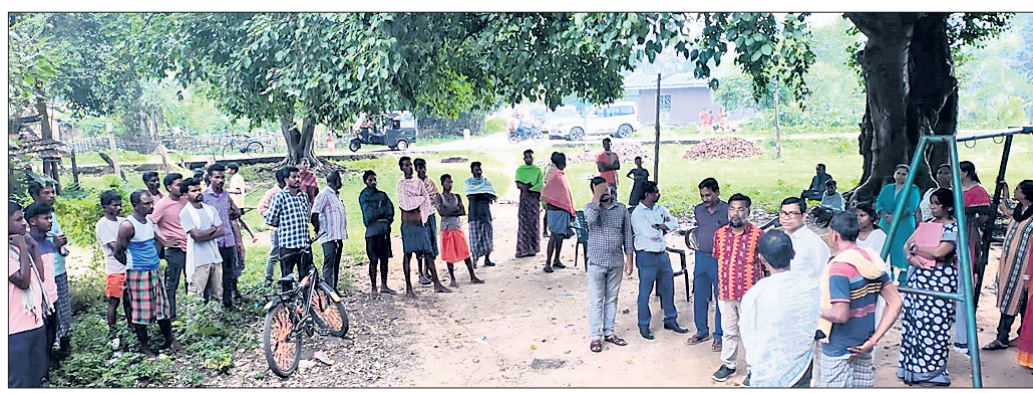
ଅଙ୍ଗନୱାଡି କର୍ମୀ ଚୟନକୁ ବିରୋଧ କରି ଏକାଠି ହୋଇଥିବା ଗ୍ରାମବାସୀ ।

ମାଲକାନଗିରି ଜିଲ୍ଲା ଖଜରପୁଟ ସମୂହ ଶିଶୁ ବିକାଶ ପ୍ରକଳ୍ପ ଅଧୀନରେ ଅଙ୍ଗନୱାଡି କର୍ମୀ ନିଯୁକ୍ତିକୁ କେନ୍ଦ୍ରକରି ଗ୍ରାମବାସୀଙ୍କ ମଧ୍ୟରେ ଅସନ୍ତୋଷ ପ୍ରକାଶ ପାଇବା ସହ ଲୋକେ କେନ୍ଦ୍ରରେ ତାଲା ପକାଇ ଦେଇଥିଲେ । ପ୍ରଶାସନିକ ହସ୍ତକ୍ଷେପ ପରେ ତାଲା ଖୋଲାଯାଇ ଲୋକଙ୍କୁ ବୁଝାଖୁଝା କରାଯାଇଥିଲା ।