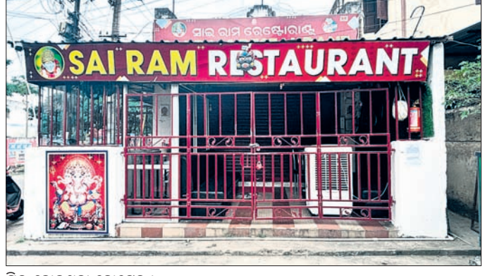
ସିଲ୍ ହୋଇଥିବା ହୋଟେଲ ।

ବେଆଇନ ସରକାରୀ ଜାଗା ଜବରଦଖଲ ଓ ଦିନା ଚାଉଳପୁନିରେ ଦୀର୍ଘ ଦିନଧରି ବେଆଇନ ଭାବେ ସହର ମଝିରେ ଚାଲିଥିବା ସାଇରାମ ରେଷ୍ଟୁରାଣ୍ଟ । ଶନିବାର ପୌର ପରିଷଦ ପକ୍ଷରୁ ହୋଟେଲ ସିଲ୍ ହୋଇଛି ।