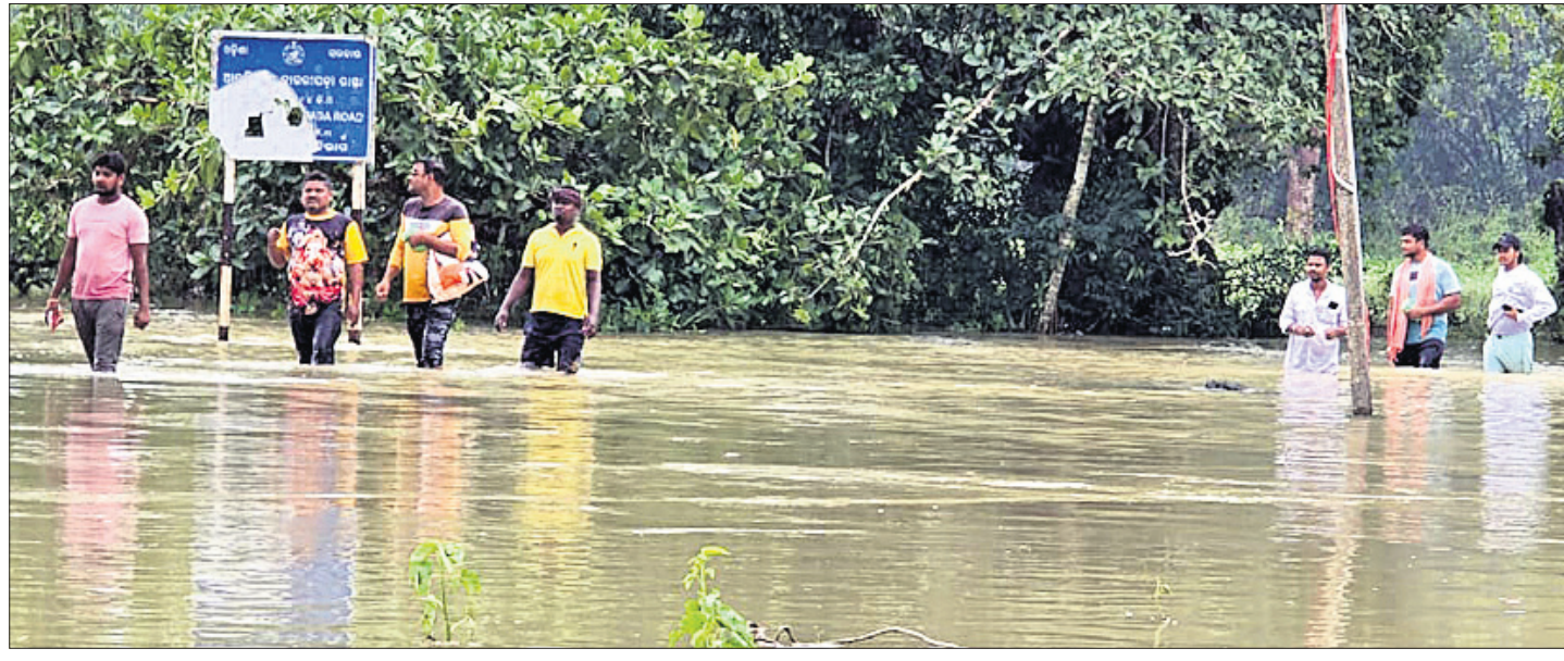
କାଶିବାଂଶ ନଦୀର ବନ୍ୟାଜଳ ସିପୁଲିଆ ବୁକ ବାଉରାପଦା ଅଞ୍ଚଳରେ ମାଡ଼ିଯାଇଥିବାରୁ ଲୋକେ ପାଣି ଭିତରେ ପଶି ଯାତାୟାତ କରୁଛନ୍ତି।

ସାମୁଦ୍ରିକ ଝଡ଼ 'ବାନା' ପ୍ରଭାବରେ ଉପକୂଳବର୍ତ୍ତୀ ଜିଲ୍ଲାଗୁଡ଼ିକରେ ବର୍ଷା ଲାଗିରହିଛି। ଏଥିଯୋଗୁଁ ବାଲେଶ୍ୱର ଜିଲ୍ଲାରେ ବନ୍ୟା ସ୍ଥିତି ସୃଷ୍ଟି ହୋଇ ନୀଳଗିରିରେ ଏକ ଅସ୍ଥାୟୀ ପୋଲ ଭାଙ୍ଗିଯିବାରୁ ୧୦ଟି ଗାଁ ବାହ୍ୟଜଗତରୁ ବିଚ୍ଛିନ୍ନ ହୋଇଯାଇଛି। ସେହିପରି ଭଦ୍ରକ, ଯାଜପୁର, କେନ୍ଦ୍ରାପଡ଼ା ଓ ମୟୂରଭଞ୍ଜ ଜିଲ୍ଲାର କେତେକ ଗ୍ରାମରେ ମଧ୍ୟ ବନ୍ୟା ସ୍ଥିତି ଉପସ୍ଥିତ। କଟକ, ଭୁବନେଶ୍ୱର ସମେତ କିଛି ସହରରେ ଶନିବାର ଦିନ ତମାମ ବର୍ଷା ଓ କୋହଲା ପାଗ ଲାଗିରହିଛି। ସହରାଞ୍ଚଳରେ ବର୍ଷାଜଳ ଜମିରହିବା ଯୋଗୁଁ ଯାତାୟାତ ବାଧାପ୍ରାପ୍ତ ହୋଇଛି। ବାତ୍ୟା ପରବର୍ତ୍ତୀ ସ୍ଥିତିର ମୁକାବିଲା ପାଇଁ ରାଜ୍ୟ ସରକାର ବିଭିନ୍ନ ବିଭାଗ କରିଆରେ ପଦକ୍ଷେପ ନେଉଛନ୍ତି।