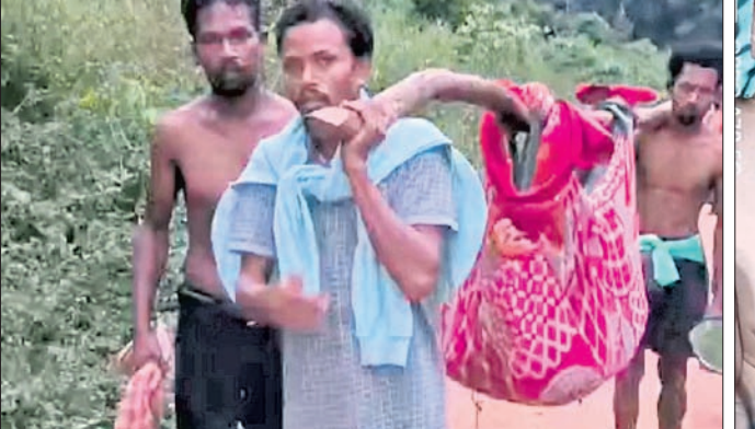
ଭାରରେ ଗର୍ଭବତୀଙ୍କୁ ବୁହାଯାଇଛି ।