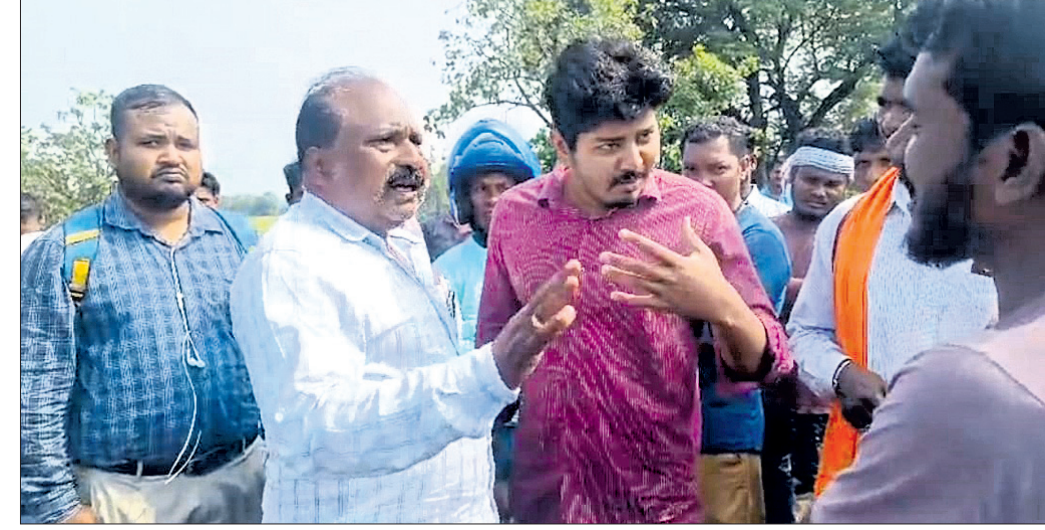
ବିଭାଗୀୟ ସମ୍ପ୍ରଦାୟ ଆନ୍ଦୋଳନକାରୀଙ୍କୁ ବୁଝାଖୁଝା କରୁଛନ୍ତି ।

ମାଲକାନଗିରି ଜିଲ୍ଲା କୋରୁକୋଣ୍ଡା ବ୍ଲକ୍ ପୁରୁଣା ଚମପାପାଳା ପଞ୍ଚାୟତ ସିଦ୍ଧିବାଟା ଗ୍ରାମବାସୀ ଗୋମ୍ପାକୋଣ୍ଡା କେନାଲ ପୋଲ ନିର୍ମାଣ ଦାରିରେ ଶନିବାର ଜଳସେଚନ ବିଭାଗ ବିରୋଧରେ ଆନ୍ଦୋଳନ କରିଛନ୍ତି । ଗ୍ରାମବାସୀଙ୍କ କହିବା ଅନୁଯାୟୀ, ଦୀର୍ଘ ବର୍ଷ ଧରି ଏକ ପୋଲ ନିର୍ମାଣ ନିମନ୍ତେ ବିଭାଗୀୟ କର୍ତ୍ତୃପକ୍ଷଙ୍କ ନିକଟରେ ବାରମ୍ବାର ଲିଖିତ ଅଭିଯୋଗ କରିଥିଲେ ମଧ୍ୟ କୌଣସି ଅଧିକାରୀ ଶୁଣୁ ନ ଥିବା କହିଛନ୍ତି । ସୂଚନାଯୋଗ୍ୟ, ଉକ୍ତ ପୋଲଟି ଗୋମ୍ପାକୋଣ୍ଡା ବ୍ୟାରେଜଠାରୁ ଗୋମ୍ପାକୋଣ୍ଡା ଜଳସେଚନ ହେଉଥିବା କେନାଲ ଉପରେ ନିର୍ମାଣ କରିବା ପାଇଁ ଗ୍ରାମବାସୀ ବହୁବାର ଦାବି କରିଥିଲେ । ଲୋକଙ୍କ କହିବା ଅନୁଯାୟୀ, ନିଜ ବାସକର୍ମୀ ଯିବା ପାଇଁ ଓ ଗୋରୁ ଚରାଇବାକୁ ନେବା ପାଇଁ ଗ୍ରାମବାସୀ ନାହିଁ ନ ଥିବା ଅସୁବିଧାର ସମ୍ମୁଖୀନ ହେଉଛନ୍ତି । ଗ୍ରାମ ଓ ଶାନ୍ତରୁ ଯେମିତି ସେମିତି ଚାଲିଯାଏ, କିନ୍ତୁ ବର୍ଷାଦିନେ ଗ୍ରାମବାସୀ ଜୀବନକୁ ବାଜିଲଗାଇ ଏହି କେନାଲ ପାରହୋଇ ବାସକର୍ମୀଙ୍କୁ ଯାଇଥାନ୍ତି । ଗୋରୁ ମଧ୍ୟ ବର୍ଷାଦିନେ ଉକ୍ତ କେନାଲ ପାରହୋଇ ଯିବା ସମୟରେ ସ୍ତୋତର ପୂର୍ବରୁ ଅନେକଥର ଭାସିଯାଇ ମୃତ୍ୟୁ