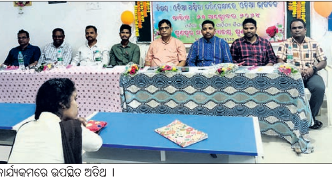
କାର୍ଯ୍ୟକ୍ରମରେ ଉପସ୍ଥିତ ଅତିଥି ।