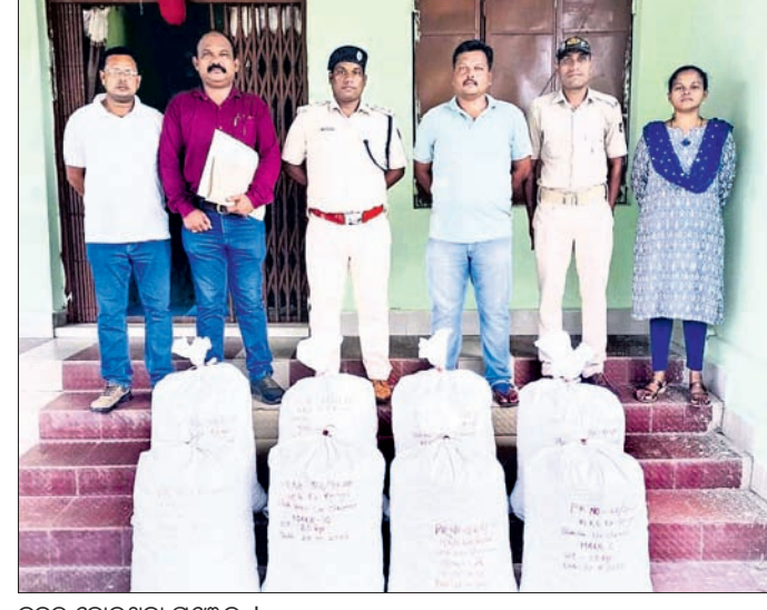
ଜବତ ହୋଇଥିବା ଗଞ୍ଜେଇ ।

ଅଙ୍ଗନୱାଡି କର୍ମୀ ଚୟନ ପ୍ରକ୍ରିୟା ସରକାରଙ୍କ ନିୟାମବଳୀ ଅନୁସରଣକରି ଉପ ଜିଲ୍ଲାପାଳଙ୍କ ଅଧିକାରରେ ୬ ଜଣିଆ କମିଟିଙ୍କ ଦ୍ୱାରା ସମ୍ପନ୍ନ ହେଉଛି । ତେଣୁ କେନ୍ଦ୍ର ଅଧୀନ ପ୍ରାର୍ଥନାମାନଙ୍କ ମଧ୍ୟରେ ମାର୍ଚ୍ଚିକା କରାଯାଇ କର୍ମୀ ଚୟନ କରାଯିବା ବ୍ୟବସ୍ଥା ରହିଛି । ସେଥିପାଇଁ ଲୋକଙ୍କର ଅସନ୍ତୋଷ ସରକାରୀ କାର୍ଯ୍ୟାଳୟ, ଅନୁସାନ୍ଧନରେ ତାଲା ପକାଇବା ନିୟମ ସରକାରୀ କାର୍ଯ୍ୟରେ କୌଣସି ବାଧା ସୃଷ୍ଟିକରିବା ଆଇନଗତ ଅପରାଧ ବୋଲି ଲୋକଙ୍କୁ ପ୍ରଶାସନିକ ଅଧିକାରୀ ବୁଝାଇଥିଲେ ।