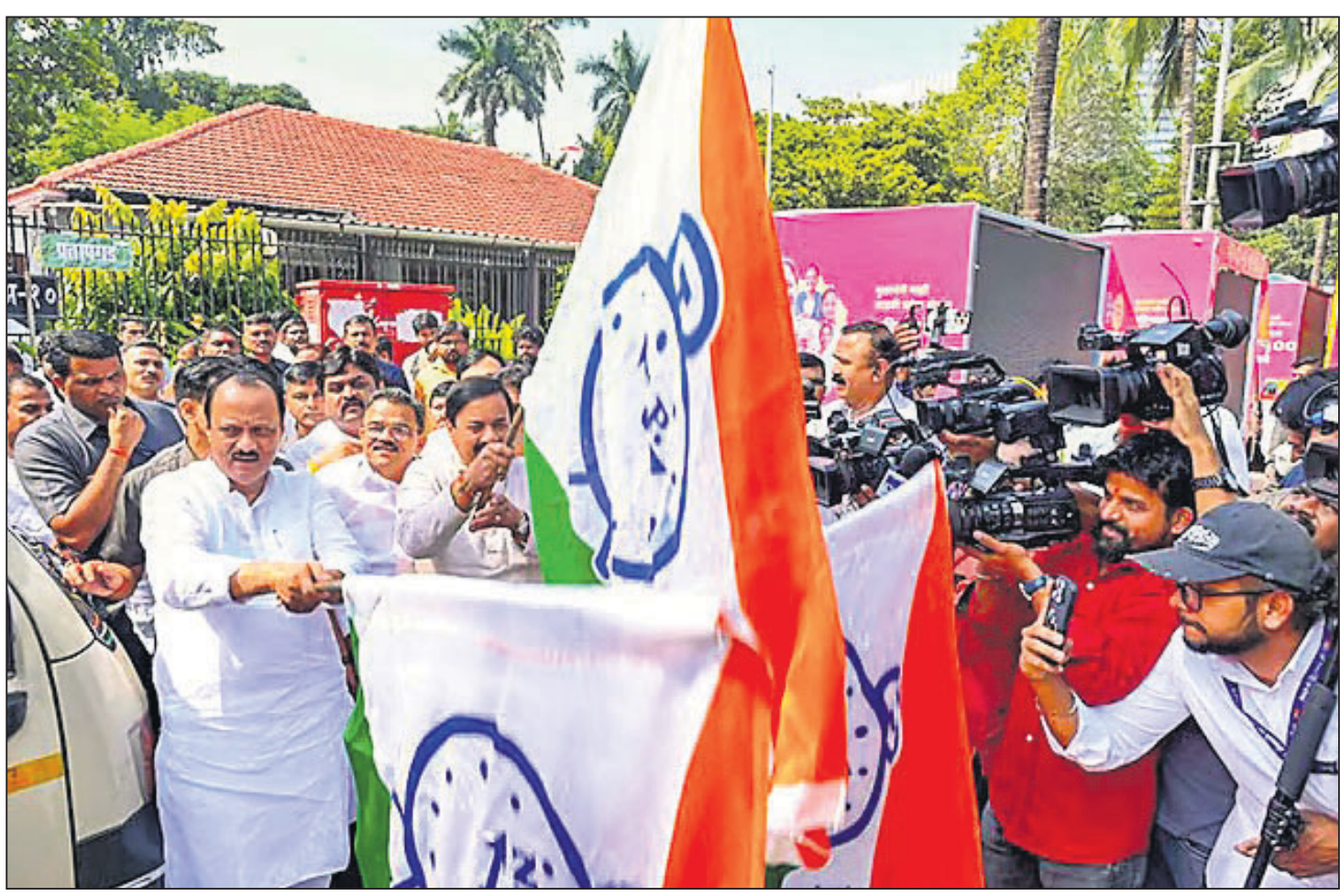
ମହାରାଷ୍ଟ୍ର ବିଧାନସଭା ନିର୍ବାଚନରେ ଦଳୀୟ ପ୍ରଚାର ପାଇଁ ଏନ୍‌ସିପି ଜାତୀୟ ସଭାପତି ତଥା ରାଜ୍ୟ ଉପ ମୁଖ୍ୟମନ୍ତ୍ରୀ ଅଜିତ ପାଞ୍ଜର ଏବଂ ଏନ୍‌ସିପି ଏମ୍‌ପି ସୁନୀଲ ଚକ୍ରବର୍ତ୍ତୀ ଏକତ୍ର ଭାବରେ ଏକତ୍ର ଭାବରେ ଉଦ୍‌ଘାଟନ କରୁଛନ୍ତି।