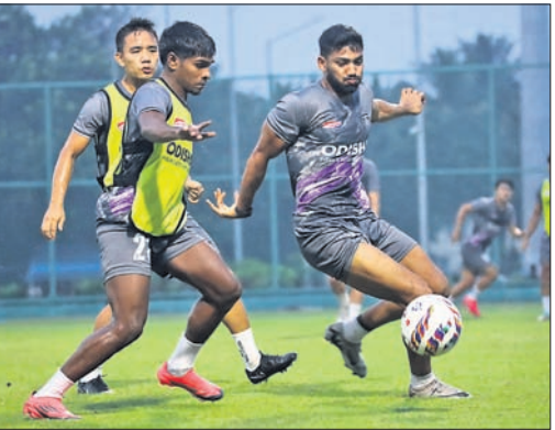
ଓଡ଼ିଶା ଖୋର୍ଦ୍ଧା ଏକାଡେମୀରେ ଓଏପ୍ସି ଖେଳାଳିଙ୍କ ଅଭ୍ୟାସ।