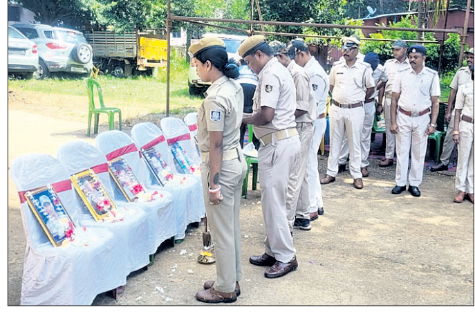
ଶହୀଦଙ୍କ ଫଟୋ ଚିତ୍ରରେ ଶ୍ରଦ୍ଧାଞ୍ଜଳି ଅର୍ପଣ କରାଯାଇଛି ।