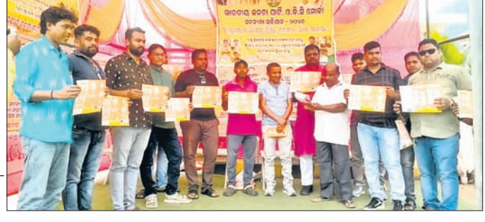
ଭାଇପାର ସଦସ୍ୟତା ଅଭିଯାନରେ ଦଳରେ ମିଶିଥିବା ନୂତନ ସଦସ୍ୟ ଓ ଅନ୍ୟମାନେ ।