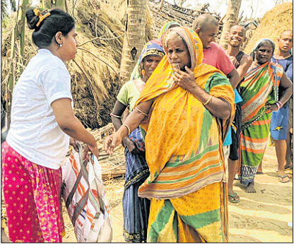
ପ୍ରକାର ରୋଗ ଯଥା ; ଯେତେବେଳା, ପୁଣ୍ୟଦିନ, ବାନ୍ତି, ଗ୍ୟାସ, ଦୁର୍ବଳ ଅନୁଭବ କରିବା, ଝାଡ଼ା, ଅତ୍ୟଧିକ ଖାଲବୋହିବା ଶିକାର ହୋଇ ତାତ୍କାଳିନୀ ଭାବେ ଚିକିତ୍ସା ନିମନ୍ତେ ଉପସ୍ଥାପନ କରିବାକୁ ପଡ଼ିଥାଏ ।

ସାମାଜିକ ଓ ଶାରୀରିକ ପ୍ରଭାବ ପକାଇଥାଏ । ଏହି ମାନସିକ, ସାମାଜିକ ସମସ୍ୟାକୁ ସାମାଜିକ କ୍ରିୟା ନିମନ୍ତେ ମନୋସାମାଜିକ ଯତ୍ନ ସହାୟତାର ଆବଶ୍ୟକତା ପଡ଼େ । ଏକ ସ୍ତର ମାନସିକ ଓ ସାମାଜିକ ସାମାଜିକ, ଅର୍ଥନୈତିକ, ସାଂସ୍କୃତିକ ବ୍ୟବସ୍ଥାର ପୁନଃସ୍ଥାପନ ଓ ବ୍ୟକ୍ତିଗତ ଅଭିଯାନ ନିମନ୍ତେ ଏହି ସହାୟତା ଦରକାର ହୁଏ । ମାନସିକ ସ୍ୱାସ୍ଥ୍ୟ ଠିକ୍ ରହିବା କାରଣରୁ ଏହାର ପ୍ରଭାବ ସାମାଜିକ ମାନସିକ ଓ ଶାରୀରିକ ସ୍ତରରେ ଦେଖାଯାଏ । ଉଦାହରଣସ୍ୱରୂପ ଏହି ସମୟରେ ଲୋକମାନେ ମାନସିକ ସମସ୍ୟା ଦ୍ୱାରା ଉତ୍ତର ବିଜିନ