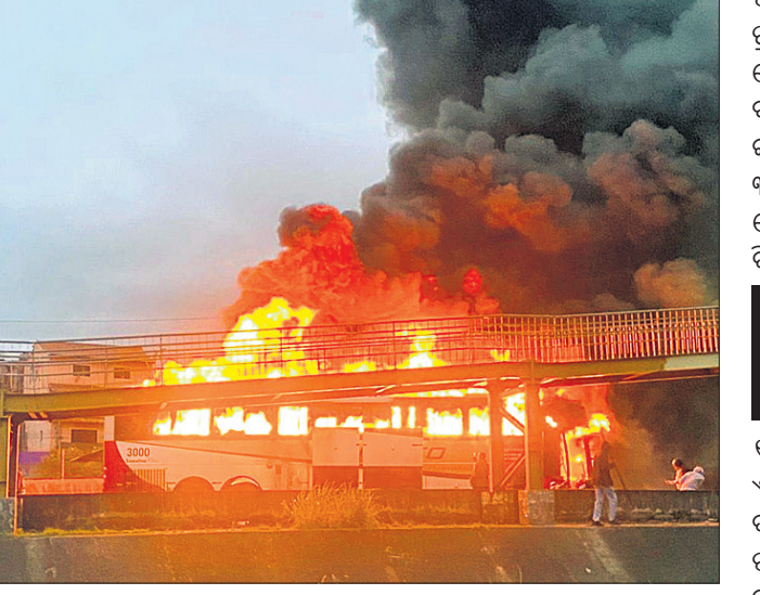
ପାଲମେରିଆସ୍ ସମର୍ଥକମାନେ ବସ୍ରେ ନିଆଁ ଲଗାଇ ଦେଇଛନ୍ତି।