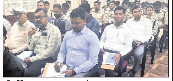
ତାଲିମ ଶିବିରରେ ସୋରବେଲୁଆ ବନ କର୍ମଚାରୀମାନେ।

ବିଭାଗ ଆଇନକୁ ଆହୁରି କିପରି ଶସ୍ତ୍ର କରାଯିବ ତାଲିମ ପ୍ରଦାନ ହୋଇଛି। ଜଙ୍ଗଲ ସୁରକ୍ଷା ନିମନ୍ତେ ଜନମାନସକୁ ସଚେତନ କରି ଉଦ୍‌ଘୋଷଣା ସୃଷ୍ଟି କରିବାର ଲକ୍ଷ୍ୟ ରହିଛି। ଜଙ୍ଗଲରେ ବନ୍ୟପ୍ରାଣୀଙ୍କ ସୁରକ୍ଷା ନିମନ୍ତେ କାର୍ଯ୍ୟରେ କୋଲକାତାର ୨ ବରିଷ୍ଠ ରବେଷଙ୍କ ଅଂଶଗ୍ରହଣ କରି ୫୫ଜଣ ଶିବିରୀଙ୍କୁ ପ୍ରଶିକ୍ଷଣ ପ୍ରଦାନ କରୁଛନ୍ତି। ଏ ଦିନ ଧରି ଅନୁଷ୍ଠିତ ହେବାକୁ ଥିବା ଉକ୍ତ ଶିବିରର ବାରିପଦା ବନଖଣ୍ଡର ଏସିଏସ୍, ରେଞ୍ଜର, ଫରେଷ୍ଟର ଆଦି ଉପସ୍ଥିତ ରହିଛନ୍ତି। ବନ ଅପରାଧ ଆଇନକୁ ନେଇ ତାଙ୍କର ତଦନ୍ତ ଅଭିଜ୍ଞତା ବାବଦରେ ମଧ୍ୟ ଅଧ୍ୟାପନକୁ ଜଣାଇଛନ୍ତି। ଏହା ଦ୍ୱାରା ଆଗକୁ ବନ୍ୟଜନ୍ତୁ ସୁରକ୍ଷା ନିମନ୍ତେ ଆଇନର କାର୍ଯ୍ୟକାରୀତା ବାବଦରେ ସମସ୍ତେ ଅଗୋଚର ହୋଇପାରିବେ ବୋଲି ବାରିପଦା ବନଖଣ୍ଡ ଅଧିକାରୀ କହିଛନ୍ତି।