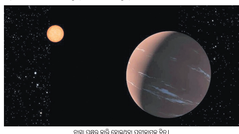
ନାସା ପକ୍ଷରୁ ଜାରି ହୋଇଥିବା ପ୍ରତୀକାତ୍ମକ ଚିତ୍ର।

୨୬୫୧ବି' ଆକାରର କୃତ୍ରିମ ଗ୍ରହ ଦେଖିବାକୁ ମିଳିଥାଏ। 'ଟିଓଆଇ-୨୬୫୧ବି' ଆବିଷ୍କାର ଗ୍ରହ ଗଠନ ଏବଂ ବିବର୍ତ୍ତନ ଉପରେ ନୂତନ ତଥ୍ୟ ପ୍ରଦାନ କରିଛି। ନେପଚୁନିଆନ୍ ଡିଜାର୍ଡ୍ ଏକ ରହସ୍ୟମୟ କ୍ଷେତ୍ର, ଯେଉଁଠାରେ 'ଟିଓଆଇ-୨୬୫୧ବି' ଆକାରର ଖୁବ୍ ଅଳ୍ପ ଗ୍ରହ ବିଦ୍ୟମାନ। ତେଣୁ ସେଠାରେ 'ଟିଓଆଇ-୨୬୫୧ବି' ଆକୃତିର ଗ୍ରହ ଦେଖା ନ ଯିବାର କାରଣ ସମ୍ପର୍କରେ ଅଧିକ ଗବେଷଣା ପାଇଁ ସବ୍ୟ ଆବିଷ୍କାର ପ୍ରୟୋଗ ସୃଷ୍ଟି କରିଛି। ଏହି ଗ୍ରହ ପୃଥିବୀଙ୍କ ବଦଳରେ 'ଟିଓଆଇ-୨୬୫୧ବି' ଚାନ୍ଦର ପ୍ରତି ୫.୦୬ ଦିନ ଚକ୍ରରେ ପରିକ୍ରମା କରିଥାଏ। ତେଣୁ ଏହାର ଏକ ବର୍ଷ