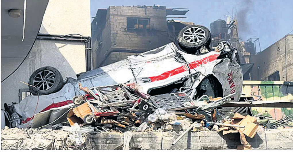
ଇସ୍ରାଏଲ୍ ସେନାର ଆକ୍ରମଣରେ ଉତ୍ତର ଗାଜା କମଳ ଅତ୍ୟନ୍ତ ହସ୍ତିତାଳ ଖସିଗସ୍ତ ହୋଇଛି।

ଇସ୍ରାଏଲ୍ ସୈନ୍ୟ ଉତ୍ତର ଗାଜା କମଳ ଅତ୍ୟନ୍ତ ହସ୍ତିତାଳରେ ଚତୁର କରି ପ୍ରାୟ ୧୦୦ ଜଣ ସମ୍ବନ୍ଧିତ ଆତଙ୍କବାଦୀଙ୍କୁ ଗିରଫ କରିଥିବା ସହାୟକ ସେନା ସୋମବାର ସୂଚନା ଦେଇଛି। ସୈନ୍ୟମାନେ ଶୁକ୍ରବାର ଉକ୍ତ ହସ୍ତିତାଳରେ ଧସେଇ ପଶିବା ସହ ଶନିବାର ପର୍ଯ୍ୟନ୍ତ ଚତୁର ଜାରି ରଖିଥିଲେ। ହସ୍ତିତାଳ ପରିସରରେ ଆମ୍‌ଗୋପନ କରିଥିବା ହମାସ୍ ଆତଙ୍କବାଦୀମାନଙ୍କୁ ଧରାଯାଇଛି। ସେଠାରୁ ସାଧାରଣ ନାଗରିକମାନଙ୍କୁ ବାହାର କଲାବେଳେ କେତେଜଣ ଆତଙ୍କବାଦୀ ଖସି ପଳାଇବାକୁ ଉଦ୍ୟମ କରିଥିଲେ। ହସ୍ତିତାଳ ଭିତରୁ ଅସ୍ତ୍ରଶସ୍ତ୍ର, ଆତଙ୍କବାଦୀଙ୍କ ପାଣ୍ଡି ଏବଂ ଗୋଇନ୍ଦା ଦସ୍ତାବିଜ ଜବତ ହୋଇଛି। ଅନ୍ୟପକ୍ଷରେ ଇସ୍ରାଏଲ୍ ସୈନ୍ୟମାନେ ହସ୍ତିତାଳର କେତେଜଣ ପୁରୁଷ କର୍ମଚାରୀଙ୍କୁ ଅଟକ ରଖିବା ସହ ହସ୍ତିତାଳରେ କ୍ଷୟକ୍ଷତି କରିଥିବା ଗାଜା ସ୍ୱାସ୍ଥ୍ୟ ମନ୍ତ୍ରଣାଳୟ କହିଛି। କେତେଜଣ ଜଣାଶୁଣା ଆତଙ୍କବାଦୀ ନିଜକୁ ମେଡିକାଲ କର୍ମଚାରୀ ପରିଚୟ ଦେଇ ହସ୍ତିତାଳରେ କୁଟି ରହିଥିଲେ। ତେଣୁ ସବୁ କର୍ମଚାରୀଙ୍କୁ ଯାଞ୍ଚ କରିବା ବ୍ୟତୀତ ଅନ୍ୟ ବିକଳ ନ ଥିଲା ବୋଲି ଇସ୍ରାଏଲ୍ ରୋଗୀମାନଙ୍କୁ ବିଦା କରିଦେବାକୁ ଜଣେ ସାମରିକ ଅଧିକାରୀ ଗଣମାଧ୍ୟମକୁ କହିଛନ୍ତି। ସେନା ବାହାରିଯିବା ପରେ ହସ୍ତିତାଳରେ କେତେକ ବିଲ୍ଡିଂ କର୍ମଚାରୀ ହୋଇଥିବା ସ୍ୱାସ୍ଥ୍ୟ ମନ୍ତ୍ରଣାଳୟରୁ ସୂଚନା ମିଳିଛି। ତେବେ ସୈନ୍ୟମାନେ ହସ୍ତିତାଳରେ ପ୍ରବେଶ କଲାବେଳେ କିଛିଟା କ୍ଷୟକ୍ଷତି ହୋଇଥିଲା। ଏହା ବ୍ୟତୀତ ଅଧିକେତେ ଚ୍ୟାକ୍ ଭଳି ଦ୍ୱିତୀୟ ବ୍ୟବସାୟ ଉପକରଣଗୁଡ଼ିକୁ ଧ୍ୱଂସ କରାଯାଇଥିବା