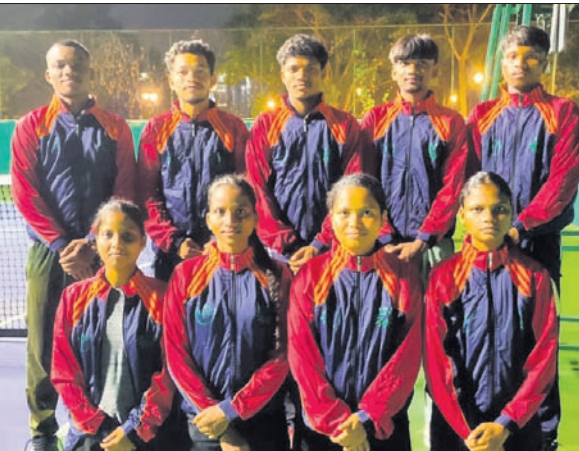
କିସ୍ ବିଶ୍ୱବିଦ୍ୟାଳୟ ମହିଳା ଓ ପୁରୁଷ ଟେନିସ୍ ଦଳ।

ମହିଳା ଦଳରେ ସେଷ୍ଟିଅନ ଟେକପୁର ବିଶ୍ୱବିଦ୍ୟାଳୟକୁ ବିଶ୍ୱବିଦ୍ୟାଳୟକୁ କିସ୍ ଏବଂ ଡିଡିୟୁ ବିଶ୍ୱବିଦ୍ୟାଳୟକୁ କିସ୍, ସେଷ୍ଟିଅନ ବିଶ୍ୱବିଦ୍ୟାଳୟକୁ ମହିଳା ପୁରୁଷ ବିଶ୍ୱବିଦ୍ୟାଳୟ ଏବଂ ସୋଆ ବିଶ୍ୱବିଦ୍ୟାଳୟ ପୁଣିତ ରବିଶଙ୍କର ଶୁକ୍ଳା ବିଶ୍ୱବିଦ୍ୟାଳୟ ପରାସ୍ତ କରିଛି।