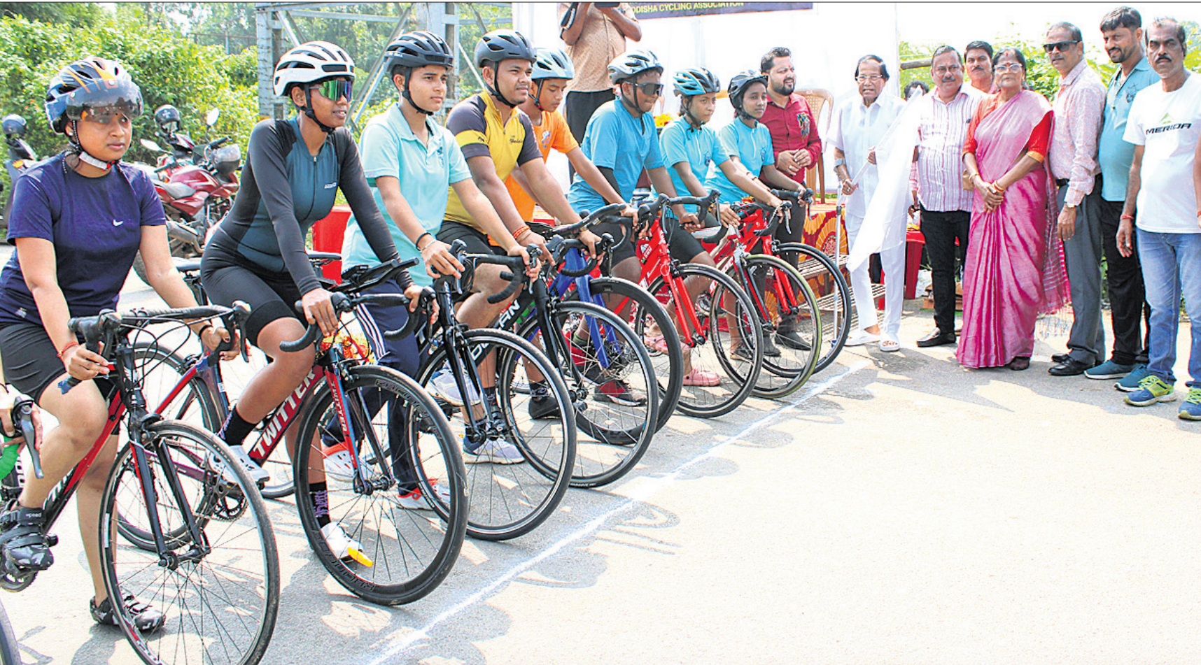
ରାଜ୍ୟସ୍ତରୀୟ ସାଇକ୍ଲିଂ ପ୍ରତିଯୋଗିତାକୁ ସାମାଜିକ କଳା ନୂଆପାଟଣାସ୍ଥିତ ମଧୁସୂଦନ ସେନ୍ଦ୍ର ଉପରେ ପତାକା ଦେଖାଇ ଆଶୀର୍ବାଦ ଦେହେରା ଶୁଭାରମ୍ଭ କରୁଛନ୍ତି ।