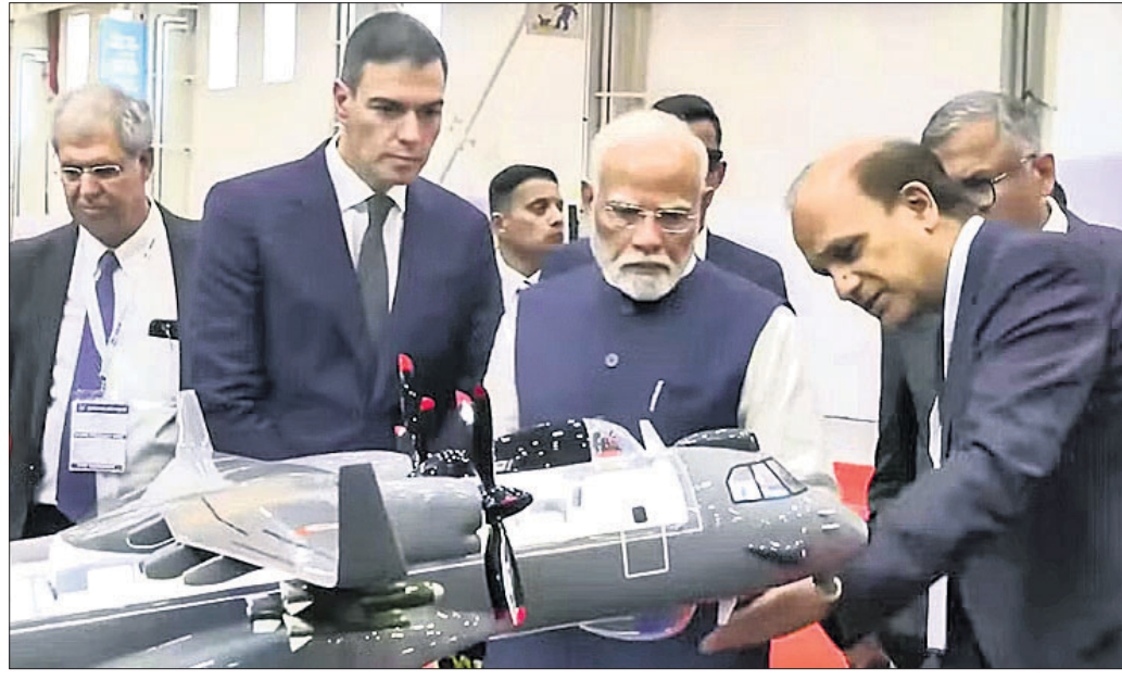
ପ୍ରଧାନମନ୍ତ୍ରୀ ନରେନ୍ଦ୍ର ମୋଦି ଓ ଶ୍ରେୟ ପ୍ରତିପକ୍ଷ ପେଡ୍ରୋ ପାଷ୍ଟେଲ୍ ସାମରିକ ବିମାନ କାରଖାନା ଉଦ୍‌ଘାଟନ କରୁଛନ୍ତି।