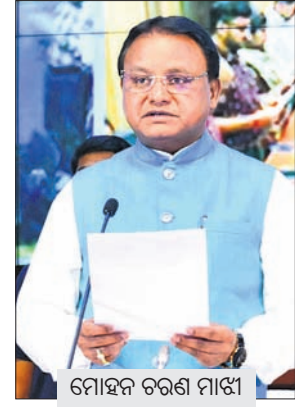
ମୋହନ ଚରଣ ମାଝୀ

ଲୋକସେବା ଭବନ କର୍ମଭେଦନ ସହକାରେ ସୋମବାର ରାଜ୍ୟସ୍ତରୀୟ ଦୁର୍ନୀତି ନିବାରଣ ସମ୍ମୁହ ୨୦୨୪ ପାଳନ ଅବସରରେ ମୁଖ୍ୟମନ୍ତ୍ରୀ ମୋହନ ଚରଣ ମାଝୀ ପୂଜ୍ୟ ଅତିଥି ଭାବେ ଯୋଗଦେଇ ଦୁର୍ନୀତିକୁ ଦୂର ଭାବେ ବିରୋଧ କରିବା ପାଇଁ ସମସ୍ତଙ୍କୁ ଶପଥ ପାଠ କରାଇଛନ୍ତି। ଏହି ଅବସରରେ ସେ କହିଛନ୍ତି, ଦୁର୍ନୀତି ହେଉଛି ଭୟଙ୍କର ମଧୁସୂଦ ହୋଇ ସମସ୍ତଙ୍କୁ ଦୁର୍ନୀତିରୁ କୁପ୍ରଭାବ ପ୍ରଥମେ ଜଣା ପଡ଼ିବ ନାହିଁ, ଧୀରେ ଧୀରେ