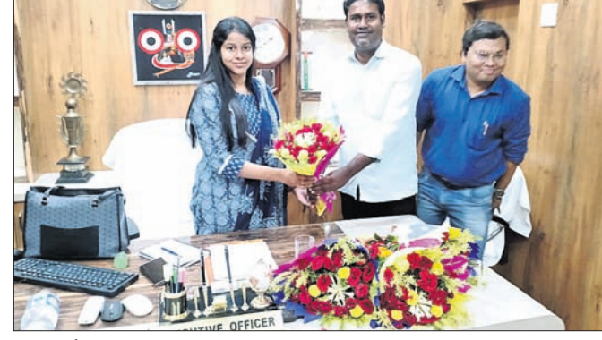
ନୂଆ ନିର୍ବାହୀ ଅଧିକାରୀଙ୍କୁ ନଗରପାଳ ସାଗର କରୁଛନ୍ତି।