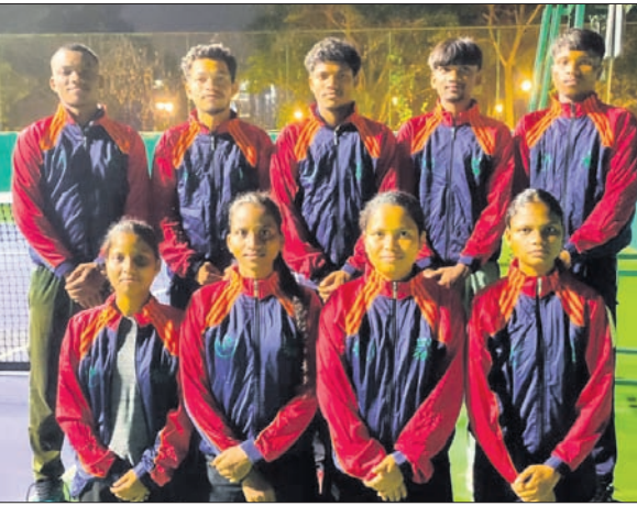
କିସ୍ ବିଶ୍ୱବିଦ୍ୟାଳୟ ମହିଳା ଓ ପୁରୁଷ ଟେନିସ୍ ଦଳ।

ମହିଳା ଦଳରେ ସେଷ୍ଟିଅନ ଟେକପୁର ବିଶ୍ୱବିଦ୍ୟାଳୟକୁ ବିଶ୍ୱବିଦ୍ୟାଳୟକୁ କିସ୍ ଏବଂ ଡିଡିୟୁ ବିଶ୍ୱବିଦ୍ୟାଳୟକୁ କିସ୍, ସେଷ୍ଟିଅନ ବିଶ୍ୱବିଦ୍ୟାଳୟକୁ ମହିଳା ଦଳକୁ କିଟ୍ ପରାସ୍ତ କରିଛି। ସେହିପରି ଏମ୍‌ଜି କାଶୀ ବିଦ୍ୟାପୀଠକୁ ବିଶ୍ୱବିଦ୍ୟାଳୟ ଏବଂ ସୋଆ ହରାଇଛି ପଶ୍ଚିତ ରବିଶଙ୍କର ଶୁକ୍ଳା ବିଶ୍ୱବିଦ୍ୟାଳୟ ପଶ୍ଚିତ ରବିଶଙ୍କର ଶୁକ୍ଳା ବିଶ୍ୱବିଦ୍ୟାଳୟ ପରାସ୍ତ କରିଛି।