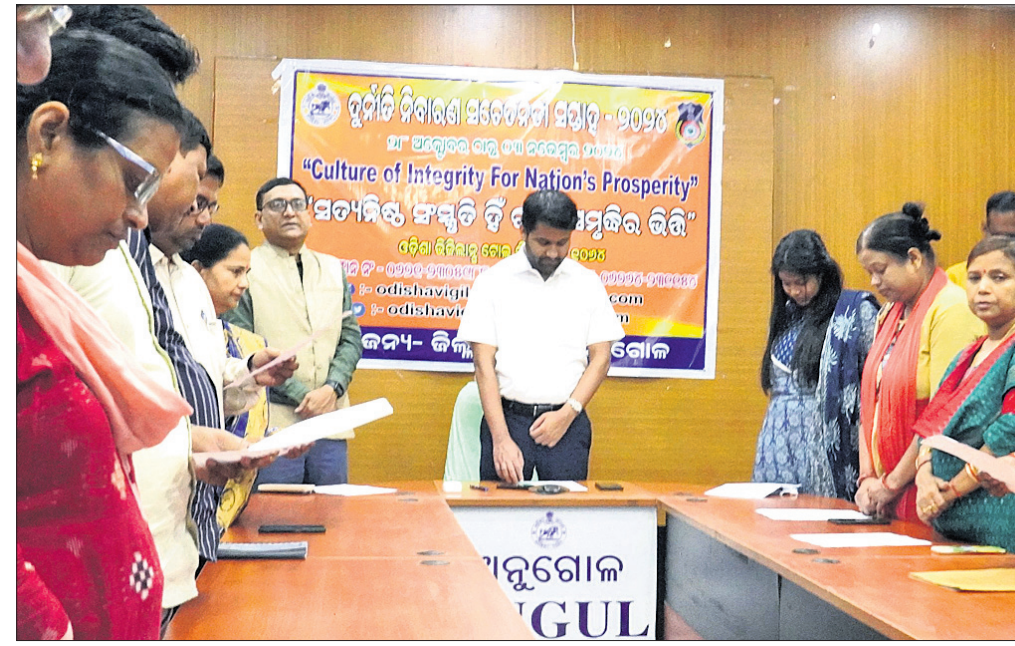
ମୋହନ ଚରଣ ମାଝି ଲୋକସେବା ଭବନରେ ଉଚିତ କନଫରେନ୍ସ

ଅନୁଗୋଳ ଜିଲା କାର୍ଯ୍ୟାଳୟ ଓସ୍ତାଧନ ହଲ୍‌ରେ ୨୮ ରୁ ନଭେମ୍ବର ୩ ତାରିଖ ପର୍ଯ୍ୟନ୍ତ ଦୁର୍ନୀତି ନିବାରଣ ସଚେତନତା ସପ୍ତାହ ପାଳନ କରାଯାଉଛି। ସମାଜର ବିଭିନ୍ନ କ୍ଷେତ୍ରରୁ ଦୁର୍ନୀତି ହଟାଇ ଶାନ୍ତି ଓ ସୌହାର୍ଦ୍ଦ୍ୟପୂର୍ଣ୍ଣ ବାତାବରଣ ସୃଷ୍ଟି କରିବା ସହ ଜନସାଧାରଣଙ୍କୁ ନ୍ୟାୟ ପ୍ରଦାନ ଉଦ୍ଦେଶ୍ୟରେ ଏଥିରେ ସଚେତନତା ସୃଷ୍ଟି କରିବାକୁ ନେଇ ଆରମ୍ଭ ହୋଇଥିବା ଦୁର୍ନୀତି ନିବାରଣ ସଚେତନତା ସପ୍ତାହରେ ଅଧିକାରୀ ଓ କର୍ମଚାରୀମାନେ ଶପଥ ନେଇଛନ୍ତି। ଚଳିତବର୍ଷର ବାର୍ଷିକ ହେଉଛି ସତ୍ୟନିଷ୍ଠ ସଂସ୍କୃତି ହିଁ ରାଷ୍ଟ୍ର ସମୃଦ୍ଧିର ଭିତ୍ତି। ସମାଜର ପ୍ରତ୍ୟେକପ୍ରସ୍ତରରୁ ଦୁର୍ନୀତିର ମୂକୋଦ୍ଧାବନ ନିମନ୍ତେ ସମସ୍ତେ ଆଗେଇ ଆସିବା ସହ ଜୀବନର ସବୁ କ୍ଷେତ୍ରରେ ସାଧୁତା ଓ ସଚ୍ଚୋଟତା ଅବଲମ୍ବନ କରି ରାଜ୍ୟକୁ ଦୁର୍ନୀତିମୁକ୍ତ କରିବା ଉଦ୍ଦେଶ୍ୟରେ ମୁଖ୍ୟମନ୍ତ୍ରୀ