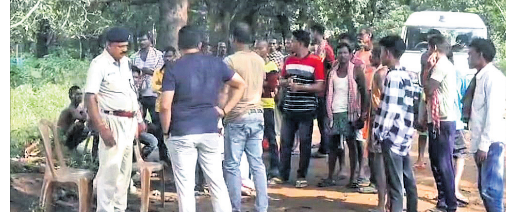
ନିମ୍ନୁଡ଼ି, ଜଙ୍ଗଲୀକଳୁ ବିଶେଷକରି ହାତୀ ଉପଦ୍ରବକୁ ଧନକାବନକୁ ପୁରୁଣା ଯୋଗାଇଦେବା ନିମନ୍ତେ ଗାଁ ଚରୁଃପାର୍ଶ୍ୱରେ ସୌରବାଡ଼ ସହ ଗାଁକୁ

ରାସ୍ତା ନିର୍ମାଣ ଆଦି ଦାବିନେଇ ସ୍ଥାନୀୟ ଲୋକେ ଆନ୍ଦୋଳନ କରିଥିଲେ। ଘଟଣାସ୍ଥଳରେ ପୁରୁଣାକୋଟ ରେଞ୍ଜ ଅଧିକାରୀ, ସାତକୋଶିଆ ଏସିଏସ୍,