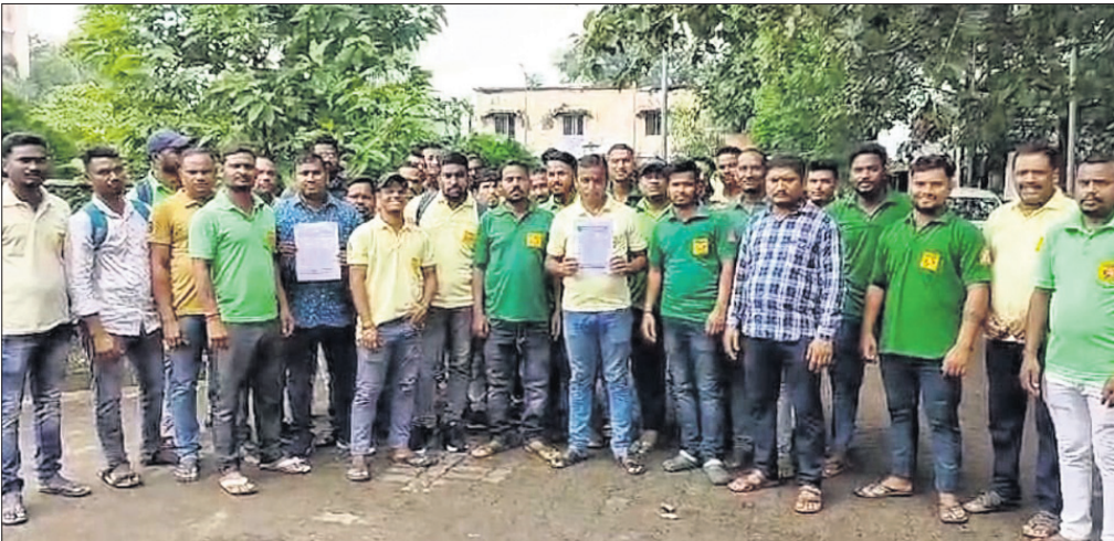
ଜିଲାପାଳଙ୍କୁ ଦାବିପତ୍ର ପ୍ରଦାନ ପାଇଁ ଆସିଥିବା ଆତ୍ମଲୀଳା କର୍ମଚାରୀମାନେ।

ଅନୁଗୋଳ ଜିଲାରେ କାର୍ଯ୍ୟରତ ୧୦୮ ଆତ୍ମଲୀଳା କର୍ମଚାରୀମାନେ ୧୧ ଦଫା ଦାବି ନେଇ ଯୋଗଦାନ ଜିଲାପାଳଙ୍କୁ ଏକ ଦାବିପତ୍ର ପ୍ରଦାନ କରିଛନ୍ତି। ଅଲ୍ ଓଡ଼ିଶା ୧୦୮ ଆତ୍ମଲୀଳା କର୍ମଚାରୀ ମହାସଂଘରେ କାର୍ଯ୍ୟରତ କର୍ମଚାରୀ ବିଗତ ୨୦୧୩ ମସିହା ଠାରୁ ଠିକା ସଂଗ୍ରା (ଡିକିଆ ହେଲଥ କେୟାର ଲିମିଟେଡ୍) ଦ୍ୱାରା ପରିଚାଳିତ ହୋଇଥିବା ୧୦୮ ଆତ୍ମଲୀଳା କର୍ମଚାରୀଙ୍କୁ ନିଷ୍ଠାପୂର୍ଣ୍ଣ ଓ ନିରାପତ୍ତ ଭାବରେ ସେବା ଯୋଗାଇ ଆସୁଛନ୍ତି। ଅକ୍ଟୋବର ୨୧ ଠାରୁ ଅନ୍ୟ ଏକ ଠିକା ସଂଗ୍ରା ନୂତନ ଦାୟିତ୍ୱ ଗ୍ରହଣ କରିଛି। ଜିଲା ଓଡ଼ିଶାରେ ୨୦୦ କର୍ମଚାରୀଙ୍କୁ କାର୍ଯ୍ୟ ଦେଇନାହିଁ। ଫଳରେ ସମସ୍ତ କର୍ମଚାରୀ ନିଜ ଜିଲାର ଜିଲାପାଳଙ୍କୁ ଦାବିପତ୍ର ପ୍ରଦାନ କରିଛନ୍ତି। ଆସନ୍ତା