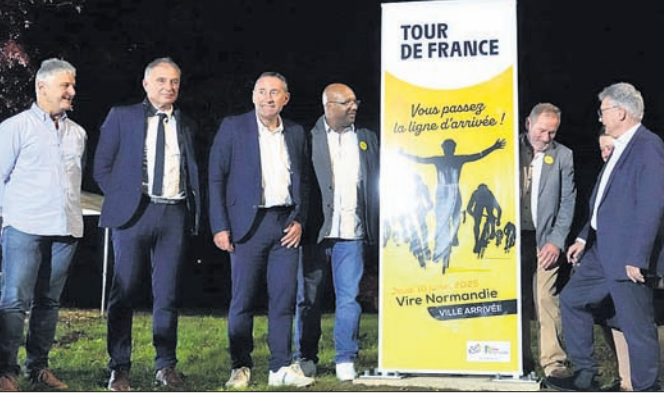
ରୁର୍ ଡି ପ୍ରାନ୍ତର ନୂଆ ରୁର୍ ସମ୍ପର୍କରେ ଅଧିକାରୀମାନେ ସୂଚନା ଦେଇଛନ୍ତି।

ପ୍ୟାରିସ, ୩୦.୧୦ (ପି.ଟି.) ଭେଷ୍ଟକୁ, ଦ କୋଲ ଡି ଲା କୋଲି ଓ ଆଲ୍‌ସ୍ ପର୍ବତମାଳରେ ଅଧିକ ପର୍ଯ୍ୟାୟରେ ରେସ୍ ଅନୁଷ୍ଠିତ ହେବ। ଏହି ରେସ୍ ହେଉଥିବା ପୂର୍ବାପେକ୍ଷା ଏହି ରେସ୍ ଏକ ପାରମ୍ପରିକ ରୂପରେ ଭେଷ୍ଟକୁ ମିଳିବ। ପୂର୍ବରୁ ପ୍ୟାରିସ୍ ବାହାରେ ଏହି ରେସ୍ କିଛି ଅଂଶ ରଖିଥିବା ବେଳେ ଚଳିତ ବର୍ଷ ଏହା ସମ୍ପୂର୍ଣ୍ଣ ପ୍ୟାରିସ୍‌ରେ ରହିବ। ପ୍ରଥମ ସମ୍ପାଦନରେ ସାଧାରଣତଃ ସମତଳ ଅଞ୍ଚଳରେ ଏହି ପ୍ରତିଯୋଗିତା ଅଂଶ ଦେଖିବାକୁ ମିଳିବ। ରେବେ ପରବର୍ତ୍ତୀ ୧୦ ପର୍ଯ୍ୟାୟରେ ପାହାଡ଼ିଆ ଅଞ୍ଚଳରେ ରେସ୍ ଦେଖିବାକୁ ମିଳିବ। ରୁର୍ ଉତ୍ତମକେଶ କାର୍ଯ୍ୟକ୍ରମରେ ଭିଜେଗାଟ୍ ଅନୁପସ୍ଥିତ ଥିଲେ ମଧ୍ୟ ସେ ଏହି ରୁର୍ ଦେଖି ଖୁସି ହେବେ ବୋଲି କହିଛନ୍ତି ଡାକ୍ ଟିମ୍ ଡାମ୍ପା ଲିଜର୍ ମୁଖ୍ୟ କୋଣସି ଦଳ ଜିତି ନ ଥିଲେ। ଦ୍ୱିତୀୟ ସଂସ୍କରଣରେ ସେ ନିଜ ବେସ୍ ପ୍ରାକ୍ତମ୍ ୩୦ ଲକ୍ଷରେ ଯୁସି ଓରିୟର୍ଜରେ ସାମିଲ ହୋଇଥିଲେ। ସମାନ ମୂଲ୍ୟରେ ଯୁସି ତାମିସଲକୁ ଟ୍ରେଡ୍ କରିଥିବା ଜଣା ପଡିଛି। ସେ ଇଂଲଣ୍ଡ ପକ୍ଷରୁ ୧୨୪ ଟି ୨୦ ଅର୍ଦ୍ଧଶତକ ଟି ୨୦ ମ୍ୟାଚ୍ ଖେଳିଛନ୍ତି।