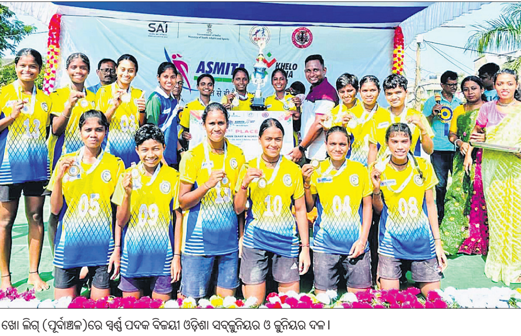
ପଶ୍ଚିମବଙ୍ଗର ହକିଆଠାରେ ଅନୁଷ୍ଠିତ ଅସିମିଆ ଖେଳା ଲଞ୍ଜିଆ ମହିଳା ଗୋଲ ଖୋ ଖୋ ଲିଗ୍ (ପୂର୍ବାଞ୍ଚଳ)ରେ ଷ୍ଟର୍ସ ପଦକ ବିଜୟୀ ଓଡ଼ିଶା ସର୍ବକ୍ରମିୟର ଓ କୁନିୟର ଦଳ।

ନୂଆଦିଲ୍ଲୀ, ୩୦.୧୦ (ପି.ଟି.): ଇଂଲଣ୍ଡ ମହିଳା ଦଳର ଚାରକା ଖେଳାଳି ତାମିସଲ ଓ ଓ ହକ୍ ଓପେଟ୍ସ୍ ପ୍ରିମିୟର ଲିଗ୍(ଡବ୍ଲ୍ୟୁପିଏଲ୍)ର ଆସକା ସଂସ୍କରଣରେ ଉତ୍ତମ ଖେଳାଳିଙ୍କୁ ବେଙ୍ଗାଲୁରୁ (ଆରସିବି) ପକ୍ଷରୁ ଖେଳିବାକୁ ଯାଉଛନ୍ତି। ୩୩ ବର୍ଷୀୟ ଓ ଓ ଯୁସି ଓରିୟର୍ଜ ନିକଟରୁ ଟ୍ରେଡ୍ କରିଛନ୍ତି ଆରସିବି। ସାମାଜିକ ଭାବରେ ଅର୍ପିସିନ୍ ବୋଲି ଏହା ଟପ୍ ଅର୍ଡରରେ ବ୍ୟାଟ୍ କରୁଥିବା ତାମିସଲ ପ୍ରଥମ ସଂସ୍କରଣରେ ଡବ୍ଲ୍ୟୁପିଏଲରେ କୋଣସି ଦଳ ଜିତି ନ ଥିଲେ। ଦ୍ୱିତୀୟ ସଂସ୍କରଣରେ ସେ ନିଜ ବେସ୍ ପ୍ରାକ୍ତମ୍ ୩୦ ଲକ୍ଷରେ ଯୁସି ଓରିୟର୍ଜରେ ସାମିଲ ହୋଇଥିଲେ। ସମାନ ମୂଲ୍ୟରେ ଯୁସି ତାମିସଲକୁ ଟ୍ରେଡ୍ କରିଥିବା ଜଣା ପଡିଛି। ସେ ଇଂଲଣ୍ଡ ପକ୍ଷରୁ ୧୨୪ ଟି ୨୦ ଅର୍ଦ୍ଧଶତକ ଟି ୨୦ ମ୍ୟାଚ୍ ଖେଳିଛନ୍ତି।