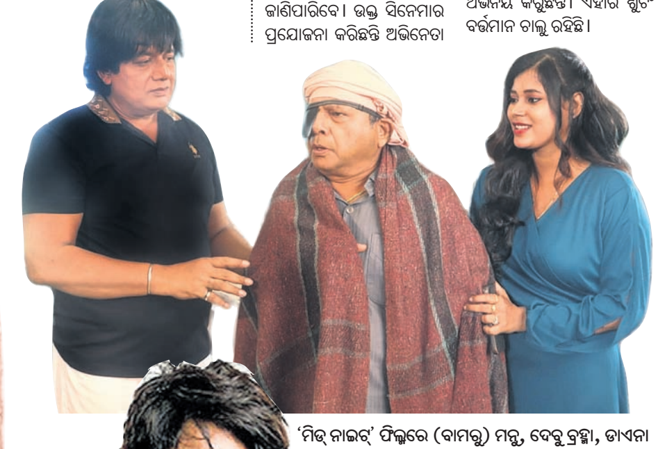
'ନିଶୁ ନାଲନ୍' ଫିଲ୍ମରେ (ବାମକୁ) ମନ୍ତ୍ର, ଦେବୁ ବ୍ରହ୍ମା, ତାଏନା