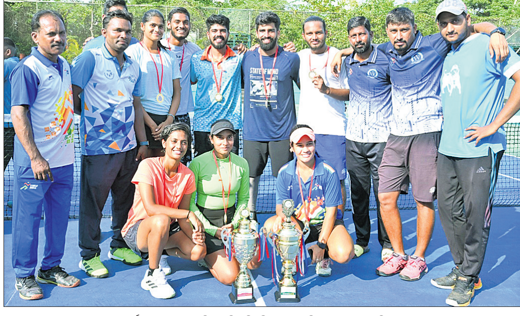
ସପୋର୍ଟ୍ ଷ୍ଟାଫ୍ ସହ ଚାମ୍ପିୟନ କିର୍ ବିଶ୍ୱବିଦ୍ୟାଳୟ ମହିଳା ଓ ପୁରୁଷ ଟେନିସ୍ ଦଳ।

ଭୁବନେଶ୍ୱର, ୩୦.୧୦ (ତପନ ସାଲ୍) ଗୁଜରାଟ ଲିଆଣ୍ଡର ସେପ୍ଟେମ୍ବର ଷ୍ଟାଫ୍ ମଧ୍ୟରେ ଅନୁଷ୍ଠିତ ପୂର୍ବାଞ୍ଚଳ ଆଞ୍ଚଳିକ ଲିଆଣ୍ଡ ବିଶ୍ୱବିଦ୍ୟାଳୟ ଟେନିସ୍ ପ୍ରତିଯୋଗିତାର ଉତ୍ତମ ମହିଳା ଓ ପୁରୁଷ ବିଭାଗରେ କିର୍ ଚାମ୍ପିୟନ ହୋଇଛି। ରୁଷ୍ଟାଙ୍କ ଅନୁଷ୍ଠିତ ପାଇନାଲରେ କିର୍ ପୁରୁଷ ଦଳ ମଣିପୁର ବିଶ୍ୱବିଦ୍ୟାଳୟକୁ ୨-୧ରେ ଏବଂ ମହିଳା ଦଳ ପଞ୍ଚିତ ରବିଶଙ୍କର ଶୁକ୍ଳା ବିଶ୍ୱବିଦ୍ୟାଳୟକୁ ୨-୧ରେ ହରାଇ ପ୍ରଥମସ୍ଥାନ ଅଧିକାର କରିଛି। ପୁରୁଷ ବର୍ଗରେ କିର୍ ପ୍ରଥମ, ମଣିପୁର ଦ୍ୱିତୀୟ, ରାଜପୁରର ପଞ୍ଚିତ ରବିଶଙ୍କର ଶୁକ୍ଳା ବିଶ୍ୱବିଦ୍ୟାଳୟ ତୃତୀୟ ଓ ପଶ୍ଚିମବଙ୍ଗର ଯାଦବପୁର ବିଶ୍ୱବିଦ୍ୟାଳୟ ୪ର୍ଥ ସ୍ଥାନ ଅଧିକାର କରିଛି। ସେହିପରି