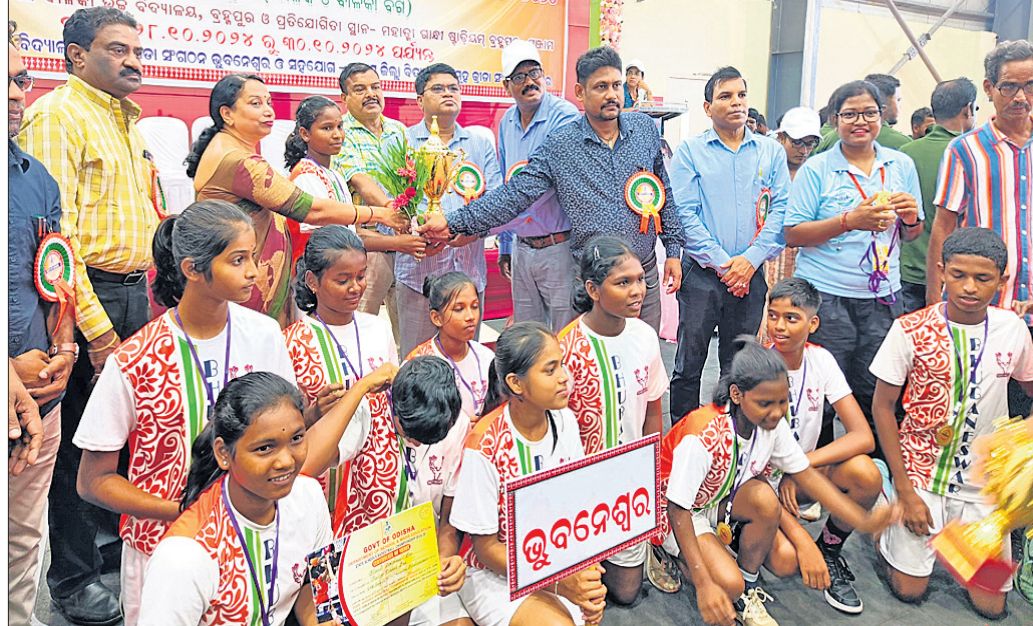
କୃତୀ ପ୍ରତିଯୋଗୀଙ୍କୁ ଚୁପ୍ ପ୍ରଦାନ କରାଯାଇଛି।