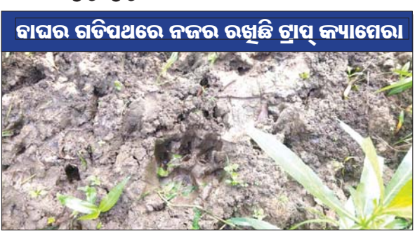
ବାଘର ଗତିପଥରେ ନଜର ରଖି ଗ୍ରାମ କ୍ୟାମେରା ମହାବଳରେ ବାଘର ପାଦଚିହ୍ନ ଠାବ କରାଯାଇଛି। ବାଘ ବୁଲୁଥିବା ଖବର ରୁଧିରୀର ସକାଳେ ପ୍ରଚାରିତ ହେବାପରେ ସମ୍ପୃକ୍ତ ଅଞ୍ଚଳରେ ଭୟ ସୃଷ୍ଟି ହୋଇଛି। ମଙ୍ଗଳବାର ରାତିରେ ଖମାରୀ ଗାଁ ଘୋଡ଼ାହାଡ଼ ଡ୍ୟାମ ନିକଟସ୍ଥ ପଦ୍ମପୁର ଗ୍ରାମର ମଙ୍ଗଳା ମଞ୍ଚଳକ

ଦିଗପହଣ୍ଡି, ୩୦।୧୦ (ଅଶେଷ ନାଥ ମିଶ୍ର) ଗଞ୍ଜାମ ଗଜପତି ଜିଲ୍ଲା ସାମାଜିକ ଦିଗପହଣ୍ଡି ରୁକ୍ମିଣୀ ଗାଁ ପଞ୍ଚାୟତର ଆଦିବାସୀ ଗ୍ରାମ ପଦ୍ମପୁର ନିକଟସ୍ଥ ମହାବଳରେ ମହାବଳ ବାଘର ପାଦ ଚିହ୍ନକୁ ବନବିଭାଗ ପକ୍ଷରୁ ଠାବ କରାଯାଇଛି। ବାଘ ବୁଲୁଥିବା ଖବର ରୁଧିରୀର ସକାଳେ ପ୍ରଚାରିତ ହେବାପରେ ସମ୍ପୃକ୍ତ ଅଞ୍ଚଳରେ ଭୟ ସୃଷ୍ଟି ହୋଇଛି। ମଙ୍ଗଳବାର ରାତିରେ ଖମାରୀ ଗାଁ ଘୋଡ଼ାହାଡ଼ ଡ୍ୟାମ ନିକଟସ୍ଥ ପଦ୍ମପୁର ଗ୍ରାମର ମଙ୍ଗଳା ମଞ୍ଚଳକ