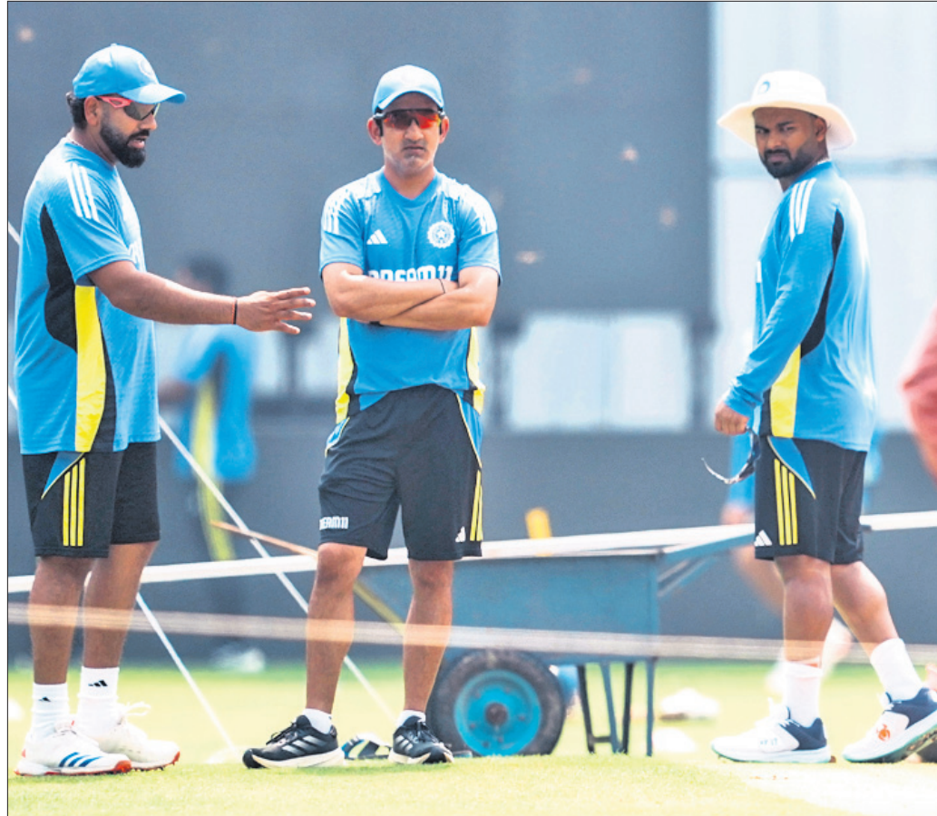
ରୁସ୍ତାମ ନେତୃ ଅବସରରେ ଅଧିନାୟକ ରୋହିତ ଶର୍ମା ଓ କୋଚ୍ ଗୌତମ ଗମ୍ଭୀର ପୂର୍ବ ନିରୀକ୍ଷଣ କରୁଛନ୍ତି।

ମୁମ୍ବାଇ, ୩୦/୧୦ (ପି.ଟି.) ଦୁଇଦିନିଆ ଚାରିଦିନୀୟ ବିଶ୍ୱ ଖେଳିବାକୁ ବ୍ୟାଚରଙ୍କ ଅଭ୍ୟାସ ରିତିକାଙ୍କୁ ୨ ସ୍ୱର୍ଣ୍ଣ ସହ ୪ ପଦକ ଭାରତୀୟ ଦଳର ନେତୃ ସେସନ