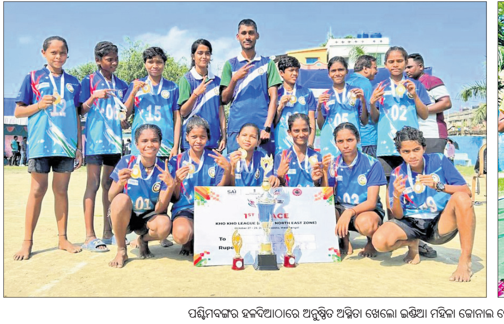
ପଶ୍ଚିମବଙ୍ଗର ହକିଆଠାରେ ଅନୁଷ୍ଠିତ ଅସିମିଆ ଖେଳା ଲଞ୍ଜିଆ ମହିଳା ଗୋଲ ଖୋ ଖୋ ଲିଗ୍ (ପୂର୍ବାଞ୍ଚଳ)ରେ ଷ୍ଟର୍ସ ପଦକ ବିଜୟୀ ଓଡ଼ିଶା ସର୍ବକ୍ରମିୟର ଓ କୁନିୟର ଦଳ।

ଭୁବନେଶ୍ୱର ଦଳ ଚାମ୍ପିୟନ ଓ ଗଞ୍ଜାମ ଦଳ ରନର୍ସଅପ ହୋଇଛି। ବାଳକରେ ଭୁବନେଶ୍ୱର ଚାମ୍ପିୟନ ଓ କଟକ ଦଳ ରନର୍ସଅପ ହୋଇଛି। ଓଡ଼ିଶା ରାଜ୍ୟ ବିଦ୍ୟାଳୟ ସମୂହ କ୍ରୀଡା ସଙ୍ଗଠନ ଓ ଗଞ୍ଜାମ ବିଦ୍ୟାଳୟ ସମୂହ କ୍ରୀଡା ସଙ୍ଗଠନ ମିଳିତ ସହଯୋଗରେ ଏହି ପ୍ରତିଯୋଗିତା ହୋଇଥିଲା।