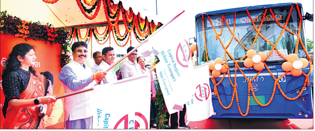
ମନ୍ତ୍ରୀ ଡ. କୃଷ୍ଣଚନ୍ଦ୍ର ମହାପାତ୍ର ଓ ଅଧିକାରୀମାନେ ନୂଆ ଇ-ବସ୍ ସେବାର ଉଦ୍‌ଘାଟନ କରୁଛନ୍ତି। ଭୁବନେଶ୍ୱର, ୩୦.୧୦

କ୍ୟାପିଟାଲ୍ ରିଜିଅନ ଅର୍ବାନ ଟ୍ରାନ୍ସପୋର୍ଟ (କ୍ରୁ) ପକ୍ଷରୁ ୧୨ଟି ନୂଆ ଇ-ବସ୍ ସେବାର ଶୁଭାରମ୍ଭ କରାଯାଇଛି। ଏସବୁ ବସ୍ ୨ଟି ନୂଆ ରୁଟ୍‌ରେ ଚଳିବ। ମାଷ୍ଟରକ୍ୟାଣ୍ଟିନରୁ ଖୋର୍ଦ୍ଧା ନୂଆ ବସ୍‌ଷ୍ଟାଣ୍ଡ ଭାୟା ଖାଉଁଳା ପାର୍କ (ରୁଟ୍ ନଂ.୧୫) ଏବଂ ବିଜୁ ପଟ୍ଟନାୟକ ବିମାନବନ୍ଦରରୁ ପଥରଗାଡ଼ିଆ ଓ କିମ୍ ମହାବିଦ୍ୟାଳୟ ଭାୟା ମାଷ୍ଟରକ୍ୟାଣ୍ଟିନ (ରୁଟ୍ ନଂ.୧୬) ସୂତ୍ରି କରାଯାଇଛି। ଏହାସହ ବାବା ସାହେବ ଭାମରାଓ ଆୟୋଜନ ବସ୍‌ଷ୍ଟାଣ୍ଡ (ବିଏସ୍‌ଏସ୍‌ସି) ବରପୁଞ୍ଜା, ମାଷ୍ଟରକ୍ୟାଣ୍ଟିନ ବସ୍‌ଷ୍ଟାଣ୍ଡ ଓ