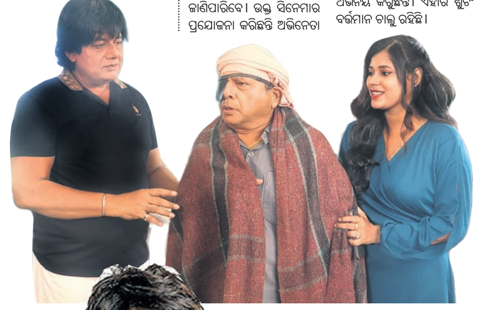
'ନିହ ନାଲନ୍' ଫିଲ୍ମରେ (ବାମକୁ) ମନ୍ତୁ, ଦେବୁ ବ୍ରହ୍ମା, ତାଏନା