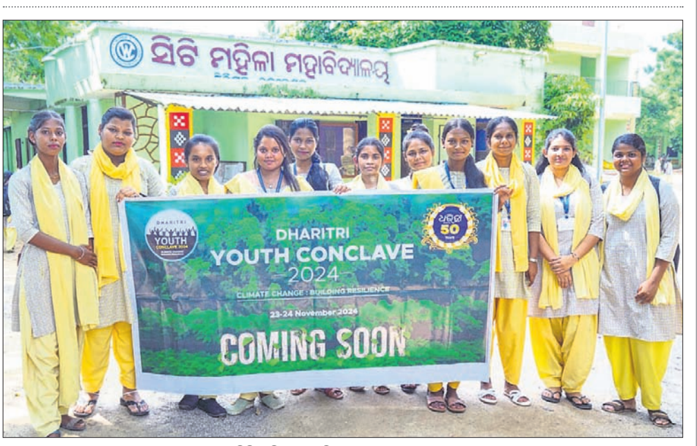
ସିଟି ମହିଳା ମହାବିଦ୍ୟାଳୟ, ଭୁବନେଶ୍ୱର।