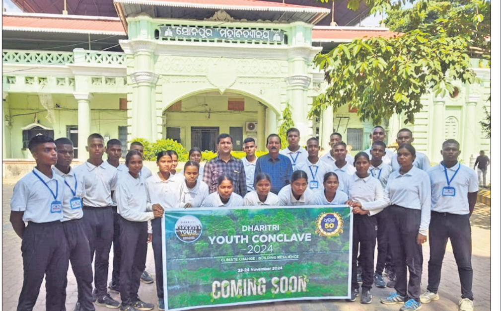
ସୋନପୁର ମହାବିଦ୍ୟାଳୟ, ସୋନପୁର।