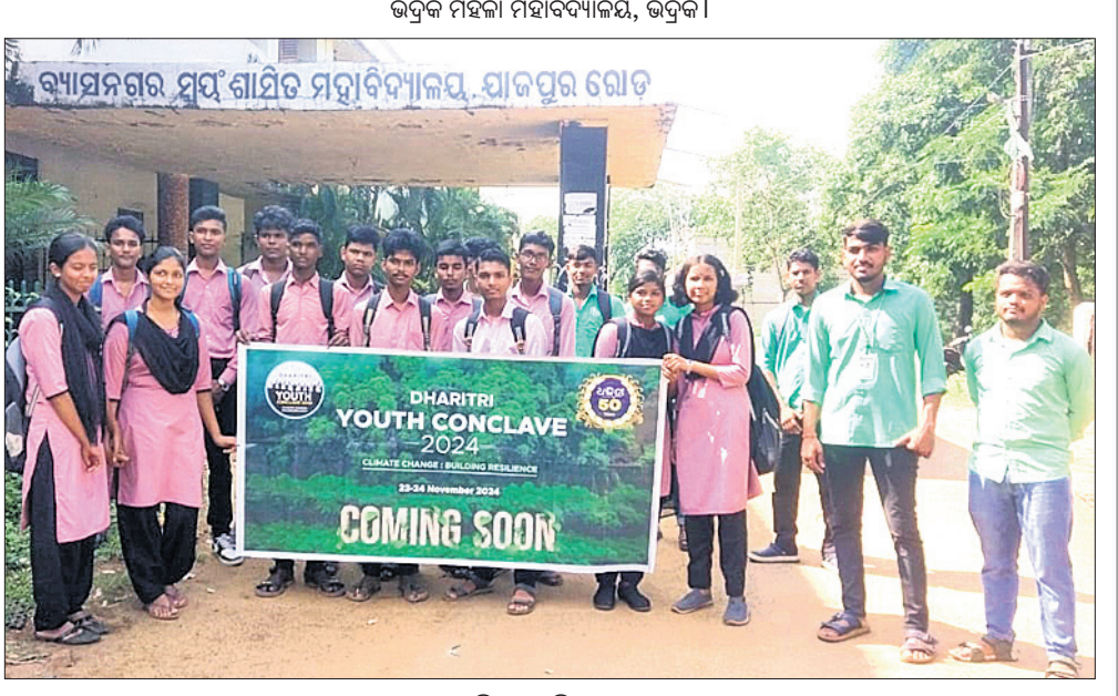
ବ୍ୟାସନଗର ସ୍ୱୟଂଶାସିତ ମହାବିଦ୍ୟାଳୟ, ଯାଜପୁର ରୋଡ୍।