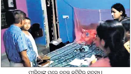
ପାଢ଼ିତାଙ୍କ ଘରେ ତଦନ୍ତ କରିବାର ସମୟ।