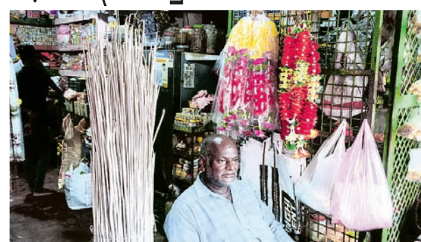
ବଡ଼ା ଦାମରେ ବିକ୍ରି ହେଉଥିବା କାଉଁରିଆ କାଠି।

ଘର ହିତାଧିକାରୀଙ୍କ ବିରୋଧରେ କାର୍ଯ୍ୟାଳୟ ଗ୍ରହଣ କରିବା ପରିବର୍ତ୍ତେ ଅଧିକାରୀଙ୍କ ଦରମା ବନ୍ଦ କରିବା ଅତ୍ୟନ୍ତ ଦୁର୍ଭାଗ୍ୟକରକ ବୋଲି କେତେଜଣ କର୍ମଚାରୀ ନାମ ଗୋପନ ରଖିବା ସର୍ତ୍ତରେ କହିଛନ୍ତି। ସେହିପରି ୨ ବର୍ଷ ଧରି ନେତା ଓ ଅଧିକାରୀଙ୍କ ଚେଷ୍ଟା ବାଧ୍ୟତାରେ ଆରମ୍ଭ କରି ସମସ୍ତ କାର୍ଯ୍ୟକୁ ସଫଳ କରିବା ପାଇଁ ଅଧିକାରୀଙ୍କୁ ଦାୟିତ୍ୱ ଦିଆଯାଇଥିଲା। ପ୍ରକୃତ କାର୍ଯ୍ୟ କରିବା ପରିବର୍ତ୍ତେ ସରକାରଙ୍କ କାର୍ଯ୍ୟକ୍ରମରେ ଅଧିକ ସମୟ କଟିଯାଉଥିଲା। ଏପରିକି ବିତ୍ତୀୟ, ତହସିଲଦାରଙ୍କଠାରୁ ଆରମ୍ଭ କରି ଚଳୁଥିବା କର୍ମଚାରୀମାନେ ସେହି କାର୍ଯ୍ୟରେ ନିୟୋଜିତ ରହୁଥିଲେ। ଯାହା ଫଳରେ ସରକାରଙ୍କ ଯୋଜନା ସଫଳ ହେବା ପରିବର୍ତ୍ତେ ବୃଦ୍ଧି ହୋଇପଡ଼ିଛି ବୋଲି ବୁଝିକାଦା ମତ ଦେଇଛନ୍ତି।