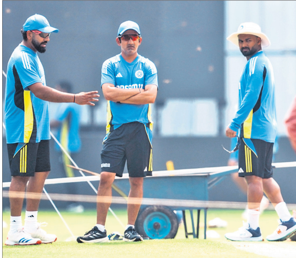
ରୁସ୍ତୁର ନେତୃ ଅବସରରେ ଅଧିନାୟକ ରୋହିତ ଶର୍ମା ଓ କୋଚ୍ ଗୌତମ ଗମ୍ଭୀର ପୂର୍ବ ନିରୀକ୍ଷଣ କରୁଛନ୍ତି।