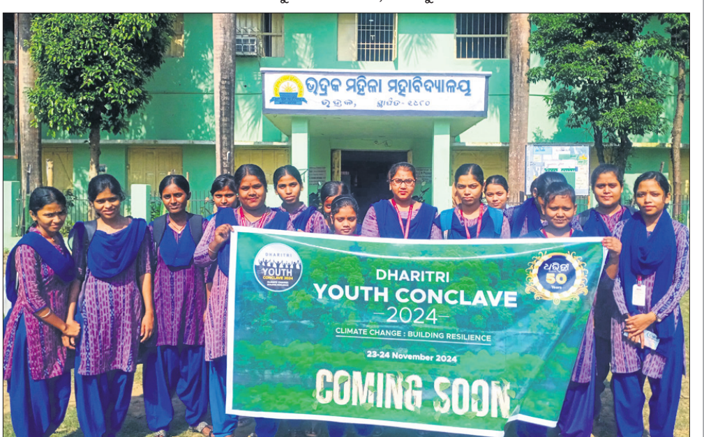
ଭଦ୍ରକ ମହିଳା ମହାବିଦ୍ୟାଳୟ, ଭଦ୍ରକ।