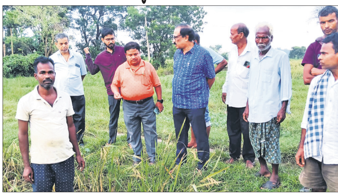
କୃଷି ବିଭାଗର ଅଧିକାରୀ କ୍ଷୟକ୍ଷତି ଆକଳନ କରୁଛନ୍ତି।

ଧାନନଗର, ୩୦।୧୦(ଦେବେନ୍ଦ୍ର ଆଦିଆ) ସେଥି ମଧ୍ୟରୁ ବିଭିନ୍ନ ଅଞ୍ଚଳରେ ମୋଟ ୪୦ ହେକ୍ଟର ଜମିରେ ପନିପରିବା ଫସଲ ନଷ୍ଟ ହୋଇଥିବା ବେଳେ ୮ ହଜାର ହେକ୍ଟର ଧାନ ଚାଷ ନଷ୍ଟ ହୋଇଥିବା କୃଷି ବିଭାଗ ପ୍ରାଥମିକ ଆକଳନରୁ ଅନୁମାନ କରାଯାଇଛି।