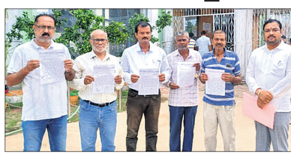
ଧର୍ମରକ୍ଷା ସମିତିର କର୍ମକର୍ମୀମାନେ।

ଭଦ୍ରକ, ୩୦।୧୦(ରବିନାରାୟଣ ଖୁଲାର) ସଂସ୍କୃତି ଓ ପରମ୍ପରା ବିରୋଧୀ ଅଟେ। ଏଥିସହ ହିନ୍ଦୁ ଦେବାଦେବୀଙ୍କୁ ନେଇ ବ୍ୟଙ୍ଗାତ୍ମକ ଦୃଶ୍ୟ ପରିବେଷଣ ହେଉଛି। ଯାହାକି ଆମ ଧର୍ମ ଓ ଆତ୍ମାକୁ କୁଳାଘାତ କରୁଛି।