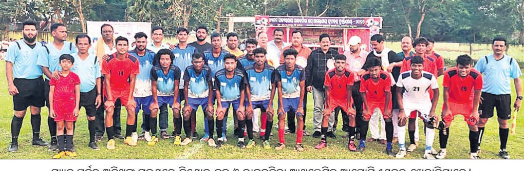
ମ୍ୟାଚ ପୂର୍ବରୁ ଅତିଥିକ୍ୱ ଗହଣରେ କିଶୋର କ୍ଲବ୍ ଓ ରାଜକନିକା ଆଥଲେଟିକ୍ ଆସୋସିଏସନ୍ର ଖେଳାଳିମାନେ।

ରାଜକନିକା ଆଥଲେଟିକ୍ ଆସୋସିଏସନ୍ ଆନୁକୁଲ୍ୟରେ ରାଜକନିକା ନାମାୟକ ଉପକ୍ରମରେ କିଶୋର କ୍ଲବ୍ ଗଠନ କରାଯାଇଛି।