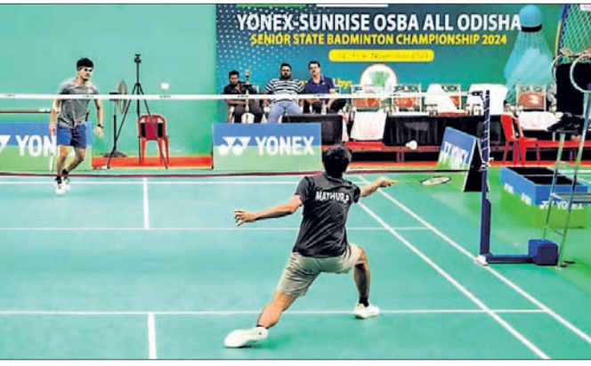
ରବିବାର ଅନୁଷ୍ଠିତ ଏକ କ୍ୱାର୍ଟରଫାଇନାଲ୍ ମ୍ୟାଚ୍।