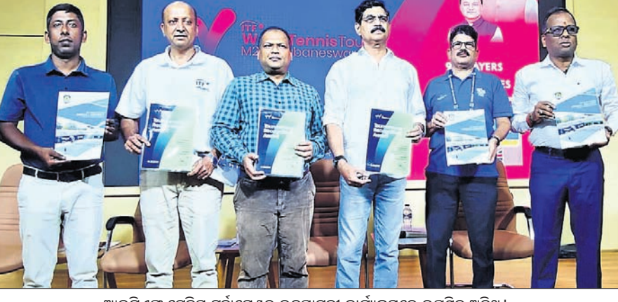
ଆଇଟିଏସ୍ ଟେନିସ୍ ଟୁର୍ନାମେଣ୍ଟର ଉଦ୍‌ଘାଟନା କାର୍ଯ୍ୟକ୍ରମରେ ଉପସ୍ଥିତ ଅତିଥି ।

କ୍ରୀଡ଼ା ସହ ଉଲ୍ଲସିତ ହୋଇଥିବା ଦଳ । ଭାରତୀୟ ବ୍ୟାଟରମାନେ ମାତ୍ର ୨୯.୧ ଓଭରରେ ୧୨୧ ରନ କରି ଅଲଆଉଟ ହୋଇଥିଲେ । ନ୍ୟୁଜିଲାଣ୍ଡ ଦଳରୁ ଆସିଥିବା ବ୍ୟାଟରମାନେ ୯ ଓଭରରେ ୧୨୧ ରନ କରି ଅଲଆଉଟ ହୋଇଥିଲେ । ନ୍ୟୁଜିଲାଣ୍ଡ ଦଳରୁ ଆସିଥିବା ବ୍ୟାଟରମାନେ ୯ ଓଭରରେ ୧୨୧ ରନ କରି ଅଲଆଉଟ ହୋଇଥିଲେ । ନ୍ୟୁଜିଲାଣ୍ଡ ଦଳରୁ ଆସିଥିବା ବ୍ୟାଟରମାନେ ୯ ଓଭରରେ ୧୨୧ ରନ କରି ଅଲଆଉଟ ହୋଇଥିଲେ ।