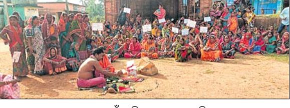
ପୂଜକ ଗାଁ ମଝିରେ ପୂଜା କରୁଛନ୍ତି।

କେନ୍ଦୁଝର ଜିଲ୍ଲା ତେଲକୋଇ ବ୍ଲକ୍ ଅଞ୍ଚଳରେ ମଦ କାରବାର ଦିନକୁ ଦିନ ବଢ଼ିବାରେ ଲାଗିଛି। ଏହାକୁ ନେଇ ଅଧିକାଂଶ ବହୁଧନୀ ବେଳେ ବିଶେଷକରି ମହିଳାମାନେ ବିରୋଧ କରିଆସୁଛନ୍ତି। ବାରମ୍ବାର ଅଭିଯୋଗ ସତ୍ତ୍ୱେ ଅବକାରୀ ବିଭାଗ ପଦକ୍ଷେପ ନେଇ ନ ଥିବାରୁ ଗ୍ରାମାଭିକାର ଅଞ୍ଚଳ ବନ୍ଦ କରିବା ପାଇଁ ଗ୍ରାମବାସୀଙ୍କୁ ଆକଳନ କରିବାକୁ ନିଷ୍ପତ୍ତି ହୋଇଛି। ଅପରାଧ ବଢ଼ିଛି, ଆଇନଶୁଳ୍କା ପରିଚ୍ଛିନ୍ନ ଉତ୍ପତ୍ତି ସହ ପରିବାରର ସାମାଜିକ ଛିଟି ଫୁଟିବା ହୋଇପାରୁଛି। ଏକଲି ଶ୍ରେଣୀରେ ଗୁମାସ୍ତା ଯଦ୍ୱାରା ଗାଁରେ ବେଆଇନ ମଦ କାରବାର ବିରୋଧରେ ଦାୟିତ୍ୱ ଧରି ଆନ୍ଦୋଳନ କରିଆସୁଥିବା ମହିଳାମାନେ ଏକ ନୂଆ ଉପାୟ ଅବଲମ୍ବନ କରିଛନ୍ତି। ଗାଁ ବାଣ୍ଟରେ ପୂଜାପାଠ କରି ମଦ ପିଇଥିବା ଓ ବିକ୍ରେତାଙ୍କୁ ଅଭିଶାପ ଦେଇଛନ୍ତି। ପ୍ରକାଶ ଯେ, ଉକ୍ତ ଗ୍ରାମରେ ଦିନକୁ ଦିନ ବେଆଇନ ମଦ କାରବାର ବୃଦ୍ଧି ପାଇଛି। ୪ରୁ ୫ ଟୋରା ଦେଖା, ବିଦେଶୀ ମଦ ବୋକାନ ଖୋଲି ମାସିଆମାନେ ଦିନ ରାତି ୨୪ ଘଣ୍ଟା ମଦ କାରବାର କରୁଛନ୍ତି। ବାଲକ୍ ଓ ବୋଲେରୋରେ ମଦ ଯୋଗାଇ ଦିଆଯାଉଛି। ମଦ ପିଇ ଘରର ପୁରୁଷମାନେ ଅଶାନ୍ତି ସୃଷ୍ଟି କରୁଛନ୍ତି। ରାଶନ ସାମଗ୍ରୀ ଓ ସୁଦ୍ରା ଅର୍ଥ ନେଇ ମଦ ପିଇବା ପାଇଁ ଲୁଚାଇ କରୁଥିବା ଅଭିଯୋଗ ହେଉଛି। ଯୋଗଗ୍ରହ ହୋଇ ଅକାଳରେ ଜୀବନ ମଧ୍ୟ ଯାଉଛି ବୋଲି ମହିଳାମାନେ କହିଛନ୍ତି। ଫଳରେ ଗାଁରେ ବେଆଇନ ମଦ କାରବାର ବନ୍ଦ ନେଇ ମହିଳାମାନେ ଏକତ୍ର ହୋଇ ଏହାକୁ ବୁଦ୍ଧି ପାଇଛନ୍ତି।