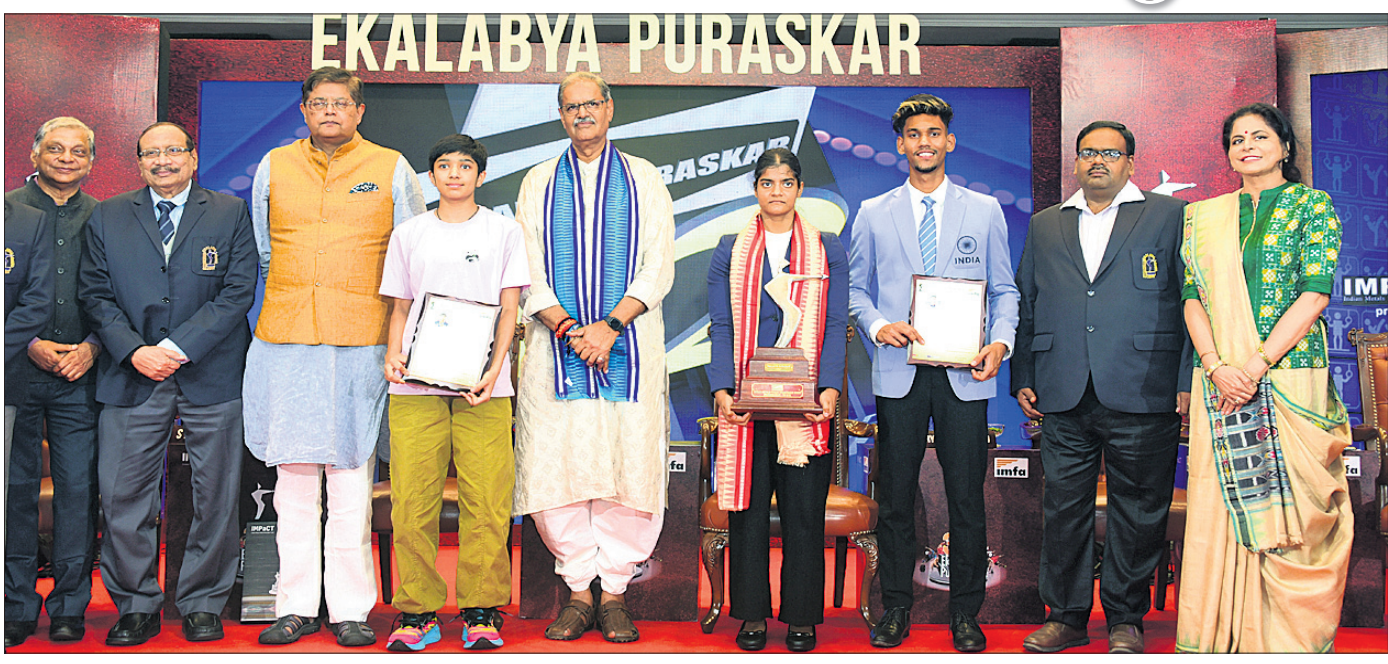
ଉପରପୁଖ୍ୟମନ୍ତ୍ରୀ କନକ ବର୍ଦ୍ଧନ ସିଂଦେଓ, ଏମ୍ପି ବୈକେୟର ପଣ୍ଡା ଓ ଅନ୍ୟ ଅତିଥିମାନେ ପ୍ରତ୍ୟାଶା ରାୟଙ୍କୁ ଏକଲବ୍ୟ ପୁରସ୍କାରରେ ସମ୍ମାନିତ କରୁଛନ୍ତି।