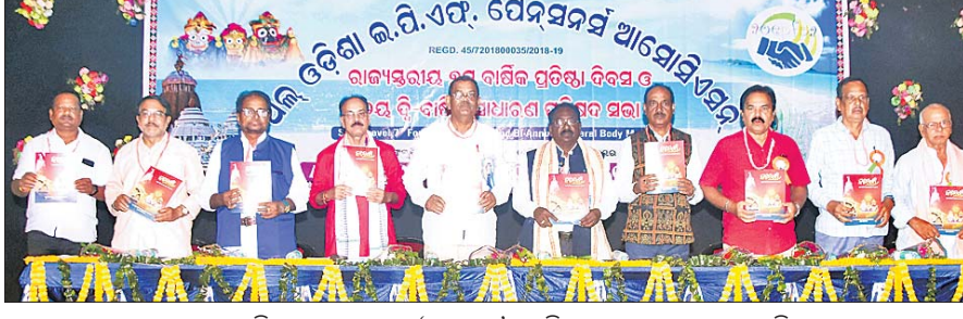
ଆସୋସିଏଶନର ମୁଖ୍ୟପତ୍ର 'ବରଣ୍ୟ' କୁ ଅଭିମୁଖେ ଉଦ୍ଘୋଷଣ କରୁଛନ୍ତି।