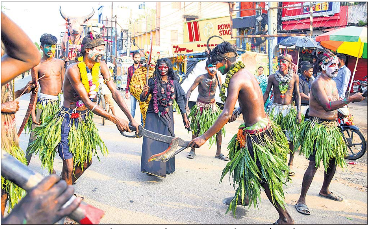
କଟକରେ ରବିବାର କାଳୀପୂଜା ଭବାଣିରେ କଳାକାରମାନେ ପାରମ୍ପରିକ ନୃତ୍ୟ ପ୍ରଦର୍ଶନ କରୁଛନ୍ତି।

ମୁଖ୍ୟମନ୍ତ୍ରୀ ମୋହନ ଚରଣ ମାଝା ଚଳିତ ମାସରେ ୩ ଦିନିଆ ବିଦେଶ ଗସ୍ତରେ ଯିବେ। ଆସନ୍ତା ୧୮ରୁ ୨୦ ତାରିଖ ପର୍ଯ୍ୟନ୍ତ ସେ ସିଙ୍ଗାପୁର ଗସ୍ତ କରିବାର କାର୍ଯ୍ୟକ୍ରମ ରହିଛି। ଉକ୍ତ ଗସ୍ତରେ, ମେକଲଭ ଓଡ଼ିଶା କନଫରେନ୍ସ-୨୦୨୪ ଲାଗି ସିଙ୍ଗାପୁରରେ ରୋଡ୍ ଶୋ'ର ଆୟୋଜନ କରାଯିବ। ମୁଖ୍ୟମନ୍ତ୍ରୀ ରୋଡ୍ ଶୋ'ରେ ଯୋଗଦେବା ସହିତ ଏହି ଅବସରରେ ନିବେଶକମାନଙ୍କ ସହ ଆଲୋଚନା କରିବେ। ମୁଖ୍ୟମନ୍ତ୍ରୀଙ୍କ ସହ ଏହି ଗସ୍ତ କାଳରେ ଶିଳ୍ପମନ୍ତ୍ରୀ ଏବଂ ଅନ୍ୟ ବରିଷ୍ଠ ଅଧିକାରୀମାନେ ମଧ୍ୟ ସିଙ୍ଗାପୁର ଯିବେ। ସୁନାଯୋଗ୍ୟ, ନିକଟରେ ମୁଖ୍ୟମନ୍ତ୍ରୀ ମହାରାଷ୍ଟ୍ର ଗସ୍ତ କରି ସେଠାରେ ଓଡ଼ିଶା ସରକାରଙ୍କ ପକ୍ଷରୁ ଆୟୋଜିତ ରୋଡ୍ ଶୋ'ରେ ଯୋଗ ଦେଇଥିଲେ। ଏହାସହ ନିବେଶକମାନଙ୍କ ସହ ଆଲୋଚନା କରି ସେମାନଙ୍କୁ ଓଡ଼ିଶାରେ ଶିଳ୍ପ ପ୍ରତିଷ୍ଠା ଲାଗି ମଧ୍ୟ କହିଥିଲେ।