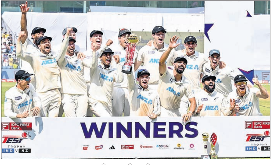
ପ୍ରଥମ ସ୍ଥାନୀୟ ଟେଷ୍ଟ ଟ୍ରଫି ପାଇଁ ଖେଳାଳିମାନଙ୍କୁ ପୁରସ୍କାର କରାଯାଇଛି ।

ଭାରତ ବିପକ୍ଷ ତୃତୀୟ ଥର ଟିକେଟ ମୂଲ୍ୟ ୮୦୦ ଟଙ୍କା ପାଇଁ ଟିକେଟ ବିକ୍ରୟ କରିଛି । ଭାରତକୁ ବିକ୍ରୟ ପାଇଁ ମାତ୍ର ୧୪୭ ରନ ଆବଶ୍ୟକ ଥିବାବେଳେ ବ୍ୟାଟରଙ୍କ ବିଫଳତା କାରଣରୁ ଦଳ ମାତ୍ର ୧୨୧ ରନରେ ଅଲଆଉଟ ହୋଇଥିଲା । ଏହା ସହ ଭାରତୀୟ ଟେଷ୍ଟ ଇତିହାସରେ ଏହା ସବୁଠାରୁ ଖରାପ ପ୍ରଦର୍ଶନ ରହିଛି । ୧୯୩୪ରେ ଟେଷ୍ଟ ଖେଳିବା ପରଠାରୁ ଭାରତ କେବେ ହେଲେ ୩-୦ରେ ପରାଜିତ ହୋଇ ନ ଥିଲା ।