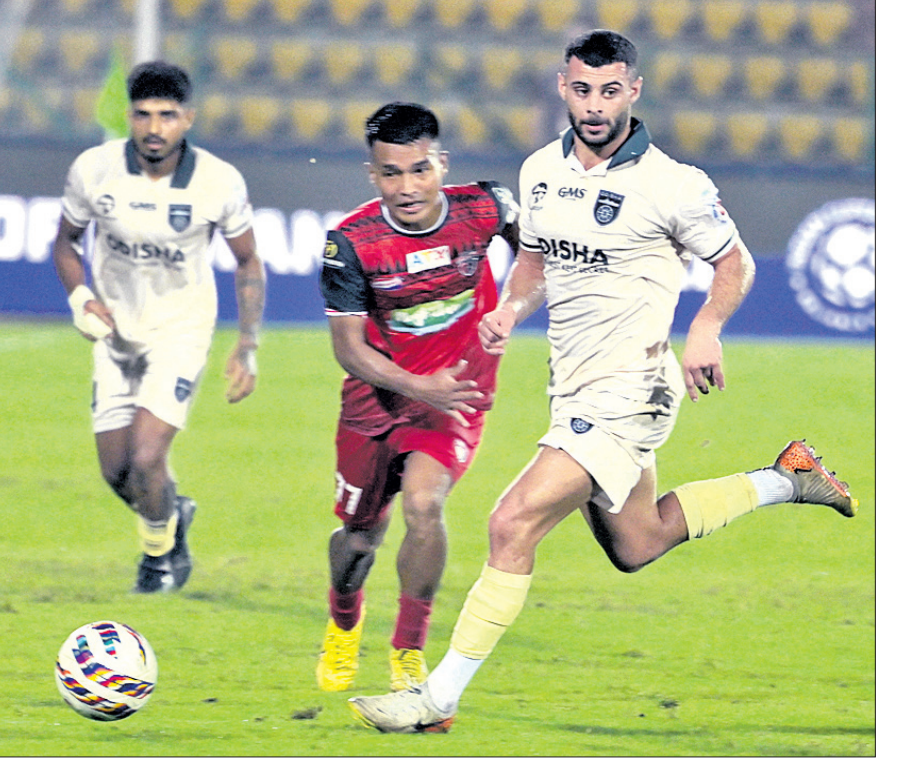
ଓଡ଼ିଶା ଏଫସି ଓ ନର୍ଥଇଷ୍ଟ ୟୁନାଇଟେଡ୍ ମଧ୍ୟରେ ଅନୁଷ୍ଠିତ ମ୍ୟାଚର ଏକ ସଂଘର୍ଷପୂର୍ଣ୍ଣ ପୁରୁଣା ।