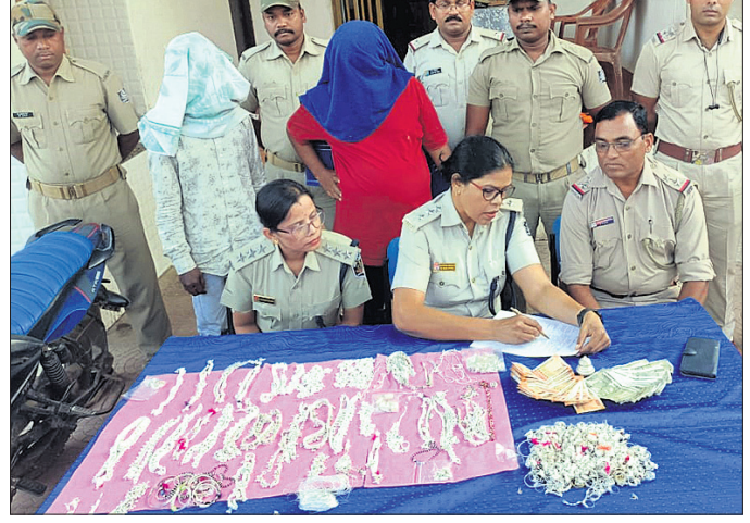
ମୁନିଗୁଡ଼ା ଥାନାରେ ଖବରଦାତା ସମ୍ମିଳନୀରେ ପୋଲିସ୍ ସୂଚନା ଦେଉଛି।