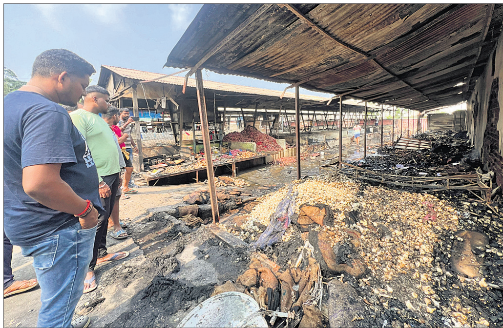
ତ ଆଉ କେହି ଭଡ଼ା ଲାଗେଇଥିଲେ। ପ୍ରାୟ ଯମୟରେ ମଦ ପିଇବା ପାଇଁ ସେଠାରେ ଆସର ଜମିଥାଏ ଓ ତା' ସାଙ୍ଗକୁ ଭୋକିଭାତ ହୁଏ। କିଛି ଦୋକାନୀଙ୍କ କହିବା କଥା ହେଲା ରବିବାର ସକାଳେ କିଛି ଲୋକ ଆସି ପିନ୍ଧିରେ ଭୋକି କରିବା ସହ ମଦ ପିଇଥିଲେ। ପାଖରେ ଥିବା ଅଳିଆ ଗଦାରେ କେହି ଜଣେ ସିଗାରେଟ୍ ଚାଟି ପିନ୍ଧି ଦେଇଥିଲା। ସେହି ସିଗାରେଟ୍‌ରୁ ନିଆଁ

ଅନୁଗୋଳ ସହରର ଦୈନିକ ପରିବା ମାର୍କେଟରେ ରବିବାର ଭୟାବହ ଅଗ୍ନିକାଣ୍ଡ ଘଟିଛି। ଫଳରେ ୩୦ରୁ ଅଧିକ ଦୋକାନ ଯୋଡ଼ି ପାରନ୍ତ ହୋଇଯାଇଛି। ଅଗ୍ନିକାଣ୍ଡରେ ଆଳୁ, ପିଆଜ, ଅଦା ଓ ରସୁଣ ଯୋଡ଼ି ସମ୍ପୂର୍ଣ୍ଣ ନଷ୍ଟ ହୋଇଯାଇଛି। ବହୁ ଆସବାବପତ୍ର ଏବଂ ଦୋକାନ ପାଖରେ ଥିବା ସ୍କୁଟି ଓ ମୋଟର ସାଇକେଲ ଯୋଡ଼ି ପାରନ୍ତ ହୋଇଯାଇଛି। କ୍ଷତି ହୋଇଥିବା ପିଆଜ, ରସୁଣ, ଅଦା ଓ ଆଳୁର ପ୍ରକୃତ ମୂଲ୍ୟ ବର୍ତ୍ତମାନ ପର୍ଯ୍ୟନ୍ତ ଜଣାପଡ଼ିନାହିଁ।