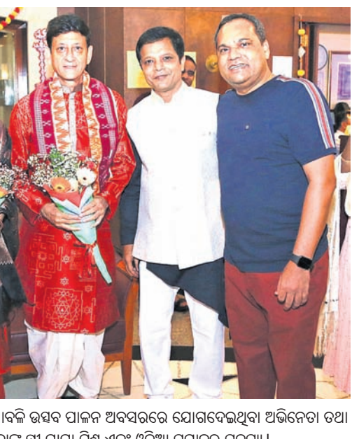
ସିଦ୍ଧାପୁରଠାରେ ଓଡ଼ିଆ ସମାଜ ପକ୍ଷରୁ ବାପାଙ୍କୁ ଉତ୍ସବ ପାଇଁ ଅର୍ପଣ କରାଯାଇଥିବା ଅଭିନେତା ତଥା ବିଧାୟକ ସିଦ୍ଧାଚନ୍ଦ୍ର ଚାଟ୍ଟୋପାଧ୍ୟାୟଙ୍କୁ ଶ୍ରୀ ମାମା ନିମ୍ନ ସମ୍ବୋଧନାରେ ସମ୍ବୋଧନା କରାଯାଇଥିଲା ।