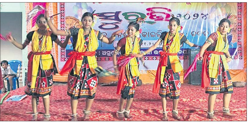
ସୁରଭି କାର୍ଯ୍ୟକ୍ରମରେ ଛାତ୍ରୀମାନେ ନୃତ୍ୟ ପରିବେଷଣ କରୁଛନ୍ତି।