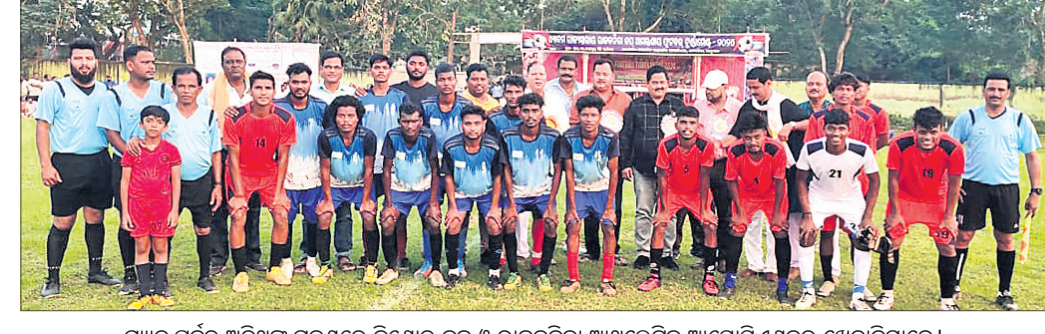
ମ୍ୟାଚ ପୂର୍ବରୁ ଅତିଥିକ୍ ଗହଣରେ କିଶୋର କ୍ଲବ୍ ଓ ରାଜକନିକା ଆଥଲେଟିକ୍ ଆସୋସିଏସନ୍‌ର ଖେଳାଳିମାନେ ।