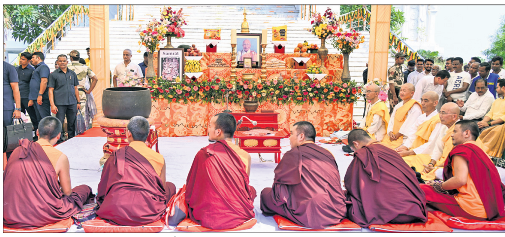
ଧର୍ଯ୍ୟ ଶାନ୍ତିସୂତ୍ରର ୫୨ତମ ପ୍ରତିଷ୍ଠା ଦିବସ କାର୍ଯ୍ୟକ୍ରମରେ ଯୋଗଦେଇଥିବା ବୌଦ୍ଧ ସନ୍ନ୍ୟାସୀମାନେ ।