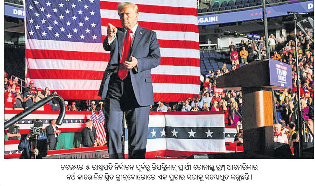
ନଭେମ୍ବର ୫ ରାଷ୍ଟ୍ରପତି ନିର୍ବାଚନ ପୂର୍ବରୁ ରିପବ୍ଲିକାନ୍ ପ୍ରାର୍ଥୀ ଡୋନାଲ୍ଡ୍ ଟ୍ରମ୍ପ୍ ଆମେରିକାର ନୂର୍ଥ କାରୋଲିନାସ୍ଥିତ ଗ୍ରୀନସ୍‌ବୋରୋରେ ଏକ ପ୍ରଚାର ସଭାକୁ ସମ୍ବୋଧିତ କରୁଛନ୍ତି।