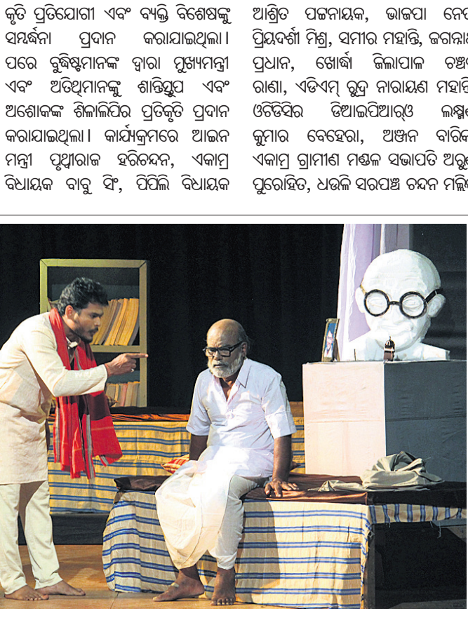
ନାଟ୍ୟଧାରା ପକ୍ଷରୁ ଉତ୍ସବମାନଙ୍କୁ ମଣ୍ଡପରେ ଉଦ୍‌ଘାଟନ କରିବାର ପରିବେଷିତ ନାଟକ 'ତନ୍ମା'ର ଏକ ଦୃଶ୍ୟ ।

ଧର୍ଯ୍ୟ ଶାନ୍ତିସୂତ୍ରର ୫୨ତମ ପ୍ରତିଷ୍ଠା ଦିବସ କାର୍ଯ୍ୟକ୍ରମରେ ଯୋଗଦେଇଥିବା ବୌଦ୍ଧ ସନ୍ନ୍ୟାସୀମାନେ ।