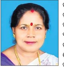
କରିଥିଲେ । ର ବି । ର ପ ୂ ର 1 ସ୍ୱର୍ଗସ୍ୱାରରେ ତ । କ ର ଶେଷକୁତ୍ୟ ସ ୱ ନ

ପରିବେଶ ସଚେତନତା କାର୍ଯ୍ୟକ୍ରମ ବାଙ୍କୀ, ୩୧୧ (ଆନେନ୍ଦ୍ର ମୋହନ ମିଶ୍ର): ବାଙ୍କୀ ଏନ୍‌ଏସ୍ ଅନ୍ତର୍ଗତ ସାହାଡ଼ାପଦା ସରକାରୀ ଉଚ୍ଚପ୍ରାଥମିକ ବିଦ୍ୟାଳୟ ପରିସରରେ ପରିବେଶ ସଚେତନତା, ଚାରାଚୋପଣ ଓ ବନ୍ଧନ କାର୍ଯ୍ୟକ୍ରମ ଅନୁଷ୍ଠିତ ହୋଇଯାଇଛି।