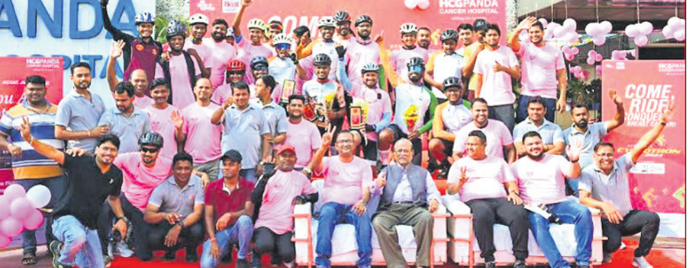
ସାଇକ୍ଲୋଥନର ଯୋଗଦେଇଥିବା ଅତିଥି ଓ ସାଇକେଲ ଆରୋହୀମାନେ।