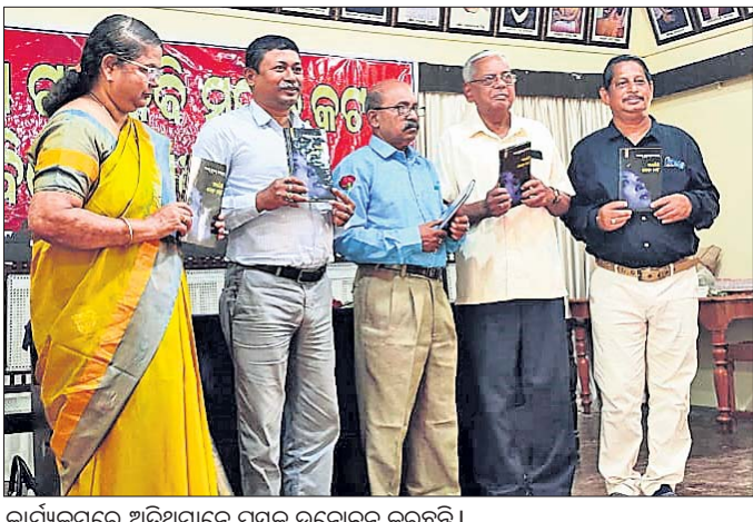
କାର୍ଯ୍ୟକ୍ରମରେ ଅତିଥିମାନେ ପୁସ୍ତକ ଉଦ୍‌ଘାଟନ କରୁଛନ୍ତି।