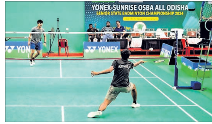
ରବିବାର ଅନୁଷ୍ଠିତ ଏକ କ୍ୱାର୍ଟରଫାଇନାଲ୍ ମ୍ୟାଚ୍ ।