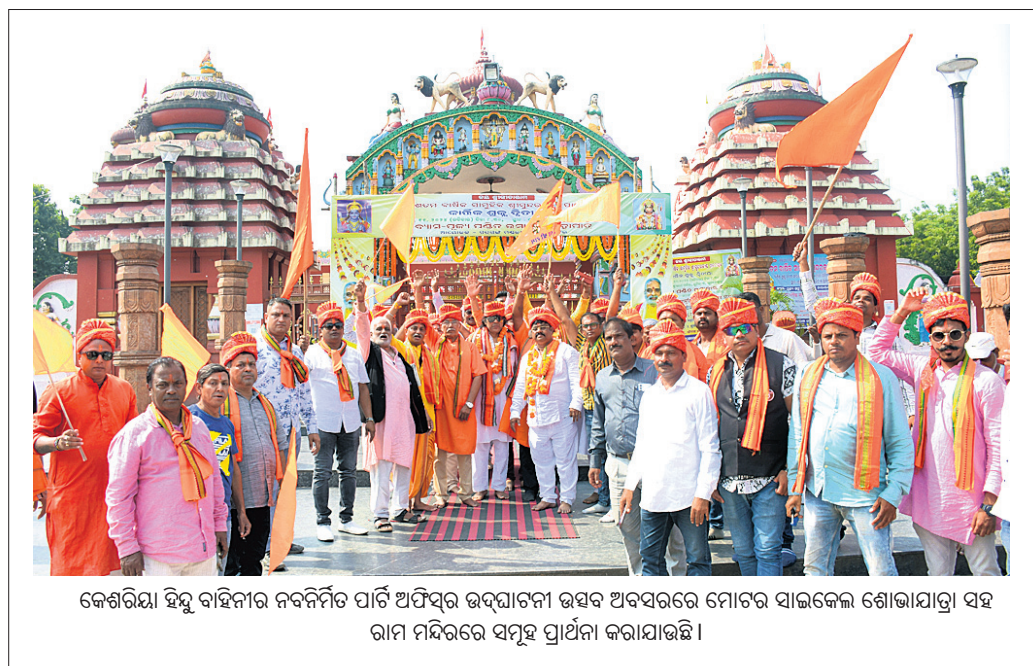
କେଶରୀୟା ହିନ୍ଦୁ ବାହନୀର ନବନିର୍ମିତ ପାର୍ଟି ଅଫିସର ଉଦ୍‌ଘାଟନା ଉତ୍ସବ ଅବସରରେ ମୋଟର ସାଇକେଲ ଶୋଭାଯାତ୍ରା ସହ ରାମ ମନ୍ଦିରରେ ସମ୍ପୂର୍ଣ୍ଣ ପ୍ରାର୍ଥନା କରାଯାଇଛି।