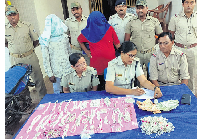
ପୁନିଗୁଡ଼ା ଥାନାରେ ଖବରଦାତା ସମ୍ମିଳନୀରେ ପୋଲିସ୍ ସୂଚନା ଦେଉଛି।