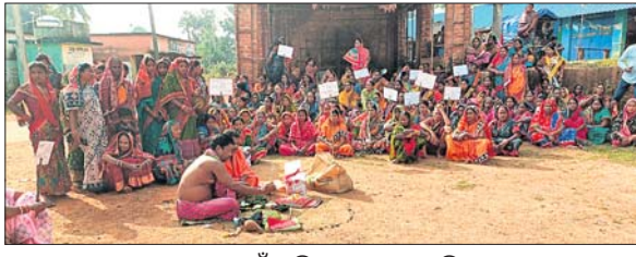
ପୂଜକ ଗାଁ ମଝିରେ ପୂଜା କରୁଛନ୍ତି।