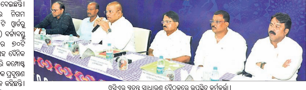
ଓସିଏର ସ୍ୱତନ୍ତ୍ର ସାଧାରଣ ବୈଠକରେ ଉପସ୍ଥିତ କର୍ମକର୍ମୀ।

ଆଇଏଏସ୍ କର୍ମଚାରୀଙ୍କୁ ଛିଠି-ଟ୍ୟାଣି କରିବାକୁ ଯାଉଛି। ଏହାଦ୍ୱାରା ପ୍ରତି ପୂର୍ଣ୍ଣସମୟରେ ସେମାନଙ୍କ ଗତିବିଧିକୁ ଗ୍ରାହ୍ୟ କରାଯାଇପାରିବ ବୋଲି ସେ କହିଛନ୍ତି। ସେହିପରି ଅବସରପ୍ରାପ୍ତ ସେମା ଅଧିକାରୀ ତା ଚେକ୍ ଏଣ୍ଡମେଣ୍ଟରୁ ପବ୍ଲିସ୍ ରାଜନ ମଧ୍ୟ ଅନୁରୂପ ମତ ବ୍ୟକ୍ତ କରି କହିଛନ୍ତି, ତେଣୁ ଲୋକାଳାୟକତା ଏବଂ ସ୍ୱେଚ୍ଛା ଇନିସିଆଟିଭ୍ ଆଣ୍ଡ କମ୍ୟୁନିକେଶନ୍ (ଆଇସିସି) ଦିନା କଠୋର ତେଣୁ ପ୍ରିଭେସି ଆଇନ ଅଣାଯାଇପାରିବ ନାହିଁ। ରାଜନଙ୍କ ମତରେ ଦିନା କୌଶଳରେ ରଖାଯାଉଛି ସେହିପରି ପଲ୍ଲୀ ଗତି। ରଖାଯାଉଛି ଦିନା କୌଶଳ ହେଲା ପରାଜୟ ପୂର୍ବରୁ କୋଣାର୍କ। ସାଧକରକ୍ଷେତ୍ରରେ ସାର୍ବଭୌମିକ ଏବଂ ତେଣୁ ପ୍ରିଭେସି ନେଇ ଜରୁରୀ ଆଇନ ନ ରହିବା ଦ୍ୱାରା ଭାରତର ଜାତୀୟ ସୁରକ୍ଷା ବିପନ୍ନ ହୋଇପାରେ ବୋଲି ସେ ସତର୍କ କରାଇଛନ୍ତି। ପ୍ରକାଶ ଯେ, ଅକ୍ଟୋବର ୧୮ରେ ଆଇଏଏସ୍ ଏବଂ ଉଚ୍ଚ ମଧ୍ୟରେ ଏହି ରୁଦ୍ଧି ସମ୍ପାଦିତ ହୋଇଥିଲା। ଏୟାର ଭାଇସ୍ ମାର୍କି ଉପଦେଶ ଶର୍ମା ଏବଂ ଉଚ୍ଚ ମଧ୍ୟରେ ଜଣେ ବରିଷ୍ଠ ଅଧିକାରୀ ଏଥିରେ ସ୍ୱାସ୍ଥ୍ୟ କରିଥିଲେ। ତଦନୁସାରେ ଉଚ୍ଚର ଆଇଏଏସ୍ ଅଧିକାରୀ, ଅବସରପ୍ରାପ୍ତ କର୍ମଚାରୀ ଏବଂ ସେମାନଙ୍କ ପରିବାରକୁ ବିଶ୍ୱସନୀୟ, ସହକ୍ଷ ଓ ସୁରକ୍ଷିତ ପରିବହନ ସେବା ପ୍ରଦାନ କରିବ ବୋଲି ବାଣ୍ଟିଥିବା ପକ୍ଷରୁ ଏହି ପୋଷ୍ଟ କରାଯାଇଥିଲା। ତେବେ ସୋସିଆଲ ମିଡ଼ିଆରେ ଏହାକୁ ନେଇ ଆପତ୍ତି ଉଠାଯିବା ପରେ ଏୟାରପୋର୍ଟ ଉକ୍ତ ପୋଷ୍ଟକୁ ତିଳିତ କରିଦେଇଥିଲା।