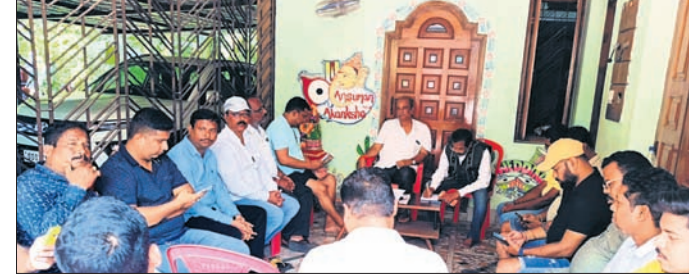
ବୈଠକରେ ପୂର୍ବତନ ମନ୍ତ୍ରୀ ଅଶୋକଚନ୍ଦ୍ର ପଣ୍ଡାଙ୍କ ସହ ଅନ୍ୟମାନେ।

ପୁରୁଣା ଭୁବନେଶ୍ୱର, ୩।୧୧ (ପୁରୀ ସତ୍ୟ ପ୍ରଧାନ)