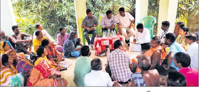
ଗ୍ରାମବାସୀଙ୍କ ସହ ସ୍ୱାସ୍ଥ୍ୟକେନ୍ଦ୍ର ଅଧିକାରୀମାନେ ଆଲୋଚନା କରୁଛନ୍ତି।