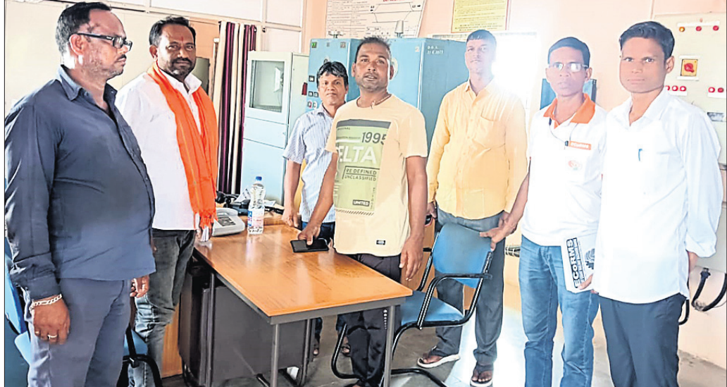
କର୍ମଚାରୀଙ୍କ ସହ କର୍ମକର୍ତ୍ତା ।

ବଣପଲ୍ଲୀ, ୪।୧୧ (ପ୍ରକାଶ କୁମାର ପାଣି) ଆସନ୍ତା ଦିସେମ୍ବର ୪, ୫ ତାରିଖରେ ହେବାକୁ ଯାଉଥିବା ରେଳ କର୍ମଚାରୀ ସଂଘ ନିର୍ବାଚନରେ, ଭାରତୀୟ ରେଳ ମହାସଂଘର ସଂଗଠନ ବିଚାରଣା ପାଇଁ ଭାରତୀୟ ମହାସଂଘର ସଂଗଠନ ସମାପନ କରାଯିବ ବୋଲି ନିର୍ଦ୍ଦେଶ ଦିଆଯାଇଛି । ଏହି ପରିପ୍ରେକ୍ଷାରେ ଯେ ରେଳ କର୍ମଚାରୀଙ୍କ ସହ ଆଲୋଚନା କରିଥିଲେ । ଦୀର୍ଘବର୍ଷ ଧରି ବର୍ତ୍ତମାନର