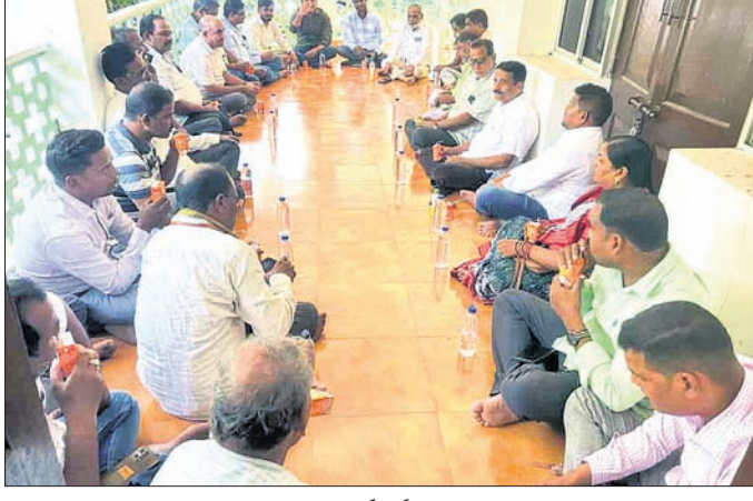
ବୈଠକରେ ଯୋଗ ଦେଇଥିବା ନେତା ଓ କର୍ମକର୍ତ୍ତାମାନେ।