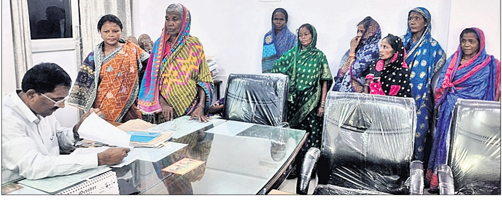
ଅତିରିକ୍ତଜିଲ୍ଲାପାଳଙ୍କୁ କୋଟଗଡ଼ ମହିଳାମାନେ ମଦ ବିକ୍ରି ବନ୍ଦ ପାଇଁ ଅଭିଯୋଗ କରୁଛନ୍ତି।