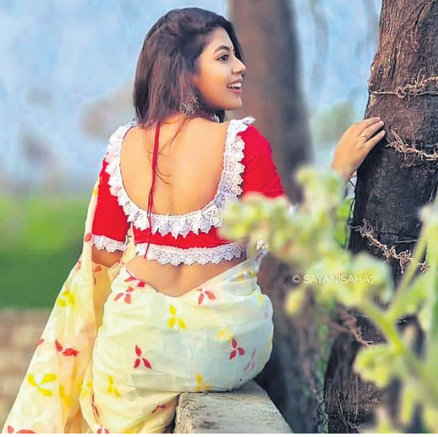
ଶାନ୍ତିର ମୁଖ୍ୟଭାଗ ହୋଇଥାଏ ଗ୍ଳାଉଜ । ଯଦି ଶାନ୍ତି ସହ ଗ୍ଳାଉଜ ଠିକ୍ ଭାବେ ବିଳାଳ କରାହୋଇଛି ତେବେ ଏହା ଯଦି ଫିଟ ହୋଇଛି ତେବେ ଆପଣ ଷ୍ଟାଇଲିଙ୍ଗ୍ ଲାଭିବେ । ଆସନ୍ତୁ, ଏବେ ଆପଣଙ୍କୁ କିଛି ଲାଭଦେୟ ଗ୍ଳାଉଜ ବିଷୟରେ ସୂଚନା ଦେଉଛୁ । ଏହାକୁ ବି ଆପଣ ନିଜ ହିସାବରେ ଚୟନ କରିପାରିବେ, ତେବେ ଆପଣ ଠିକ୍ ଡିପାର୍ଟମେଣ୍ଟ ଦେଖାଯିବେ ।

ବ୍ୟାକଲେଉଟ୍: ଯଦି ଆପଣ ସମ୍ପୂର୍ଣ୍ଣ ରୂପେ ବ୍ୟାକଲେଉଟ୍ ଗ୍ଳାଉଜ ପିନ୍ଧିବାକୁ ନିଷ୍ପତ୍ତ ହୋଇଛନ୍ତି ତେବେ ଷ୍ଟାଇଲିଙ୍ଗ୍ ଡିଜାଇନର ବି ଆପଣଙ୍କୁ ବ୍ୟାକଲେଉଟ୍ ଭଳି ଫ୍ୟାସ୍ଟି ଲୁକ୍ ଦେଇପାରେ । ଆପଣଙ୍କ ଶାଢ଼ି ଯଦି ଅଧିକ ହେଲି ନାହିଁ, ତେବେ ଏହି ଡିଜାଇନର ଗ୍ଳାଉଜ ନିହାତି ସିଲେକ୍ଟ କରିବା ଆବଶ୍ୟକ । ମ୍ୟାଟି ତୋରି ଏବଂ ଲଟ୍ କଟ୍ ସହିତ ଆପଣଙ୍କୁ ବେଶ୍ ଷ୍ଟାଇଲିଙ୍ଗ୍ ଲୁକ୍ ଦେବ ।