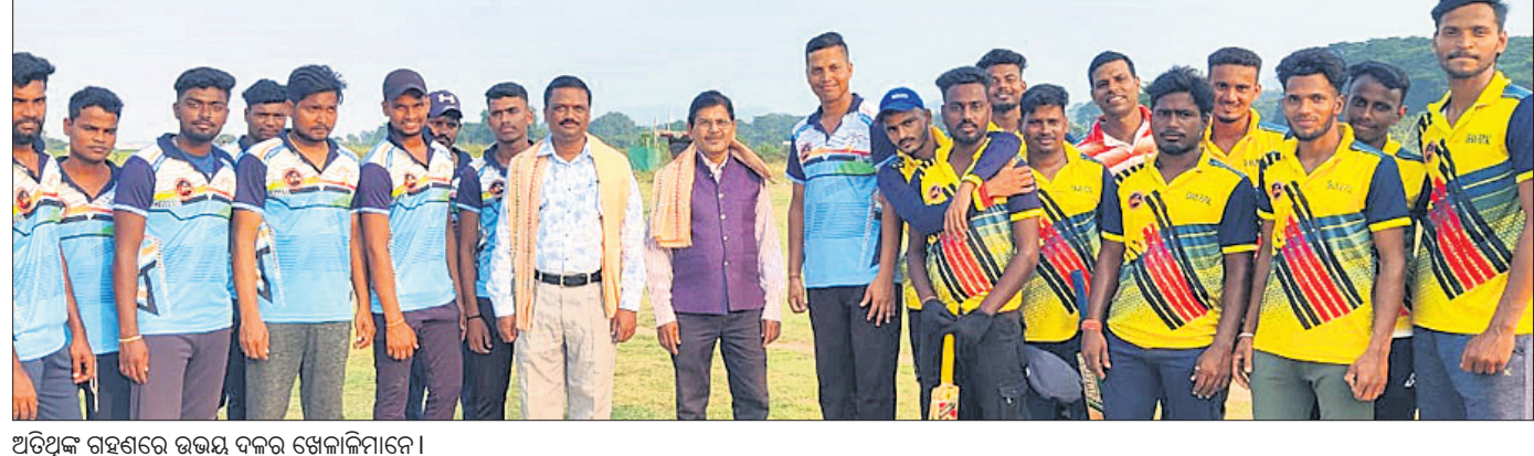
ଅତିଥିକ ଗହଣରେ ଉଭୟ ଦଳର ଖେଳାଳିମାନେ।

ଖଣ୍ଡପଡ଼ା ବ୍ଲକ୍ ଅଧୀନ କର୍ମିଣ୍ଡା ସାଇକ୍ୱା କେପିଏଲ୍ କର୍ମିଣି ପକ୍ଷରୁ ଅଭ୍ୟୁତ୍ପନ୍ନ ହୋଇଥିବା ପଲଟନ ପଡ଼ିଆରେ ଆରମ୍ଭ ହୋଇଥିବା ୪ର୍ଥ ବାର୍ଷିକ କ୍ରିକେଟ ଟୁର୍ନାମେଣ୍ଟର ଯୋଜନା ୪୪ଟମ ଦିବସ। ପ୍ରଥମ ପର୍ଯ୍ୟାୟରେ ଅଣ୍ଡର ବାଲୁକେଶ୍ୱର ଓ ଦିପୁ କିଙ୍ଗସ ମଧ୍ୟରେ ମୁକାବିଲା ହୋଇଥିଲା। ଦୀପୁ କିଙ୍ଗସ ଥଣ୍ଡର ବାଲୁକେଶ୍ୱରକୁ ହରାଇ ବିଜୟୀ ହୋଇଛି। ଅଣ୍ଡର ବାଲୁକେଶ୍ୱର ପ୍ରଥମେ ବ୍ୟାଟି ଆରମ୍ଭ କରି ନିର୍ଦ୍ଧାରିତ ୧୦ ଓଭରରେ ୮୩ ରନ ସଂଗ୍ରହ କରି ବିଜୟୀ ହୋଇଥିଲା। କବାବରେ ଶୁଭମ୍ ମ୍ୟାନ ଅଫ ଦି ମ୍ୟାଚ ବିବେଚିତ ହୋଇଥିଲେ। ଚନ୍ଦନ ଦଳେଇ ଓ ଅଶୋକ ବାରିକ ଖେଳକୁ ପରିଚାଳନା କରିଥିଲେ। ୨ୟ ପର୍ଯ୍ୟାୟରେ ଇସାନ ରୟାଲ ଓ ଶତପଥୀ ଲାୟନସ ମଧ୍ୟରେ ମୁକାବିଲା