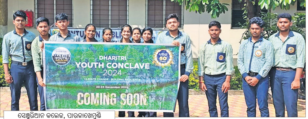
ସେଷ୍ଟୁରିଆନ କଲେଜ, ପାରଳାଖେମୁଣ୍ଡି