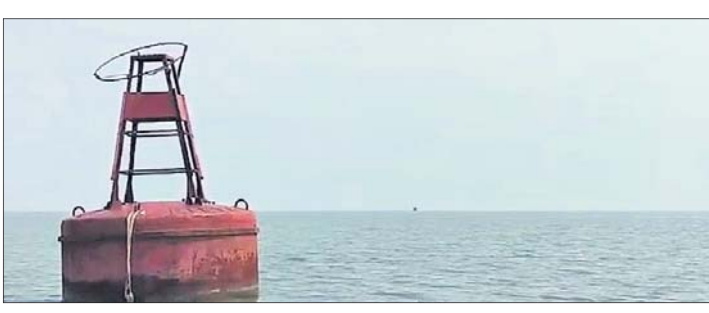
ଭୋଗରାଇ, ୪।୧୧ (ପ୍ରବାସ ବାସ)

ଓଡ଼ିଶା ସାମାଜିକ ବାଲେଶ୍ୱର ଜିଲ୍ଲା ଭୋଗରାଇ ବ୍ଲକ ଉଦୟପୁର ସମୂହକୁଳରେ ସୋମବାର ଜାହାଜର ଦିଗ ନିର୍ଣ୍ଣୟ ଯନ୍ତ୍ର (ବର୍ଯ୍ୟ) ମହାସଜାବାଳ ଦ୍ୱାରା ଠାବ କରାଯାଇଛି । ସମ୍ବନ୍ଧିତ ଏହି ଦିଗନିର୍ଣ୍ଣୟ ଯନ୍ତ୍ର ସମୂହର ଉଦ୍ଦାରକ ଡେଉରେ ଗଭୀର ସମୁଦ୍ରକୁ ଭାସିଆସି କୁଳଆଡ଼କୁ ଆସିଛି । ଘ୍ନାନୀୟ ମହାସଜାବାଳାଙ୍କ ଅନ୍ୟ ତଳା ଓ କ୍ଷିତ୍ରକୋଚରେ କୁଳକୁ ଆଶିଷ୍ଟି । ଉଦୟପୁର ବେଳାଭୂମିକୁ ଆଗତ ପର୍ଯ୍ୟଟକମାନେ ଭକ୍ତ ଯନ୍ତ୍ରକୁ ଦେଖିବା ଲାଗି ଭିଡ଼ ଜମାଇଛନ୍ତି । ସୂଚନାନ୍ତୁଯାୟୀ ଗଭୀର ସମୁଦ୍ରରେ