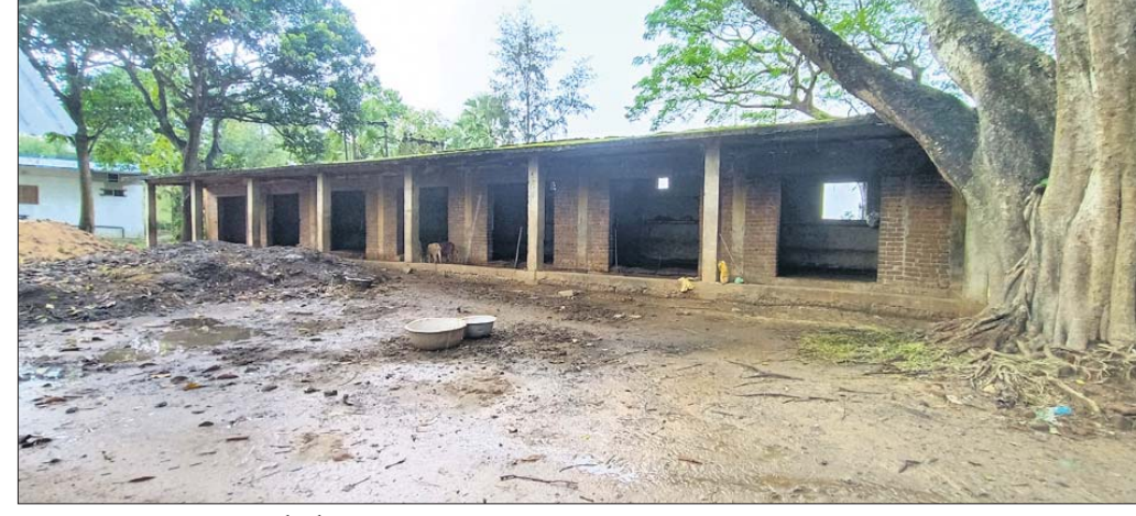
ଅବହେଳିତ ଭାବେ ପଡ଼ିଥିବା ଅର୍ଦ୍ଧନିର୍ମିତ ୭ ବୋକାନ ଗୃହ ।

ଯାଜପୁର ଜିଲ୍ଲା ଧର୍ମଶାଳା ବ୍ଲକ ଅନ୍ତର୍ଗତ ମିର୍ଜାପୁର ପଞ୍ଚାୟତ କାର୍ଯ୍ୟାଳୟ ସମ୍ମୁଖରେ ଥିବା ହାଟ ମଧ୍ୟରେ ୮ ବର୍ଷ ହେବ ବିଜୁ ଗ୍ରାମୀଣ ବଜାର କରାଯିବ ବୋଲି ଲକ୍ଷ୍ୟ ନେଇ ନିର୍ମାଣ ହୋଇଥିବା ବୋଲି ଘର ଗାଳିଗୁହାଳ ପାଳଟିଛି । ଦୀର୍ଘଦିନରୁ ସେହି ଗୁହଗୁହାଳ ପରିତ୍ୟକ୍ତ ଅବସ୍ଥାରେ ପଡ଼ିଥିବାକୁ ବୁଲି ଗାଳିଗୁହାଳ ସେଠାରେ ଆଶ୍ରୟ ନେଉଛନ୍ତି । ଜଣେ ବେକାର ଯୁବକ ସେଠାରେ ବ୍ୟବସାୟ କରି ରୋଜଗାରକ୍ଷମ ହୋଇ ପାରିବ ବୋଲି ଆଶା ବାନ୍ଧିଥିଲେ । ସେଥିପାଇଁ ବିଜୁ ଗ୍ରାମୀଣ ବଜାର ପ୍ରକଳ୍ପରେ ବୋକାନ ଘର ନିର୍ମାଣ କରାଯାଇଥିଲା । ହେଲେ ସେହି ଆଶା ଆଜି ପର୍ଯ୍ୟନ୍ତ ସଫଳ ହୋଇପାରିନାହିଁ ବିଭାଗୀୟ ଅଧିକାରୀ ଓ ଦାୟିତ୍ୱରେ ଥିବା କର୍ମଚାରୀଙ୍କ ଖାମୋଶ୍ୟା ନୀତି ଯୋଗୁଁ ଏହି ପରିସ୍ଥିତି ସୃଷ୍ଟି ହୋଇଛି ବୋଲି ଅଭିଯୋଗ ହୋଇଛି ।