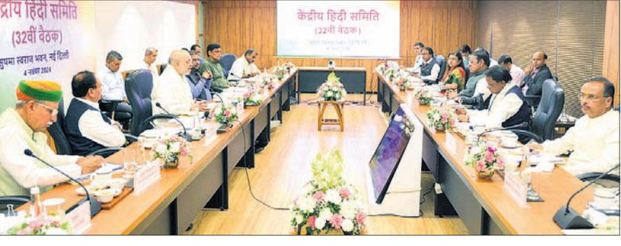
ନୂଆଦିଲ୍ଲୀରେ ଅନୁଷ୍ଠିତ ହିନ୍ଦୀ ସମିତି ବୈଠକରେ ସ୍ଵାଗତମନ୍ତ୍ରୀ ଅମିତ ଶାହା, ମୁଖ୍ୟମନ୍ତ୍ରୀ ମୋହନ ଚରଣ ମାଝୀ ଓ ଅନ୍ୟମାନେ ।

ଇଣ୍ଡୋ-ଲାଲୁଏଜ ରିସର୍ଚ୍ଚ ଇନ୍‌ଷ୍ଟିଚ୍ୟୁଟ୍, ଓଡ଼ିଆ-ହିନ୍ଦୀ ଅନୁବାଦ କେନ୍ଦ୍ର ସ୍ଥାପନ ପାଇଁ ପ୍ରସ୍ତାବ