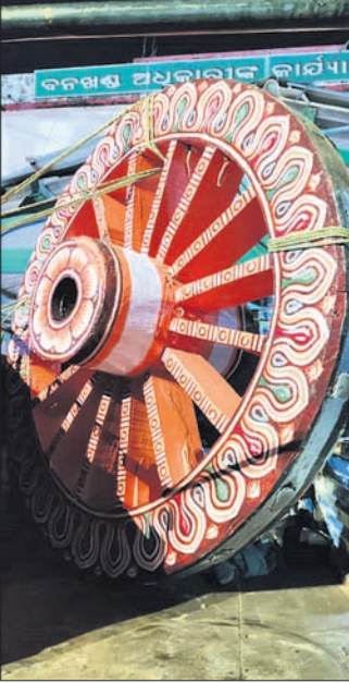
ନୟାଗଡ଼ ବନଖଣ୍ଡ କାର୍ଯ୍ୟାଳୟରେ ମା' ସୁଭଦ୍ରାଙ୍କ ରଥ ଚଳ ଆଦି ଯୋଜନା ପହଞ୍ଚାଇଛି ।

ନୟାଗଡ଼ ବନଖଣ୍ଡ କାର୍ଯ୍ୟାଳୟକୁ ପୁରୀ ଶ୍ରୀମନ୍ଦିର ପ୍ରଶାସନ ପକ୍ଷରୁ ମା' ସୁଭଦ୍ରାଙ୍କ ରଥ ଚଳ ଆଦି ଯୋଜନା ପହଞ୍ଚାଇଛି । ରଥ ଚଳ ପାଇଁ ଶ୍ରୀମନ୍ଦିରକୁ ଚିଠି ଲେଖିଥିଲେ ନୟାଗଡ଼ ଡିପ୍ୟୁଟି ସମ୍ପାଦକ । ଶୁଭଦିନ ଦେଖି ରଥ ଚଳକୁ ବନଖଣ୍ଡ କାର୍ଯ୍ୟାଳୟରେ ସ୍ଥାପନ କରାଯିବାର ନିଷ୍ପତ୍ତି ନିଆଯାଇଛି ।