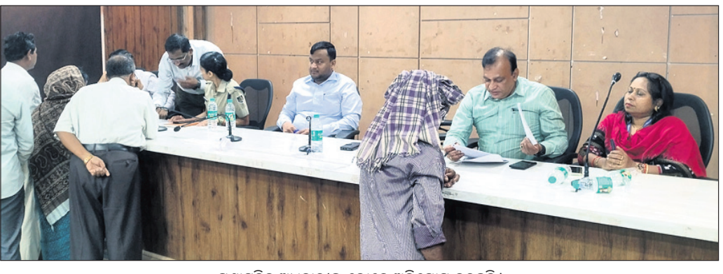
ପ୍ରଶାସନିକ ଅଧିକାରୀଙ୍କୁ ଲୋକେ ଅଭିଯୋଗ କରୁଛନ୍ତି ।

ନୟାଗଡ଼ ଜିଲ୍ଲାପାଳଙ୍କ ସଂଭାବନା ସଭାକକ୍ଷେତ୍ରରେ ଜିଲ୍ଲାପାଳଙ୍କ ଜନ ଶୁଣାଣି ଶିବିର ଯୋଜନା କରାଯାଇଛି । ଏଥିରେ ଜିଲ୍ଲାପାଳ ଅକ୍ଷୟ କୁମାର ପ୍ରଧାନଙ୍କ ସମ୍ମୁଖରେ ଲୋକମାନଙ୍କର ଅଭିଯୋଗ