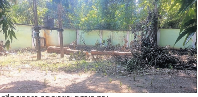
ସର୍ବନିମ୍ନ ହାତରେ କଟାଯାଇଥିବା ଶାଗୁଆନ ଗଛ।

କାହିଁକି ଗଛ କାଟିଲେ ବୋଲି ପ୍ରଶ୍ନ ଉଠିଛି। ଘଟଣାର ତଦନ୍ତ କରାଯାଇ କାର୍ଯ୍ୟାନୁଷ୍ଠାନ ନେବାକୁ ଦାବି ହେଉଛି। ତେବେ ଗଛ କଟାକୁ ନେଇ ଅନୁମତି ନିଆଯାଇଛି। କିନ୍ତୁ ଏହା ପରେ ଆଉ କିଛି ପଦକ୍ଷେପ ବନ ବିଭାଗ ପକ୍ଷରୁ ନିଆଯାଇ ନ ଥିବା ନୟାଗଡ଼ ରେଞ୍ଜର ଅଶୋକ କୁମାର ବିଶ୍ୱାଳ କହିଛନ୍ତି।