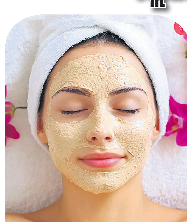
ସ୍କିନ୍ ଗ୍ଲୋଇଂ ରଖିବାକୁ ହେଲେ ନିମ୍ନଲିଖିତ ଟିପ୍ସ ଆପଣଙ୍କ ପାଇଁ...