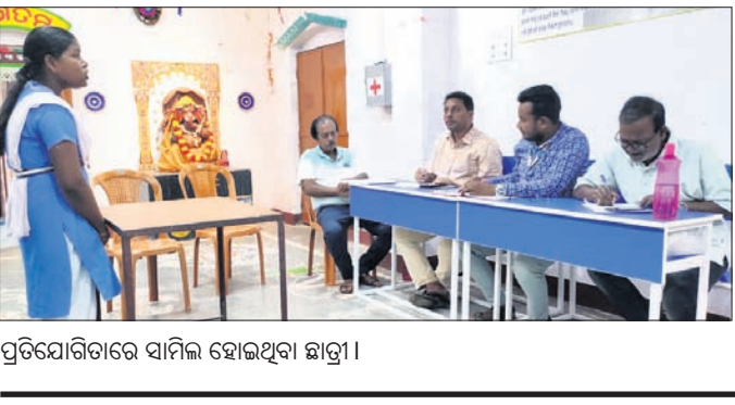
ପ୍ରତିଯୋଗିତାରେ ସାମିଲ ହୋଇଥିବା ଛାତ୍ର।