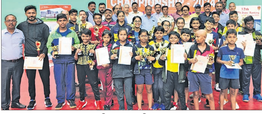
କୃତୀ ପ୍ରତିଯୋଗୀମାନେ ଅତିଥିକ ଗହଣରେ ।