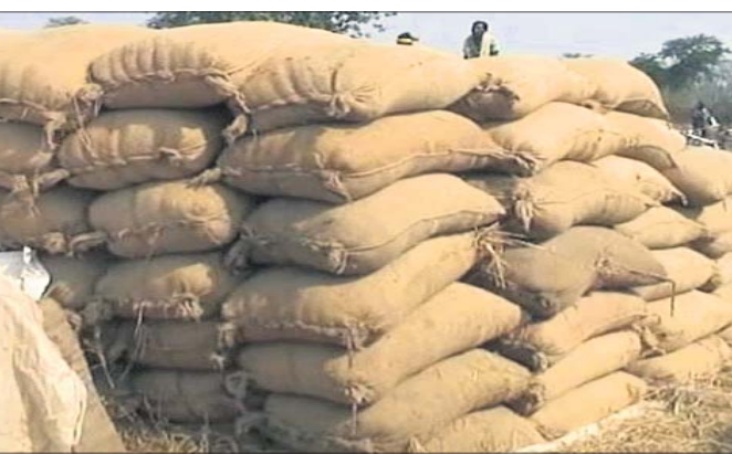
ଭୁବନେଶ୍ୱର, ୪।୧୧ (ସୁନିଲ ମିଶ୍ର)

ଚଳିତ ବର୍ଷଠାରୁ ଧାନ ସର୍ବନିମ୍ନ ସହାୟକ ମୂଲ୍ୟ (ଏମ୍.ଏସ୍.ପି) ୨୩୦୦ ଟଙ୍କା ଏବଂ ରାଜ୍ୟ ସରକାରଙ୍କ ପକ୍ଷରୁ ଇନ୍‌ସୁରା ସହାୟତା ୮୦୦ ଟଙ୍କା ମିଶାଇ ମୋଟ ୩୧୦୦ ଟଙ୍କାରେ ଚାଷୀ ଧାନ ବିକ୍ରି କରିବେ। ଧାନ କ୍ରୟ ପ୍ରକ୍ରିୟାକୁ ସୁବ୍ୟବସ୍ଥିତ କରିବା ପାଇଁ ପ୍ରକୃତ୍ୟା ଶେଷ ହେବା ପର୍ଯ୍ୟନ୍ତ ମଣ୍ଡଳରେ ବିଭାଗୀୟ ଅଧିକାରୀ ରହିବେ। ସବୁ ମଣ୍ଡଳରେ ଧାନ ମାନ ଯାଞ୍ଚ କରିବା ପାଇଁ କ୍ୟାଲିବ୍ରେସନ୍ ଫୋର୍ମ୍‌ସ୍ ରହିବ। ମଣ୍ଡଳ ମିଲ୍ ପର୍ଯ୍ୟନ୍ତ ଧାନ ପରିବହନ ବ୍ୟବସ୍ଥାର ତଦାରଖ ପରିବହନ ବିଭାଗ କରିବ। ସେହିଭଳି ପଡ଼ୋଶୀ ରାଜ୍ୟକୁ ଯେପରି ଧାନ ଓଡ଼ିଶାକୁ ପ୍ରବେଶ ନ କରେ ସେଥିଲାଗି ପାଗୋଲି ଟିମ୍ ପୁରସ୍କାର କରାଯିବ। ଚାଷୀଙ୍କ ସୁରକ୍ଷା ସହିତ କର୍ମଚାରୀଙ୍କୁ ମୁକ୍ତ ଧାନକିଣା ଉପରେ ରାଜ୍ୟ ପୃଷ୍ଠା-୪