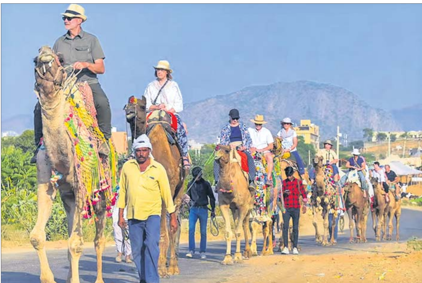
ଆଜମେରର ପୁଷ୍କର ମେଳାରେ ବିଦେଶୀ ପର୍ଯ୍ୟଟକମାନେ ଓଡ଼ ସବାରିର ମଜା ନେଉଛନ୍ତି।

ଚଳିତ ବର୍ଷଠାରୁ ଧାନ ସର୍ବନିମ୍ନ ସହାୟକ ମୂଲ୍ୟ (ଏମ୍.ଏସ୍.ପି) ୨୩୦୦ ଟଙ୍କା ଏବଂ ରାଜ୍ୟ ସରକାରଙ୍କ ପକ୍ଷରୁ ଇନ୍‌ସୁରା ସହାୟତା ୮୦୦ ଟଙ୍କା ମିଶାଇ ମୋଟ ୩୧୦୦ ଟଙ୍କାରେ ଚାଷୀ ଧାନ ବିକ୍ରି କରିବେ। ଧାନ କ୍ରୟ ପ୍ରକ୍ରିୟାକୁ ସୁବ୍ୟବସ୍ଥିତ କରିବା ପାଇଁ ପ୍ରକୃତ୍ୟା ଶେଷ ହେବା ପର୍ଯ୍ୟନ୍ତ ମଣ୍ଡଳରେ ବିଭାଗୀୟ ଅଧିକାରୀ ରହିବେ। ସବୁ ମଣ୍ଡଳରେ ଧାନ ମାନ ଯାଞ୍ଚ କରିବା ପାଇଁ କ୍ୟାଲିବ୍ରେସନ୍ ଫୋର୍ମ୍‌ସ୍ ରହିବ। ମଣ୍ଡଳ ମିଲ୍ ପର୍ଯ୍ୟନ୍ତ ଧାନ ପରିବହନ ବ୍ୟବସ୍ଥାର ତଦାରଖ ପରିବହନ ବିଭାଗ କରିବ। ସେହିଭଳି ପଡ଼ୋଶୀ ରାଜ୍ୟକୁ ଯେପରି ଧାନ ଓଡ଼ିଶାକୁ ପ୍ରବେଶ ନ କରେ ସେଥିଲାଗି ପାଗୋଲି ଟିମ୍ ପୁରସ୍କାର କରାଯିବ। ଚାଷୀଙ୍କ ସୁରକ୍ଷା ସହିତ କର୍ମଚାରୀଙ୍କୁ ମୁକ୍ତ ଧାନକିଣା ଉପରେ ରାଜ୍ୟ ପୃଷ୍ଠା-୪