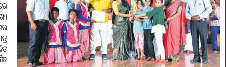
ବାରିପଦା, ୪।୧୧