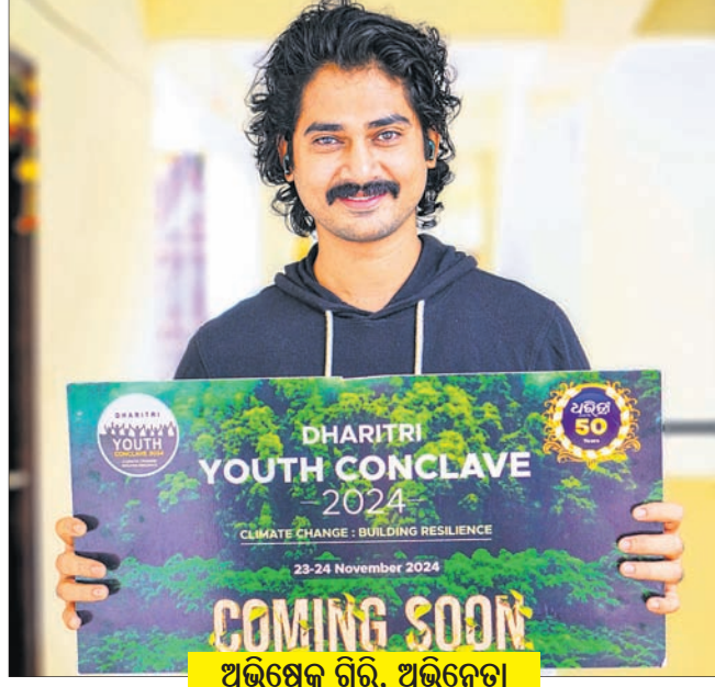
ଅଭିଷେକ ଗିରି, ଅଭିନେତା