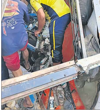
ମର୍ଦ୍ଦଳା (ଉତ୍ତରାଖଣ୍ଡ), ୪।୧୧ (ପି.ଟି.)