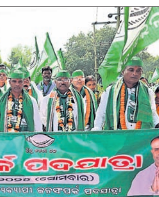
ପାଟଣା ବିଜେଡି ପକ୍ଷରୁ ଅନୁଷ୍ଠିତ ପଦଯାତ୍ରା।