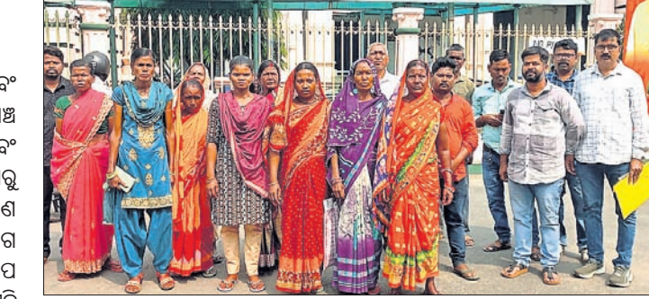
ଜିଲାପାଳଙ୍କ କାର୍ଯ୍ୟାଳୟ ଆଗରେ ଗ୍ରାମବାସୀ।