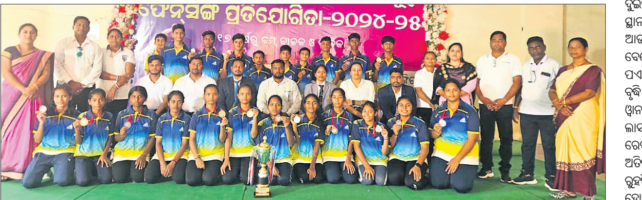
ଅତିଥି ଓ କର୍ମକର୍ତ୍ତାଙ୍କ ସହ ଚାମ୍ପିୟନ ବଲାଙ୍ଗୀର ଦଳର ପ୍ରତିଯୋଗୀ ।