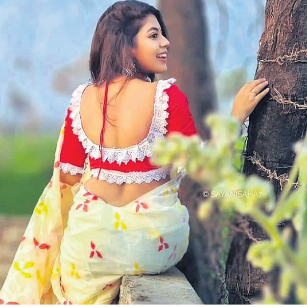
ଶାନ୍ତିର ମୁଖ୍ୟଭାଗ ହୋଇଥାଏ ଗ୍ଲାଉଜ । ଯଦି ଶାନ୍ତି ସହ ଗ୍ଲାଉଜ ଠିକ୍ ଭାବେ ବିଳାଳ କରାହୋଇଛି ତେବେ ଏହା ଯଦି ଫିଟ୍ ହୋଇଛି ତେବେ ଆପଣ ଷ୍ଟାଇଲିଙ୍ଗ୍ ଲାଭିବେ । ଆପଣଙ୍କୁ ଏବେ ଆପଣଙ୍କୁ କିଛି ଲାଭେଷ୍ଟ ଗ୍ଲାଉଜ ବିଷୟରେ ସୂଚନା ଦେଉଛୁ । ଏହାକୁ ବି ଆପଣ ନିଜ ହିସାବରେ ଚୟନ କରିପାରିବେ, ତେବେ ଆପଣ ଠିକ୍ ଡିପାର୍ଟମେଣ୍ଟ ଦେଖାଯିବେ ।

ବ୍ୟାକଲେଉଟ୍: ଯଦି ଆପଣ ସମ୍ପୂର୍ଣ୍ଣ ରୂପେ ବ୍ୟାକଲେଉଟ୍ ଗ୍ଲାଉଜ ପିନ୍ଧିବାକୁ ନିଷ୍ପତ୍ତ ହେବେ ତେବେ ମାତ୍ର ନାହାନ୍ତି ତେବେ ଷ୍ଟାଇଲିଙ୍ଗ୍ ଡିଜାଇନ ବି ଆପଣଙ୍କୁ ବ୍ୟାକଲେଉଟ୍ ଭଳି ଫ୍ୟାସି ଲୁକ୍ ଦେଇପାରେ । ଆପଣଙ୍କ ଶାଢ଼ି ଯଦି ଅଧିକ ହେଲି ନାହିଁ, ତେବେ ଏହି ଡିଜାଇନର ଗ୍ଲାଉଜ ନିହାତି ସିଲେକ୍ଟ କରିବା ଆବଶ୍ୟକ । ମ୍ୟାଟ୍ ଡୋରି ଏବଂ ଲଟ୍ କର୍ଡ୍ ସହିତ ଆପଣଙ୍କୁ ବେଶ୍ ଷ୍ଟାଇଲିଙ୍ଗ୍ ଲୁକ୍ ଦେବ ।