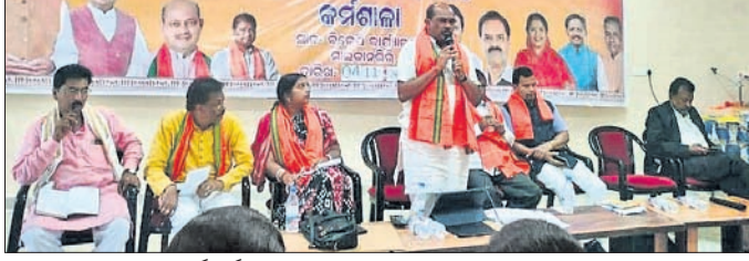
ବୈଠକରେ ଭାଜପା କର୍ମକର୍ତା ।