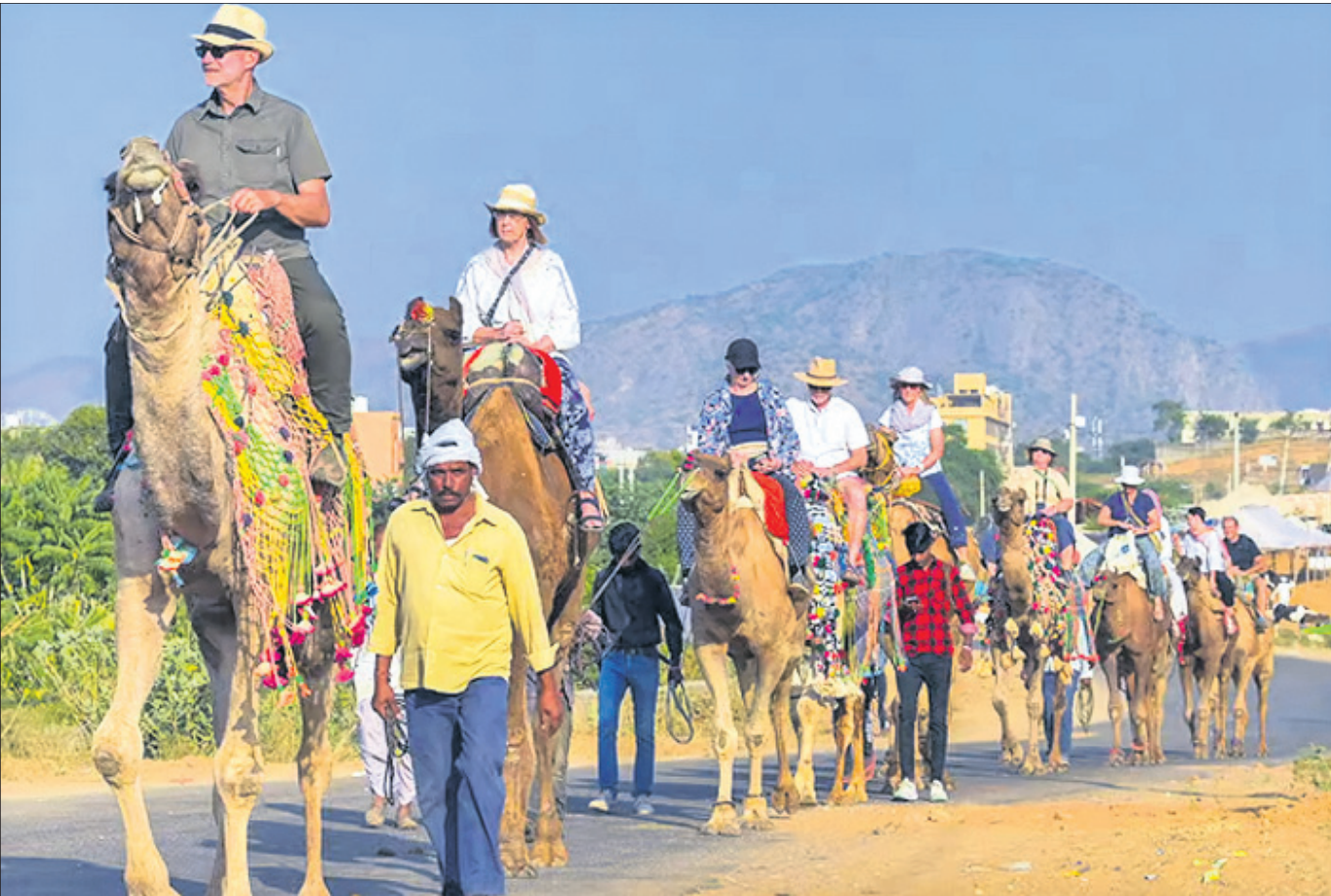
ଆଜମେରର ପୁଷର ମେଳାରେ ବିଦେଶୀ ପର୍ଯ୍ୟଟକମାନେ ଓଡ଼ ସବାରିର ମଜା ନେଉଛନ୍ତି।

ଚଳିତ ବର୍ଷଠାରୁ ଧାନର ସର୍ବନିମ୍ନ ସହାୟକ ମୂଲ୍ୟ (ଏମ୍.ଏସ୍.ପି) ୨୩୦୦ ଟଙ୍କା ଏବଂ ରାଜ୍ୟ ସରକାରଙ୍କ ପକ୍ଷରୁ ଇନ୍‌ସୁରା ସହାୟତା ୮୦୦ ଟଙ୍କା ମିଶାଇ ମୋଟ ୩୧୦୦ ଟଙ୍କାରେ ଚାଷୀ ଧାନ ବଜାର କରିବେ।