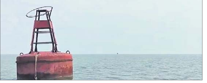
ଭୋଗରାଇ, ୪୧୧ (ପ୍ରବାସ ବାସ)

ଓଡ଼ିଶା ସାମାନ୍ୟ ବାଲେଶ୍ୱର ଜିଲ୍ଲା ଭୋଗରାଇ ବ୍ଲକ୍ ଉଦୟପୁର ସମୁଦ୍ରକୂଳରେ ସୋମବାର ଜାହାଜର ଦିଗ ନିର୍ଣ୍ଣୟ ଯନ୍ତ୍ର (ବର୍ଯ୍ୟ) ମହାସମାବେଶ ଦ୍ୱାରା ଠାଏ କରାଯାଇଛି । ସମ୍ଭବତଃ ଏହି ଦିଗନିର୍ଣ୍ଣୟ ଯନ୍ତ୍ର ସମୁଦ୍ର ଉତ୍ତାର ଢେଉରେ ଗଭୀର ସମୁଦ୍ର ଭାସିଆସି କୂଳଆଡ଼କୁ ଆସିଛି । ଘ୍ଲାନୀୟ ମହାସମାବେଶ ଅନ୍ୟ ତନ୍ତା ଓ ଶିଳ୍ପକାରୀଙ୍କର କୂଳକୁ ଆକର୍ଷିତ । ଉଦୟପୁର ବେଳାଭୂମିକୁ ଆଗତ ପର୍ଯ୍ୟଟକମାନେ ଉଚ୍ଚ ଯନ୍ତ୍ରକୁ ଦେଖିବା ଲାଗି ଭିଡ଼ ଜମାଇଛନ୍ତି । ସୂଚନାଗୁଣୀୟା ଗଭୀର ସମୁଦ୍ରରେ