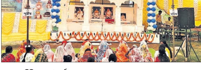
ଏମ୍‌ପି‌ଜି ୮୩ ଗ୍ରାମରେ ଠାକୁର ଅନୁକୂଳ ଚନ୍ଦ୍ରଙ୍କ ଜୟନ୍ତୀ ।