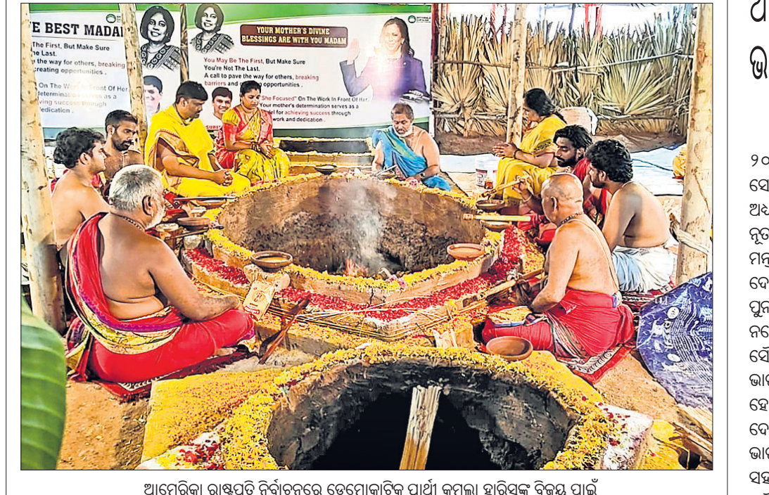
ଆମେରିକା ରାଷ୍ଟ୍ରପତି ନିର୍ବାଚନରେ ତେନୋକ୍ୱାଟିକ୍ ପ୍ରାର୍ଥୀ କମଳା ହାରିବାର ବିକ୍ରମ ପାଇଁ ତେଲଙ୍ଗାନାର ପାଲ୍‌ଭଞ୍ଜାଠାରେ ହିନ୍ଦୁ ପୂଜକମାନେ ସୋମବାର ପୂଜାର୍ଚ୍ଚନା କରୁଛନ୍ତି।

ଉତ୍ତରପ୍ରଦେଶର ୯, ପଞ୍ଜାବର ୪ ଏବଂ କେରଳର ଗୋଟିଏ ବିଧାନସଭା ଆସନ ପାଇଁ ଉପ ନିର୍ବାଚନର ତାରିଖକୁ ନିର୍ଦ୍ଧାରଣ ଆୟୋଗ(ଇସି) ସୋମବାର ବଦଳାଇଛନ୍ତି। ଏହି ୩ ରାଜ୍ୟରେ ବିଭିନ୍ନ ପର୍ବ ପର୍ବଣାକୁ ଦୃଷ୍ଟିରେ ରଖି ଉପନିର୍ବାଚନ ତାରିଖକୁ ନଭେମ୍ବର ୧୩କୁ ନଭେମ୍ବର ୨୦କୁ ଘୁଞ୍ଚାଇ ଦିଆଯାଇଥିବା ନେଇ ଇସିଙ୍କ ପକ୍ଷରୁ ସୂଚନା ଦିଆଯାଇଛି। ନଭେମ୍ବର ଦ୍ୱିତୀୟ ସପ୍ତାହରେ ଉତ୍ତରପ୍ରଦେଶରେ କାର୍ତ୍ତିକ ପୂର୍ଣ୍ଣିମା, ପଞ୍ଜାବରେ ଶ୍ରୀ ଗୁରୁ ନାନକ ଦେବଙ୍କ ୫୫୫ତମ ପ୍ରକାଶ ପର୍ବ ପଡ଼ୁଥିବାରୁ ଉପ ନିର୍ବାଚନରେ ମତଦାନ ହାର କମ୍ ହେବାର ଆଶଙ୍କା କରି ଅନେକ ରାଜନୈତିକ ଦଳ ପକ୍ଷରୁ ନିର୍ବାଚନ ତାରିଖକୁ ବଦଳାଇବା ପାଇଁ ଦାବି କରାଯାଇଥିଲା। କେରଳର ପଲ୍ଲକଟ୍ଟ ବିଧାନସଭା ଆସନର ଉପନିର୍ବାଚନକୁ ନଭେମ୍ବର ୧୩କୁ ନଭେମ୍ବର ୨୦କୁ ଘୁଞ୍ଚାଇ ଦିଆଯାଇଥିବାବେଳେ ତେଲୁଙ୍ଗା ବିଧାନସଭା ଉପନିର୍ବାଚନ ଓ ବହୁ ଚର୍ଚ୍ଚିତ ଖେୟାସ୍ ଲୋକ ସଭା ଉପନିର୍ବାଚନ ପୂର୍ବ ନିର୍ଦ୍ଧାରିତ ନଭେମ୍ବର ୧୩ରେ ଅନୁଷ୍ଠିତ ହେବ ବୋଲି ଇସିଙ୍କ ପକ୍ଷରୁ ବକ୍ଷିତ୍ ପ୍ରକାଶ ପାଇଛି।