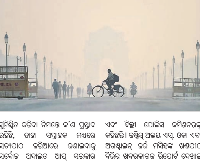
ସୁନିଶ୍ଚିତ କରିବା ନିମନ୍ତେ କ'ଣ ପ୍ରସ୍ତାବ ରହିଛି, ତାହା ସପ୍ତାହକ ମଧ୍ୟରେ ସତ୍ୟପାଠ କରିଆରେ ଜଣାଇବାକୁ ସର୍ବୋଚ୍ଚ ଅଦାଲତ ଆପ୍ ସରକାର

ଅଦାଲତଙ୍କ ନିର୍ଦ୍ଦେଶ ଉଲ୍ଲଙ୍ଘନ କରାଯାଇଥିବା କହିଥିଲେ। ସେହିପରି ଅକ୍ଟୋବର ମାସର ଶେଷ ୧୦ ଦିନରେ କେତେ ନଡ଼ା ପୋଡ଼ି ଘଟଣା ଘଟିଛି ତାହାର ସର୍ବଶେଷ ରିପୋର୍ଟ ୧୪ ତାରିଖ ପୁଣି ଦେବା ନିମନ୍ତେ ଖଣ୍ଡପାଠ ପଞ୍ଜାବ ଓ ହରିୟାଣା ସରକାରଙ୍କୁ କହିଛନ୍ତି। ବାଣ ନିକ୍ଷେପାଦେଶ ଉଲ୍ଲଙ୍ଘନ କରିଥିବା ବ୍ୟକ୍ତିଗଣଙ୍କ ଓ ସଂସ୍ଥା ବିରୋଧରେ କଠୋର କାର୍ଯ୍ୟାନୁଷ୍ଠାନ ଆବଶ୍ୟକ ରହିଛି ବୋଲି ଖଣ୍ଡପାଠ କହିଛନ୍ତି।