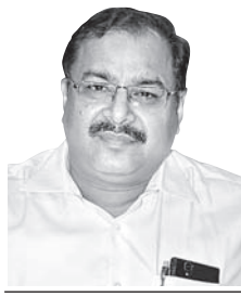
ଉତ୍ତର ଭୂମିର ଦାସ