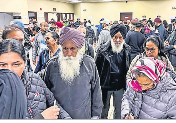
କାନାଡାରେ ଥିବା ଭାରତୀୟମାନେ ମନ୍ଦିର ଆକ୍ରମଣର ପ୍ରତିବାଦ କରୁଛନ୍ତି।

ତାହା ଗ୍ରହଣୀୟ ନୁହେଁ। କାନାଡା ପ୍ରତ୍ୟେକ ନାଗରିକ ସ୍ୱାଧୀନ ଏବଂ ସୁରକ୍ଷିତ ଭାବେ ପୂର୍ଣ୍ଣାଙ୍ଗୀ କରିବା ଅଧିକାର ରହିଥିବା ଗୁଡ଼ୋ କହିଛନ୍ତି। ପିଲ୍ ରିଜିଷ୍ଟ୍ରାଲ ପୋଲିସ୍ କହିବା ଅନୁଯାୟୀ, ବ୍ରାମ୍‌ସ୍‌ଟାଉନ ହିନ୍ଦୁ ମନ୍ଦିରରେ ବିକ୍ରୋଧ ବେଳେ ବିକ୍ରୋଧକାରୀମାନେ ଖଲିସ୍ତାନୀ ସମର୍ଥନରେ ବ୍ୟାନର ଧରିଥିବା ସେହିଆଳ ମିଡିଆରେ ପ୍ରସାରିତ ଭିତ୍ତିରେ ଦେଖିବାକୁ ମିଳିଛି। ହିନ୍ଦୁ ସଭା ହିନ୍ଦୁମାନଙ୍କୁ ମାଡ଼ ମରାଯାଇଛି, ଏହା ସହ ଲାଠିରେ