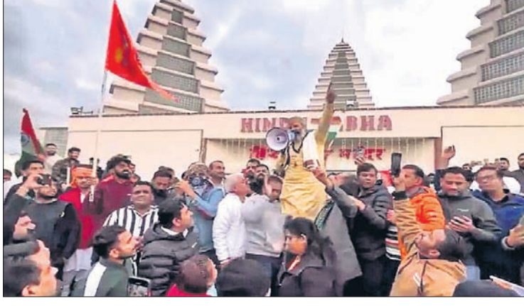
କାନାଡାରେ ବ୍ରାମ୍‌ସ୍‌ଟାଉନ ହିନ୍ଦୁ ମନ୍ଦିରରେ ଖଲିସ୍ତାନୀ ସମର୍ଥକ ପତାକା ଧରି ବିକ୍ରୋଧ କରୁଛନ୍ତି।

କାନାଡା ଓଷ୍ଟାରିଓ ଅନ୍ତର୍ଗତ ବ୍ରାମ୍‌ସ୍‌ଟାଉନରେ ଥିବା ହିନ୍ଦୁ ମନ୍ଦିର ଉପରେ ଖଲିସ୍ତାନୀ ଆକ୍ରମଣ ଆକ୍ରମଣ କରିଛନ୍ତି। ସେଠାରେ ଥିବା ହିନ୍ଦୁମାନଙ୍କୁ ମାଡ଼ ମରାଯାଇଛି। ଏପରିକି ଆକ୍ରମଣର ପ୍ରତିବାଦରେ ହିନ୍ଦୁମାନେ ବିକ୍ରୋଧ କରୁଥିବାବେଳେ କାନାଡା ପୋଲିସ୍ ସେମାନଙ୍କୁ ମାଡ଼ ମାରିଥିବା ଅଭିଯୋଗ ହୋଇଛି। ଭାରତୀୟ ପତାକା ଧରି ମନ୍ଦିର ଯାଉଥିବା ଲୋକମାନଙ୍କୁ ପୋଲିସ୍ ଆକ୍ରମଣ କରୁଥିବା ଭିତ୍ତିରେ ଦେଖିବାକୁ ମିଳିଛି। କାନାଡା ଜଣେ ଖବରଦାତା ଉକ୍ତ ଭିତ୍ତି ଶେୟାର କରିଛନ୍ତି। ଅନ୍ୟପକ୍ଷରେ ହିନ୍ଦୁ ମନ୍ଦିର ଉପରେ ଆକ୍ରମଣକୁ କାନାଡା ପ୍ରଧାନମନ୍ତ୍ରୀ ଜଷ୍ଟିନ୍ ଟ୍ରଡ଼ୋ ନିନ୍ଦା କରିଛନ୍ତି। ହିନ୍ଦୁ ସଭା ହିନ୍ଦୁମାନଙ୍କୁ ମାଡ଼ ମରାଯାଇଛି, ଏହା ସହ ଲାଠିରେ