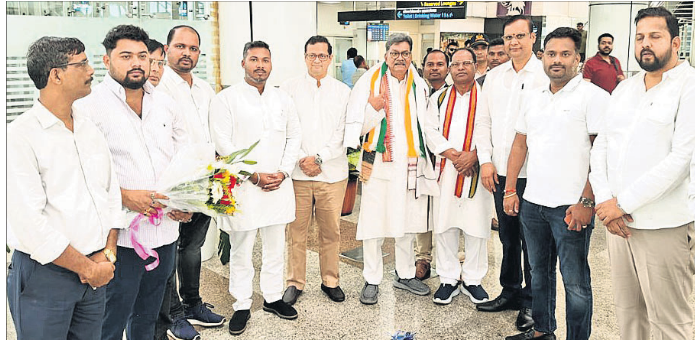
ଭୁବନେଶ୍ୱର ବିମାନ ବନ୍ଦରଠାରେ ଯୋଗଦାନ ଛତିଶଗଡ଼ ବିଧାୟକ ଦଳର ନେତା ଚରଣ ଦାସ ମହନ୍ତ ପହଞ୍ଚିବା ପରେ ତାଙ୍କୁ କଂଗ୍ରେସର କର୍ମକର୍ତ୍ତାମାନେ ସ୍ୱାଗତ କରୁଛନ୍ତି ।