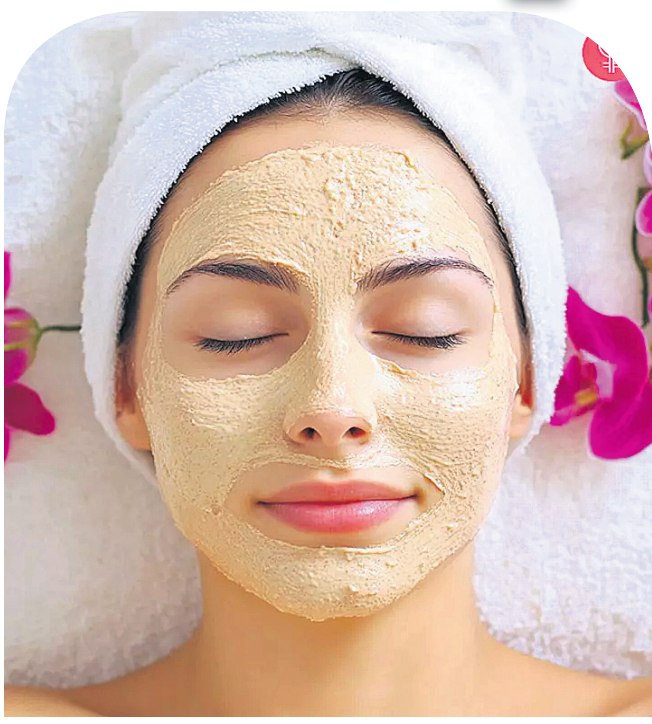
ସ୍କିନ୍ ଗ୍ଲୋଇଂ ରଖିବାକୁ ହେଲେ ନିମ୍ନଲିଖିତ ଟିପ୍ସ ଆପଣଙ୍କ ପାଇଁ...

ବଦଳୁଥିବା ଋତୁ ଅନୁସାରେ ସ୍କିନ୍ ଠିକ୍ ଭାବରେ ଯତ୍ନନେବା ଦରକାର। ବେଳେବେଳେ ଏଥିରେ ଅବହେଳା ଦେଖିବାକୁ ମିଳିଥାଏ। ଏହାର କାରଣ ନିଜର ସ୍କିନ୍ ଟେକ୍ସଚର ଦେଖି ବୁଝାପଡ଼ିଲେ ଯେ କ'ଣ କରାଯିବ। ଏଥିପାଇଁ ବକାରକୁ ଆପଣ ବିଭିନ୍ନ ପ୍ରକାର ପ୍ରଦତ୍ତ କରି ତାକୁ ସ୍କିନ୍ ଲାଗି ବ୍ୟବହାର କରିଥାନ୍ତି। କେତେକ ବିସ୍ତୃତି ପାଇଁ ଯାଇ ସ୍କିନ୍ କେୟାର ନେଇଥାନ୍ତି। ପ୍ରତି ଥର ଟଙ୍କା ଖର୍ଚ୍ଚ କରିବା ଅପେକ୍ଷା ଆପଣ କିଛି ଘରୋଇ ଉପଚାର ଆପଣେଇ ପାରିବେ। କାଣ୍ଡୁ ସେ ସମ୍ପର୍କରେ.. ମହୁ -ମହୁ ଲଗାଇବାକୁ ହେଲେ ପ୍ରଥମେ ଏକ ଛୋଟ ପାତ୍ର ନିଅନ୍ତୁ। ସେଥିରେ ୧ ଚାମଚ ମହୁ ନିଅନ୍ତୁ। ଏବେ ଏଥିରେ ବେସନ ପକାଇ ଏହାକୁ ଭଲଭାବେ ମିଶ୍ର କରନ୍ତୁ। ପୁଣି ଏହାର ସେଷ୍ଟ ବଜାନ୍ତୁ। ପାଣିରେ ମହୁକୁ ଭଲଭାବେ ସଫା କରିବା ପରେ ଏହି ପ୍ୟାକ୍ଟ ଲଗାନ୍ତୁ। ଏହାକୁ ପାଖାପାଖି ୨୦-୩୦ ମିନିଟ୍ ପର୍ଯ୍ୟନ୍ତ ଲଗାନ୍ତୁ। ପୁଣି