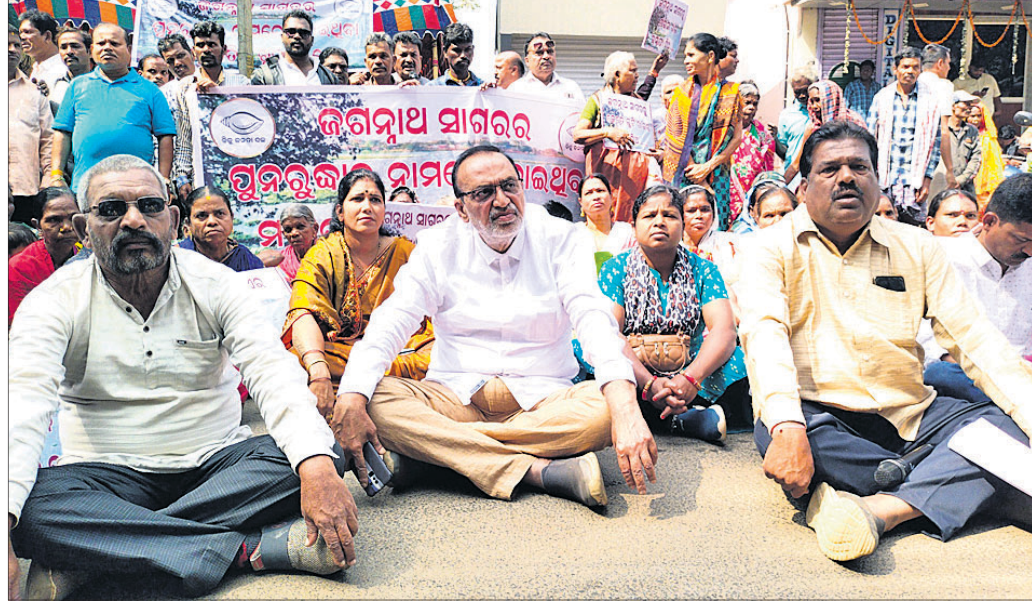
ଜୟପୁର ବିଜେଡି ପକ୍ଷରୁ ଧାରଣା ଦିଆଯାଇଛି ।