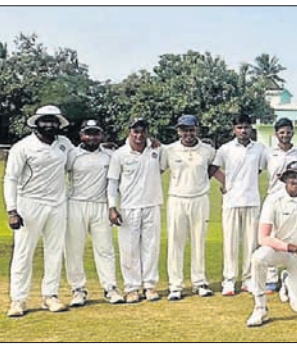
ଅତିଥିକ୍ତ ଗହଣରେ ଭଣ୍ଡାସ ଦଳର ଖେଳାଳି ଏବଂ ଅନ୍ୟମାନେ।

ଖୋର୍ଦ୍ଧା, ୪୧୧ (ପ୍ରଭାତ ପାଣିଗ୍ରାହୀ): କ୍ରୀଡ଼ାକର୍ମ ଆୟୋଜିତ ଅଟୁ ଖୋର୍ଦ୍ଧା ଆନୁକୂଲ୍ୟରେ ସିନିୟର ଇଣ୍ଟର କ୍ରୀଡ଼ାକର୍ମ ଚୁନିମେଣ୍ଟ ଗ୍ଲାନୀୟ ବିଜେଟି ହାଇସ୍କୁଲ ନିମ୍ନ ଷ୍ଟାଡ଼ିୟମରେ ସୋମବାର ଆରମ୍ଭ ହୋଇଛି। ପ୍ରଥମ ଦିବସରେ ଖୋର୍ଦ୍ଧା କ୍ରୀଡ଼ାକର୍ମ କ୍ଳବକୁ ହରାଇ ରାଇଫିଙ୍ଗର କ୍ଳବ ବିଜୟୀ ହୋଇଛି। ରାଇଫିଙ୍ଗର କ୍ଳବ ପ୍ରଥମେ ବ୍ୟାଟିଂ କରି ୩୨.୨ ଓଭରରେ ୧୦ରୁଜକେଟ ବିନିମୟରେ ୧୨୦ରୁନ ହୋଇଥିଲା।