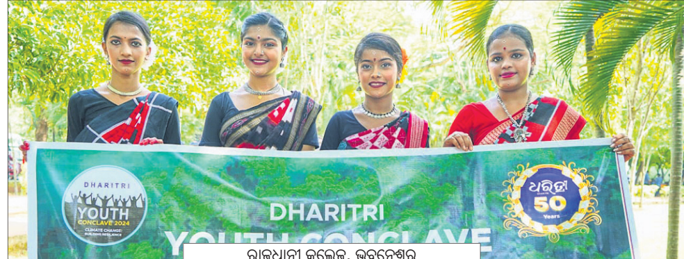
ରାଜଧାନୀ କଲେଜ, ଭୁବନେଶ୍ଵର