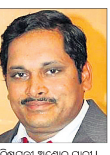
କନିଷ୍ଠଯନ୍ତ୍ରୀ ଅଶୋକ ପାଢ଼ୀ।