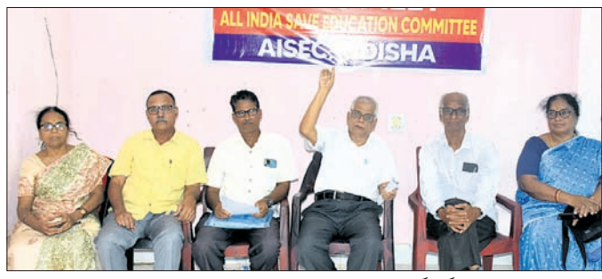
ଖବରଦାତା ସମ୍ମିଳନୀରେ ଅଧିକାରୀଙ୍କୁ ଶିକ୍ଷା ବଞ୍ଚାଅ କମିଟି କର୍ମଚାରୀ।

ରାଜ୍ୟରେ ୪ ବର୍ଷୀୟା ତ୍ରିଗ୍ରୀ କୋର୍ସ ସହ ବହୁ ପ୍ରସ୍ଥାନ ବ୍ୟବସ୍ଥା ଲାଗୁ କରିବାକୁ ରାଜ୍ୟ ସରକାର ନିଷ୍ପତ୍ତି ନେଇଥିବାବେଳେ ଅଧିକ ଭାରତ ଶିକ୍ଷା ବଞ୍ଚାଅ କମିଟିର ଓଡ଼ିଶା ଶାଖା ପକ୍ଷରୁ ଏହାକୁ ବିରୋଧ କରାଯାଇଛି। ଚଳିତ ଶିକ୍ଷାବର୍ଷରେ ଗତ ଅଗଷ୍ଟରୁ ପାଠପଢ଼ା ଆରମ୍ଭ ହୋଇଥିବାବେଳେ ବର୍ଷ ଅଧ୍ୟାୟରେ ଏପରି ବ୍ୟବସ୍ଥା ଲାଗୁ କରାଯିବା ସମ୍ପୂର୍ଣ୍ଣ ଅଗଣାତନ୍ତ୍ରିକ ଓ ଉଚ୍ଚଶିକ୍ଷାରେ ବଡ଼ ଅବ୍ୟବସ୍ଥା ସୃଷ୍ଟି କରିବ। ସେହିପରି ଏହି କୋର୍ସ ଦ୍ୱାରା ଛାତ୍ରଛାତ୍ରୀମାନେ