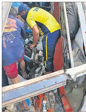
ମର୍ତ୍ତ୍ୟୁ (ଉତ୍ତରାଖଣ୍ଡ), ୪।୧୧ (ପି.ଟି.)

ଉତ୍ତରାଖଣ୍ଡର ଆଲମୋରା ଜିଲ୍ଲାରେ ସୋମବାର ଏକ ବସ୍ ଗଭୀର ଗର୍ଭକୁ ଖସିପଡ଼ିବାରୁ ୩୬ ଯାତ୍ରୀଙ୍କ ମୃତ୍ୟୁ ଘଟିବା ସହ ୨୪ ଜଣ ଆହତ ହୋଇଛନ୍ତି।