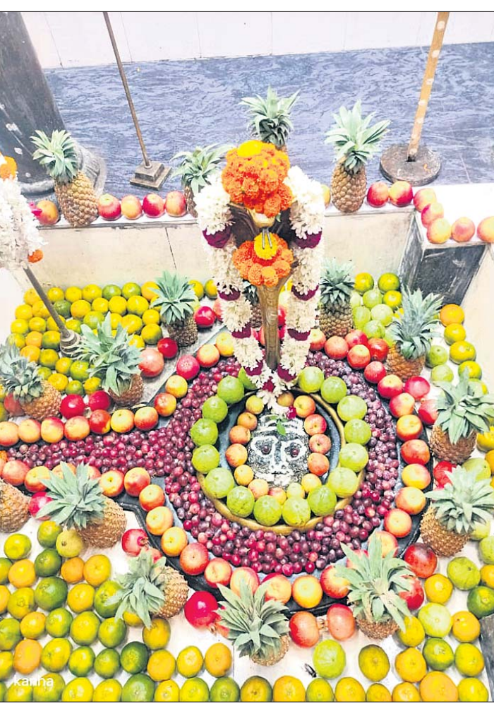
ବାବା ଧର୍ମାନ୍ତରକୁ ବିଭିନ୍ନ ପକ୍ଷରେ ସୁସଜ୍ଜିତ କରାଯାଇଛି।