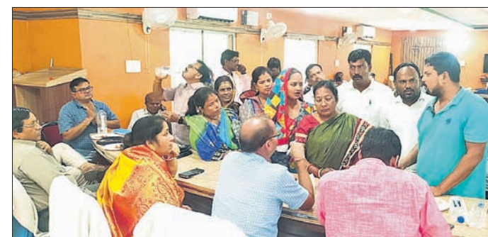
ଅଧିକାରୀମାନେ ଲୋକଙ୍କ ଅଭିଯୋଗ ଶୁଣିଛନ୍ତି।