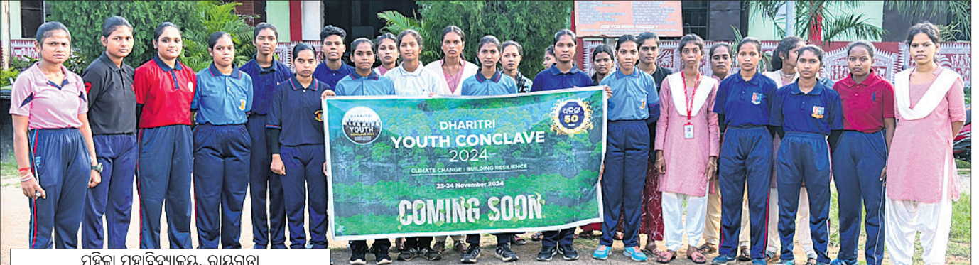
ମହିଳା ମହାବିଦ୍ୟାଳୟ, ରାୟଗଡ଼ା