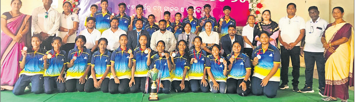
ଅତିଥି ଓ କର୍ମକର୍ତ୍ତାଙ୍କ ସହ ଚାମ୍ପିୟନ ବଲାଙ୍ଗୀର ଦଳର ପ୍ରତିଯୋଗୀ ।