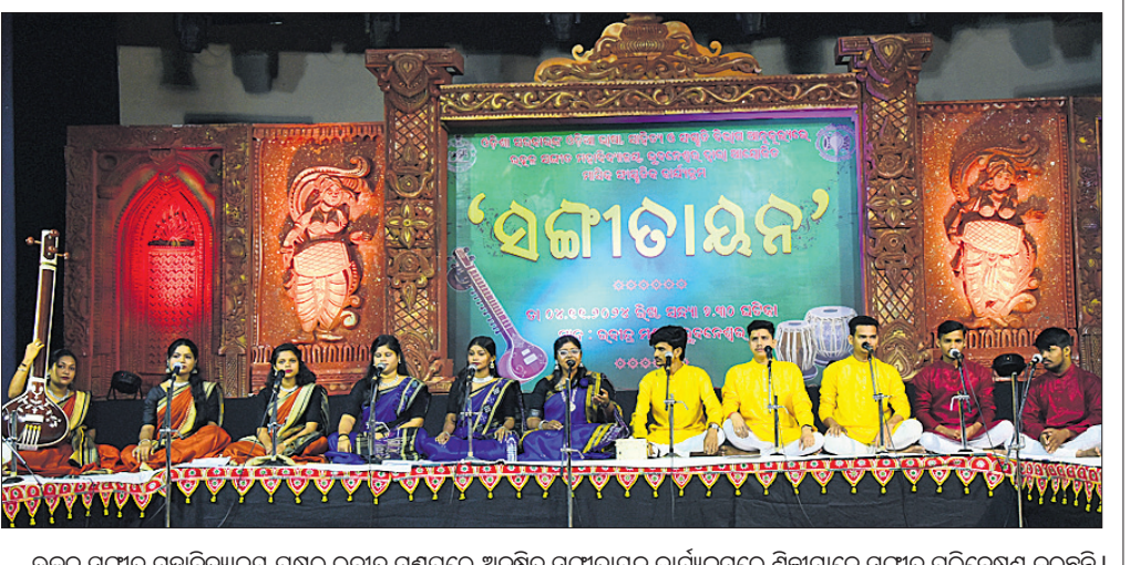
ଉତ୍କଳ ସଙ୍ଗୀତ ମହାବିଦ୍ୟାଳୟ ପକ୍ଷରୁ ରବୀନ୍ଦ୍ର ମଞ୍ଚପରେ ଅନୁଷ୍ଠିତ ସଙ୍ଗୀତାୟନ କାର୍ଯ୍ୟକ୍ରମରେ ଶିଳ୍ପୀମାନେ ସଙ୍ଗୀତ ପରିବେଷଣ କରୁଛନ୍ତି।

ଆସି ଧକ୍କା ଦେଇଥିଲା। ଦୁର୍ଘଟଣାକୁ ନେଇ ଦୁଇ ଚାଳକଙ୍କ ମୁକ୍ତିତର୍କ ହୋଇଥିଲା। ଚାଟା ଏସିଇ ଚାଳକଙ୍କୁ ଘାନୀୟ ଅଞ୍ଚଳରେ ହୋଇଥିବାରୁ ସେ କିଛି ସହଯୋଗୀଙ୍କୁ ଡାକି ଅନ୍ ଲାଇନ ଅଟୋ ଚାଳକ ସରୋଷକୁ ମରଣାନ୍ତକ ଆକ୍ରମଣ କରିଥିଲେ।