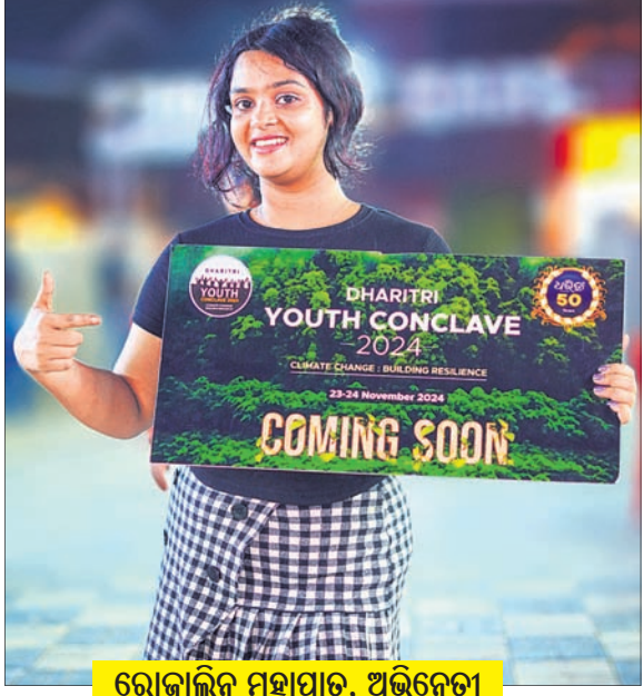
ରୋଜାଲିନ ମହାପାତ୍ର, ଅଭିନେତ୍ରୀ