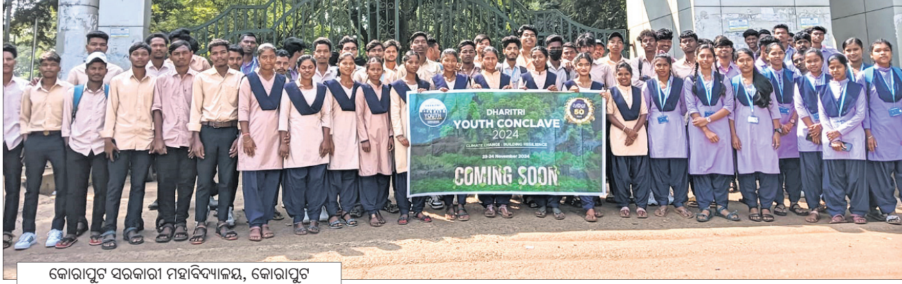
କୋରାପୁଟ ସରକାରୀ ମହାବିଦ୍ୟାଳୟ, କୋରାପୁଟ