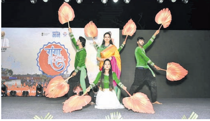
ଭୁବନେଶ୍ୱର, ୪।୧୧ (ଅନୁରାଧା ମହାରଣା)

ଆଗାଦି କା ଅମୃତ ମହୋତ୍ସବ ଅବସରରେ କଳ ଶିଳ୍ପ ମନୁଶାଳୟ ଦ୍ୱାରା ହରିଦ୍ୱାର ଚାନ୍ଦି ଘାଟରେ ନ୍ୟାଶନାଲ କାହାକୁ ଅବଗତ କରାଯାଉ ନ ଥିଲା। ଡେବେ ଏହାକୁ ବିପଦ ଗୋଷ୍ଠୀ ବିରୋଧ କରିବା ସହ ପୋଡ଼ା ଯାଇଥିବା ବାତ୍ତାଣକୁ ହତାହତ କରାଯାଇ ପ୍ରକାଶ ପାଇଥିଲା। ପୋଲିସ୍ ପହଞ୍ଚି ପରିସ୍ଥିତି ନିୟନ୍ତ୍ରଣ କରି ଫୋର୍ସ ମୁତୟନ କରିଥିଲା।