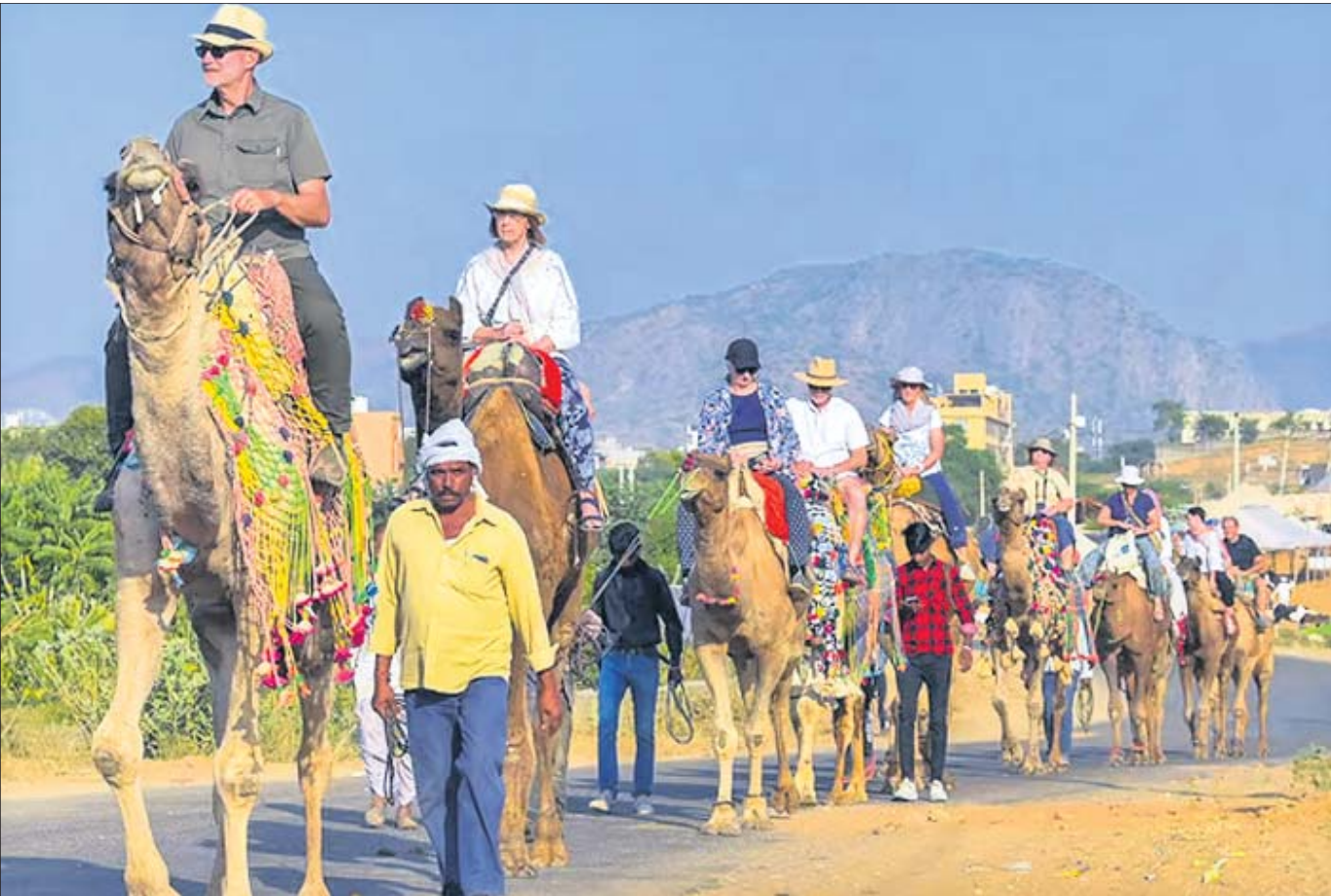
ଆଜମେରର ପୁଷ୍ପ ମେଳାରେ ବିଦେଶୀ ପର୍ଯ୍ୟଟକମାନେ ଓଡ଼ ସବାରିର ମଜା ନେଉଛନ୍ତି।

ଚଳିତ ବର୍ଷଠାରୁ ଧାନର ସର୍ବନିମ୍ନ ସହାୟକ ମୂଲ୍ୟ (ଏମ୍.ଏସ୍.ପି) ୨୩୦୦ ଟଙ୍କା ଏବଂ ରାଜ୍ୟ ସରକାରଙ୍କ ପକ୍ଷରୁ ଇନ୍‌ସୁରା ସହାୟତା ୮୦୦ ଟଙ୍କା ମିଶାଇ ମୋଟ ୩୧୦୦ ଟଙ୍କାରେ ଚାଷୀ ଧାନ ବିକ୍ରି କରିବେ।