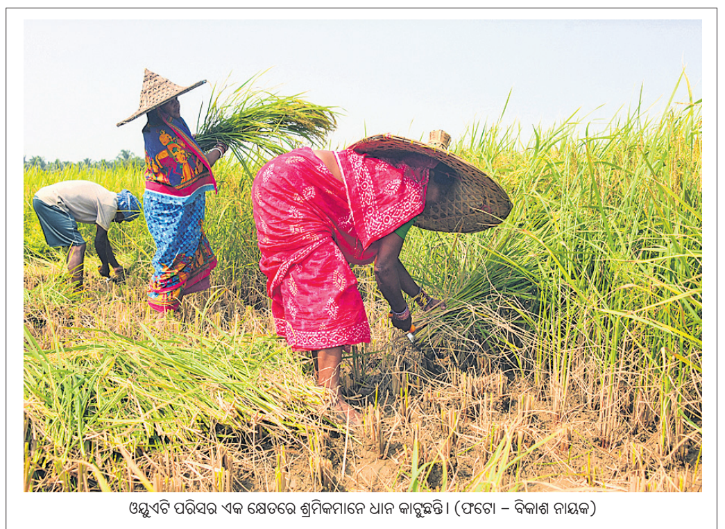
ଓୟୁଏଟି ପରିସର ଏକ କ୍ଷେତରେ ଶ୍ରମିକମାନେ ଧାନ କାଟୁଛନ୍ତି।

ପ୍ରତ୍ୟୁମ୍ନ କହୁଥିଲେ। ସେହିପରି ଏକିତାଙ୍କ ସହ ପ୍ରେମ ସମ୍ପର୍କକୁ ରୋକି ସମର୍ଥନ ଜଣାଉଥିବା ଏକିତାଙ୍କ ପାଖରେ ପ୍ରତ୍ୟୁମ୍ନ କହୁଥିଲେ। ଏଭଳି ସ୍ତ୍ରୀ ପକାଇ ଦୁଇ ଯୁବକଙ୍କୁ ପ୍ରତ୍ୟୁମ୍ନ ଫସାଇଥିଲେ। ଅନ୍ୟପକ୍ଷରେ ୬ ମାସ ହେବ ବାପଘରେ ଥିବା ସ୍ତ୍ରୀ ଶୁଭଶ୍ରୀ ସ୍ୱାମୀଙ୍କ ସହ ଯିବାକୁ ଅତି ବସିଥିଲେ। ଏପିକିତା ତାଙ୍କୁ ଖୋର୍ଦ୍ଧାକୁ ଚିହ୍ନିଥିବା ବେଳେ ପ୍ରତ୍ୟୁମ୍ନ ଉଭୟଙ୍କ ସହ ଛଳନା କରିଥିଲେ। ଏକାକୀନ ପ୍ରତ୍ୟୁମ୍ନ ଦୁଇ ଜଣଙ୍କୁ ଭଲପାଉଥିବାବେଳେ ଉଭୟଙ୍କୁ ସତ କଥା ଲୁଚାଇ ଚାଲିଥିଲେ। ରୋଜିଙ୍କ ସହ ପ୍ରେମ ସମ୍ପର୍କକୁ ଏକିତା ସମର୍ଥନ ଜଣାଉଥିବା ରୋଜିଙ୍କ ପାଖରେ