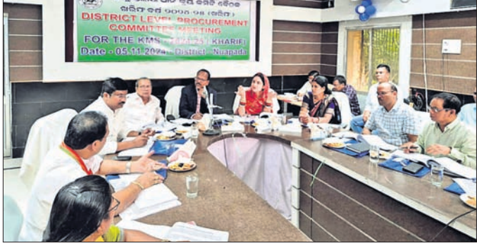
ଧାନ କ୍ରୟ କମିଟି ଦୈନିକରେ ଏମ୍ପି, ବିଧାୟକ ଓ ଅଧିକାରୀମାନେ।

ନୂଆପଡ଼ା ଜିଲ୍ଲାପାଳଙ୍କ ସଦ୍‌ଭାବନା ସହାୟତାରେ ମଙ୍ଗଳବାର ୨୦୨୪-୨୫ ଖରିଫ ଉତ୍ତ ଧାନ ସଂଗ୍ରହ କମିଟି ଦୈନିକ ଅନୁଷ୍ଠିତ ହୋଇଯାଇଛି।