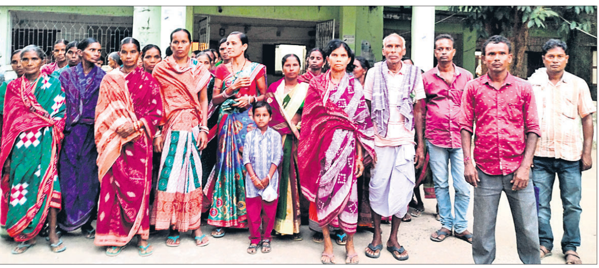
ଜମି ଜବରଦଖଲ ବିରୋଧରେ ଫେରାଦ ହେବାକୁ ଆସିଥିବା ବୀରମହାରାଜପୁର ତହସିଲ କାର୍ଯ୍ୟାଳୟ ସମ୍ମୁଖରେ ବଡ଼ମାଳ ଗ୍ରାମର ମହିଳାମାନେ।

ସେଲ୍ଫି ପଠାଇବା ସମୟରେ ନିଜର ନାମ ଏବଂ ମୋବାଇଲ ନମ୍ବର ଦେବାକୁ ଭୁଲନ୍ତୁ ନାହିଁ। ଯୋଗ୍ୟ ବିବେଚନା ପରେ ପ୍ରକାଶ ପାଇବ।