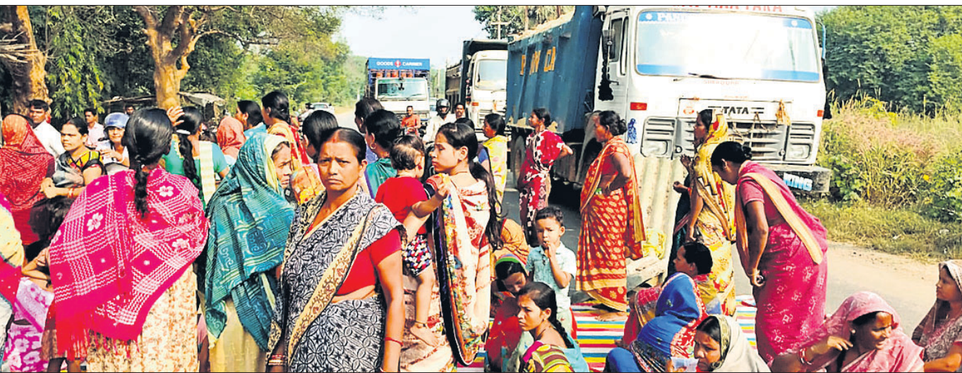
ଖେଳାପାଳିରେ ପ୍ରଭାବିତ ପରିବାର ଓ ଗ୍ରାମବାସୀ ରାସ୍ତାରୋକ୍ତା କରିଛନ୍ତି।

ଏତଦ୍‌ବ୍ୟତୀତ ପ୍ରତ୍ୟେକ ଧାନ ସଂଗ୍ରହ କେନ୍ଦ୍ରରେ ଗଣାକ ଅଭିଯୋଗ ଗ୍ରହଣ ଲାଗି ସ୍ୱତନ୍ତ୍ର ରେଜିଷ୍ଟର ସହ କାର୍ଯ୍ୟାନୁଷ୍ଠାନ ଗ୍ରହଣ କରାଯିବ ବୋଲି ଜିଲ୍ଲାପାଳ କହିଥିଲେ।