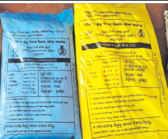
ଛତୁଆ ପ୍ୟାକେଟ୍ରେ ପ୍ରସ୍ତୁତ ତାରିଖ ଉଲ୍ଲେଖ ନାହିଁ।

ରିପୋର୍ଟ କରାଯାଇଛି। ଯାହା ମା' ଓ ଶିଶୁଙ୍କୁ ସ୍ୱାସ୍ଥ୍ୟପ୍ରତି ବିପଦ ସୃଷ୍ଟି କରୁଛି। ତେବେ ଓଜନ କମ୍ ରହୁଥିବା ଓ ଅସ୍ୱାସ୍ଥ୍ୟକର ପରିବେଶରେ ଛତୁଆ ପ୍ରସ୍ତୁତି ହେଉଥିବା ବେଳେ କମିଟି ରିପୋର୍ଟ ଦେଇଛି।