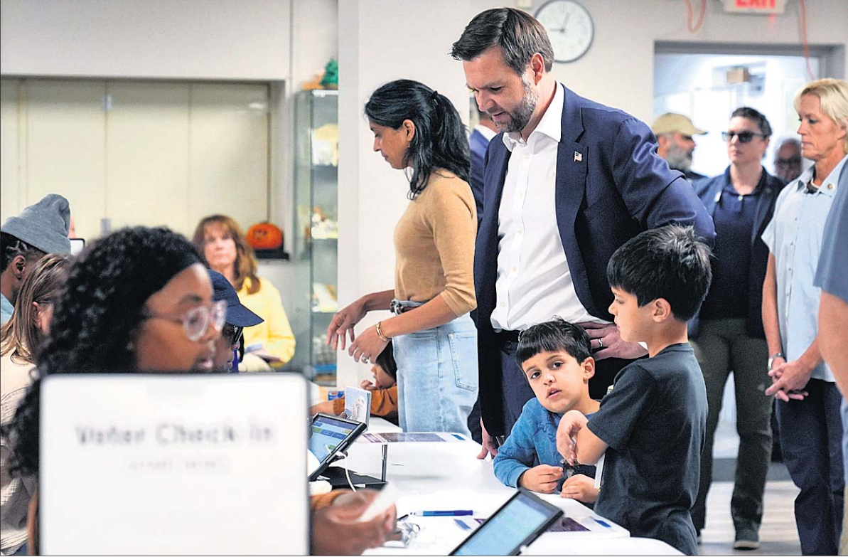
ଆମେରିକା ରାଷ୍ଟ୍ରପତି ନିର୍ବାଚନରେ ରିପବ୍ଲିକାନ୍ ପାର୍ଟିର ଉପରାଷ୍ଟ୍ରପତି ପ୍ରାର୍ଥୀ ଜେଡ୍ ଭାସ୍କ ମଜଲସାର ଓଡ଼ିଆ ରାଜ୍ୟ ସିନେମାଟୋଗ୍ରାଫି ସ୍ତା ଉପାଦାନ ଓ ପିଲାମାନଙ୍କୁ ଧରି ଭୋଟ ଦେବାକୁ ଆସି ପହଞ୍ଚିଛନ୍ତି।