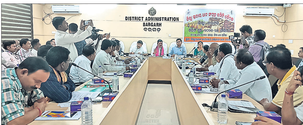
ବୈଠକରେ ଉପସ୍ଥିତ ଅଧିକାରୀ ଏବଂ ଅନ୍ୟମାନେ।

ଖରିଦ ବର୍ଷ ୨୦୨୪-୨୫ ଧାନ ସଂଗ୍ରହ ଲାଗି ଜିଲ୍ଲାପାଳ ଆଦିତ୍ୟ ଗୋୟାଲଙ୍କ ଅଧ୍ୟକ୍ଷତାରେ ମଙ୍ଗଳବାର ଜିଲ୍ଲାସ୍ତରୀୟ ଧାନ ସଂଗ୍ରହ କମିଟି ବୈଠକ ଅନୁଷ୍ଠିତ ହୋଇଯାଇଛି।