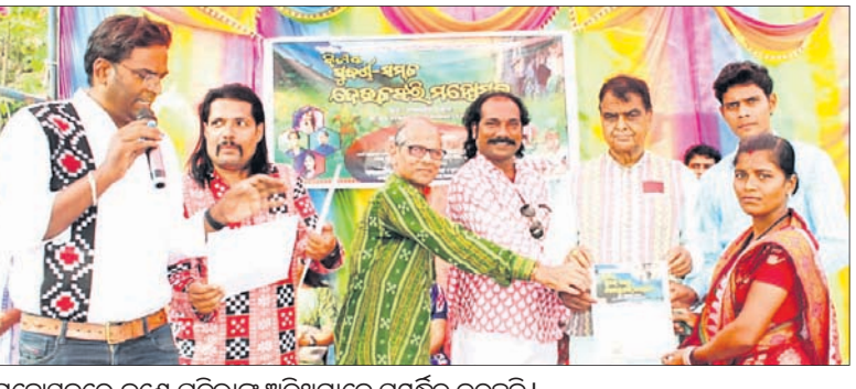
ମହୋତ୍ସବରେ ଜଣେ ପ୍ରତିଭାକୁ ଅତିଥିମାନେ ସମର୍ଥନ କରୁଛନ୍ତି।

ଅମରପାଳି, ୫୧୧ (ପଞ୍ଚମ ଘଣ୍ଟା) ସୁବର୍ଣ୍ଣପୁର ଜିଲ୍ଲାର ଅନେକ ପର୍ଯ୍ୟଟନସ୍ଥଳୀ ରହିଛି। ଏସବୁ ଏବେ ବି ଲୋକଲୋଚନକୁ ଆସି ପାରିନାହିଁ। ପ୍ରାୟ ସମସ୍ତ ପର୍ଯ୍ୟଟନସ୍ଥଳୀର ବିକାଶ କରାଯାଇ ପାରିନାହିଁ। ସୁବର୍ଣ୍ଣପୁର-ସମଲପୁର ଜିଲ୍ଲା ସୀମାବର୍ତ୍ତୀ ବୀରମହାରାଜପୁର ବ୍ଲକ୍ ବନ୍ଦଳପଦର ପଞ୍ଚାୟତର କୁନ୍ଦପାଳ ନିକଟ ପ୍ରସିଦ୍ଧ ଦେଉଳଖଣ୍ଡର ପାଠ୍ୟପଞ୍ଚାୟତ ସାଂସ୍କୃତିକ କାର୍ଯ୍ୟକ୍ରମ ଅନୁଷ୍ଠିତ ହୋଇଥିଲା।