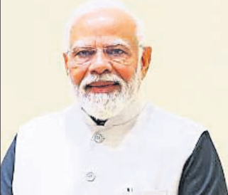
ନୂଆଦିଲ୍ଲୀ, ୬।୧୧ (ପି.ଟି.)

ରାଷ୍ଟ୍ରପତି ନିର୍ବାଚନରେ ଏତିହାସିକ ବିଜୟ ପାଇଁ ବନ୍ଧୁ ତୋନାଲ୍ ଟ୍ରମ୍ପ୍ ପ୍ରଧାନମନ୍ତ୍ରୀ ନରେନ୍ଦ୍ର ମୋଦି ହୃଦୟଭରା ଅଭିନନ୍ଦନ ଜଣାଇଛନ୍ତି। ଭାରତ-ଆମେରିକା ବିସ୍ତୃତ ବୈଶ୍ୱିକ ଓ ରକ୍ଷଣାତ୍ମକ ସହଭାଗିତାକୁ ଆହୁରି ମଜବୁତ କରିବା ଦିଗରେ ସହଯୋଗ ବଢ଼ାଇବାକୁ ଚାହୁଁଥିବା ପ୍ରଧାନମନ୍ତ୍ରୀ କହିଛନ୍ତି। ଉଭୟ ଦେଶବାସୀଙ୍କ ମଙ୍ଗଳ ଏବଂ ବିଶ୍ୱ ଶାନ୍ତି, ସ୍ଥିରତା ଏବଂ ସମୃଦ୍ଧି ପ୍ରସାର ଦିଗରେ ଏକାଠି କାର୍ଯ୍ୟ କରିବା ପାଇଁ ମୋଦି ଆହ୍ୱାନ ଦେଇଛନ୍ତି। ସୁତନାୟୋଗ୍ୟ, ଗତ ମାସରେ ଟ୍ରମ୍ପ୍ ପ୍ରଧାନମନ୍ତ୍ରୀଙ୍କୁ ସବୁଠୁ ସୁନ୍ଦର ବ୍ୟକ୍ତି ଏବଂ ମୋଦି ବନ୍ଧୁ ବୋଲି କହିଥିଲେ। କଂଗ୍ରେସ୍ ଅଧକ୍ଷ ମଲ୍ଲିକାର୍ଜୁନ ଖାର୍ଜେ ବଳ ଚରଫ୍ ଟ୍ରମ୍ପ୍ ଅଭିନନ୍ଦନ ଜଣାଇଛନ୍ତି। ବିଶ୍ୱ ଶାନ୍ତି ଏବଂ ସମୃଦ୍ଧି ପାଇଁ ଆମେରିକା ସହ କାର୍ଯ୍ୟ କରିବାକୁ ଚାହୁଁ ବୋଲି ସେ ଲେଖିଛନ୍ତି।