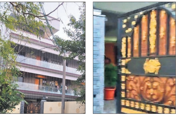
ଆର୍ଯ୍ୟ ବିହାରସ୍ଥିତ ୪ ମହଲା କୋଠା। ସେନ୍ଦର ଲାଗିଥିବା ରୋଡ୍