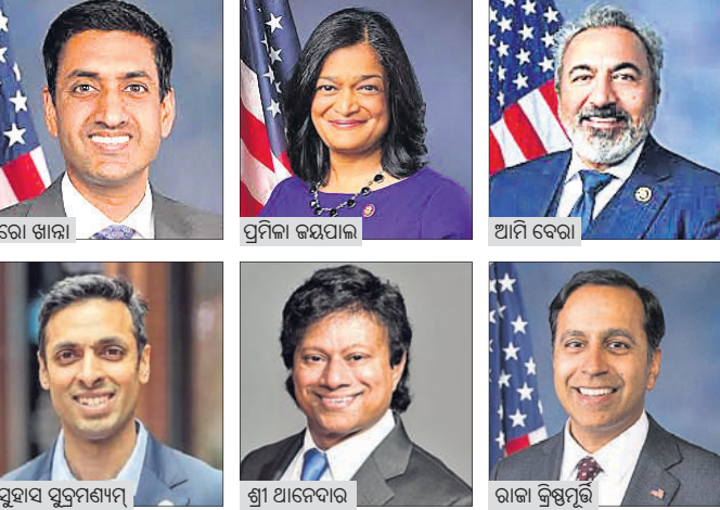
ରୋ ଖାନ୍ନା, ପ୍ରମିଳା କନ୍ୟାପାଲ, ଆନି ବେରା, ସୁହାସ ସୁବ୍ରହମଣ୍ୟ, ଶ୍ରୀ ଆନେସାର, ରାଜା କ୍ରିଷ୍ଣମୂର୍ତ୍ତି

ଆମେରିକା କଂଗ୍ରେସର ନିମ୍ନ ସଦନ ସେମାନେ ପୁନଃନିର୍ବାଚିତ ହୋଇଥିବାକୁ ହାଉସ୍ ଅଫ୍ ରିପ୍ରେଜେଣ୍ଟେଟିଭ୍ସରେ ଭାରତୀୟ ବଂଶୋଦ୍ଭବ ସଦସ୍ୟଙ୍କ ସଂଖ୍ୟା ୬ରେ ପହଞ୍ଚିଛି। ଆର୍ଚେନ ଡିଭିନିଆ ଷ୍ଟେଟ୍ ସିନେଟର ସୁହାସ ସୁବ୍ରହମଣ୍ୟ ଉକ୍ତ ନିର୍ବାଚନ ପରେ ପାଇଁ ବିଜୟୀ ହୋଇଛନ୍ତି। ସେହିପରି ଆନବୋର ମିଡିଗାନ୍ ୧୩ତମ ଜିଲାରୁ ବକାୟ ରଖିଥିବାବେଳେ କ୍ରିଷ୍ଣମୂର୍ତ୍ତି ଲଲିନୋଭ୍ ଅଧିକ ଜିଲାରୁ ପଞ୍ଚମ ଥର ପାଇଁ ନିର୍ବାଚିତ ହୋଇଛନ୍ତି। ରାଜା କ୍ରିଷ୍ଣମୂର୍ତ୍ତି, ରୋ ଖାନ୍ନା, ପ୍ରମିଳା କନ୍ୟାପାଲ ଏବଂ ଶ୍ରୀ ଆନେସାର ସେମାନଙ୍କ ଆସନକୁ ବକାୟ ରଖିଛନ୍ତି।