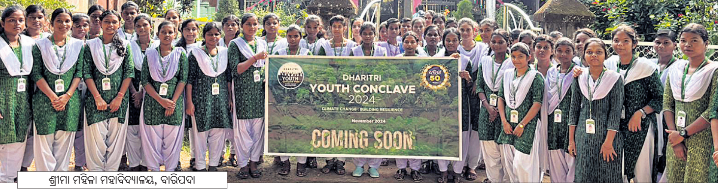
ଶ୍ରୀମା ମହିକା ମହାବିଦ୍ୟାଳୟ, ବାରିପଦା