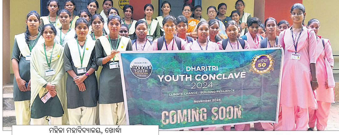
ମହିକା ମହାବିଦ୍ୟାଳୟ, ଖୋର୍ଦ୍ଧା