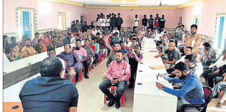
ବିଚାରପତିଙ୍କୁ ନିଜ ଗ୍ରାମକୁ ଫୋରାଇବାକୁ ପ୍ରଶାସନର ପ୍ରସ୍ତୁତି

କୋରାପୁଟ ଜିଲ୍ଲା ନାରାୟଣପାଟଣା ବିଭାଗୀୟ ପରିବାରକୁ କୋରାପୁଟ ନାରାୟଣପାଟଣା ନିଜ ଗ୍ରାମକୁ ଫୋରାଇବା ନେଇ ଜିଲ୍ଲା ପ୍ରଶାସନ ପକ୍ଷରୁ ପ୍ରଫୁଲ୍ଲ ଆରଣ୍ୟ ହୋଇଛି।