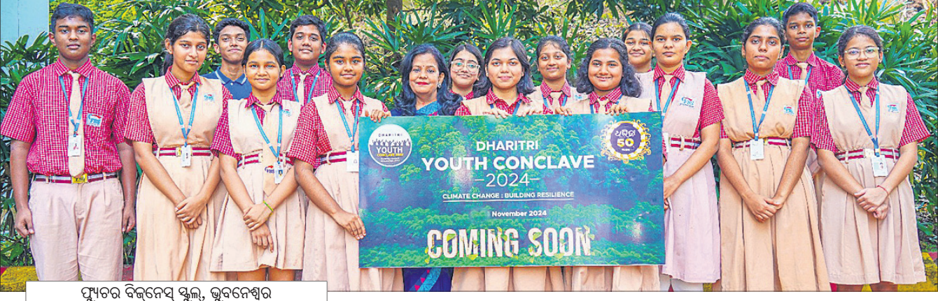
ପୁଅତର ବିକଳନେତ୍ର ସ୍କୁଲ, ଭୁବନେଶ୍ଵର