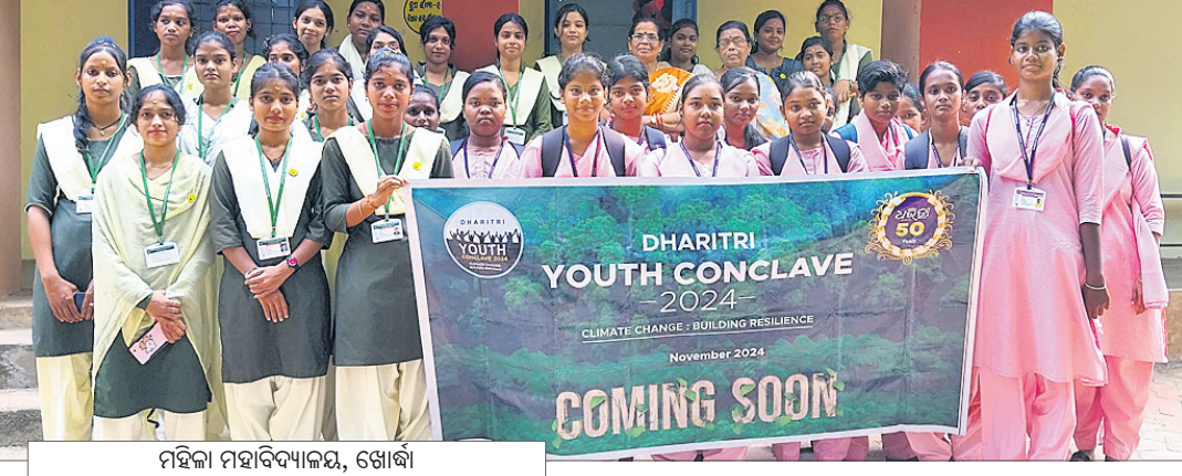
ମହିଳା ମହାବିଦ୍ୟାଳୟ, ଖୋର୍ଦ୍ଧା