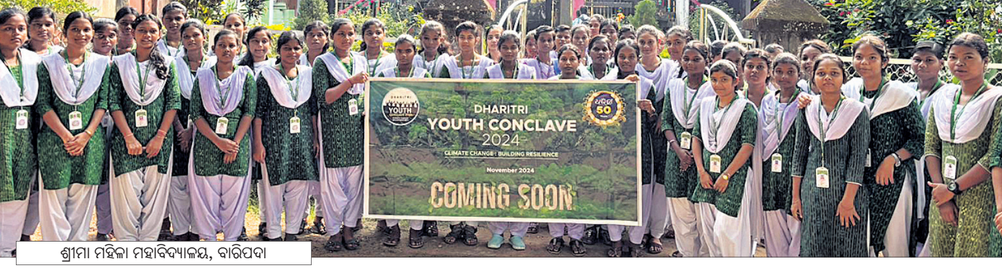
ଶ୍ରୀମା ମହିଳା ମହାବିଦ୍ୟାଳୟ, ବାରିପଦା