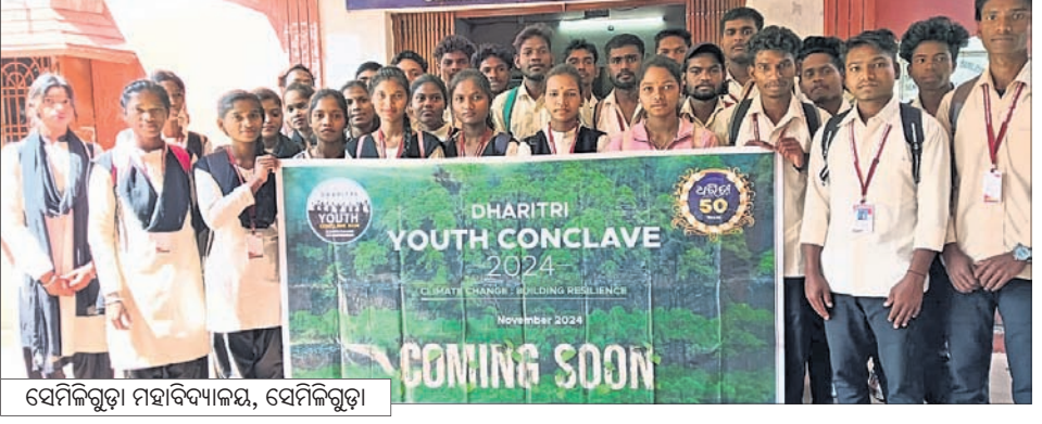
ସେମିଲଗୁଡ଼ା ମହାବିଦ୍ୟାଳୟ, ସେମିଲଗୁଡ଼ା