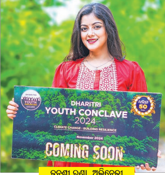
ଚନ୍ଦ୍ରଶ୍ରୀ ରଣା, ଅଭିନେତ୍ରୀ