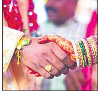
ଦସ୍ୟୁବିକ ଓ ଫଟୋଗ୍ରାଫ ଦେଇଥିଲେ। ଦିଲ୍ଲୀର ମାଟ୍ରିମୋନି ପକ୍ଷରୁ ସମ୍ବନ୍ଧ୍ୟ କନ୍ୟା ଖୋଜିବା ପାଇଁ ଟଙ୍କାଠାରୁ ଟି ଆକାରରେ ୩୦ ହଜାର ଟଙ୍କା ନିଆଯାଇଥିଲା।

କଣେ ଯୁବକଙ୍କ ପାଇଁ ଉପଯୁକ୍ତ କନ୍ୟା ଖୋଜିବାରେ ବିଫଳ ହୋଇଥିବାରୁ ବେଙ୍ଗାଲୁରୁରୁ ଏକ କଣ୍ଟ୍ରାକ୍ଟର କୋର୍ଟ ଦିଲ୍ଲୀର ନାମକ ମାଟ୍ରିମୋନିଆଲ ପୋର୍ଟାଲକୁ ୬୦ ହଜାର ଟଙ୍କା ଜରିମାନା କରିଛନ୍ତି।