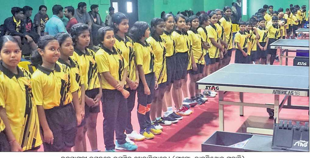
ଭଦ୍ରାବନ୍ତୀ ଉତ୍ସବରେ ଉପସ୍ଥିତ ଖେଳାଳିମାନେ।

ଭୁବନେଶ୍ୱର, ୬।୧୧ (ତପନ ସାହୁ) କଟକ ସିଡିଏସ୍‌ରେ ବିଜୁ ପଟ୍ଟନାୟକ ଇନଷ୍ଟିଚ୍ୟୁଟ୍‌ରେ ହଲ୍‌ରେ ରୁଧିରା ୩୦ତମ ଆକ୍ଷୟ ଝୁଲ ଟେବୁଲ୍ ଟେନିସ୍ ଚାମିଲନାଦୁର ଉଦ୍‌ଘାଟିତ ହୋଇଛି।