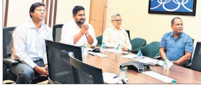
ଆଭାସୀ ମାଧ୍ୟମରେ ଭାରତୀୟ ହକି ଦଳ ସହ କ୍ରୀଡ଼ାମନ୍ତ୍ରୀ ଓ ଅନ୍ୟମାନେ କଥା ହେଉଛନ୍ତି।

୯୨ ରନ କରି ଏଲବିଟନ୍‌ସୁ ଆଉଟ ହୋଇଥିବାବେଳେ ଖାତା ଖୋଲିବା ପୂର୍ବରୁ ରାହାନେ କ୍ଲେ ବୋଲୁ ହୋଇ ଯାଇଥିଲେ।