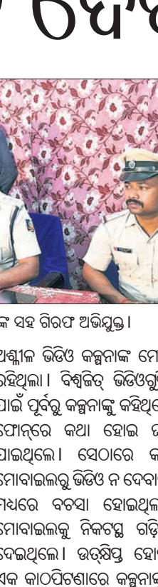
ଅଶ୍ୱୀନ ଭିତ୍ତିରେ ନ ଦେବାରୁ ହତ୍ୟା