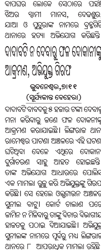
ସଂପୃକ୍ତ ଓ ଥାନା ଅଧିକାରୀଙ୍କ ସହ ଗିରଫ ଅଭିଯୁକ୍ତ।