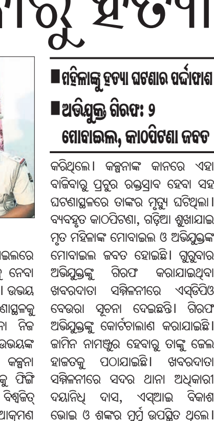
ଅଭିଯୁକ୍ତ ଗିରଫ: ୨ ମୋବାଇଲ, କାଠପିଟିଆ ଜବତ