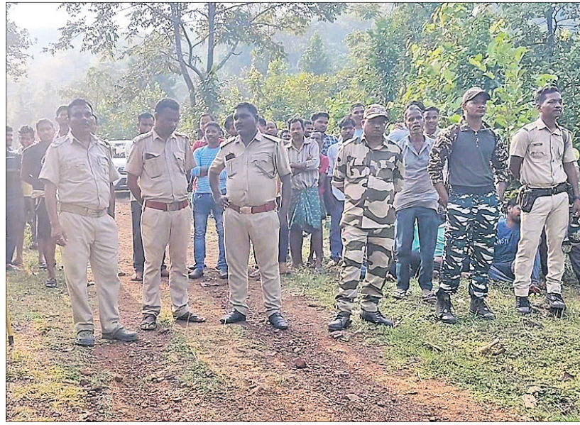
ମହାବିରୋଧ ରେଞ୍ଜ ଦେବରାଘାଟି ସେକ୍ସନ ଯାଗରାମୁଣ୍ଡା ବିନ୍ଦୁ ହାଉସ ଅସନବାହାଳି ଜଙ୍ଗଲ ନିକଟସ୍ଥ ଏକ ବିଲରୁ ଉଦ୍ଧାର ହୋଇଥିବା କଲରା ପତରିଆ ବାଘ । (୨) ସ୍ୱତନ୍ତ୍ର ଗାଡିରେ କଡ଼ା ପୁରୁଷରେ ନନ୍ଦନବାନନ ସ୍ଥାନାନ୍ତର କରାଯାଇଛି । (୩) ଲୋକମାନଙ୍କୁ ଅଟକାଇ ରଖିଛନ୍ତି ବନବିଭାଗ କର୍ମଚାରୀ ।