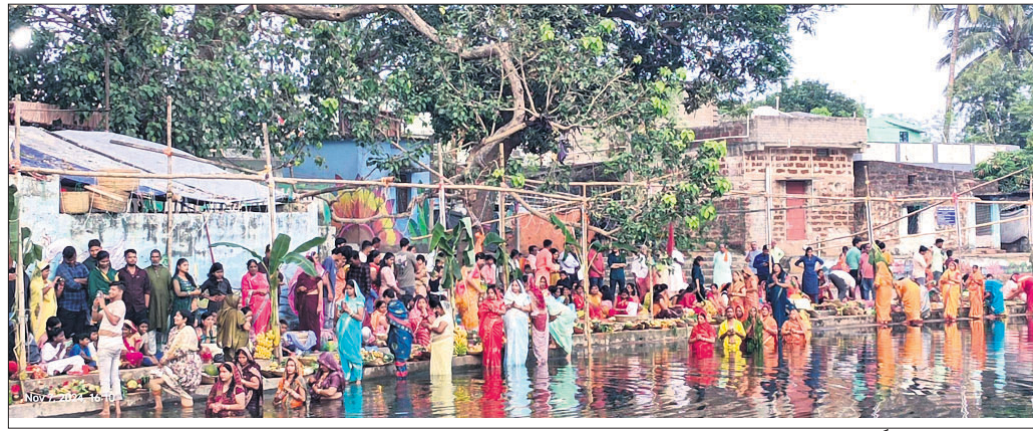
ଛତ୍ର ପୂଜା ଅବସରରେ ଗୁରୁବାର ଜଟଣୀରେ ବିହାରୀ ଏବଂ ମାରଘ୍ରାତି ସମ୍ପ୍ରଦାୟର ବ୍ରତଧାରୀ ମହିଳାମାନେ ପୂଜାର୍ଚ୍ଚନା କରୁଛନ୍ତି।