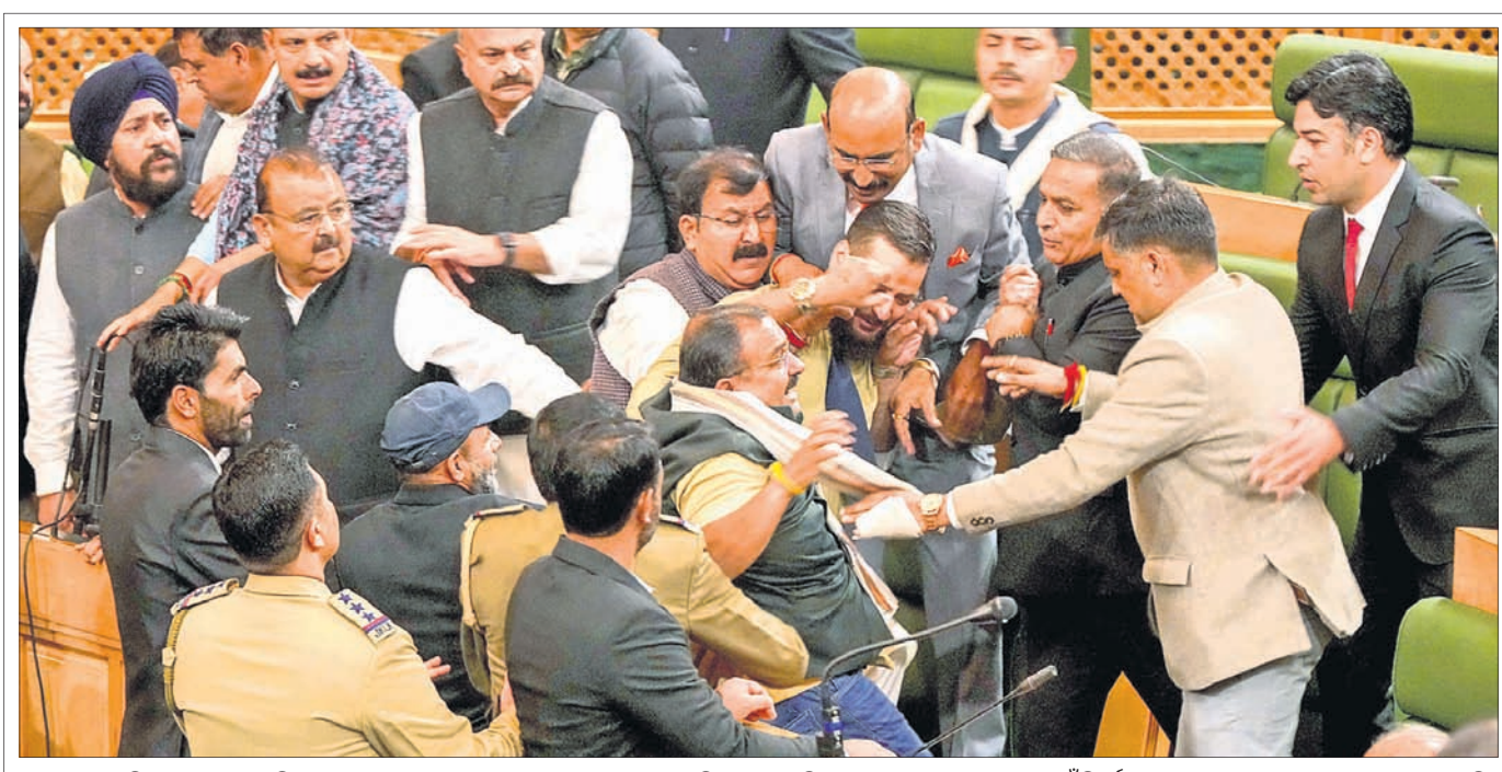
ଜମ୍ମୁ-କଶ୍ମୀର ବିଧାନସଭା ବାଚସ୍ପତି ଗୁରୁବାର ସ୍ୱତନ୍ତ୍ର ରାଜ୍ୟ ମାମଲାର ଫେରସ୍ତ ପ୍ରସଙ୍ଗରେ ବିରୋଧୀ ସଦସ୍ୟଙ୍କୁ ହଟାଇବା ପାଇଁ ନିର୍ଦ୍ଦେଶ ଦେବା ପରେ ଗୃହରେ ହତ୍ତାଶ ଓ ଧସ୍ତାଧସ୍ତି