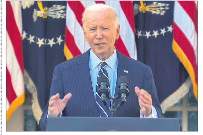
ଝାକଟ୍ ହାତସ୍ତର ବିଦାୟୀ ରାଷ୍ଟ୍ରପତି ଜୋ ବାଲତେନ୍ ।

କ୍ଷମତା ହସ୍ତାନ୍ତର କରିବେ । ଝାକଟ୍ ହାତସ୍ତର ପାଇଁ ନିର୍ବାଚନୀ ଫଳାଫଳକୁ ଆମେରିକାବାସୀ ଗ୍ରହଣ କରନ୍ତୁ ବୋଲି ବାଲତେନ୍ ଅପିଲ କରିଛନ୍ତି । ବାଲତେନ୍ ଆହୁରି କହିଛନ୍ତି, ଆମେରିକାଧିକାରୀ ନିର୍ବାଚନ ବ୍ୟବସ୍ଥାକୁ ବିଶ୍ୱାସ କରାଯାଇପାରେ । ୨୦୨୦ ସମ୍ଭୋଧିତ କରିଛନ୍ତି । ଏହି ଅବସରରେ ଗ୍ରୁଷ୍ଟ ପରାଜିତ ହେବା ପରେ ଆଣିଥିବା ଅଭିଯୋଗ ମିଥ୍ୟା । ସେ ପୁନଃ ନିର୍ବାଚିତ ହେବା ପରେ ଏହା ସ୍ପଷ୍ଟ ହୋଇଛି ।