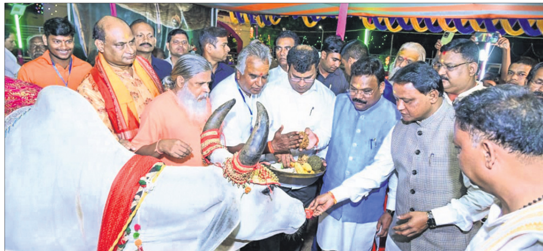
ପୁରୀ ବାଲିଆଭଣ୍ଡିତ ହରିହରାନନ୍ଦ ଗୁରୁକୁଳପୀଠରେ ଗୁରୁବାର ଆୟୋଜିତ ଗୋ-ନବରାତ୍ର ମହୋତ୍ସବରେ ମୁଖ୍ୟମନ୍ତ୍ରୀ ମୋହନ ଚରଣ ମାଝୀ ଏକ ଗାନ୍ଧୀ ଖାଦ୍ୟ ଖୁଆଇଛନ୍ତି ।