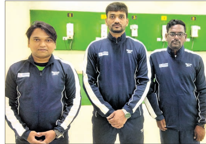
ଜୋନାଲ ଓ ଜାତୀୟ ପାରା ଶୁଟିଂ ଚାମ୍ପିୟନଶିପ୍ ପାଇଁ ଓଡ଼ିଶା ଦଳ।