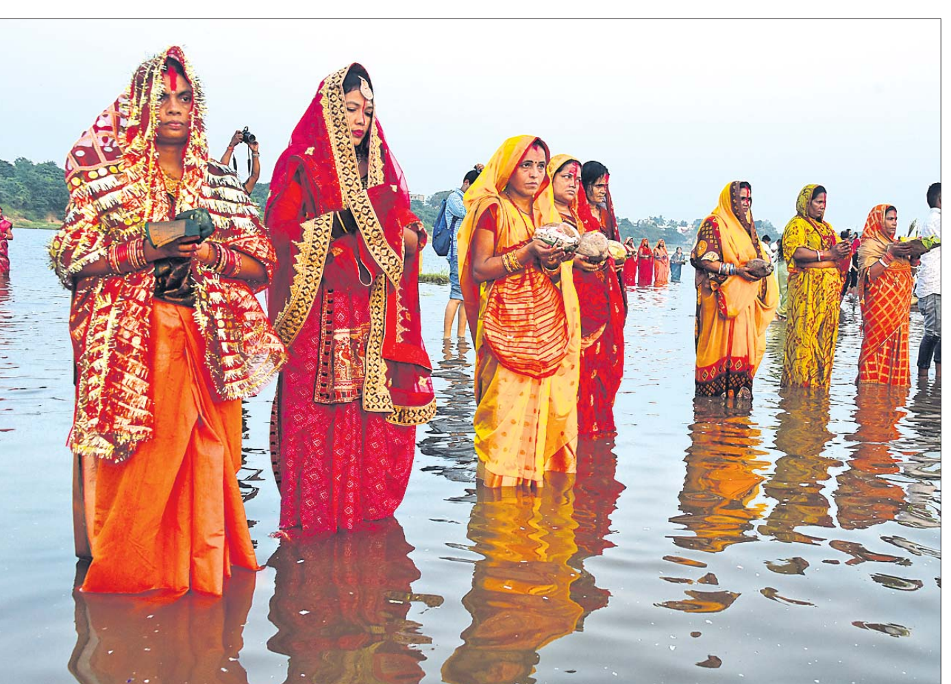
ଭୁବନେଶ୍ୱର କୁଆଖାଇ ନଦୀରେ ଗୁରୁବାର ଅପରାହ୍ନରେ ବିହାରୀ ମହିଳାମାନେ ଛନ୍ଦ ପୂଜା କରୁଛନ୍ତି।