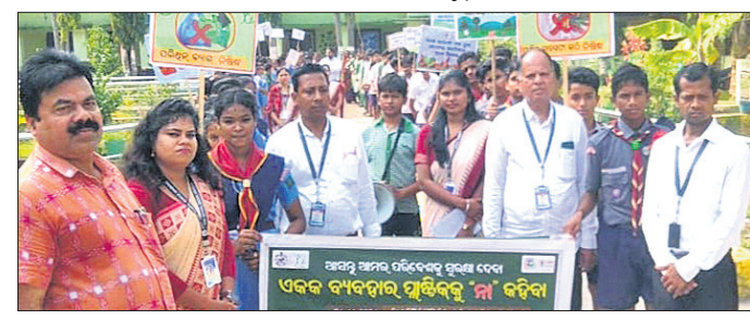
ବୋଲଗଡ଼, ୭୧୧ (ବେବସୁତ ହୋତା) ଗାନ୍ଧୀ କଳା ଓ ପରିବେଶ ବିଭାଗର ପରିବେଶ ଶିକ୍ଷାକେନ୍ଦ୍ର ଆନୁକୂଲ୍ୟରେ ଏବଂ ବାକୋଇ ସରକାରୀ ବିଦ୍ୟାଳୟ ଆବାହକତ୍ୱରେ ରୁକ୍ମପୁରୀୟ ପ୍ଲାଷ୍ଟିକ୍ ବର୍ଜନ ସଚେତନତା ଓ ପରିବେଶ ସୁରକ୍ଷା ସଚେତନତା କାର୍ଯ୍ୟକ୍ରମ ଅନୁଷ୍ଠିତ ହୋଇଯାଇଛି।

ପହଞ୍ଚିବାକୁ ହେଲେ ନିଜର ମନଯୋଗ ସହ ଅକ୍ଳାନ୍ତ ପରିଶ୍ରମର ଆବଶ୍ୟକତା ରହିଛି। ଏହି ଅବସରରେ ବିଭିନ୍ନ ବିଭାଗରେ ପ୍ରଥମ ସ୍ଥାନ ଅଧିକାର କରିଥିବା କୃତା ପ୍ରତିଯୋଗୀମାନେ ରାଜ୍ୟସ୍ତରରୁ ଭିନ୍ନ ଭିନ୍ନ ହୋଇଛନ୍ତି।