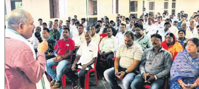
ବିଧାୟକ ପ୍ରଦୀପ ସାହୁ ଉଦ୍‌ଘୋଷଣା ଦେଉଛନ୍ତି।

ବୋଲଗଡ଼/ବେଗୁନିଆ, ୭।୧୧ (ବେଦବ୍ରତ ହୋତା/ସନ୍ଧ୍ୟାବାଣୀ ମିଶ୍ର)