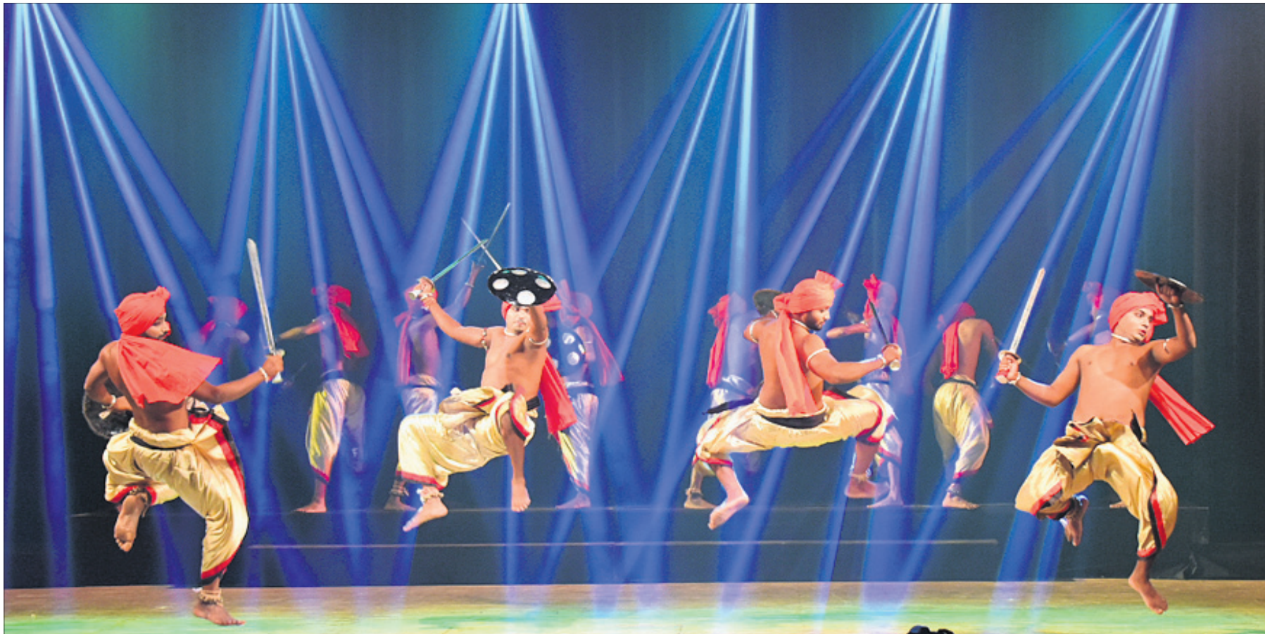
ମୟୂରଭଞ୍ଜ ଜିଲ୍ଲା ପ୍ରଶାସନର ସାଂସ୍କୃତିକ ଅନୁଷ୍ଠାନ ଶାନ୍ତିପାଳୀ ପକ୍ଷରୁ ଉତ୍ସବକୁ ନେଇ ଗୁରୁବାର ଭୁବନେଶ୍ୱର ରବାନ୍ତ ମଞ୍ଚପରେ ଉଦ୍ଘାଟିତ କାତୀୟ ମହୋତ୍ସବ 'ନାବକା'ରେ ଶିଳ୍ପୀମାନେ ଛନ୍ଦ କଳାକୌଶଳ ପ୍ରଦର୍ଶନ କରୁଛନ୍ତି ।

ସାକ୍ଷର/- ପ୍ରିକାଶକର୍ତ୍ତା ଅଧିକାରୀ ଭୂ-ଅର୍ଜନ ଅଭିଧାନ ଏବଂ ପୁନର୍ବସତି ପ୍ରାଧିକାରୀ ଅଦାଲତ, କଟକ