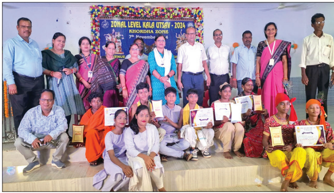
ଅତିଥିକ ଗହଣରେ କୃତା ପ୍ରତିଯୋଗୀ ଏବଂ ଅନ୍ୟମାନେ।

ବେଗୁନିଆ ବ୍ଲକ୍ ଅନ୍ତର୍ଗତ ସିକୋ ବଜାରରେ ଥିବା ପୂର୍ଣ୍ଣକାଳୀନ ମହାପାତ୍ରଙ୍କ ଲିଫ୍ଟ୍ କୋରସ୍ତକ୍ଷେତ୍ରରେ ଭୋରାଭେଟ୍ ସ୍ତରରେ ବୁଧବାର ସଂଖ୍ୟାଗଣା ଅଗ୍ନିକାଣ୍ଡ ଘଟି ଲକ୍ଷାଧିକ ଟଙ୍କାର ସାମଗ୍ରୀ ପୋଡ଼ି ନଷ୍ଟ ହୋଇଯାଇଛି।