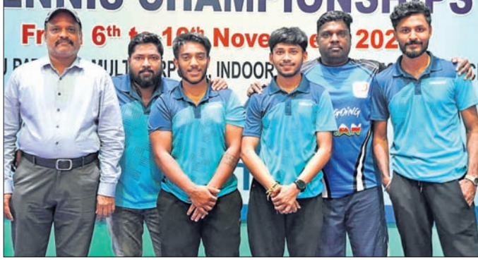
ପୁରୁଷ ଟିମ୍ ଇଭେଣ୍ଟରେ ଚାମ୍ପିୟନ ଏଜି ଓଡ଼ିଶା ଦଳ।