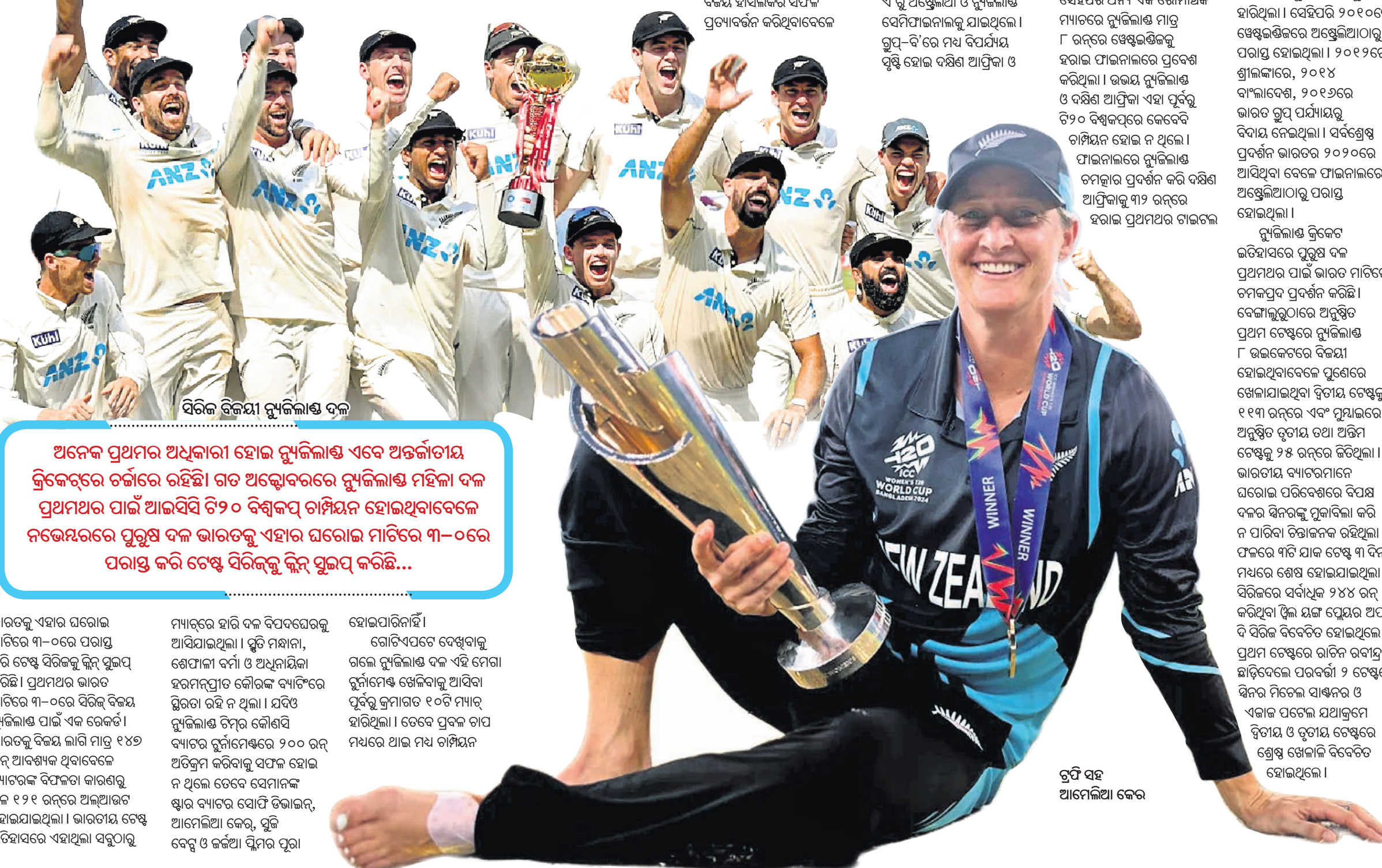
ସିରିଜ ବିଜୟୀ ନ୍ୟୁଜିଲ୍ୟାଣ୍ଡ ଦଳ

ନ୍ୟୁଜିଲ୍ୟାଣ୍ଡ କ୍ରିକେଟ ଇତିହାସରେ ପ୍ରଥମଥର ପାଇଁ ଭାରତ ମାଟିରେ ଚମତ୍କାର ପ୍ରଦର୍ଶନ କରିଛି । ଦେଖାଯାଇଥିବା ଅନୁଷ୍ଠିତ ପ୍ରଥମ ଟେଷ୍ଟରେ ନ୍ୟୁଜିଲ୍ୟାଣ୍ଡ ୮ ଉତ୍କଳେଷରେ ବିକୟ ହୋଇଥିବାବେଳେ ପୁଣିତେ ଖେଳାଯାଇଥିବା ଦ୍ୱିତୀୟ ଟେଷ୍ଟରୁ ୧୧୩ ରନରେ ଏବଂ ପୂର୍ଣ୍ଣାଙ୍ଗରେ ଅନୁଷ୍ଠିତ ତୃତୀୟ ଟି୨୦ ଅତିମ ଟେଷ୍ଟରୁ ୨୫ ରନରେ କ୍ରିଚିଥିଲା । ଭାରତୀୟ ବ୍ୟାଟରମାନେ ଘରୋଇ ପରିବେଶରେ ବିପକ୍ଷ ଦଳର ସିନରକୁ ପୁକାରିବା କରି ନ ପାରିବା ଚିନ୍ତାଜନକ ରହିଥିଲା । ଫଳରେ ୩ଟି ଯାକ ଟେଷ୍ଟ ୩ ଦିନ ମଧ୍ୟରେ ଶେଷ ହୋଇଯାଇଥିଲା । ସିରିଜରେ ସର୍ବାଧିକ ୨୪୪ ରନ କରିଥିବା ଫ୍ରିଲ ଯଙ୍ଗ୍ ପ୍ଲେୟର ଅଫ୍ ଦି ସିରିଜ ବିବେଚିତ ହୋଇଥିଲେ । ପ୍ରଥମ ଟେଷ୍ଟରେ ରାଜିନ ରବୀନ୍ଦ୍ରଙ୍କୁ ଛାଡ଼ିଦେଇ ପରବର୍ତ୍ତୀ ୨ ଟେଷ୍ଟରେ ସିନର ମିଡେଲ୍ ସାକ୍ସନର ଓ ଏକାକ ପଟେଲ୍ ଯଥାକ୍ରମେ ଦ୍ୱିତୀୟ ଓ ତୃତୀୟ ଟେଷ୍ଟରେ ଶ୍ରେଷ୍ଠ ଖେଳାଳି ବିବେଚିତ ହୋଇଥିଲେ ।