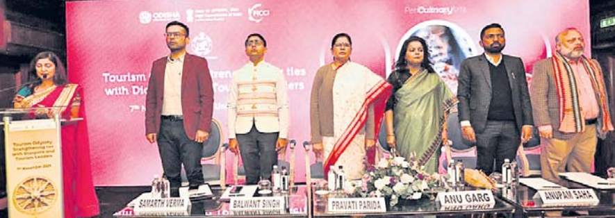
ଖାଲ୍ଲି ଗ୍ରାଭେଲ ମାର୍କେଟରେ ଯୋଗଦେଇଥିବା ଓଡ଼ିଶାର ଉପମୁଖ୍ୟମନ୍ତ୍ରୀ ପ୍ରଭାତୀ ପରିଡ଼ାଙ୍କ ସହ ଅଧିକାରୀମାନେ ।