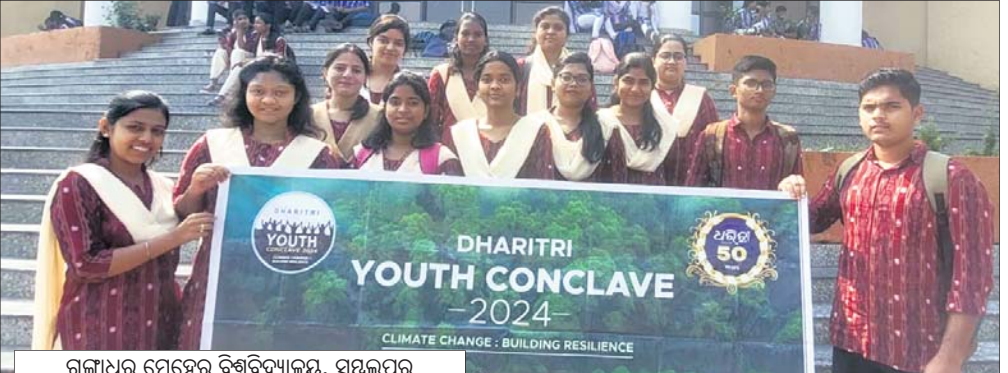
ରଞ୍ଜାଧର ମେହେର ବିଶ୍ୱବିଦ୍ୟାଳୟ, ସମ୍ବଲପୁର