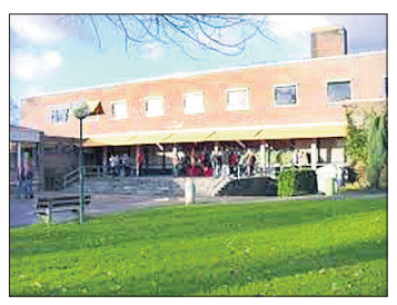
ଜଣାଇବାକୁ ଏହି ସ୍କୁଲ ଯୋଗଣା କରିଛି ନୂଆ ନିୟମ ଅନୁଯାୟୀ, ମାସେ ପର୍ଯ୍ୟନ୍ତ ଛାତ୍ରାଛାତ୍ରୀଙ୍କ ପରୀକ୍ଷାଫଳ ସେମାନଙ୍କ ଆଭିଭାବକଙ୍କୁ ଜଣାଯିବ ନାହିଁ। ଏହି ନିୟମକୁ

ଆମଷ୍ଟରତାମ ଛାତ୍ରାଛାତ୍ରୀଙ୍କ ଉପରୁ ଚାପ ହ୍ରାସ କରିବା ପାଇଁ ନେବରଲୁଣ୍ଡସ୍ ରାଜଧାନୀ ଆମଷ୍ଟରତାମର ଜର୍ଜନ-ମହେସୋରି ଲିଭେଟମ ଉତ୍ତେକର୍ ମାଧ୍ୟମିକ ସ୍କୁଲ ଅବନ ନିଷ୍ପତ୍ତି ନେଇଛି। ଛାତ୍ରାଛାତ୍ରୀଙ୍କ ପରୀକ୍ଷାଫଳ ସେମାନଙ୍କ ଆଭିଭାବକଙ୍କୁ ନ