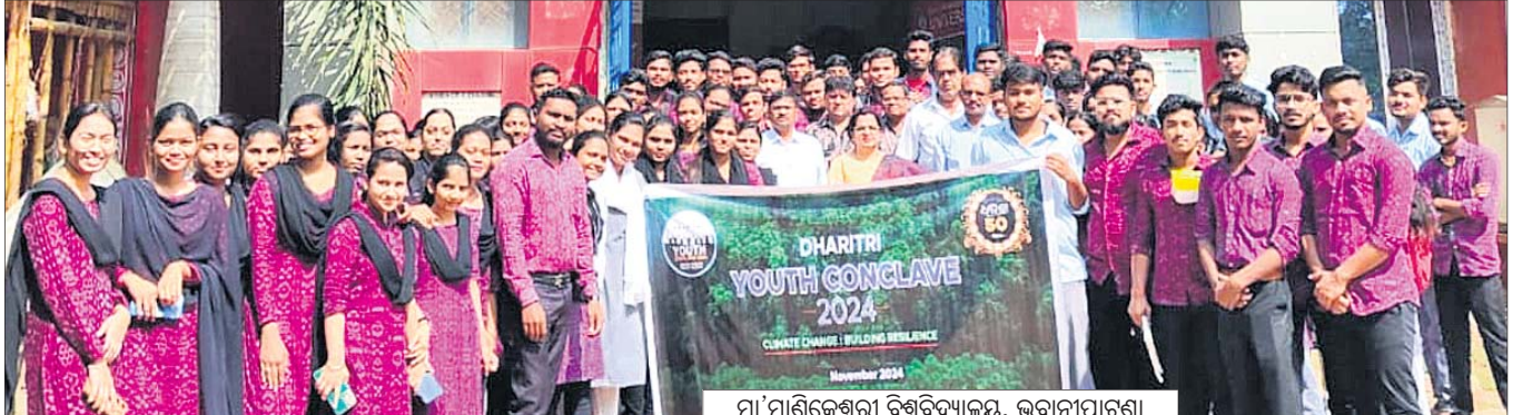
ମା'ମାଣିକେଶ୍ୱରୀ ବିଶ୍ୱବିଦ୍ୟାଳୟ, ଭବାନୀପାଟଣା