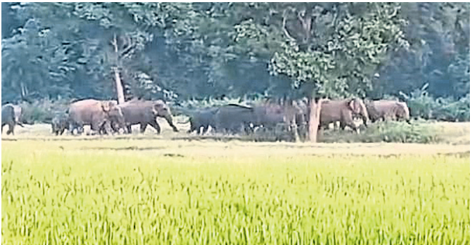
ଉପଦ୍ରବ ଚଳାଇଥିବା ହାତୀପଲ ।

ମୟୂରଭଞ୍ଜ ଜିଲ୍ଲାରେ ମାସେରୁ ଅଧିକ ସମୟ ହେବ ଖାଡ଼ଖଣ୍ଡା ହାତୀପଲ ଉପଦ୍ରବ ଭାରି ରଖିଛନ୍ତି । ଏହି ହାତୀପଲ ପାଟିଲା ଧାନ କ୍ଷେତ ଛାଡ଼ି ଯାଉ ନ ଥିବା ବେଳେ ସେମାନଙ୍କ ଉପଦ୍ରବରେ ଜିଲ୍ଲାବାସୀ ଅତିଷ୍ଠ ହୋଇ ପଡ଼ିଲେଣି । ଜିଲ୍ଲାର ତେତନଟା, ବାଲିରିପୋଷି, ବାରିପଦା, ଦେଉଳି, କପ୍ପିପଦା, ରାସଗୋବିନ୍ଦପୁର ଓ କରଞ୍ଜିଆ ରେଖା ଅଞ୍ଚଳରେ ପ୍ରତିଦିନ ହାତୀ ଉପଦ୍ରବ ଭାରି ରହିଛି । ବାରିପଦା ବନଖଣ୍ଡରେ ୧୨୧ ହାତୀ ଥିବା ବେଳେ ସେଥିମଧ୍ୟରୁ ୯୭ଟି ଖାଡ଼ଖଣ୍ଡା ଓ ୨୫ଟି ଶିମିଳିପାଳ ଅଭୟାରଣ୍ୟର ହାତୀ ରହିଛନ୍ତି । ଗତବର୍ଷ ବାରିପଦା ବନଖଣ୍ଡକୁ