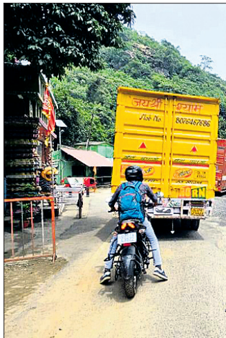
ଆହୁଲାଦୁ ମଧ୍ୟ ଘଣ୍ଟାଘଣ୍ଟା ଧରି ଜାମ୍‌ରେ ଫସି ରହିଛି ।

ଆହୁଲାଦୁ ମଧ୍ୟ ଘଣ୍ଟାଘଣ୍ଟା ଧରି ଜାମ୍‌ରେ ଫସି ରହିଛି । ଏନ୍‌ଏଚ୍‌ଏଆଇ ବିଭାଗ ଓ ରାଜନେତାମାନଙ୍କ ମିଛ ପ୍ରତିଶ୍ରୁତି ସାଙ୍ଗକୁ ପ୍ରଶାସନ ତଥା ବିଭାଗୀୟ ଉପସାଧନା ଯୋଗୁ ଏହି ଘାଟି ରାସ୍ତାରେ ଲୋକେ