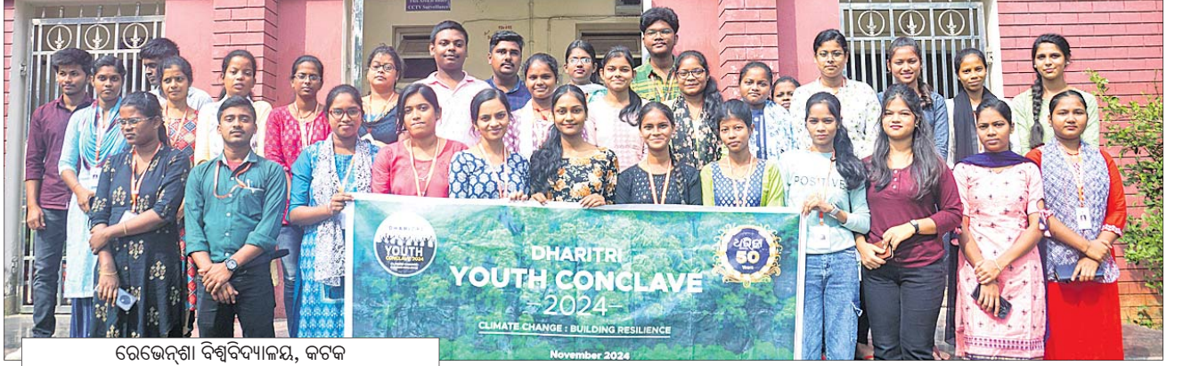
ରେଭେନ୍ସା ବିଶ୍ୱବିଦ୍ୟାଳୟ, କଟକ