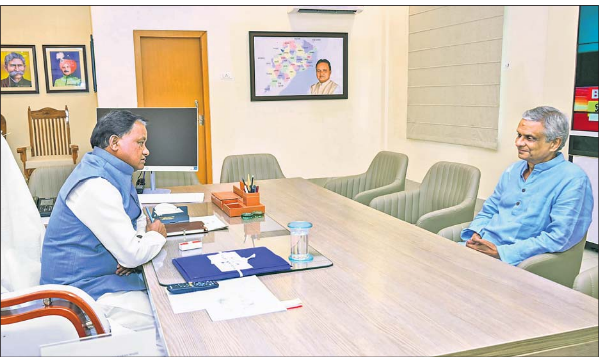
ଭୁବନେଶ୍ୱର ଲୋକସେବା ଭବନରେ ଶୁକ୍ରବାର ଅପରାହ୍ନରେ ମୁଖ୍ୟମନ୍ତ୍ରୀ ମୋହନ ଚରଣ ମାଝୀଙ୍କୁ 'ଧରିତ୍ରୀ' ଏବଂ 'ଓଡ଼ିଶା ପୋଷ୍ଟ' ସମ୍ପାଦକ ତଥା ପୂର୍ବତନ ଏମ୍ପି ତଥାଗତ ସତପଥୀ ସୌଜନ୍ୟମୂଳକ ସାକ୍ଷାତ କରୁଛନ୍ତି ।