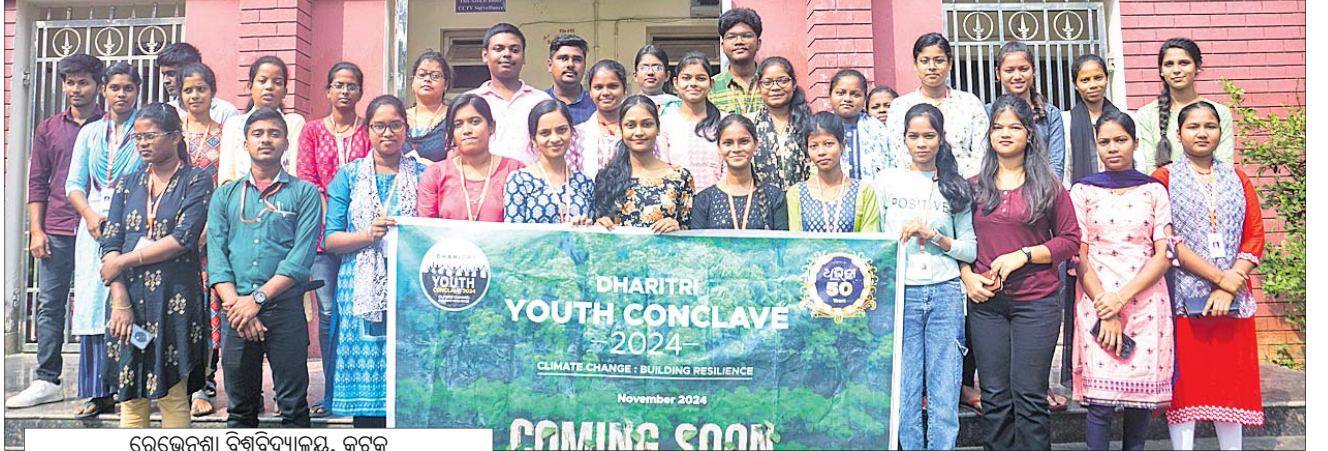
ରେଭେନ୍ସା ବିଶ୍ଵବିଦ୍ୟାଳୟ, କଟକ