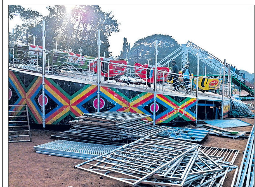
ବାଲିଯାତ୍ରା ଚଳପଡ଼ିଆରେ ବୋଲି ପ୍ରସ୍ତୁତି ଚାଲିଛି ।

କରିବେ ତେବେ ତାଙ୍କୁ ସୁଯୋଗ ମିଳିବ । ଅପରପକ୍ଷରେ ବାଲିଯାତ୍ରା ପଡ଼ିଆରେ ବିଭିନ୍ନ ପ୍ରକାର ବୋଲି ପ୍ରସ୍ତୁତିରେ ବ୍ୟବସାୟୀ ଲାଗିପଡ଼ିଛନ୍ତି ।