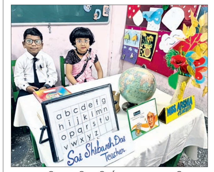
କଟକ ନିଗମ ରୋଡ୍‌ସ୍ଥିତ ସ୍ତ୍ୟୁ ଷ୍ଟିଡିଓ ସ୍କୁଲରେ ଶୁକ୍ରବାର ଆୟୋଜିତ ପ୍ରଦର୍ଶନୀ ‘ପିନାକେଲ ୨୦୨୪’ରେ ଯୋଗଦେଇଥିବା ଛାତ୍ରାଛାତ୍ରୀ ।

ଗୋପାସ୍ତମୀ ଅବସରରେ ନୟାବଜାରସ୍ଥିତ ଗୋପାଳକୃଷ୍ଣ ଗୋଶାଳା ପରିସରରେ ଏସ୍‌ସି ମେଡିକାଲ ଡାକ୍ତରଙ୍କ ପକ୍ଷରୁ ଶୁକ୍ରବାର ସ୍ୱାସ୍ଥ୍ୟପରୀକ୍ଷା ଶିବିର ଅନୁଷ୍ଠିତ ହୋଇଯାଇଛି ।