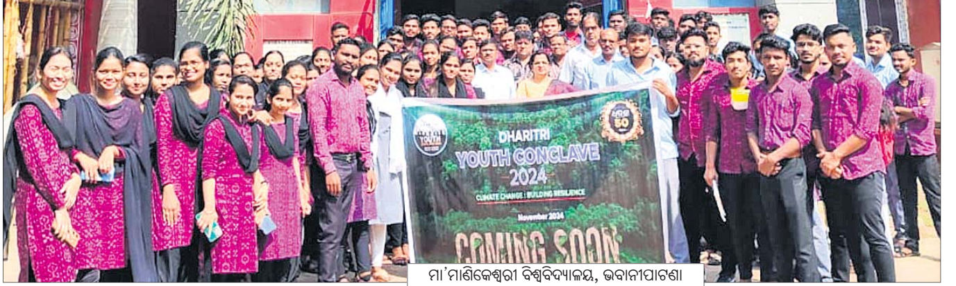
ମା'ମାଣିକେଶ୍ଵରୀ ବିଶ୍ଵବିଦ୍ୟାଳୟ, ଭବାନୀପାଟଣା