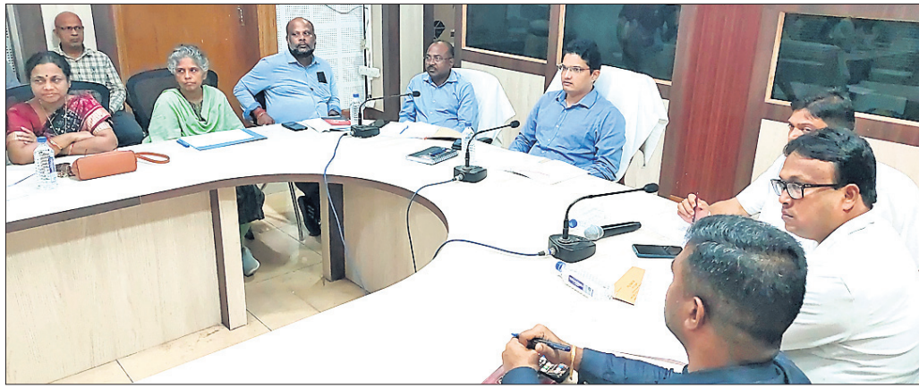
ବୈଠକରେ ଜିଲାପାଳ ବରାଦ୍ରୟ ଭାଉସାହେବ ସିଦ୍ଧେକ ସମେତ ଅନ୍ୟମାନେ ।