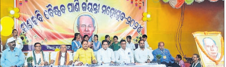
କନ୍ୟା ଉତ୍ସବରେ ଯୋଗଦେଇଥିବା ଅତିଥି ଓ ଅନ୍ୟମାନେ।