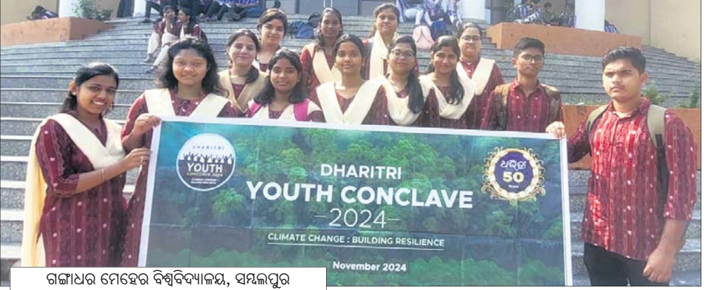
ଗଙ୍ଗାଧର ମେହେର ବିଶ୍ଵବିଦ୍ୟାଳୟ, ସମ୍ବଲପୁର