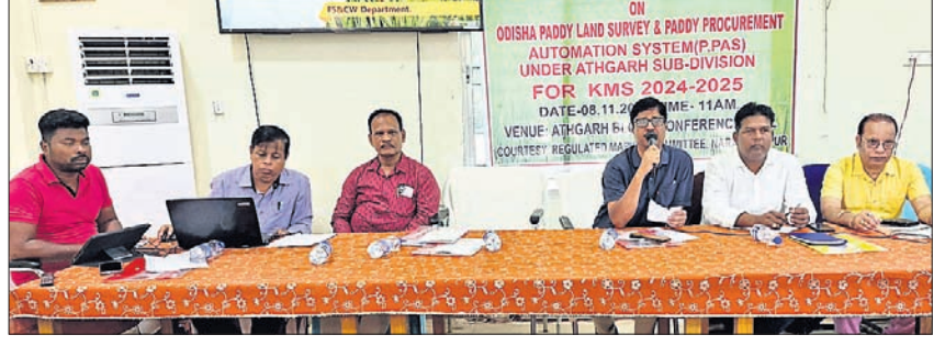
ପ୍ରଶିକ୍ଷଣ ଶିବିରରେ ଯୋଗଦେଇଥିବା ପ୍ରଶାସନିକ ଅଧିକାରୀମାନେ।

ଆଠଗଡ଼, ୮୧୧ (ସତ୍ୟ ପ୍ରସାଦ ରଥ) କମ୍ପ୍ୟୁଟରୀକରଣ ମାଧ୍ୟମରେ ଧାନକ୍ରୟ ଓ ଧାନ କ୍ଷେତ ସର୍ବେକ୍ଷଣ ନିମନ୍ତେ କର୍ମଚାରୀମାନଙ୍କ ପ୍ରଶିକ୍ଷଣ ଶିବିର ଆଠଗଡ଼ ରୁକ୍ ସମ୍ମିଳନୀ କକ୍ଷରେ ଅନୁଷ୍ଠିତ ହୋଇଯାଇଛି। ପ୍ରକାଶ ଯେ, ଆଠଗଡ଼ ଉପଖଣ୍ଡର ଆଠଗଡ଼, ଚିରିଖିଆ, ବଡ଼ମ୍ବା, ନରସିଂହପୁର ରୁକ୍ ସମେତ ଆଠଗଡ଼ ଏନ୍‌ଏସି ଅନ୍ତର୍ଗତ ୭୮ଟି ପ୍ରାଥମିକ ସେବା ସମବାୟ ସମିତି ଓ ୭ ଉପକେନ୍ଦ୍ର ସମେତ ମୋଟ ୮୫ଟି କେନ୍ଦ୍ରରେ ଧାନ କ୍ରୟ କରାଯିବ। ଏନେଇ କମ୍ପ୍ୟୁଟରୀକରଣ ମାଧ୍ୟମରେ କିପରି ଚାଷୀମାନେ ସେମାନଙ୍କ ବକଳା ଧାନକୁ ବିକ୍ରୟ କରିବେ, ସହଯୋଗକାରୀ ରାଷ୍ଟ୍ରକର୍ମୀ ଠିକ୍ ଯାଞ୍ଚ କରାଯିବ ସେନେଇ ସମିତିର ସମସ୍ତ ସମ୍ପାଦକ ଓ ଡିଭିଡିମାନଙ୍କ ନିମନ୍ତେ ପ୍ରଶିକ୍ଷଣ ଶିବିର ଅନୁଷ୍ଠିତ ହୋଇଥିଲା। ଏହାଛଡା ସାଧାରଣ ଧାନର ମାନ କୁଳଖିଲ ପିଛା ସହାୟକ ମୂଲ୍ୟ ୨୩୦୦ ଟଙ୍କା ଓ ଇନ୍‌ସୁଟ ସର୍ବିସିଟି ୮ ଶହ ଟଙ୍କା ରାଷ୍ଟ୍ରୀୟ ଆକାଉଣ୍ଟକୁ ପ୍ରଦାନ କରାଯିବ। ଚଳିତବର୍ଷ ଡିସେମ୍ବର ତୃତୀୟ ସପ୍ତାହରେ ଆଠଗଡ଼ ଉପଖଣ୍ଡରେ ମଣ୍ଡି ଆରମ୍ଭ ହେବ। ଏ ବର୍ଷ ଖରିଫ ରଫ୍ଟରେ ସରକାର ଧାନ କ୍ରୟକୁ ପ୍ରାଧାନ୍ୟ ଦେଇ ଚାଷୀମାନେ କିପରି ସେମାନଙ୍କ ବକଳା ଧାନ