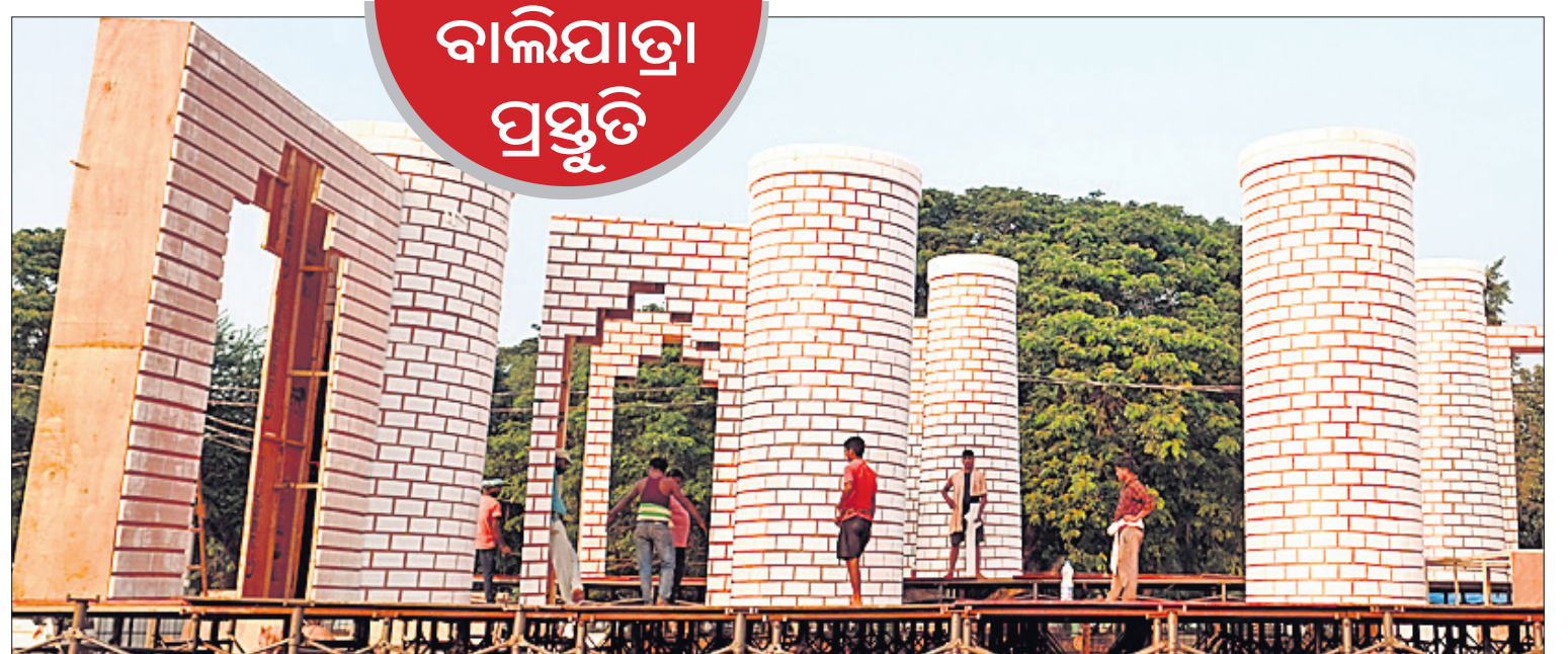
ଚଳପଡ଼ିଆରେ ସଂସ୍କୃତିକ ମଞ୍ଚ ପ୍ରସ୍ତୁତି ଚାଲିଛି ।