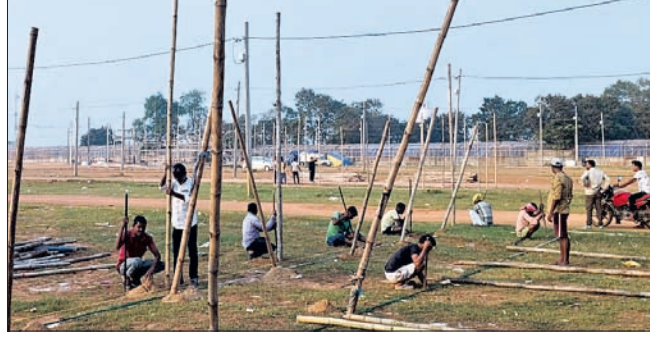
ବାଲିଯାତ୍ରା ଚଳପଡ଼ିଆରେ ଶୁକ୍ର ନିର୍ଦ୍ଦେଶ ପାଇଁ ବାଉଁଶ ପୋଡ଼ାଯାଇଛି ।

ଆସନ୍ତା ୧୫ ତାରିଖରେ କଟକ ବାଲିଯାତ୍ରା ପ୍ରତିଆର ଗୋରୁସୋରରେ ପ୍ରସ୍ତୁତି କାର୍ଯ୍ୟ ଜାରି ରହିଛି ।