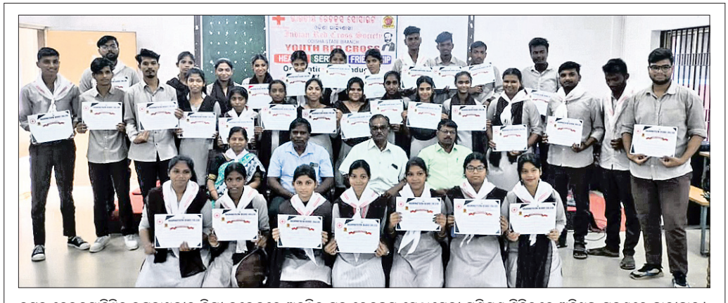
କଟକ ଦେଉଳସାହିସ୍ଥିତ ରଘୁନାଥଜୀଉ ତିନି କଲେଜରେ ଅନୁଷ୍ଠିତ ମୁବ ରେଡକ୍ରସ ସ୍ପୋଲ୍‌ସେବା ପ୍ରଶିକ୍ଷଣ ଶିବିରରେ ଅଧିକ୍ଷକ ଗହଣରେ ଛାତ୍ରାଛାତ୍ରୀ ।

କଟକ ମହାନଗର ତୈଳକ ବିଶେଷ ସମାଜ ପକ୍ଷରୁ ତୈଳକ ବୋଇତ ବନ୍ଦାଣ ଉତ୍ସବ ନିମନ୍ତେ ଏକ ପ୍ରସ୍ତୁତି ବୈଠକ ଗୁମାସ୍ତା ସଭାରେ ବୋଇତ ବନ୍ଦାଣ ଉତ୍ସବ ଅନୁଷ୍ଠିତ ହେବ ।