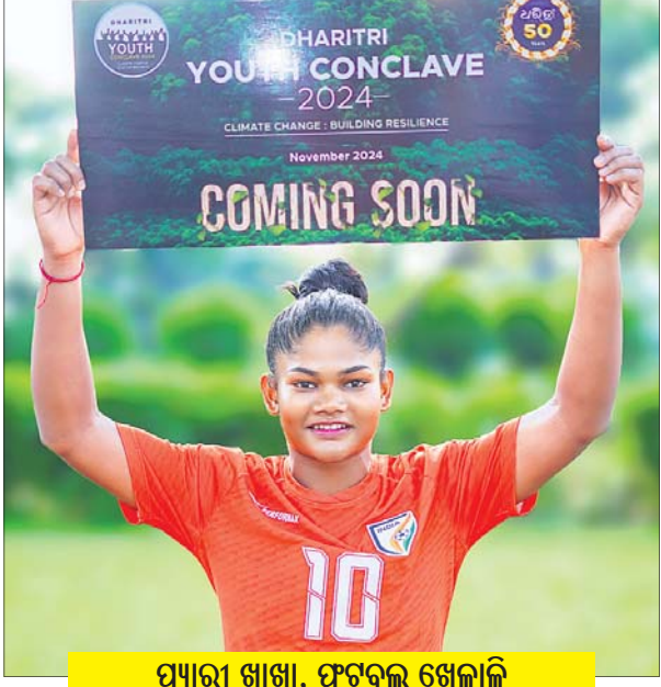
ପ୍ୟାରୀ ଶାଖା, ଫୁଟବଲ ଖେଳାଳି