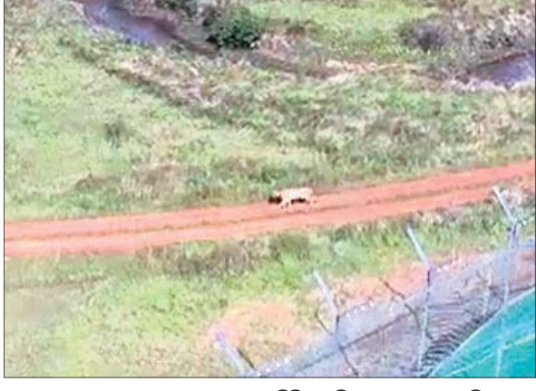
ହୋମ କ୍ୟାମ୍ପରେ ସମୂନାର ଗତିବିଧିକୁ ନିରୀକ୍ଷଣ କରାଯାଉଛି।