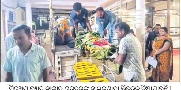
ପିକ୍‌ଅପ୍‌ ଭ୍ୟାନିଂ ଡ୍ରାଇଭ୍‌ରେ ଗୁରୁତରକୁ ଡାକ୍ତରଖାନା ଭିତରକୁ ନିଆଯାଉଛି।