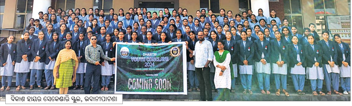
ବିକାଶ ହାୟର ସେକେଣ୍ଡାରୀ ସ୍କୁଲ, ଭବାନୀପାଟଣା