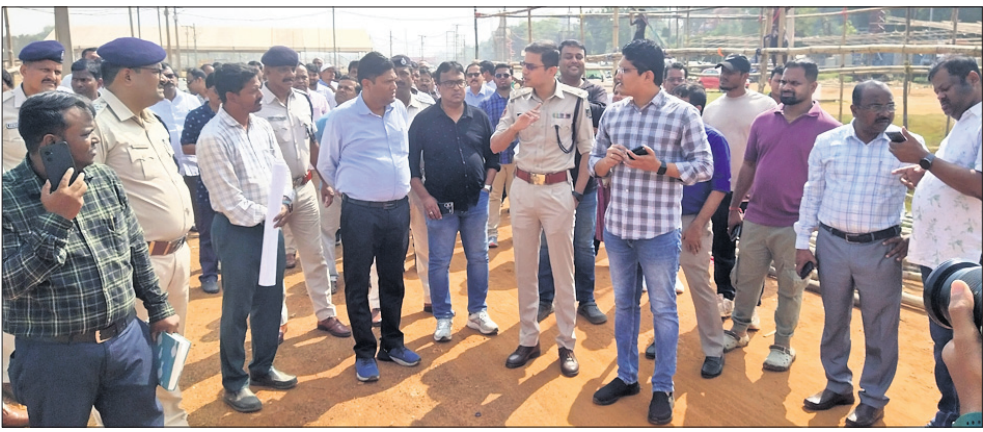
ଜିଲାପାଳ ଓ ଡିପିଏ ବାଲିଯାତ୍ରା ସମ୍ପର୍କରେ ଅଧିକାରୀଙ୍କ ସହ ଆଲୋଚନା କରୁଛନ୍ତି।

ତଳପଡ଼ିଆରେ ଜାଗା ଯୋଗାଇ ଦିଆଯିବ। ଅନ୍ୟପକ୍ଷରେ କଟକ-ଇନ୍-କଟକ ଏବଂ କୃଷିବିଭାଗର ସ୍ଥଳ ନିକଟ ଖୋଲା ସ୍ଥାନରେ କୌଣସି ସାଧାରଣ ବ୍ୟବସାୟୀ ଉଚ୍ଚ ସ୍ଥାନରେ ବସିପାରିବେ ନାହିଁ ବୋଲି ଜିଲାପାଳ ସିଦ୍ଧେ ସୂଚନା ଦେଇଛନ୍ତି।