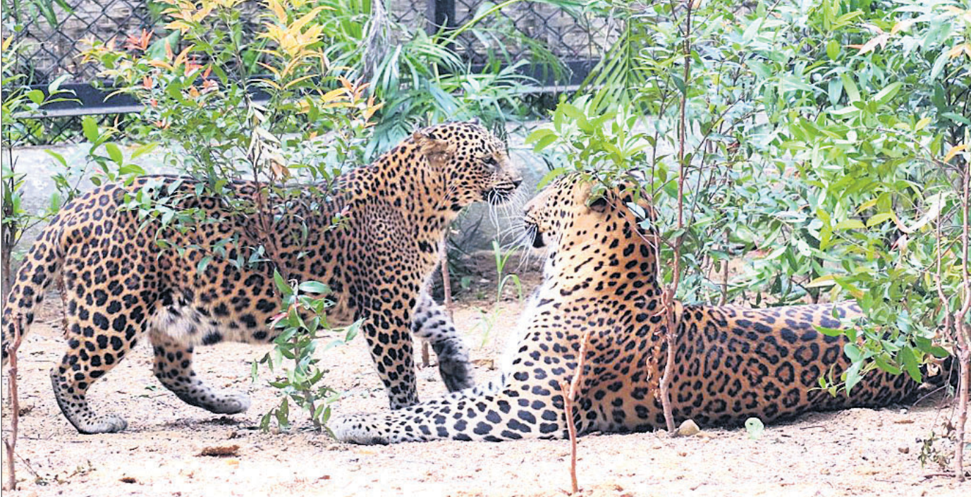
୨୦୨୩ ନଭେମ୍ବର ୪ରେ ନୁଆପଡ଼ା ଜଙ୍ଗଲରୁ ଅଭିଭାବିତା କଲରାପତରିଆ ବାଘ 'ରାଜା'କୁ ଧରାଯାଇଥିଲା। ସମ୍ବଲପୁର ପ୍ରାଣୀ ଉଦ୍ୟାନରେ ଶନିବାର ଏହି ମଣିଷଖୁଆ ବାଘକୁ ଛଡ଼ାଯାଇଥିବାବେଳେ ଗ୍ରାସ ଏନ୍‌ଡେମିକରେ ଏକ ମାଲି କଲରାପତରିଆ ବାଘ ସହ ଏକାଠି ହୋଇଛି।

ପାରଳାଖେମୁଣ୍ଡି ମୁଖ୍ୟ ଚିକିତ୍ସାଳୟକୁ ନେଇଥିଲେ। ସେଠାରେ ପ୍ରାଥମିକ ଚିକିତ୍ସା କରାଯାଇଥିଲା। ଆଖିରେ ଏସିଡ୍ ପଡ଼ିଥିବାରୁ ତାଙ୍କୁ ଗୁରୁତର ଅବସ୍ଥାରେ ବିଶାଖାପାଟଣା ସ୍ଥାନାନ୍ତର କରାଯାଇଛି। ଖବର ଲେଖା ହେବାଯାଏ ଏସିଡ୍ ପକାଇବା ପଛର କାରଣ ସ୍ପଷ୍ଟ ହୋଇନି। କିଏ ଏଭଳି କରୁଛି ସେନେଇ କୌଣସି ସୂଚନା ମିଳିପାରି ନାହିଁ। ଏସିଡ୍ ଆକ୍ରମଣ ଘଟଣାକୁ ପାରଳାଖେମୁଣ୍ଡି ଓକିଲ ସଂଘ ନିନ୍ଦା କରିବା ସହ ଅଭିଯୁକ୍ତଙ୍କୁ ଗୁରୁତର ଭାବେ ଦୋଷୀଙ୍କ ବିରୋଧରେ ଦୃଢ଼ କାର୍ଯ୍ୟାନୁଷ୍ଠାନ ଗ୍ରହଣ କରିବାକୁ ସଂଘ ପକ୍ଷରୁ ଦାବି କରାଯାଇଛି। ଅଭିଯୁକ୍ତ ଗିରଫ ହେବା ପୁସ୍ତକ-୨