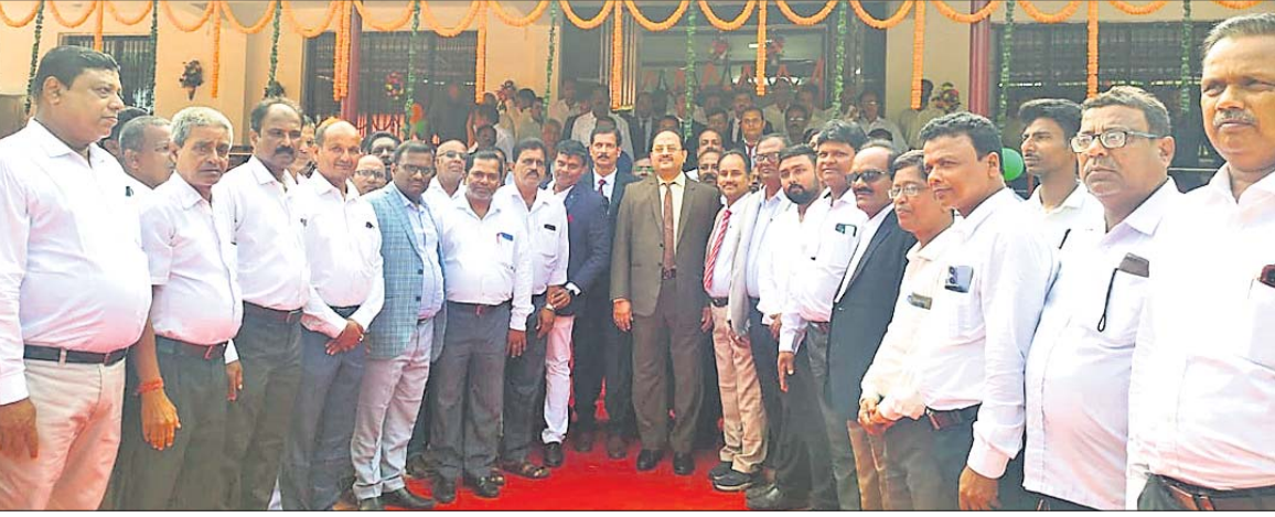
ନିଶ୍ଚିତକୋଇଲି ବ୍ଲକରେ ଜେଏମ୍ଏସ୍‌ସି ଉଦ୍ଘାଟନା କାର୍ଯ୍ୟକ୍ରମରେ ବିଚାରପତି, ଆଇନଜୀବୀ ଓ ଅନ୍ୟମାନେ।

ମାହାଙ୍ଗା/ନିଶ୍ଚିତକୋଇଲି, ୯୧୧ (ଯଯାତି ସିଂହ/ଅଶୋକ କୁମାର ମହାପାତ୍ର)