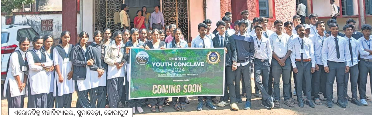
ଏରୋନଟିକ୍ସ ମହାବିଦ୍ୟାଳୟ, ସୁନାବେଡ଼ା, କୋରାପୁଟ