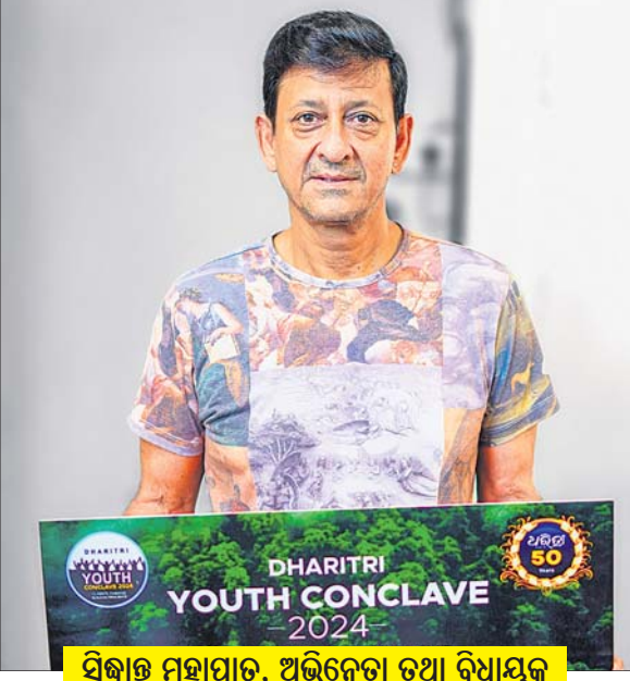
ସିଦ୍ଧାନ୍ତ ମହାପାତ୍ର, ଅଭିନେତା ତଥା ବିଧାୟକ