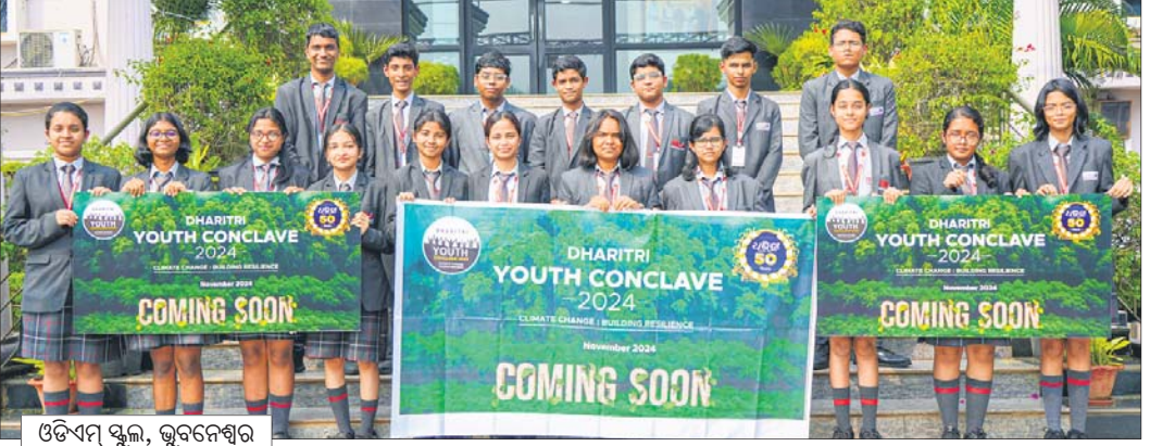
ଓଡିଏସ୍ ସ୍କୁଲ, ଭୁବନେଶ୍ଵର