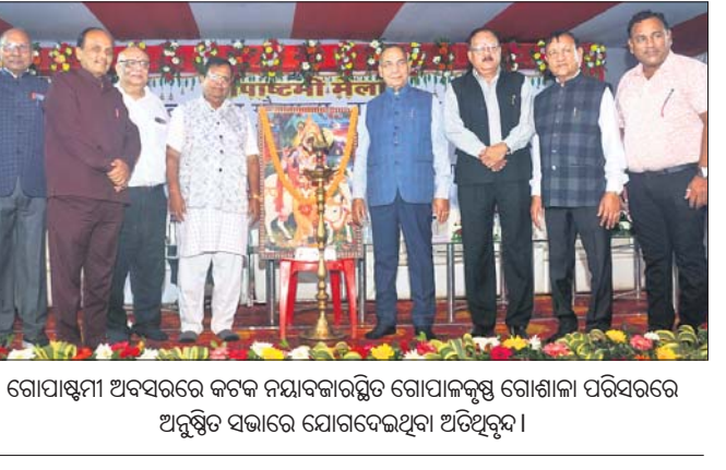
ଗୋପାସ୍ତମ୍ଭୀ ଅବସରରେ କଟକ ନୟାବକାରମ୍ଭିତ ଗୋପାକୃଷ୍ଣ ଗୋଶାଳା ପରିସରରେ ଅନୁଷ୍ଠିତ ସଭାରେ ଯୋଗଦେଇଥିବା ଅତିଥିବୃନ୍ଦ।