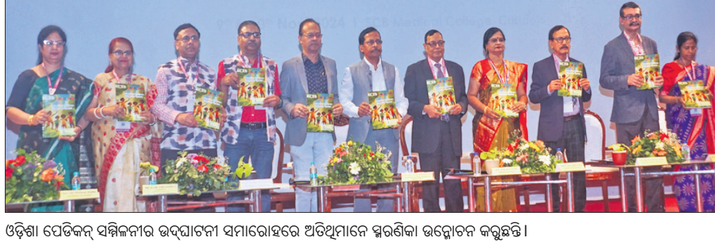
ଓଡ଼ିଶା ପେଡିକ୍ ସମ୍ମିଳନୀର ଉଦ୍‌ଘାଟନା ସମାରୋହରେ ଅତିଥିମାନେ ସ୍ୱରଶିଳା ଉନ୍ନୋତନ କରୁଛନ୍ତି।