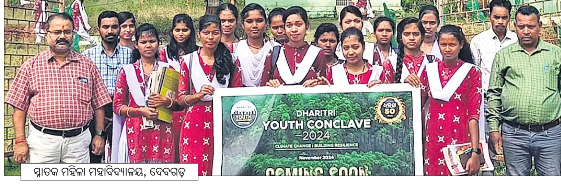
ସ୍ନାତକ ମହାବିଦ୍ୟାଳୟ, ଦେବଗଡ଼