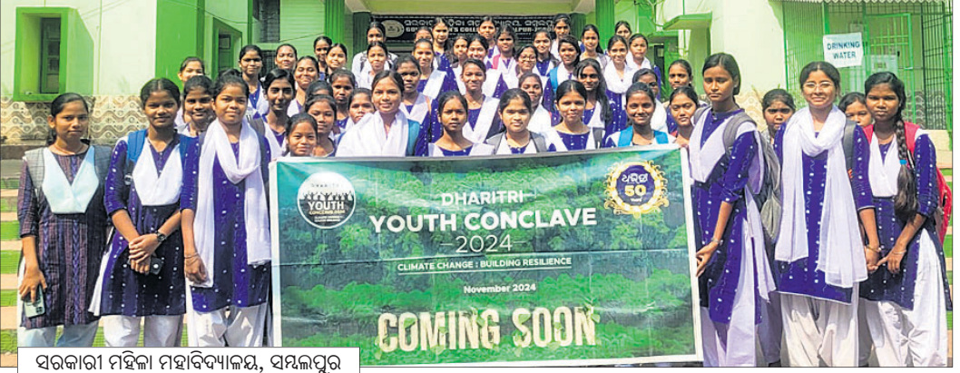
ସରକାରୀ ମହାବିଦ୍ୟାଳୟ, ସମ୍ବଲପୁର