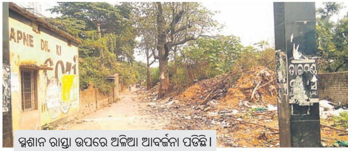
ଶିବାଦାହ ରାସ୍ତା ଉପରେ ଅଳିଆ ଆବର୍ଜନା ପଡ଼ିଛି।

ଝାରସୁଗୁଡ଼ା ସରକାରୀ ମୁଖ୍ୟରାସ୍ତାରୁ ଝାରସୁଗୁଡ଼ା ମ୍ୟୁନିସିପାଲିଟିର ଓଡ଼ି ନଂ. ୨୨ରେ ଅବସ୍ଥିତ ଥିବା ଶିବାଦାହ କେନ୍ଦ୍ରକୁ ଯାଇଥିବା ରାସ୍ତା ଅତ୍ୟନ୍ତ ଶୋଚନୀୟ ଏବଂ ଅବର୍ଜନାପୂର୍ଣ୍ଣ ହୋଇପଡ଼ିଛି। ରାସ୍ତା ପାର୍ଶ୍ୱରୁ ଯୋଗାଣକୃତ ତଥା ସହରର ବିଭିନ୍ନ ସ୍ଥାନରୁ ଆବର୍ଜନା ପାଣି ଏହି ରାସ୍ତାରେ ଫୋପାଡ଼ା ଯାଉଛି। ଫଳରେ ଏହି ରାସ୍ତା ସର୍ବଦା ଅଳିଆ ଆବର୍ଜନା ହେଉଛି। ଏପରିକି ସହର ଲୋକମାନେ ଶିବାଦାହ ପାଇଁ ମୃତଦେହ ନେଇ ଯାଉଥିବା ବେଳେ ପୂତବ୍ୟକ୍ତିମାନଙ୍କ ସମ୍ପର୍କରେ ବହୁତ ସମସ୍ୟା ସୃଷ୍ଟି ହେଉଛି। ପ୍ରକାଶ ଆଉଁଶ ଓଡ଼ି