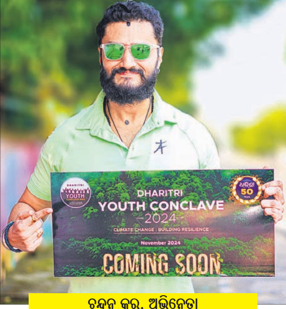
ଚନ୍ଦନ କର, ଅଭିନେତା