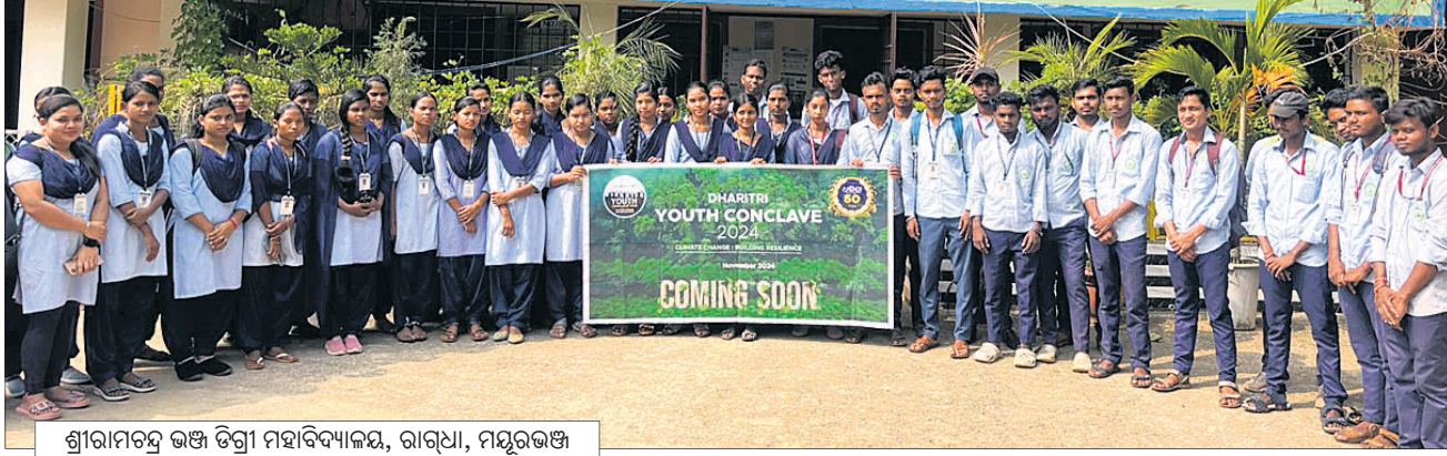
ଶ୍ରୀରାମଚନ୍ଦ୍ର ଭଞ୍ଜ ଡିଗ୍ରୀ ମହାବିଦ୍ୟାଳୟ, ରାଉଧା, ମୟୂରଭଞ୍ଜ