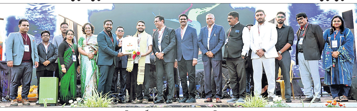
ବିକାଶ ବାର୍ଷିକ ଉତ୍ସବରେ ଯୋଗଦେଇଥିବା ଅତିଥିଗଣ।