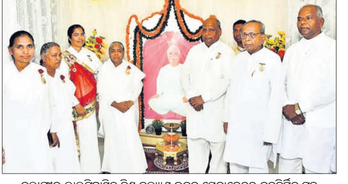
ବଲାଙ୍ଗୀର ଲାଲଚିତ୍ରାସ୍ଥିତ ବିଶ୍ୱ କଲ୍ୟାଣ ଭବନ ସେବାକେନ୍ଦ୍ରର ନବନିର୍ମିତ ଗୃହ ଉଦ୍ଘାଟନ ଓ ସୁବର୍ଣ୍ଣ ଜୟନ୍ତୀ ସମାରୋହରେ ଉପସ୍ଥିତ ଅତିଥି।

ବଲାଙ୍ଗୀର, ୧୦।୧୧ (ବାରେନ୍ଦ୍ର କୁମାର ଝାଙ୍କର)