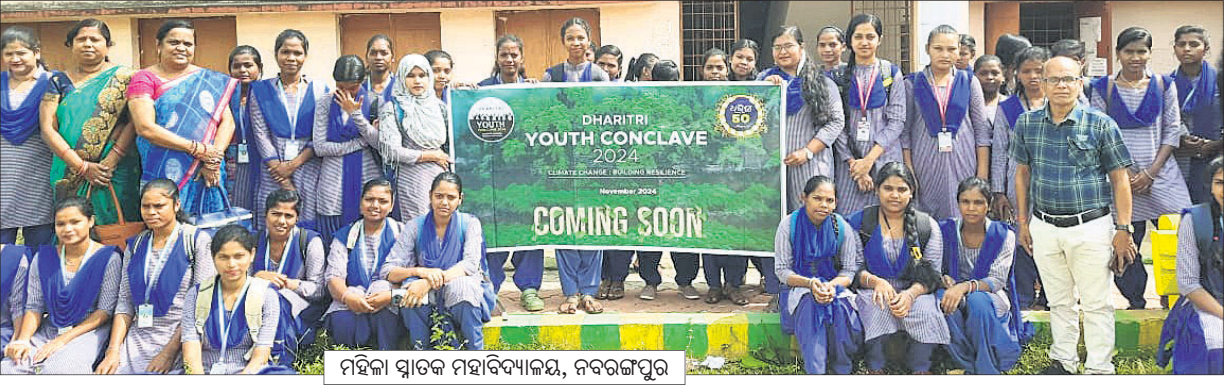
ମହିଳା ସ୍ଵାତନ୍ତ୍ର ମହାବିଦ୍ୟାଳୟ, ନବରଙ୍ଗପୁର