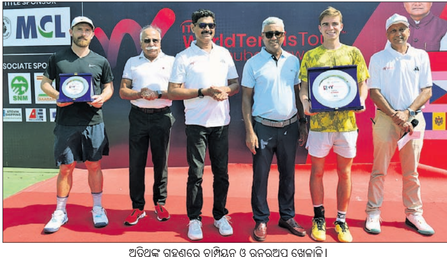
ଅତିଥିକ୍ ଗହଣରେ ଚାମ୍ପିୟନ ଓ ରନରଥ ଖେଳାଳି।