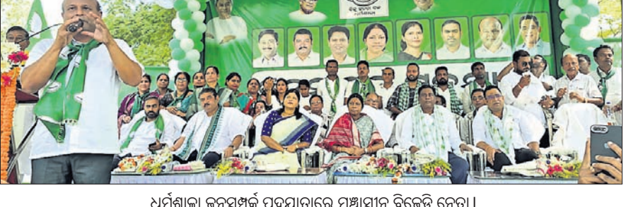
ଧର୍ମଶାଳା ଜନସମ୍ପର୍କ ପଦସାଗ୍ରାରେ ମଞ୍ଚାସୀନ ବିଜେଡି ନେତା।