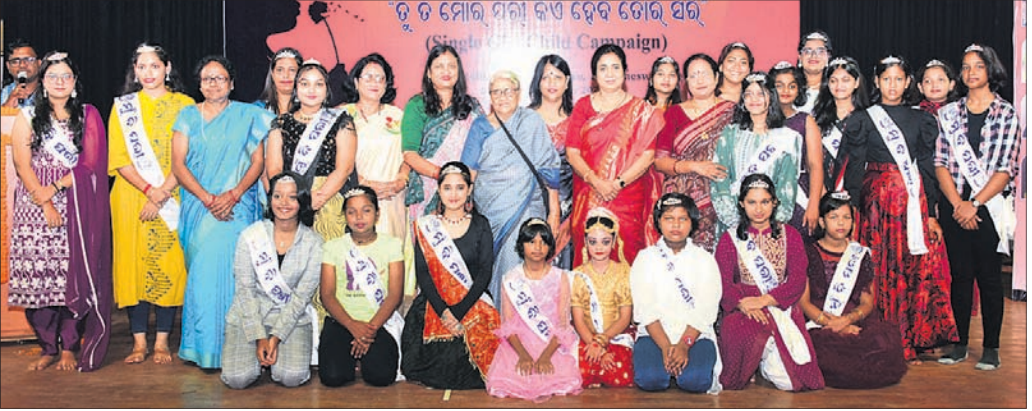
ସମ୍ବର୍ଦ୍ଧନା ପରେ ଅତିଥିକ ଗହଣରେ ନିଜ ଶିଶୁକନ୍ୟାଙ୍କ ସହ ମା'ମାନେ।