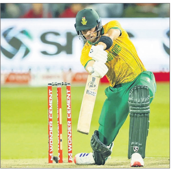
ଶର୍ବ ଖେଳୁଛନ୍ତି ଟ୍ରିଷ୍ଟାନ ଷ୍ଟୁବ୍

ଗୋଲକେନ୍ଦ୍ର, ୧୦୧୧ (ପି.ଟି.) ଭାରତ ବିପକ୍ଷ ଦ୍ୱିତୀୟ ଟି୨୦ ଅନ୍ତର୍ଜାତୀୟ ମ୍ୟାଚକୁ ୩ ଉଇକେଟରେ ଜିତି ନେଇଛି ଦକ୍ଷିଣ ଆଫ୍ରିକା। ଚନ୍ଦ୍ର ହାରି ପ୍ରଥମେ ବ୍ୟାଟିଂ କରିଥିବା ଭାରତ ବିପକ୍ଷରେ ସମ୍ପୂର୍ଣ୍ଣାନ୍ତ ହୋଇ