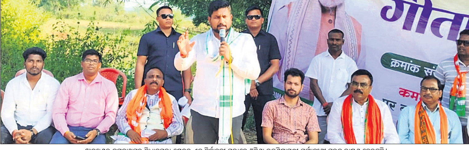
ଝାଡ଼ଖଣ୍ଡର ଜଗନ୍ନାଥପୁର ବିଧାନସଭା କ୍ଷେତ୍ରର ଏକ ନିର୍ବାଚନୀ ସଭାରେ ଓଡ଼ିଶା ଉଚ୍ଚଶିକ୍ଷାମନ୍ତ୍ରୀ ସୂର୍ଯ୍ୟବଂଶୀ ସୁରଜ ରାଣାଙ୍କୁ ଦେଖିଛନ୍ତି।