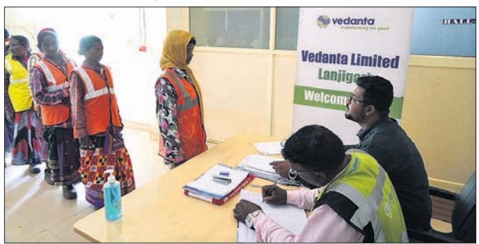
ଶିବିରରେ କର୍ମଚାରୀଙ୍କୁ ସୁନିଶ୍ଚିତ କରାଯାଇଛି।

କଳାହାଣ୍ଡି ଜିଲ୍ଲା ଲାଞ୍ଜିଗଡ଼ ବେଦାନ୍ତ ଲିମିଟେଡ୍ କର୍ମଚାରୀଙ୍କୁ କେନ୍ଦ୍ର ବାଲକୋ ସେକ୍ଟରରେ ସହଯୋଗରେ ଏକ ମାଗଣା କର୍ମଚାରୀ ସୁନିଶ୍ଚିତ ଶିବିର ଆୟୋଜନ କରିଥିଲା।