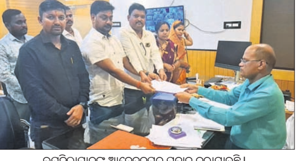
ଉପଜିଲ୍ଲାପାଳଙ୍କୁ ଆବେଦନପତ୍ର ପ୍ରଦାନ କରାଯାଉଛି ।