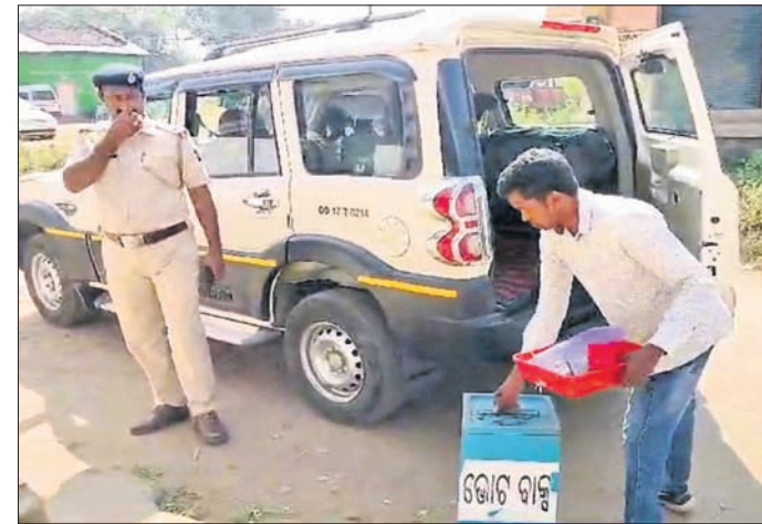
କଡ଼ା ସୁରକ୍ଷା ମଧ୍ୟରେ ଭୋଟବାକୁ ନିଆଯାଉଛି।