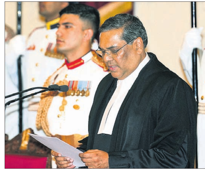
ରାଷ୍ଟ୍ରପତି ଭବନରେ ନୂଆ ସିଜେଆଇ ଜଷ୍ଟିସ୍ ସମ୍ପାଦ ଖାନା ଶପଥ ନେଉଛନ୍ତି।