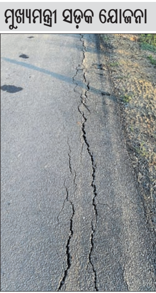
ରାସ୍ତାରେ ଫାଟ ସୃଷ୍ଟି ହୋଇଛି।

କଳାହାଣ୍ଡି ଜିଲ୍ଲା ଧର୍ମଗଡ଼ ଗ୍ରାମ୍ୟ ଉନ୍ନୟନ ବିଭାଗ ତତ୍ତ୍ୱାବଧାନରେ ନିର୍ମାଣ ହୋଇଥିବା ରାସ୍ତା ୪ମାସ ନ ପୂରୁଣୁ ଫାଟି ଥାଏ କଲାଣି।