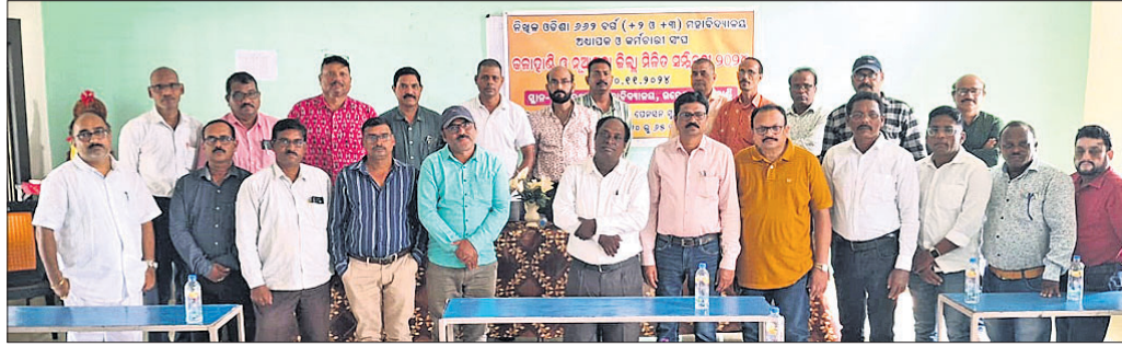
ସମ୍ମିଳନୀରେ ଯୋଗଦେଇଥିବା ସଂଘର କର୍ମଚାରୀ।

କଳାହାଣ୍ଡି ଜିଲ୍ଲା ଉତ୍ତମେଶ୍ୱରୀ ମୁକ୍ତ ୨ ମହାବିଦ୍ୟାଳୟରେ ରବିବାର ନିଖୁଳ ଓଡ଼ିଶା ୨୨୨ ବର୍ଷ (ମୁକ୍ତ ୨ ଓ ମୁକ୍ତ ୩) ମହାବିଦ୍ୟାଳୟ ଅଧ୍ୟାପକ ଓ କର୍ମଚାରୀ ସଂଘର ଏକ ସମ୍ମିଳନୀ ଅନୁଷ୍ଠିତ ହୋଇଥିଲା।