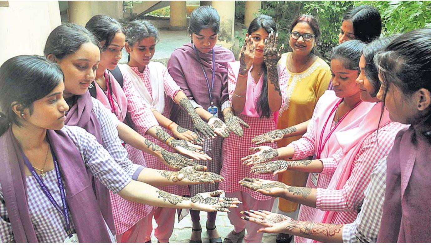
ଜାତୀୟ ସଂସ୍କୃତି ମହୋତ୍ସବ ୨୦୨୪ ଅବସରରେ ସୋମବାର ନେହେରୁ ଯୁବ ପ୍ରତିଷ୍ଠାନ ପକ୍ଷରୁ ଭୁବନେଶ୍ୱରସ୍ଥିତ କମଳା ନେହେରୁ ମହିଳା ମହାବିଦ୍ୟାଳୟ ଛାତ୍ରୀଙ୍କ ମଧ୍ୟରେ ଆୟୋଜିତ ମେହେନ୍ଦି ପ୍ରତିଯୋଗିତା।