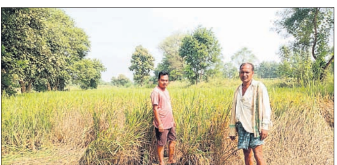
ବିପିଏସ୍ ରୋଗ ଯୋଜ ଲାଗିଥିବା ଧାନ ଫସଲ।

କଳାହାଣ୍ଡି ଜିଲ୍ଲା କର୍ମାମୁଖୀ ବ୍ଲକ୍ରେ ୧୦ ପ୍ରତିଶତ ଲୋକ ଚାଷ ଉପରେ ନିର୍ଭରଶୀଳ।