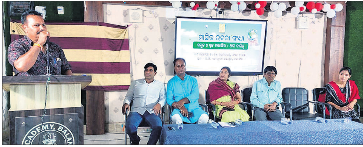
ରଚନା ମାସିକ ସମ୍ମାନରେ ଅନୁଷ୍ଠିତ ଆଲୋଚନାଚକ୍ରରେ ମଞ୍ଚାସୀନ ଅତିଥି ଓ ଆଲୋଚକ ।