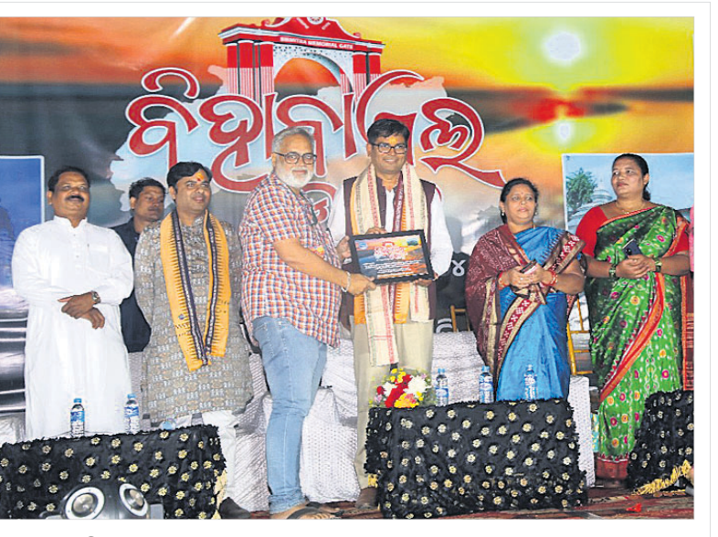
ଭୁବନେଶ୍ୱର ଇନ୍‌ନପା ପଠାରେ ଆୟୋଜିତ ବିହାରୀଧଳ ଉତ୍ସବରେ ଅତିଥିଙ୍କୁ ପୁରସ୍କୃତ କରାଯାଇଛି।