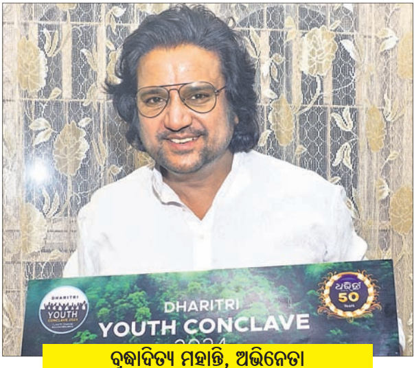
ରୁଚାଦିତ୍ୟ ମହାନ୍ତି, ଅଭିନେତା