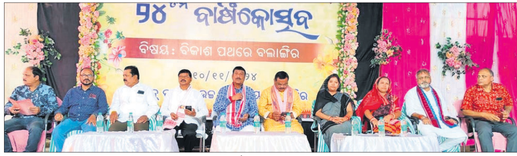
କୋଶଳ ପ୍ରବାହ ବାର୍ଷିକୋତ୍ସବରେ ମଞ୍ଚାସୀନ ଅତିଥି ।