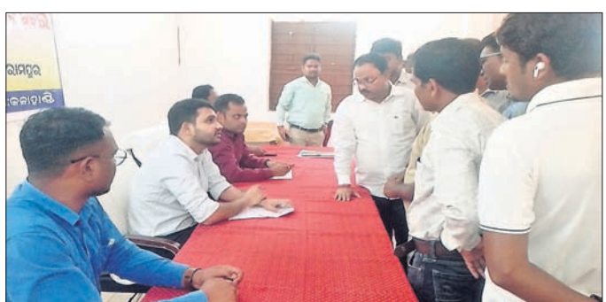
ଓ କଲମପୁର ବ୍ଲକ୍ରେ ସେତୁ କୁହାଯାଉଥିବା ସିନାରିଓଗ୍ରାଫି ରାସ୍ତାର ଦୟନୀୟ ସ୍ଥିତି

କଳାହାଣ୍ଡି ଜିଲ୍ଲା ଥୁଆମୁଳ ରାମପୁର ବ୍ଲକ୍ରେ ଯୋଗଦାତା ଅନୁଷ୍ଠିତ ଅଭିଯୋଗ ଶୁଣାଣି ମାତ୍ର ୪୩ ଅଭିଯୋଗରେ ସୀମିତ ରହିଛି।