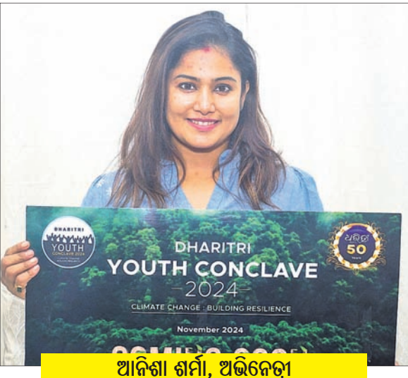
ଆଦିଶା ଶର୍ମା, ଅଭିନେତ୍ରୀ