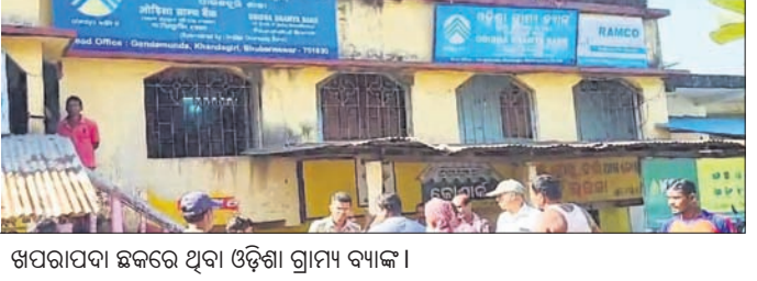
ଖପରାପଦା ଛକରେ ଥିବା ଓଡ଼ିଶା ଗ୍ରାମ୍ୟ ବ୍ୟାଙ୍କ।