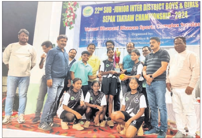
ଅତିଥିଙ୍କ ସହ ଖେଳାଳି।