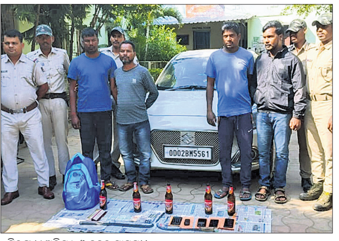
ଗିରଫ ୪ ଅଭିଯୁକ୍ତ ଓ ଜବତ ସାମଗ୍ରୀ

କେନ୍ଦୁଝର ଗାଉନ ଥାନା ଅନ୍ତର୍ଗତ ପବିତ୍ରା ଗ୍ରାମ ନିକଟ ଜଙ୍ଗଲରେ ଚୋରି ଘଟିଥିବା ପୋଲିସ ଚଢ଼ାଉ କରି ଏକ ଡକାୟତି ଯୋଜନାକୁ ପକ୍ଷ କରିଛି।