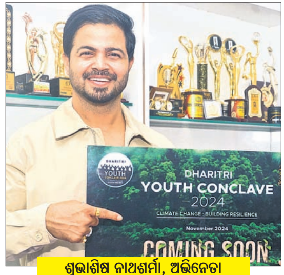
ଶୁଭାଶିଷ ନାଥଶର୍ମା, ଅଭିନେତା