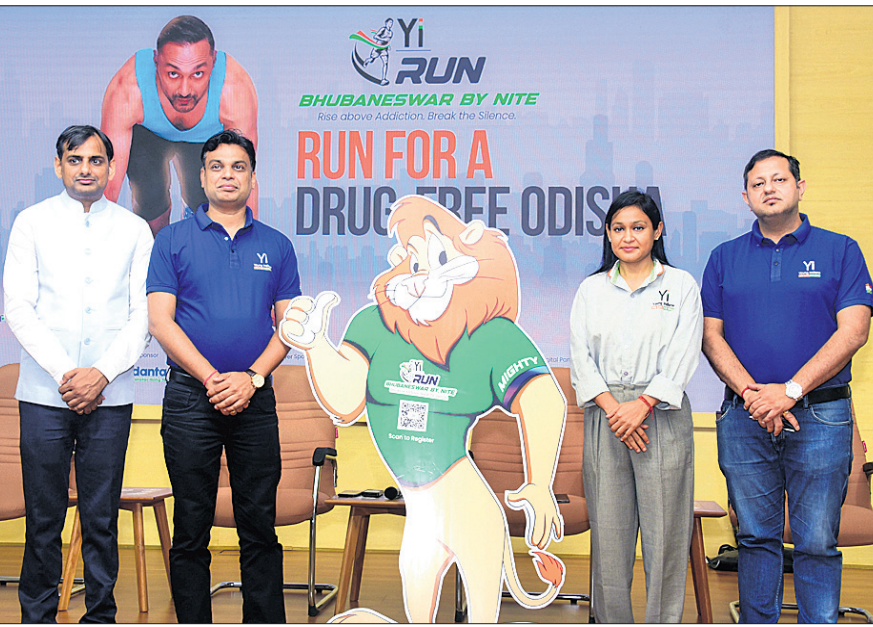
ଖବରଦାତା ସମ୍ମିଳନୀରେ ମାଧ୍ୟମ ସହ ଉପସ୍ଥିତ କର୍ମକର୍ତ୍ତାବୃନ୍ଦ।

ଭୁବନେଶ୍ୱର, ୧୧।୧୧ (ସଂପାଦକ କେନା) ଭ୍ରଷ୍ଟମୁକ୍ତ ଭୁବନେଶ୍ୱର ପାଇଁ ଯଜ୍ଞ ଇତିହାସୀ ଓ ସିଆଇଆଇ ପକ୍ଷରୁ ରାଜ୍ୟ କ୍ରୀଡା ଓ ଯୁବ ବ୍ୟାପାର ବିଭାଗର ମିଳିତ ସହଯୋଗରେ ଏକ ନାଇଟ୍ ମାରାଥନ୍ ଆୟୋଜନ କରାଯିବ। ଆସନ୍ତା ୧୭ ତାରିଖରେ