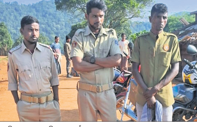
ପୋଲିସ ବେଶରେ ଆସିଥିବା ୩ ଦୁର୍ଭିକ୍ଷ

ପରିବାର ସଦସ୍ୟଙ୍କୁ ଧମକ ଦେଇଥିଲେ। ପରେ ସେମାନେ ଘରେ ବାହୁଡ଼େ ଥିବା ୨ ଲକ୍ଷ ୪୦ ହଜାର ଟୁପି ଲୋନ ଟଙ୍କା ଲୁଟି ନେଇଥିବା ଚିପା ଅଭିଯୋଗ କରିଛନ୍ତି।