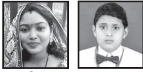
ପୁଷ୍ପିତା ପରିବାରବର୍ଗ ପ୍ରୀତମ୍ ପରିବାରବର୍ଗ