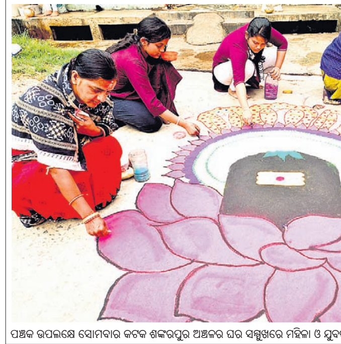
ପଞ୍ଚକ ଉପଲକ୍ଷେ ସୋମବାର କଟକ ଶକରପୁର ଅଞ୍ଚଳର ଘର ସମ୍ମୁଖରେ ମହିଳା ଓ ମୁଦତା ଖେଳି ପକାଉଛନ୍ତି ।