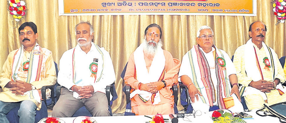
କଟକ ଶତାବ୍ଦୀ ଭବନରେ ହିନ୍ଦୁ ଏକତା ମଞ୍ଚ, ଭାରତ ଓ ଦେବାଳୟ ବିମୋଚନମ୍ ଉତ୍ସବ ଦେଖି ଗ୍ରନ୍ଥ ପଞ୍ଚମ ଅନୁଷ୍ଠିତ ସମର୍ପଣ ସଭାରେ ମଞ୍ଚାସୀନ ଅତିଥିବୃନ୍ଦ ।