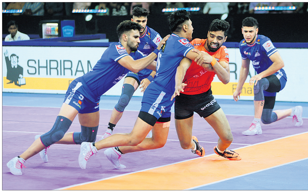
ନବଦ୍ୱାରେ ଯୋଗଦାନ ହରିୟାଣା ଷ୍ଟିଲର୍ସ ଓ ୟୁ ୟୁଥ ମଧ୍ୟରେ ଅନୁଷ୍ଠିତ ପ୍ରୋ କବାଡ଼ି ମ୍ୟାଚ।