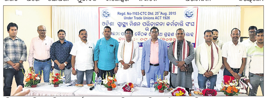
ଓଡ଼ିଶା ସ୍ୱାସ୍ଥ୍ୟ ମିଶନ ପରିଚାଳନା କର୍ମଚାରୀ ସଂଘର ପରିଚାଳନା ପରିଷଦ ବୈଠକରେ ଅତିଥିଙ୍କ ସହ ଅନ୍ୟମାନେ।