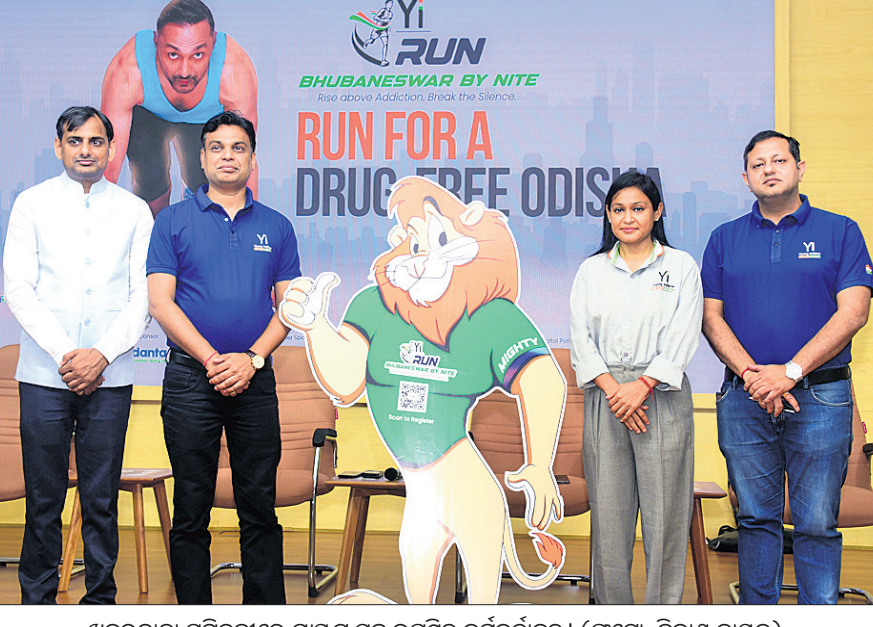
ଖବରଦାତା ସମ୍ମିଳନୀରେ ମାଧ୍ୟମ ସହ ଉପସ୍ଥିତ କର୍ମକର୍ତ୍ତାବୃନ୍ଦ।

ଭୁବନେଶ୍ୱର, ୧୧।୧୧ (ସରୋଜ କେନା) ଡ୍ରଗ୍ସମୁକ୍ତ ଭୁବନେଶ୍ୱର ପାଇଁ ଯଜ୍ଞ ଇଣ୍ଡିଆନ୍ ଓ ସିଆଇଆଇ ପକ୍ଷରୁ ରାଜ୍ୟ କ୍ରୀଡା ଓ ଯୁବ ବ୍ୟାପାର ବିଭାଗର ମିଳିତ ସହଯୋଗରେ ଏକ ନାଇଟ୍ ମାରାଥନ୍ ଆୟୋଜନ କରାଯିବ। ଆସନ୍ତା ୧୭ ତାରିଖରେ