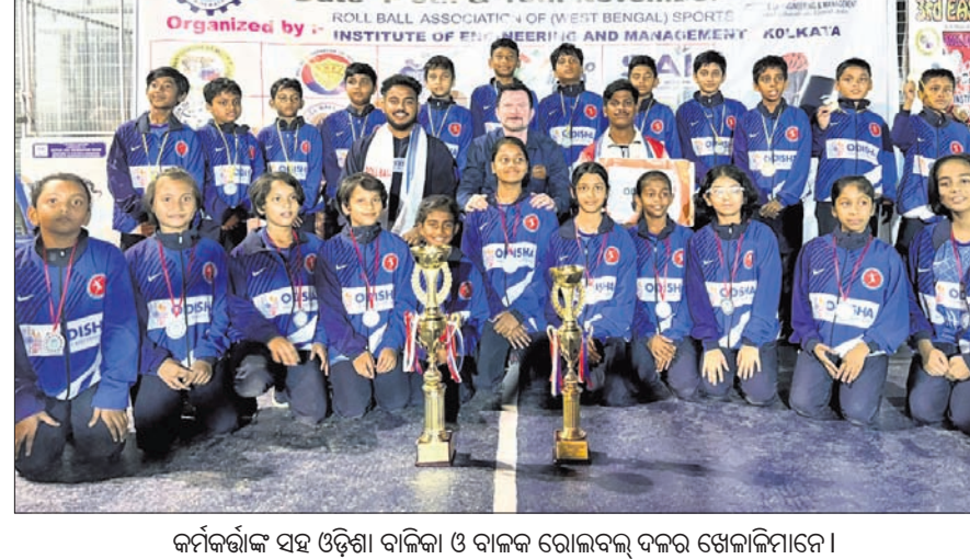
କର୍ମକର୍ତ୍ତାଙ୍କ ସହ ଓଡ଼ିଶା ବାଲିକା ଓ ବାଳକ ରୋଲବଲ୍ ଦଳର ଖେଳାଳିମାନେ।