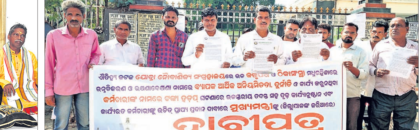
କଟକସ୍ଥିତ ଯୋତ୍ରା ନୌବାଣିଜ୍ୟ ସଂଗ୍ରହାଳୟର ରକ୍ଷଣାବେକ୍ଷଣ ଓ ଉନ୍ନତୀକରଣ ନାମରେ ବ୍ୟାପକ ଅର୍ଥ ଅନିୟମିତା ଅଭିଯୋଗ ନେଇ ମୋ କଟକ ସୁରକ୍ଷା ମଞ୍ଚ ପକ୍ଷରୁ ସୋମବାର ଜିଲ୍ଲାପାଳଙ୍କୁ କାର୍ଯ୍ୟାଳୟ ସମ୍ମୁଖରେ ବିକ୍ଷୋଭ ।