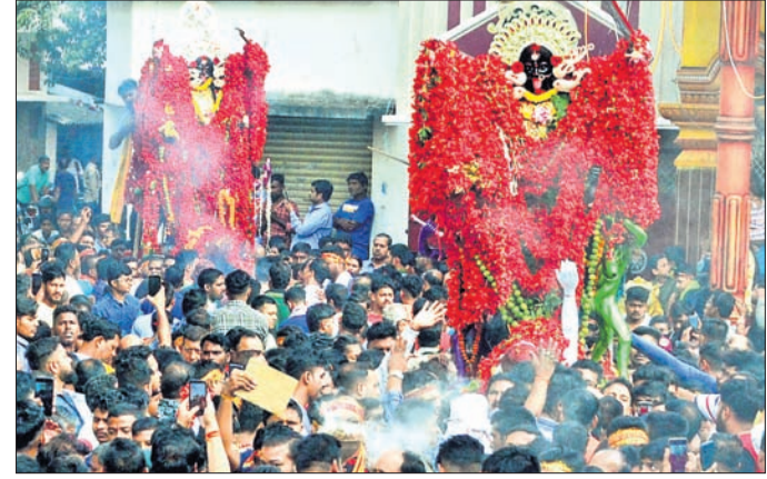
ମା'କାଳୀଙ୍କ ମୂର୍ତ୍ତୀ ପ୍ରତିମାକୁ ବିସର୍ଜନ ପାଇଁ ଶୋଭାଯାତ୍ରାରେ ନିଆଯାଉଛି ।

କଟକ, ୧୧/୧୧ (ଶିଳ୍ପା ପ୍ରିୟଦର୍ଶିନୀ) ମୂର୍ତ୍ତୀ ପ୍ରତିମାକୁ ଶୋଭାଯାତ୍ରାରେ ନିଆଯାଇ ଡାକଦଣ୍ଡା କୋଳରେ ବିସର୍ଜନ କରାଯାଇଥିଲା । ପରେ ଅନ୍ୟାନ୍ୟ ୨୮ଟି ପ୍ରତିମାକୁ ପ୍ରଶାସନ ପକ୍ଷରୁ ଖୋଳାଯାଇଥିବା ଅସ୍ଥାୟୀ ଯୋଗାଣରେ ବିସର୍ଜନ କରାଯାଇଥିଲା । ଭସାଣି ନଗର ପରିକ୍ରମା କରିଥିଲା । ଶତାଧିକ ଶୋଭାଯାତ୍ରୀରେ ପାରମ୍ପରିକ ବାଦ୍ୟ ମହିଳା ଲୁଗା ବିଛାଇ, ହଳଦୀ ପାଣି ପରିବେଷଣ କରାଯାଇଥିଲା । ଶାନ୍ତିଶୁଖିଳା ପକାଇ ମା'ଙ୍କ ଆଶୀର୍ଷ ଲାଭ କରିଥିଲେ । ରକ୍ଷା କରିବା ପାଇଁ ୧୨ ପ୍ଲାଟୁନ୍ ପୋଲିସ୍ ବଡ଼କାଳୀ, ସାନକାଳୀ ଓ ଦକ୍ଷିଣକାଳୀଙ୍କୁ ସୁରକ୍ଷା ଦିଆଯାଇଥିଲା ।