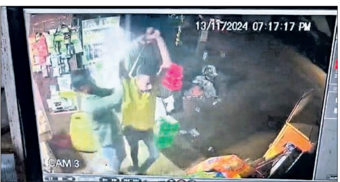
ସିପି ଟିଭିରେ କବ୍ଚ ହୋଇଥିବା ଆକ୍ରମଣର ଦୃଶ୍ୟ ।

ରାଜଧାନୀରେ ପୁଣି ଜେଲ ପ୍ରେରଣା ଉଦ୍ଘାଟନରେ ଉଦ୍ଘାଟନ କରାଯାଇଛି । ଉଦ୍ଘାଟନରେ ଉଦ୍ଘାଟନ କରାଯାଇଛି ।