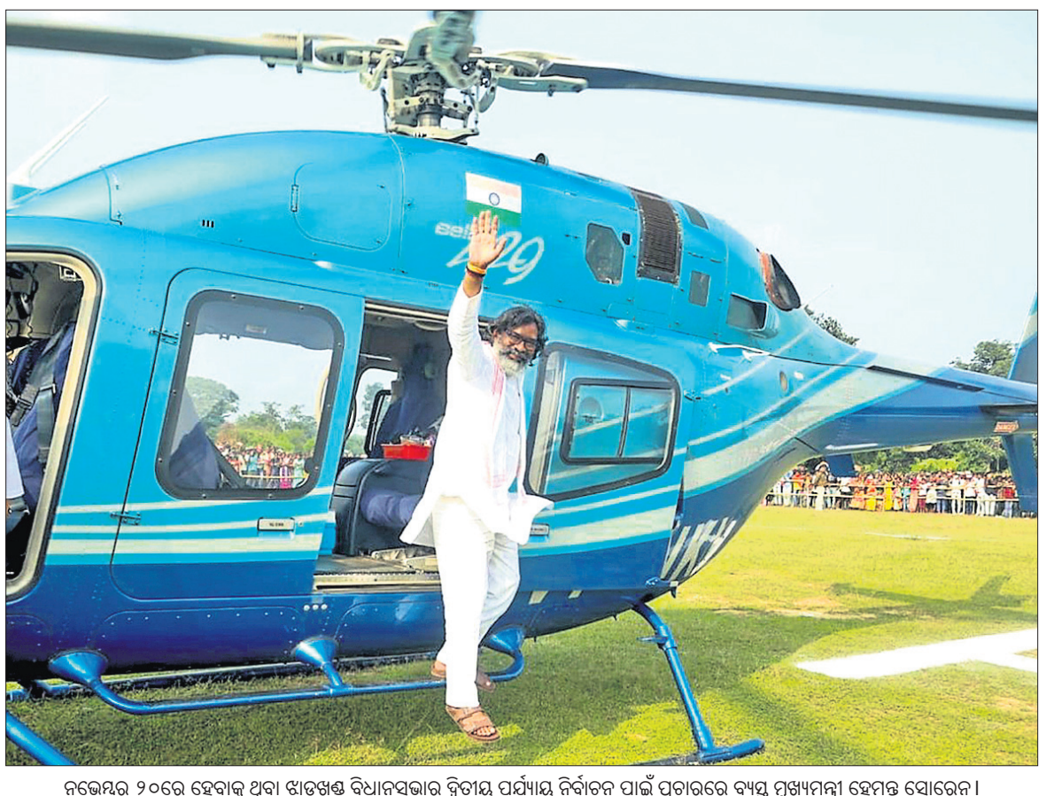
ନଭେମ୍ବର ୨୦ରେ ହେବାକୁ ଥିବା ଝାଡ଼ଖଣ୍ଡ ବିଧାନସଭାର ବିତରଣ ପର୍ଯ୍ୟାୟ ନିର୍ବାଚନ ପାଇଁ ପ୍ରଚାରରେ ବ୍ୟସ୍ତ ପୁଖ୍ୟମନ୍ତ୍ରୀ ହେମନ୍ତ ସୋରେନ ।