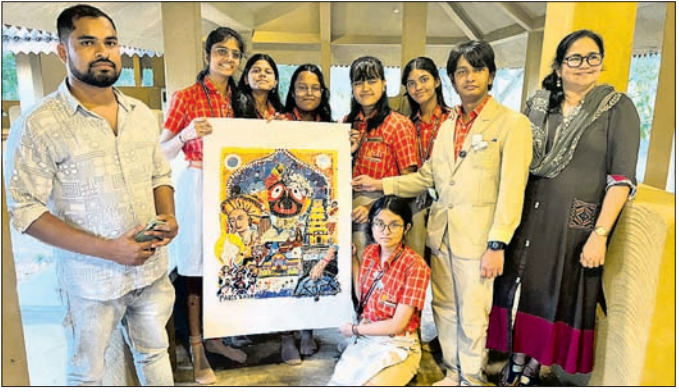
ମହୋତ୍ସବରେ ଯୋଗଦେଇଥିବା ସାରା ଦେଶରୁ ଯୋଗଦେଇଥିବା ଛାତ୍ରାଛାତ୍ରୀ ଓ ଯୁବ ମହୋତ୍ସବରେ ଯୋଗଦେଇଥିବା ସାରା ଦେଶରୁ ଯୋଗଦେଇଥିବା ଛାତ୍ରାଛାତ୍ରୀ ।

ସାରା ଦେଶରୁ ଯୋଗଦେଲେ ୧୫ଜାର ଛାତ୍ରାଛାତ୍ରୀ, ସ୍ପେଷ୍ଟାସେବା