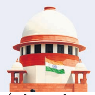
କାର୍ଯ୍ୟାଳୟ ନିର୍ମାଣ ପାଇଁ ବୁଲ୍ଡୋଜର କାର୍ଯ୍ୟାନୁଷ୍ଠାନ ଅସାମ୍ଭାବିକ

ବାରାୟର ନାମ ପରିବର୍ତ୍ତନ ସହ କମ୍ପାନୀର ବିଶ୍ୱସନାୟତାକୁ ନେଇ ସେତେବେଳେ ପ୍ରଶ୍ନ ଉଠିଥିଲା। ଜମି ଅଧିଗ୍ରହଣ ପ୍ରକ୍ରିୟାକୁ ହାଇକୋର୍ଟ ୨୦୧୦ରେ ବୈଧ ରୁହେଁ ବୋଲି ଦର୍ଶାଇଥିଲେ। ଏହି ରାୟକୁ ସର୍ବୋଚ୍ଚ ଅଧିକାରୀ ୨୦୨୩ରେ କାର୍ଯ୍ୟ ରଖିବା ସହ ଜମି ଫେରାଇବାକୁ ଅନୁମୋଦନ ଦେଇଥିଲେ। ତଥ୍ୟରେ ରାଜ୍ୟରେ ବିଶ୍ୱବିଦ୍ୟାଳୟ ପାଇଁ ଅଧିଗ୍ରହଣ ହୋଇଥିବା ଘରୋଇ ଜମିକୁ ସରକାର ଫେରାଇବା ପ୍ରକ୍ରିୟା ଆରମ୍ଭ କରିଛନ୍ତି। ଲିଜ୍ ପ୍ରଣାୟକ ଏ ନେଇ ଖୁବ୍ ଶୀଘ୍ର ପଦକ୍ଷେପ ନେବ। ବିଶ୍ୱବିଦ୍ୟାଳୟ ପାଇବ ଓ ତା'ପରେ ଜମି ଫେରାଇବ। ଜମି ରେକର୍ଡ ପରିବର୍ତ୍ତନ ନେଇ ରାଜ୍ୟ ବିଭାଗ ପକ୍ଷରୁ ଆବଶ୍ୟକ ପଦକ୍ଷେପ ଗ୍ରହଣ କରାଯିବ ବୋଲି ରାଜ୍ୟ ମନ୍ତ୍ରୀ କହିଛନ୍ତି।