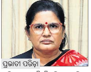
ପ୍ରଭାତୀ ପରିଡ଼ା ତାରିଖ ପରେ ଗାଁ ଗାଁକୁ ଚିମ୍ ପଠାଯିବ। ଅଜ୍ଞାନତା କର୍ମୀ ବ୍ୟକ୍ତିଗତ ଭାବେ ଯାଇ ଭେରିଫିକେସନ୍ କରିବେ ବୋଲି ଉପମୁଖ୍ୟମନ୍ତ୍ରୀ କହିଛନ୍ତି। ସୁତନାଯୋଗ୍ୟ, 'ସୁଭଦ୍ରା' ରାଜ୍ୟ ସରକାରଙ୍କ ସହୁ ମୋବାଇଲ୍ ନମ୍ବର

ଆକାରରେ ସହ ଗୋଟିଏ ମୋବାଇଲ ନମ୍ବର ଲିଙ୍କ୍ କରନ୍ତୁ। ରାଜ୍ୟର ପ୍ରାୟ ୫ ଲକ୍ଷ ଆବେଦନକାରୀଙ୍କ ବ୍ୟାଙ୍କ ସହ ଲିଙ୍କ୍ ହୋଇନାହିଁ। ବ୍ୟାଙ୍କ ଆକାର-ଆଧାର-ମୋବାଇଲ ନମ୍ବର ମଧ୍ୟରେ ସମନ୍ୱୟ ନାହିଁ। ଯାହାର ୨ରୁ ୩ଟି ଆକାର ଅଛି, ସେମାନଙ୍କୁ ଏକତ୍ର କରି ସମସ୍ତଙ୍କୁ ସହଜରେ ଗୋଟିଏ ଆକାରରେ ସହ ଗୋଟିଏ ମୋବାଇଲ ନମ୍ବର ଯୋଡ଼ନ୍ତୁ। ୨୪ ତାରିଖରେ ବାକି ଥିବା ହିତାଧିକାରୀଙ୍କୁ ଚଳାଏ ମିଳିଯିବା କଥା। କେହି ବଞ୍ଚିତ ହେଲେ ୨୪