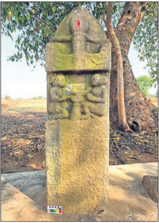
ଉଦ୍ଧାର ହୋଇଥିବା ସତୀଶିଳା ।

କଳାକାର ଜିଲ୍ଲା ଚିତ୍ତାଗଡ଼ ଜିଲ୍ଲା ଅନ୍ତର୍ଗତ ତିଆଡ଼ ଗ୍ରାମରୁ ଅଭିଲେଖ ଉଦ୍ଧାର ହୋଇଛି । ଏହା ଓଡ଼ିଶାର ପ୍ରଥମ ବୋଲି ସ୍ମୃତିପୁସ୍ତକ ରଚନାକାର ତଥା ଖ୍ରୀଷ୍ଟୀୟ ଶତାବ୍ଦୀର ପ୍ରଥମ ମହାବିଦ୍ୟାଳୟ ଭାବେ ବିଶ୍ୱବିଦ୍ୟାଳୟ ସ୍ଥାପନା ପ୍ରଥମ ପ୍ରଥମ ପ୍ରଥମ ଶିଳା ଉଦ୍ଧାର ହୋଇଛି ।