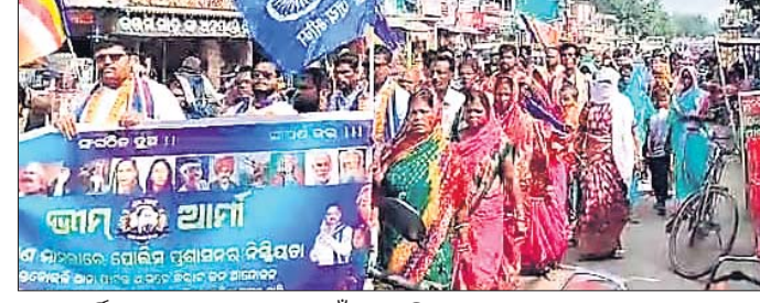
ଭୀମ ଆର୍ତ୍ତ ପକ୍ଷରୁ ଥାନା ଘେରାଉ ପାଇଁ ଯାଉଛନ୍ତି।

କଟିଆଣା ଆକ୍ଷେପ ମାମଲାରେ ପୋଲିସ୍‌ର ନିଶ୍ଚିତକୋଇଲି ଥାନା ସମ୍ମୁଖରେ ପ୍ରତିବାଦ କରାଯାଇଥିଲା। ସରପଞ୍ଚା ପଞ୍ଚାୟତ କର୍ମୀମାନେ ଆକ୍ଷେପ ଯୋଗାଇ ଦେଲେ।