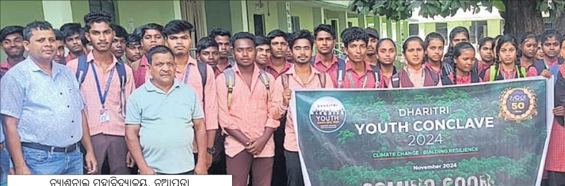
ନ୍ୟାଶନାଲ ମହାବିଦ୍ୟାଳୟ, ନୂଆପଡ଼ା