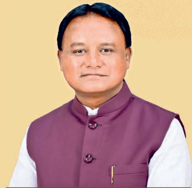
ଶ୍ରୀ ମୋହନ ଚରଣ ପ୍ରାସାଦୀ ମୁଖ୍ୟମନ୍ତ୍ରୀ, ଓଡ଼ିଶା