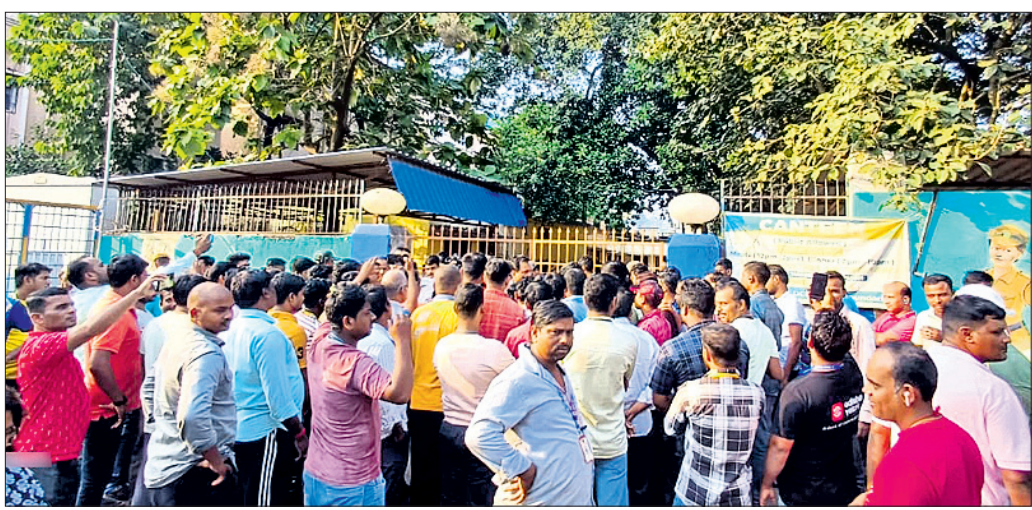
ଅନ୍ତର୍ଜାତୀୟ ଅଟୋ ଚାକର ଓ ମାଲିକମାନେ ଡିସିପି ଅଫିସ୍ ଘେରାଉ କରିଛନ୍ତି ।

ଅନ୍ତର୍ଜାତୀୟ ଅଟୋ ଚାକର ଓ ମାଲିକମାନେ ଏହାର ପ୍ରତିବାଦ କରୁଥିଲେ ।