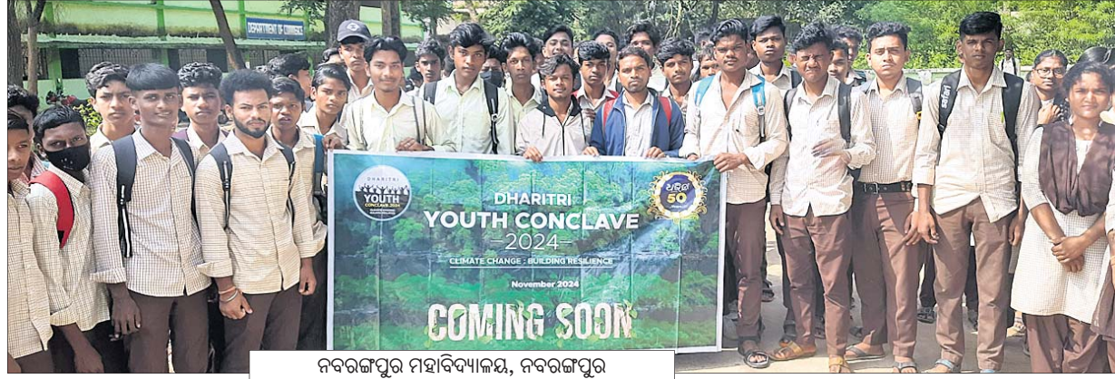
ନବରଙ୍ଗପୁର ମହାବିଦ୍ୟାଳୟ, ନବରଙ୍ଗପୁର