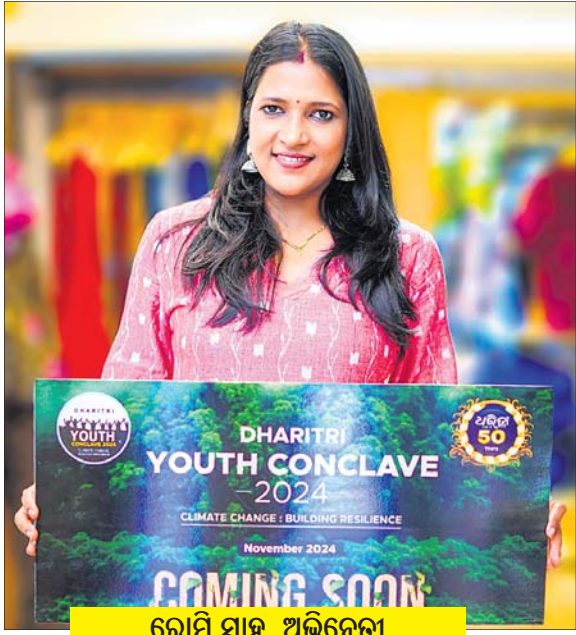
ରୋମି ସାହୁ, ଅଭିନେତ୍ରୀ