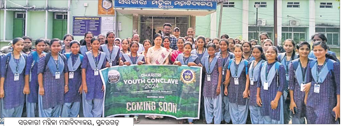
ସରକାରୀ ମହିଳା ମହାବିଦ୍ୟାଳୟ, ସୁନ୍ଦରଗଡ଼