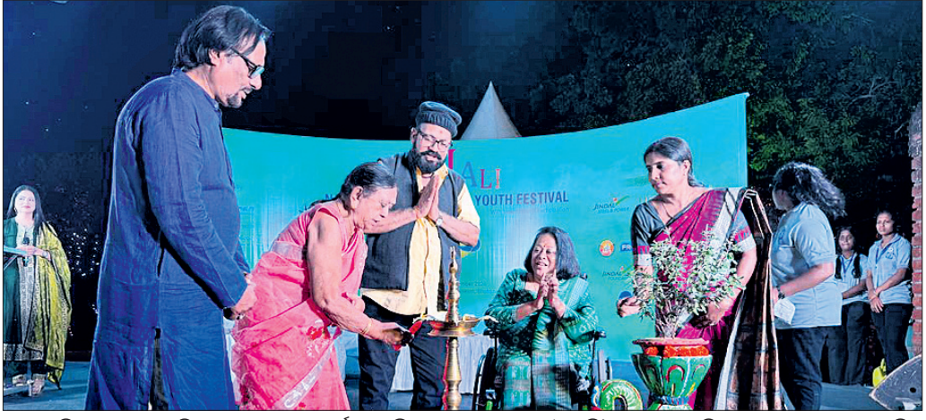
କଳା କୁମ୍ଭୀ ସଂଗ୍ରହାଳୟ ପରିସରରେ ୨୩ତମ ଅନ୍ତର୍ଜାତୀୟ ଶିଶୁ ଓ ଯୁବ ମହୋତ୍ସବ 'ଅଞ୍ଜଳି'ରୁ ବୁଧବାର ଅତିଥିମାନେ ଉଦ୍ଘାଟନ କରୁଛନ୍ତି ।