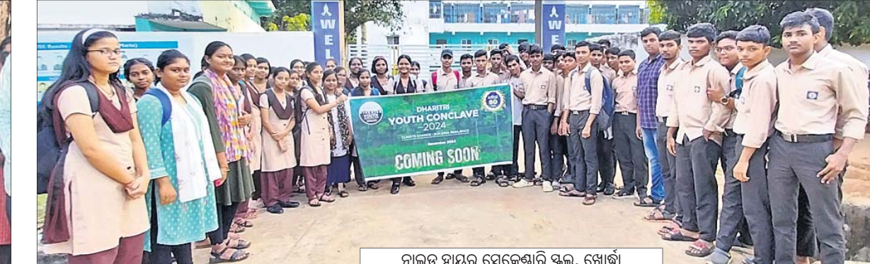
ନାଲନ୍ଦା ହାୟର ସେକେଣ୍ଡାରି ସ୍କୁଲ, ଖୋର୍ଦ୍ଧା