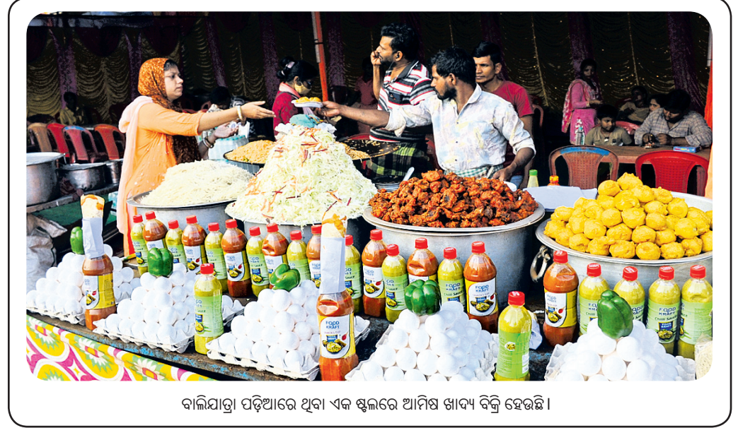
ବାଲିଯାତ୍ରା ପଡ଼ିଆରେ ଥିବା ଏକ ଷ୍ଟଲରେ ଆମିଷ ଖାଦ୍ୟ ବିକ୍ରି ହେଉଛି।

ଷ୍ଟଲରେ ଚଢ଼ାଉ, ବାସିଖାଦ୍ୟ ନଷ୍ଟ ବାଲିଯାତ୍ରା ପଡ଼ିଆର ବିଭିନ୍ନ ଷ୍ଟଲରେ ସିଏମ୍‌ସି ପକ୍ଷରୁ ରବିବାର ଚଢ଼ାଉ କରାଯାଇ ଖାଦ୍ୟର ମାନ ଯାଞ୍ଚ କରାଯାଇଥିଲା। ଯାଞ୍ଚବେଳେ ଅଧିକାଂଶ ଷ୍ଟଲରେ ଖାଦ୍ୟର ମାନ ଠିକ୍ ନ ଥିବା ଜଣାପଡ଼ିଥିଲା। ଫଳରେ ୧ କୁଇଣ୍ଟାଲରୁ ଅଧିକ ବାସି ଓ ଅପିମିଶ୍ରିତ ଖାଦ୍ୟ ନଷ୍ଟ କରାଯାଇଥିଲା। ଏଥିସହ ୬ଟି ଡୋକାନ ସିଲ୍ କରାଯାଇଛି। ଆଗାମୀ ଦିନରେ ବାସି କିମ୍ପା ରଖି ମିଶା ଖାଦ୍ୟ ବିକ୍ରି ନ କରିବାକୁ ବ୍ୟବସାୟୀଙ୍କୁ ସତର୍କ କରାଯାଇଥିବା ସିଏମ୍‌ସି ସ୍ୱାସ୍ଥ୍ୟ ଅଧିକାରୀ ସତର୍କତା ମହାପାତ୍ର କହିଛନ୍ତି।