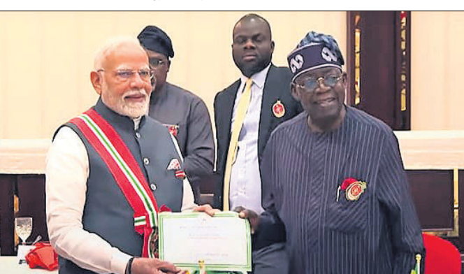
ନାଲଜେରିଆ ରାଷ୍ଟ୍ରପତି ବୋଲୋ ଅହମଦ ତିରୁବୁ ରବିବାର ପ୍ରଧାନମନ୍ତ୍ରୀ ନରେନ୍ଦ୍ର ମୋଦିଙ୍କୁ 'ଗ୍ରାଣ୍ଡ କମାଣ୍ଡର ଅଫ୍ ଦି ଅର୍ଡର ଅଫ୍ ଦି ନାଇଜର' ସମ୍ମାନ ପ୍ରଦାନ କରୁଛନ୍ତି।

ପ୍ରଧାନମନ୍ତ୍ରୀ ନରେନ୍ଦ୍ର ମୋଦି ରବିବାର ନାଲଜେରିଆର ଦ୍ୱିତୀୟ ସର୍ବୋଚ୍ଚ ରାଷ୍ଟ୍ରୀୟ ସମ୍ମାନ 'ଗ୍ରାଣ୍ଡ କମାଣ୍ଡର ଅଫ୍ ଦି ଅର୍ଡର ଅଫ୍ ଦି ନାଇଜର' ସମ୍ମାନରେ ସମ୍ମାନୀତ ହୋଇଛନ୍ତି।