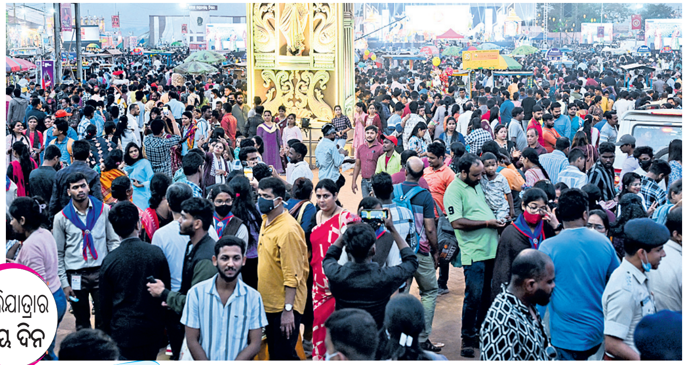
ବାଲିଯାତ୍ରାର ଗାୟ ଦିନ

କଟକ, ୧୭।୧୧(ଶିଳ୍ପା ପ୍ରିୟଦର୍ଶିନୀ) ରବିବାର ଥିଲା ବାଲିଯାତ୍ରାର ତୃତୀୟ ଦିନ। ଦିନଟମାମ ପଡ଼ିଆରେ ଗହଳି ଲାଗି ରହିଥିଲା। ଦିନରେ କେତେକ ଲୋକ ବାଲିଯାତ୍ରା ବୁଲାଇବା କରିବା ସହ ଘରକରଣା ସାମଗ୍ରୀ କିଣି ଘରକୁ ଫେରିଥିଲେ। କ୍ଷୁଦ୍ରିତ ଥିବାବୁଦ୍ଧି ଅପରାହ୍ଣରୁ ଭିଡ଼ ଅସମ୍ଭାଳ ହୋଇପଡ଼ିଥିଲା। ସମସ୍ତେ ଚାହୁଁଥିଲେ ବାଲିଯାତ୍ରା ପଡ଼ିଆରେ ଆଉ ପହଞ୍ଚିବା ପାଇଁ। ବାଲିଯାତ୍ରା ପଡ଼ିଆକୁ ସଂଯୋଗ କରୁଥିବା ରାସ୍ତା ସମ୍ପୂର୍ଣ୍ଣ ଜାମ୍ ରହିଥିଲା। ଏପରି କି ମହାନଦୀ ରିଂରୋଡ଼ରେ ଗାଡ଼ି ଗଡ଼ିବା ଅସମ୍ଭବ ହୋଇଥିଲା। ଗାଡ଼ି ଗଡ଼ିବା ପଡ଼ିଆ ତ ଦୂରର କଥା ଗାଡ଼ି ପାର୍କିଂ ସ୍ଥାଣ୍ଡରେ ପହଞ୍ଚିବାବେଳକୁ ଘଣ୍ଟା ଘଣ୍ଟା ସମୟ ଲାଗିଥିଲା। ଯାହାର ଦୃଶ୍ୟ ନ ଦେଖିଲେ ବର୍ଷନା କରିହେବ ନାହିଁ। ପୂର୍ବ ଦୁଇଦିନ ଅପେକ୍ଷା ରବିବାର ବାଲିଯାତ୍ରା ଗାଡ଼ି ରଖିବା ପାଇଁ ୧୦ରୁ ଅଧିକ ପାର୍କିଂ ବ୍ୟବସ୍ଥା କରାଯାଇଥିଲେ ମଧ୍ୟ ସନ୍ଧ୍ୟା ୬ଟା ପରଠୁ ଗାଡ଼ି ରଖିବାକୁ ଜାଗା ମିଳି ନ ଥିଲା। ୩ ଲକ୍ଷରୁ ଊର୍ଦ୍ଧ୍ୱ କନସାଧାରଣ ବାଲିଯାତ୍ରା ବୁଲିଥିବା ପ୍ରଶାସନ ପକ୍ଷରୁ ଆକଳନ କରାଯାଇଛି। ଶନିବାର ସଂକ୍ରାନ୍ତି ଥିବାବୁଦ୍ଧି ଛାଡ଼ିବା ପାଇଁ ଖାଲିଥିଲା। ହେଲେ ରବିବାର ବାଲିଯାତ୍ରା ପଡ଼ିଆରେ ଲୋକମାନେ ଛାଡ଼ିବା ପାଇଁ ଥିଲେ। ଆମିଷ ଷ୍ଟଲରେ ଲୋକଙ୍କ ଗହଳି ଦେଖିବାକୁ ମିଳିଥିଲା। ଏହାକୁ ଦୃଷ୍ଟିରେ ରଖି ବ୍ୟବସାୟୀମାନେ ପ୍ରସ୍ତୁତ ରହିଥିଲେ। ଏଥିସହ ଦହକରା ଆକ୍ରମଣ, ଚାଟୁ, ଠୁଳାପୁରୀ ଓ ଅନ୍ୟାନ୍ୟ ଚରପଟି ଖାଦ୍ୟ ଖାଇବାର ମଜା ନେଇଥିଲେ ଜନସାଧାରଣ। ସେହିପରି କଟକ ଇନ୍ କଟକ, ଅନନ୍ତ ଭୁବିଆ, ଓଡ଼ିଆ ସ୍କୁଲ, କନରକ ସ୍କୁଲ ସମେତ ବାଲିଯାତ୍ରାର ତଳ ଓ ଉପର ପଡ଼ିଆରେ ବ୍ୟବସାୟୀ ଭଲ ବ୍ୟବସାୟ କରିଥିଲେ।