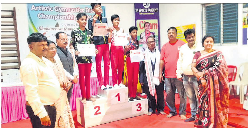
କୃତୀ ପ୍ରତିଯୋଗୀମାନେ ଅତିଥିଙ୍କୁ ଗ୍ରହଣରେ ।

ଭୁବନେଶ୍ୱର, ୧୭।୧୧ (ତପନ ସାଲ୍) ଭୁବନେଶ୍ୱର ଜିମ୍ନାଷ୍ଟିକ୍ ଆସୋସିଏସନ ଆନୁକୂଲ୍ୟରେ ଜେଏମ୍ ସ୍କୋର୍ସ୍ ଏକାଡେମୀ ପରିସରରେ ରବିବାର ଜିଲ୍ଲାସ୍ତରୀୟ ଆର୍ଟିଷ୍ଟିକ୍ ଜିମ୍ନାଷ୍ଟିକ୍ସ ପ୍ରତିଯୋଗିତା ଅନୁଷ୍ଠିତ ହୋଇଯାଇଛି । ସର୍ବ-ଜୁନିୟର, ଜୁନିୟର ଓ ସିନିୟର ଆଦି ୪ ବର୍ଗରେ ଆୟୋଜିତ ହୋଇଥିଲା ।