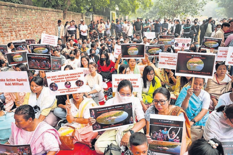
ମଣିପୁରରେ ହିଂସା ଲାଗି ରହିଥିବାବେଳେ ଇମ୍ଫାଲରେ ଗାୟାର ଜାମି ବିସୋଇ ପ୍ରଦର୍ଶନ କରାଯାଉଛି।