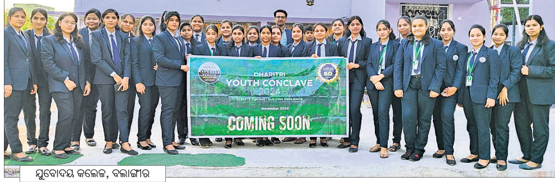
ସୁବୋଦୟ କଲେଜ, ବଲାଙ୍ଗୀର