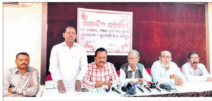
କାର୍ଯ୍ୟକ୍ରମରେ ମଞ୍ଚାଧୀନ ଅତିଥିମାନେ।

ଭୁବନେଶ୍ୱର ମାତୃ ଭୂମିପୁତ୍ର ବୀର ମାତୃ କାଲୋକୁ ସ୍ୱାଧୀନତା ସଂଗ୍ରାମୀର ମାନ୍ୟତା ସହ ଗୁଣାୟନ ନେତୃକାଳ କଲେଜ ଓ ହରିଶଲକୁ ଡାକ ନାମରେ ନାମିତ କରିବାକୁ ସର୍ବଭାରତୀୟ ଅଖଣ୍ଡ ଭୂୟାଁ ସମାଜ ପକ୍ଷରୁ ପୂର୍ଣ୍ଣ ଦାବି କରାଯାଇଛି।