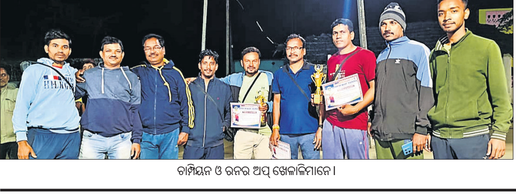
ଚାମ୍ପିୟନ ଓ ରନର ଅପ ସ୍କୋରକାରୀମାନେ ।

କ୍ରିକ୍ ଏଣ୍ଡ କନଷ୍ଟ୍ରକ୍ସନ କୋର୍ପୋରେଶନ ଲିମିଟେଡ୍(ଓପିସି) ୪ ମାସ ପୂର୍ବରୁ ଚେଣ୍ଡର ଆହ୍ଲାନ କରିଥିଲା । ଚେଣ୍ଡର ପ୍ରକ୍ରିୟା ମଧ୍ୟ ସରିଛି । ତେବେ ସମ୍ପୂର୍ଣ୍ଣ ଜମି ଅବରୋଧ ମୁକ୍ତ ହୋଇ ନ ଥିବା ବେଳେ କେତେକ ଲୋକ ଭୁବନେଶ୍ୱର ଯାଇ ସହର ବାହାରେ ବସ୍ତୁକ ନିର୍ମାଣ ପାଇଁ ସରକାରଙ୍କୁ ଅନୁରୋଧ କରିଛନ୍ତି । ଫଳରେ ନିର୍ମାଣ କାମ ଅଟକି ଯାଇଛି । ଅନ୍ୟପକ୍ଷେ ବସ୍ତୁକରେ ସାମାନ୍ୟ ସୁବିଧା ନ ଥିବାରୁ ଯାତ୍ରୀମାନେ ନାନା ଅସୁବିଧା ଭୋଗୁଛନ୍ତି । ପୂର୍ଣ୍ଣା ଗ୍ରାମରେ ନୂତନ ବସ୍ତୁକ ନିର୍ମାଣ ପାଇଁ ଜିଲ୍ଲାର ବୁଦ୍ଧିଜୀବୀ ମତ ରଖିବା ସହ କାମ ଦ୍ରାବିତ କରିବାକୁ ସରକାରଙ୍କୁ ଅନୁରୋଧ କରିଛନ୍ତି ।