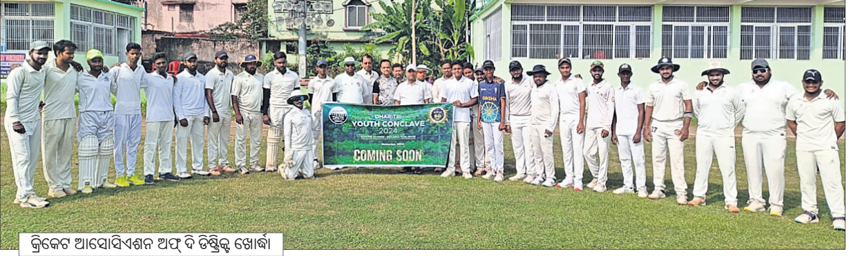
କ୍ରିକେଟ ଆସୋସିଏଶନ ଅଫ୍ ଦି ଡିଷ୍ଟ୍ରିକ୍ଟ ଖୋର୍ଦ୍ଧା