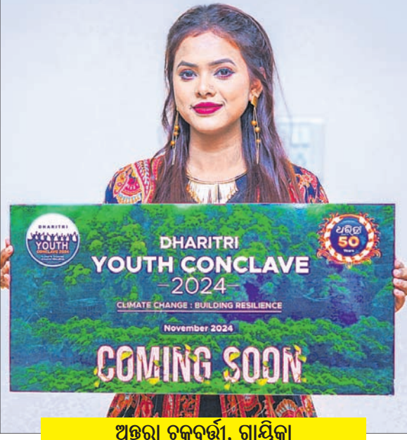
ଅନ୍ତରା ଚକ୍ରବର୍ତ୍ତୀ, ଗାୟିକା