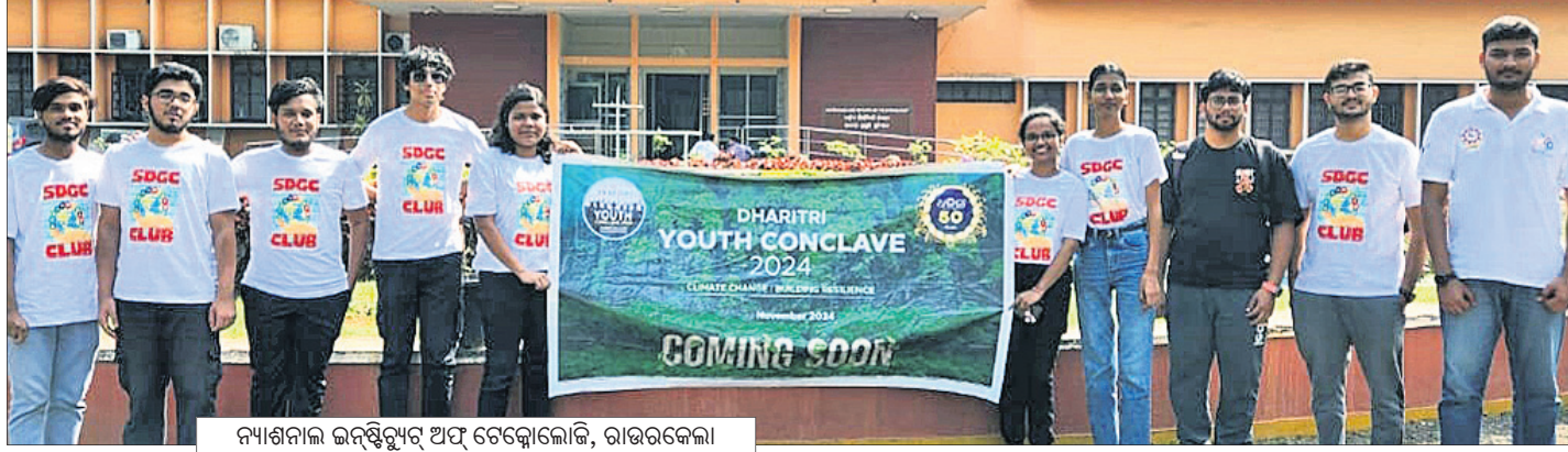
ନ୍ୟାଶନାଲ ଇନ୍‌ଷ୍ଟିଚ୍ୟୁଟ୍ ଅଫ୍ ଟେକ୍ନୋଲୋଜି, ରାଉରକେଲା