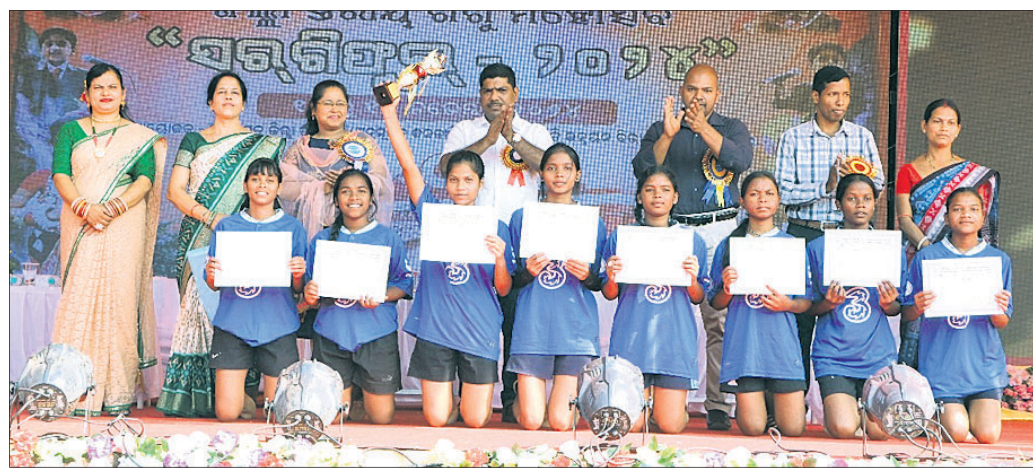
ପୁରସ୍କୃତ ହୋଇଥିବା ଛାତ୍ରୀମାନେ।

ଭୁବନେଶ୍ୱର, ୧୮.୧୧.୧୯ (ଜୟ ନାରାୟଣ ମେହେର) ଭୁବନେଶ୍ୱର ଭବାନୀପୁର ସ୍ଥିତ ଏକଲବ୍ୟ ଆଦର୍ଶ ବିଦ୍ୟାଳୟଠାରେ ରାଜ୍ୟସ୍ତରୀୟ ପୁରୀୟ ଶିଶୁ ମହୋତ୍ସବ ସର୍ବିଷ୍ଟୁଳ ଯୋଜନାରେ ଉଦ୍‌ଯାପିତ ହୋଇଯାଇଛି।