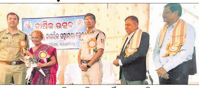
ଜଣେ ବରିଷ୍ଠ ନାଗରିକଙ୍କୁ ସମ୍ମାନିତ କରାଯାଇଛି।