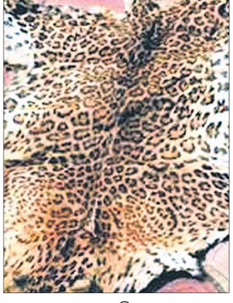
ଜବତ କଲରାପତରିଆ ବାଘଛାଲ।

ବାରିପଦା(ନୀଳାଦ୍ରି ବିହାରୀ ଦଣ୍ଡପାଟ)/ବାରିପଦାସି (ସଞ୍ଜୟ କୁମାର ଅଗ୍ରୱାଲ), ୧୮।୧୧