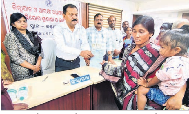
ଜିଲ୍ଲାପାଳ ଜଣେ ହିତାଧିକାରୀଙ୍କୁ ଭଣ୍ଡା ପ୍ରଦାନ କରୁଛନ୍ତି ।