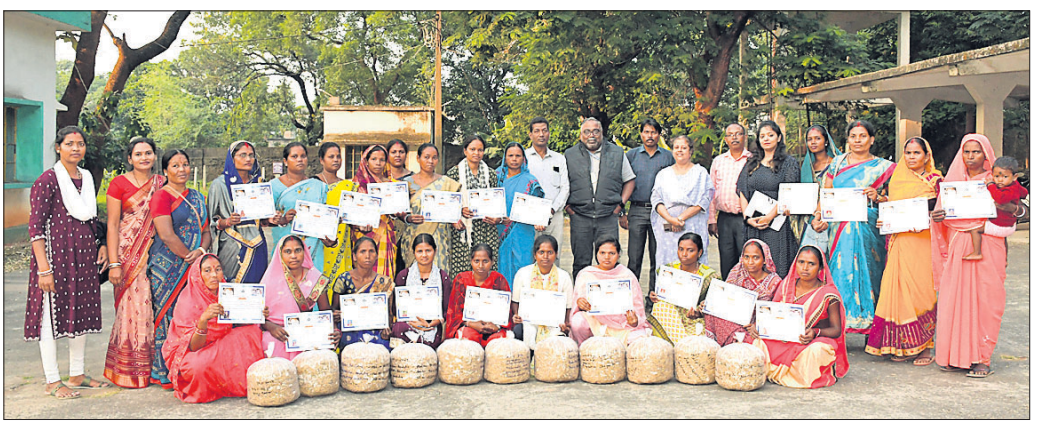
ମହିଳାମାନଙ୍କୁ ଛତୁତାଷ ତାଲିମ ପ୍ରମାଣପତ୍ର ପ୍ରଦାନ କରାଯାଇଛି।

ରାଉରକେଲା, ୧୮।୧୧ (ବିସୁବ ରଞ୍ଜନ ଦାଶ) ଆର୍.ଏସ୍.ଏମ୍. କର୍ମଚାରୀ ସାମାଜିକ ଦାୟିତ୍ୱ ବିଭାଗ ପାଠ୍ୟପୁସ୍ତକ ଆର୍ଥିକ ସଶକ୍ତୀକରଣ ପାଇଁ ଛତୁତାଷ ତାଲିମ ପ୍ରଦାନ କରୁଛି। ଏହି କ୍ରମରେ ପାଠ୍ୟପୁସ୍ତକ ବିଭାଗ ପ୍ରତିଷ୍ଠାନରେ ନୂଆଗାଁ ବ୍ଲକର ବରାଉଗଡ଼ା, କଦେଲିବାହାଳ, ତୁମ୍ପାହାତ ଏବଂ ରମକଦାରୀ ୨୦କଣ ଏସ୍.ଏଚ୍.ଏମ୍. ମହିଳାଙ୍କୁ ଛତୁତାଷ ତାଲିମ ପ୍ରଦାନ କରାଯାଇଛି। କାର୍ଯ୍ୟକ୍ରମର