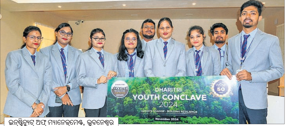
ଇନ୍‌ଷ୍ଟିଚ୍ୟୁଟ୍ ଅଫ୍ ମ୍ୟାନେଜମେଣ୍ଟ, ଭୁବନେଶ୍ଵର