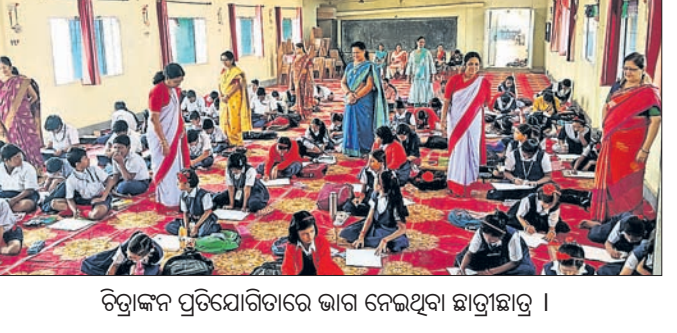
ଚିତ୍ରାଙ୍କନ ପ୍ରତିଯୋଗିତାରେ ଭାଗ ନେଇଥିବା ଛାତ୍ରାଛାତ୍ରୀ ।