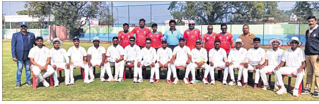
ଅତିଥିଙ୍କ ସହ ପ୍ରତିଯୋଗିତାରେ ଭାଗ ନେଇଥିବା ଖେଳାଳି।

ସୁନ୍ଦରଗଡ଼ ଜିଲା ଜ୍ରୀତା ସଂସଦ ଓ ଓଡ଼ିଶା କ୍ରିକେଟ ସଂଘର ମିଳିତ ଆରମ୍ଭକର୍ତ୍ତାମାନେ ଜିଲା ଜ୍ରୀତା ସଂଘ ସ୍ୱାଗତ୍ୟରେ ପ୍ରଥମଥର ପାଇଁ ଆୟୋଜିତ ହୋଇଥିବା ଜାତୀୟ ପୁରୀୟ କର୍ନେଲ ସି.କେ.ନାଇଡୁ ଟ୍ରଫି କ୍ରିକେଟ ମ୍ୟାଚ ଯୋଗଦାନ ଉଦ୍‌ଯାପିତ ହୋଇଯାଇଛି।