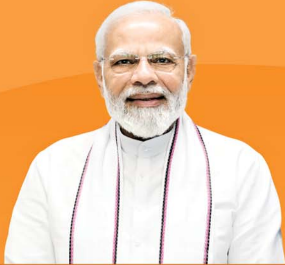
ଶ୍ରୀ ନରେନ୍ଦ୍ର ମୋଦୀ ପ୍ରଧାନମନ୍ତ୍ରୀ