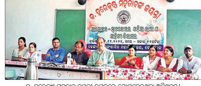
ଓ. ହରେକୃଷ୍ଣ ମହତାବ ଜୟନ୍ତୀ ଉତ୍ସବରେ ଯୋଗଦେଇଥିବା ଅତିଥିବୃନ୍ଦ।