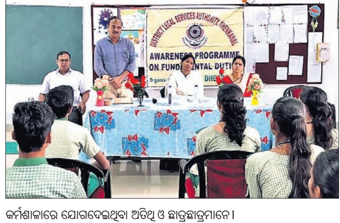
କର୍ମଶାଳାରେ ଯୋଗଦେଇଥିବା ଅତିଥି ଓ ସାଥୀଗଣଙ୍କ ପ୍ରତିବାଦ କରାଯାଇଛି।