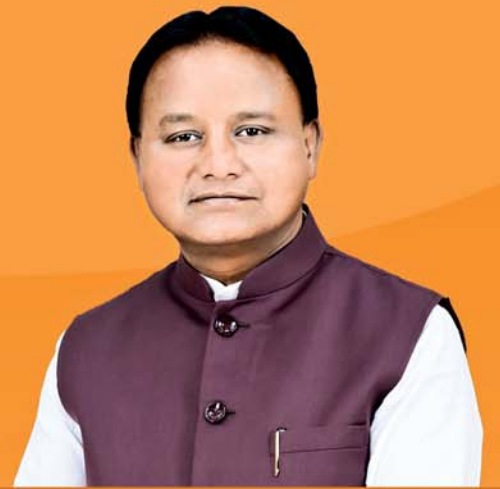
ଶ୍ରୀ ମୋହନ ଚରଣ ମିଶ୍ର ମୁଖ୍ୟମନ୍ତ୍ରୀ, ଓଡ଼ିଶା

୨୦୨୪-୨୫ ରେ ଦେଶର ପ୍ରମୁଖ ତୀର୍ଥସ୍ଥାନ ଦର୍ଶନ ପାଇଁ ରାଜ୍ୟର ବରିଷ୍ଠ ନାଗରିକମାନଙ୍କ ନିମନ୍ତେ ଆବେଦନୀୟ ସୂଚନା