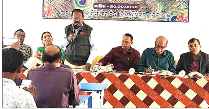
ଉପଜିଲ୍ଲାପାଳଙ୍କ ଦ୍ୱାରା ଆହୂତ ବୈଠକରେ ପ୍ରତିବାଦ କରାଯାଇଛି।