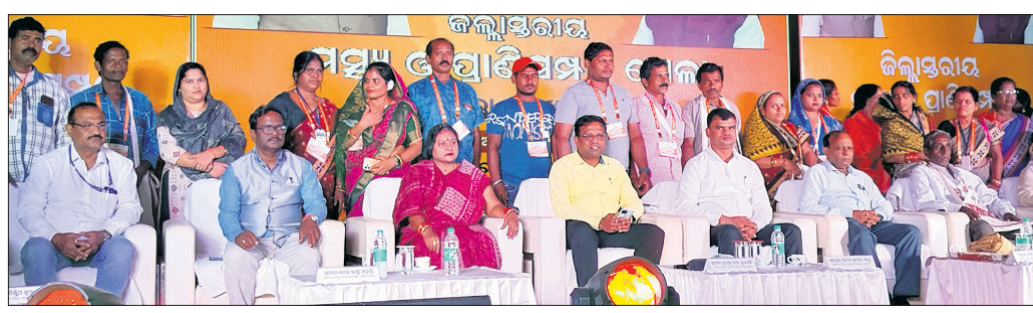
ଜିଲ୍ଲାପ୍ରଶାସନ ମଧ୍ୟ ଓ ପ୍ରାଣୀସମ୍ପଦ ମେଳା ଉଦ୍‌ଘାଟନୀ ଦିବସରେ ମଞ୍ଚାସୀନ ଅତିଥି ଏବଂ ଅନ୍ୟମାନେ।

ଓଡ଼ିଶା ଅର୍ଥନୀତି ସୁଦୃଢ଼ ଦିଗରେ ମହତ୍ତ୍ୱପୂର୍ଣ୍ଣ ପ୍ରୟାସ ଚଳୁଥିବା ବେଳେ, ବିକାଶରେ ମହତ୍ତ୍ୱପୂର୍ଣ୍ଣ ସହଯୋଗୀ ଭୂମିକା ଗ୍ରହଣ କରିବା ପାଇଁ ଉଦ୍ଦେଶ୍ୟ ରଖିଛନ୍ତି। ଓଡ଼ିଶାର ଶୀର୍ଷକାରୀ ପଦସ୍ଥିତା ଦିଗରେ ମହତ୍ତ୍ୱପୂର୍ଣ୍ଣ ଗୁରୁତ୍ୱ ଦେଇଛନ୍ତି। ସ୍ୱାଧୀନତା ପାଇଁ ଉଦ୍ଦେଶ୍ୟ ରଖିଛନ୍ତି। ସ୍ୱାଧୀନତା ପାଇଁ ଉଦ୍ଦେଶ୍ୟ ରଖିଛନ୍ତି। ସ୍ୱାଧୀନତା ପାଇଁ ଉଦ୍ଦେଶ୍ୟ ରଖିଛନ୍ତି।