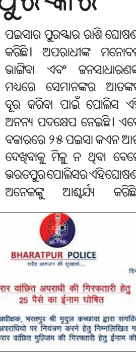
WANTED BHARATPUR POLICE

ଭିକାରୀ ଜଣକ ଅତିଥିମାନଙ୍କୁ ଭୋଜି ଦିଆଯାଉଥିବା ସ୍ଥଳକୁ ନେବା ପାଇଁ ପ୍ରାୟ ୨ ହଜାର ଯାନବାହନ ବ୍ୟବହାର କରିଥିଲେ। ସେହିପରି ଏହି ଭୋଜିରେ ଚିକେନ୍, ମଟର, ବିଟ୍, ବିଭିନ୍ନ ପ୍ରକାର ଫଳ, ମିଠା ଆଦି ଅନେକ ବ୍ୟଞ୍ଜନ ଅତିଥିମାନଙ୍କୁ ପରଷା ଯାଇଥିଲା।