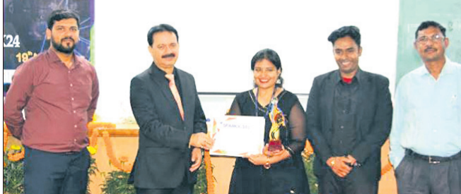
ପ୍ରତିଯୋଗିତାର ଜଣେ କୃତୀ ଛାତ୍ରୀଙ୍କୁ ଅତିଥିମାନେ ପୁରସ୍କୃତ କରୁଛନ୍ତି।