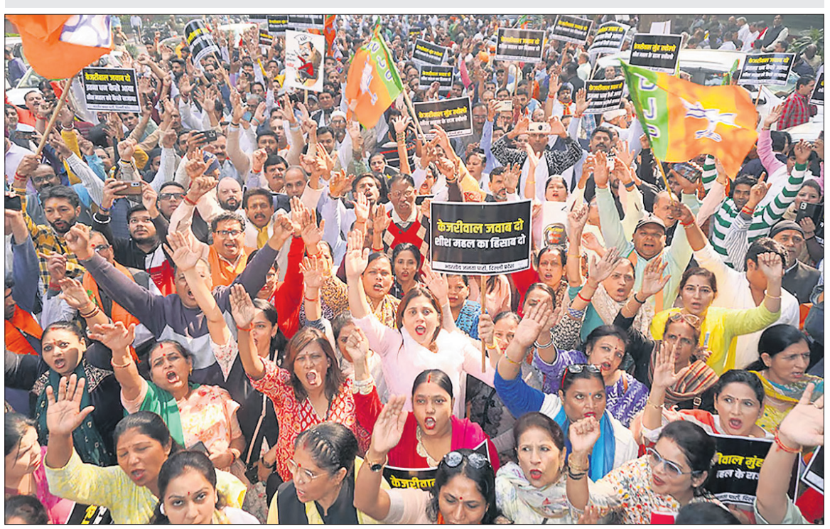
ଆମ ଆଦମୀ ପାର୍ଟି (ଆପ) ରାଷ୍ଟ୍ରୀୟ ଆବାହକ ଅରବିନ୍ଦ କେଜ୍ରିୱାଲ ସରକାରୀ ବାସଭବନ ମନାମେ ନାମରେ ବିପ୍ଳବ ଅର୍ଥ ବ୍ୟୟ କରିବା ସହ ବିକାସପୂର୍ଣ୍ଣ ସାମଗ୍ରୀ ବ୍ୟବହାର କରୁଥିବା ଅଭିଯୋଗ ଆଣି ଭାଜପା ନେତା ଓ କର୍ମୀମାନେ ନୂଆଦିଲ୍ଲୀରେ ଗୁରୁବାର ବିରୋଧ କରୁଛନ୍ତି।