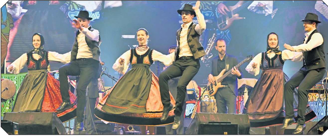
ବାଲିଯାତ୍ରା ପଡ଼ିଆ ଗଣକବି ବୈଷ୍ଣବ ପାଣି ମଞ୍ଚରେ ସ୍ୱୋଭାଉଥିବା କଳାକାରମାନେ ସାଂସ୍କୃତିକ କାର୍ଯ୍ୟକ୍ରମ ପରିବେଷଣ କରୁଛନ୍ତି ।