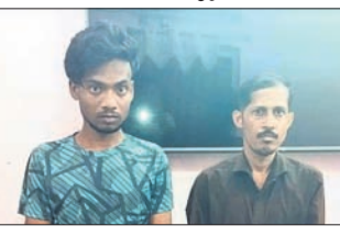
ଭୁବନେଶ୍ୱର, ୨୧।୧୧ (ସତ୍ୟଜିତ ରାଉତ)

୧୨ ଚୋରି ସ୍ମାର୍ଟଫୋନ୍ ଜବତ, ୨ ଅଭିଯୁକ୍ତ ଗିରଫ