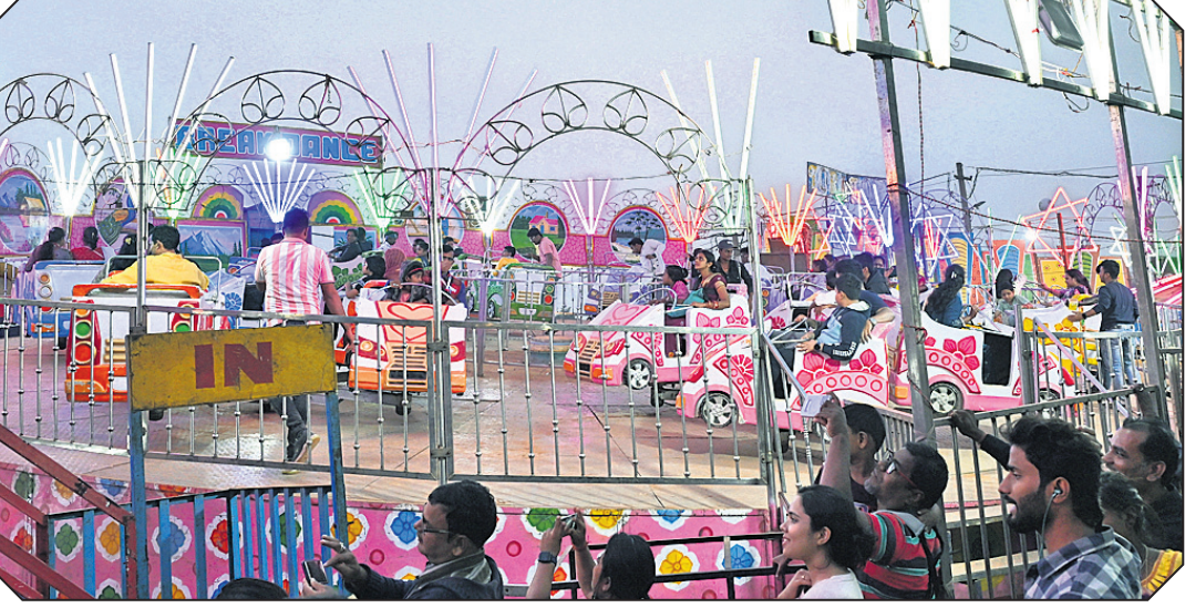
ବାଲିଯାତ୍ରା ପଡ଼ିଆରେ ଯୁବତୀ ଯୁବକ ବ୍ରେକଡ୍ୟାନ୍ସ ଦୋଳିର ମଜା ନେଉଛନ୍ତି ।