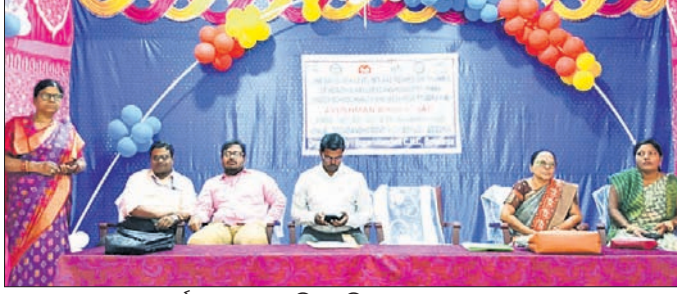
କର୍ମଶାଳାରେ ଉପସ୍ଥିତ ଅତିଥି ଏବଂ ଅନ୍ୟମାନେ।

ବେଗୁନିଆ, ୨୧।୧୧ (ହର ପ୍ରସାଦ ଉପାଧ୍ୟକ୍ଷ) ବେଗୁନିଆ ସଦର ମହକୁମା ସ୍ଥିତ ରୋପସବୁ ସରକାରୀ ଉଚ୍ଚ ବିଦ୍ୟାଳୟ ପରିସରରେ ଚଳୁଥିବା 'ସ୍ୱାସ୍ଥ୍ୟ ଓ ପୁସ୍ତକା' କର୍ମଶାଳା ଅନୁଷ୍ଠିତ ହୋଇଯାଇଛି। ଭାରତ ସରକାରଙ୍କ ଆହ୍ୱାନ ଉପରେ ଆନୁକୂଲ୍ୟରେ ଆୟୋଜିତ କର୍ମଶାଳାକୁ ବୋତେଲ୍ ଗୋଷ୍ଠୀ ସ୍ୱାସ୍ଥ୍ୟକେନ୍ଦ୍ର ଓ କୁଳ ଗୋଷ୍ଠୀ ଶିକ୍ଷା କାର୍ଯ୍ୟାଳୟ ମିଳିତ ଭାବେ ପରିଚାଳନା କରୁଥିଲେ। ଏଥିରେ କୁଳର ସମସ୍ତ ଉଚ୍ଚ ପ୍ରାଥମିକ ଏବଂ ମାଧ୍ୟମିକ ବିଦ୍ୟାଳୟର ଜଣେ ଲେଖାଏ ଶିକ୍ଷକ ଉପସ୍ଥିତ ରହି ସ୍ୱାସ୍ଥ୍ୟ ସମ୍ପର୍କିତ ବିଭିନ୍ନ ଉପକାରୀ ସମ୍ପର୍କରେ ଅବଗତ ହୋଇଥିଲେ। ଛାତ୍ରାଛାତ୍ରୀଙ୍କୁ ଉତ୍ତମ ସ୍ୱାସ୍ଥ୍ୟସେବା ଯୋଗାଇଦେବା ଲକ୍ଷ୍ୟ ନେଇ ପ୍ରଥମେ ବିଦ୍ୟାଳୟରେ ଆହ୍ୱାନ ପାଇଁ ଉଦ୍‌ଘାଟନା କରାଯାଇଥିଲା। ଏହା ପରେ ବିଭିନ୍ନ ପ୍ରକାରର ସ୍ୱାସ୍ଥ୍ୟ ସମ୍ପର୍କରେ ଉପସ୍ଥାପନା କରାଯାଇଥିଲା।