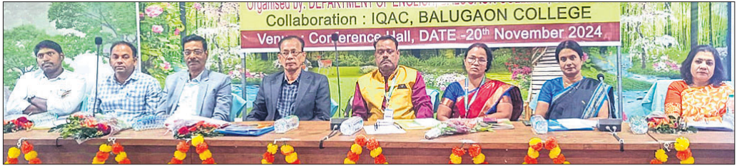
ଆଲୋଚନାଚକ୍ରରେ ଉପସ୍ଥିତ ଅତିଥି।