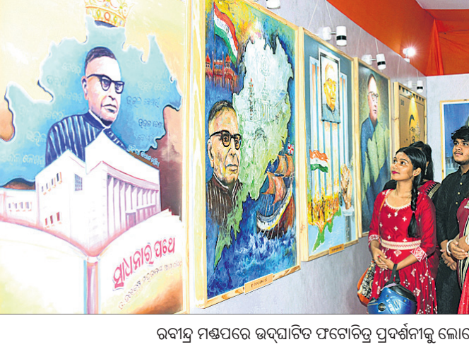
ରବୀନ୍ଦ୍ର ମଞ୍ଚପରେ ଉଦ୍ଦେଶ୍ୟରେ ଫଟୋଟିଭୁ ପ୍ରଦର୍ଶନୀକୁ ଲୋକେ ବୁଲି ଦେଖୁଛନ୍ତି।