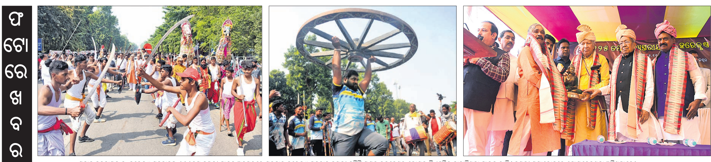
ମହାନ ଜନନାୟକ ଡ. ହରେକୃଷ୍ଣ ମହତାବୀଙ୍କ ୧୨୫ତମ ଜନ୍ମଦିନ ପାଇଁ ଅବସରରେ ଗୁରୁବାର ହରେକୃଷ୍ଣ ମହତାବ ଜୟନ୍ତୀ କମିଟି ପକ୍ଷରୁ ଭୁବନେଶ୍ୱର ଲୋକମଣ୍ଡଳ ପିଏସ୍‌ସିସି ବାହାରିଥିବା ପାଇକ ରାଲି। କନ୍ୟା ସମାପୋହରେ ଯୋଗଦେଇଥିବା ଅତିଥିମାନେ।

ହେଉଥିବା ସମାଧାନ ପାଠିତା ପାଠିତ ଓ ଦୋଷୀଙ୍କ ମଧ୍ୟରେ ଭଲ ସମ୍ପର୍କକୁ ପୁଣି ଥରେ ପ୍ରତିଷ୍ଠା କରିପାରୁଛି। ଦୋଷୀ ଚାଲିବ ଭୁଲ ବୁଝିପାରି କ୍ଷମା ମାଗିବା ସହିତ ପାଠିତାଙ୍କୁ ଉପଯୁକ୍ତ କ୍ଷତିପୂରଣ ଦେଉଛନ୍ତି। ଏହି ପ୍ରକ୍ରିୟାରେ ଶାନ୍ତି କମିଟିର ସଦସ୍ୟା ଓ ଗୋଷ୍ଠୀର ଅନ୍ୟ ସଭ୍ୟମାନେ ସକ୍ରିୟ ଭୂମିକା ଗ୍ରହଣ କରୁଛନ୍ତି। ଏହାଦ୍ୱାରା ଦୋଷୀ ଭିତରେ ଶାନ୍ତି ପ୍ରତିଷ୍ଠା ହେବା ସହ ସେହି ଦୋଷୀ ବ୍ୟକ୍ତିଙ୍କ ଦ୍ୱାରା ପୁଣିଥରେ ଅପରାଧ ନ କରିବାର ମାନସିକତା ସୃଷ୍ଟି ହେଉଛି। ପ୍ରଚଳିତ ନ୍ୟାୟ ପ୍ରଦାନ ପ୍ରକ୍ରିୟା ଠାରୁ ଏହି ରେଷ୍ଟୋରେଟିଭ୍ ଜଷ୍ଟିସ୍ ଉତ୍କୃଷ୍ଟ ପଦ୍ଧତି ଭାବେ ପ୍ରମାଣିତ ହୋଇଛି। ଦେଶରେ ପ୍ରଚଳିତ ନ୍ୟାୟିକ ବ୍ୟବସ୍ଥା ସହିତ ରେଷ୍ଟୋରେଟିଭ୍ ଜଷ୍ଟିସ୍ ବ୍ୟବସ୍ଥାକୁ ଆପଣାଣକରାଯାଇ ସାଧାରଣରେ ସଚେତନତା ବୃଦ୍ଧି କରିବା ପାଇଁ ଅନୁଷ୍ଠାନ ପକ୍ଷରୁ ଆହ୍ୱାନ କରାଯାଇଥିଲା।