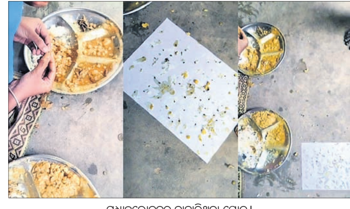
ମଧ୍ୟାହ୍ନଭୋଜନରୁ ବାହାରିଥିବା ପୋକ।

କଟକ/ସାକ୍ଷୀଗୋପାଳ, ୨୧୧୧ (ବିଭୂତି ଭୂଷଣ ତ୍ରିପାଠୀ/ଭବତ ରାଉତ) ରାଜ୍ୟର ସମସ୍ତ ସରକାରୀ ବିଦ୍ୟାଳୟରେ ଛାତ୍ରାଛାତ୍ରୀଙ୍କୁ ମାଗଣାରେ ପୁଷ୍ଟିକର ଖାଦ୍ୟ ଯୋଗାଇଦେବା ପାଇଁ ମଧ୍ୟାହ୍ନଭୋଜନ ଯୋଜନା କାର୍ଯ୍ୟକାରୀ ହେଉଛି।