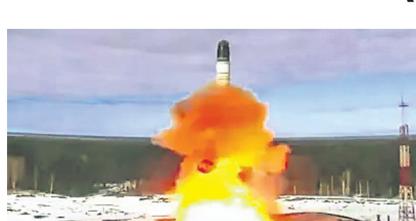
ଗାରେଜ କରି ଏହି ଆକ୍ରମଣ କରାଯାଇଥିଲାବେଳେ କେତେକ କର୍ମଚାରୀ ହତାହତ ହୋଇଛନ୍ତି। ଏହା ବ୍ୟତୀତ ମଧ୍ୟାହ୍ନ ୬ଟି କେଏଚ୍-୧୦୧ ଗୁଳି ଶେପଥାସ୍ତ୍ର

କିରା, ୨୧।୧୧ ମୁକ୍ତେନ୍ଦ୍ର ଓ ରୁଷିଆ ମଧ୍ୟରେ ୩୩ ମାସ ହେଲା ମୁକ୍ତେନ୍ଦ୍ର ଲାଗିରହିଥିବାବେଳେ ଗୁରୁବାର ମଧ୍ୟାହ୍ନ ପ୍ରଥମ ଥର ପାଇଁ କିରା ବିରୋଧରେ ଆକ୍ରମଣାହୀନ ବାଲିଷ୍ଟିକ ମିଶାଲ (ଆଇସିବିଏମ୍) ବ୍ୟବହାର କରିଛି। ଅଷ୍ଟ୍ରାଲିଆ ଅଞ୍ଚଳରୁ ଗୁରୁବାର ସକାଳେ ମୁକ୍ତେନ୍ଦ୍ର ଉପରେ ଆଇସିବିଏମ୍ ମାଡ଼ ହୋଇଥିବା ଏହାର ବାୟୁସେନା ପକ୍ଷରୁ ଜଣାଯାଇଛି। ମୁକ୍ତେନ୍ଦ୍ରରୁ ଗୁରୁବାର ସହରରେ ଥିବା ଗୁରୁତ୍ୱପୂର୍ଣ୍ଣ ଭିଡିଓଗ୍ରାଫି ଏବଂ ଉଦ୍ୟୋଗଗୁଡ଼ିକୁ ଗାରେଜ କରି ଏହି ଆକ୍ରମଣ କରାଯାଇଥିଲାବେଳେ କେତେକ କର୍ମଚାରୀ ହତାହତ ହୋଇଛନ୍ତି। ଏହା ବ୍ୟତୀତ ମଧ୍ୟାହ୍ନ ୬ଟି କେଏଚ୍-୧୦୧ ଗୁଳି ଶେପଥାସ୍ତ୍ର