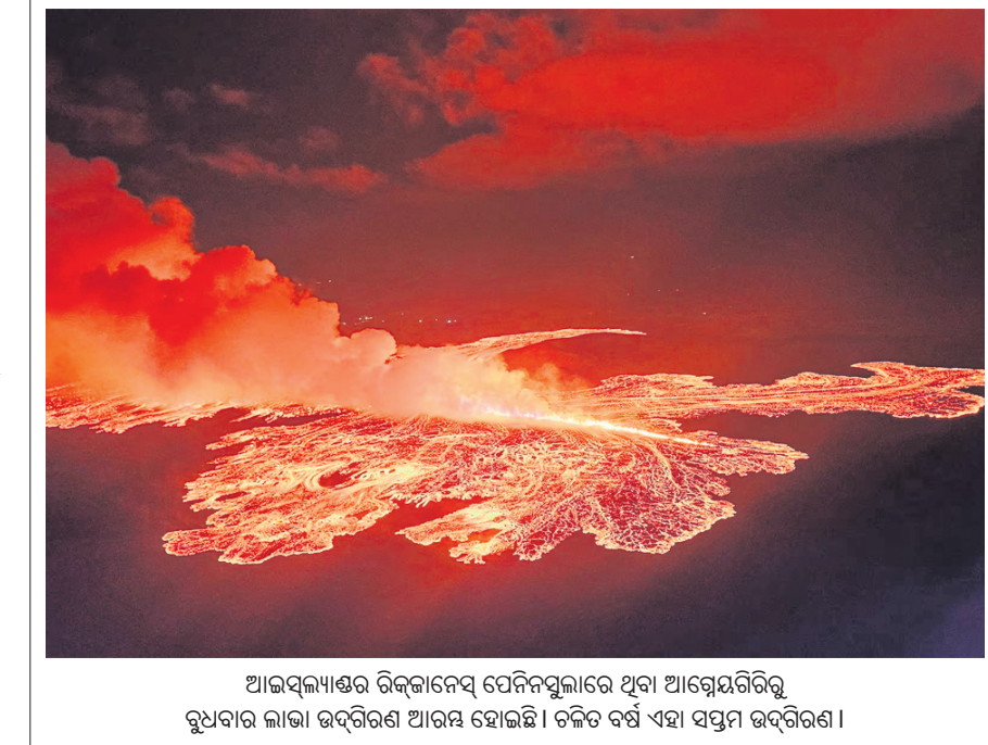
ଆଇସ୍‌ଲ୍ୟାଣ୍ଡର ରିକ୍‌ଟାକେନ୍‌ସ୍ ପେନିନ୍ସୁଲାରେ ଥିବା ଆଗ୍ନେୟଗିରିକୁ ରୁଧିବାର ଲାଭା ଉଦ୍‌ଗିରଣ ଆରମ୍ଭ ହୋଇଛି। ଚଳିତ ବର୍ଷ ଏହା ସପ୍ତମ ଉଦ୍‌ଗିରଣ।

ଏନ୍‌ସିପି ନେତା ବାବା ସିଦ୍ଧିକିକୁ ହତ୍ୟା ଏବଂ ଅଭିନେତା ସଲମାନ ଖାନଙ୍କ ମୃତ୍ୟୁର ଉଦ୍ଦେଶ୍ୟରେ ଆମେରିକାରେ ଗିରଫ କରାଯାଇଛି। ଏହା ପୂର୍ବରୁ ଆମେରିକାରେ ଗିରଫ କରାଯାଇଥିବା ଅଧିକାରୀଙ୍କୁ ହତ୍ୟା ଏବଂ ଅଭିନେତା ସଲମାନ ଖାନଙ୍କ ମୃତ୍ୟୁର ଉଦ୍ଦେଶ୍ୟରେ ଆମେରିକାରେ ଗିରଫ କରାଯାଇଛି। ଏହା ପୂର୍ବରୁ ଆମେରିକାରେ ଗିରଫ କରାଯାଇଥିବା ଅଧିକାରୀଙ୍କୁ ହତ୍ୟା ଏବଂ ଅଭିନେତା ସଲମାନ ଖାନଙ୍କ ମୃତ୍ୟୁର ଉଦ୍ଦେଶ୍ୟରେ ଆମେରିକାରେ ଗିରଫ କରାଯାଇଛି।