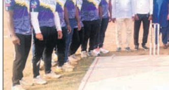
ଅତିଥି ଗହଣରେ ଉଭୟ ଦଳର ଖେଳାଳି ଏବଂ ଅନ୍ୟମାନେ।