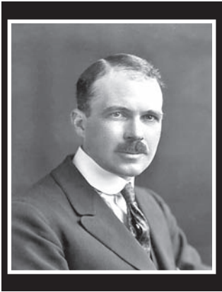
ଉଇଲିୟମ୍ ଲରେନ୍ସ ବ୍ରାଗ

ଇଂଲଣ୍ଡର ଜଣେ ବିଶିଷ୍ଟ ବୈଜ୍ଞାନିକ ଥିଲେ ଉଇଲିୟମ୍ ଲରେନ୍ସ ବ୍ରାଗ। ସେ କେମ୍ବ୍ରିଜ୍ ବିଶ୍ୱବିଦ୍ୟାଳୟରେ ଗବେଷକ ଛାତ୍ର ଥିବା ବେଳେ ପିତାଙ୍କ ସହ ମିଶି ଷ୍ଟଟିକରେ ଏକ୍ସ-ରଶ୍ମିର ପ୍ରଭାବ ଉପରେ ଗବେଷଣା କରିଥିଲେ। ଏଥିରୁ ଷ୍ଟଟିକର ସଂରଚନା ଜାଣିହେଲା। ଏହି କାର୍ଯ୍ୟ ପାଇଁ ପିତା ଓ ପୁତ୍ରଙ୍କୁ ୧୯୧୫ ମସିହାରେ ପଦାର୍ଥ ବିଜ୍ଞାନରେ ନୋବେଲ ପୁରସ୍କାର ପ୍ରଦାନ କରାଯାଇଥିଲା। ସେତେବେଳକୁ ତାଙ୍କୁ ମାତ୍ର ୨୫ ବର୍ଷ ହୋଇଥିଲା ଏବଂ ନୋବେଲ ପୁରସ୍କାର ପାଇବାରେ ସେ କନିଷ୍ଠ ବ୍ୟକ୍ତି ଥିଲେ। ବର୍ତ୍ତମାନ ସୁଦ୍ଧା ବିଜ୍ଞାନ ବିଭାଗରେ ନୋବେଲ ପୁରସ୍କାର ପାଇବାରେ ସେ କନିଷ୍ଠ ଅଛନ୍ତି।