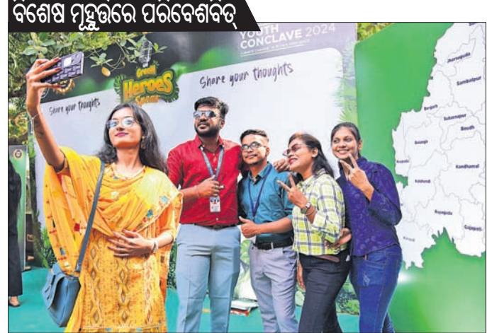
ବିଶେଷ ମୁହୂର୍ତ୍ତରେ ପରିବେଶବିତ୍