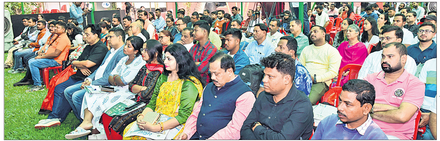
କାର୍ଯ୍ୟକ୍ରମରେ ଯୋଗଦେଇଥିବା ପରିବେଶବିତ୍ ଏବଂ ବିଶିଷ୍ଟ ବ୍ୟକ୍ତି ।