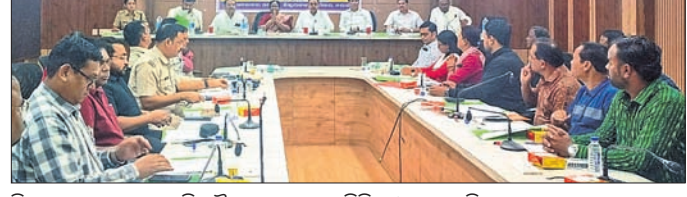
ଜିଲ୍ଲା ମହୋତ୍ସବର ପ୍ରସ୍ତୁତି ବୈଠକରେ କମିସନିୟର ଓ ପ୍ରଶାସନିକ ଅଧିକାରୀ

୯ ଦିନୀ ଦାକ୍ଷିଣ୍ୟ ପ୍ରଦାନ ଦାକ୍ଷିଣ୍ୟ ନ ହେଲେ ନାଗରିକ ମଞ୍ଚର ଗଣିତଶୈଳୀ ଚେତାବନୀ