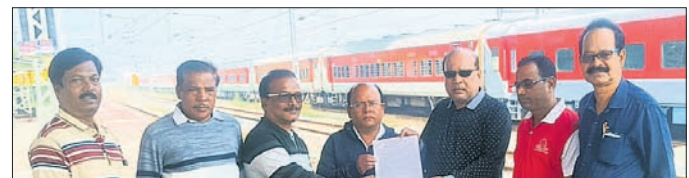
ଶ୍ରେଣୀ ମ୍ୟାନେଜରଙ୍କୁ ସ୍ମାରକପତ୍ର ପ୍ରଦାନ କରାଯାଇଛି।

୯ ଦିନୀ ଦାକ୍ଷିଣ୍ୟ ପ୍ରଦାନ ଦାକ୍ଷିଣ୍ୟ ନ ହେଲେ ନାଗରିକ ମଞ୍ଚର ଗଣିତଶୈଳୀ ଚେତାବନୀ