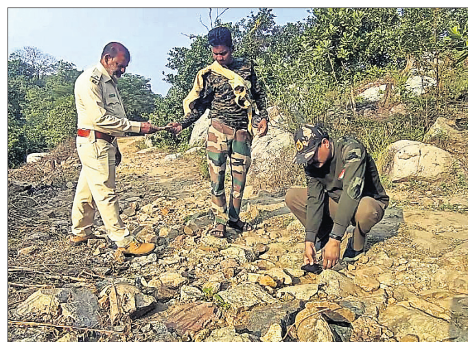
ବନ ବିଭାଗ କର୍ମଚାରୀ ବାଘ ପାଦଚିହ୍ନ ଅନୁଧ୍ୟାନ କରୁଛନ୍ତି