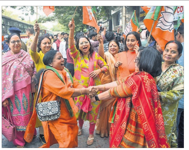
ମହାରାଷ୍ଟ୍ର ବିଧାନସଭା ନିର୍ବାଚନରେ ମହାୟୁତି ମେଣ୍ଟକୁ ବହୁମତ ମିଳିବା ପରେ ଭାଜପା ମହିଳା କର୍ମୀମାନେ ନାଗପୁରରେ ବିଜୟ ଉତ୍ସବ ମନାଉଛନ୍ତି।

ମୁଖ୍ୟମନ୍ତ୍ରୀ ହେମନ୍ତ ସୋରେନ୍ ଜେଲ ଯିବା ସତ୍ତ୍ୱେ ତାଙ୍କ ଲୋକପ୍ରିୟତା ଅସ୍ତରୁ ରହିଛି। ଇଣ୍ଡିଆ ମେଣ୍ଟକୁ ଜିତାଇବାରେ ସେ ମୁଖ୍ୟ ଭୂମିକା ନେଇଥିଲେ। ତାଙ୍କର ମୈତ୍ରୀ ସମ୍ମାନ ଯୋଜନା ମହିଳା ଭୋଟରଙ୍କୁ ଆକୃଷ୍ଟ କରିଥିଲା।