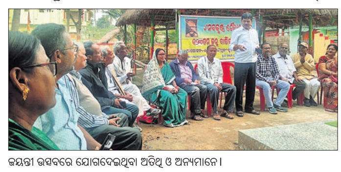
କକ୍ଷୀୟ ଉତ୍ସବରେ ଯୋଗଦେଇଥିବା ଅତିଥି ଓ ଅନ୍ୟମାନେ।

ମଞ୍ଚ ପକ୍ଷରୁ ଚେତାବନୀ ଦିଆଯାଇଛି। ଉପେକ୍ଷିତ ଚଳାଚଳକୁ ଭୁବନେଶ୍ୱର, ପୁରୀ ଏବଂ ଭଦ୍ରକ ମଧ୍ୟରେ ୩ଟି ଟ୍ରେନ ଚଳାଚଳ କରାଯିବ ବୋଲି ରାଜ୍ୟର ଅନ୍ୟାନ୍ୟ ସ୍ଥାନ ଏବଂ ରାଜ୍ୟ ବାହାରକୁ ଜିଲ୍ଲା କୌଶଳ ଟ୍ରେନ ସୁଧା ନାହିଁ। ଏଣୁ ଶନିବାର ପ୍ରଦାନ କରାଯାଇଛି।