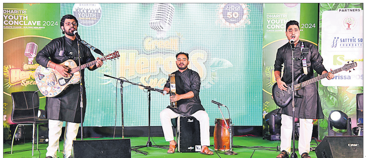
କାର୍ଯ୍ୟକ୍ରମରେ ପରିବେଶ ସଚେତନତାକୁ ନେଇ ବିରାହ ବ୍ୟାଣ୍ଡର ସଦସ୍ୟମାନେ ସଙ୍ଗୀତ ପରିବେଷଣ କରୁଛନ୍ତି ।