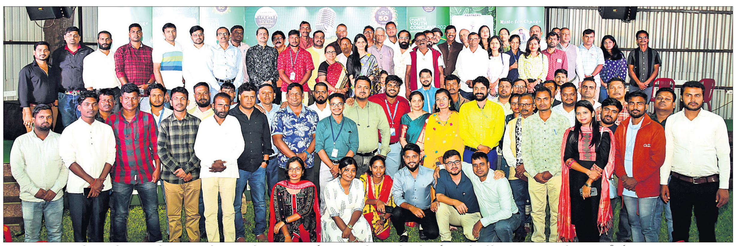
ଧରିତ୍ରୀ ପକ୍ଷରୁ ଶନିବାର ଭୁବନେଶ୍ୱରସ୍ଥିତ ପ୍ରେସ୍ କ୍ଲବ୍ ଅଫ୍ ଓଡ଼ିଶାଠାରେ ଆୟୋଜିତ 'ଯୁଥ୍ କନ୍‌କ୍ଲେଭ୍'ର ଚତୁର୍ଥ ସଂସ୍କରଣର ପ୍ରଥମ ଦିନରେ 'ଗ୍ରୀନ୍ ହିରୋଇଜ୍ ସିକ୍' କାର୍ଯ୍ୟକ୍ରମରେ ଓଡ଼ିଶାର ବିଭିନ୍ନ ପ୍ରାନ୍ତରୁ ଯୋଗ ଦେଇଥିବା ପରିବେଶ ସୁରକ୍ଷା ପାଇଁ କାର୍ଯ୍ୟରତ ଯୋଦ୍ଧା ।