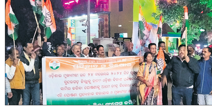
ଡିଆରଡିଏ ଛକରେ କଂଗ୍ରେସ ପକ୍ଷରୁ ବିରୋଧ ପ୍ରଦର୍ଶନ କରାଯାଇଛି ।

ଜିଲ୍ଲା କଂଗ୍ରେସର ପ୍ରତିବାଦ ସୁନ୍ଦରଗଡ଼, ୨୫.୧୧ (କନ୍ୟ ନାରାୟଣ ମେଘୁଲି)