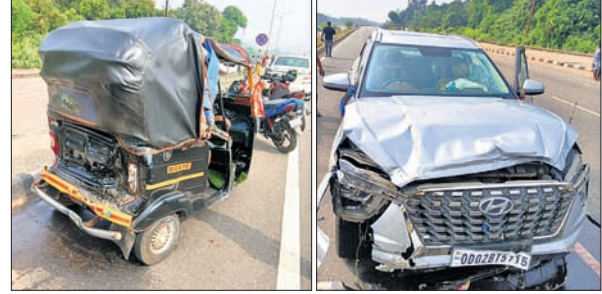
ଦୁର୍ଘଟଣାରେ କ୍ଷତିଗ୍ରସ୍ତ ଅଟୋ ଓ ବିଧାୟକଙ୍କ କାର୍।