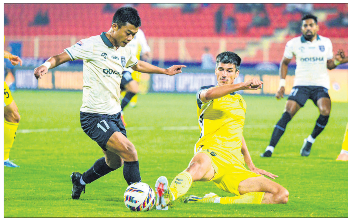
ଓଡ଼ିଶା ଏଫ୍ ସି ଓ ହାଇଦ୍ରାବାଦ ଏଫ୍ ସି ମଧ୍ୟରେ ଅନୁଷ୍ଠିତ ମ୍ୟାଚ୍ ର ଏକ ସଂଘର୍ଷପୂର୍ଣ୍ଣ ମୁହୂର୍ତ୍ତ।