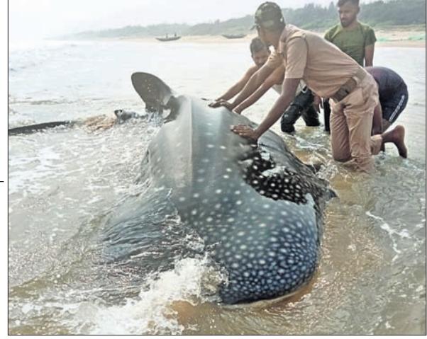
ମୃତ ହେଲ ସାର୍ଜ।

ଡିକଟି, ୨୫।୧୧ (ପ୍ରକାଶ ରତ୍ନ ସାହୁ) ଗଞ୍ଜାମ ଜିଲ୍ଲା ଡିକଟି ବ୍ଲକ୍ ଅନ୍ତର୍ଗତ ସୁନାପୁର ସମୁଦ୍ର ବେଳାଭୂମିରେ ସାମାଜିକ ଏକ ମୃତ ହେଲ ସାର୍ଜ ଦେଖିବାକୁ ମିଳିଥିଲା। ଏହି ବିରଳ ଡିନିର ଲମ୍ବ ୧୦ ମିଟର, ଓଜନ ପ୍ରାୟ ୩୦୦ କେଜି ହେବ ବୋଲି ଡିକଟି ବ୍ଲକ୍ ମତ୍ସ୍ୟ ସମ୍ପ୍ରଦାୟର ଅଧିକାରୀ ପ୍ରକାଶନ ଦାବି କରିଛନ୍ତି। ଏହି ସାର୍ଜକୁ ସୁନାପୁର ଗ୍ରାମବାସୀ ସମୁଦ୍ର ଭିତରକୁ ଠେଲିବା ପାଇଁ ବହୁ ଚେଷ୍ଟା କରୁଥିଲେ ସୁଦ୍ଧା ବିଫଳ ହେବାର