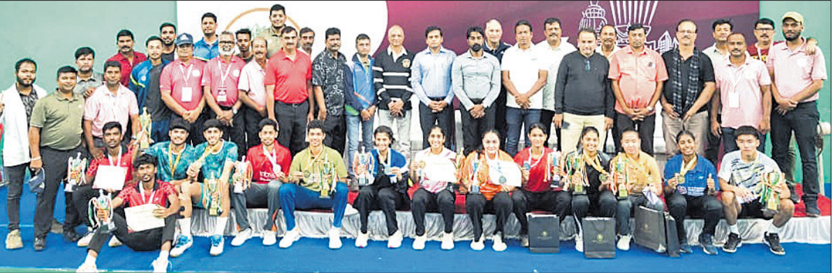
ଜାତୀୟ କ୍ରୀଡ଼ାରେ ବ୍ୟାଡ୍ମିଣ୍ଟନର କୃତୀ ଖେଳାଳିମାନେ ଅତିଥି ଓ କର୍ମଚାରୀଙ୍କ ସହ ଗହଣରେ।