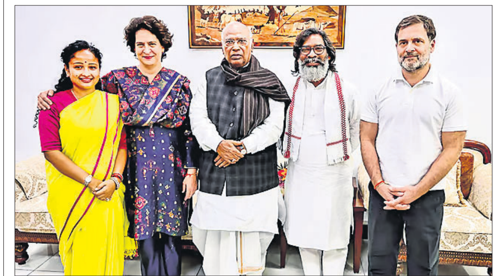
ଝାଡ଼ଖଣ୍ଡ ମୁଖ୍ୟମନ୍ତ୍ରୀ ଭାବେ ସୁକୁମାର ଶପଥ ନେବାକୁ ଯାଉଥିବା ହେମନ୍ତ ସୋରେନ୍ ଏବଂ ସ୍ତ୍ରୀ ତଥା ଜେଏମ୍‌ଏମ୍ ନେତ୍ରୀ କଳ୍ପନା ସୋରେନ୍ ମଙ୍ଗଳବାର ନୂଆଦିଲ୍ଲୀରେ ଲୋକ ସଭାର ବିରୋଧୀ ଦଳ ନେତା ରାହୁଲ ଗାନ୍ଧୀ, କଂଗ୍ରେସ ଅଧ୍ୟକ୍ଷ ମଲ୍ଲିକାର୍ଜୁନ ଖର୍ଚେ ଏବଂ ପ୍ରିୟଙ୍କା ଗାନ୍ଧୀଙ୍କୁ ଭେଟୁଛନ୍ତି।