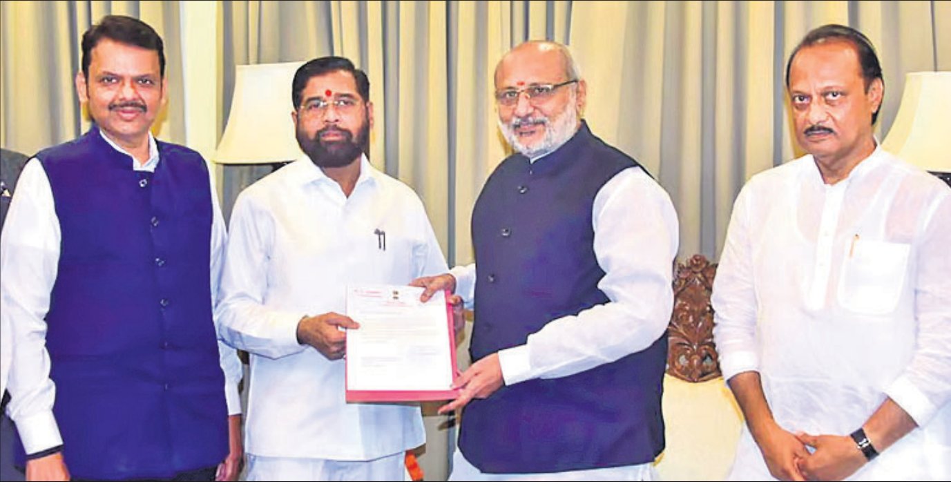
ରାଜ୍ୟପାଳ ସି.ପି. ରାଧାକ୍ରିଷ୍ଣନ ମହାରାଷ୍ଟ୍ର ମୁଖ୍ୟମନ୍ତ୍ରୀ ଏକନାଥ ଶିନ୍ଦେଙ୍କଠାରୁ ଇସ୍ତଫାପତ୍ର ଗ୍ରହଣ କରୁଛନ୍ତି। ନିକଟରେ ଭାଜପା ନେତା ଦେବେନ୍ଦ୍ର ଫଡ଼ନବିସ୍ ଏବଂ ଏନ୍‌ସିପି ନେତା ଅଜିତ ପାଠ୍ୟାର ଉପସ୍ଥିତି ଅଛନ୍ତି।