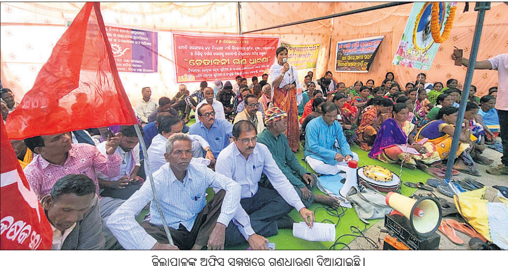
ଜିଲ୍ଲାପାଳଙ୍କ ଅଫିସ ସମ୍ମୁଖରେ ଗଣଧାରଣା ଦିଆଯାଇଛି।

କେନ୍ଦ୍ର ସରକାରଙ୍କ ଜନବିରୋଧୀ ନୀତି ବିରୋଧରେ ମଙ୍ଗଳବାର ଭବାନୀପାଟଣା ଜିଲ୍ଲାପାଳଙ୍କ ଅଫିସ ସମ୍ମୁଖରେ ଜିଲ୍ଲାର ବିଭିନ୍ନ ସଙ୍ଗଠନ ପକ୍ଷରୁ ଗଣଧାରଣା ଦିଆଯାଇଛି। କକାହାଡ଼ି ଜିଲ୍ଲା କେନ୍ଦ୍ରୀୟ ଚେତ୍ର ଯୁକ୍ତିଅନ, ସ୍ୱାଧୀନ ଫେଡେରେଶନର ନିକିତ ମଞ୍ଜୁ ଓ ସଂଯୁକ୍ତ କିଷାନ ମୋର୍ଚ୍ଚା, ମା' ମାଟି ମାଲି ପୁରୁଷା ମଞ୍ଚ ପକ୍ଷରୁ ୨୬ ଦିନୀ ଦାବିପତ୍ର ରାଷ୍ଟ୍ରପତିଙ୍କ ଉଦ୍ଦେଶ୍ୟରେ ଜିଲ୍ଲାପାଳଙ୍କୁ ପ୍ରଦାନ କରାଯାଇଛି। ଦରବୁକ୍ତି ରୋକିବା, କୃଷିକାର ଫୁଲ ଉପରୁ ଜିଏସ୍‌ଟି ପ୍ରତ୍ୟାହାର, ମାଗଣା ଶିକ୍ଷା, ସମସ୍ତ ଆଦିବାସୀ ଓ ଜଙ୍ଗଲ ଅଧିବାସୀଙ୍କୁ ଜଙ୍ଗଲ ଜମିର ଅଧିକାର ପ୍ରଦାନ, ଲଘୁ ବନଜାତ ଫୁଲକୁ ଠିକ୍ ମୂଲ୍ୟ ପ୍ରଦାନ କରିବା ଆଦି ଦାବି କରାଯାଇଛି। ସେହିପରି କକାହାଡ଼ି