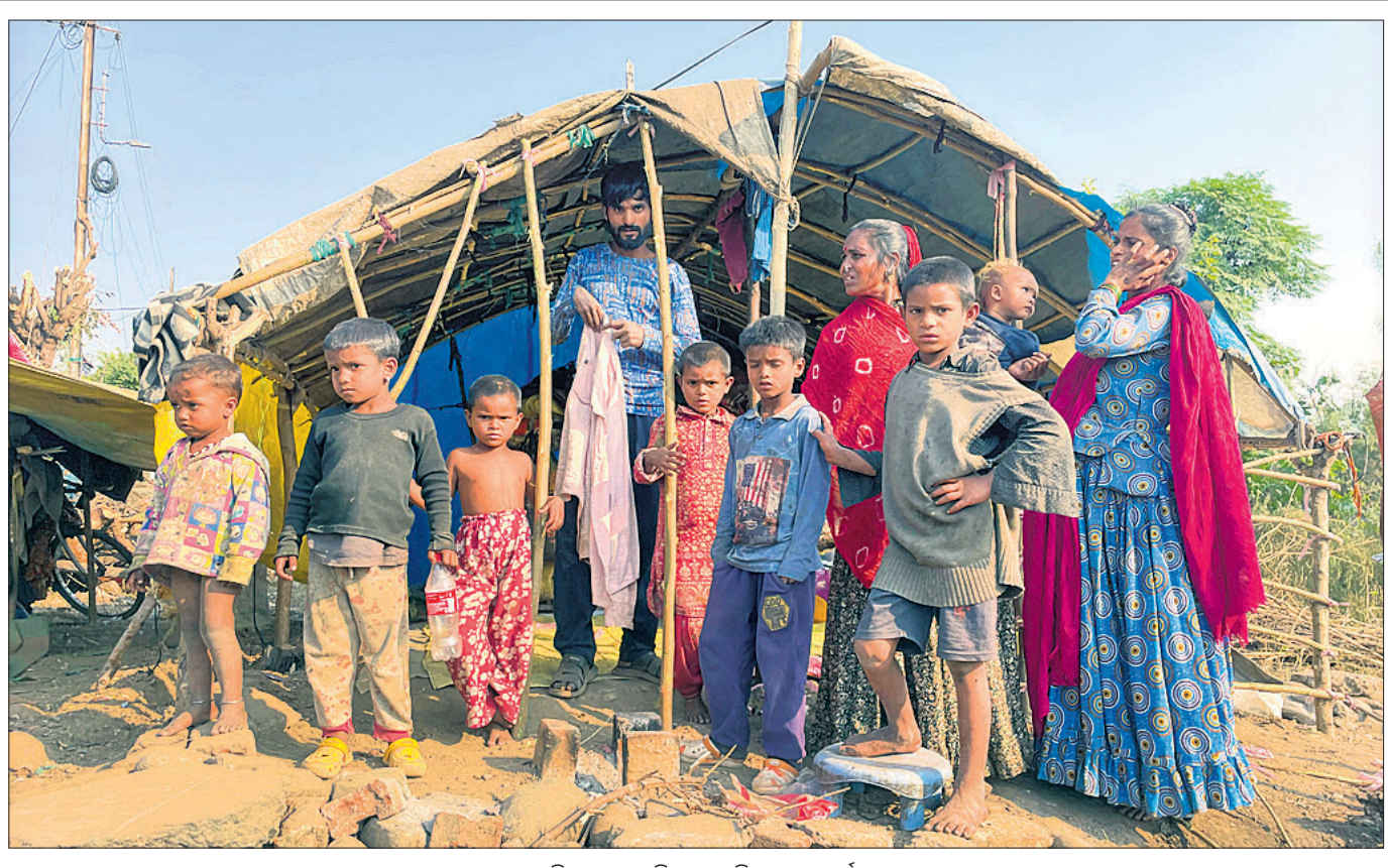
ଜମ୍ମୁରୁ ଏକ ବସତିରେ ରୋହିଙ୍ଗା ଶରଣାର୍ଥୀ।

କଳ୍ପ, ୨୬।୧୧ ୨୦୧୭ରେ ମ୍ୟାନ୍ମାରରେ ନିର୍ଯ୍ୟାତ ହୋଇ ଜମ୍ମୁକୁ ଚାଲିଆସିଥିବା ରୋହିଙ୍ଗା ଶରଣାର୍ଥୀମାନଙ୍କୁ ଦିନ ଭେଟିଫକେଶନରେ ଘରଭଡ଼ା ଦେବା ଅଭିଯୋଗରେ ଜମ୍ମୁ-କମ୍ପାନୀ ପୋଲିସ ୧୮ ଘର ମାଲିକଙ୍କ ବିରୋଧରେ ମାମଲା ରୁଜୁ କରିଛି। ୨ ମହିଳା ଓ ୨ ପୁରୁଷ ରୋହିଙ୍ଗାଙ୍କୁ ଫରେନର୍ସ ଆକ୍ଟ ବଳରେ ଅତୀତ ରଖାଯାଇଥିବା ମଙ୍ଗଳବାର ଜମ୍ମୁ ସାହିତ୍ୟ ଏକାଡେମୀ ଅକାଦେମି ସୂଚନା ଦେଇଛନ୍ତି। ବର୍ତ୍ତମାନ ଜମ୍ମୁ କର୍ମାନ୍ୱୟ ଚାଲିବ ଭଳି ଅଞ୍ଚଳରେ ଶରଣାର୍ଥୀ କାର୍ଡ ନ ଥାଇ ଅନେକ ଶହ ରୋହିଙ୍ଗା ବସବାସ କରୁଥିବାବେଳେ ପୋଲିସ ଯାଞ୍ଚ ପ୍ରକ୍ରିୟାକୁ କଡ଼ାକଡ଼ି କରିଛି।