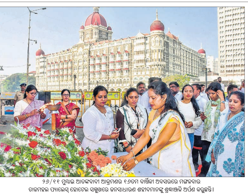
୨୬/୧୧ ମୁଖ୍ୟ ଅତିଥିକାରୀ ଆକ୍ରମଣରେ ୨୬ତମ ବାର୍ଷିକୀ ଅବସରରେ ମଙ୍ଗଳବାର ଚାକମହଳ ପ୍ୟାଲେସ୍ ହୋଟେଲ ସମ୍ମୁଖରେ ଜନସାଧାରଣ ଶହାଦାନକୁ ଶ୍ରଦ୍ଧାଞ୍ଜଳି ଅର୍ପଣ କରୁଛନ୍ତି।

ନୂଆଦିଲ୍ଲୀ, ୨୬।୧୧ ବାଂଲାଦେଶରେ ହିନ୍ଦୁ ସହ ଚିନ୍ତୟ କୃଷ୍ଣ ଦାସଙ୍କ ଗିରଫଦାରୀକୁ ନେଇ ଦେଶବାସୀମାନେ ମନୁଶାଳୟ ପକ୍ଷରୁ ମଙ୍ଗଳବାର ଏକ ଦସ୍ତାବିଜ ଜାରି କରାଯାଇଛି। ଚିନ୍ତୟ ଦାସଙ୍କୁ ଜାମିନ ନ ମିଳିବାକୁ ନେଇ ଦେଶବାସୀମାନେ ମନୁଶାଳୟ ପକ୍ଷରୁ ଗଭୀର ତିନା ପ୍ରକଟ କରାଯାଇଛି। ହିନ୍ଦୁ ସମେତ ୩ ବର୍ଷ ସଂଖ୍ୟାଲଘୁ ସମ୍ପ୍ରଦାୟକୁ ଲୋକଙ୍କ ସୁରକ୍ଷାକୁ ସୁନିଶ୍ଚିତ କରିବାକୁ ବାଂଲାଦେଶର ଅନ୍ତର୍ଗଣ ସରକାରଙ୍କୁ ଭାରତ ଆଗ୍ରହ କରିଛି। ଏହି ଦସ୍ତାବିଜରେ କୁହାଯାଇଛି, ହିନ୍ଦୁ ସହ ଚିନ୍ତୟ କୃଷ୍ଣ ଦାସଙ୍କୁ ଗିରଫ କରାଯିବା ଓ ତାଙ୍କୁ ଜାମିନ ନ ମିଳିବା ନିଶ୍ଚିତ ଭାବେ ଦୁର୍ଭାଗ୍ୟଜନକ।